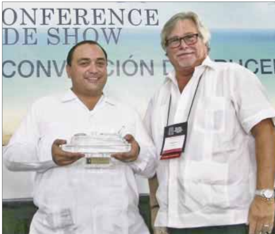
Durante la apertura de actividades, Roberto Borge recibió un reconocimiento por su aportación a la industria turística de cruceros.

En este marco, el gobernador y presidente de la Comisión de Turismo de la Conferencia Nacional de Gobernadores, resaltó el crecimiento de la industria de cruceros en Quintana Roo, que el año pasado cerró con mil 267 naves y 3