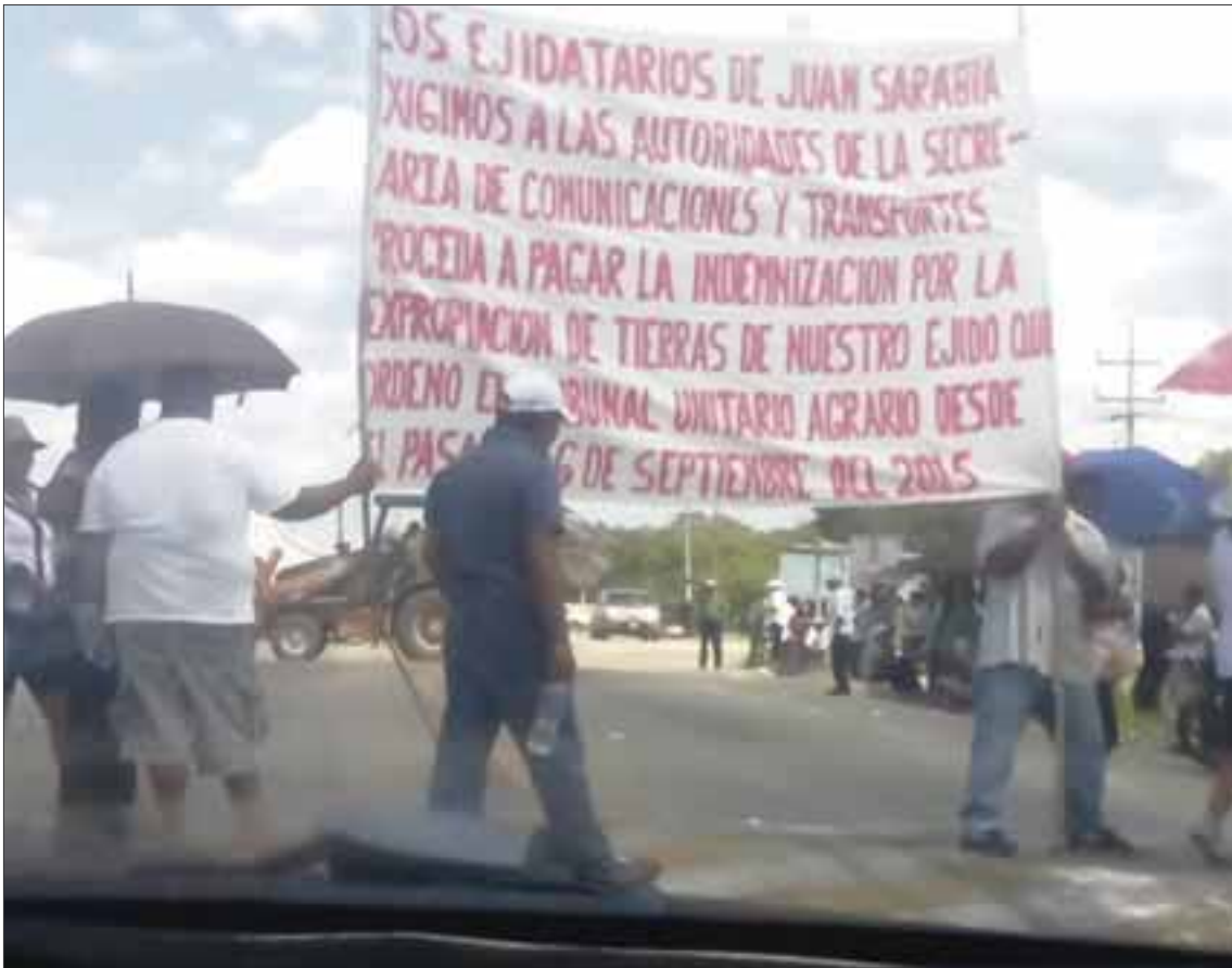
El bloqueo perjudicó a decenas de automovilistas, que estuvieron varados por horas.

Reclaman pago de tierras en Juan Sarabia por 70.4 millones de pesos