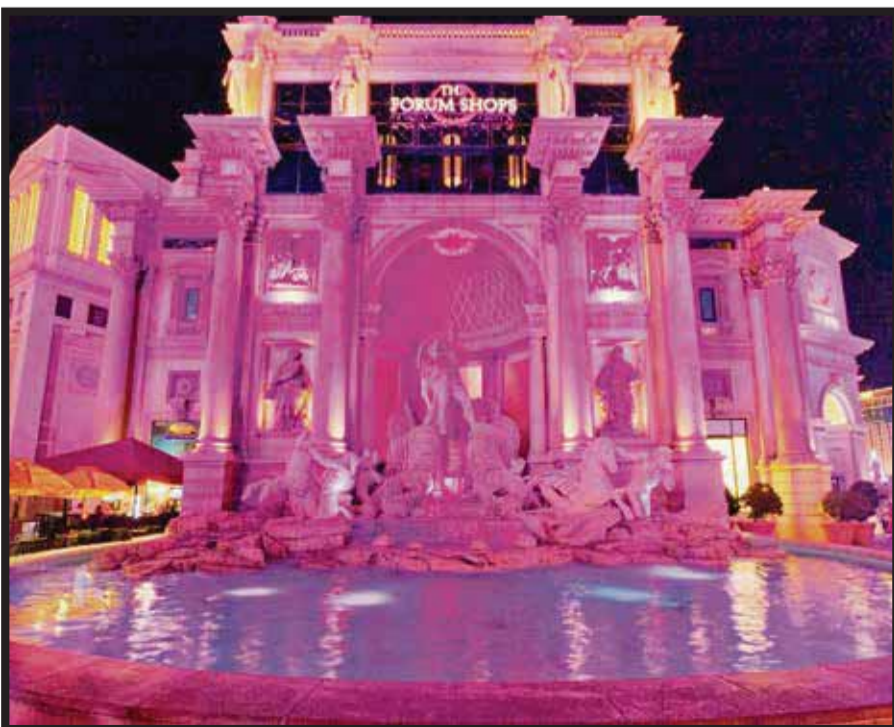
Los Malls de Simon se visten de rosa.

☆☆☆☆☆ Simon anunció su compromiso nacional con la organización Susan G. Komen para apoyar la lucha contra el cáncer de mama. Los Simon Malls , The Mills y Simon Premium Outlets participantes de todos los Estados Unidos, involucrarán a sus empleados, vendedores y compradores en los eventos " Mission Pink " durante el mes de octubre.