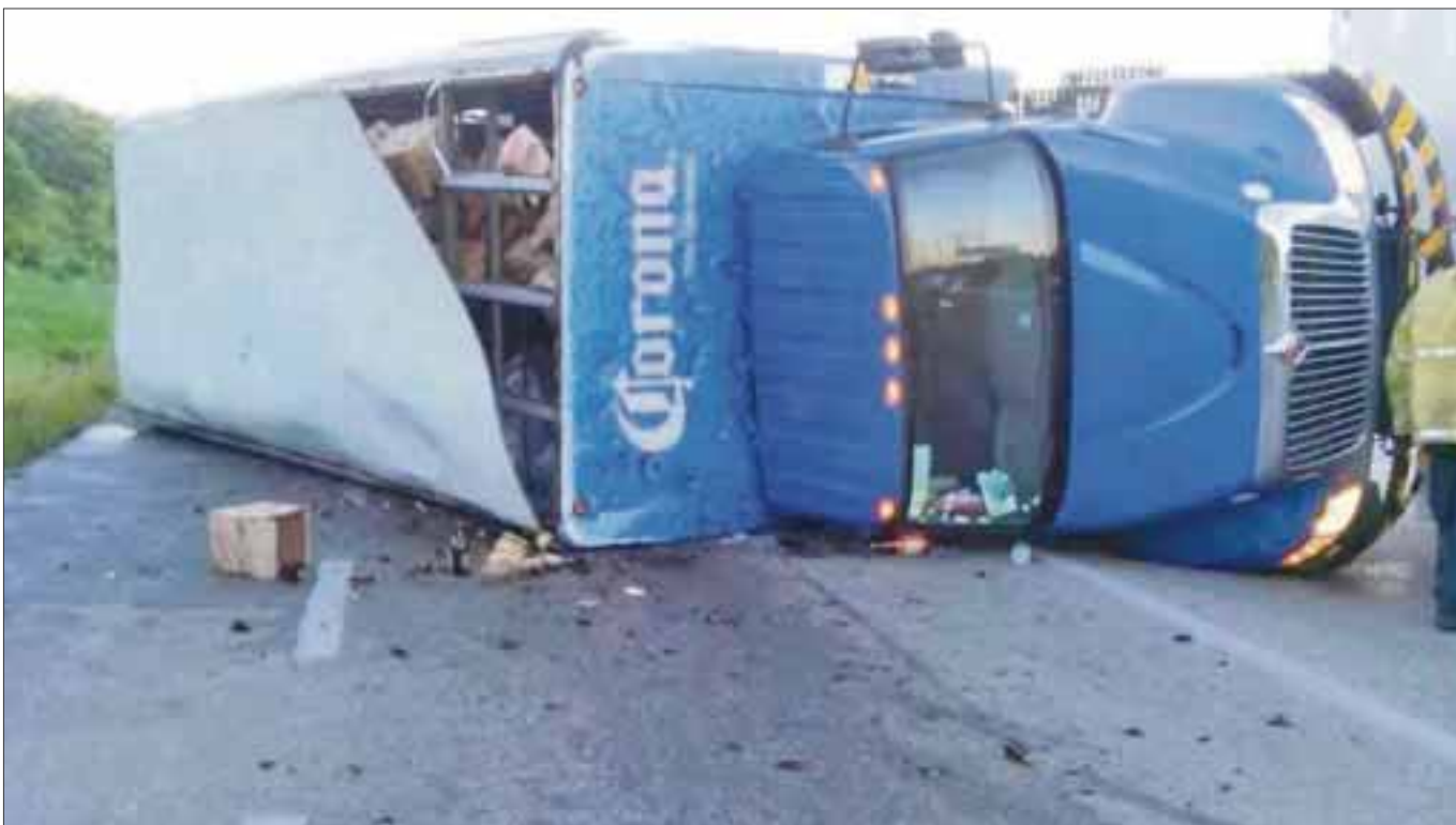
Así quedó el tráiler que transportaba cerveza de Cancún a la Riviera Maya.

Cancún.- La volcadura de un tráiler de la empresa Modelo sobre la vía federal Cancún-Playa del Carmen, provocó un embotellamiento a la altura del kilómetro 334, frente al hotel Royalton.