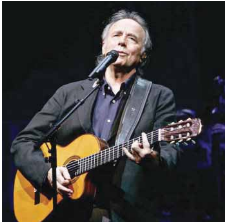
Serrat se ha presentado en el Auditorio Nacional desde 1984, la mayoría de las veces como solista, pero también al lado de Joaquín Sabina

Este recinto capitalino, que lo acogió por primera vez a mediados de los años 80, también lo ha reconocido en cinco ocasiones con el galardón Luna del Auditorio . La primera vez que recibió esta presea fue en 2002, y siempre en la categoría "Música de Iberoamérica para el mundo" (2004, 2009, 2011 y 2014).