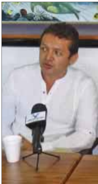
En su programa musical presentará Obertura La Flauta Mágica de Mozart.

Informaron que la Camerata de Cancún está dedicada a la difusión de la música clásica y contemporánea en Quintana Roo y su