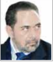
POR FRANCISCO RODRÍGUEZ