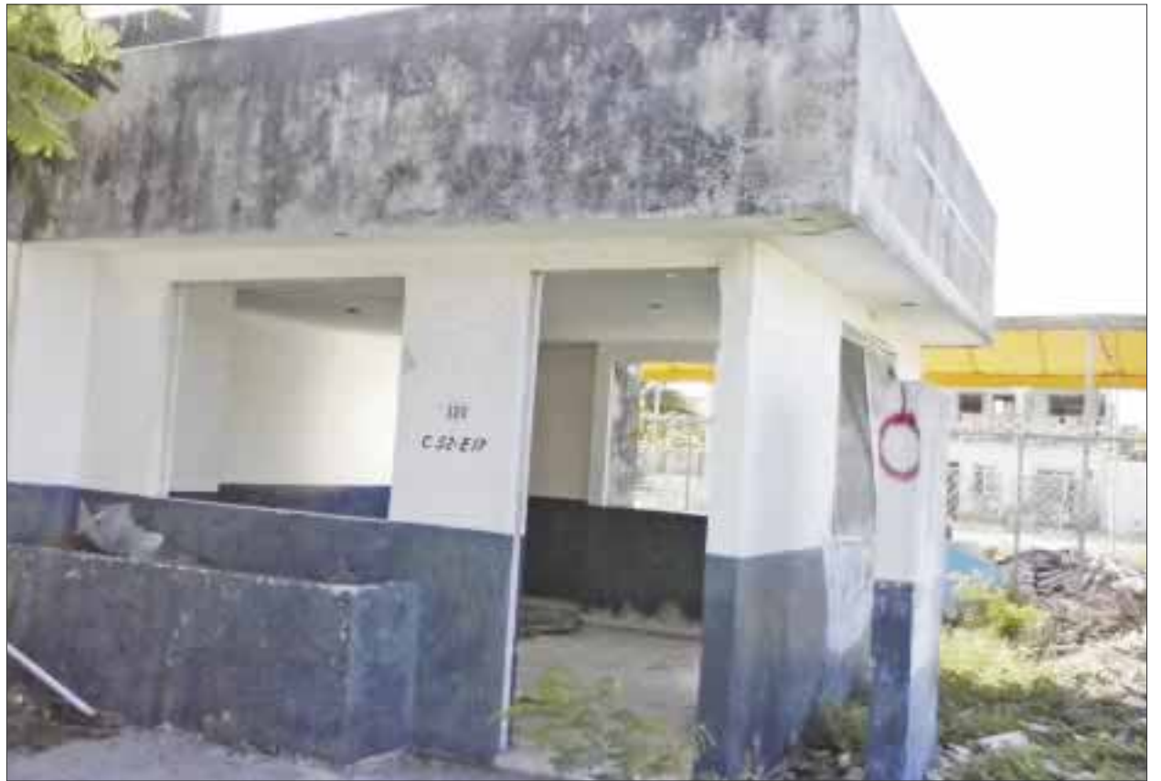
Esta caseta que se encuentra abandonada desde hace más de seis años, ahora es ocupada por drogadictos, denuncian vecinos

“El edificio lleva abandonado más de seis años. Este es un nido de delincuentes. Ahí se meten a drogarse los chemos que vienen de la ruta 7 y los que vienen de la Lombardo” dijo una vecina que pidió no hacer público su nombre.