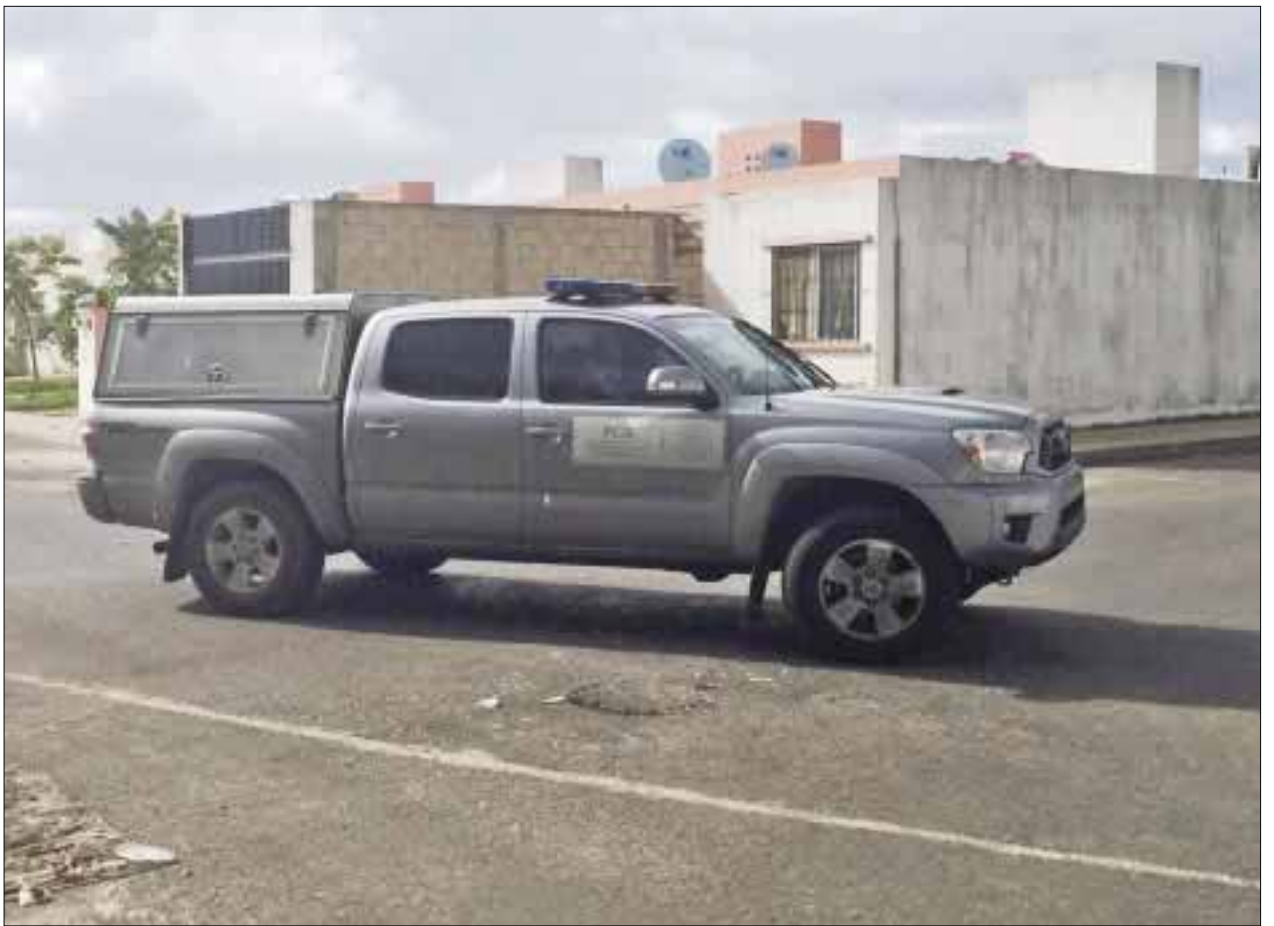
Charco de sangre, un cuerpo desmembrado, drogas, armas, dos motos y un auto asegurado fue el saldo durante un cateo la madrugada de ayers en una casa de la región 260.

Mientras tanto, se averiguó que en el lugar se aseguraron varias bolsas de droga, armas de fuego, dos motos y un auto.