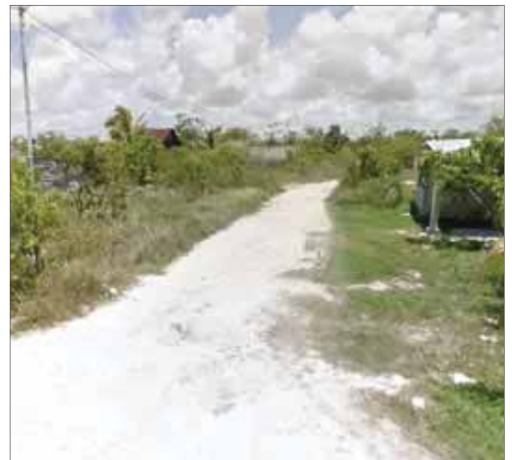
Invasores han iniciado a construir sus casas en terrenos irregulares ante la falta de atención de la Seduvi.

Dentro de las acciones que han implementado están la vigilancia durante las 24 horas en dichos terrenos, pues no quieren que lleguen otras personas a ocupar los lotes que ellos ya han limpiado y que quieren para construir su vivienda.