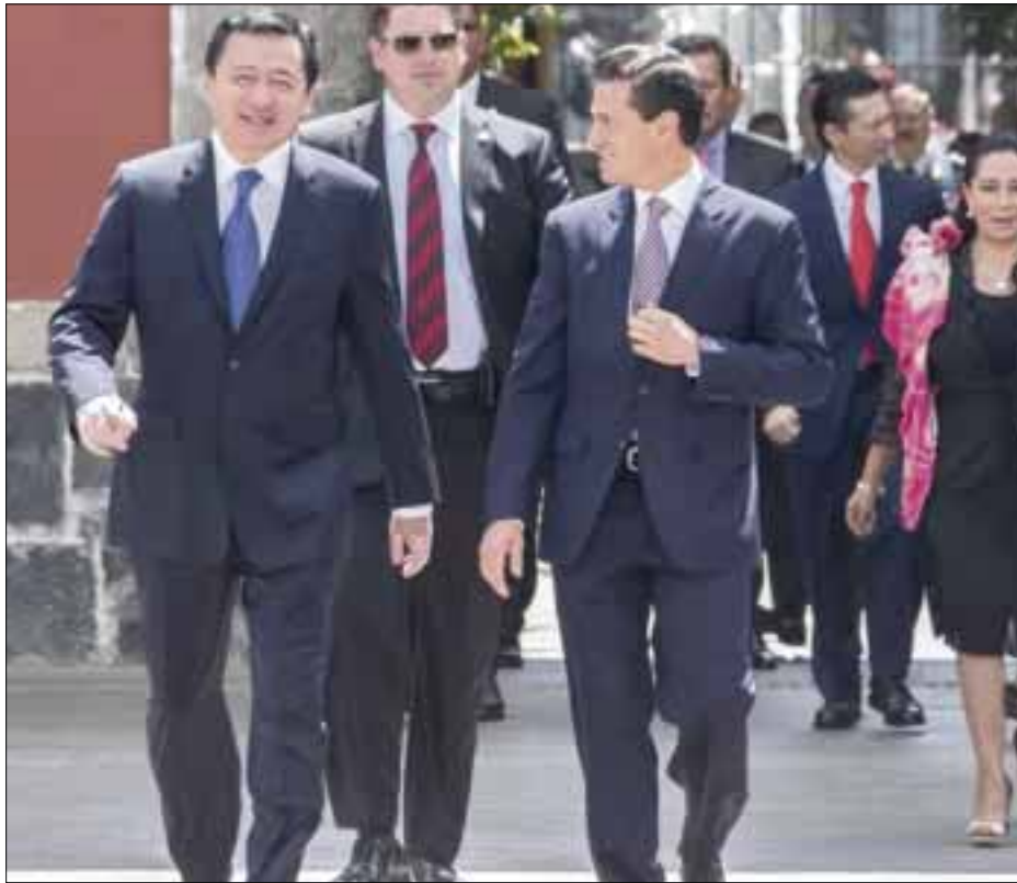
El presidente Enrique Peña Nieto inauguró la Segunda Reunión de la Conferencia Regional sobre Población y Desarrollo de América Latina y el Caribe.

Durante la inauguración de la Segunda Reunión de la Conferencia Regional sobre Población y Desarrollo de América Latina y el Caribe, apuntó que en contraparte, el número de habitantes con menos de 25 años, tiene una tendencia a la baja, y para