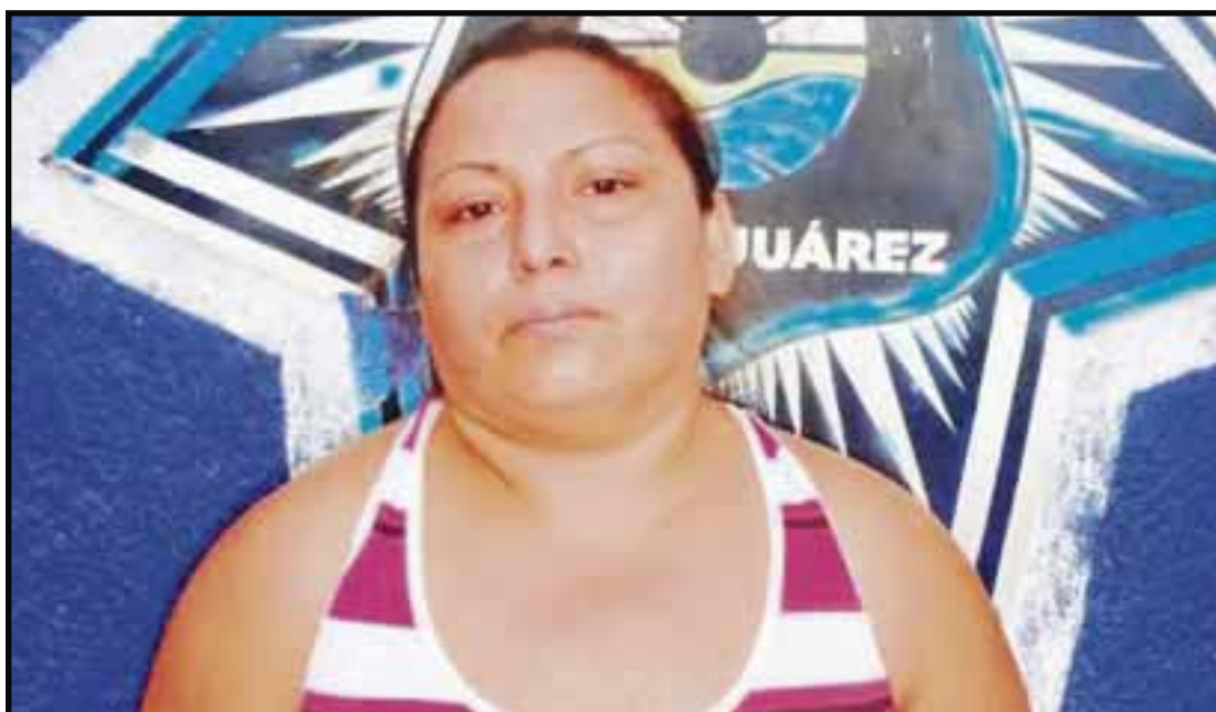
Esta mujer fue detenida como sospechosa de controlar un prostíbulo en la supermanzana 66, que es la zona donde operan 17 negocios de ese giro.

Cancún.- Una presunta tratante de personas fue detenida en la supermanzana 66, donde operan 17 prostibulos las 24 horas del día.