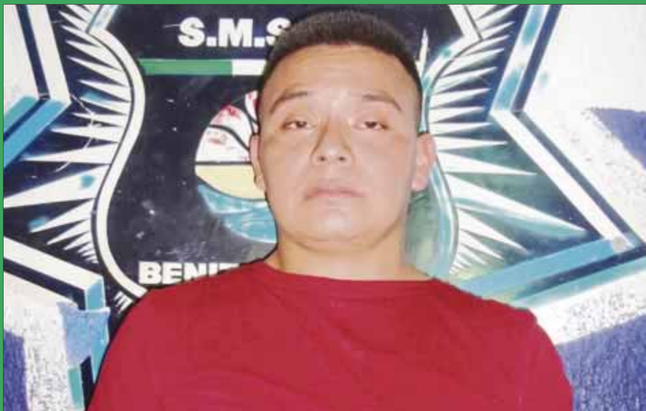
Caro le salió a este exhibicionista tocar lascivamente a las jovencitas de la secundaria de Villas Otoch.