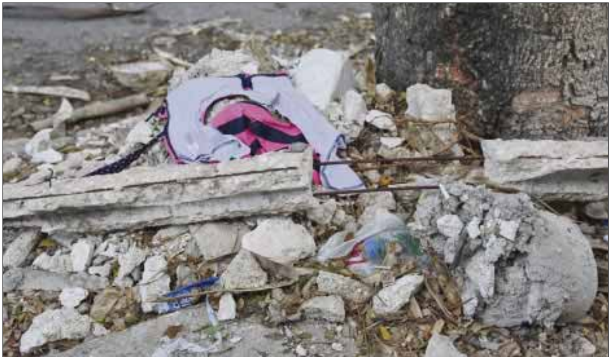
Arrojar escombros y basura a la vía pública, para algunos vecinos de la región 520 es una práctica común.

En un recorrido por el fraccionamiento en cuestión, se pudo corroborar la cantidad de escombros tirados en las esquinas, la basura depositada irresponsablemente en los camellones, así como incontables fugas de agua potable.