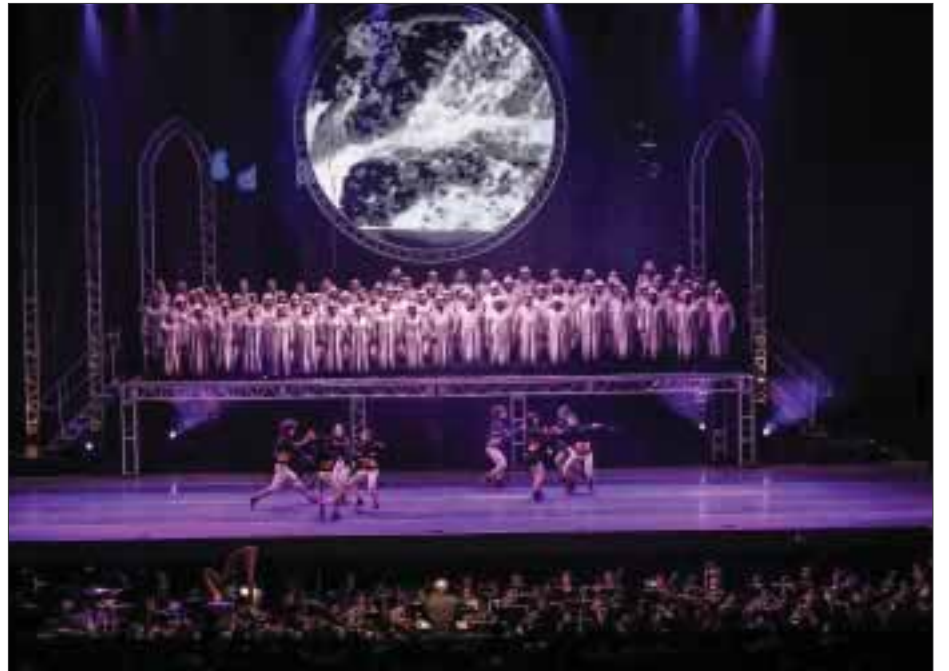
Los bailarines y el coro Enharmonía Vocals, integrado por cerca de 80 voces, ofrecen un espectáculo que seduce, a partir de su belleza convulsa, con toques pasionales.

El Bolero de Maurice Ravel fue otra de las piezas en este extraordinario concierto,