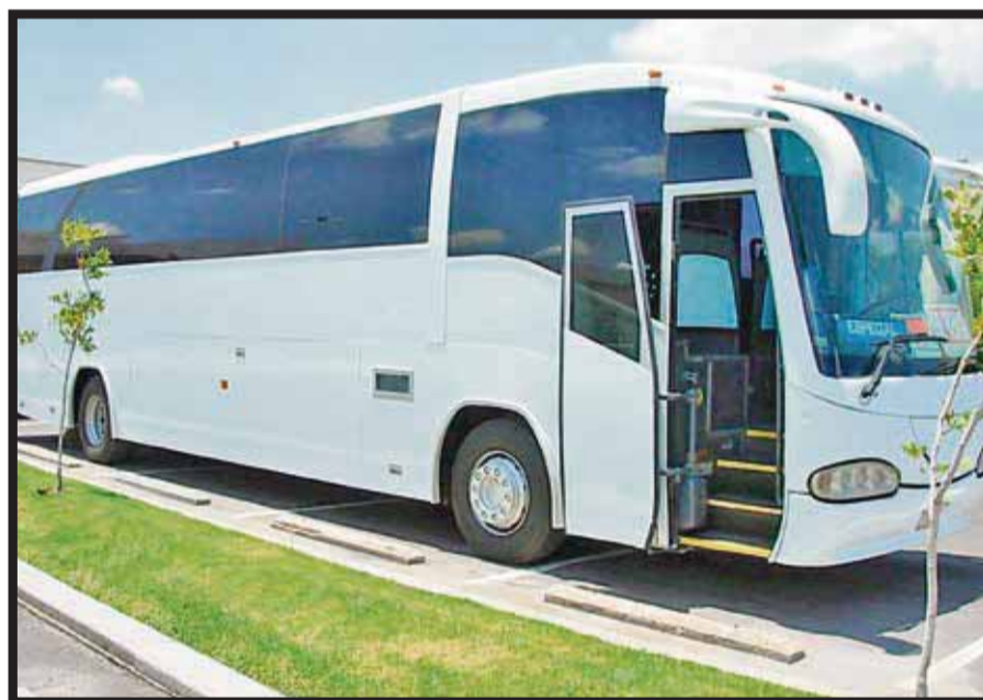
El transporte vía autobús crecerá para fin de año 150%.

El 90% de viajes en México son en autobús, especialmente por la economía que esta modalidad de transporte. “Otros beneficios importantes son que se puede llegar a todos los rincones del país, hay WiFi, pantallas individuales y asientos reclinables que traen una mejor experiencia para los viajeros. Hoy los autobuses son más cómodos, y además, los boletos ya se pueden comprar desde Internet sin pagar nada más”, señala Almeida Prado .