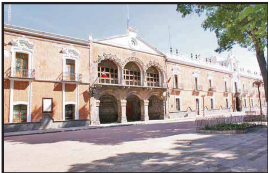
Tlaxcala, sede del Festival Internacional de Títeres Rosete Aranda.

Compañías de Guanajuato, Nuevo León, Oaxaca, Colima, Distrito Federal, Durango, Aguascalientes y Sinaloa, serán las entidades que participaran en esta edición, mientras que estarán presentes representantes de