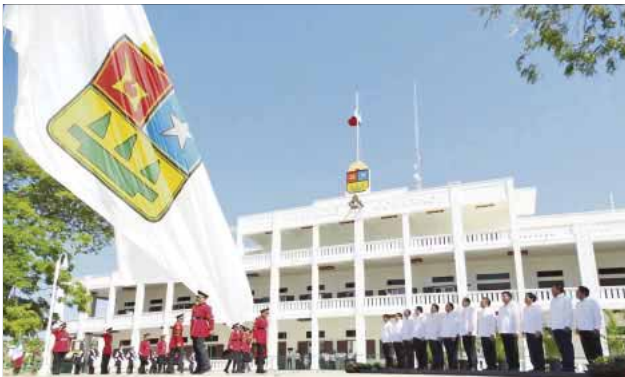
Las celebraciones iniciaron en la Plaza Cívica del Palacio de Gobierno, con el izamiento de la Bandera de Quintana Roo.

nía, tenemos claro que el destino de Quintana Roo, sólo corresponde decidirlo a los quintanarroenses”, aseguró.