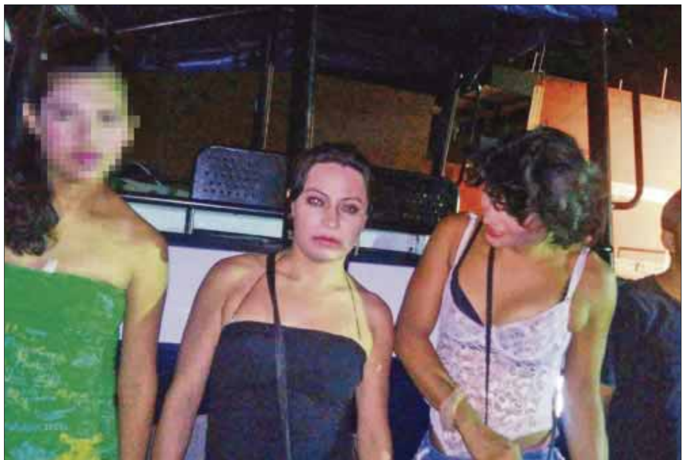
Los travestis ofrecían sus servicios sexuales a hombres y mujeres, por cantidades que van de los 500 a los 2 mil pesos.

Vale la pena mencionar que para evitar cuestionamientos, la Secretaría de Seguridad Pública argumentó que los operativos anti-prostitución se llevan a cabo en base al artículo 534 Bando de Gobierno y Policía, fracción VII, del capítulo II, donde se señala que se comete una falta cuando se invita a la prostitución, se ejerce o se solicita dicho servicio en la vía o lugares públicos.