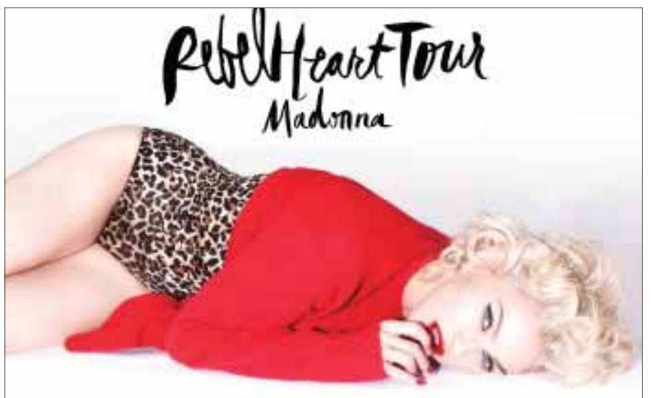
Madonna confirma que México está en la lista de países que visitará con su gira mundial. La Reina del Pop se presentará el 6 de enero de 2016 en el Palacio de los Deportes de la ciudad de México.

Para más información sobre fechas y ciudades entra a: www.madonna.com .