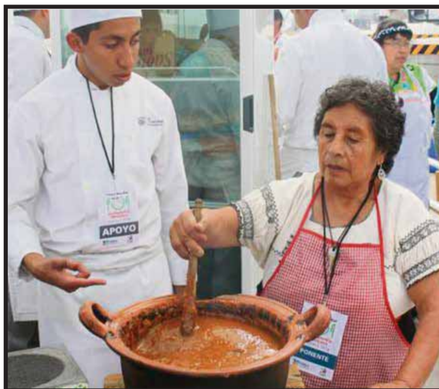
Cocineras de Tlaxcala, primer encuentro.

El Hub del hotel está diseñado como un espacio de reuniones sociales que ofrece a los huéspedes una atmósfera creativa con un toque de arte contemporáneo. Ahí mismo se encuentra un impresionante cande-