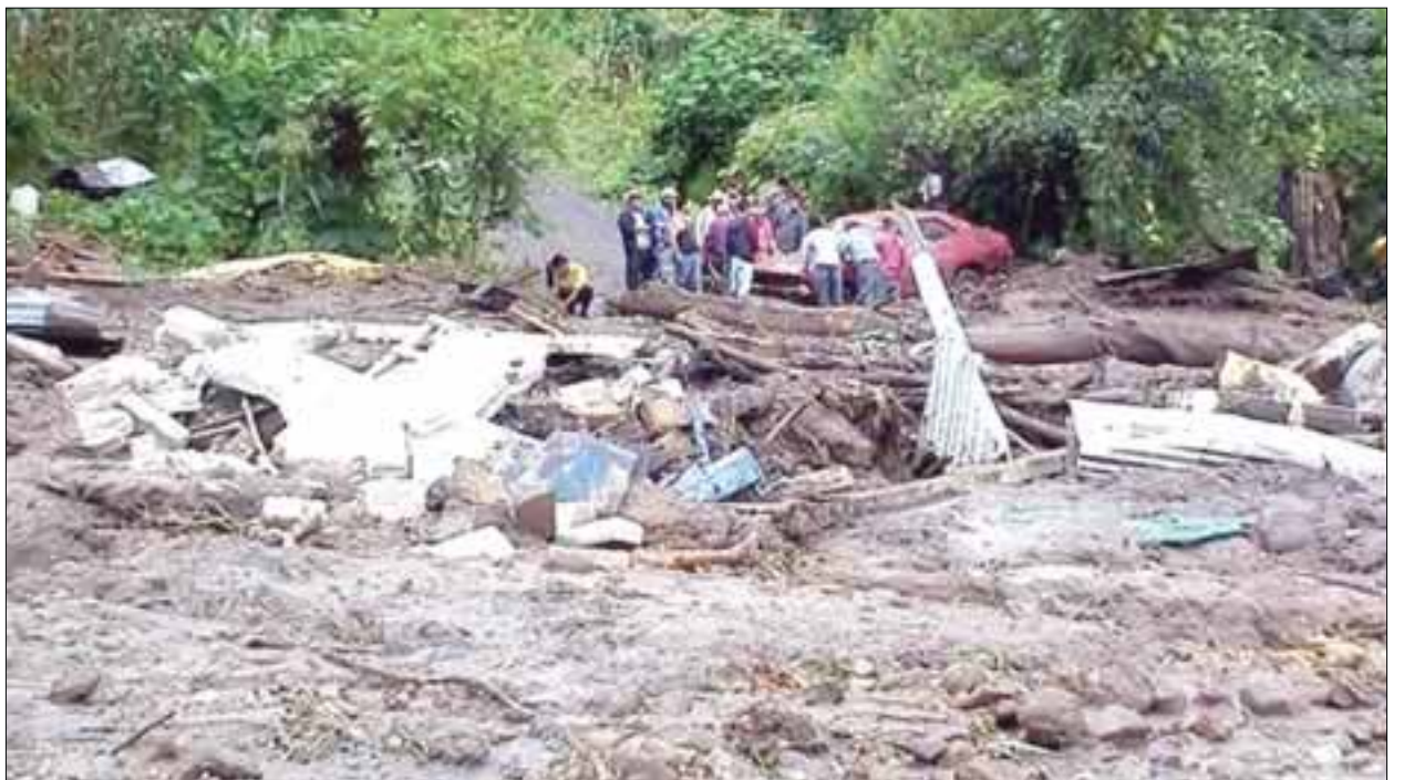
La tierra cubrió totalmente la vivienda donde se encontraba durmiendo una familia de siete integrantes.

La vivienda de la familia Fuentes estaba construida de madera y fue la única alcanzada por el deslave del cerro.