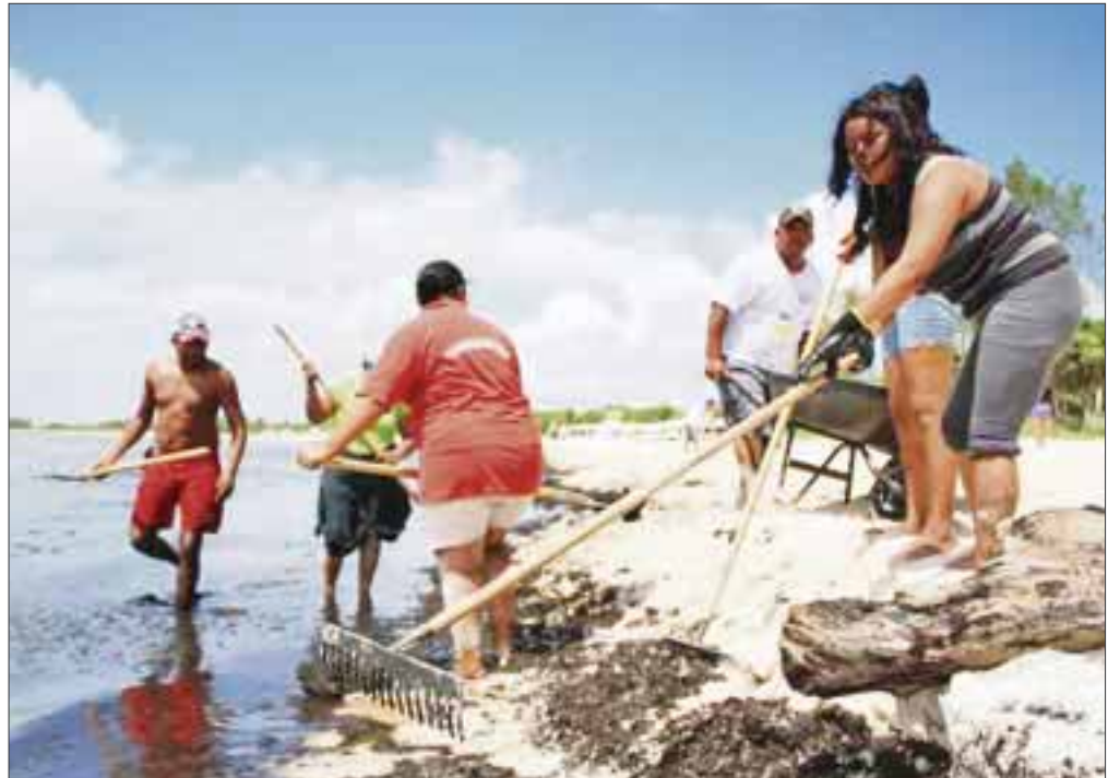
Este año la limpieza se llevará a cabo en playa Caribe, Shangrilá, Chuzubul, playa de la calle 88, Punta Esmeralda, Xcalacoco y Paamul a partir a las 8:00 horas el próximo sábado 19 de septiembre.

Manifestó que Solidaridad promueve entre los ciudadanos la conservación y el cuidado de la infraestructura turística, playas y paisajes del municipio con líneas de acción que permiten el involucramiento de los sectores en educación ambiental.