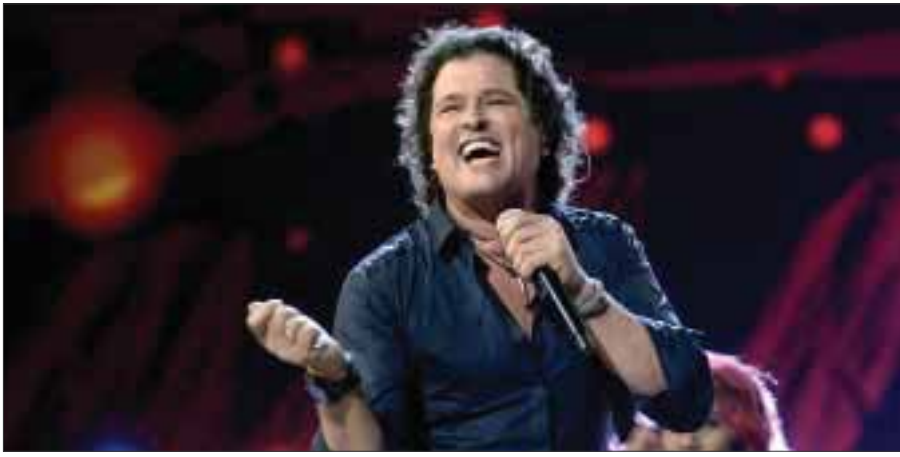
En su concierto, Carlos Vives dejó ver todo el amor que siente por México.