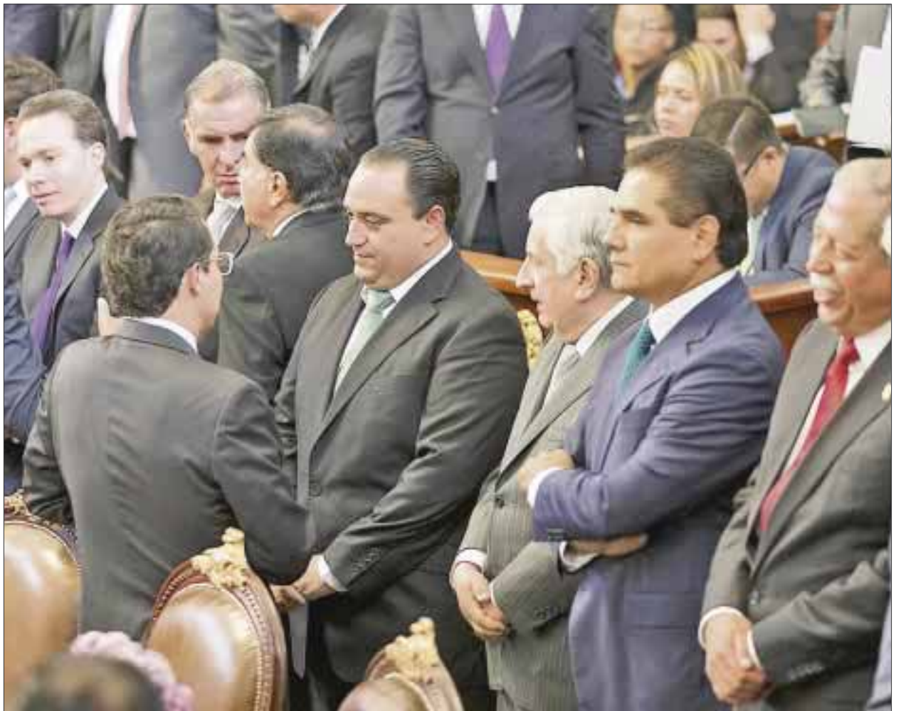
Roberto Borge aseguró que su estado y el DF son entidades seguras y turísticas.

El gobernador Roberto Borge Angulo felicitó al jefe de gobierno, quien durante su mensaje destacó que a la mitad de su mandato seguirá gobernando sin colores y con igualdad para todos.