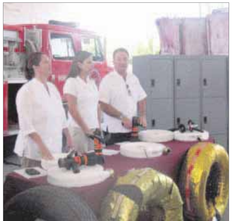
Las donaciones se agregan a lo recabado en el “Bomberotón” y la fiesta disco del mes pasado, recursos con los que se planea comprar una pipa de agua.

Por último, precisó que les están ayudando a los elementos con transporte, becas para sus hijos y están gestionando que les paguen mejor, para que todos los bomberos se sientan motivados, pues tienen proyectado que cada mes el patronato les mande material que necesiten.