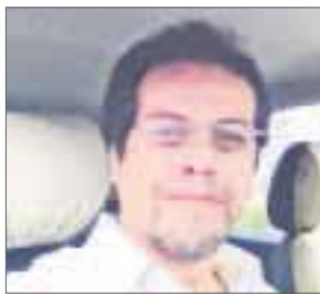
POR MAURICIO CONDE OLIVARES