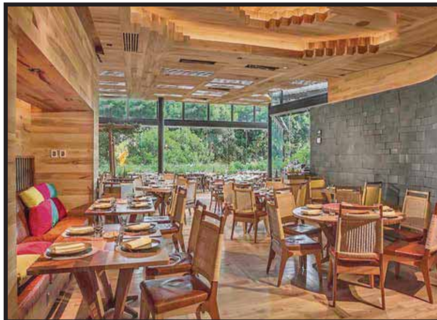
El restaurante galardonado.

El nuevo director del GACM es licenciado en derecho por la UNAM y, antes de ser director corporativo de Finanzas del GACM, fue director