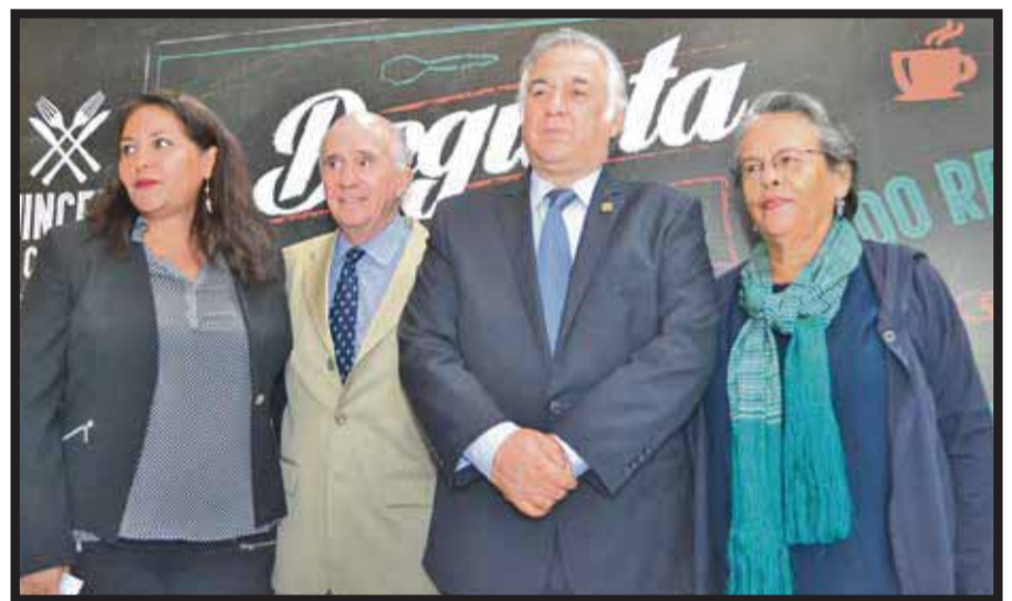
Del 1 al 15 de octubre próximo, la Semana del Comensal.

El responsable de la política turística en el DF dijo que otro as-