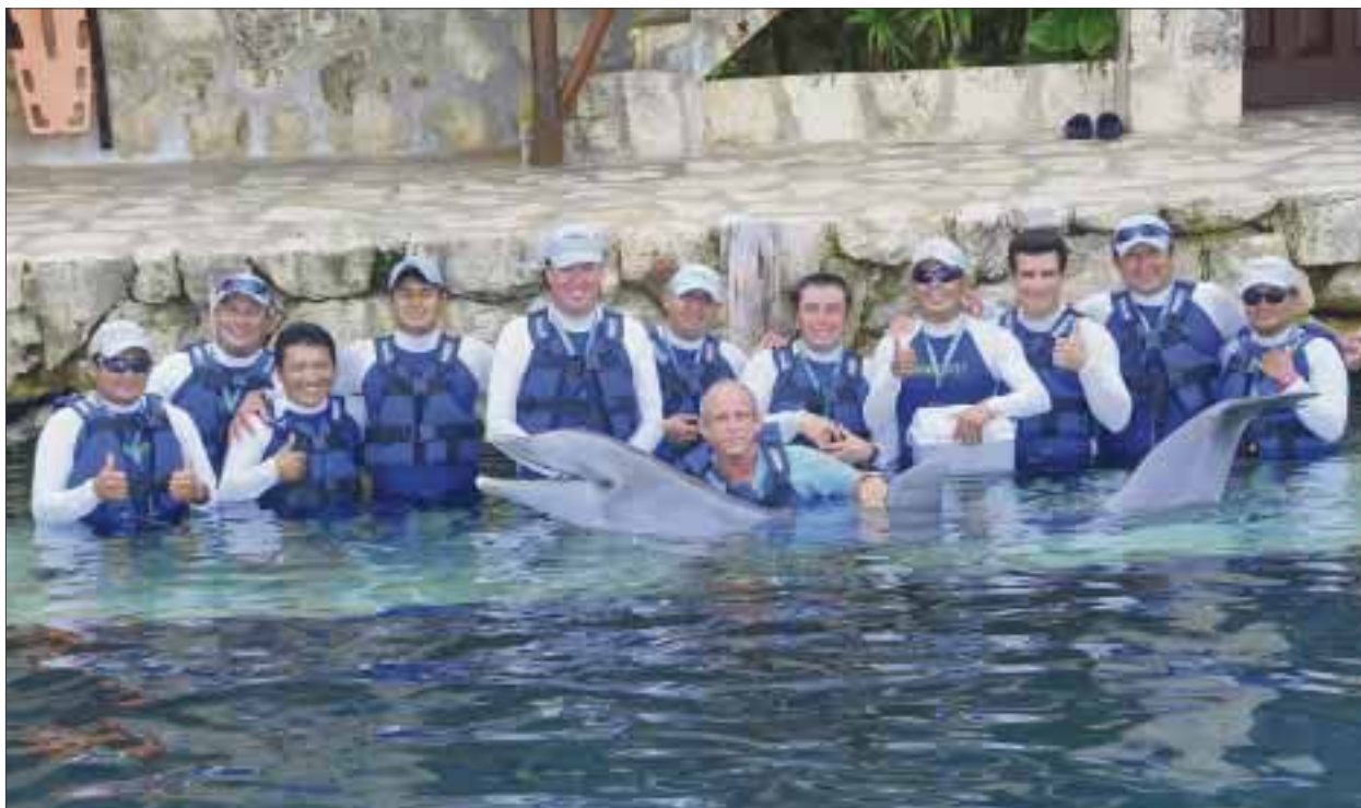
Xunán-Há está en plena madurez y cuando se acerque a los 30 podríamos decir que estaría llegando a lo que en seres humanos se llama tercera edad.

bién es la primera que nació y sobrevivió en todo México”, cumplió 23 años de vida, informó el biólogo marino Tomás Capote, director de comportamiento animal de Delphinus.