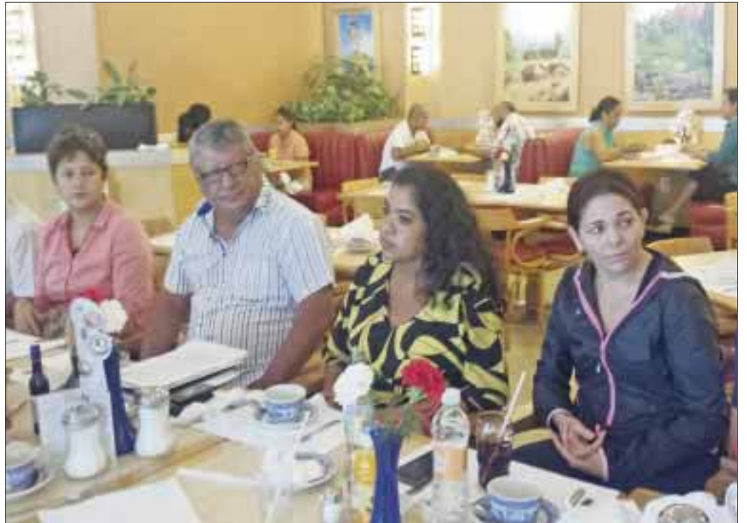
El ex trabajador que ganó la demanda laboral contra el Colegio Gregoriano, mantiene secuestrados los documentos de los alumnos, lo que impide que se inscriban en otras escuelas.