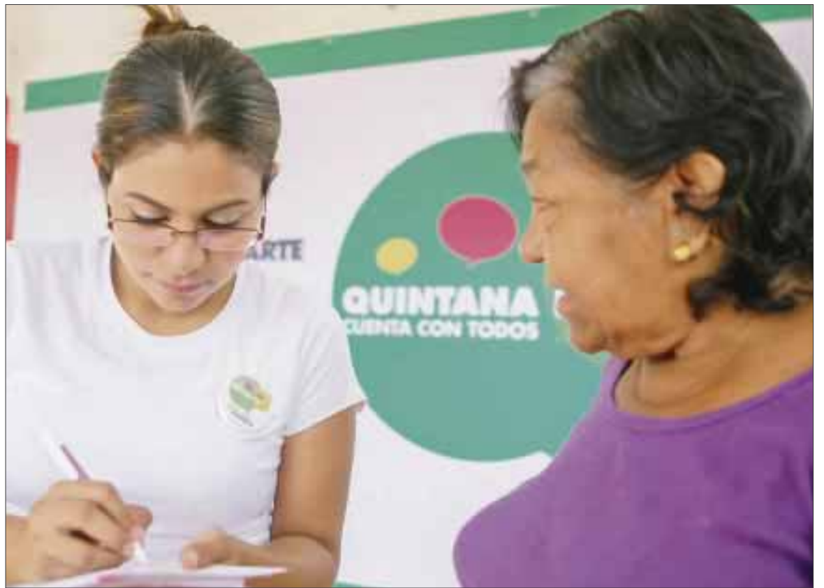
La encuesta se realiza en todo el estado, y este fin de semana llegará a la Isla de las Golondrinas.

Asimismo, hizo un llamado a las familias cozumeleñas a que este sábado acudan a los módulos de participación ciudadana "Quintana Roo cuenta con todos".