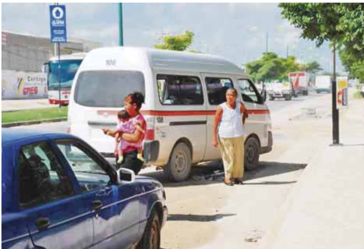
En este municipio sancionaron a cinco unidades de servicio de transporte público, al tener exceso de pasajeros en sus unidades.

La medida se aplica al representar un riesgo constante para quienes viajan en la combi ya que al circular con sobrecupo se tienen mayores posibilidades de sufrir algún accidente, por lo que pidieron la colaboración de la ciudadanía y no subirse cuando ya no hay lugares disponibles.