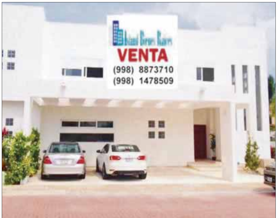
En el estudio participaron 45 de las ciudades más importantes del país y se tomó como parámetro el costo por metro cuadrado de una casa nueva en venta.

De acuerdo con el estudio, entre las cinco ciudades más accesibles para comprar una casa se encuentran Matamoros con 3 mil 437 pesos y Nuevo Laredo con 4 mil 041, ambas en Tamaulipas; Tehuacán, Puebla, con 4 mil 948 pesos; Tulancingo, Hidalgo, con 5 mil 600, y Torreón y su área metropolitana, en Coahuila, con 5 mil 749 pesos.