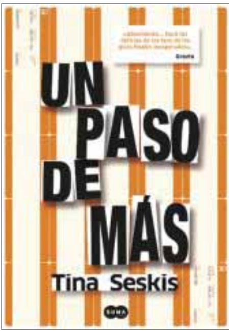
"UN PASO DE MÁS" - TINA SESKIS EDITORIAL SUMA

**Novela debut de Tina Seskis que, tras su autopublicación en Inglaterra, alcanzó un gran éxito de ventas.