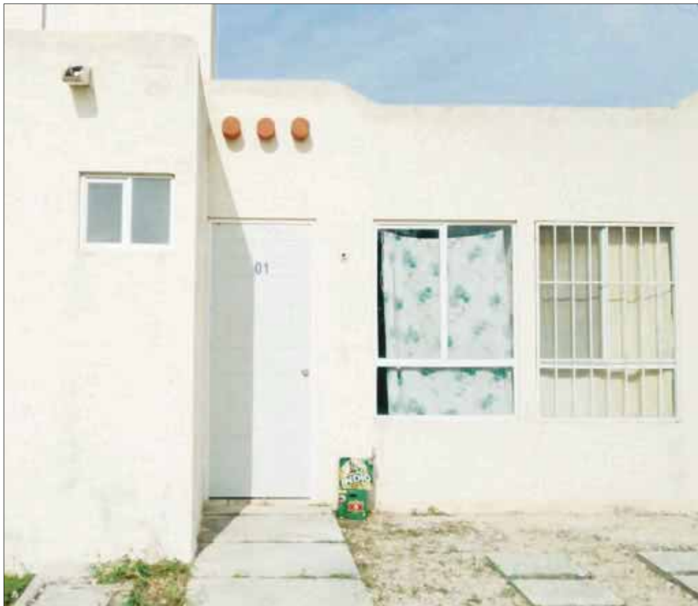
En esta casa vivía la joven de 17 años, que tras discutir con su sobrina, se quitó la vida.

Además, la noche anterior a su muerte había estado ingiriendo bebidas embriagantes con "unas amigas", lo que le provocó ira a su sobrina.