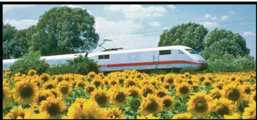
Con Rail Europe, al Oktoberfest.

☆☆☆☆☆Lo que resta del mes de septiembre y todo octubre, aún es