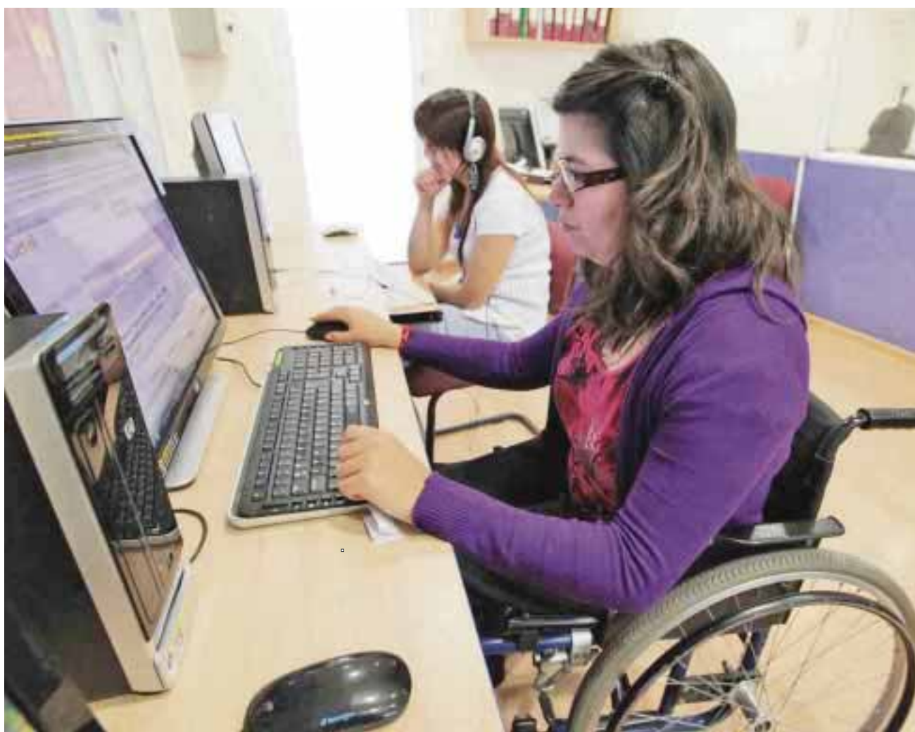
El programa pone al descubierto posibles deficiencias en destrezas y áreas que requieren de una evaluación profunda.

Dijo que el equipo tiene un costo de 2.5 millones de pesos y es una aportación del Gobierno Federal a través de la Secretaría del Trabajo federal, que permitirá establecer los diversos grados de habilidades, tanto académicas como relacionadas con el empleo que presenta un evaluado.