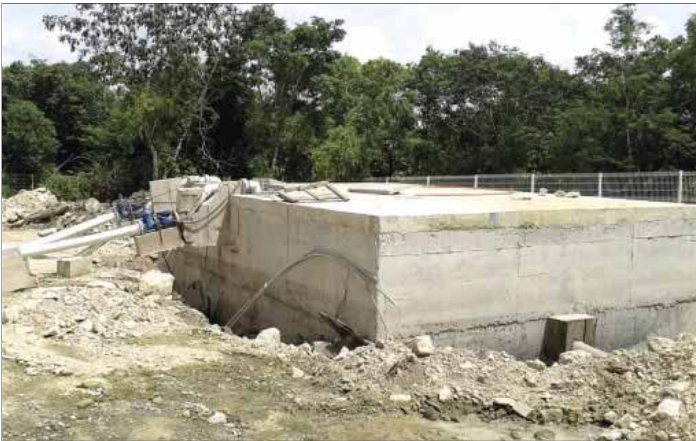
El cárcamo en la colonia Flamingos fue mal construido y hubo derrames que contaminaron la zona.

Contamina manto freático, denuncian vecinos de la Flamingos