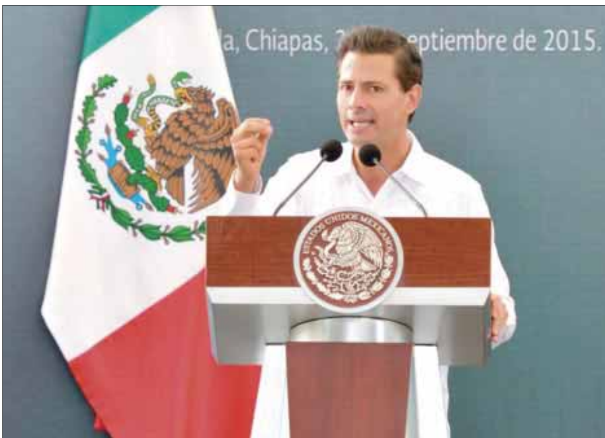
El presidente Enrique Peña Nieto presentó en su gira por Tapachula la iniciativa de Ley Federal de las Zonas Económicas Especiales.

Confió en que esta iniciativa sea revisada, enriquecida y, en su caso, aprobada por el Congreso de la Unión para estable-