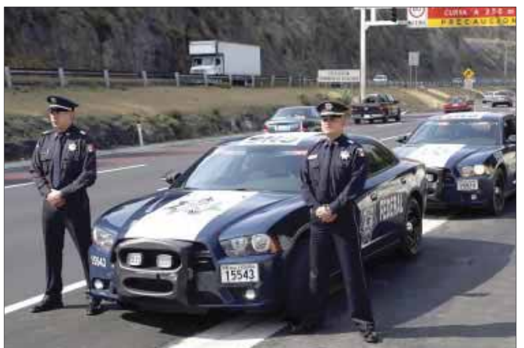
La fecha límite de registro para formar parte de la Policía Federal es el 30 de noviembre.

Cabe señalar que todas las etapas del proceso son gratuitas y cualquier irregularidad deberá ser reportada al Órgano Interno de Control de la Policía Federal, al correo electrónico uai.informacion@cns.gob.mx .