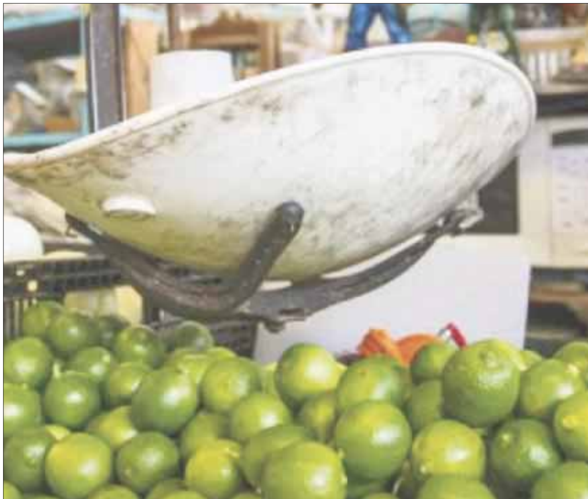
En mayo y junio se tendrá disponibilidad de limón en la entidad, al traer Diconsa 2.5 toneladas del cítrico que se distribuirán en 63 tiendas de Quintana Roo.

Mencionó, que la venta será controlada y sólo se dará un kilo o kilo y medio, al considerarse que la situación es de apoyo, al darse una situación inesperada que puede dañar la economía de la población.