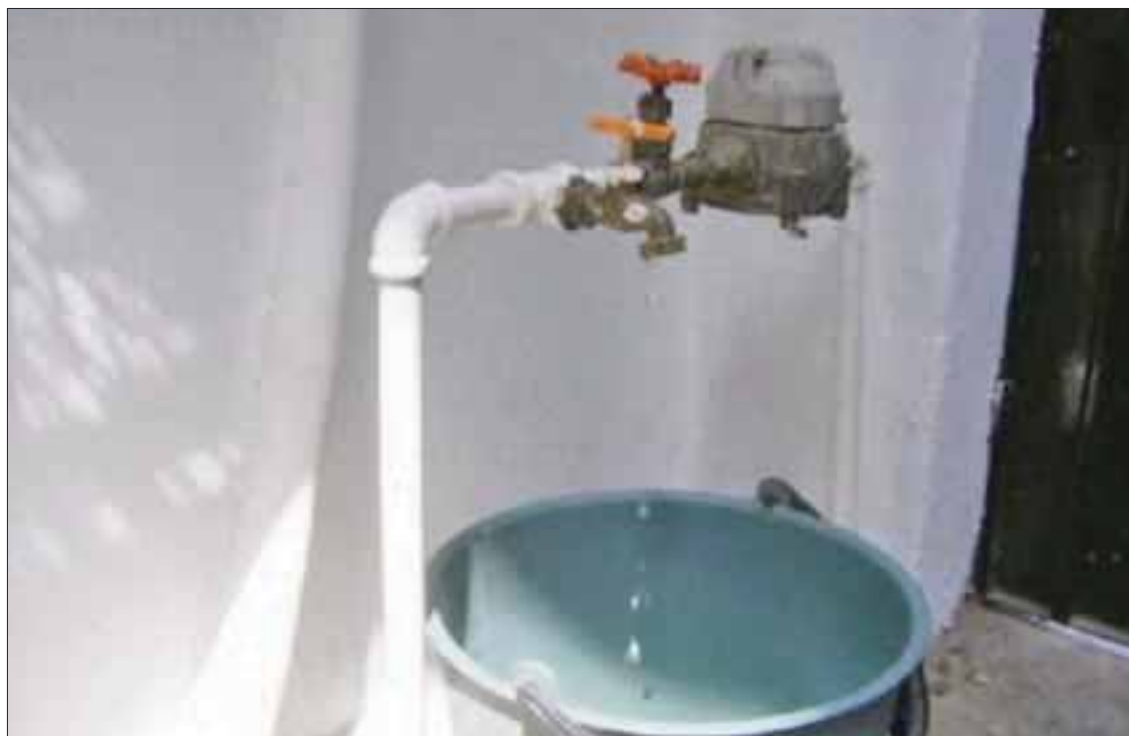
Desde el mes pasado, habitantes sufren escasez de agua en la capital.

Chetumal.- Cientos de familias sufren escasez de agua en la capital del estado y las más afectadas son las colonias populares y hasta la fecha continúa el desabasto.