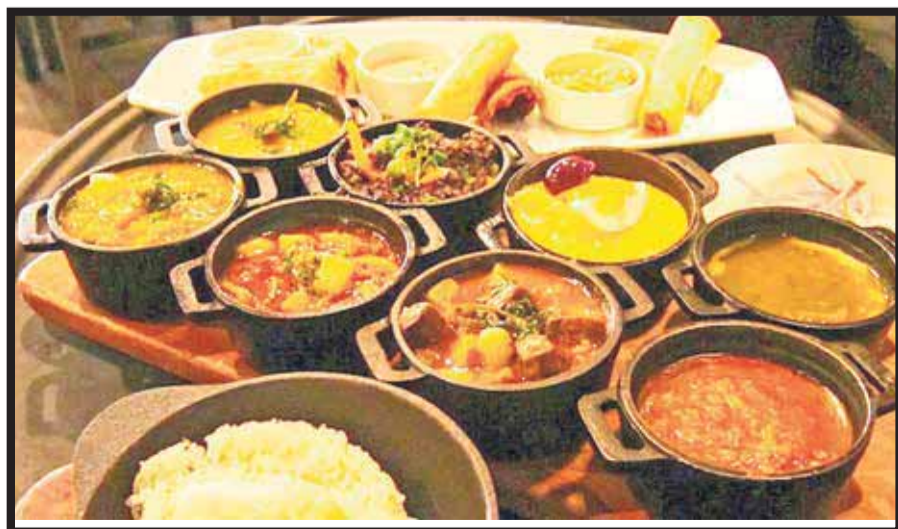
La gastronomía de Perú, en el Foro Mundial de la OMT.

El programa Mejora tu Hotel se anuncia antes de que inicie el Tianguis Turístico, en Guadalajara,