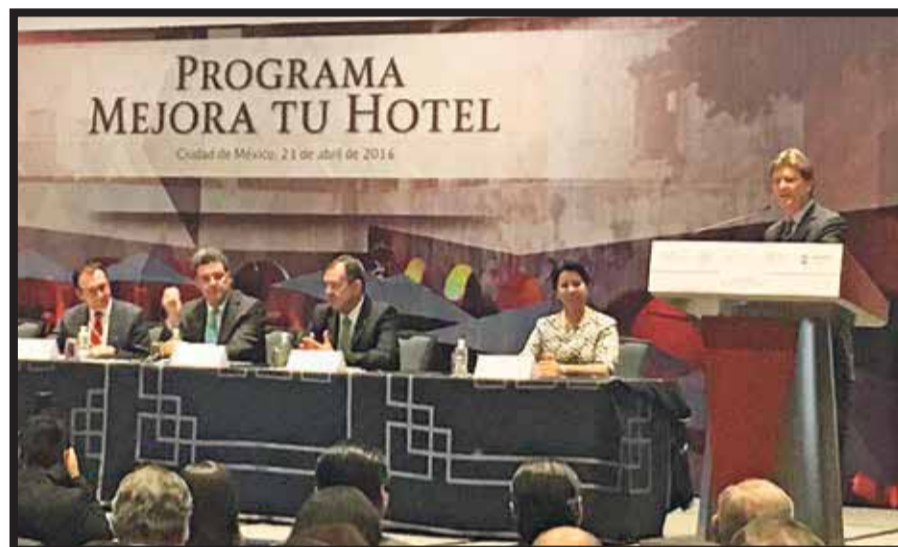
Durante la presentación del programa Mejora tu Hotel.

“Estamos apoyando a la industria hotelera mediana y pequeña, porque los grandes hoteles traen financiamiento de la banca de desarrollo y comercial. Aquí nos enfocamos en