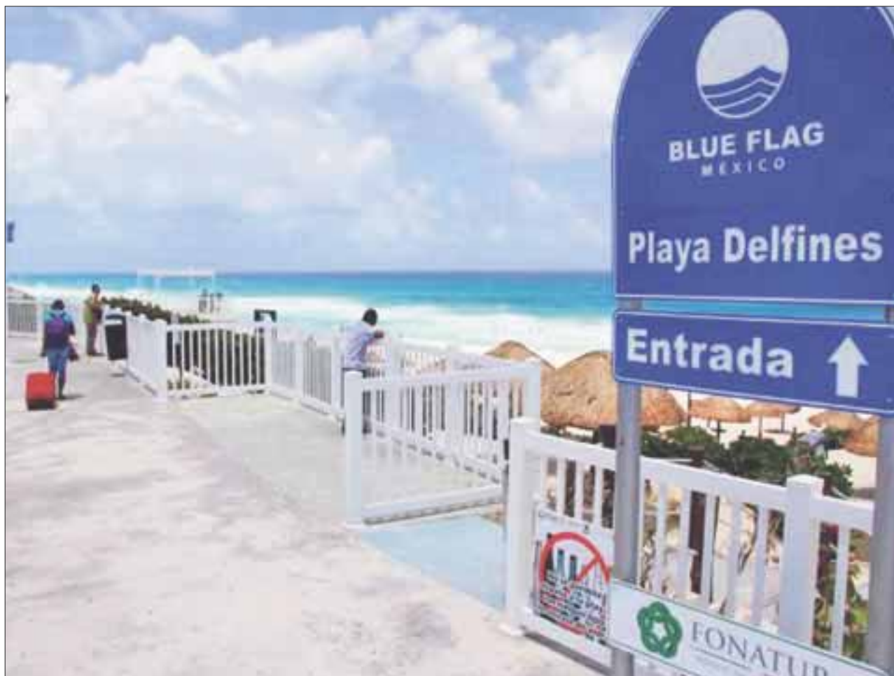
Las siete playas de Cancún obtuvieron una buena calificación en el estudio técnico que se les practicó para verificar el cumplimiento de los 33 requisitos que exige el comité calificador.

Una vez que concluya la recepción de la documentación y resultados se espera que en junio se entregue de manera oficial el galardón a las playas de Cancún, que las cataloga como las más limpias y seguras para los bañistas nacionales y extranjeros.