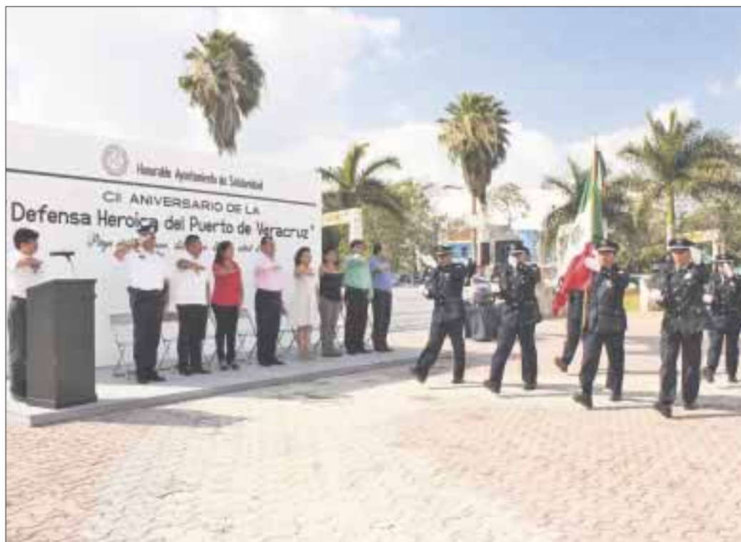
Durante la ceremonia cívica se contó con la participación de la banda de guerra y la escolta oficial de la Dirección de Seguridad Pública y Tránsito.

La limpieza de playas y equipamiento logró mantener a las 7 playas de Cancún entre las 27 playas del país que van por el galardón "Blue Flag", luego de someterse a supervisiones y análisis minuciosos de expertos en la materia