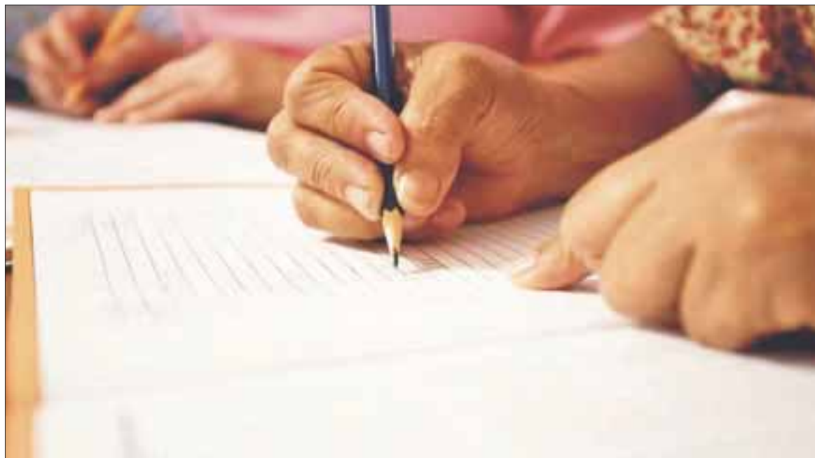
En Quintana Roo, 300 mil personas carecen de su certificado de educación primaria y secundaria, 136 mil se ubican en Benito Juárez.

Cancún.- Son alrededor de 300 mil personas que carecen de su certificado de educación primaria y secundaria, de los cuales 136 mil se ubican en Benito Juárez; que a través del Programa Especial de Certificación (PEC) pretenden certificarse y en este año lo harán 18 mil en el estado.