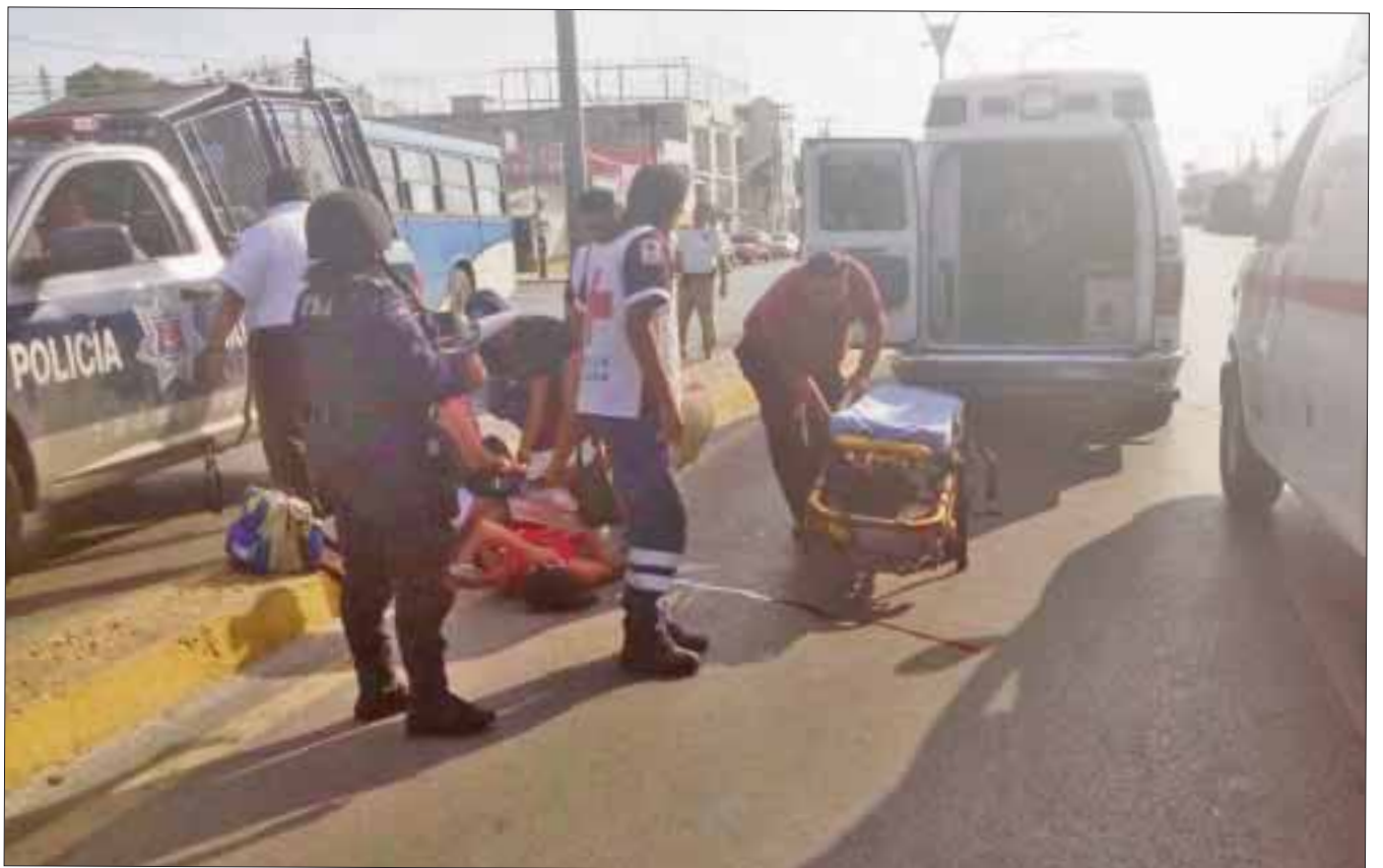
De forma extraña una joven mujer dio a luz en plena calle, frente a la zona comercial del Crucero.

El Hospital General reportó que el menor se encontraba estable en pediatría, mientras que la madre se recuperaba del parto.