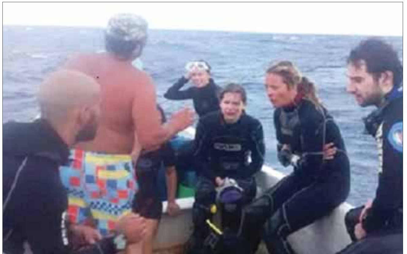
La capitanía de puerto trabaja en la localización de la embarcación "Anita" que abandonó a los turistas en altamar, sin un aparente motivo que justifique su regreso a la isla sin sus tripulantes.

Los pescadores ubicaron a los buzos perdidos en la zona norte de la isla Cozumel, quienes expresaron que es evidente que de no haber sido encontrados por la lancha pesquera probablemente no habrían sobrevivido.