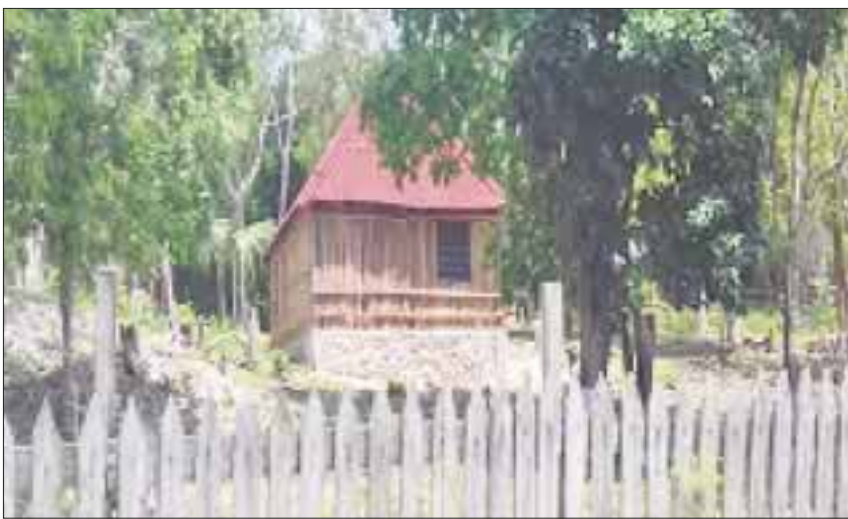
Un predio del IPAE había sido tomado por los invasores, que ya estaban construyendo sus "casitas".

Bacalar.- Ante los imparables casos de despojo e invasión de predios en Bacalar, el Instituto del Patrimonio Estatal (IPAE) realiza trabajos de cercado y colocación de letreros en lotes de su jurisdicción, ubicados en avenida Costera.