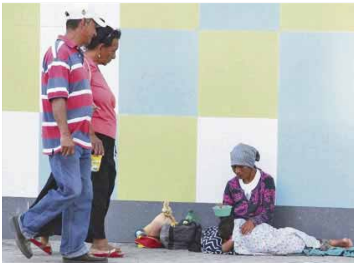
En la gráfica se ilustra una mujer de edad, con un menor durmiendo sobre la acera de Plaza las Tiendas, de la supermanzana 63.

Así Cancún se ha convertido en una de las primeras ciudades con el mayor número de pedigüños “nylon”, pues todos tienen casa y buenos alimentos y existe uno que hasta automóvil tiene.