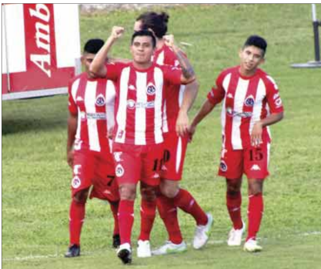
Pioneros de Cancún venció a la Máquina azul celeste, por marcador global de 4 goles a 3.