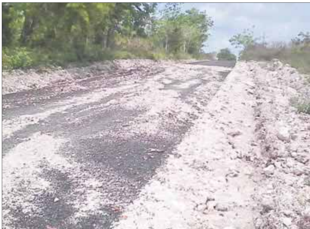
Los pobladores han presenciado 4 accidentes por mala planeación.

Los pobladores han previsto que el recién encarpado de la carretera no pasará de dos meses y volverá a quedar en malas condiciones, debido a que la lluvia a afectado los trabajos que se realizaron en dos meses.