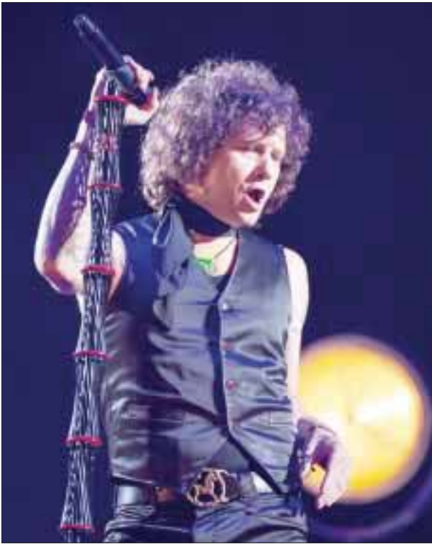
Enrique Bunbury atiborró tanto gradas como el general con miles de personas dispuestas a cantar cada uno de sus éxitos.

que se pensaba sería como tradicionalmente lo hacen el cierre del show , pero no fue así, pues aún tenían mucho que ofrecer.