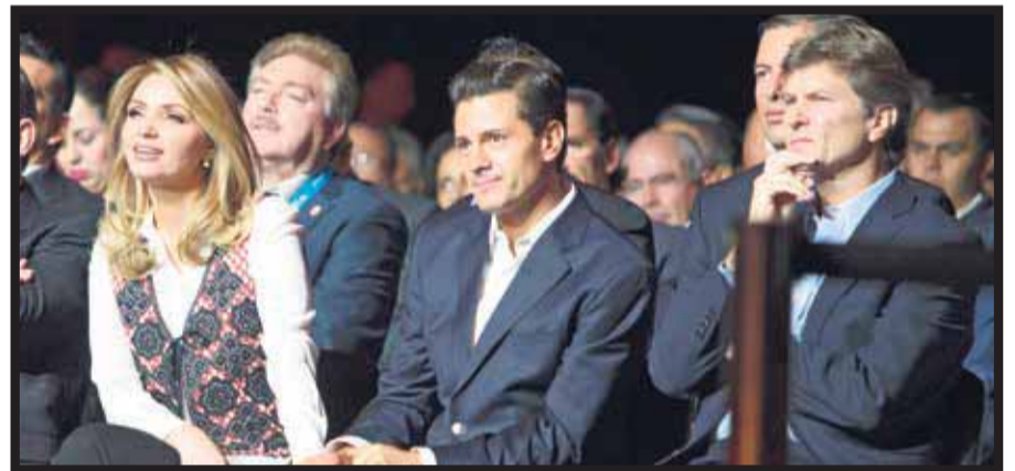
Angélica Rivera, Enrique Peña Nieto y Enrique de la Madrid.

Que México ya es una potencia turística como lo demuestra su