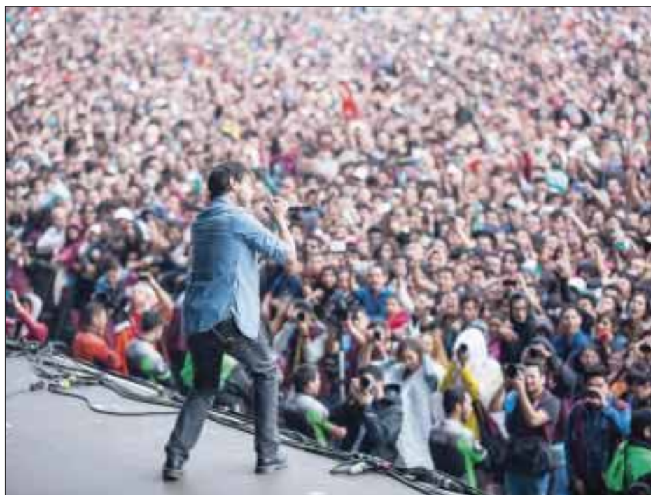
DLD se presentó en el escenario principal, enloqueciendo a miles de fans.

Arrancaron con una ola de sus grandes éxitos como "Los piratas", "Distrito Federal", y "Raquel", con los que Cucho empezó a calentar los motores "Viva México cabrones", gritó para luego presentar a "Perro viejo", Serrano, compositor y cantante de la banda, se arrancó con "El pájaro vio el cielo y se voló", "Osito de peluche de Taiwán" y otras, hasta llegar al enervante frenesí propiciado por "El murguero", esta última