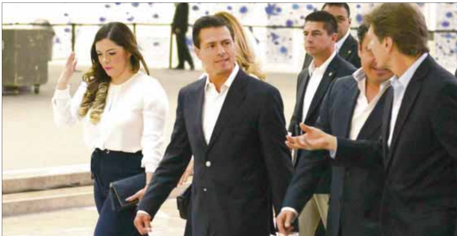
Enrique Peña Nieto presentó el programa “Viajemos todos por México”, durante la inauguración del 41 Tianguis Turístico México 2016 en Guadalajara, Jalisco.

“Somos un país como pocos, como para presumirnos ante el mundo”, afirmó para luego indicar que el programa busca aprovechar los nueve millones de asientos de avión vacíos cada año y los casi 93 millones de cuartos de hotel que no se ocupan durante esos mismos periodos.