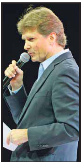
Enrique de la Madrid.

Universidad Anáhuac sobre la huella del turismo, que por cierto, dijo, “es muy importante, y los números lo dicen... México puede ser una verdadera potencia turística mundial, tenemos condiciones y la voluntad. Si hoy trabajamos con base en planes y coordinación, podemos seguir creciendo a doble dígito y llegar por qué no, a un 12 por ciento del PIB”.