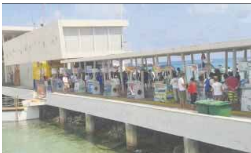
En total serán 13 cámaras de seguridad las que vigilen el recinto portuario.

Cozumel.- Se reforzará la vigilancia en el muelle fiscal para garantizar la seguridad de los viajeros que cruzan, bajan o abordan las naves que cubren la ruta Cozumel-Playa del Carmen y viceversa.