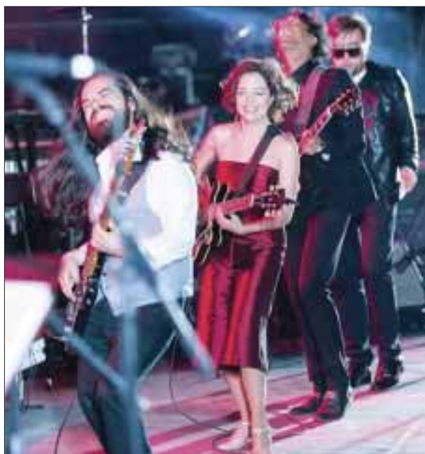
En el escenario Tecate una glamorosa y guapa Natalia Lafourcade inundó el terreno con las interpretaciones de sus éxitos y fue aplaudida por miles de fanáticos.