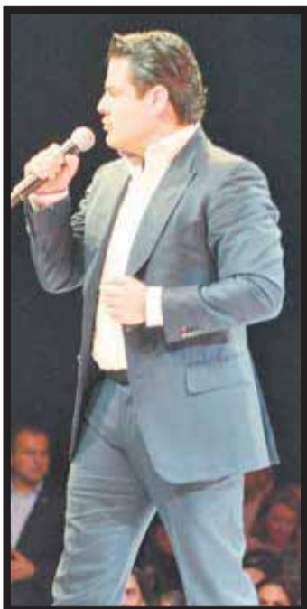
Aristóteles Sandoval, gobernador de Jalisco.