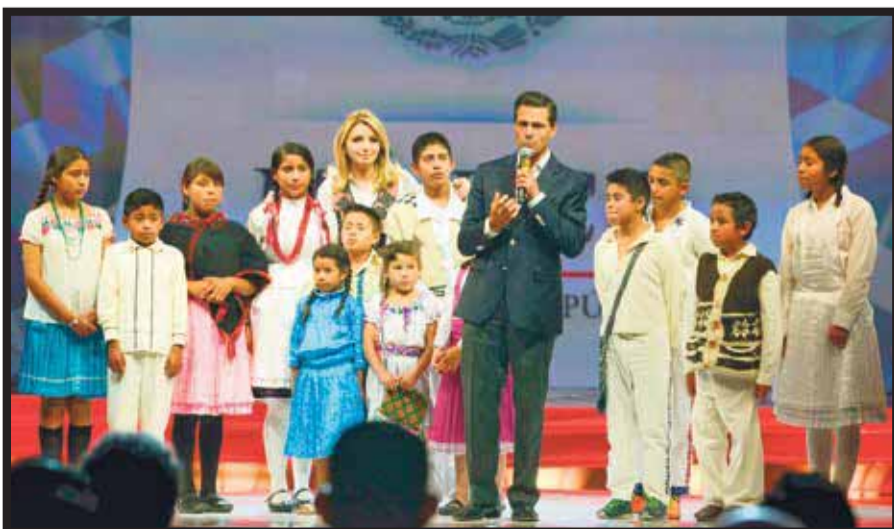
Los primeros en Viaja por todo México fueron niños mazahuas.

En este Tianguis, dijo Azcárraga , entregaremos el estudio que realizamos en conjunto con la