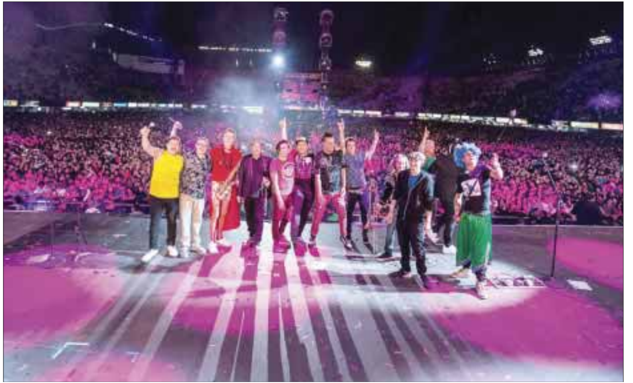
La gente recibió a los miembros de Los Auténticos Decadentes, que emocionados por el honor de cerrar el primer día de festival, hicieron un explosivo show.

Siguió con temas de su repertorio como “Creo que me enamoré”, “Viento” y “El rey del rock & roll”. Para este momento la noche ya había entrado de lleno y se dio tiempo para hacer un par de temas de