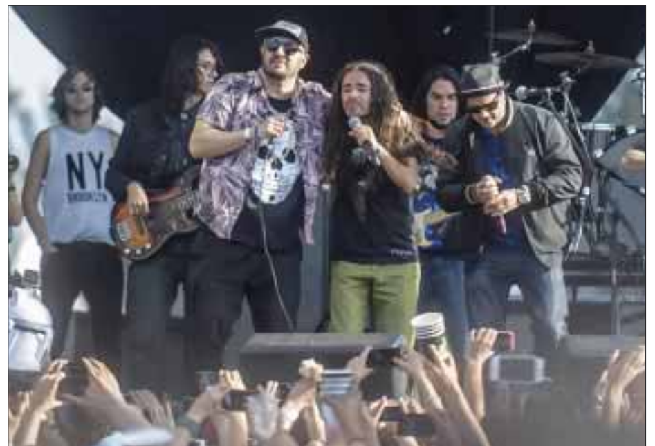
Los Auténticos Decadentes, el día domingo, quienes en compañía de Rubén Albarrán y lo que queda de la banda de Ska Salón Victoria, interpretaron "Corazón".

En subida es como camina esta banda mexicana, encabezando una nueva generación de rockeros y escalando también horarios y escenarios en el festival más importante de Latinoamérica. DLD se presentó en el escenario principal, enloqueciendo a miles de fanáticos que no dejaron de acompañar cada tema como "Todo cuenta", "Por siempre", "Arsénico", "Canción de cuna" y muchos otros en su rock alternativo con el que se adueñaron de este lu-