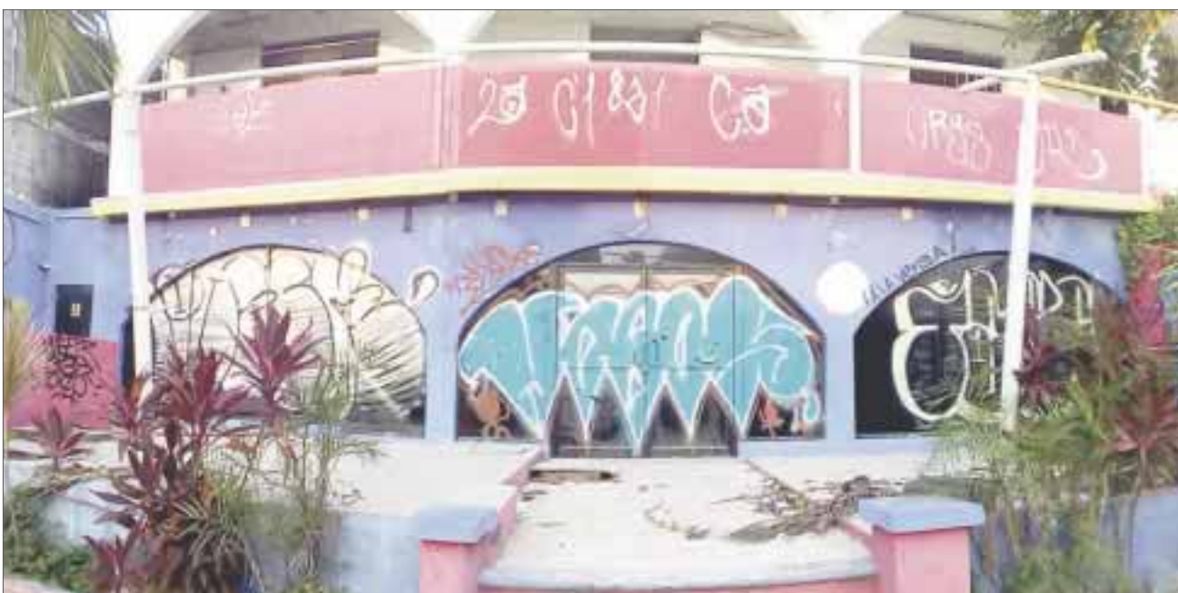
Este local que lleva cinco años abandonado, se ha convertido en un basurero, y una amenaza para los vecinos.

Cancún.- Un local abandonado sobre avenida Yaxchilán esquina con calle Orquídeas de la supermanzana 22, fue reportado por vecinos y locatarios de la zona, ya que además del cúmulo de basura que se encuentra en la fachada, también hay un número de llantas viejas, las cuales están sirviendo como zona de reproducción de moscos.