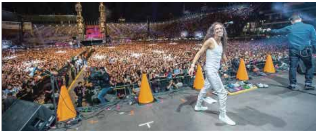
Café Tacvba, liderado por Rubén Albarrán, llegó para ofrecer un show digno de festival.

Los Fabulosos Cadillacs, “Siguiendo la luna” y “Basta de llamarme así”, para luego cerrar su show con “Los caminos de la vida”.