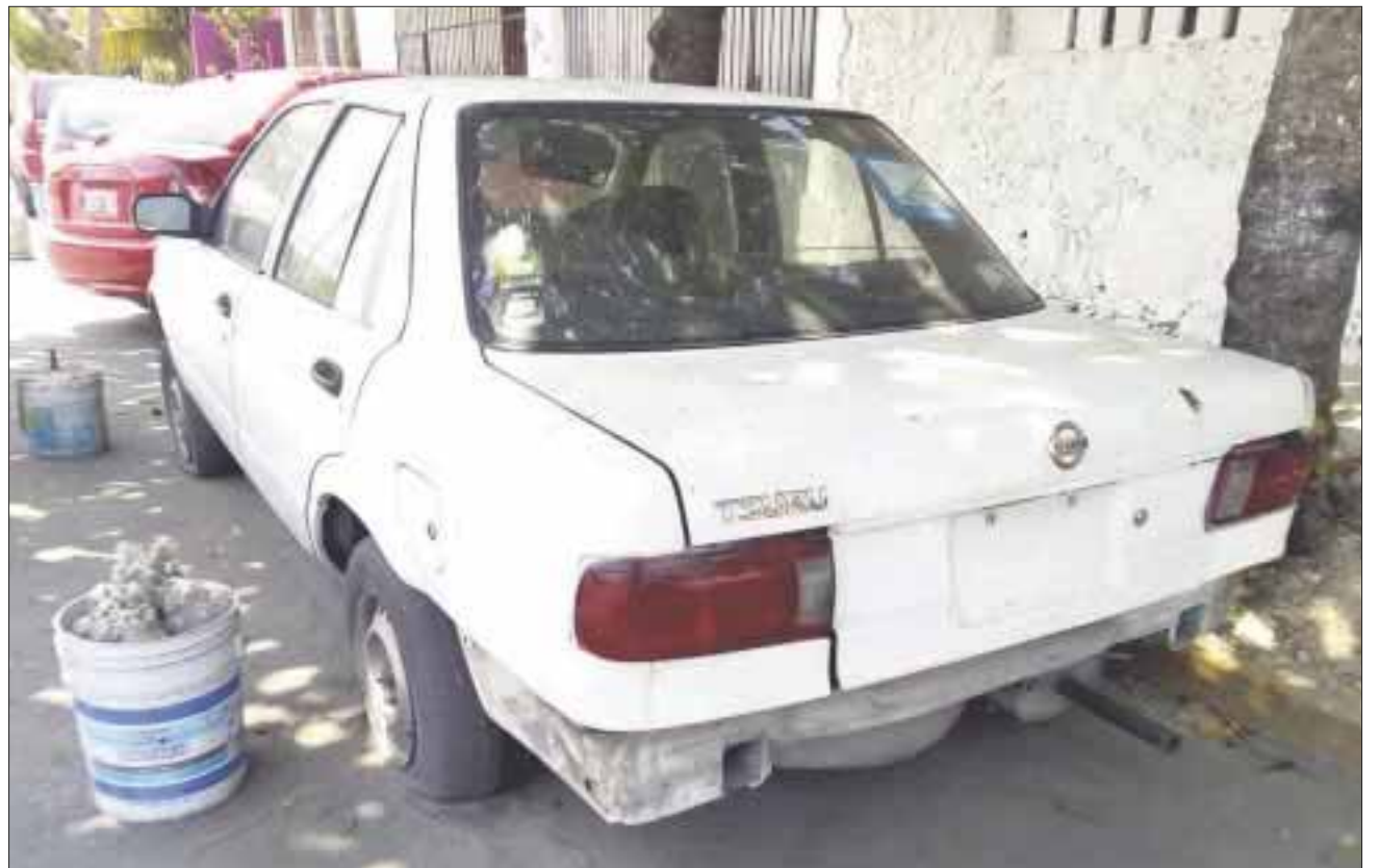
Sobre avenida Nichupté, Talleres y la López Portillo se encuentra una gran cantidad de autos extrañamente olvidados desde hace más de un año.

Este problema tiene que ver con la delincuencia, pues una buena parte de estos autos que ahora son un problema para los vecinos, han estado involucrados en hechos delictivos, por lo que sus ocupantes los abandonan en estacionamientos o en avenidas populosas.