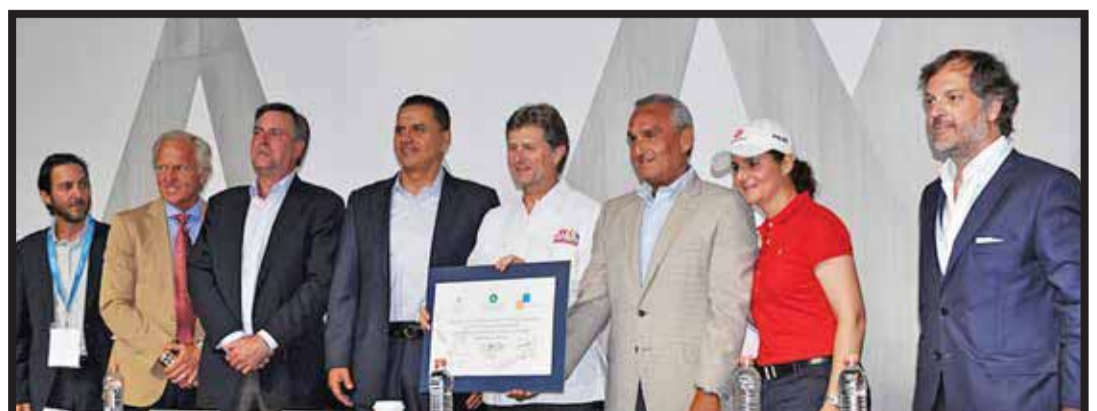
Impulsará el Fonatur Costa Canuva.

victoriagprado@gmail.com Twitter: @victoriagprado