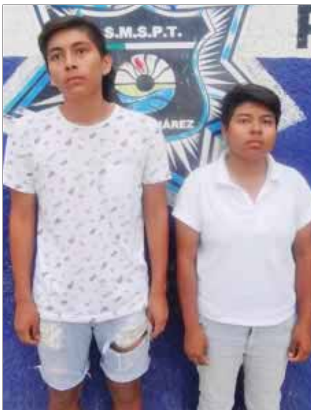
Una mujer que escondía presunta mariguana en la zona genital, fue detenida en una céntrica plaza del primer cuadro de la ciudad.

Ante esta situación, ambas personas fueron llevadas a la Secretaría de Seguridad Pública, para posteriormente ser puestas a disposición de la Fiscalía Especializada en Narcomenudeo.