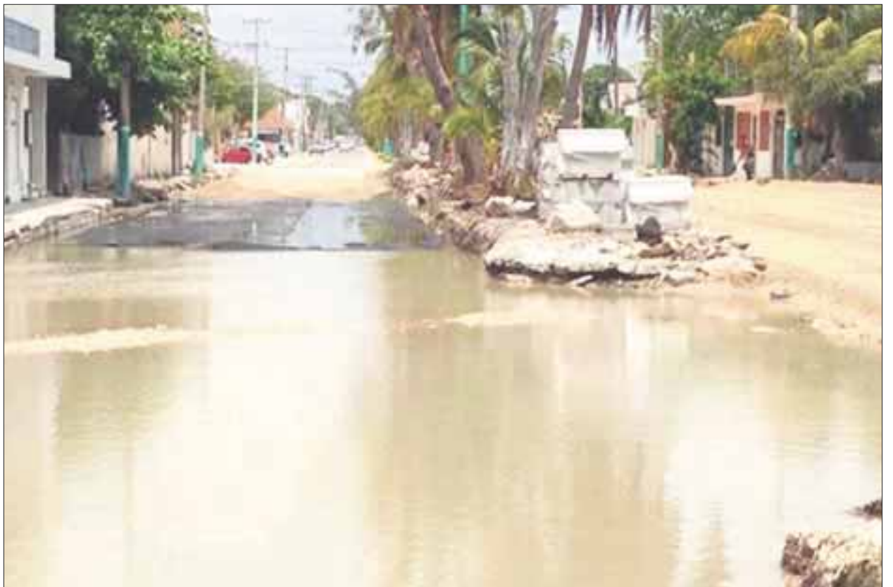
Debido a corrientes marinas y por ser zona baja, aumenta el peligro de desfondes en viviendas del centro.

Algunos propietarios, al percatarse del peligro que corren, pretenden vender sus viviendas, pues las excavaciones, los trabajos y el movimiento de la maquinaria, generaron desfondes internos en sus casas.