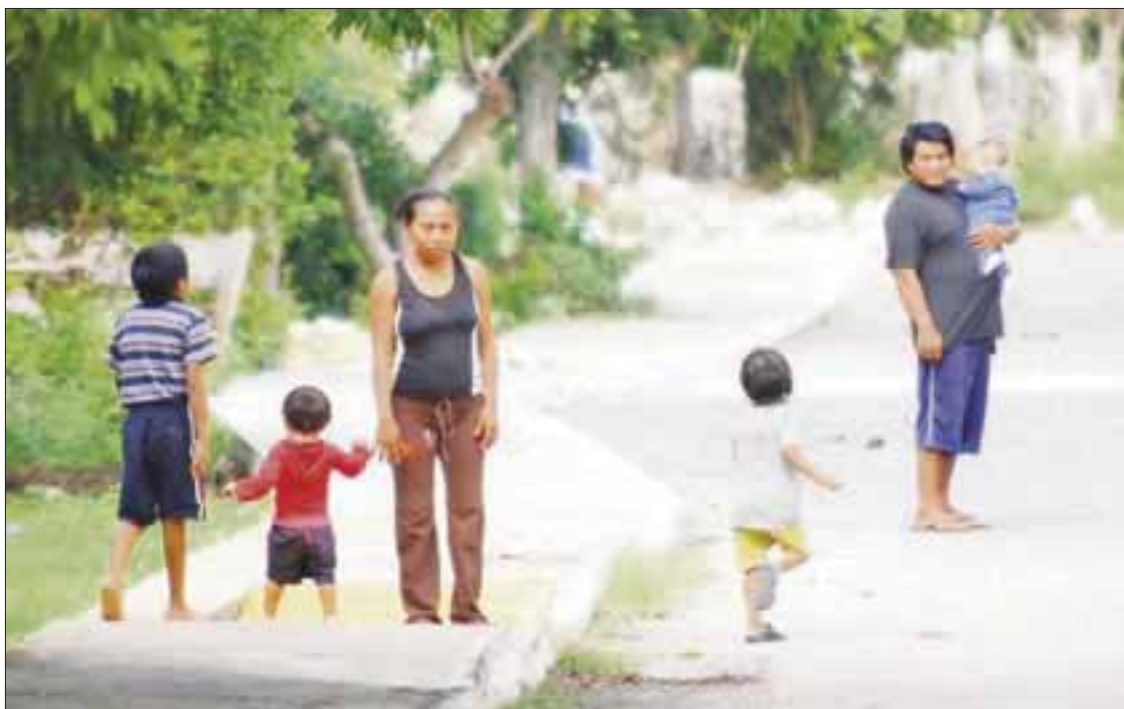
En Quintana Roo, tres de cada 10 menores padecen altos índices de desnutrición en las zonas marginadas y poblados mayas.

Cancún.- En esta entidad tres de cada 10 menores padecen altos índices de desnutrición en las zonas marginadas y poblados mayas, lo que afecta en el desarrollo de las nuevas generaciones en sus centros de estudio, al presentar problemas de aprendizaje.