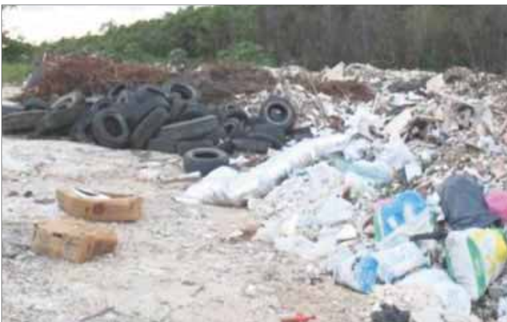
La gente desconoce cómo deshacerse de las llantas y lo más fácil es sacárselas a la calle o tirarlas a los baldíos.

Chetumal.- En breve se instalará una trituradora de llantas en Othón P. Blanco y con ello se pretende reciclar 10 mil neumáticos para reducir la contaminación y prevenir accidentes y enfermedades como el dengue.