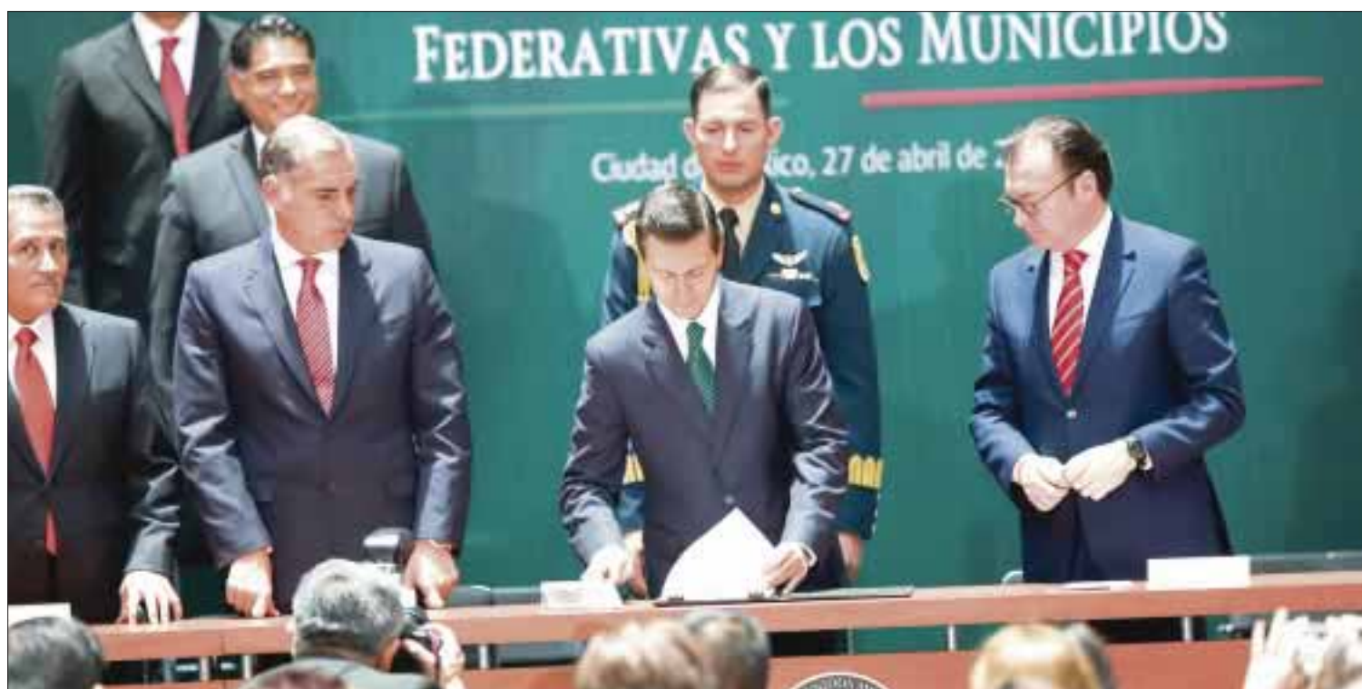
El presidente Enrique Peña Nieto , durante la Promulgación de la Ley de Disciplina Financiera de las Entidades Federativas y los Municipios.

Permitirá reducir los costos de la deuda pública a los estados y municipios, además de que el Registro Público Único permi-