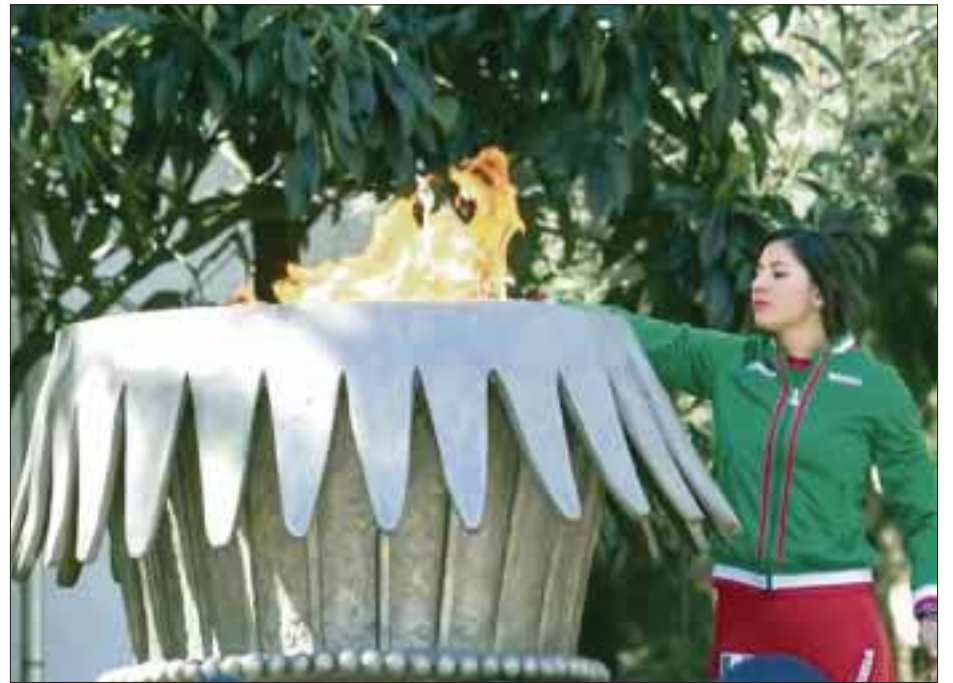
Con el encendido del pebetero olímpico arrancó en México la cuenta regresiva de los 100 días para el inicio de los Juegos Olímpicos de Río 2016.

Manifestó que para ello, la noche de ayer se realizaron varios eventos, como la iluminación del estadio Olímpico Universitario con los colores de México y Brasil, así como el Senado de la República se iluminará con los aros olímpicos y se tendrá un conteo regresivo en pantallas del aeropuerto capitalino.