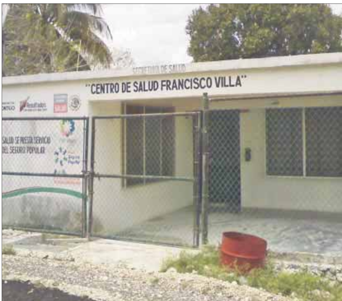
Decenas de pobladores presentan enfermedades de consideración.

En cuanto a los poblados de Canaan, Francisco Villa, Zamora, Monte Olivo, entre otros, los enfermeros sólo trabajan de lunes a jueves.