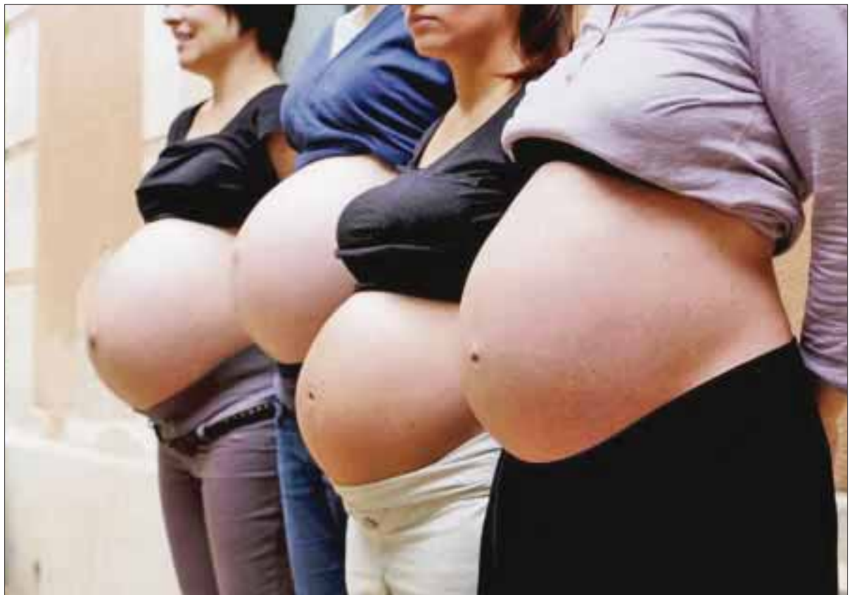
Sesa monitorea a mujeres embarazadas en Benito Juárez para descartar zika, al ser un virus que deja estragos en la salud.

En la cifra no se incluyó a las mujeres que se atienden en clínicas privadas, de manera que pidió a médicos familiares, ginecólogos y pediatras pongan atención para la oportuna detección de síntomas febriles relacionados con zika y realizar las pruebas pertinentes para detectar el tipo de virus que tengan.