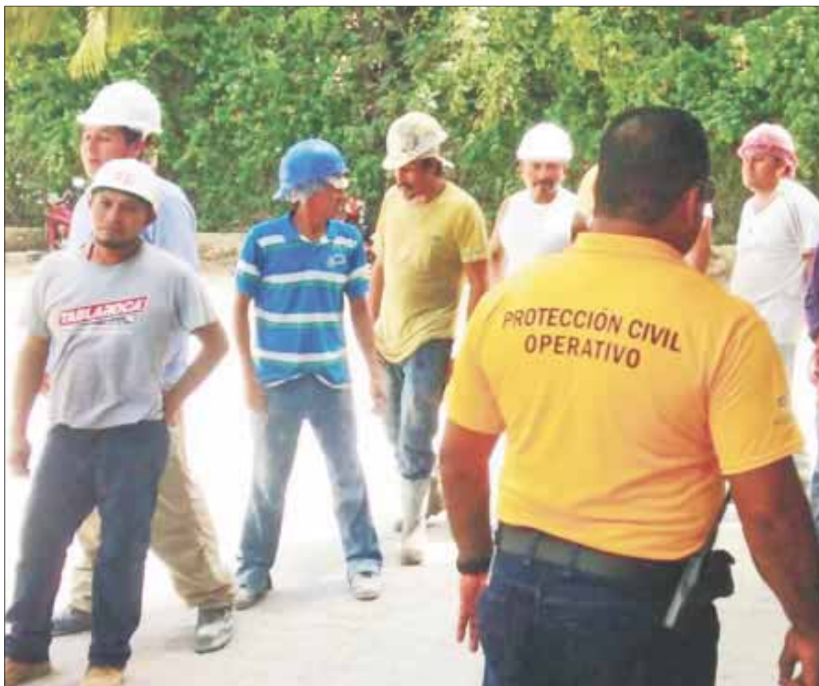
Personal de Salud va a los centros de trabajo para ofrecer líquidos a los obreros.

Aunado a ello, el ayuntamiento recomienda a la población mantenerse en lugares frescos, sea dentro o fuera del hogar, no exponerse a los rayos del sol de manera prolongada, el uso de ropa fresca y de colores claros, el aumento de consumo de líquidos de preferencia electrolitos orales, utilizar sombrillas, gorra, sombrero, lentes, protector solar, sobre todo en la zona de playa.