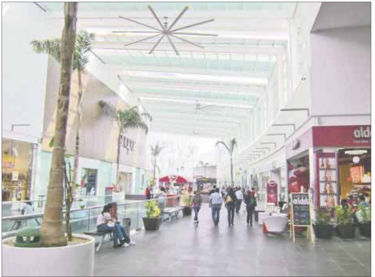
Abarrota el turismo nacional e internacional las plazas comerciales aledañas al centro y zona hotelera, donde buscan artesanías o souvenirs.

Precisó que ante la llegada masiva del turismo a estos centros y puntos de venta, se recomendó a los gerentes y administradores de las plazas y locatarios incrementar la seguridad y vigilancia con cámaras de video para que sus usuarios constaten que su estancia en sus instalaciones serán seguras.