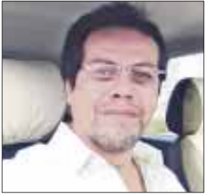
POR MAURICIO CONDE OLIVARES