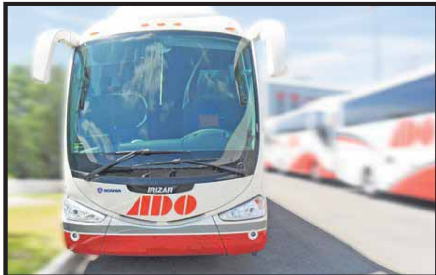
Verano de locura.

☆☆☆☆☆ "Verano de locura" es la campaña más reciente de ADO