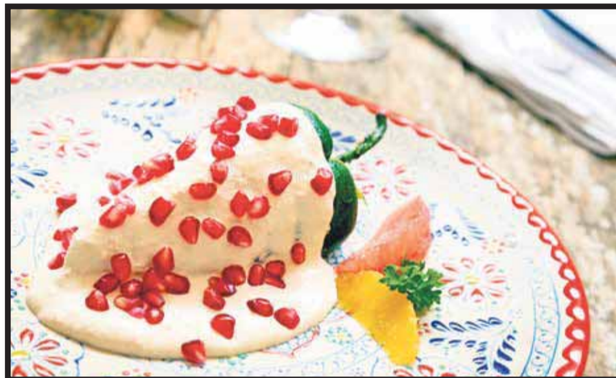
Chile en nogada.

Además, explicó, estamos en plena temporada de cosecha, el chile es uno de los principales productos producidos y consumidos en