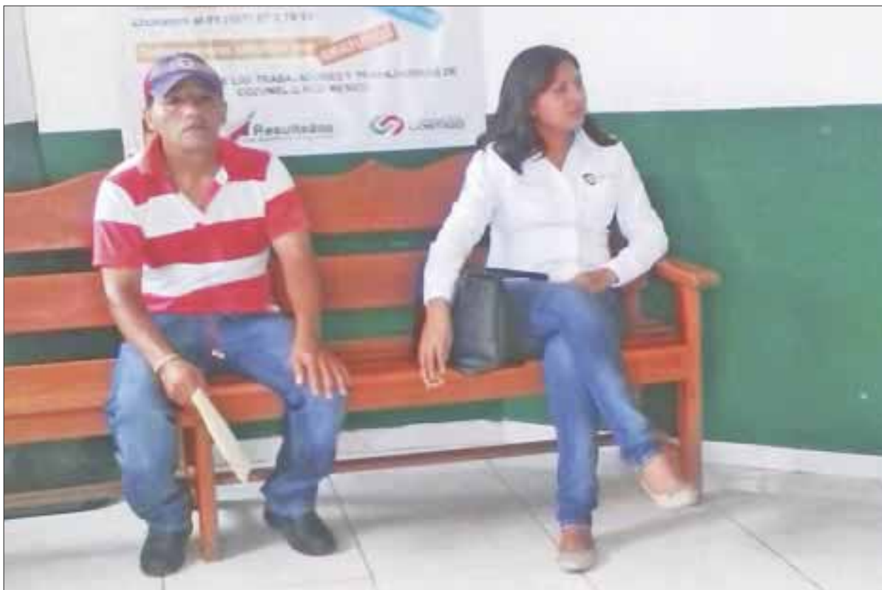
Al no contar con suficientes trabajadores se agudizará el problema de la recolección de basura en toda la isla.

Por tal motivo y al no contar con suficientes trabajadores, se estará agudizando el problema de la recolección de basura en diversas colonias de la isla y generará sin duda una mala imagen para el destino, que recibe miles de turistas nacionales y extranjeros.