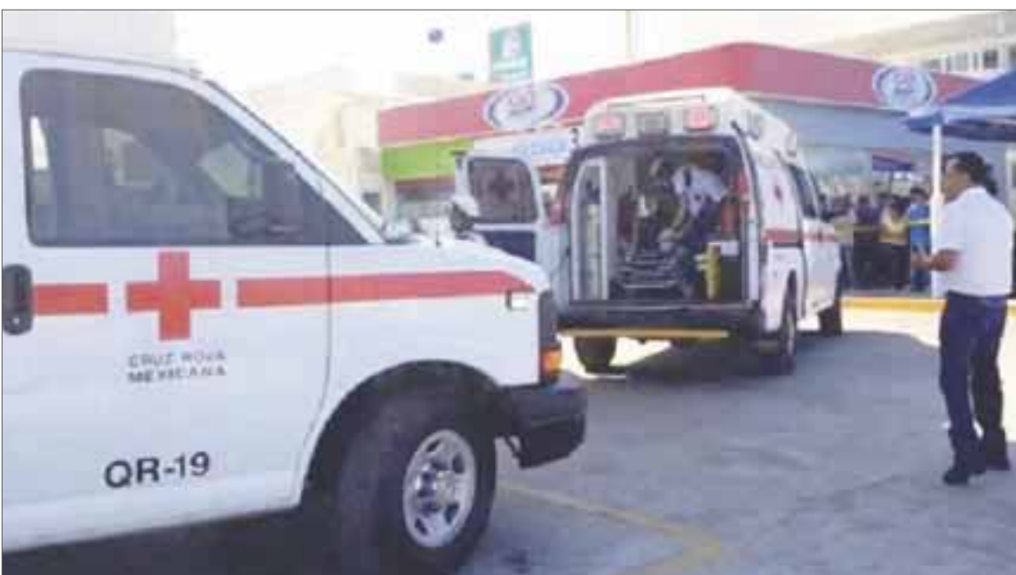
El ejecutado no fue sacado de su casa como originalmente se especuló, sino que fue acribillado en la puerta.

Cancún.- Luego de varios días de especulación sobre un supuesto comando de encapuchados, que aparentemente habría allanado una casa, de donde sacaron a un albañil, al que le aplicaron la "ley fuga", peritos en criminalística establecieron que fue acribillado desde una camioneta.