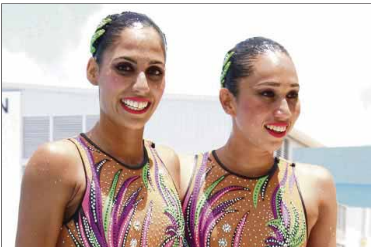
Las cancenenses estrenaron en exclusiva sus trajes que estarán luciendo en los Juegos Olímpicos.

Las cancenenses viajarán el sábado a la Ciudad de México, donde se reunirán con el Comité Olímpico Mexicano, para luego viajar el domingo con dirección a Río de Janeiro.