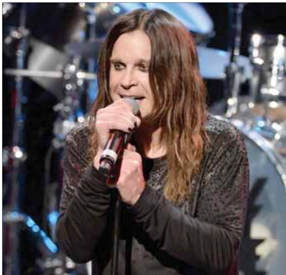
Durante los últimos seis años, el músico Ozzy Osbourne, ha tenido que lidiar con una profunda adicción al sexo.

“Lo he perdonado. Me ha llevado mucho tiempo confiar en él, pero ya llevamos juntos 36 años, 34 de matrimonio y llevo más de la mitad de mi vida con él. Simplemente no me puedo imaginar la vida sin él. A pesar de que sea un perro sucio. Él va a pagar por lo que me ha hecho durante mucho tiempo”, declaró su mujer