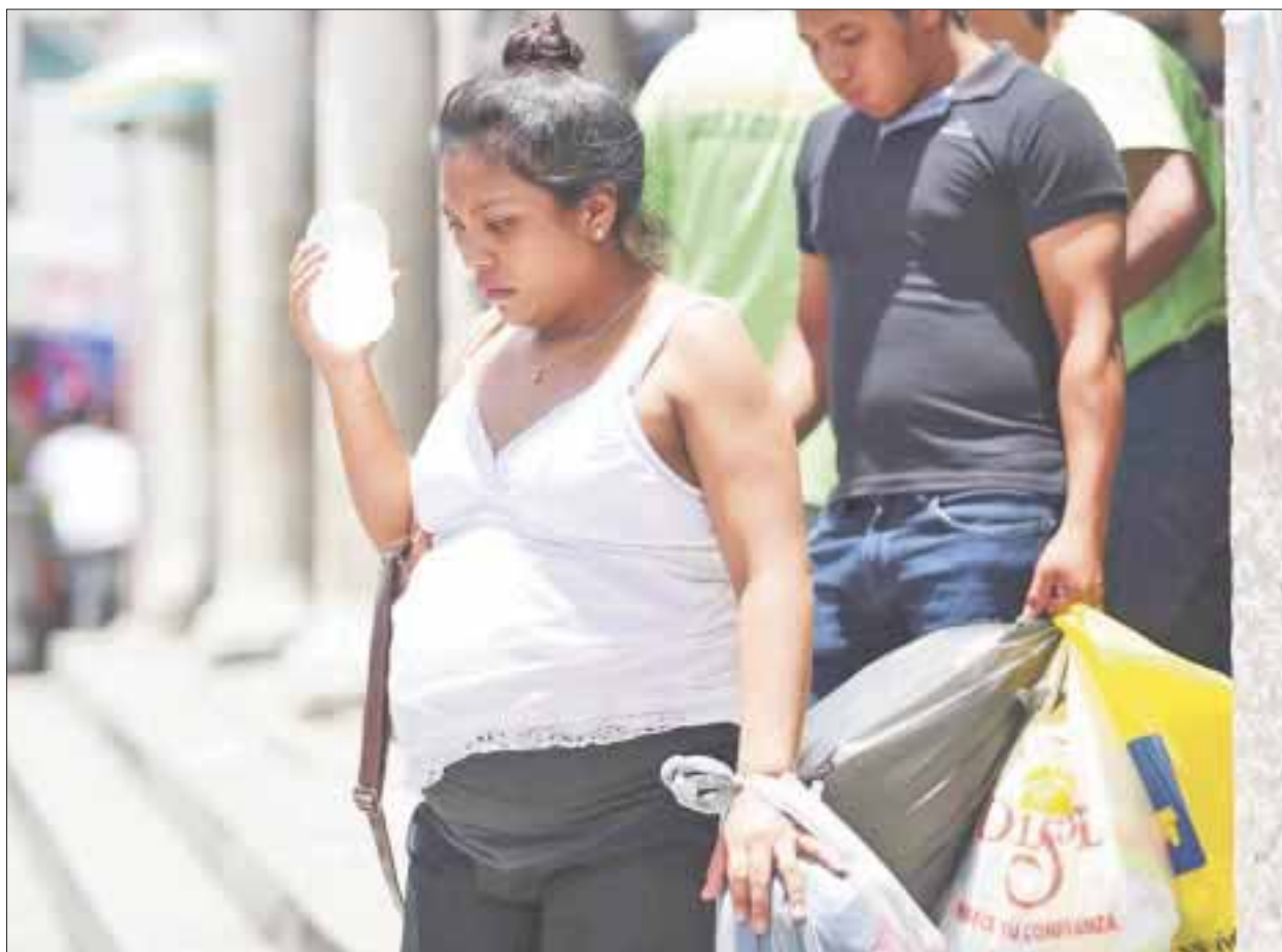
Pese a que apareció el primer caso de zika en una embarazada, el número de brotes es bajo, con relación a Campeche y Yucatán, con 14 y 11 contagios

En la entidad quintanarroense parecía que nunca sucedería, pero ya apareció en la lista con un caso de zika en una mujer embarazada.