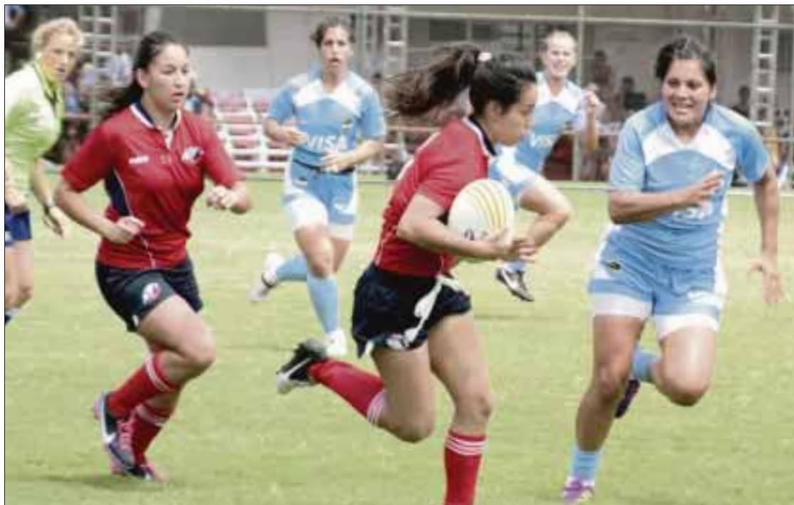
La selección estatal de rugby regresa con oro del Campeonato Nacional Juvenil, que se llevó a cabo en Querétaro.

Cancún.- Con un contundente 27-10, la selección quintanarroense de rugby derrotó al equipo "Ciudad de México", proclamándose así campeona invicta de la rama femenil M-19 (menores de 20 años) del Campeonato Nacional Juvenil, que se llevó a cabo en Querétaro.