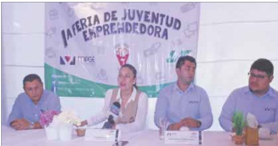
En el parque de Las Palapas se llevará a cabo la Primera Feria de la Juventud Emprendedora, con la colocación de 20 stands de distintos giros.

En esta feria la pretensión es brindar las herramientas a los jóvenes del municipio, para empezar a crear una red entre los participantes, para que de aquí en adelante esto se consolide como una red sólida, para crear un apoyo entre los jóvenes, ya que cada quien está acostumbrado a caminar por su lado, pero deben darse cuenta que no es así.