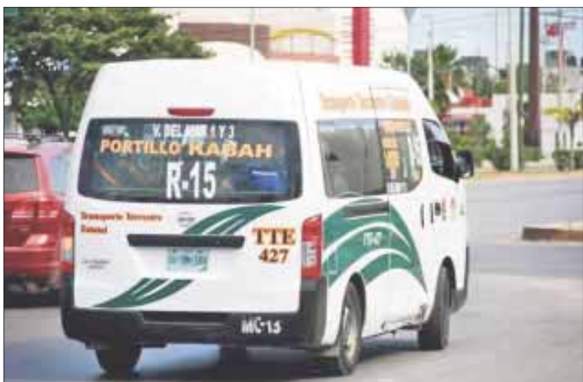
Las autoridades municipales sustituyeron la revista por la advertencia de “Si la ves llena no te subas”.

Comentó que este es un trabajo de conciencia, tanto del operador, la ciudadanía y la autoridad, pero principalmente del chofer, quien debe cuidar la integridad física de los pasajeros y la de él, pero muchas veces, sobre todo en las horas pico, suben a quien más pueden para que les reditúe económicamente, ya que tienen que sacar la cuenta de la renta de la Urvan y una ganancia extra. Expresó que los empresarios, con los que se reunieron, se muestran en contra de que la gente vaya parada en las Urvan y en los camiones, por lo que el llamado a las empresas es que convengan a sus choferes para que haya menos accidentes y mayor seguridad.