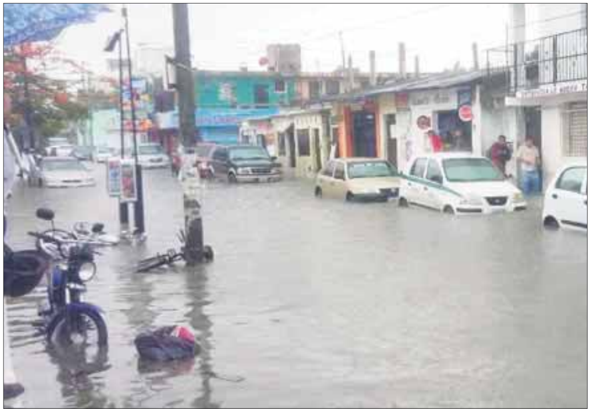
El paso del Huracán Earl por la Península de Yucatán ocasionó inundaciones principalmente en la Ribera del Río Hondo, frontera con Belice.

"Earl" se desplaza hacia el oeste a 22 kilómetros por hora (km/h), con vientos máximos sostenidos de 120 km/h y rachas de hasta 150 km/h.