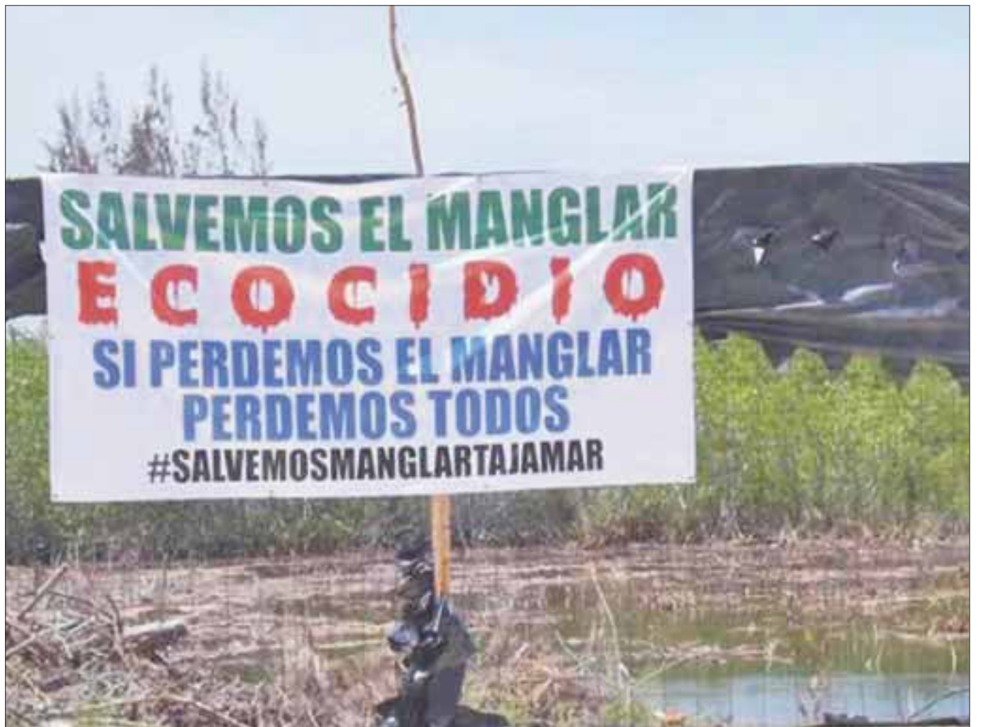
La lucha por los terrenos en Tajamar registró un avance del 90 por ciento, al lograr cinco amparos.

En el terreno legal, confían que prevalecerá la ley ya que las reglas tienen que actuar a favor de las diferentes especies que ahí habitan, además de que la flora también es protegida y no puede ser devastada.