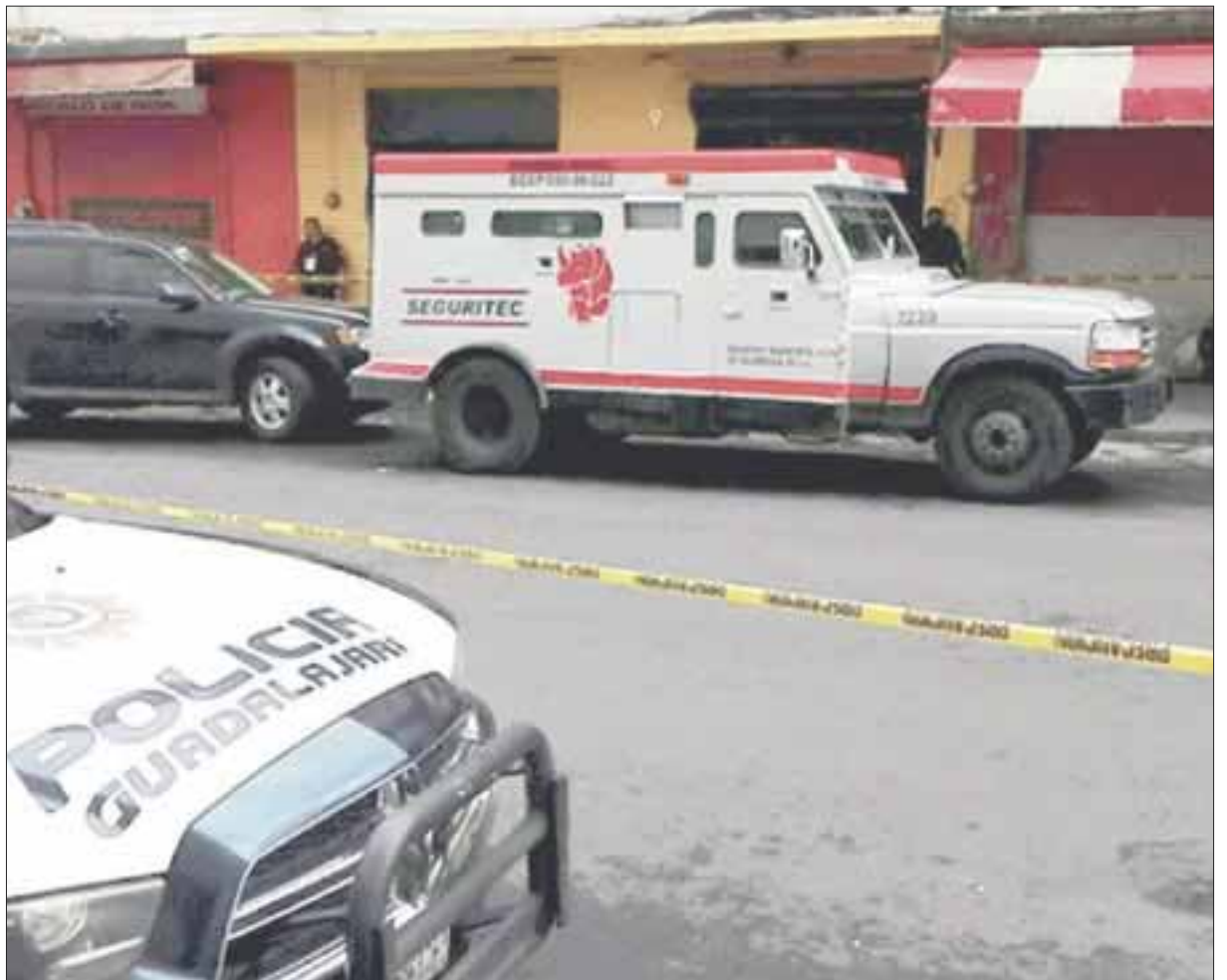
El custodio escapó el pasado viernes con un monto que podría ir entre los 12 y los 15 millones de pesos.

Al respecto medios locales aseguran que los otros dos custodios que iban en el camión también están bajo investigación, dado que se tiene detectado un cambio de ruta y otras inconsistencias que hacen presumir la participación de más trabajadores de la compañía de traslado de valores.