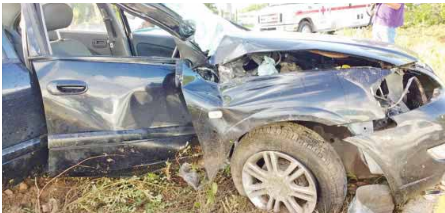
El camión materialista empujó a un auto fuera de la carretera y su operador deberá asumir los gastos del percance.

Cancún.- Un aparatoso accidente, que a punto estuvo de terminar en tragedia, se registró en la carretera Cancún-Puerto Morelos, entre un camión materialista y un auto Renault.