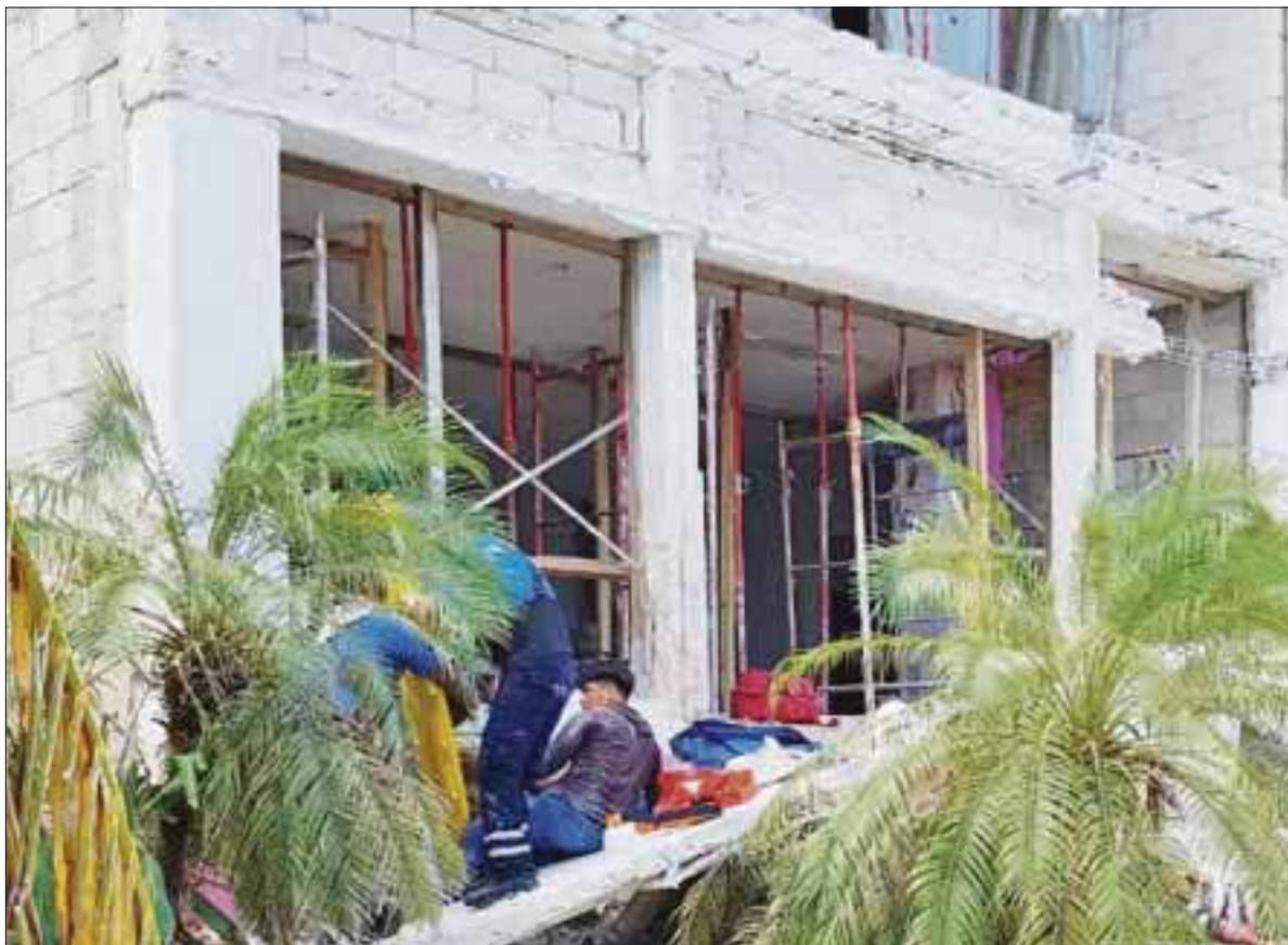
La pesada losa cedió ante los golpes de los martillos y cinces en una residencia de Cozumel.

La Dirección de Peritos se encargó del traslado del cuerpo al Servicio Médico Forense para que se realizara la necropsia de ley y posteriormente para que el cuerpo fuera entregado a sus familiares.