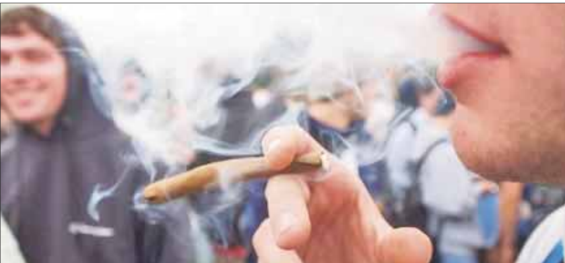
Las adicciones están en las nuevas generaciones en Quintana Roo, principalmente entre adolescentes y jóvenes en edad reproductiva.

Cancún.- Las adicciones llegaron a las nuevas generaciones en Quintana Roo, en particular a los adolescentes y jóvenes en edad reproductiva que tienen mayor consumo de mariguana, que se mantiene en el primer lugar de las drogas preferidas.