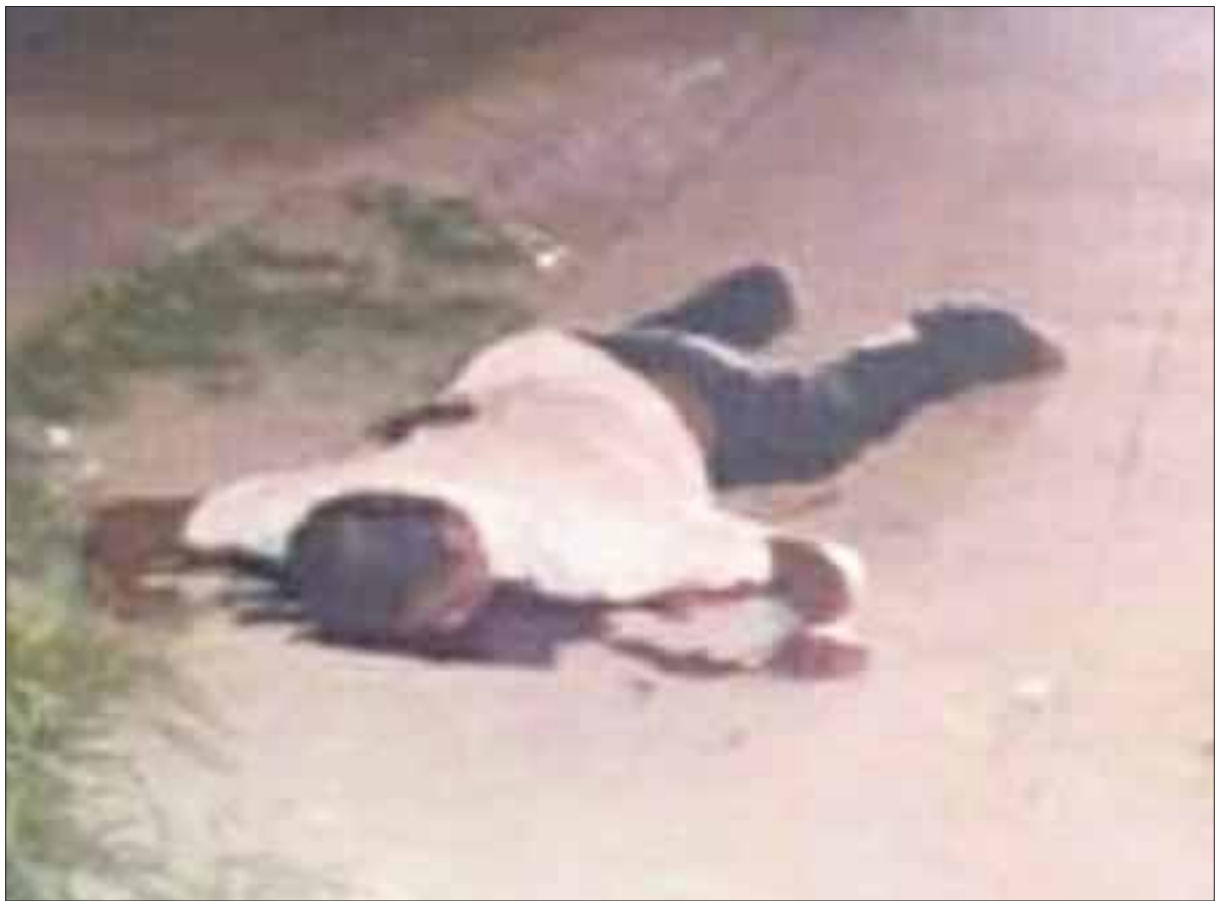
Testigos han declarado que vieron tres autos sospechosos en los que aparentemente escaparon los gatilleros.