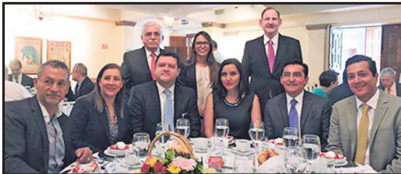
Socios y patrocinadores de la 6ª. Asamblea de la Metro.