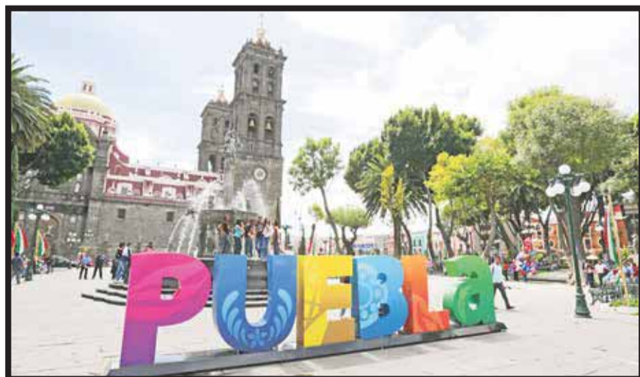
Puebla, sede de la Cumbre de Negocios.