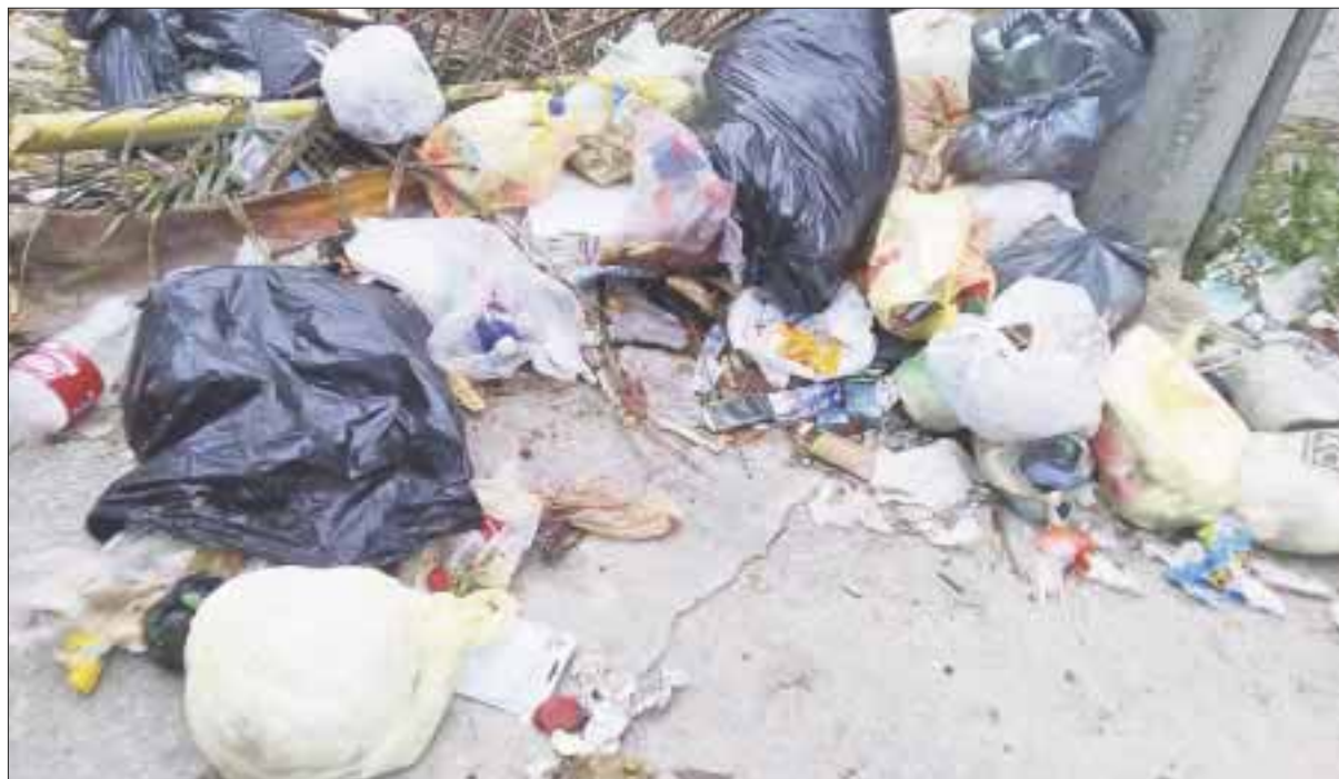
Basura como ésta es el principal problema en los días de lluvia, ya que van a parar a las cañerías.

Cancún.- La falta de educación en el manejo final de la basura doméstica, así como la colocación de esta misma en contenedores o bolsas de nylon, es el enemigo a vencer en la presente temporada de lluvia.