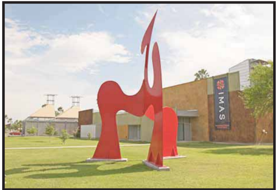
International Museum of Art & Science.

oportunidad de disfrutar de restaurantes, bares y discotecas, campos de golf y Spas con tratamientos exclusivos.