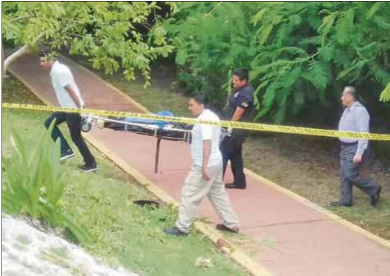
El hombre fue severamente golpeado por sus asesinos hasta provocar la muerte.

Se dijo que éste es el primer crimen violento que se registra en la zona hotelera, por lo que la excesiva presencia de agentes de la policía provocó alarma entre las familias que viven en la zona residencial de Pok Ta Pok, las cuales llamaron a los medios de comunicación, para solicitar informes sobre lo que estaba ocurriendo.