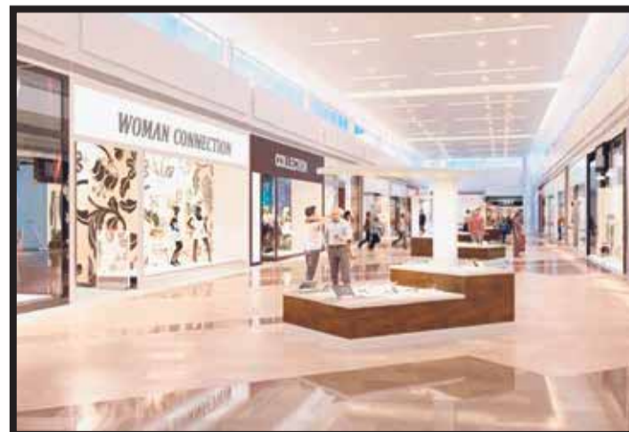
Expansión de Plaza Mall.

victoriagprado@gmail.com Twitter: @victoriagprado