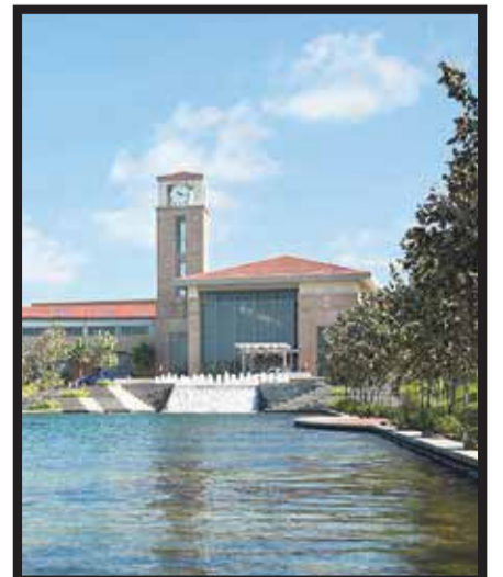
McAllen Convention Center.