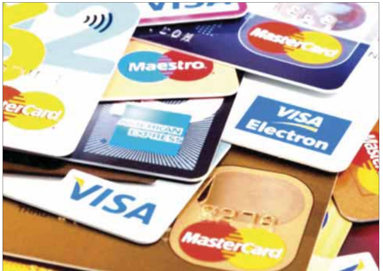
Los casos de robo de identidad aumentó 140 por ciento.

Por lo anterior, la recomendación de la Conducef es revisar con frecuencia sus estados de cuenta o manejos financieros, ya que los fraudes también se comenten por personas de presuntas instituciones bancarias falsas, que piden el registro de datos, que de ninguna manera se otorgan vía teléfono, página web o algún filtro del internet.