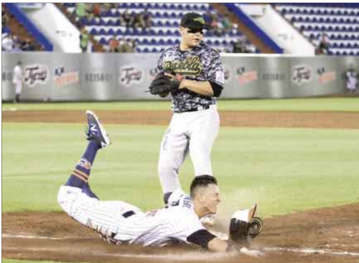
Los Tigres empataron la serie con Pericos de Puebla, al jugar una doble cartelera por mal tiempo.