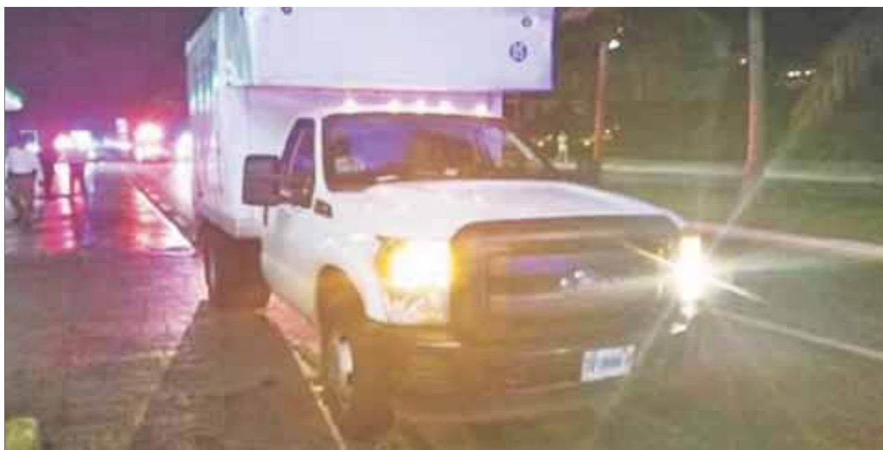
Un hombre fue atropellado y para saber con exactitud lo que pasó, se recurrió a las videocámaras de la zona hotelera, que esclarecieron que se trató de un accidente.