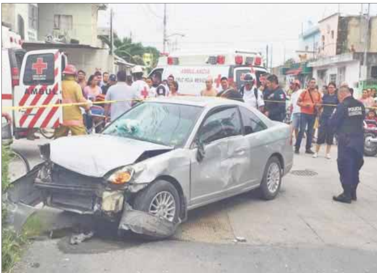
Un nuevo accidente por exceso de velocidad se registró ayer entre una camioneta del servicio público y autos particulares

En esa ocasión, debido en buena medida al sobrecupo, un niño de un año y medio de edad murió al ser aplastado por los pasajeros, teniendo este accidente como saldo final 15 pasajeros heridos y un muerto.