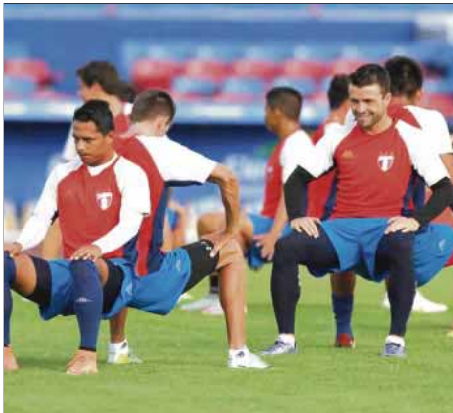
Los Potros buscarán no regalar más puntos, por lo que en el duelo frente a Dorados de Sinaloa, pretenden quedarse con la puntuación.