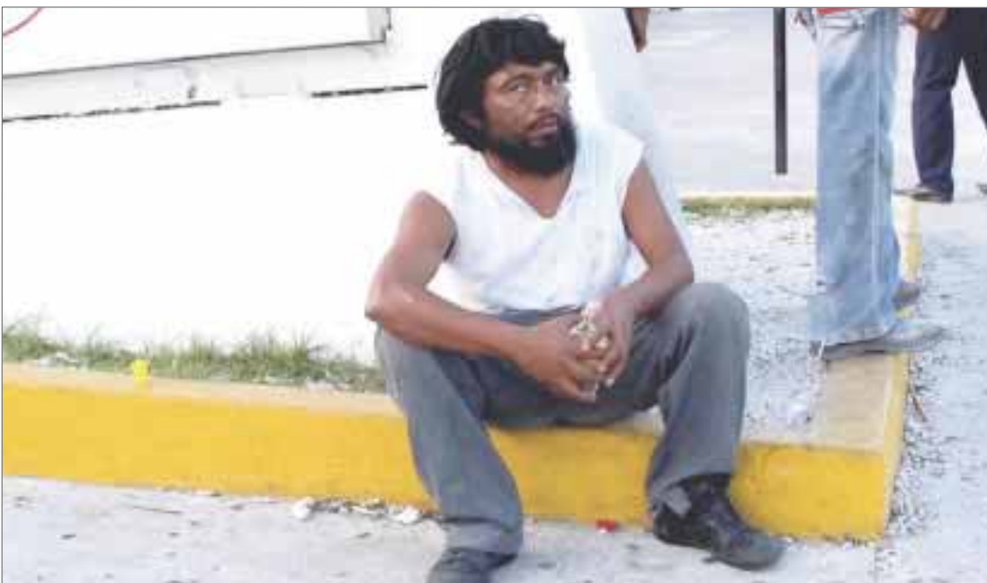
Este es el hombre que se ha dedicado a prácticamente asaltar a los transeúntes en avenida López Portillo de Cancún.

Cancún.- Un sujeto que exige con amenazas a transeúntes que le den dinero para comprar licor, fue denunciado por los afectados, quienes aseguran que el individuo no es retrasado mental ni está loco, solo utiliza la violencia para intimidar a las personas y sobra quien le crea sus patrañas.