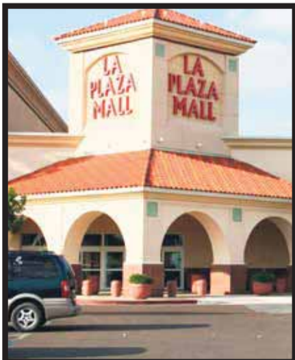
La Plaza Mall.

Pero hoy hablaremos sólo de McAllen, donde al seguir los tips al