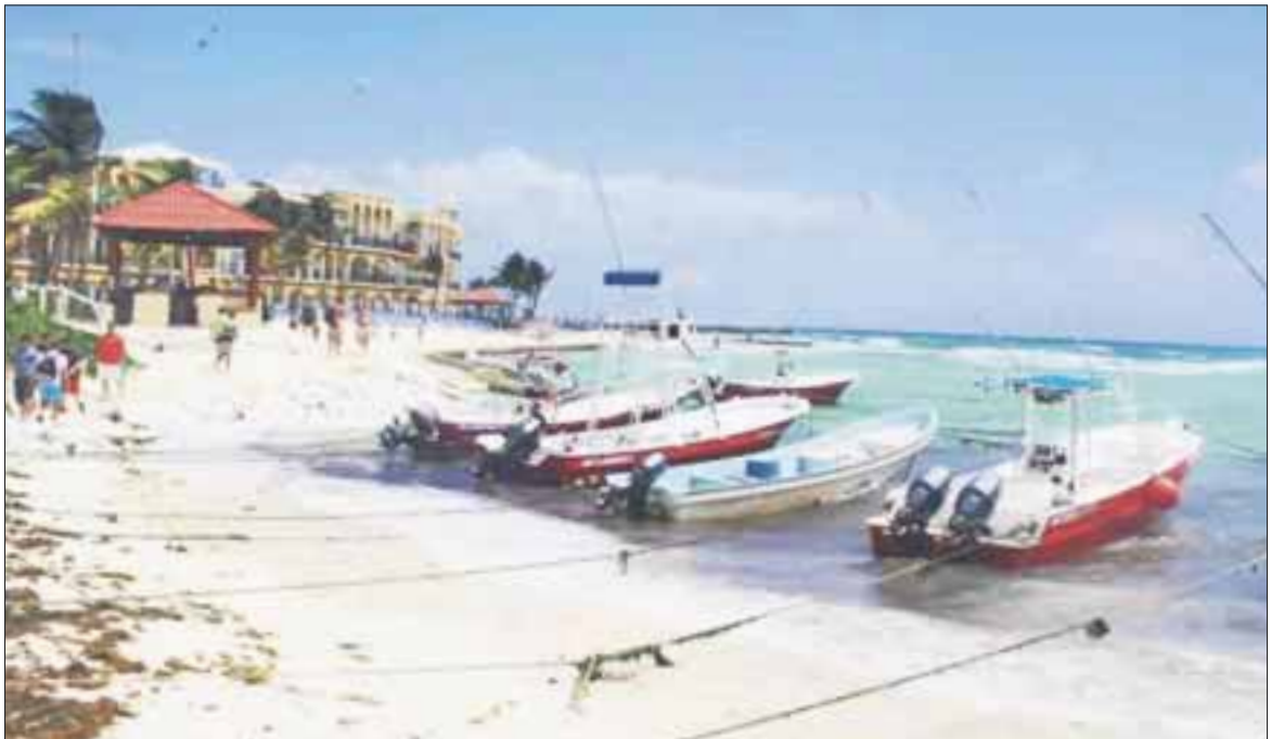
Ante "Earl", Belice perdió comunicación marítima y suspendió por tres días comunicación con la Isla de San Pedro.

Insistió que las demás rutas marítimas del sur operan con normalidad ya que no presentan daños, en tanto en la Zona Norte por la vocación turística que tiene, las capitánias de puerto hicieron un análisis de las condiciones del clima y viento para determinar si mantienen o no el cierre preventivo.