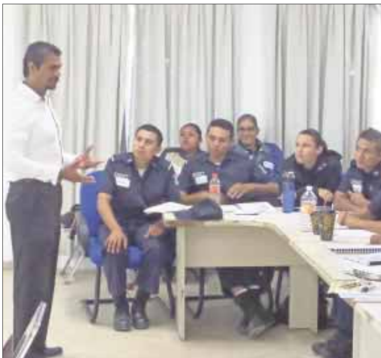
La licenciatura en derecho burocrático coloca la preparación de la policía de Solidaridad en primer nivel.