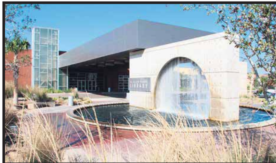
McAllen Public Library.