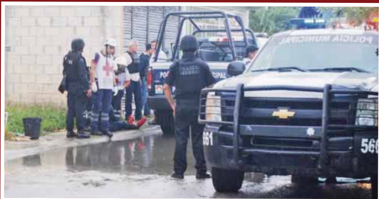
En esta ocasión se pudo comprobar que había personas armadas y se evitó una tragedia en Galaxias Itzales.

Cancún.- Intensa movilización de elementos de la policía y de la Gendarmería se registró ayer, luego que se recibiera el reporte en el número de emergencias 066, sobre personas armadas.