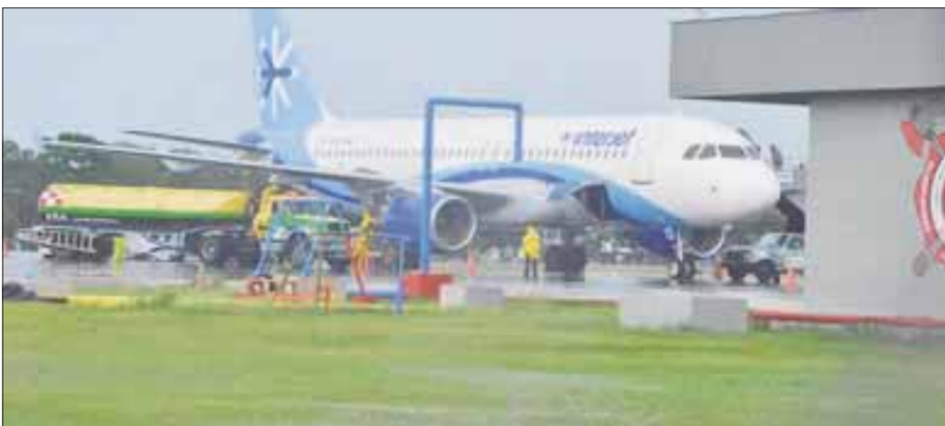
El aeropuerto de Chetumal no sufrió ningún desperfecto en sus instalaciones, pese a las lluvias que continúan de manera intermitente.

Chetumal.- Ante el fuerte temporal por la llegada a la península de Yucatán del huracán "Earl", ahora convertido en tormenta tropical, la aerolínea Interjet canceló cuatro vuelos a Chetumal.