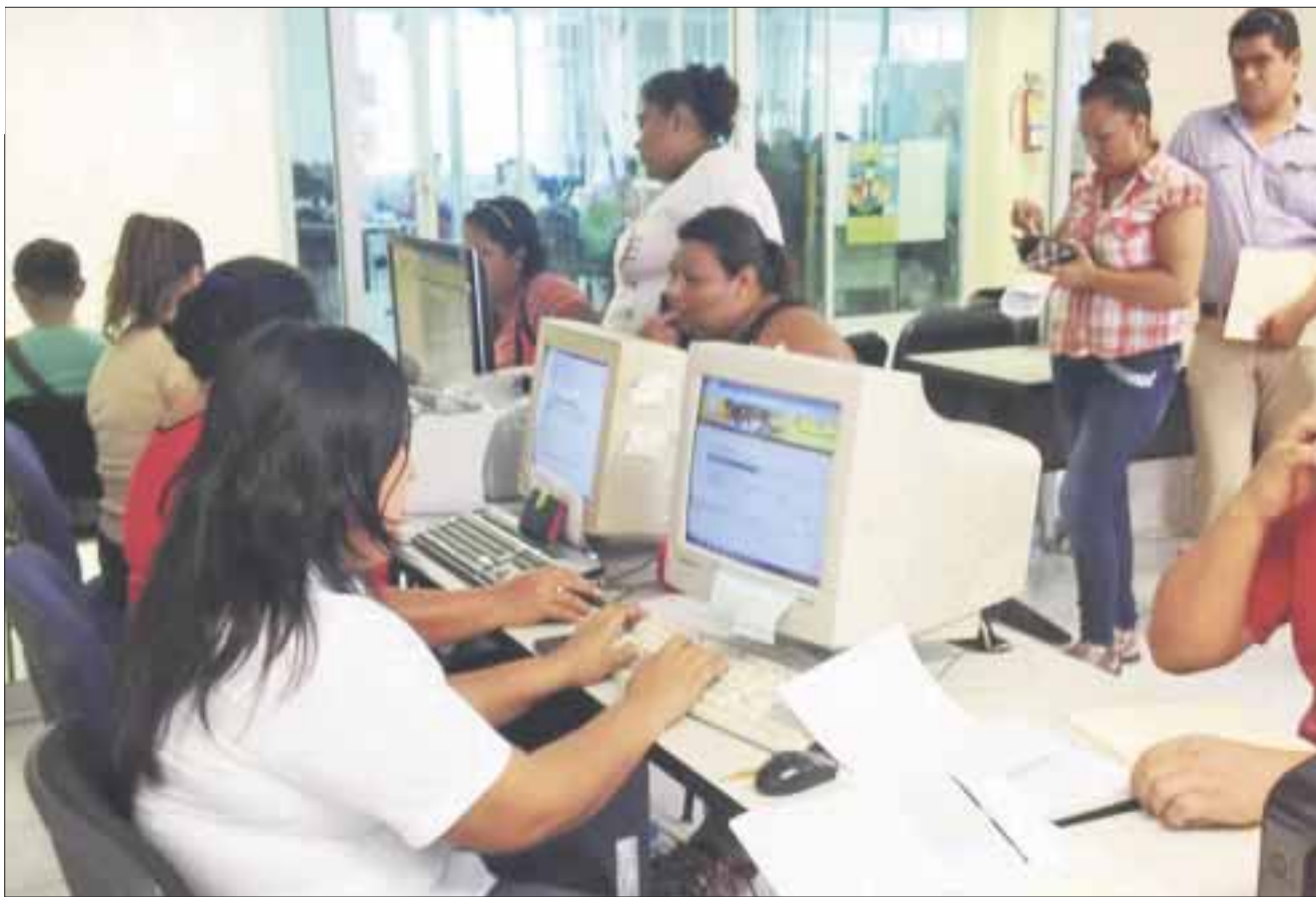
Casi 500 padres de familia al día atiende la SEyC en la Zona Norte por cambio de turno o de escuela de sus hijos.

La atención para los padres continuará de manera organizada de tal suerte que todos obtendrán una respuesta a su trámite siempre y cuando se tengan las condiciones o los requisitos para hacerlo, al tener la consigna de no dejar a ningún alumno fuera del ciclo escolar 2016-2017.