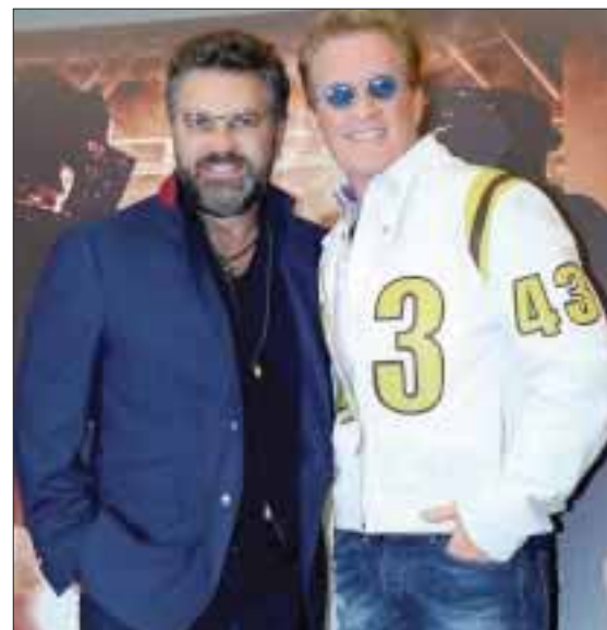
Emmanuel & Mijares continúan rompiendo records en el Auditorio Nacional.