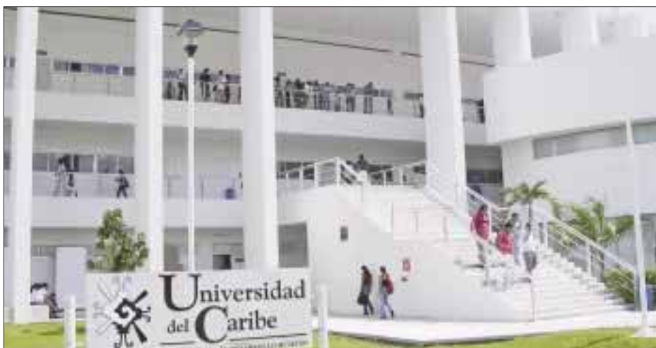
La universidad capacita a profesionistas que van desde el turismo hasta el desarrollo de nuevas tecnologías.

Cancún.- De 2014 a la fecha el Departamento de Idiomas de la Universidad del Caribe ha abierto semestre a semestre seis niveles de cursos de chino y más de 200 estudiantes han participado en ellos.