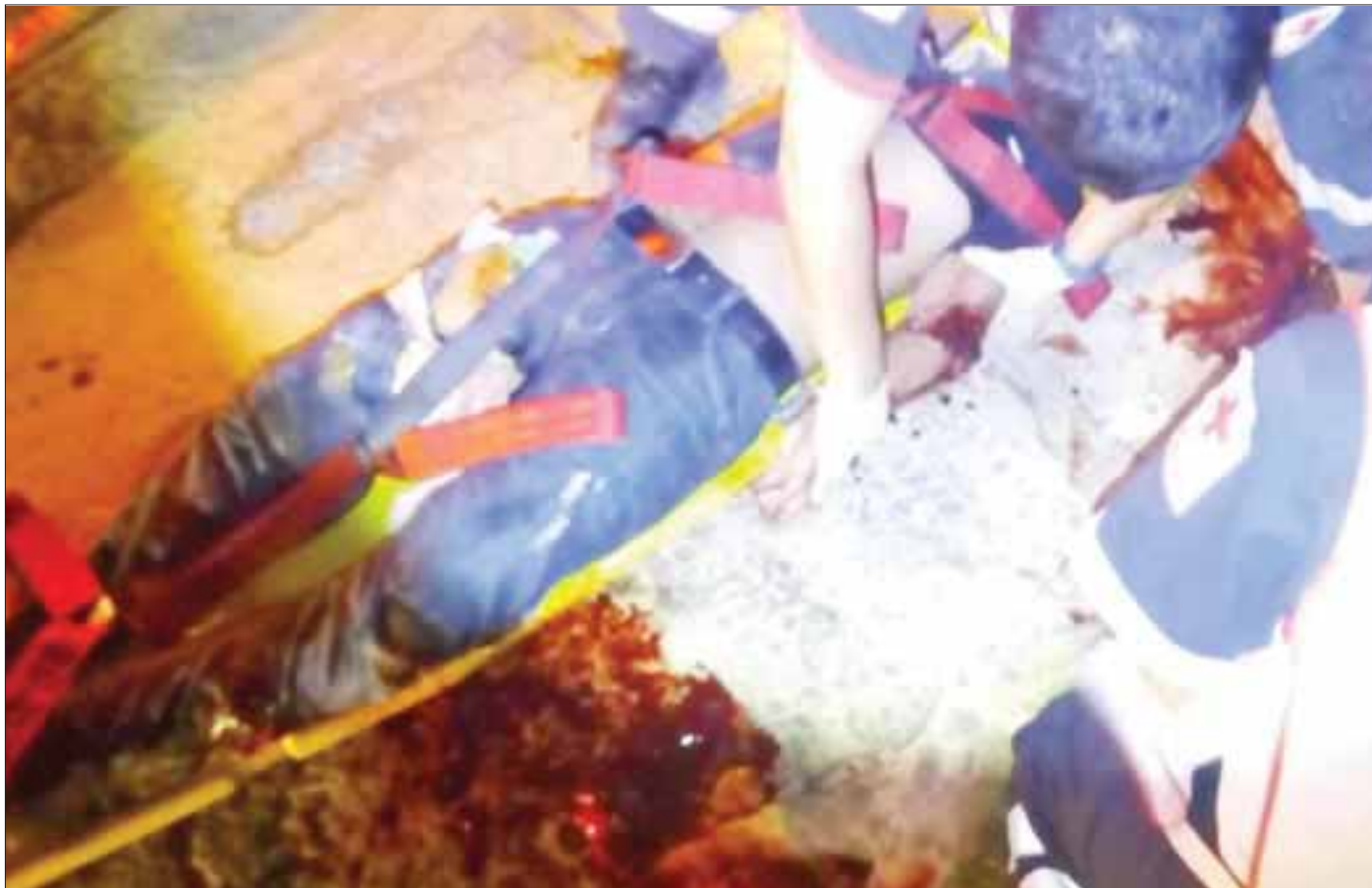
El joven de 21 años perdió la vida de forma trágica la madrugada de ayer en la Bonampak.

Al lugar se presentaron unos familiares, quienes dijeron que el occiso tenía 21 años y era originario del estado de Morelos, y que tenía pocos meses de estar viviendo en este centro vacacional.