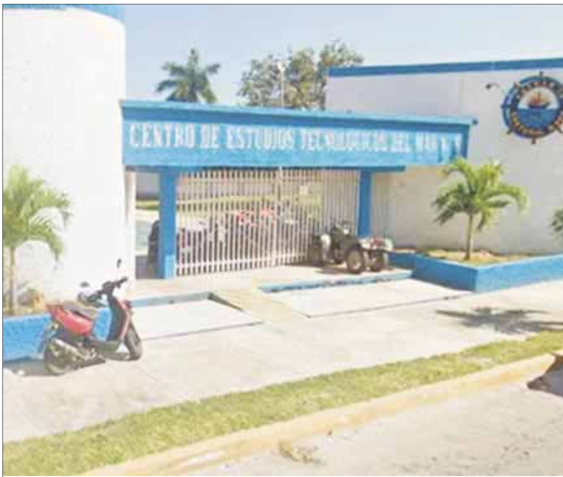
En las oficinas de la SEyC habrá módulos de atención para los alumnos que quieran de lograr colocarse en un espacio escolar.

Hoy Manzanilla señaló que en Solidaridad, que es el segundo municipio con mayor demanda de nivel medio superior, 500 jóvenes requieren un espacio, para lo cual también se llevan al cabo gestiones con los diferentes subsistemas, a fin de asignar plantel a los postulantes que no lograron el puntaje. Ahí, el proceso de reasignación de espacios de nivel medio superior se llevará a cabo el 9 y 10 de agosto y, en Cozumel, el este lunes 8 de agosto.