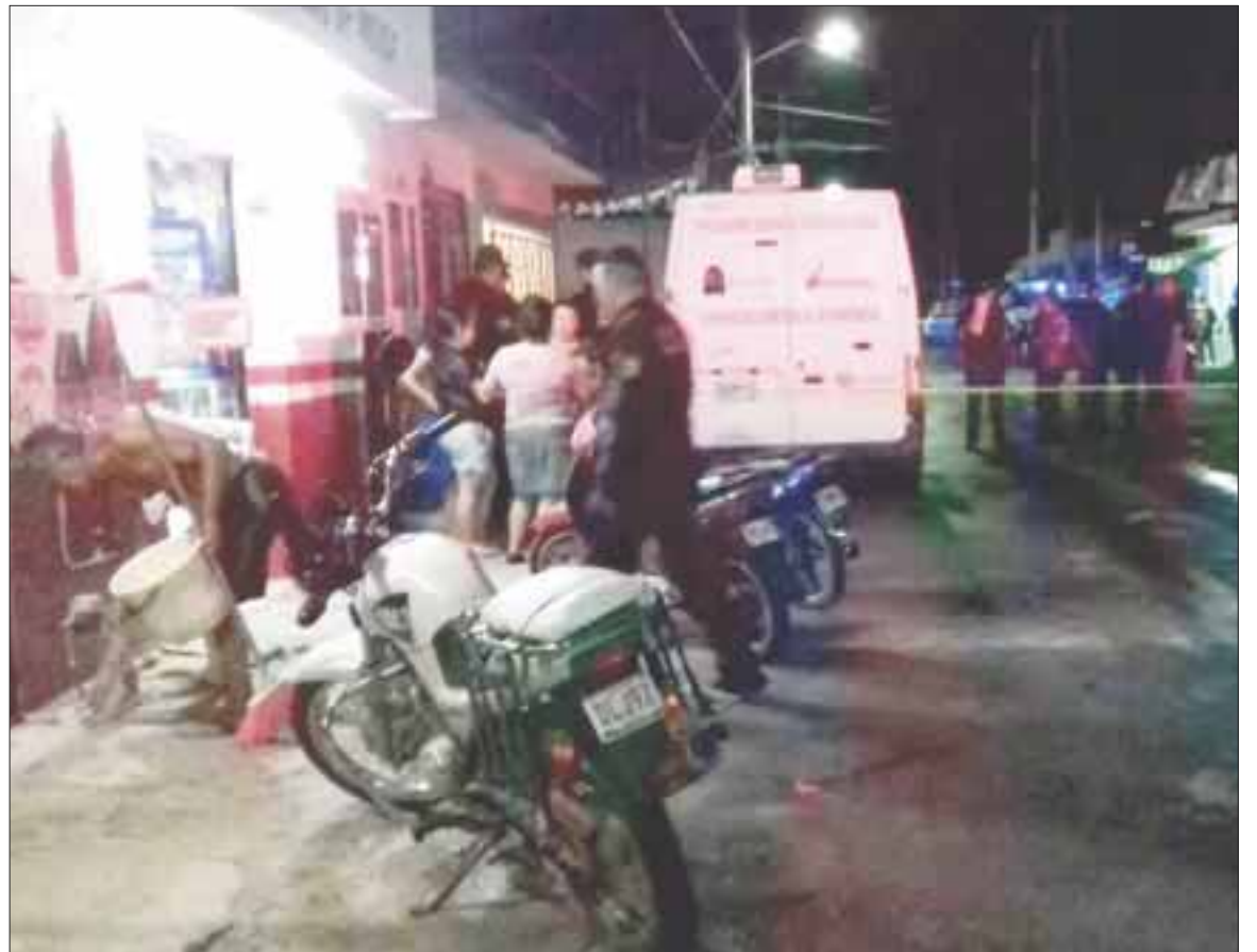
La abuelita fue encontrada el jueves pasado amarrada a un sillón con una herida en un costado.

Se determinó que la octogenaria presentaba huellas de haber sido atada de pies y manos, aunado a que se le encontraron lesiones en su costado, ocasionadas posiblemente con un desarmador, por lo que se encuentran buscando a los presuntos responsables, en este caso los inquilinos, los cuales abandonaron el cuarto.