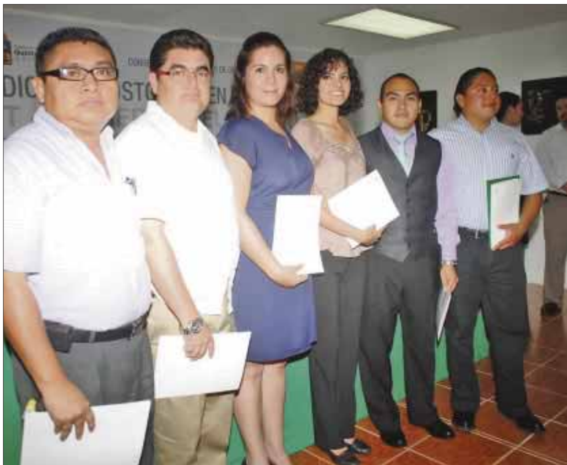
Los quintanarroenses beneficiados asisten a universidades de Estados Unidos, España, Francia, Rusia, Inglaterra, Argentina y Australia.

se cumplió el objetivo plasmado en el Plan Quintana Roo 2011-2016, de formar recursos humanos de alto nivel en temas