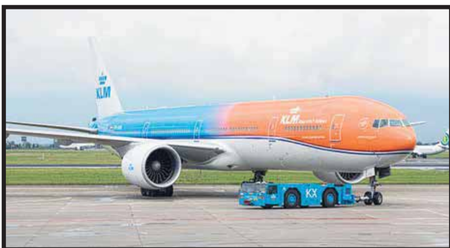
La aerolínea llevó a los atletas holandeses a los Juegos Olímpicos en Brasil.

☆☆☆☆☆ La aerolínea holandesa KLM Royal Dutch Airlines llevó a