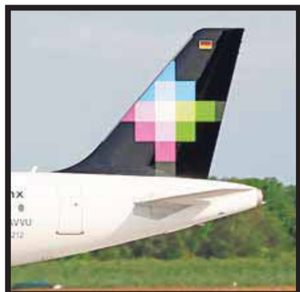
De Guadalajara a Austin.

En su primera etapa, incluirá un total de 27 hoteles, ubicados en 18 destinos y que ofrecen un total de 5,071 habitaciones. Los destinos de playa que forman parte de este primer lanzamiento son Cancún, Riviera Maya, Puerto Morelos, Isla Mujeres, Playa del Carmen y Cozumel en Quintana Roo; Acapulco y Zihuatanejo en Guerrero; Xpu Ha en Yucatán; Tecolutla en Veracruz; Punta Mita y Nuevo Vallarta en Nayarit; los cuatro destinos urbanos son Monterrey, Ciudad de México, Guadalajara