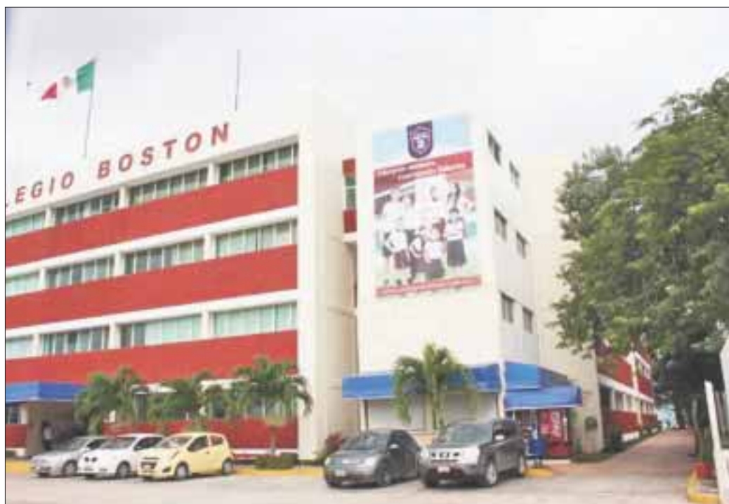
Las escuelas privadas aplicarán el nuevo modelo educativo que se promueve a nivel nacional para el ciclo 2017-2018.

Cancún.- En beneficio del sector escolar, planteles privados aplicarán nuevo modelo educativo que se promueve a nivel nacional para el ciclo 2017-2018, a pesar que todavía existen muchas dudas que se plantearán a la SEyC, una vez que concluyan las vacaciones de verano.