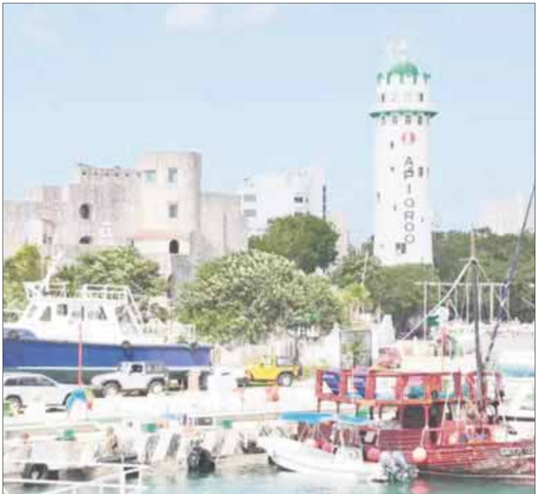
El barco es el “Nettie Q” y fue abandonado después de bajar su carga, amaneció vacío en el muelle de Punta Langosta.

Esta situación pone en evidencia la vulnerabilidad de la isla ante la posible llegada de embarcaciones que traen drogas desde Sudamérica, ya que nadie atiende el Centro de Control y Tráfico Marítimo de Cozumel, por lo tanto, se puede entrar y salir de la isla trayendo o traficando enervantes o migrantes de Cuba.