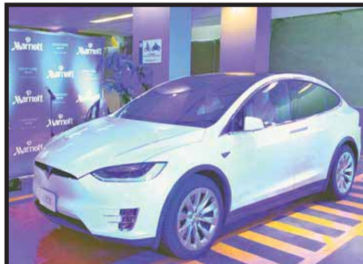
Nueva estación de carga para autos eléctricos.

f /barcoscaribe @barcoscaribe barcoscaribe