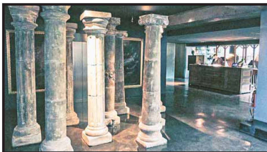
El hotel Demetria, en Guadalajara.