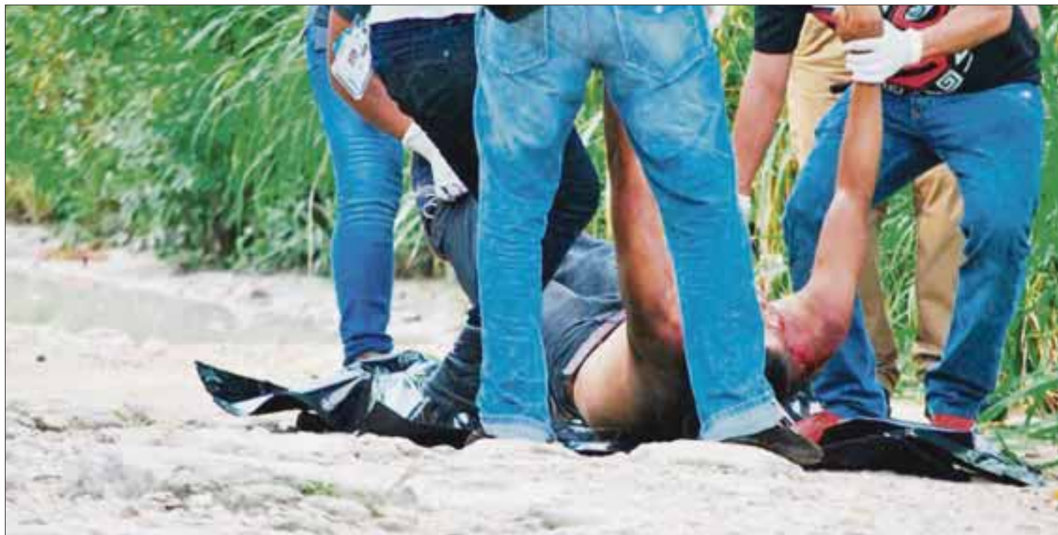
Los servicios periciales hacen esfuerzos por establecer la identidad del degollado de El Pedregal.

Cancún.- Hasta la tarde de ayer, ninguna persona se había presentado a identificar al occiso de la colonia El Pedregal, por lo que la Fiscalía lo sigue considerando como desconocido.