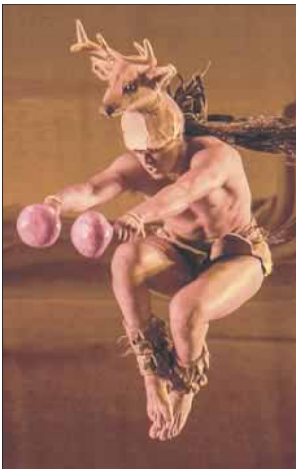
“La Danza del Venado” fue de las más aplaudidas.