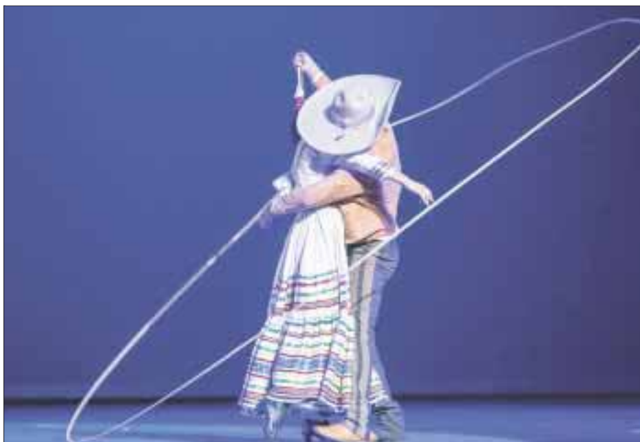
“La Charreada” fue de los números que más emocionaron al respetable.