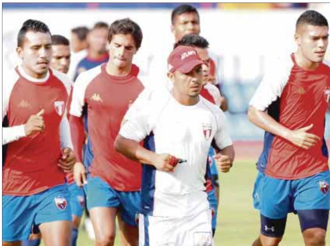
El día de hoy, los potros jugarán frente al Celaya, buscando los primeros tres puntos que le puedan dar estabilidad en la tabla general.

El tercer partido del Atlante, será también de visita en la ciudad de León, ante los esmeraldas el 23 agosto en el estadio de esa ciudad.