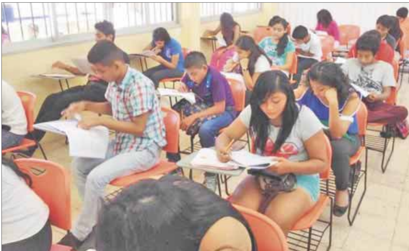
Sólo 160 de 900 aspirantes a ingresar al bachillerato que se quedaron sin cupo, pudieron hacerlo en el Cobach de Bonfil y del CBTIS 272.

Sólo 160 se asignaron al bachillerato de Bonfil y 60 en el CBTIS 272 y se informó a los padres de familia que ya no hay espacio para ninguno más, de manera que tendrán que inscribirlos en escuelas privadas, sistema abierto o semiescolarizado al menos en el primer semestre para después considerar integrarlos en algún plantel.