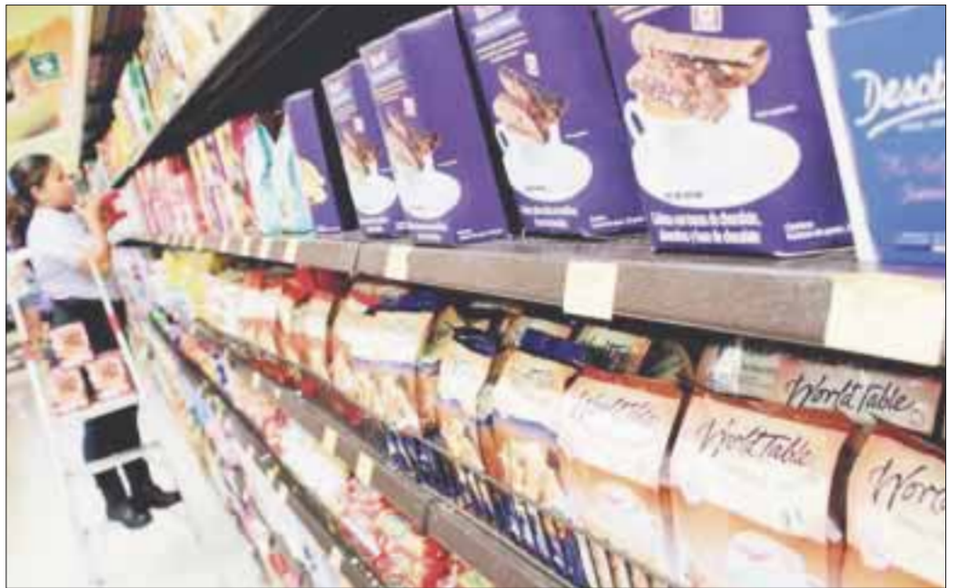
La gran mayoría de los insumos de hoteles se trae de otras partes, al no haber suficiente cantidad en el estado o no se produce.