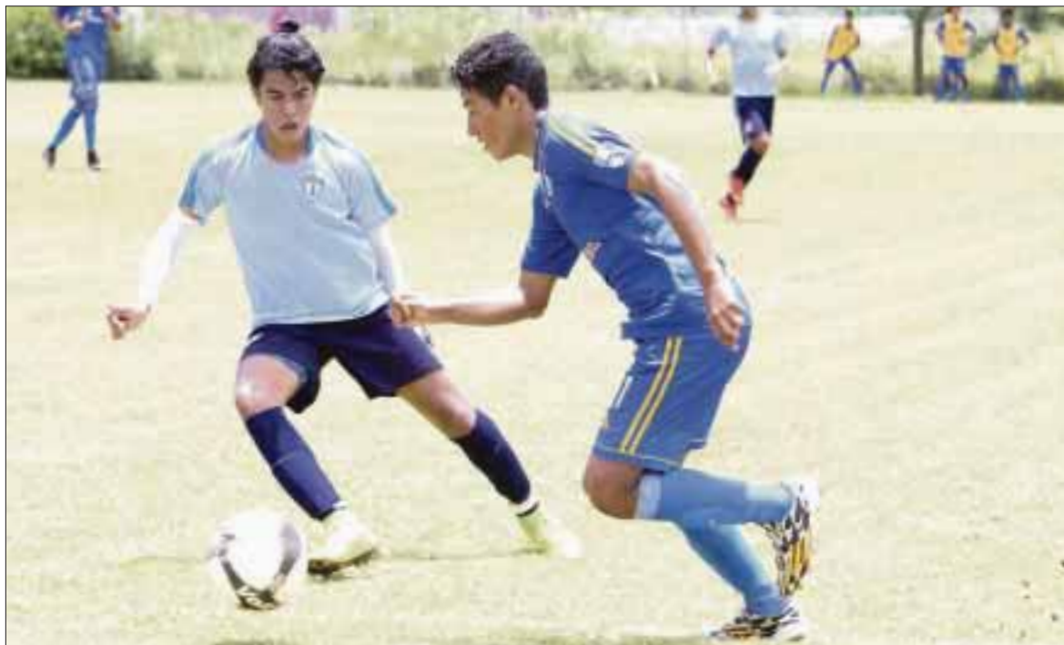
El Caribe será escenario de los juegos de Tercera División, al apuntarse cinco equipos para esta categoría.

Cancún.- Cinco equipos del Grupo Uno de la Zona Sur de la Tercera División, tendrán como sede este destino vacacional, ya que media decena de escuadras han anunciado que estarán representando al municipio de Benito Juárez en la categoría más baja del fútbol de paga.