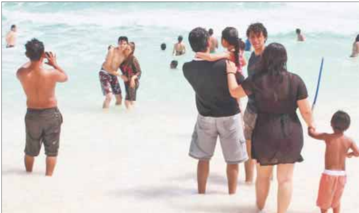
La población no querrá salir debajo de la regadera, al mantenerse temperaturas calurosas en el transcurso del día.

Cancún.- En Quintana Roo la población no querrá salir debajo de la regadera al mantenerse temperaturas calurosas y bochornosas en el transcurso del día; además de la nubosidad con lluvias acompañadas de chubascos aislados sobre algunos municipios.