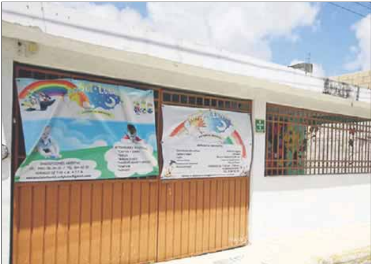
Prueba científica y médica descarta la versión de que niña padecía un problema de salud desde su nacimiento

La menor permaneció hospitalizada durante casi 15 días, hasta que falleció el pasado 24 del mismo mes.