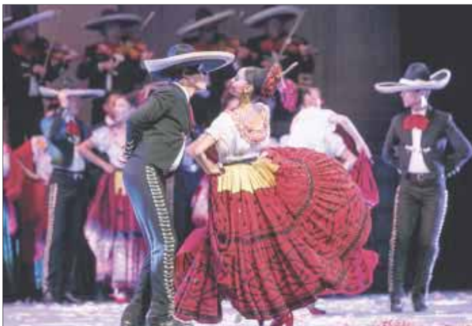
Amalia Hernández cumpliría 100 años el año próximo y quienes integran la institución que lleva su nombre, han arrancado los homenajes que se merecen, no por dos años, sino por otros 100.

qué mejor que con la música del maestro Salvador López López, que también encarna al mariachi de los pies a la cabeza, festejos que nadie debe perderse.