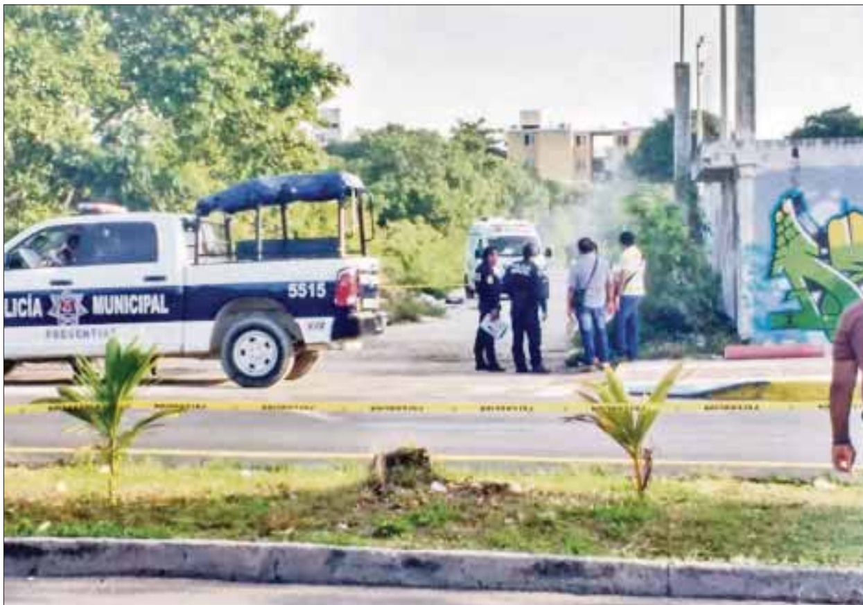
De forma dantesca, un hombre fue asesinado y luego quemado en un callejón solitario cerca del encierro de Turicún, al norte de la ciudad.

El crimen ocurrió a 24 horas de que otro hombre apareciera asesinado en la colonia El Pedregal.