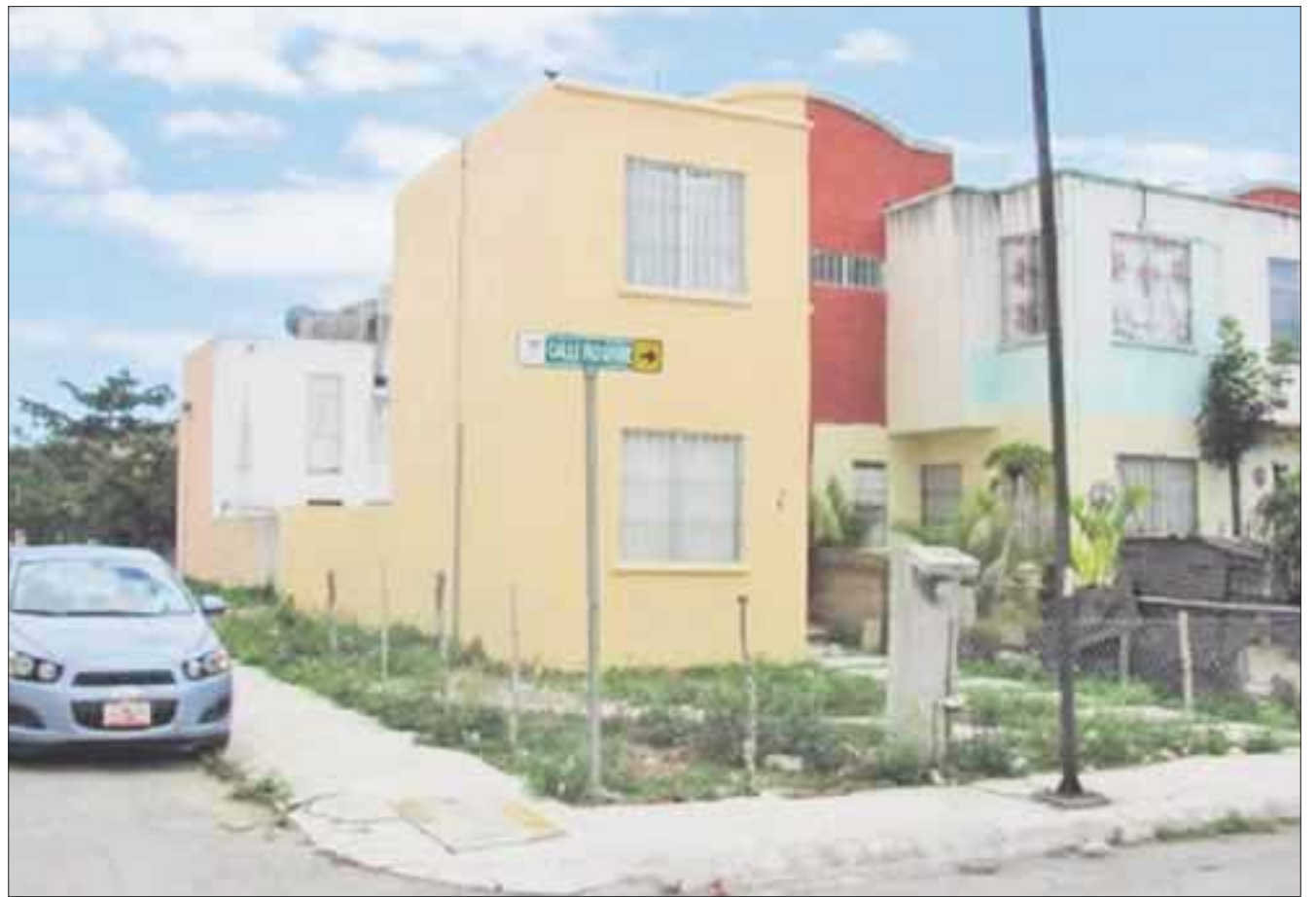
Durante el día, en las colonias y fraccionamientos de Playa del Carmen es difícil ver patrullas.