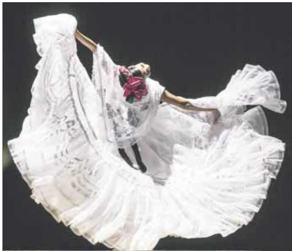
A través de majestuosos bailes, el Ballet Folklórico de México nos transportó a Veracruz con la Fiesta de Tlacotalpan.

Además, hubo coreografías que traen el sello de Amalia Hernández, como es “El Pescador” y “La Bamba”, donde la gente que aún recuerda a doña Amalia llora y por sus mentes pasan los años de trayectoria, en los que nos representó