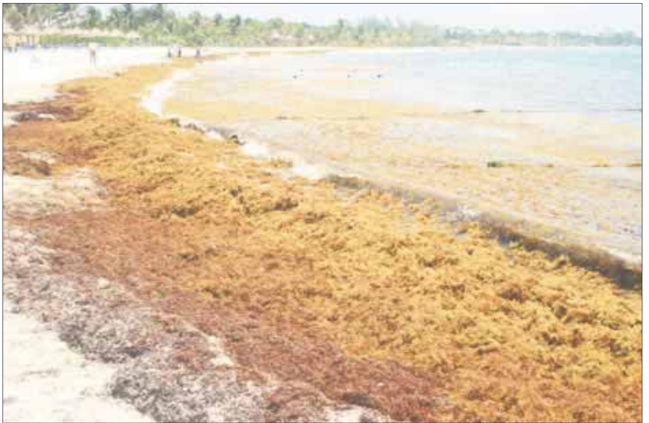
El huracán “Earl” no sólo provocó lluvias, sino que también provocó que llegara una gran cantidad de sargazo.

La mayor afectación se ha dado en las calles dos, cuatro, seis y ocho, pero lamentablemente también se ha levantado materia orgánica de los clubes de playa, que se han mezclado con el sargazo dentro del mar, esto ha provocado mala imagen a las playas, aunado al mal olor que se percibe por su putrefacción.