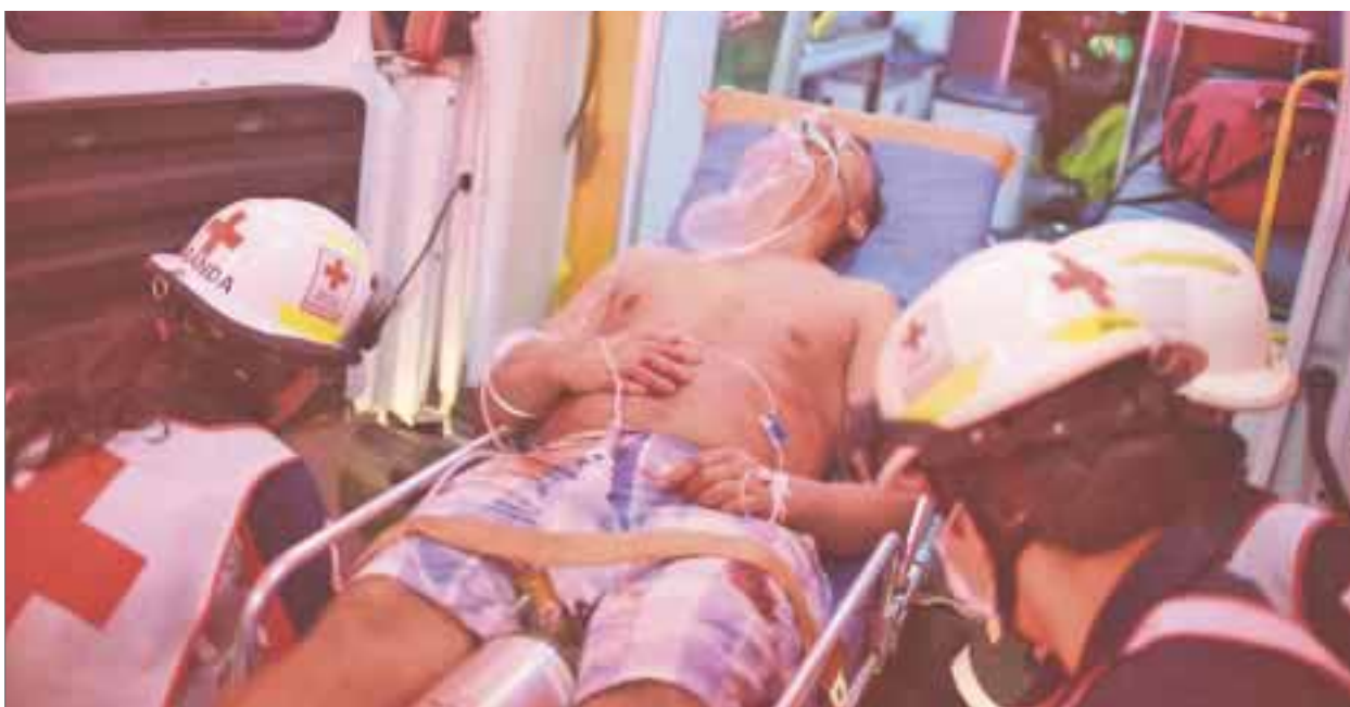
El hombre que pretendió suicidarse recibe terapia y sus médicos pretenden convertirlo en un ejemplo de readaptación social.