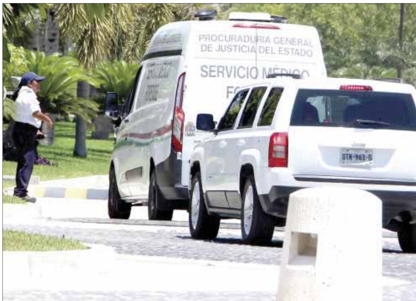
Los alarifes extrajeron valientemente a su compañero, pero pagaron un alto precio por su acción.

Cabe mencionar que ésta no es la primera tragedia por falta de equipo adecuado que se registra en Puerto Cancún.