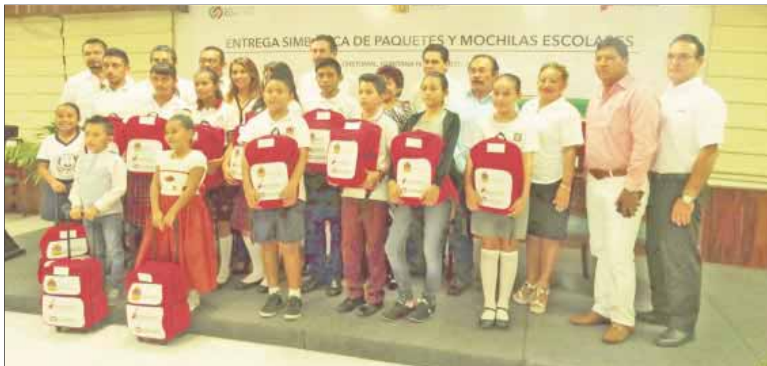
La ceremonia de entrega de útiles se efectuó en la sala “Cuna del Mestizaje” del Palacio de Gobierno.

nes del mandatario de que se cumplan los compromisos con los trabajadores, por lo que se ha dado puntual cumplimiento a diversos apoyos, como son la entrega de estímulos y reconocimientos por antigüedad, Día del Emple-