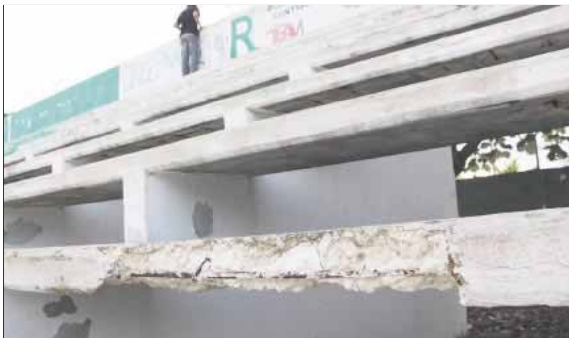
De esta manera fueron reportadas hace un año las gradas de la cancha de básquetbol en la región 516, pero a la fecha nadie se ha presentado a repararlas.

Cancún.- Los vecinos de la región 516 reportaron desde hace un año, el mal estado en que se encuentran las gradas de la única cancha de básquetbol con la que cuenta su colonia, pero nadie del ayuntamiento ha hecho nada.