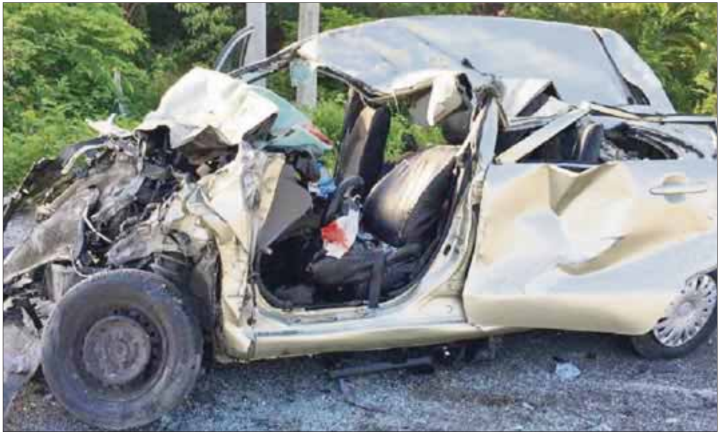
Los pasajeros de la Toyota era el padre y dos de sus hijos avecindados en Tulum, de los cuales sólo un menor salvó la vida.

Sin embargo, uno de los dos lesionados murió horas más tarde en el Hospital General de Playa del Carmen. Mientras, un menor permanece en estado grave de acuerdo al parte médico.