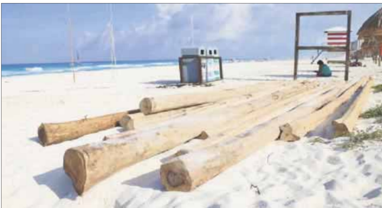
La palapa estará a unos metros de la orilla de la playa y cuenta con el aval de la Secretaría del Medio Ambiente.

El área se encuentra frente a las instalaciones del hotel, que una vez fue conocido como El Pueblito, en el kilómetro 19.5 de la zona hotelera, a un costado de la playa.