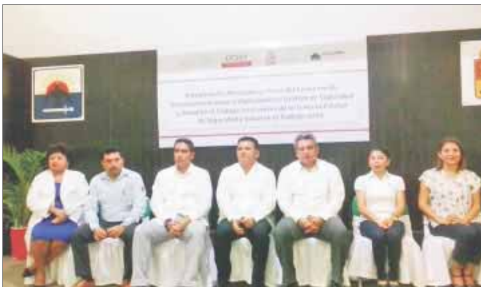
Cincuenta servidores públicos se capacitarán para ser especialistas en materia de gestión de seguridad y salud.