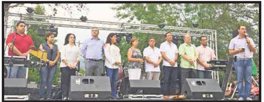
En la inauguración de la Muestra Gastronómica de Santiago.

☆☆☆☆☆ Ayer, martes a las 20:05 horas, el primer vuelo comercial del A380 aterrizó en el aeropuerto internacional RIOgaleão-Tom Jobim. El