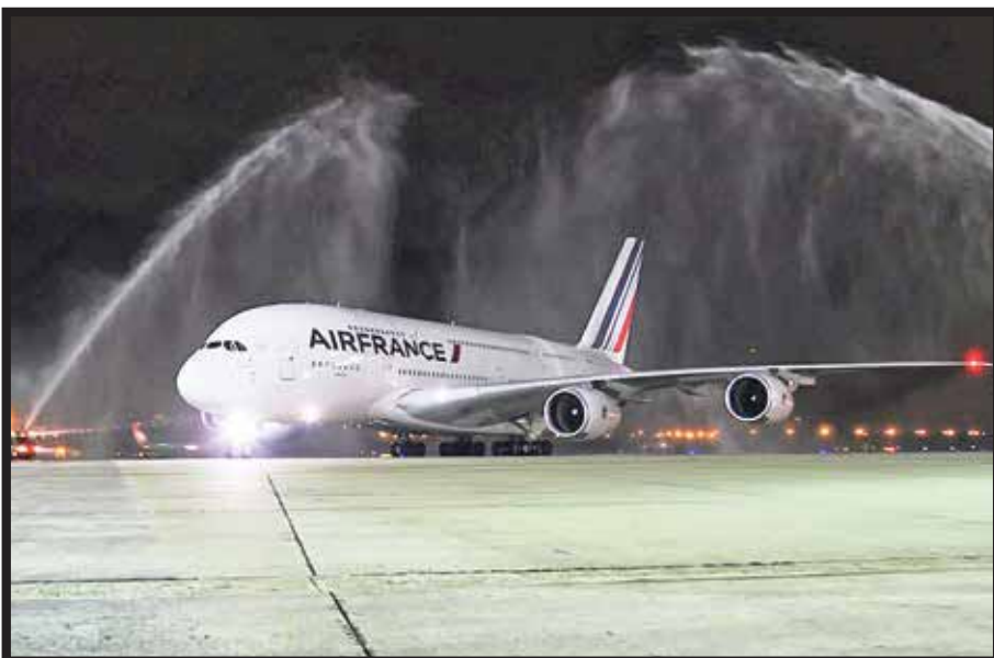
Llega el A380 al aeropuerto internacional RIOgaleão-Tom Jobim, en Río de Janeiro.

Este año se dará la bienvenida a marcas líderes como Anam Resorts, Andaz, Casa Sandra, la Isla Holbox, México, Charleston, Santa Teresa, Colombia, The Cotton House , Mustique , Cristalino Lodge, Brasil ; Hotyel B Lima, Perú; Lamima