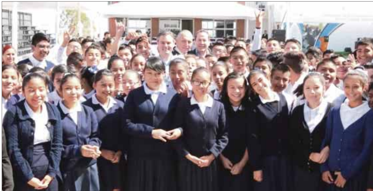
El secretario de Educación Pública, Aurelio Nuño Mayer, afirmó que el futuro de los niños no es negociable.

Acompañado por el secretario de la Defensa Nacional, Salvador Cienfuegos Zepeda, y el gobernador Eruviel Ávila Villegas, Nuño Mayer reconoció el compromiso de las fuerzas armadas con la educación, así como por su valentía y le-