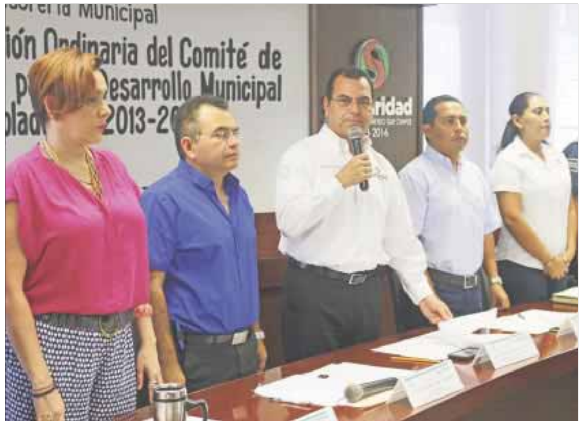
El alcalde de Solidaridad, Rafael Castro Castro, encabezó la Sesión del Comité de Planeación para el Desarrollo Municipal.

Asimismo, 128 millones 667 mil 436 pesos corresponden al ramo 33 del Fondo de Infraestructura Social Municipal y Fondo de Aportaciones para el Fortalecimiento Municipal; 15 millones 126 mil 16 pesos corresponden a Fortaseg y 32 millones 971 mil 195 pesos son del ramo 15 para el programa de infraestructura en su vertiente de hábitat, programa de infraestructura en su vertiente de espacios públicos y programa de prevención de riesgos, así como de los referendos del ejercicio 2015 siguientes, siendo 82 millones 305 mil 223 pesos con 50 centavos del ramo 23 para contingencias económicas y proyectos de desarrollo regional y 22 millones 462 mil 955 pesos que corresponden al ramo 33 del Fondo de Infraestructura Social y Fondo de Aportacio-