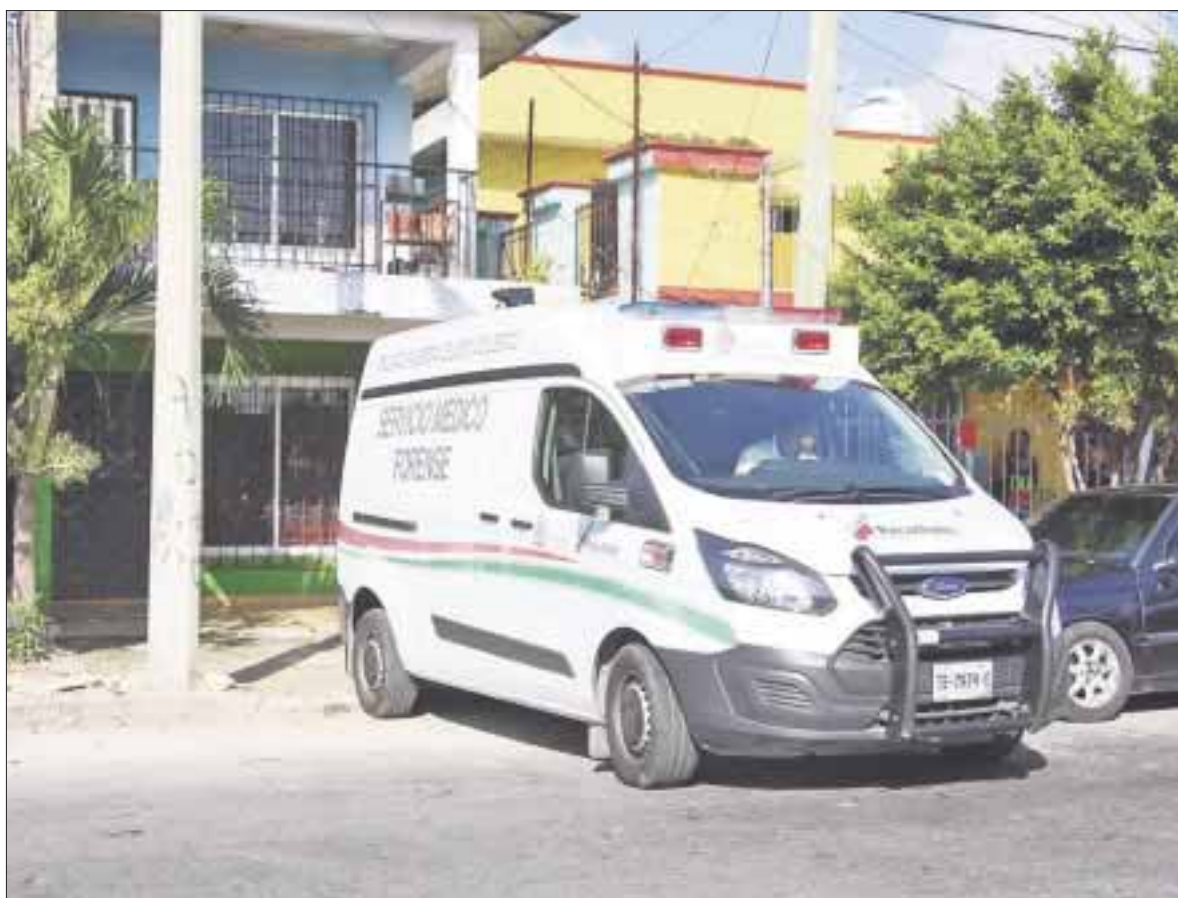
En medio de extrañas circunstancias, una pareja fue encontrada muerta dentro de una cuartería de la Supermanzana 71.

El testigo dijo a la policía que al salir a la calle para solicitar una ambulancia, el hombre tomó un destornillador e intentó clavárselo en el pecho, pero al no conseguirlo, tomó un cuchillo y se cortó las venas y las arterias del cuello.