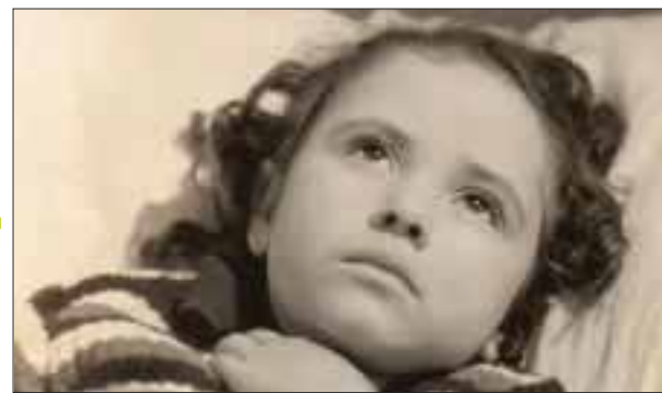
A los cuatro años de edad Evita Muñoz actuó en “El secreto del sacerdote” (1940) con Pedro Armendáriz.

en la novela “Que bonito amor”, como Doña Prudencia, y en junio del 2013 estelariza un episodio de “La rosa de Guadalupe”.