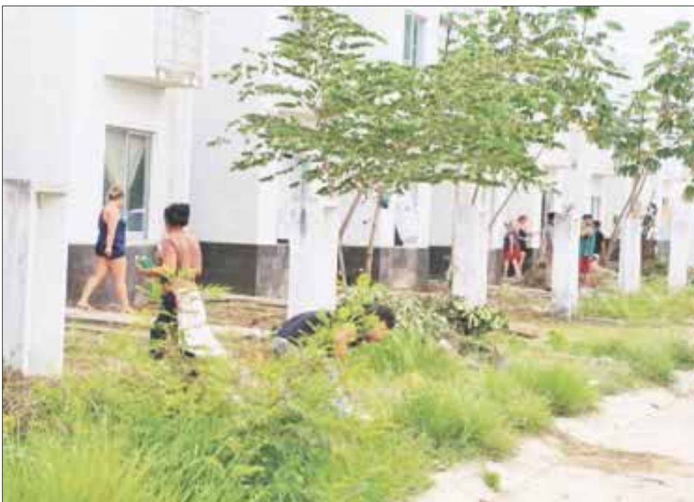
Más de 25 viviendas en Villas del Arte fueron invadidas por “paracaidistas”, dedicados a la industria de la protesta.

Cancún.- Más de 25 viviendas fueron invadidas en Villas del Arte en la supermanzana 316 en el polígono sur, hombres que aseguran no tener temor a la cárcel al apelar a su derecho de tener una casa en un lugar abandonado.