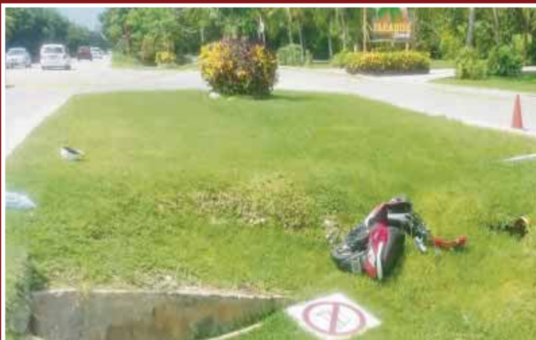
Su acompañante también resultó con heridas graves y se encuentra hospitalizada en una clínica privada.

Cozumel.- De manera lamentable muere turista estadounidense, luego de derraparse en una motocicleta cuando paseaba en la carretera perimetral de la isla.