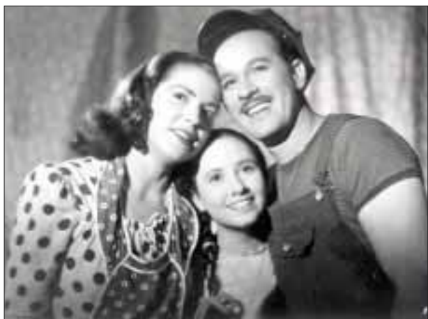
En su adolescencia coestelariza junto a Pedro Infante la trilogía de “Nosotros los pobres” (1948), “Ustedes los ricos” (1948) y “Pepe El Toro” en (1952), con lo que se da inicio a un nuevo ciclo dentro del cine nacional.