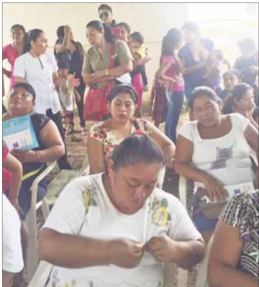
Un paquete de estudios clínicos ha sido desplegado entre las mujeres de Quintana Roo para detectar cáncer.

Durante el primer semestre del año se realizaron 7 mil 333 estudios de detección de cáncer de cuello uterino, siendo 4 mil 263 estudios de Papanicolaou y 3 mil 70 estudios de VPH, de los cuales se han detectado 82 casos de cáncer insitu, 713 casos de displasia leve y 127 pacientes con Virus de Papiloma Humano, explicó la doctora Torres.