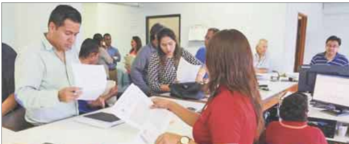
La administración local entrante heredará un 30 por ciento del total de juicios que recibió el gobierno local.

Cancún.- Heredarán a la administración local entrante un 30 por ciento del total de juicios que recibió el gobierno local, al disminuir más de un 50 por ciento los juicios laborales contra el ayuntamiento.