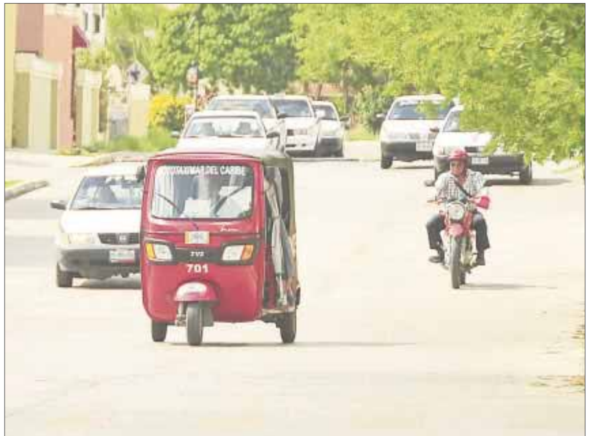
Los tricitaxis o tricimotos rechazan unirse al Sindicato de Taxistas Andrés Quintana Roo.

Las tarifas son de 10 hasta 20 pesos, según la distancia ya que pueden circular en brechas o áreas de terracería, en donde tricitaxis entran. El 25 por ciento de quienes operan este sistema son mujeres y el mismo número personas con alguna discapacidad, y el resto personas de la tercera edad.