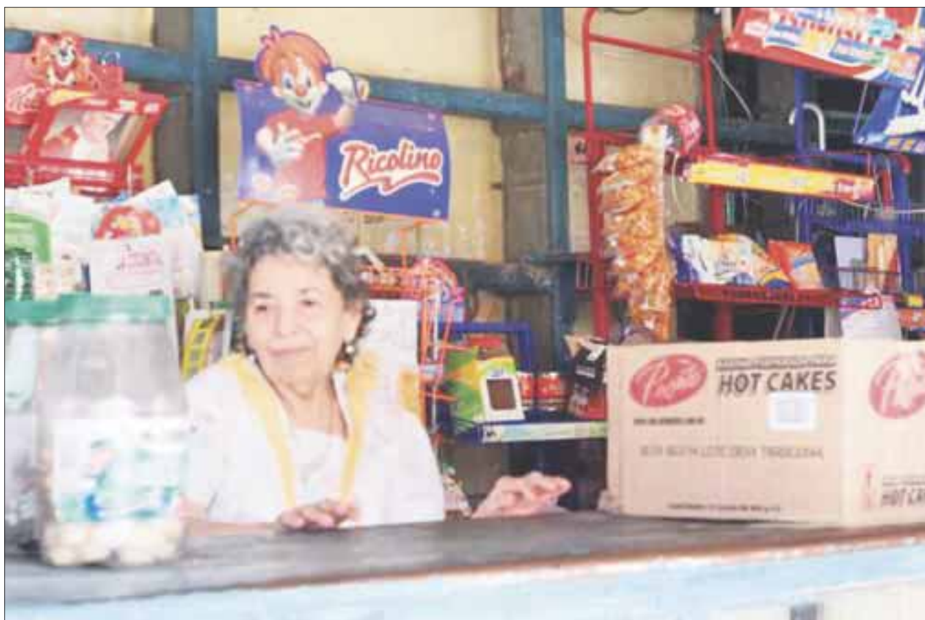
Agoniza el comercio organizado , al bajar de forma definitiva sus cortinas más de 350 negocios por año.

A pesar de las buenas intenciones de apoyarlos, los comercios en pequeño difícilmente pueden recuperarse de las malas rachas, ya que la mayoría no puede competir en precios con las cadenas comerciales, que los obligan a bajar sus precios y muchas veces sólo para recuperar la inversión, sin ganancia alguna.