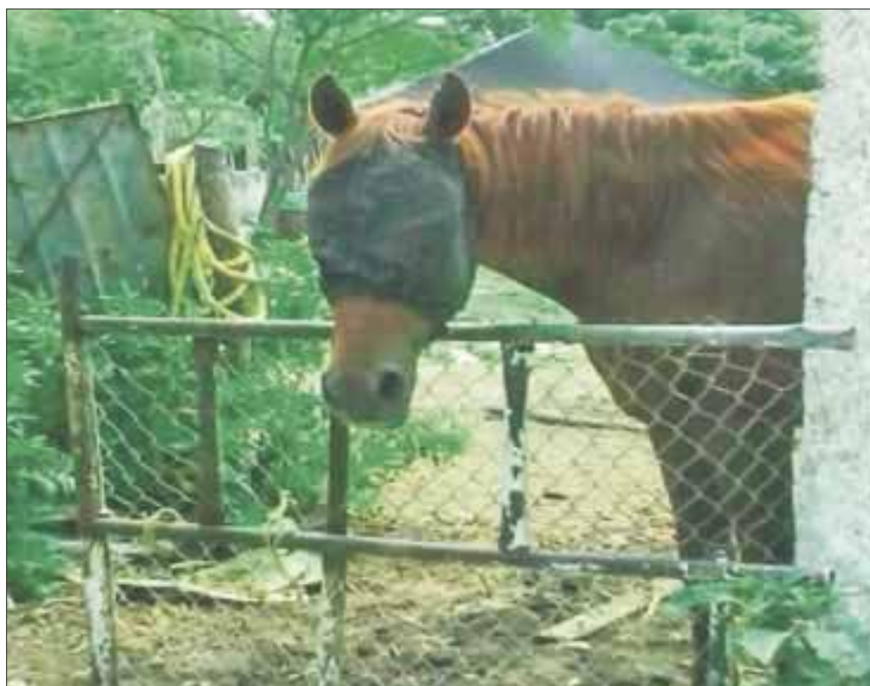
Los equinos se encuentran en un predio, propiedad del socio mayoritario de las calesas.