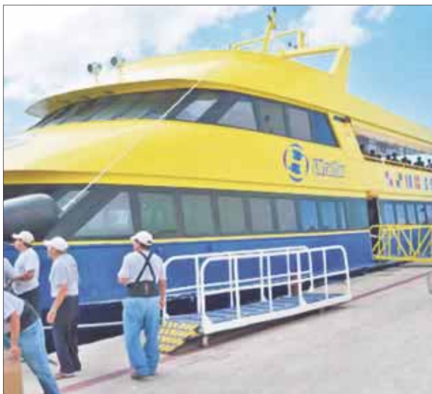
La propuesta del transporte urbano lagunar, más que una alternativa para la población, es una opción turística.

Insistió que el proyecto de la empresa marítima Ultramar, también ser un atractivo de entretenimiento local, en el que la familia que radica en Cancún, se vaya el fin de semana con toda su familia a través de ese medio.