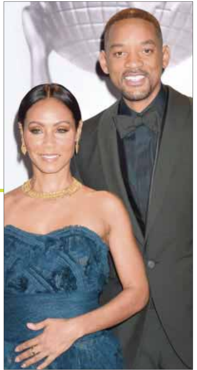
El matrimonio de Will Smith con Jada Pinkett podría llegar a divorcio.