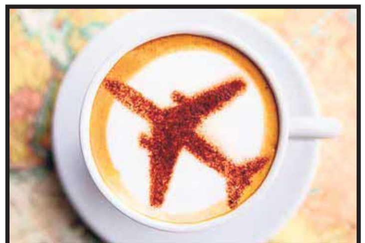
La línea aérea sirve 72 millones de tazas de café cada año.

victoriagprado@gmail.com Twitter: @victoriagprado