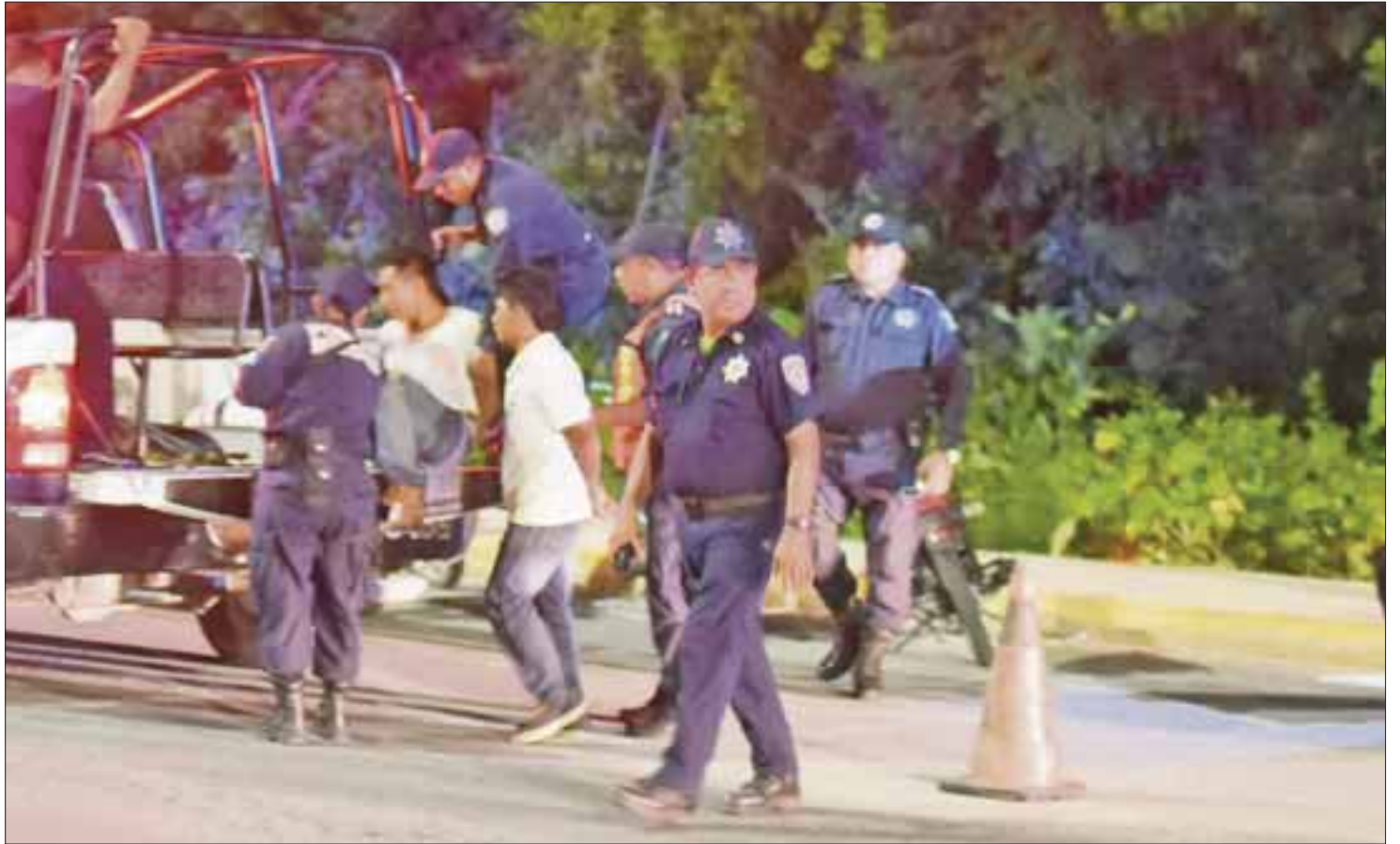
Una jovencita fue rescatada en un retén de la carretera Cancún-Mérida.

Sin embargo, la persona raptada sigue siendo interrogada y no hay detenidos ni una investigación seria sobre el caso.