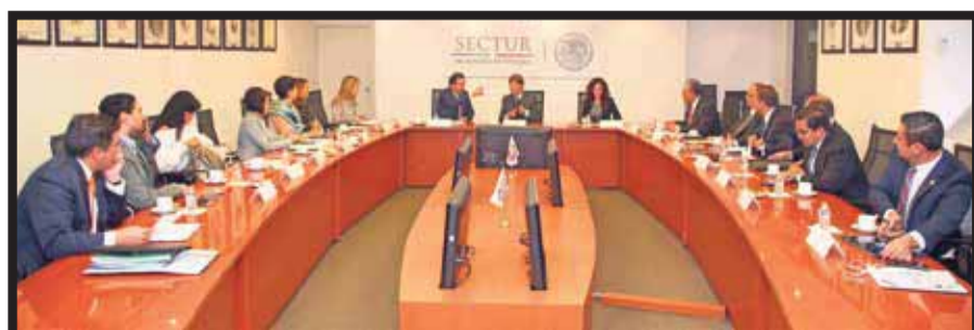
La Asetur se reúne con el titular de Turismo, Enrique de la Madrid.

En altitud de crucero, perdemos hasta 30 por ciento de la percepción de los sabores. Preparar alimentos y bebidas que los pasajeros disfruten