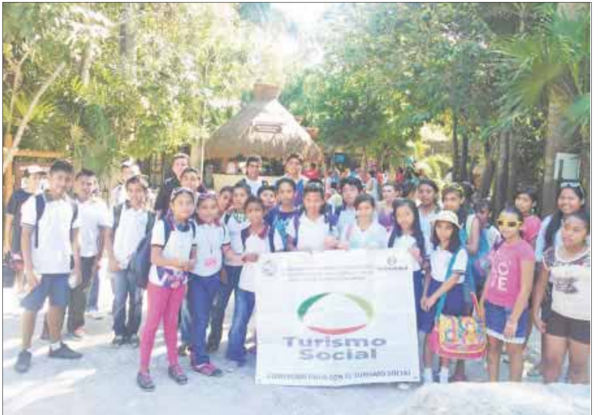
Los parques han abierto sus puertas gratuitamente a más de 14 mil habitantes de Playa del Carmen y Puerto Aventuras.

El programa Turismo Social cumple los objetivos de la administración local, de ser un municipio inclusivo con acceso a todas a las bellezas naturales y parques turísticos.