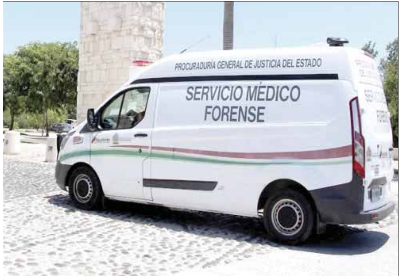
Un riesgo laboral es la versión aceptada que se intenta hacer creer en el caso de los albañiles muertos en Puerto Cancún.

Otro punto que vale la pena mencionar, es que hasta la tarde de ayer, la Dirección de Protección Civil no había clausurado la obra, ni había ordenado una revisión al equipo que estarían usando los alarifes, argumentando que era un trabajo de la Fiscalía General del Estado.