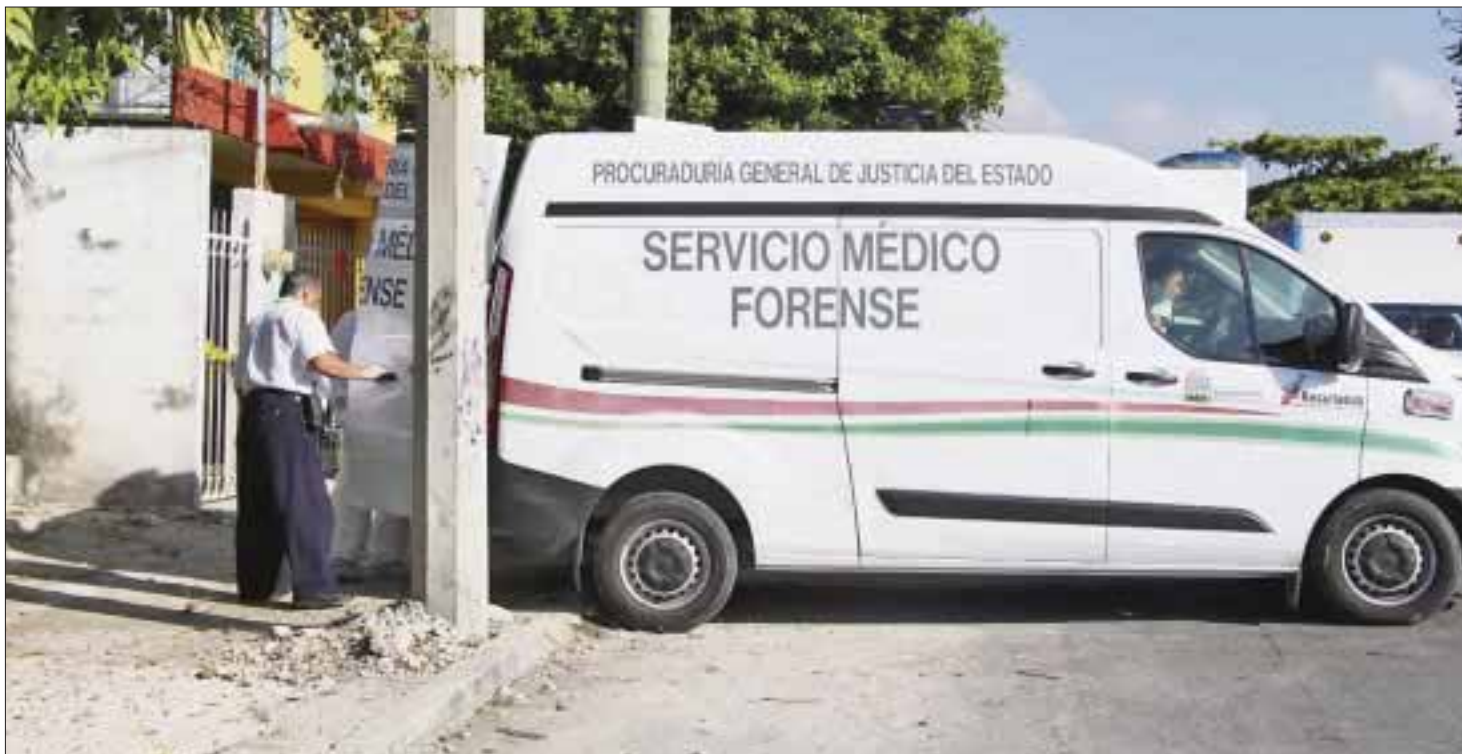
Los Servicios Periciales iniciaron trabajos a profundidad sobre los cadáveres.

Cancún.- Catalogados ya como una versión moderna y algo distorsionada de la famosa pieza teatral de “Romeo y Julieta”, los cuerpos de la pareja que se suicidaron en una cuartería de la supermanzana 71, no han sido reclamados.