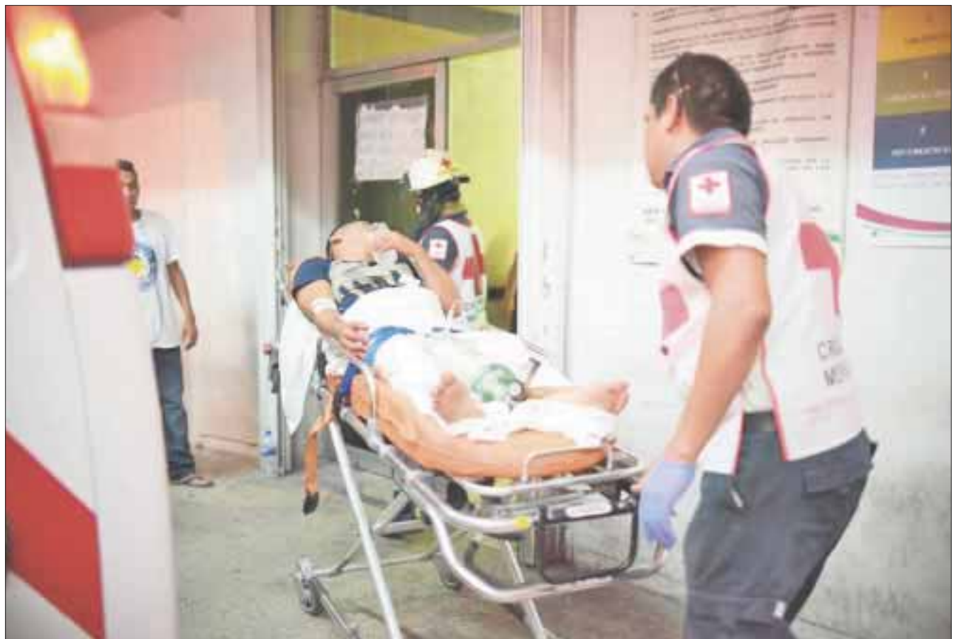
Durante la noche del pasado martes, tres hombres fueron atacados a balazos, en lo que se presume se trató de un intento de ejecución.

La Fiscalía General del Estado inició la carpeta 3653/2016, en tanto los afectados puedan iniciar formalmente su denuncia en el Ministerio Público.