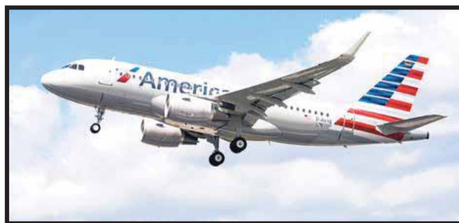
A partir de diciembre, la aerolínea volará de Los Ángeles a Cancún y Puerto Vallarta.