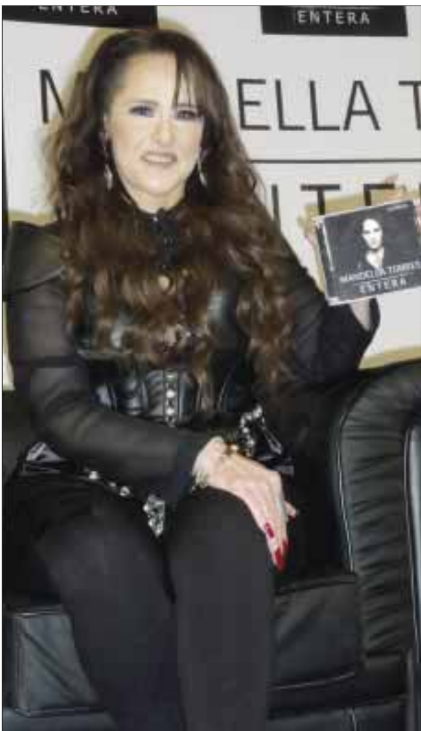
Manoella llega Entera en voz, talento, carácter, y personalidad para iniciar su romance musical con el público, en un concepto que compartirá el domingo 2 de octubre en concierto en el Lunario.