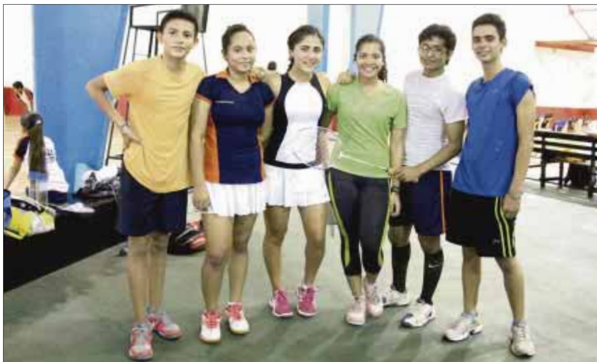
El domingo 4 de septiembre la Academia de Bádminton Cancún iniciará sus torneos en el gimnasio Kuchil Baxal.

Cancún.- Con la intención de lograr un fogueo constante y de mejorar su técnica, la escuela municipal de Bádminton Cancún, organiza desde el domingo 4 del próximo mes de septiembre, una serie de torneos dominicales, en la duela del gimnasio Kuchil Baxal.