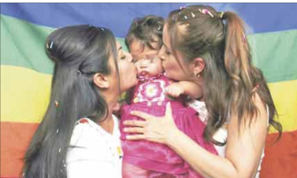
Unas mil personas marcharán el 10 de septiembre en torno al Frente Nacional por la Familia en contra de de los matrimonios igualitarios.

Cancún.- Más de mil personas participarán el 10 de septiembre en una marcha simultánea en el país, a través de la convocatoria que realizó el Frente Nacional por la Familia en contra de la iniciativa de los matrimonios igualitarios y en favor de que los menores tengan padre y madre.