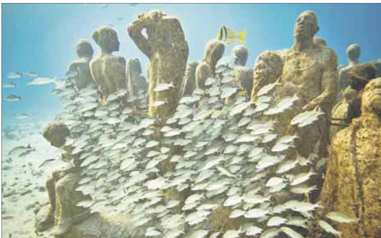
Se colocarán tres nuevas esculturas en la sala del museo subacuático, ubicado en Punta Sam, que se sumarán a “Las Bendiciones”, que forman parte del complejo artificial en la zona.

Con el apoyo de escultores y un equipo de trabajo, al momento tienen hundidas 516 piezas de las mil proyectadas, que además de ser una obra de arte, es un complejo artificial en la zona donde habitan diversas especies marinas.