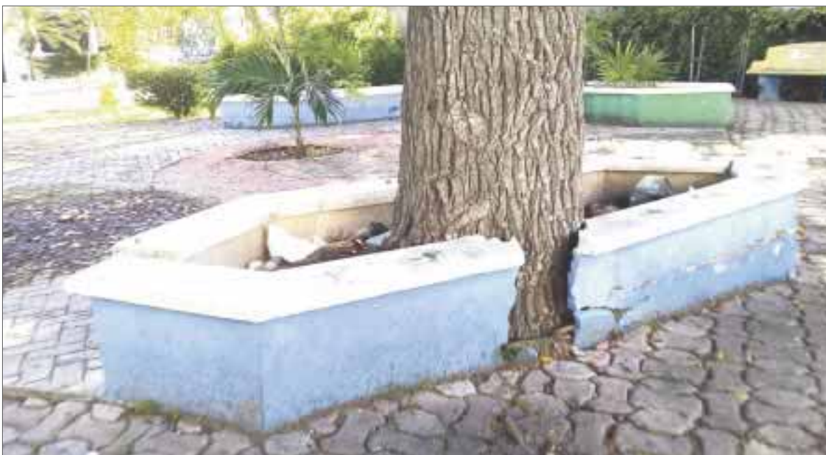
Un árbol de zapote podría desplomarse en cualquier momento sobre alguna persona en el pequeño parque, a espaldas de "la Cómer" de avenida Tulum.

Cancún.- Un pequeño parque que se ubica en la supermanzana 2 junto al hospital privado Playamed, fue reportado por locatarios quienes pidieron mayor atención a este espacio.