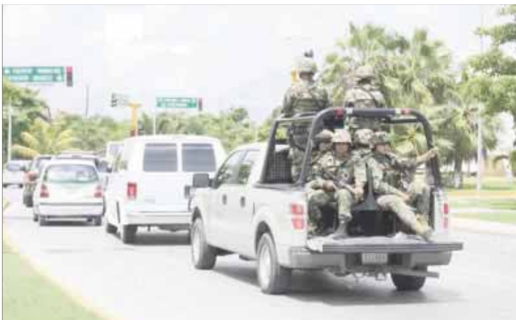
Han sido decomisadas 162 armas en diferentes operativos desplegados por el Ejército, en lo que va del año.

Chetumal.- El general Víctor Hugo Aguirre Serna, jefe de Estado Mayor de la X Región Militar, afirmó que Quintana Roo es el más violento de la península de Yucatán.