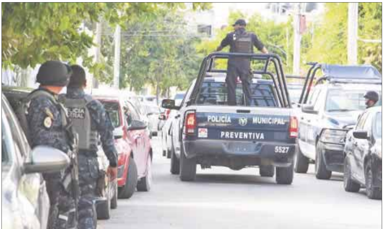
Luego de grabarlo sin camisa en un hotel de Playa del Carmen, los plagiarios supuestamente enviaron la grabación a los familiares de la víctima.

El agraviado dijo que tras la grabación, lo trasladaron a las Suites Garden de esta ciudad, donde finalmente fue rescatado.