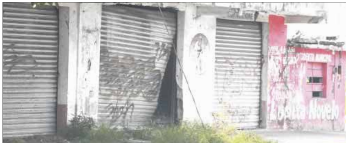
Estos locales son usados por delincuentes para esconderse de la policía o para consumir droga.

Cancún.- Lo que otrora fueron una locales comerciales en la supermanzana 69, manzana 05, calle 33, ahora son una guarida de maleantes que los utilizan para esconderse de la policía, según denuncian vecinos.