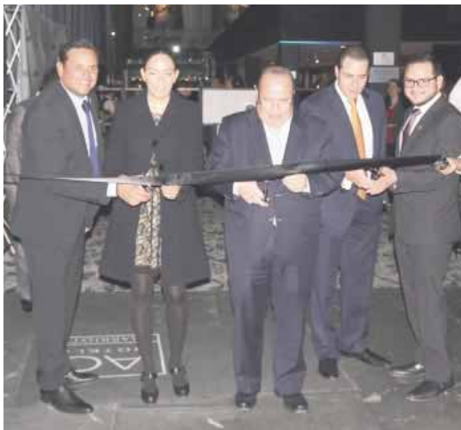
En la inauguración del nuevo hotel en Querétaro.