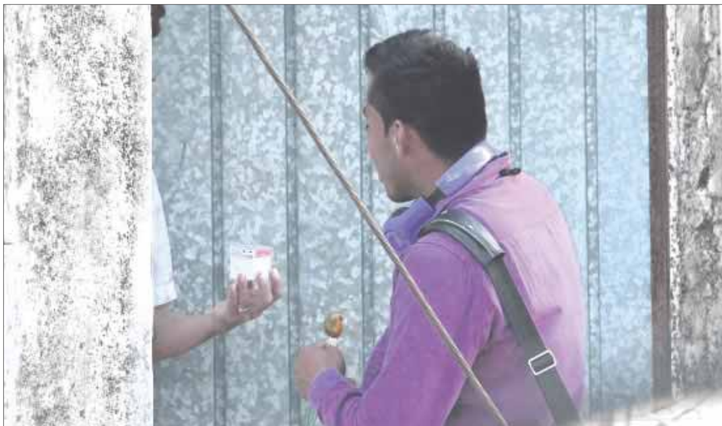
Con el viejo truco de estar haciendo un sondeo de mercado, ladrones ingresan a las casas para someter y robar objetos de valor.

Los denunciantes señalaron que los ladrones son astutos, pues no todos los días van por ese rumbo, lo hacen aleatoriamente e inclusive en otras regiones también han robado casas con ese mismo truco.