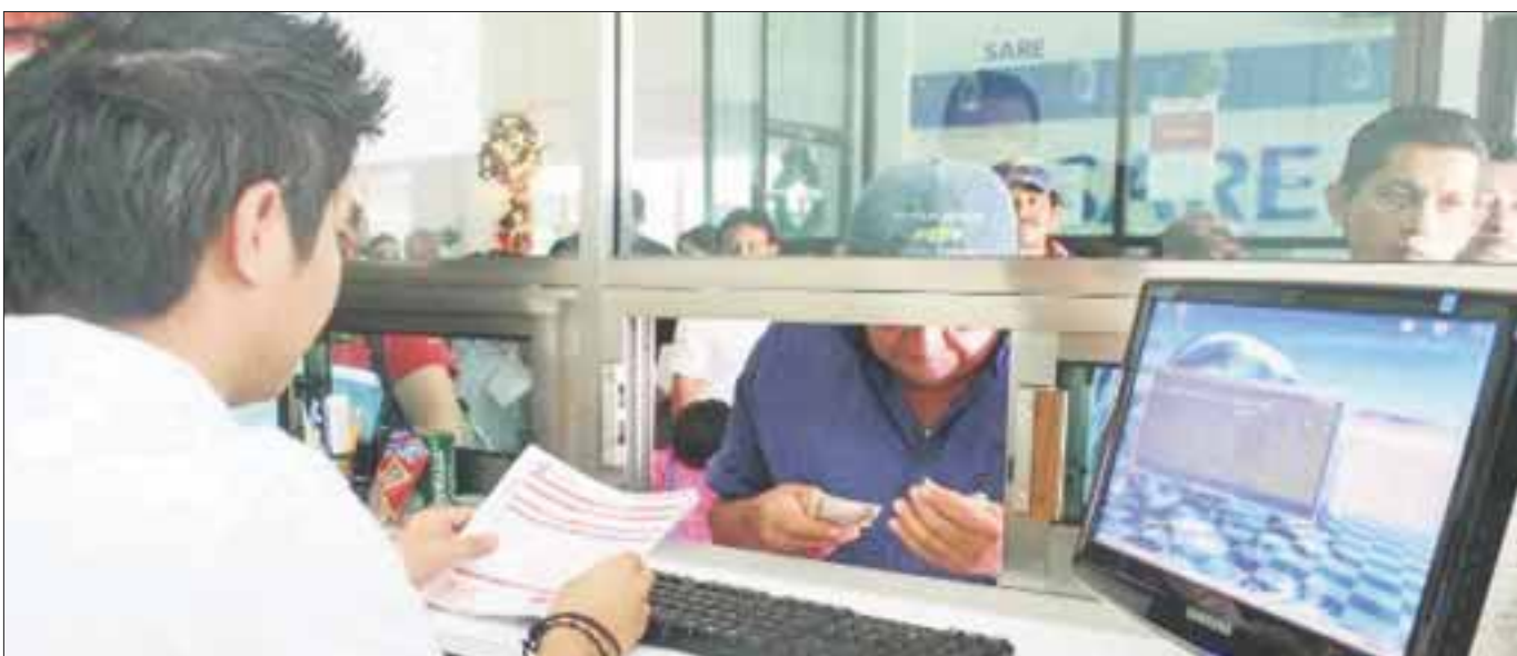
Una recaudación de 200 millones de pesos por el pago de impuesto predial, se obtuvo en el pasado mes de noviembre, lo que superó las expectativas de pretender obtener 30 millones de pesos.

Cancún.- Una recaudación de 200 millones de pesos por el pago de impuesto predial, se obtuvo en noviembre, lo que superó las expectativas de pretender obtener 30 millones de pesos, sólo aplicando el 25 por ciento de descuento para los que pagaron de manera anticipada su predial para el 2017.