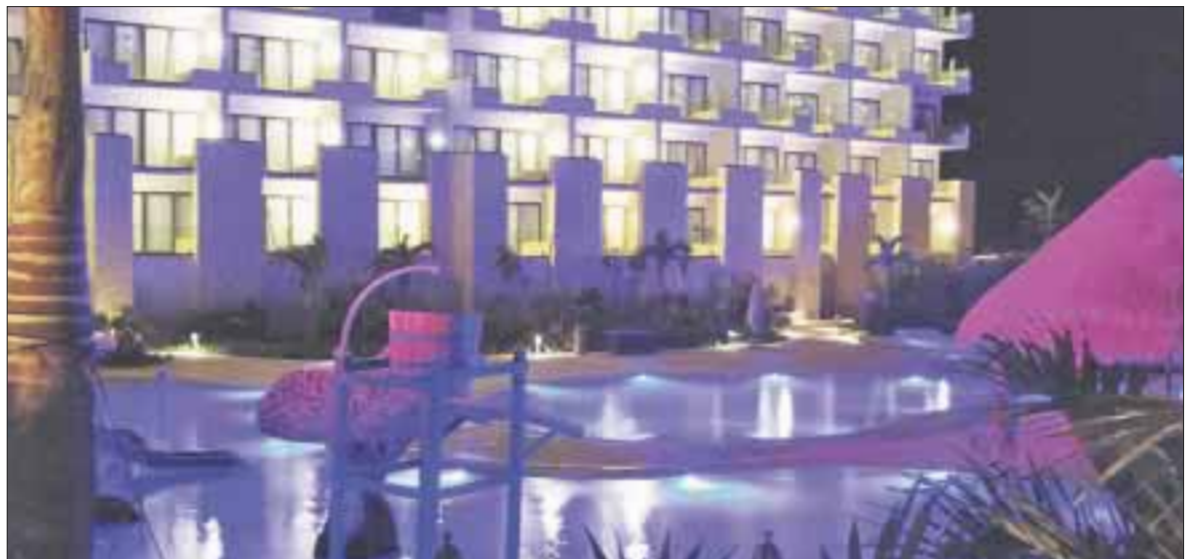
El nuevo hotel Dreams Playa Mujeres está ubicado dentro del exclusivo y lujoso complejo, a las afueras de Cancún.

Mencionó que a unos días de la apertura del Dreams Playa Mujeres, que dentro de su categoría es de los mejores, registra 40% de ocupación y prevé para el año próximo alcanzar 98%; por lo que pronostica que la inversión se recuperará en un plazo entre 10 y 12 años. Indicó que “estamos comprometidos a ofrecer las mejores amenidades para todo tipo de viajeros, incluyendo los amantes del golf, que fueron inspiración para el desarrollo del hotel dentro de Playa Mujeres”.