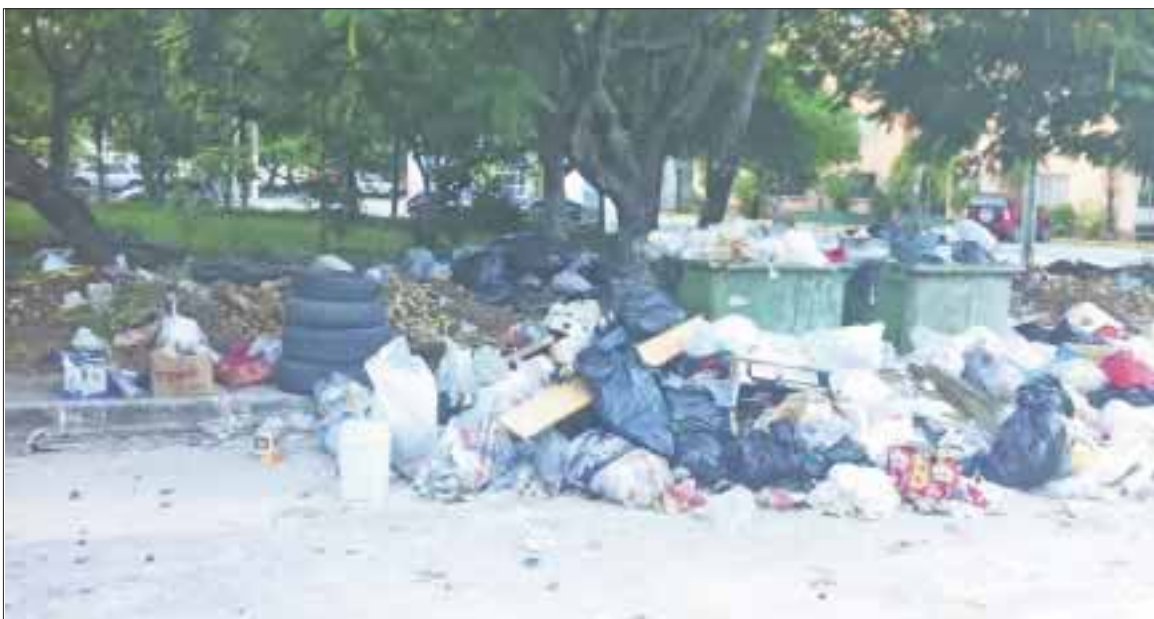
En foco de contaminación se convirtieron los puntos de recepción de la basura en la ciudad, en particular en regiones populares.

Cancún.- En un foco de contaminación se convirtieron los puntos de recepción de la basura en la ciudad, en particular en regiones populares y fraccionamientos como 95, 212, Villas Otoch y Corales, donde los desechos terminan a las puertas de los hogares.