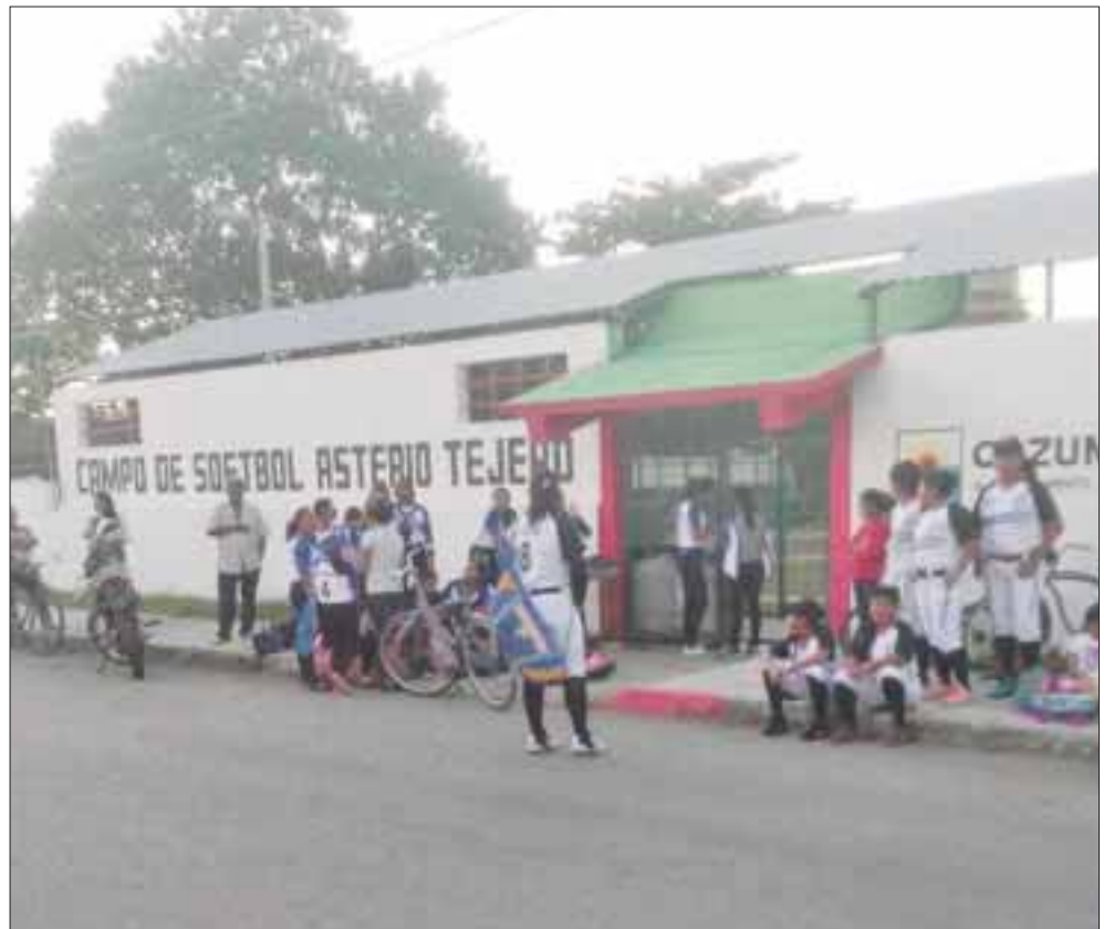
La Liga Asterio Tejero suspendió sus calendarios hasta que el ayuntamiento les comunique el monto a pagar por utilizar el deportivo para los encuentros de softbol.

Se ordenó cerrar los campos deportivos y el primero en ser afectado fue el Asterio Tejero, ubicado en la colonia Emiliano Zapata, a donde acudió personal de la Dirección de Deportes, que cambiaron los candados de la unidad y no permitieron la entrada