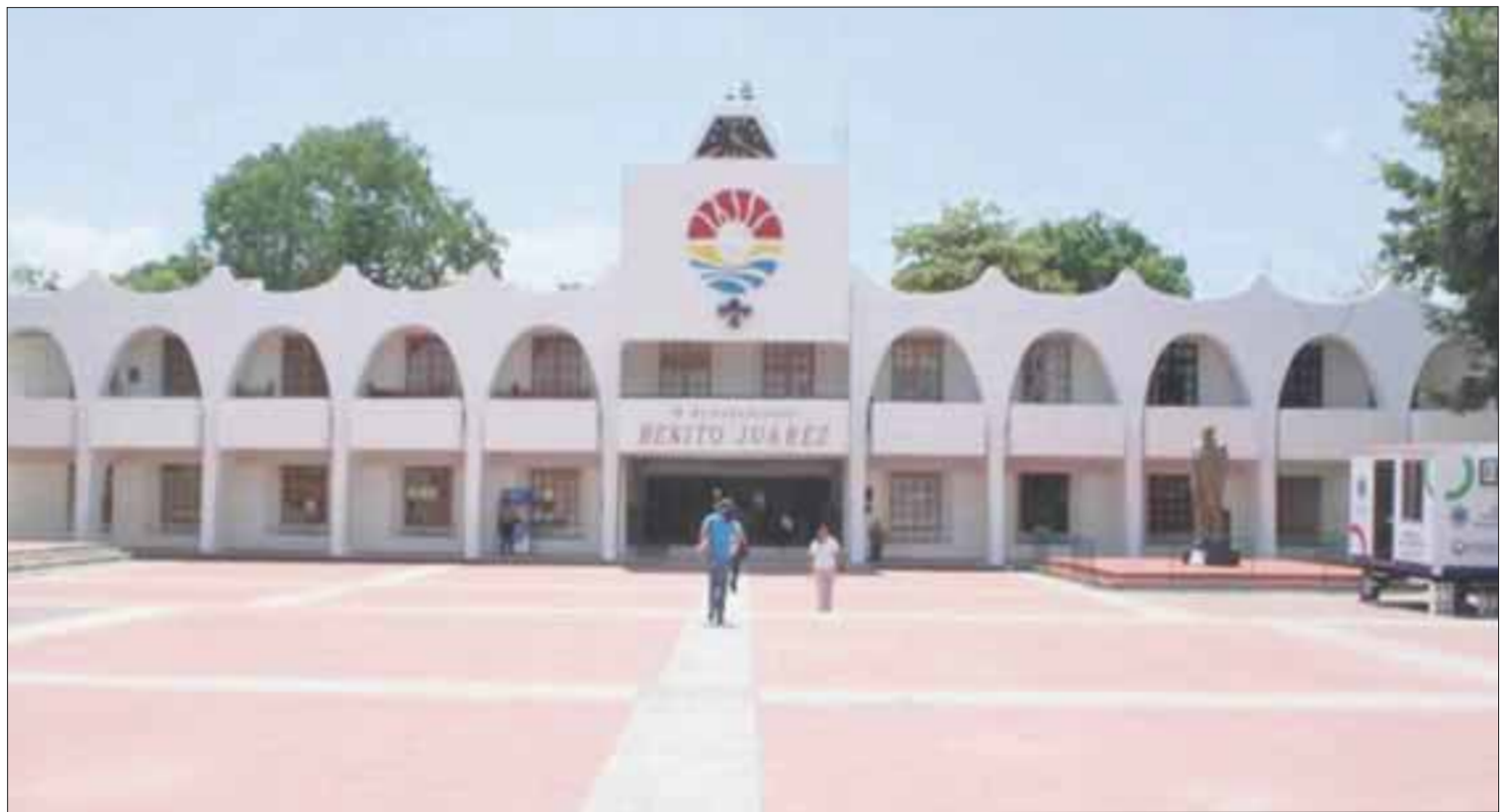
A través de mesas de trabajo se analizan los reglamentos y programas exitosos, a favor de la mejora de los empleados.

Los funcionarios y dependencias que forma parte de la comisión, se enfocan en cursos y programas básicos para actuar en caso de alguna crisis, ya sea favor de un individuo o del área administrativa en donde laboran.