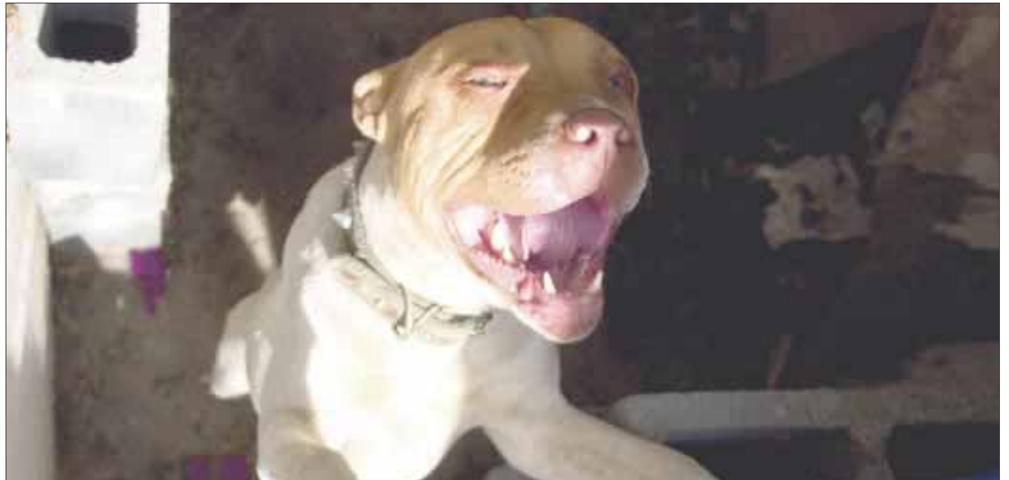
Los médicos le practicaron una cirugía al niño para repararle cuello, tráquea y pulmones, aectados por las mordidas del pitbull.

Ya pasaron las 72 horas después de la cirugía y es posible hacer un diagnóstico optimista, mientras el perro agresor continúa en observación en el Antirrábico y sus dueños buscan quien lo adopte, por bravo.