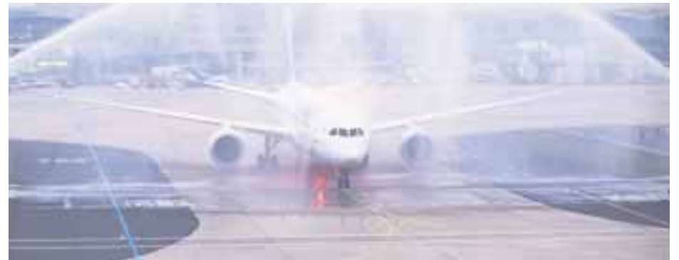
Dan la bienvenida al Boeing 787 .

Reducción significativa de emisiones de CO2 (alrededor de 20%) y emisiones de sonido. Actor importante en el mercado de mantenimiento aeronáutico, Air France Industries KLM Engineering & Maintenance (AFI KLM E&M), proporciona el soporte de mantenimiento, para la flota Boeing 787 del Grupo. AFI KLM E&M ofrece el soporte técnico más completo a las aerolíneas