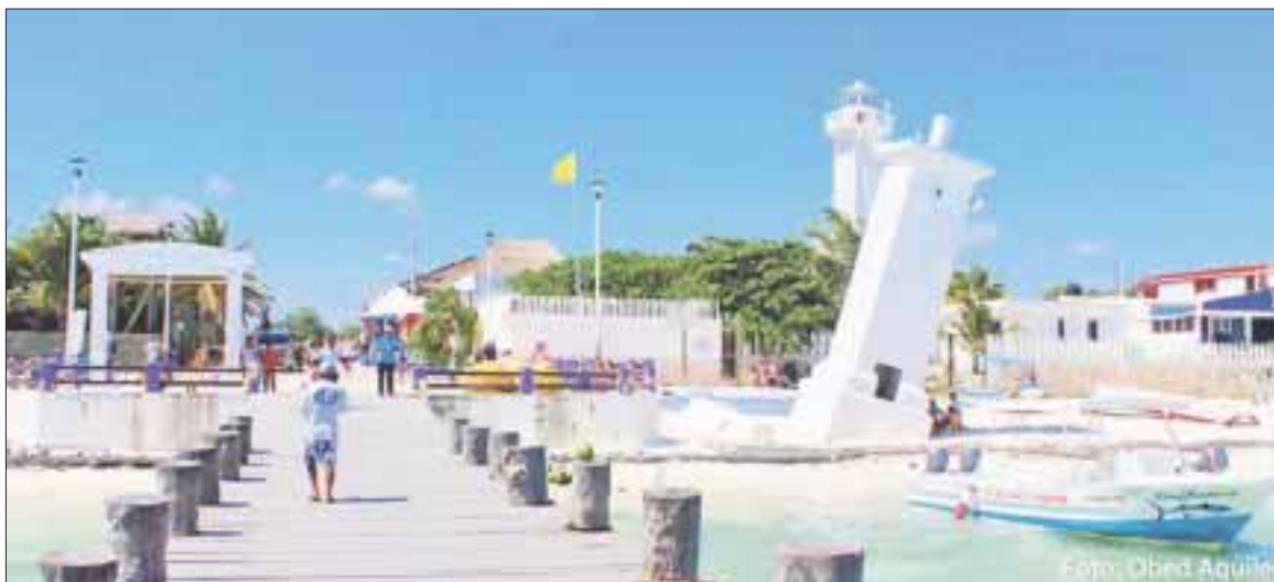
Se presentará la Primera Jornada de Incorporación , Educación, Oficio y Trabajo, para identificar el porcentaje real del rezago educativo en Puerto Morelos.

Cancún.- Ante cámaras empresariales, sindicales y organismos no gubernamentales, se presentará la Primera Jornada de Incorporación, Educación, Oficio y Trabajo, para identificar el porcentaje real del rezago educativo en Puerto Morelos, en cuatro meses.