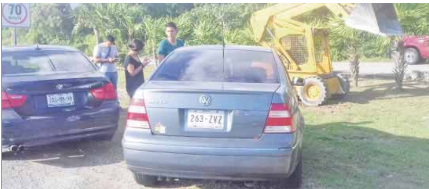
Los conductores, tanto del Jetta como del BMW deberán pagar los daños, pues ambos tuvieron parte de la responsabilidad.

Cancún.- Una imprudencia al circular con dirección a las universidades en el bulevar Colosio provocó que un estudiante, quien manejaba un Jetta, golpeará la parte trasera de un auto BMW, causando daños menores, pero un intenso tráfico que cerró uno de los carriles por casi 40 minutos.