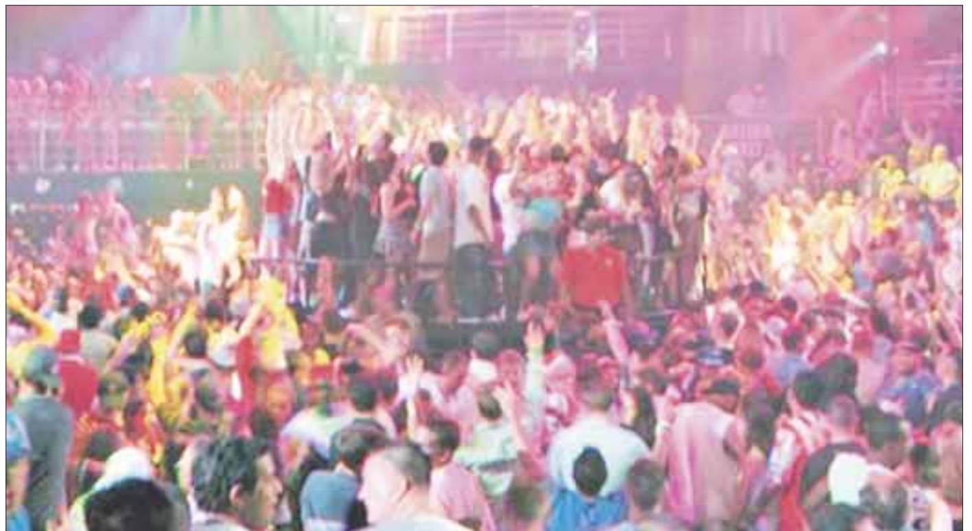
En Cancún, mil adolescentes menores de edad intentaron ingresar a los centros nocturnos, el pasado fin de semana.