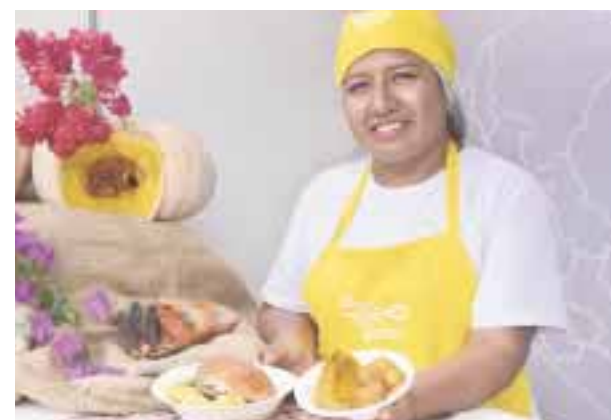
La cocina peruana, galardonada una vez más.