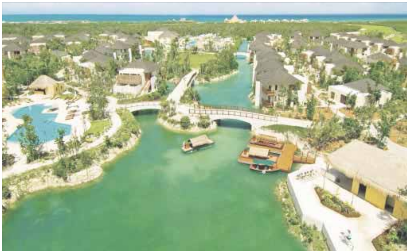
RLH es propietaria además del hotel Four Seasons de Ciudad de México, y de los hoteles One&Only Mandarin y Rosewood Mandarin.

La transacción supone conceder el 100% de estos activos un valor de empresa superior a los 500 millones de dólares (unos 471 millones de euros) y permitirá a OHL generar una caja estimada de 218 millones de euros, con un mínimo asegurado de 158 millones, y una plusvalía, incluyendo la puesta en valor de la participación no vendida, de 71 millones de euros.