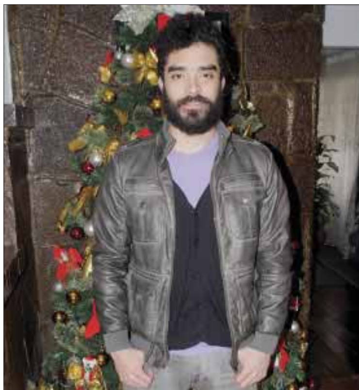
El actor Rafael Balderas, protagonista de “El ventrílocuo”, visitó la redacción de DIARIOIMAGEN .