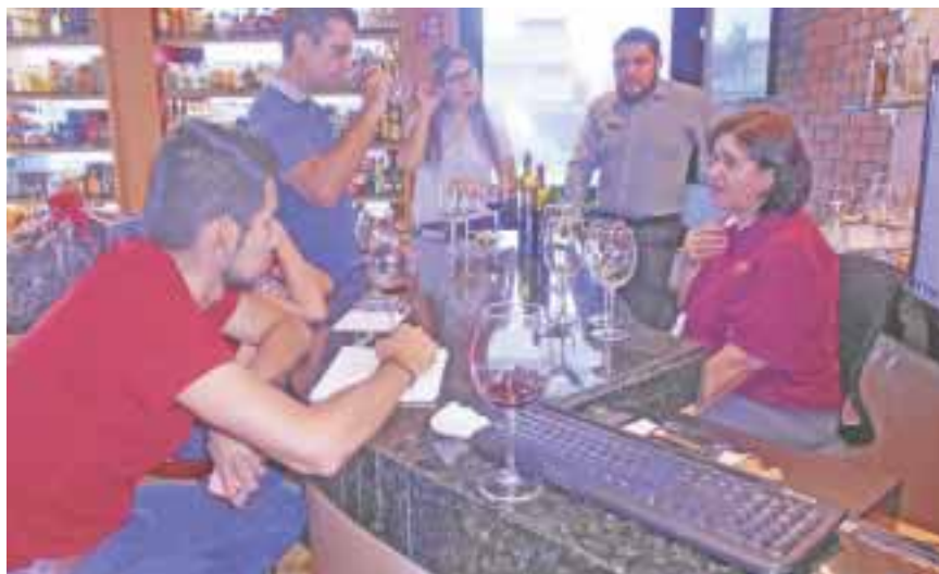
La tienda de vinos y licores La Castellana abrió sus puertas en la avenida Huayacán.

Cancún.- La Castellana, tienda de vinos, licores y productos para acompañar una buena bebida (ubicada en la avenida Huayacán, a tres kilómetros de la Kabah) empresa que existe en México desde 1936, con 17 establecimientos en distintas ciudades, abrió sus puertas en Cancún, donde pueden adquirir una botella de vino desde 60 hasta 70 mil pesos, de todas las marcas y regiones del mundo.