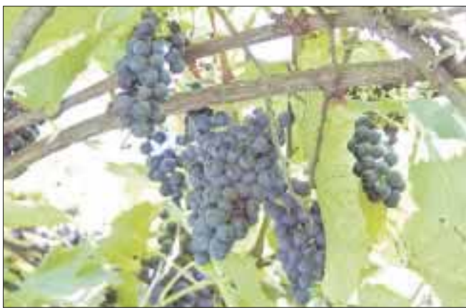
La agricultura puede ser afectada con un nuevo tipo de transgénicos, dicen los ambientalistas.

Cancún.-Organizaciones sociales, publicaron un llamado en el que conminan a los gobiernos reunidos en el Convenio sobre Diversidad Biológica (CDB) de 2016 a establecer una moratoria sobre los “impulsores genéticos”.