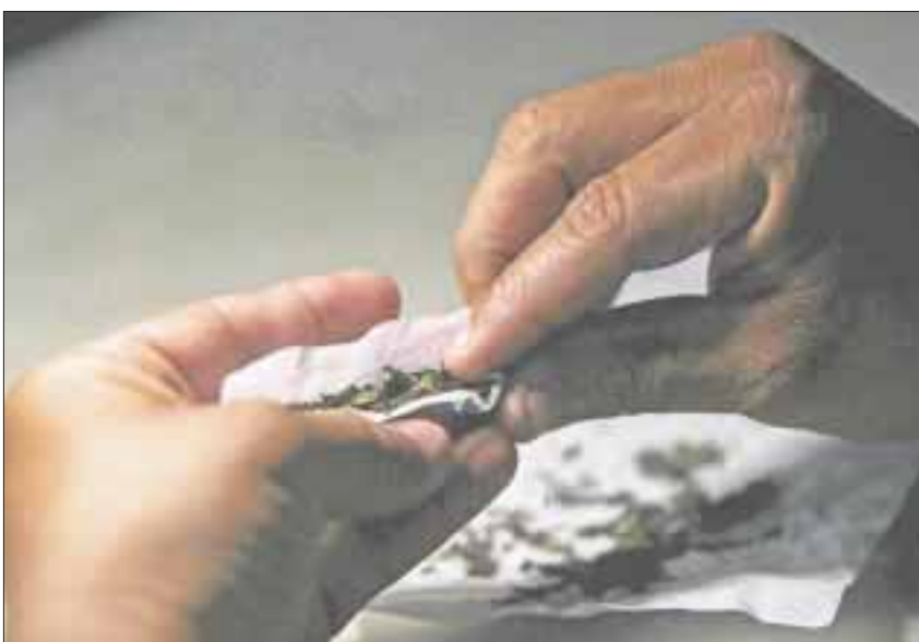
Cada vez más jóvenes en el estado incurren en consumir drogas ilegales, problema que también alcanzó a las mujeres.

Cancún.- A los 12 años, los chicos empiezan a drogarse y a tener relaciones sexuales que suspenden los planes de las prácticamente niñas, que les espera un mal futuro, porque provienen de familias disfuncionales.