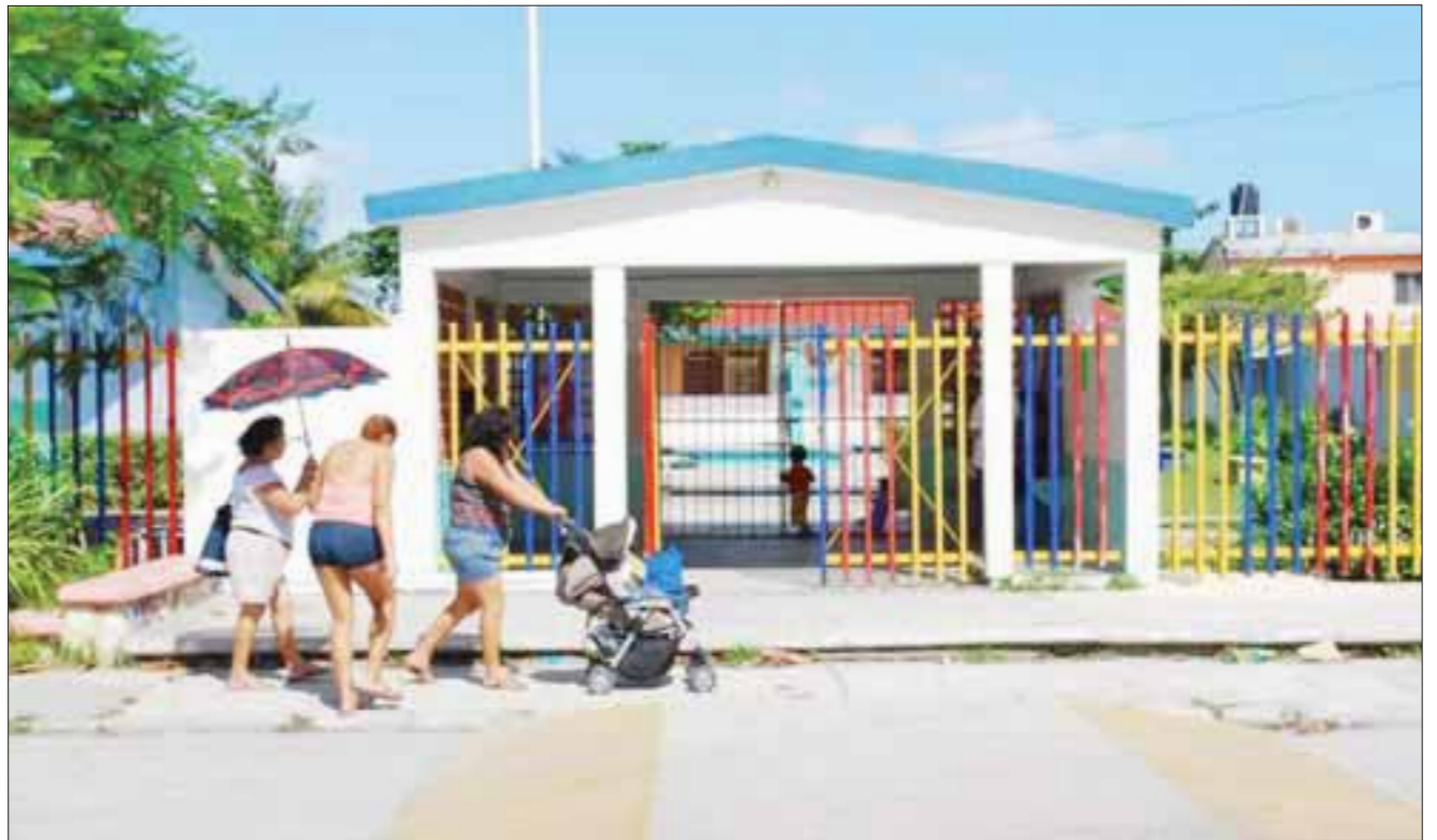
Los cambios de plantel y/o turno podrán realizarse a partir del 1 de marzo del 2017, siempre y cuando exista cupo disponible en la escuela de su interés.

Mientras, para inscripción a primaria y secundaria, los estudiantes inscritos en el ciclo escolar 2016-2017 no requieren realizar su registro de inscripción en línea, el sistema los transferirá al grado inmediato superior en el mismo plantel donde cursan el presente ciclo escolar.