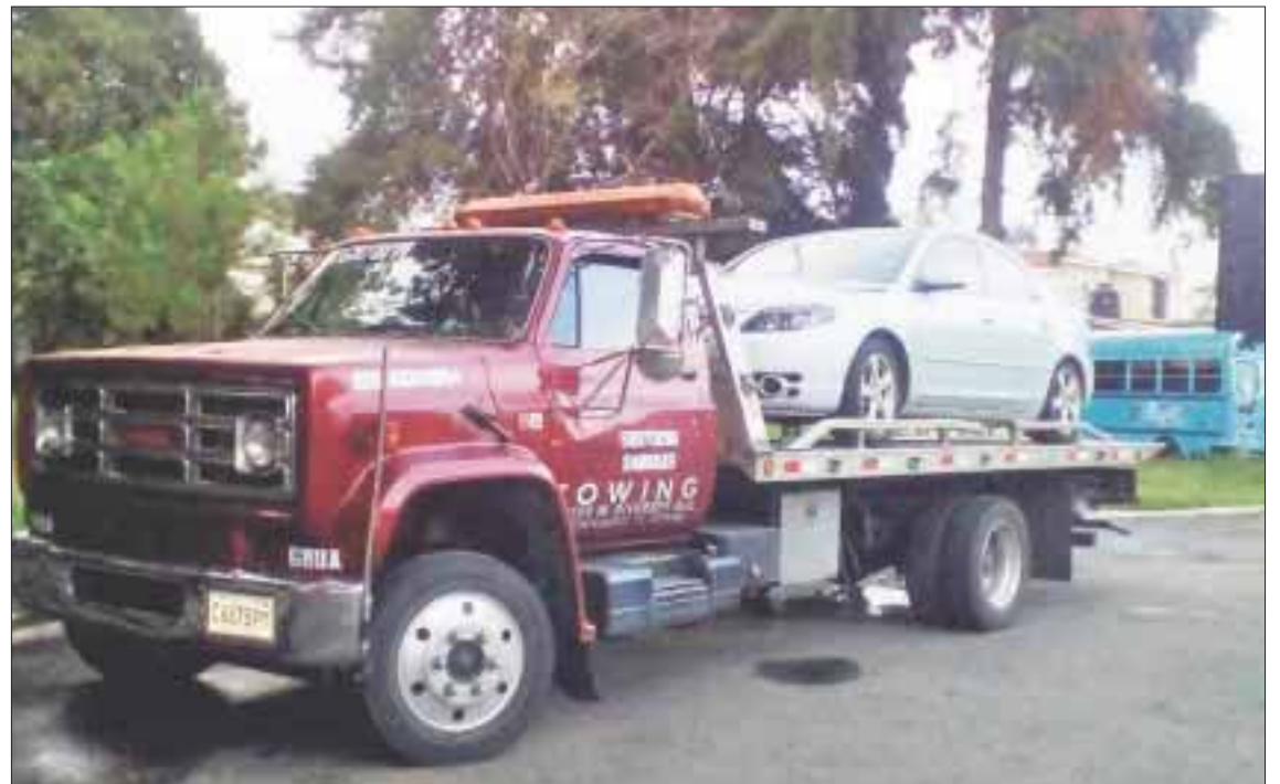
La propuesta de los regidores es derogar el Reglamento de Tránsito del municipio de modo que no pueda contravenir la legislación federal y estatal.