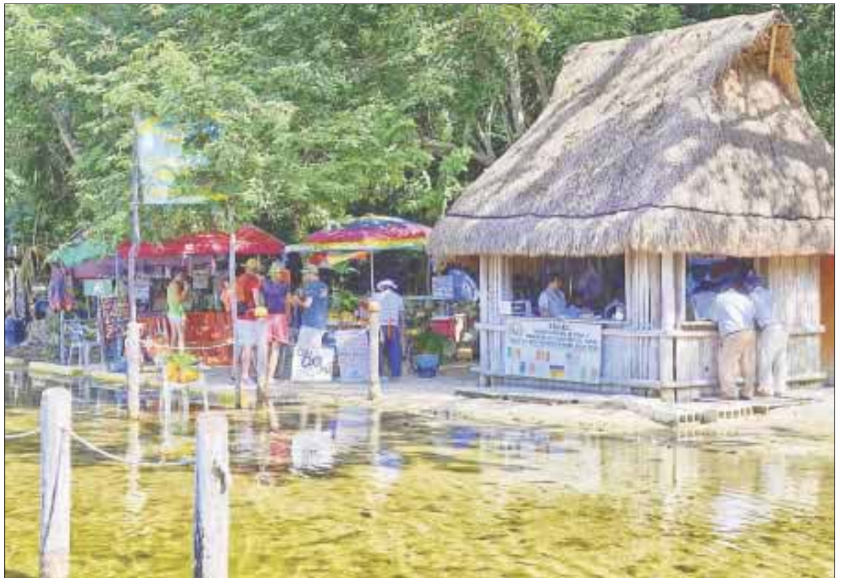
Se busca consolidar un desarrollo turístico incluyente que beneficie a los habitantes de la región maya.

De esta forma, la Secretaría de Turismo diseña y trabaja diversas acciones para consolidar la oferta existente e integrar la participación de los sectores público y privado, al igual que las comunidades locales.