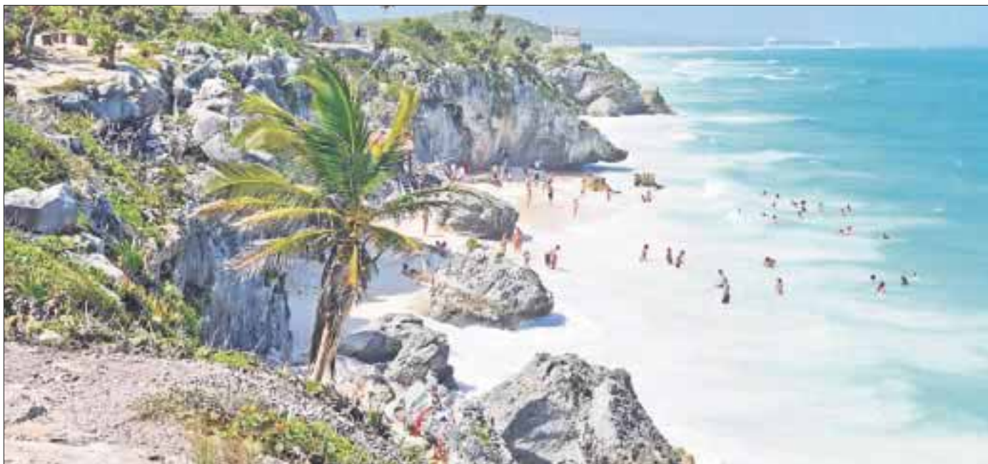
Las dificultades financieras de Cancún y la Riviera Maya se superarán en este cierre de año, en el que presumen tener una derrama económica superior a otras.

Cancún.- Las dificultades financieras que padecen algunos hoteleros en Cancún y la Riviera Maya se superarán en este cierre de año, en el que presumen tener una derrama económica superior a otras temporadas, ante la diversidad de opciones y promoción turística que se tienen en la industria.