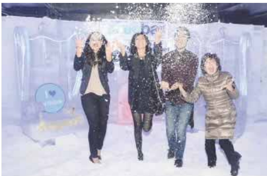
Una presentación en pleno invierno. (Foto: Jaime Arroyo Olín).

El Festival del Agave es gastronómico y cultural organizado por la Secretaría de Turismo del estado de Guanajuato, que tiene por objetivo contribuir al desarrollo y la pro-