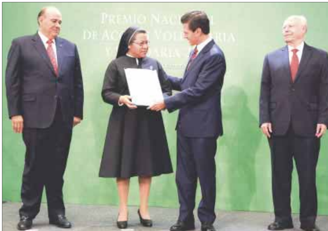
El presidente Enrique Peña Nieto entregó el Premio Nacional de Acción Voluntaria y Solidaria 2016.

El mandatario federal recalcó que para lograr cambios y las grandes transformaciones, una sociedad con mayor desarrollo y mayores oportunidades para sus integrantes, no se debe esperar a que lleguen por sí solos “o que alguien los haga por nosotros”