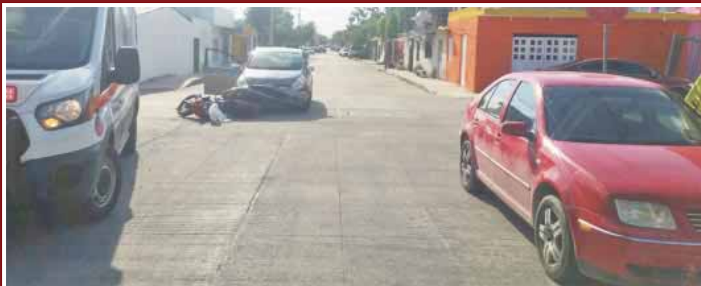
La mujer cafre, que viajaba en un auto Nissan Tidda, no cedió el paso a los motociclistas recién casados.