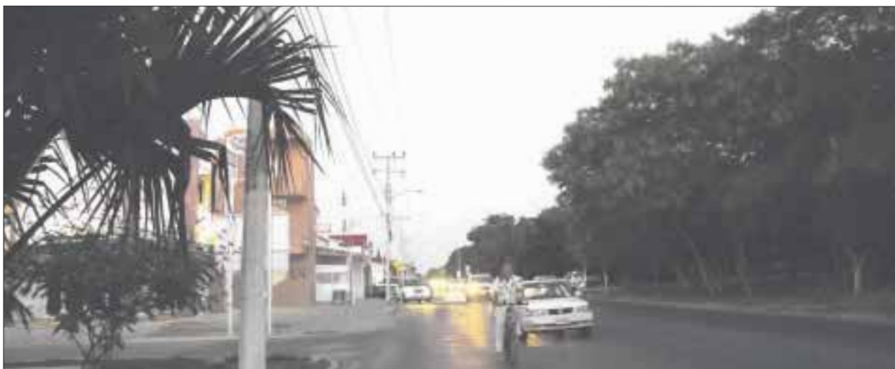
Los gerentes y dueños de locales en la zona, señalan que podría ser una falla en el encendido automático de las lámparas.

Cancún.- Debido a una serie de fallas en el alumbrado público sobre la avenida Carlos Castillo Peraza, popularmente conocida como “avenida Cancún”, en los negocios de la zona se han registrado varios robos, dieron a conocer los comerciantes de la región 510.