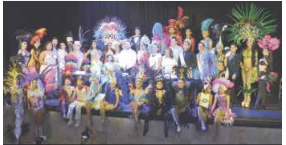
En el teatro 8 de Octubre se dio a conocer que la celebración se realizará en las avenidas Tulum y Bonampak.

CARNAVAL 2017 NO LUCIRÁ, SERÁ AUSTERO Cozumel.- Como lo prometió la