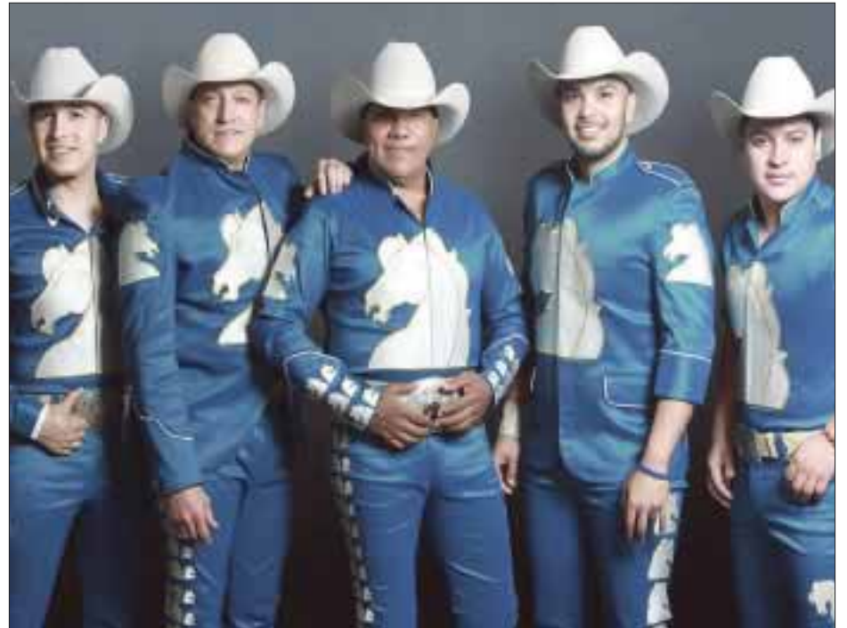
El Vive Latino 2017 se realizará los días 18 y 19 de marzo en el Foro Sol y en esta ocasión estará Bronco. Los boletos ya se encuentran a la venta, a través del Sistema Ticketmaster.

A su vez, Murguía que se queda en el lugar de Memo del Bosque dijo que se respetaría el trabajo de su antecesor "lo que está bien hecho no necesita ser modificado, si implementaremos un plan de trabajo y varios proyectos nuevos, pero de momento no podemos adelantar mucho, necesitamos sentarnos a platicar y en su momento ofreceríamos otra conferencia para anunciar esos detalles", concluyó.