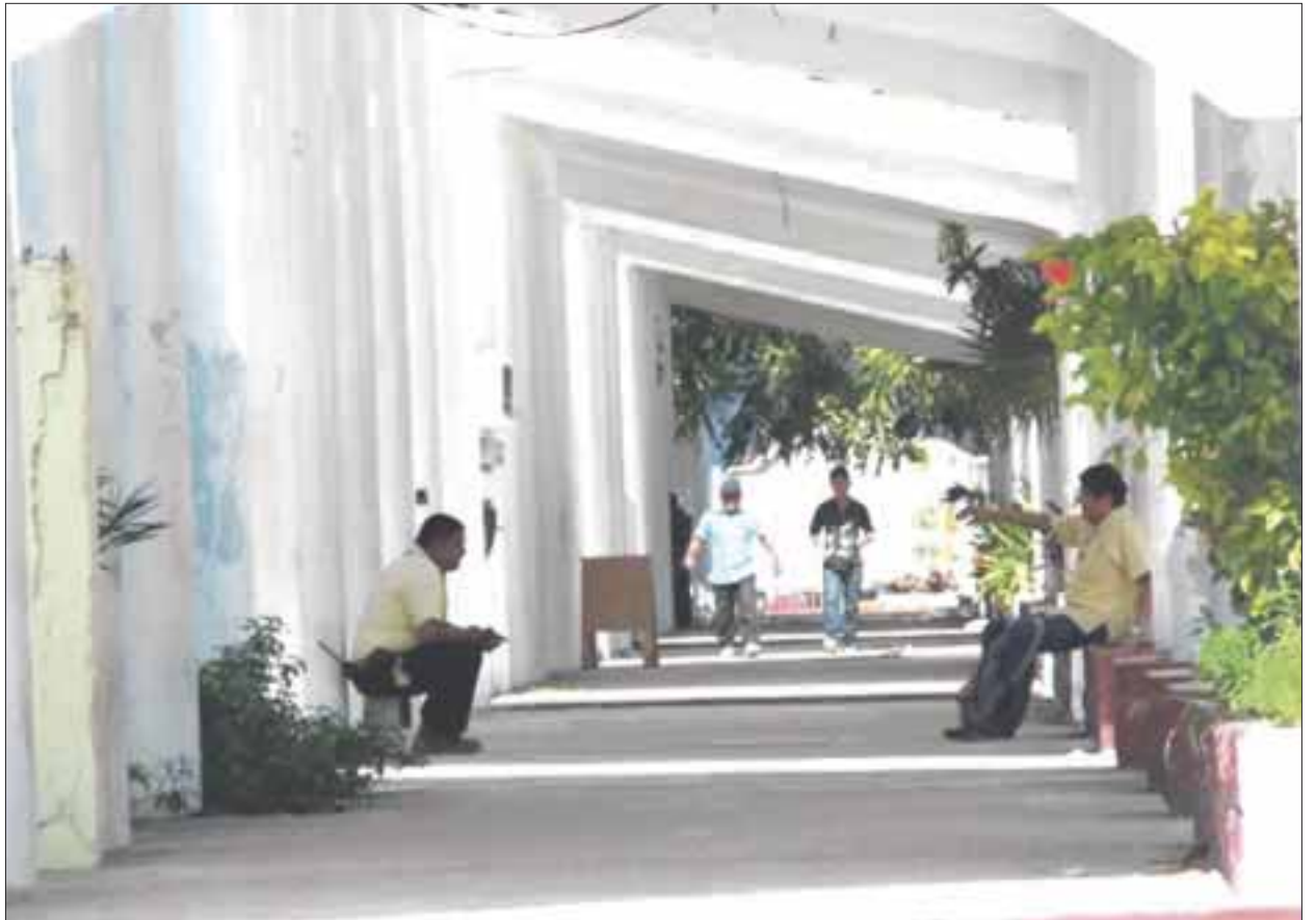
La inseguridad en la zona de Puerto Juárez preocupa a los pobladores ante la falta de vigilancia.

Los intentos de robo y sustracción de joyas, aparatos electrónicos durante la noche y tarde, están a la orden del día, ya que los ladrones estudian primero la zona y esperan a que no esté nadie en la vivienda para entrar, tanto a la zona residencial, como a la popular en donde incluso hasta los tenis le quitan a los jóvenes.