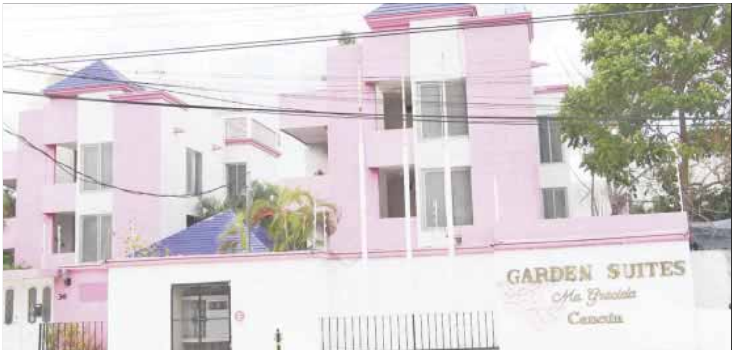
La Policía le pisa los talones a una banda de secuestradores virtuales que tienen tecnología de la misma cárcel, desde donde se comunican a distintos domicilios.

Extraoficialmente se supo que la familia sí pagó el rescate por ambas víctimas; sin embargo, la Fiscalía General del Estado negó que se haya dado el pago, aunque aceptó que los secuestrados no eran uno sino en realidad dos individuos.