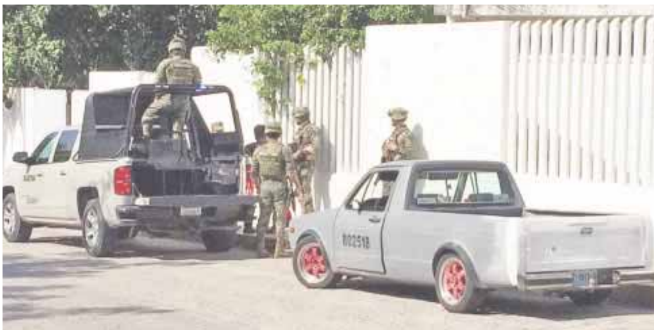
Una camioneta "hechiza" que se encuentra rotulada como las que usa la Marina, fue retenida por elementos de Ejército mexicano.

Cancún.- Una camioneta pintada de manera "hechiza" muy similar a las que usan los marinos, fue detenida ayer junto con sus tripulantes en la avenida García de la Torre, en la supermanzana 01, justo frente al plantel Conalep 01.