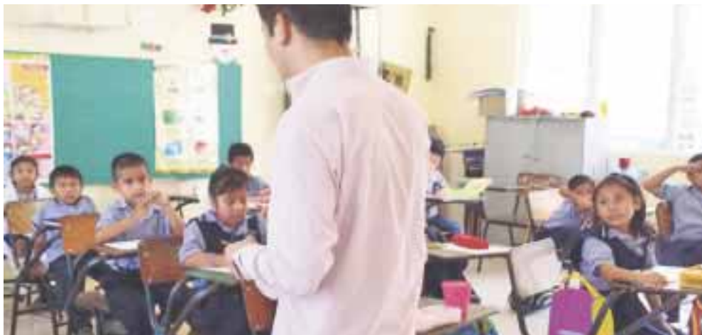
Se entregaron libros de texto y cuadernos de trabajo, a fin de que los padres sean coadyuvantes en las acciones en beneficio de los alumnos.

Cancún.- Se benefició a 75 escuelas de tiempo completo, como parte del Programa Nacional de Convivencia Social, a quienes se les entregaron los libros de texto y cuadernos de trabajo, a fin de ser coadyuvantes en las acciones de beneficio de los alumnos y erradicar el acoso escolar o bullying .