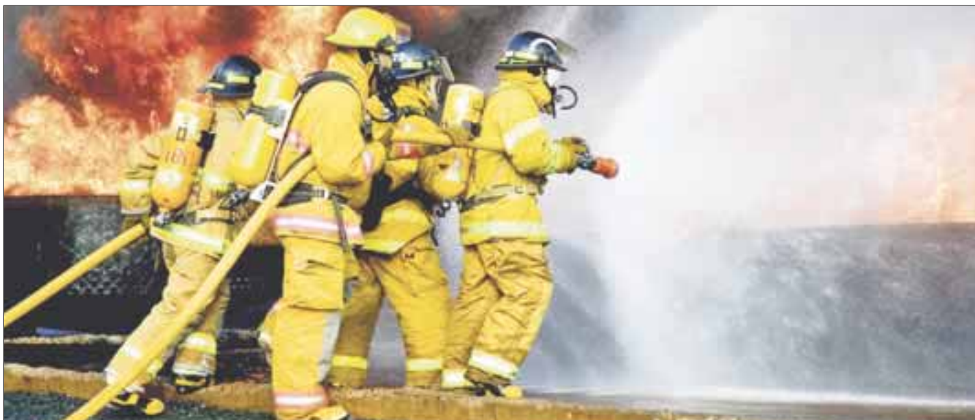
Entrega el consulado de Alemania la donación de 60 mil pesos al Cuerpo de Bomberos de Benito Juárez.