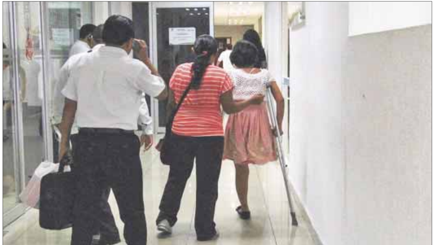
Durante nueve meses esta joven ha buscado justicia en el Ministerio Público, pero su caso se encuentra traspapelado.

De esta manera, la joven desistió de continuar su relato, aunque en un cuaderno personal de ella, escribió los números telefónicos de varios reporteros, pues dijo que sospecha que su esposo “negoció” con el ex funcionario municipal.