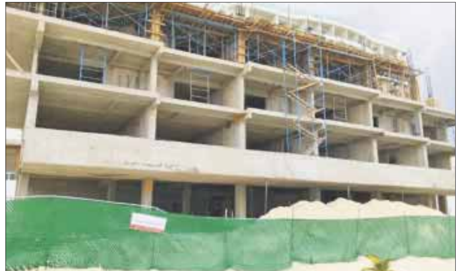
Existen sobre la actuación de funcionarios de la delegación Quintana Roo de la Profepa.

La PGR tiene ahora la facultad de investigar si se están cometiendo actos ilegales o no; nosotros estamos presentando los elementos que consideramos probatorios de las irregularidades cometidas