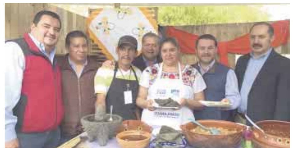
En la inauguración del Festival del Agave.