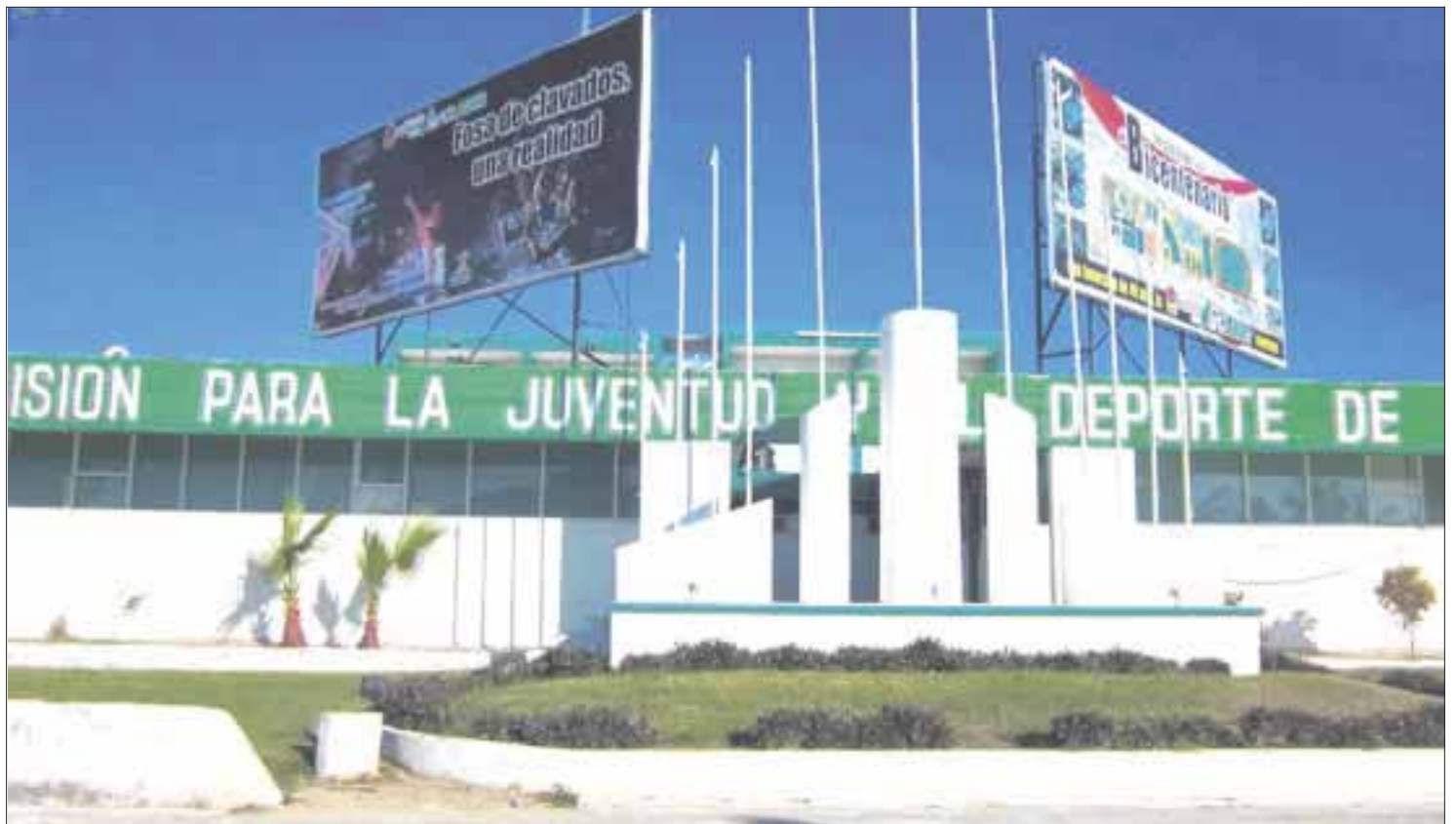
Fue saqueado el edificio de la Comisión para la Juventud y el Deporte con dedicatoria a impedir que la selección de tiro asista a la Olimpiada Nacional Juvenil.

Los cuerpos policiacos ya realizan las investigaciones pertinentes, por lo que entrevistan a varias personas que pudieron haber sido testigos del robo para localizar a los posibles delinquentes que pueden ser miembros de las bandas reconocidas en Barrio Bravo, zona cercana a la Cojudeq.