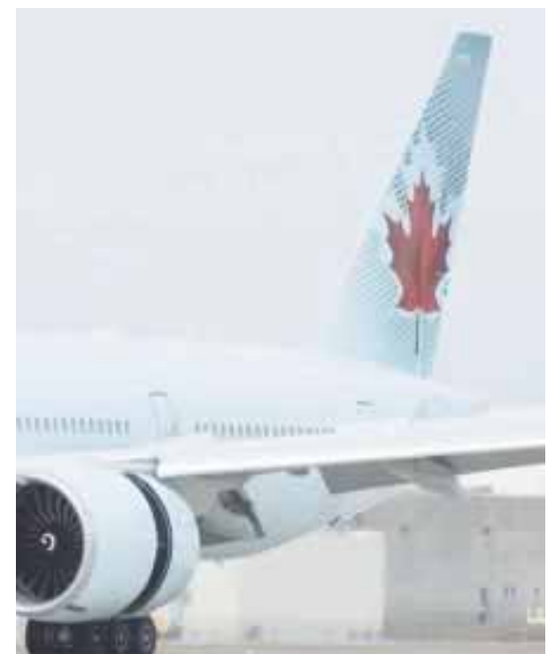
Ganadora de premios.