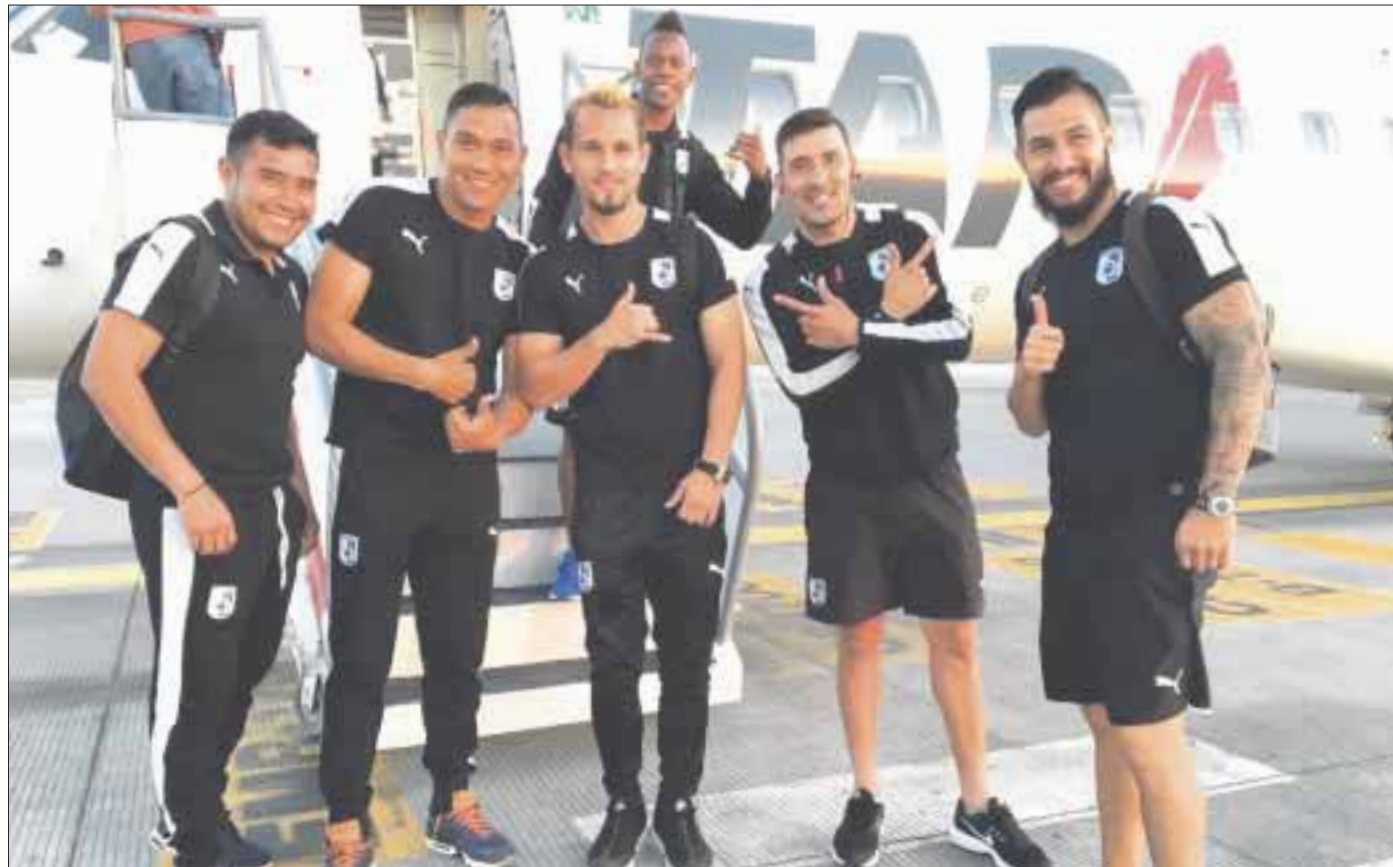
El superlíder ya se encuentra en Cancún, donde pasarán diez días de actividad de playa, incluyendo un duelo amistoso con los Potros del Atlante.

Se prevé que la escuadra queretana sostenga un partido amistoso con los potros del Atlante, aunque ese tema se resolvería la próxima semana que reporten los atlantistas.