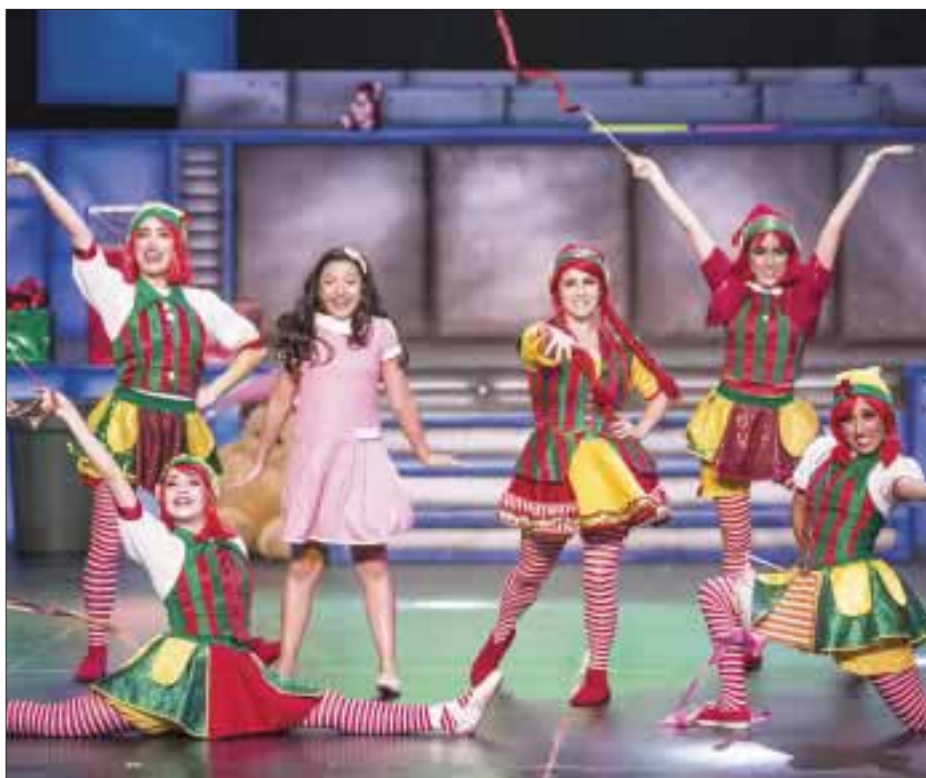
El momento cumbre es cuando Santa Claus invita a chicos y grandes a ponerse de pie y con una mano en el corazón adquirir el compromiso de cuidar el planeta.

La obra se presentará en el Centro Cultural Teatro 1 a partir de hoy viernes 9 de diciembre y concluirá el 11 del mismo mes.