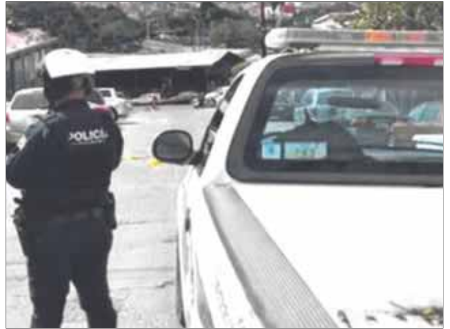
Los sicarios dejaron regados a siete hombres en distintos sitios del municipio fronterizo de Tijuana.

El ejido Lázaro Cárdenas, perteneciente a la Delegación de San Antonio de los Buenos, ha sido el lugar favorito para regar cadáveres. Aquí los vecinos cuando ven un bulto en bolsa negra de inmediato lo reportan a la Policía