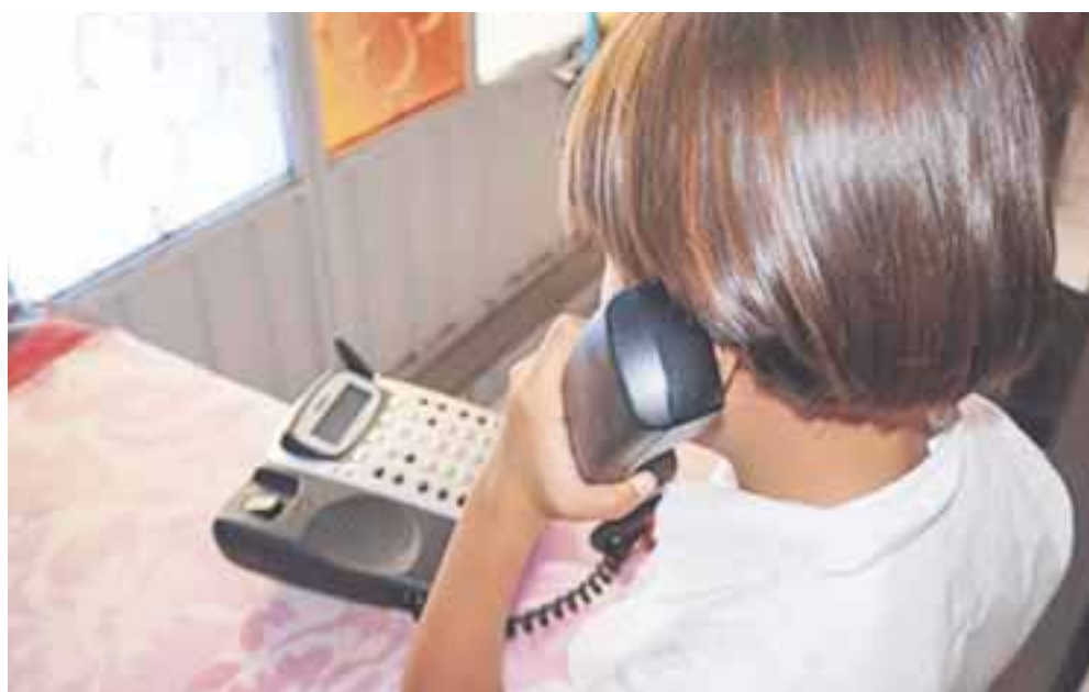
La mitad de las llamadas de extorsión se realizan entre las 12:00 y las 18:00 horas, advierten autoridades.

La Secretaría de Gobernación alertó sobre el incremento de la extorsión telefónica y el secuestro virtual en esta época del año, por lo que pide a la ciudadanía estar alerta e informada.