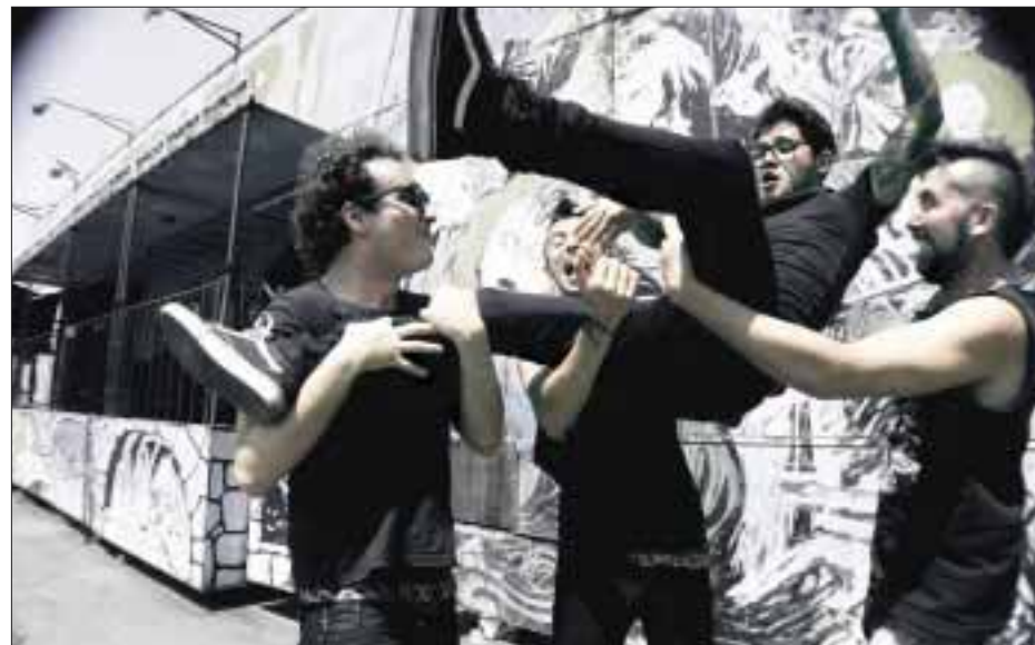
De Nalgas lanza el disco "Vulgar dulce hogar".

Los conciertos confirmados para "90's Pop Tour" son, hasta el momento, el 24 de marzo (Monterrey), 25 del mismo mes en Guadalajara y el 31 en la Arena Ciudad de México. A principios de mayo estarán en la Feria de San Marcos, en Aguascalientes y quizá en otras ciudades del país.