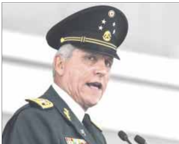
El secretario de la Defensa, Salvador Cienfuegos Zepeda, dijo que la violencia no se resolverá a balazos.

Ante la falta de apoyos de muchos sectores de la sociedad para abatir la delincuencia e inseguridad, el secretario de la Defensa Nacional, Salvador Cienfuegos Zepeda alzó la voz: “los militares no estudian para perseguir delincuentes, por lo que deben regresar a los cuarteles y realizar las tareas que les corresponden”.