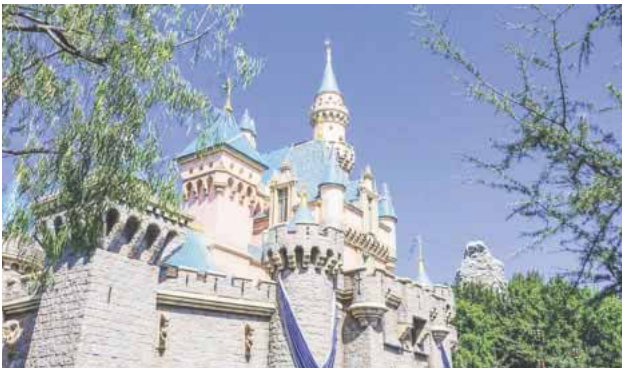
Disneyland Resort y las maravillas invernales.

☆☆☆☆☆ Disneyland Resort se convierte en el país de las maravillas invernales en esta temporada. Las atracciones clásicas son revitalizadas. El castillo de la Bella Durmiente, capas de nieve cubren la torre del recinto mágico y 80,000 luces brillan por doquier.