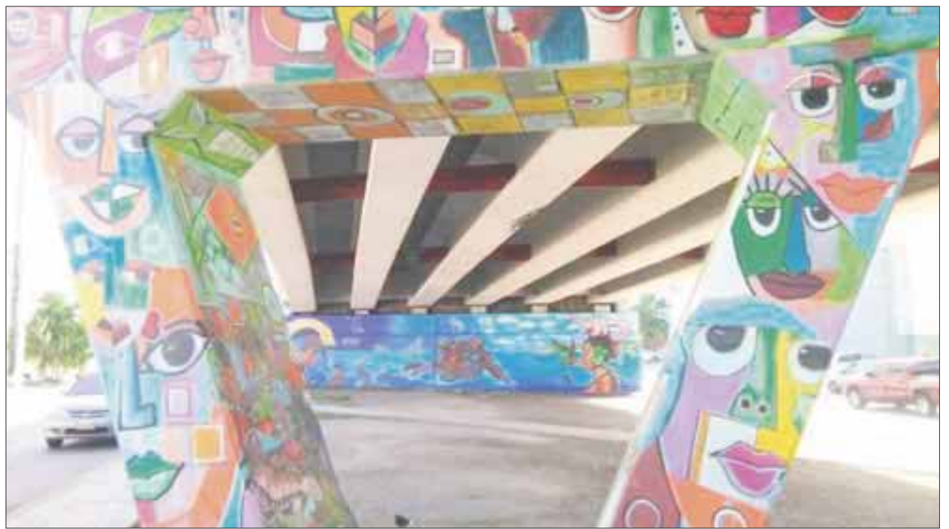
La población de la Lombardo Toledano y Donceles 28 recrimina la falta de vigilancia en la zona.

Ante dicho panorama el reclamo a las autoridades es que envíen más vigilancia a la zona ya que a pesar de que los ciudadanos pagan sus impuestos, ahora tienen que tomar la ley en su mano, a través de vecinos vigilantes que en un chat se comunican en caso de que un ladrón visite en sus hogares durante su ausencia.