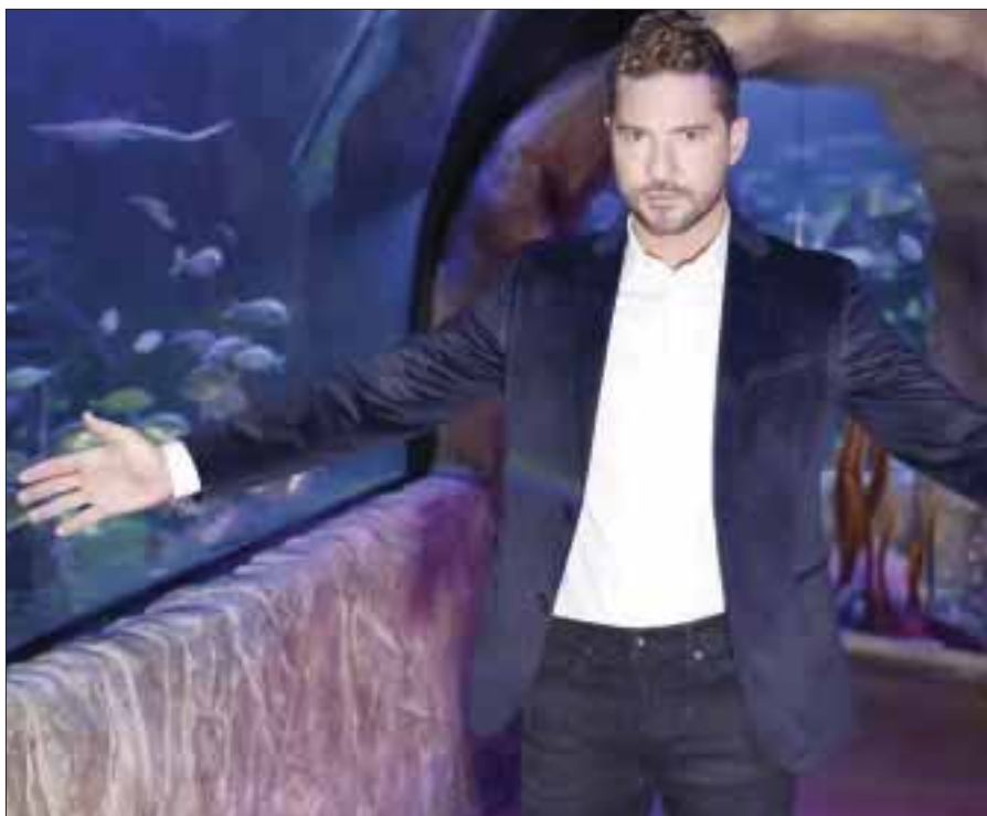
David Bisbal anunció que en 2017 emprenderá una gira mundial que pasará por México.