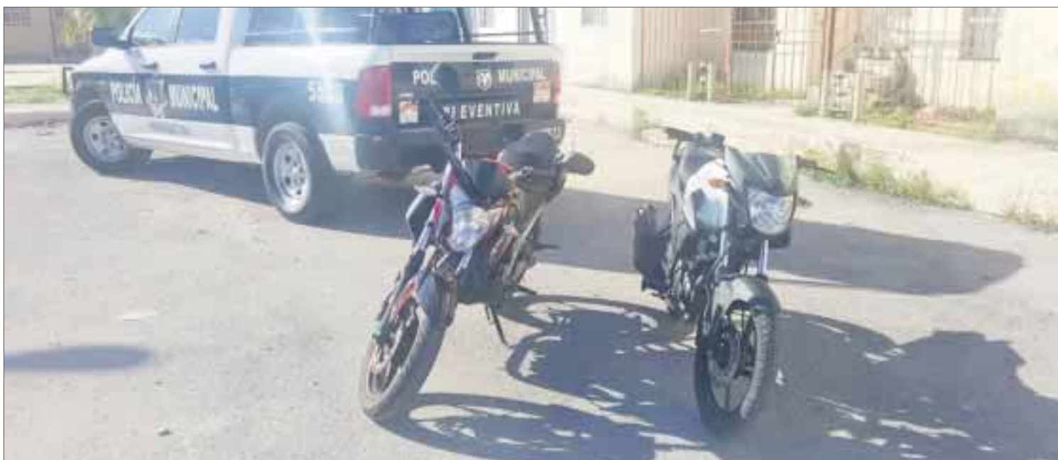
Los rufianes fueron reportados como sospechosos por vecinos de Villas Otoch Paraíso.

Cancún.- Cinco sujetos que aparentemente se encontraban fumando marihuana en una de las calles de la región 259, fraccionamiento Villas Otoch Paraíso, fueron detenidos y junto con ellos dos motos que cuentan con reporte de robo.