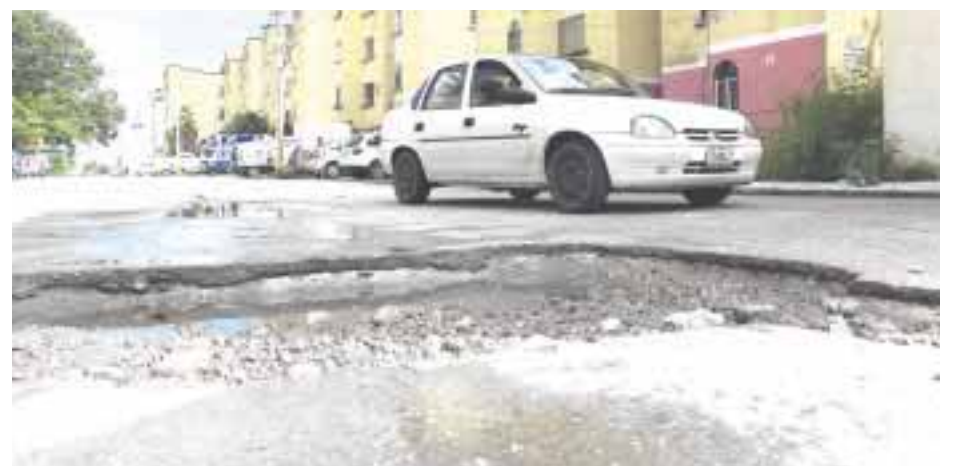
Este bache que abarca más de la mitad de la calle 2, sólo es uno de los varios que aquejan a los habitantes de Galaxias Isla Plus.

Cancún es muy simple: Vienen y aplican una pequeña capa que se deteriora con el paso de los carros y con las lluvias. Luego vuelven a venir y se vuelve a bachear y así es. Un círculo que deja dinero a unos cuantos” expresó el vecino inconforme.