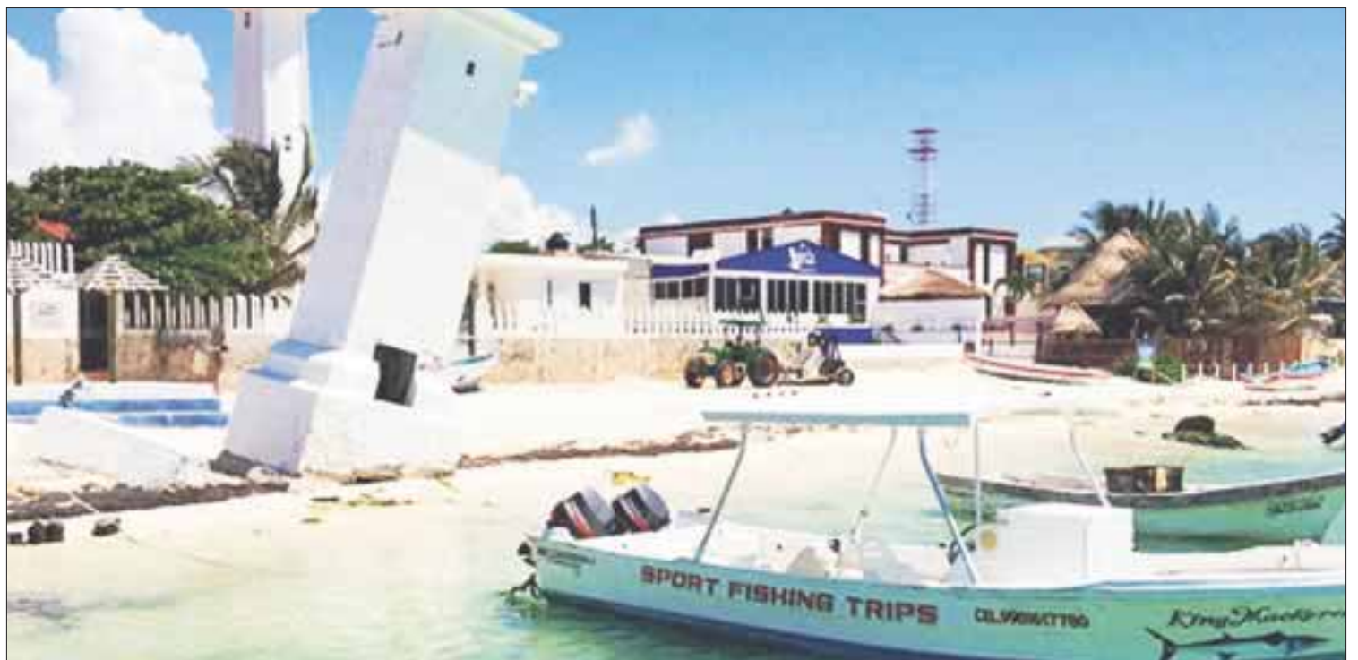
El gobierno de Puerto Morelos ofrece todo su respaldo a las autoridades judiciales para la investigación del caso.

Expresó que quienes intenten trastocar la tranquilidad que ha caracterizado a esta tierra, no tendrán cabida en Puerto Morelos, por lo que reiteró que se reforzará la seguridad en colonias, fraccionamientos, zona turística y las comunidades de Central Vallarta y Leona Vicario.