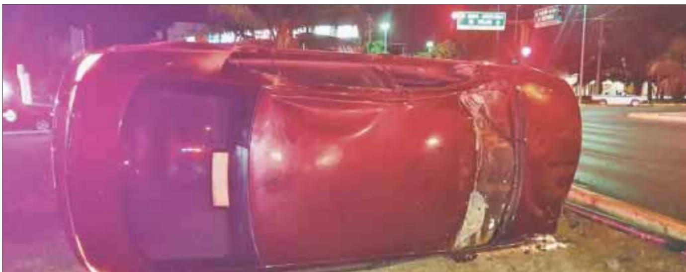
Una mujer volcó su automóvil en el cruce de las avenidas Cobá y Bonampak.

Cancún.- Alrededor de las 2:45 de la madrugada de ayer, el número de emergencias 911 fue alertado sobre la volcadura del auto de una fémina en la confluencia de las avenidas Cobá y Bonampak, justo frente al kilómetro cero.