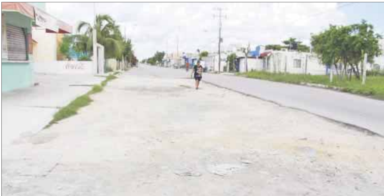
De esta forma se encuentra la avenida que divide a los fraccionamiento Petén e Izamal, en la región 211.

Cancún.- Habitantes de la región 211 no se explican los motivos por los que trabajadores del ayuntamiento dejaron inconclusa una parte de la avenida Izamal, la cual divide al fraccionamiento Izamal y El Petén.