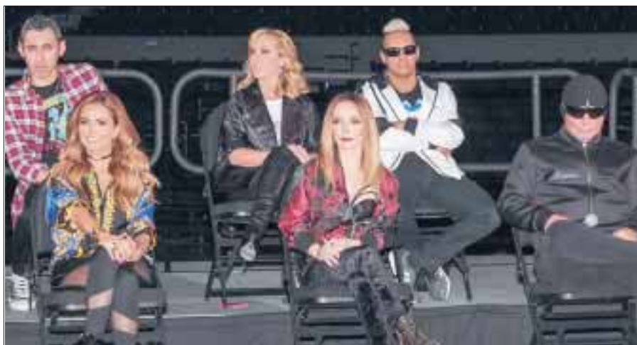
Los conciertos confirmados para "90's Pop Tour" son, hasta el momento, el 24 de marzo (Monterrey), 25 del mismo mes en Guadalajara y el 31 en la Arena Ciudad de México.