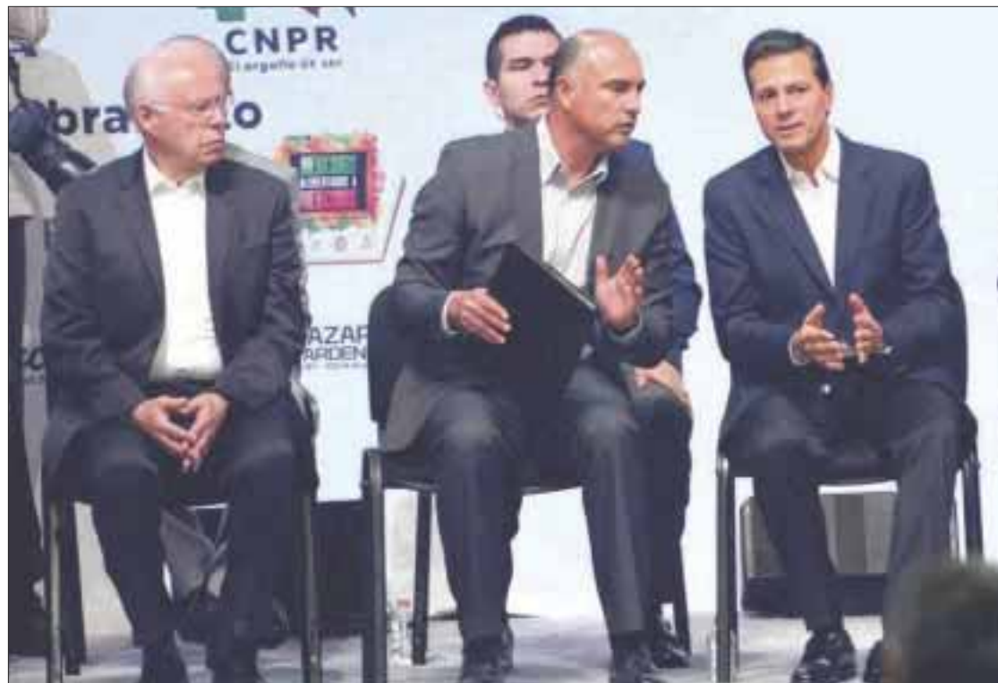
Enrique Peña Nieto, acompañado por los secretarios José Calzada Roviroso y José Narro Robles, inauguró la Expo México Alimentaria 2016 Food Show.

Como ejemplo del crecimiento del mercado agroalimentario expuso que después de 80 años el aguacate mexi-