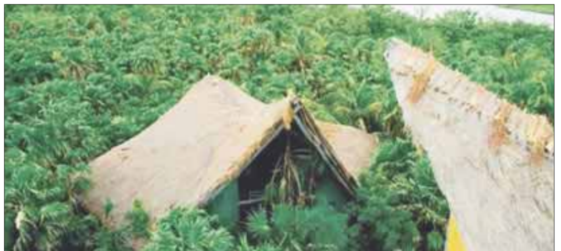
Ante representantes de los países que participan en la COP13 del Convenio sobre Diversidad Biológica (CBD), se expusieron los avances logrados a la fecha.

Además de las Áreas Naturales Protegidas existen otras cinco modalidades de conservación que se suman a los 20.9 millones para tener una superficie total protegida de 31.2 millones de hectáreas y que representa el 15.91 por ciento de la superficie continental e insular.