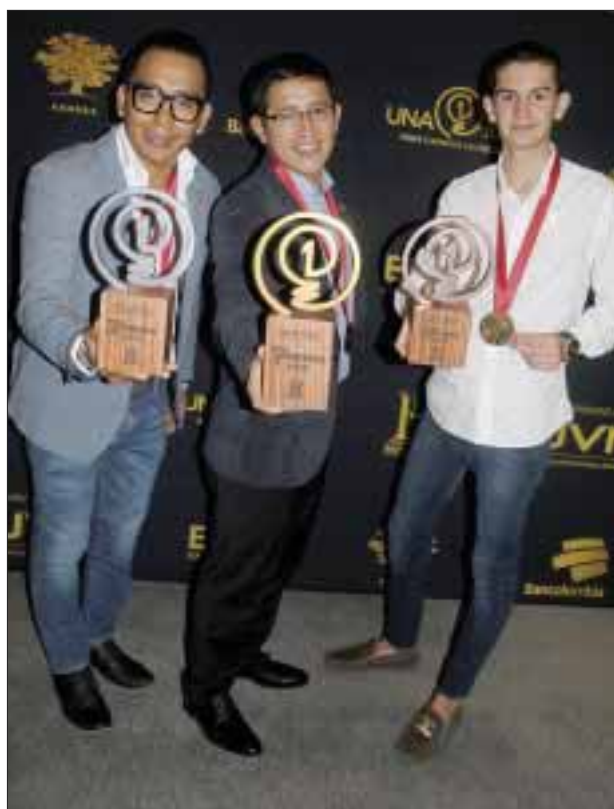
Los ganadores de “Una idea para cambiar la historia”, recibieron un estímulo económico para desarrollar sus ideas, pero sobre todo lograron tener acercamiento con instituciones del gobierno y privadas que pueden ayudar a lograr el objetivo de este concurso que es realmente cambiar el rumbo de la historia de alguna manera.

Los Amigos Invisibles tocarán nuevamente este 15 de diciembre en el Plaza Condesa, en donde ofrecerán un concierto lleno de buen acid jazz, funk y diversos ritmos latinos.