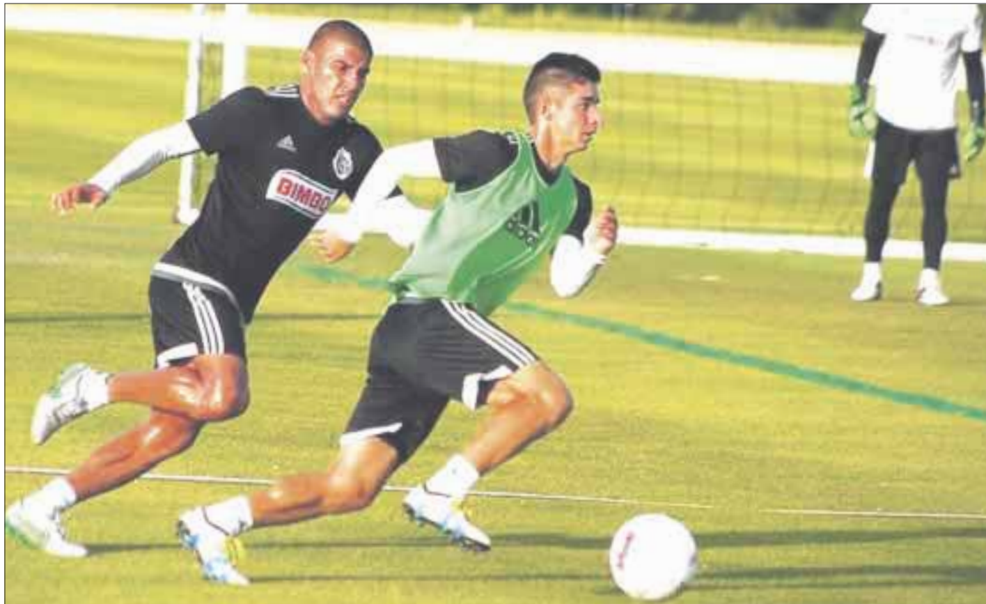
Chivas estará en Cancún hasta un día antes de la Noche Buena, para poder sostener un duelo amistoso con Atlante y el Monterrey.

Cabe destacar que Chivas sostendrá partidos amistosos en Cancún, pues ya tienen uno pactado ante Rayados de Monterrey el próximo día veinte en el estadio de los potros, retornarán a Guadalajara un día antes de las fiestas navideñas.