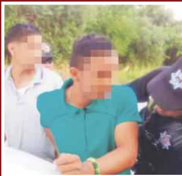
Los dos individuos detenidos hacían un reparto a pedido que era guiado vía celular por quien se encarga del cobro de la droga.