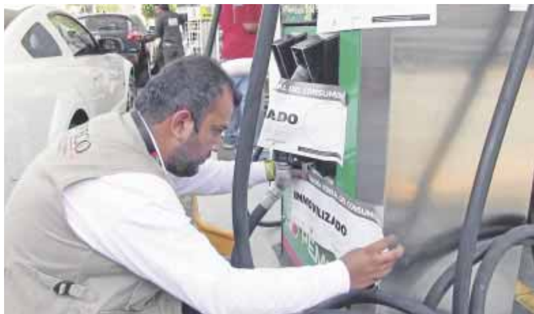
Con liberalización del precio de gasolina a partir de enero de 2017, la Profeco extenderá su vigilancia.

La Procuraduría Federal del Consumidor (Profeco) aplicó multas por 316 millones de pesos a gasolineras en el país este año y anunció que para 2017 se desarrollará una nueva forma de denuncia a través de una aplicación para empoderar al consumidor, en el marco de la llegada de nuevas marcas.