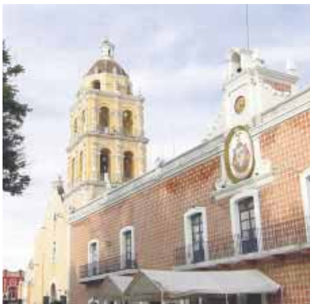
Parroquia de la Natividad y Palacio Municipal de Atlixco, Puebla.

Las casetas por las que pasarás serán la de San Marcos, San Martín y Vía Atlxcáyotl con un gasto de 176 pesos. Tiempo en llegar desde la Ciudad de México: 1 hora 50 minutos. Distancia aproximada: 150 kilómetros.