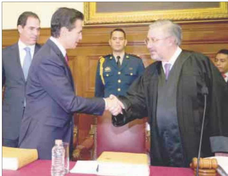
Enrique Peña Nieto asistió al informe de labores del presidente de la SCJN, Luis María Aguilar Morales.

No obstante aclaró que, pese a lo que señalen la opinión pública o los medios, nadie es culpable sino hasta que así se demuestre, siguiendo el debido proceso legal y hasta que exista sentencia firme, inmodificable de un juez competente que así lo determine. Hizo un llamado a evitar la confrontación y trabajar en unidad. “No podemos, no debemos estar enfrentados. Hay que estar juntos, trabajar en equipo conforme a las responsabilidades propias de cada uno.