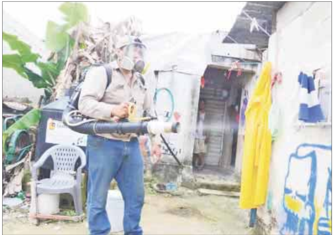
Efraín Lizama Ávila, secretario de Salud, explicó que los brotes de paludismo están aislados y sólo se registraron en la Ribera del Río Hondo.

Agregó que el “anófeles” es un mosquito que no vive en la zona hotelera, sino en zonas pantanosas y la selva, pero lo cierto es que en Puerto Morelos hay cinco casos más los de las comunidades de Bacalar y 16 en la Ribera del Río Hondo