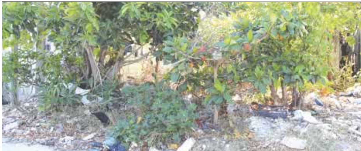
Este lote que lleva abandonado desde hace diez años, es un problema de salud pública para los vecinos de la región 96.

Cancún.- Los vecinos de la región 96 manzana 138 lote 10 ya no saben qué hacer con un lote abandonado desde hace diez años, convertido en nido de delincuentes y criadero de fauna nociva.