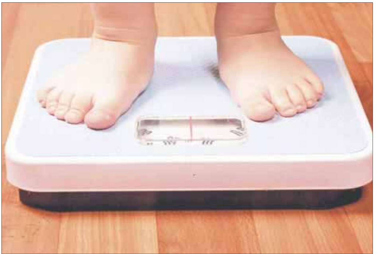
Los hábitos alimenticios y la poca o nula actividad física originan que los niños presenten sobrepeso y obesidad en etapas tempranas.

Se recomienda cambiar la alimentación hipercalórica que se les da a los niños, vigilar las porciones, evitar el consumo de bebidas azucaradas, evitar la ingesta de sal; se deben incluir alimentos de todos los grupos de alimentos basándose en el Plato del Bien Comer, consumir frutas y verduras, servirles a los niños en platos pequeños y aumentar la actividad física en lapsos de entre 30 y 45 minutos diarios.