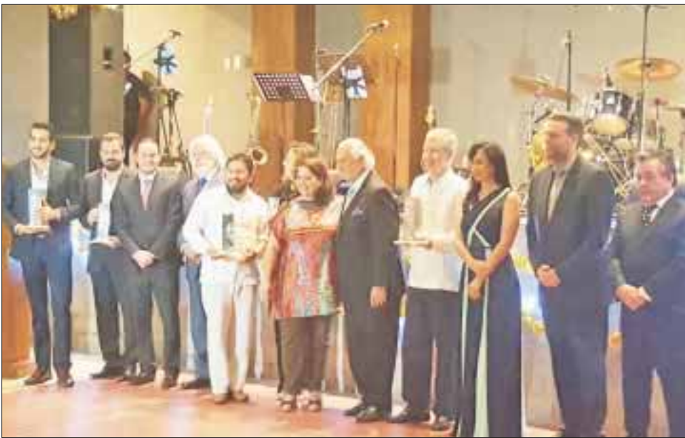
Es la segunda ocasión en que la Asociación de Hoteles de Cancún y Puerto Morelos reconocen a al ramo turístico que destaca por su infraestructura y aportes al ramo.

México cuenta con 181 Áreas Naturales Protegidas que abarcan 90 millones de hectáreas destinadas a la conservación de la biodiversidad, de las cuales más de 69 millones de hectáreas son zonas marinas (22.5 por ciento) y 20.9 millones zonas terrestres (10.68 por ciento)