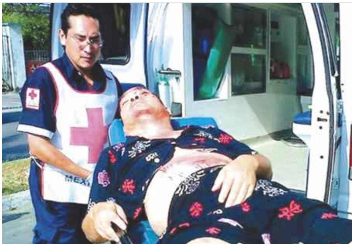
En secuestro la sentencia puede ser de 50 a 90 años de prisión, por lo que está pugnando por que se aplique la penalidad máxima.

La titular de la Fiscalía General del Estado detalló que tras la audiencia realizada en los tribunales de juicio oral, el Juez estableció, además del auto de vinculación a proceso en contra de Alexander G.H., un lapso de prisión oficiosa de dos años y seis meses para el cierre de la investigación complementaria.