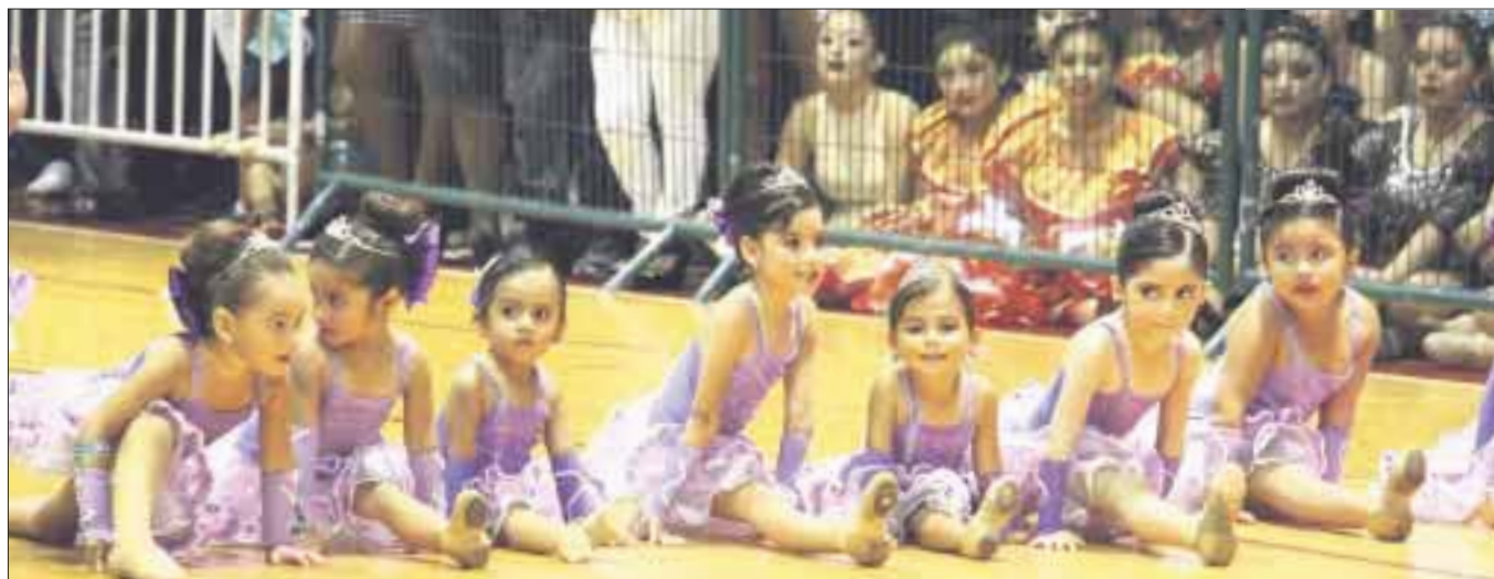
La academia municipal de gimnastas cerrará sus actividades con su festival anual, donde más de cien alumnos se darán cita el próximo lunes.

Cancún.- Como cada año, las pequeñas alumnas de la Escuela de Gimnasia "Kuchil Baxal", harán gala de lo aprendido durante este año, luego de tomar parte en su tradicional "Festival Navideño", que enmarca el cierre de actividades de la academia en este 2016.