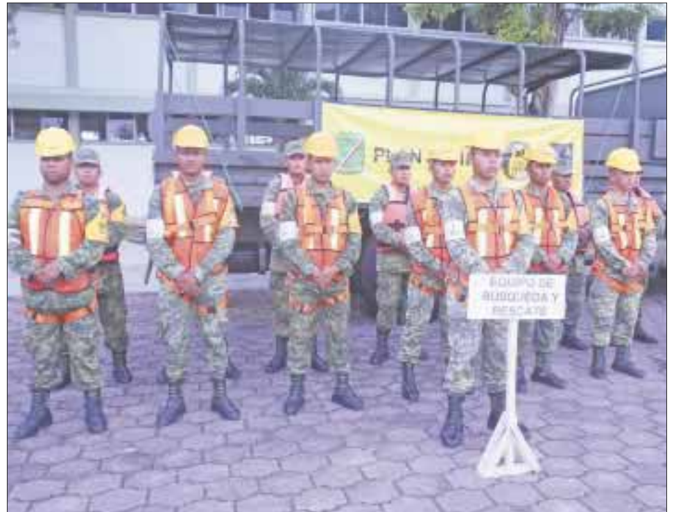
La 10 Región Militar mostró la modernización del equipo con el que se puede hacer frente a un fenómeno hidrometeorológico.

La maquinaria pesada consta de un bulldozer 750 Jhon Deere, de fabricación estadounidense, que sirve para remover escombros en áreas afectadas, cuenta con un tanque de 300 litros de diésel, puede trabajar las 24 horas. La planta purificadora de agua tiene capacidad de suministrar mil litros por hora, la usan en el Plan DN- III-E en casos de desastre para atender a la población civil, cuenta con un tanque de mil 200 litros. El equipo de rescate su función es buscar a personas heridas para atenderlas al ser evacuadas, cuentan con perros pastor alemán y pastor belga. El equipo de seguridad es para cuidar a las personas en sus bienes, hacen reconocimientos y evitan el saqueo, pillaje y el robo, bloquean calles para evitar desastres mayores, sobre todo con cables de electricidad. El equipo de albergues sirve para actuar en contingencias, llevan el registro de personas heridas en cuanto a sexo y edad y ofrecen donde quedarse a descansar porque tienen camas portátiles.