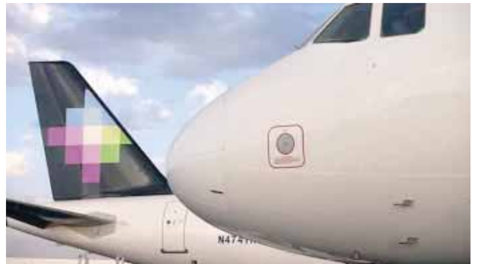
Dos nuevas rutas a partir del próximo año.

Para la ruta Guadalajara-Milwaukee, los boletos se pueden adquirir con una tarifa desde 119 dólares, y para la ruta Guadalajara-Huatulco desde 699 pesos. Ambas son por vuelo sencillo y con impuestos incluidos, gracias a la compra anticipada y al innovador esquema “Tú decides”, en la que puedes pagar por los ser-