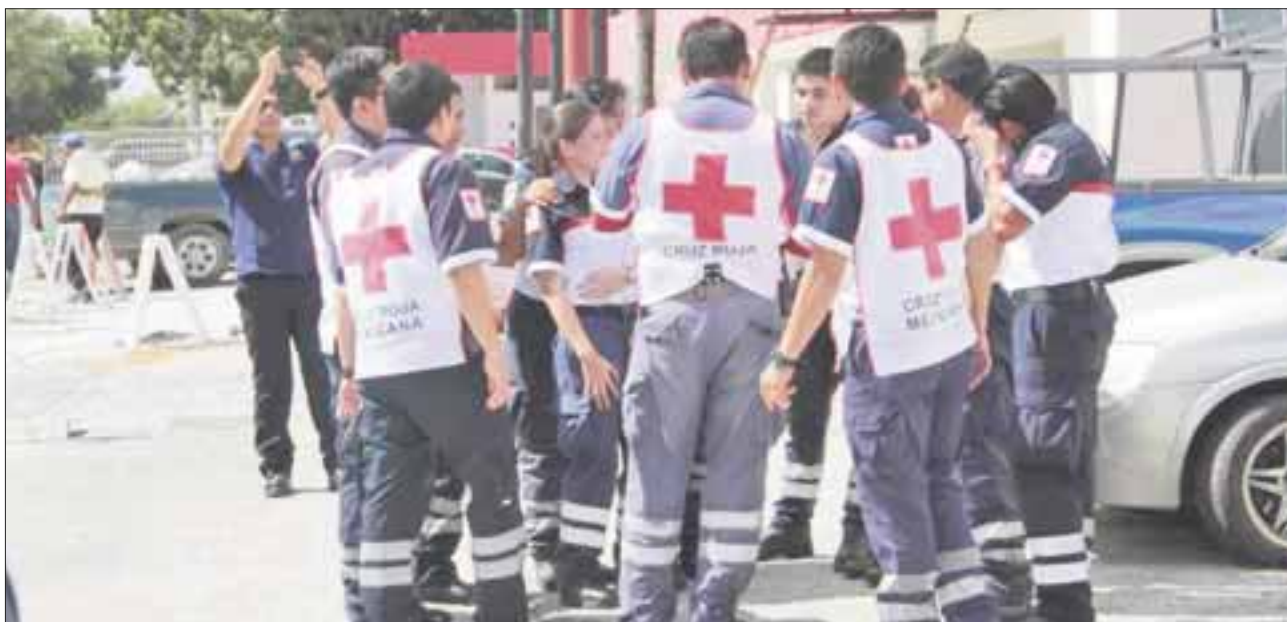
En la temporada vacacional la Cruz Roja es la instancia que atiende más llamadas de emergencia con 300 atenciones.

Cancún.- En la temporada vacacional, la Cruz Roja es la instancia que atiende más llamadas de emergencia (con 300 atenciones), que van desde prestar los servicios primarios a enfermos, hasta el rescate de una persona ahogada.