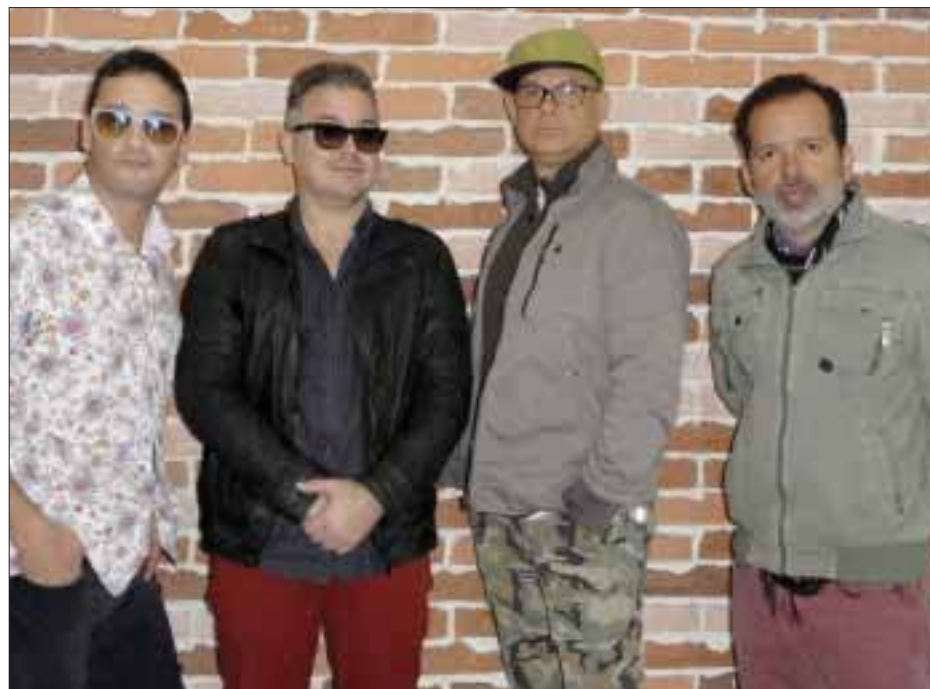
Los Amigos Invisibles estrenó el videoclip de Dame el mambo , el cual fue filmado en Guadalajara, Jalisco, y contó con la dirección de Rodrigo Robles Joseph.

Dentro de “El Paradise”, un lugar onírico, de placer y ensue-