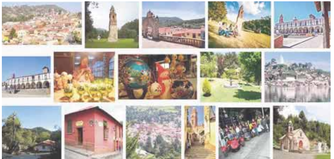
Tlalpujahua, Michoacán, lugar ideal para vacacionar.