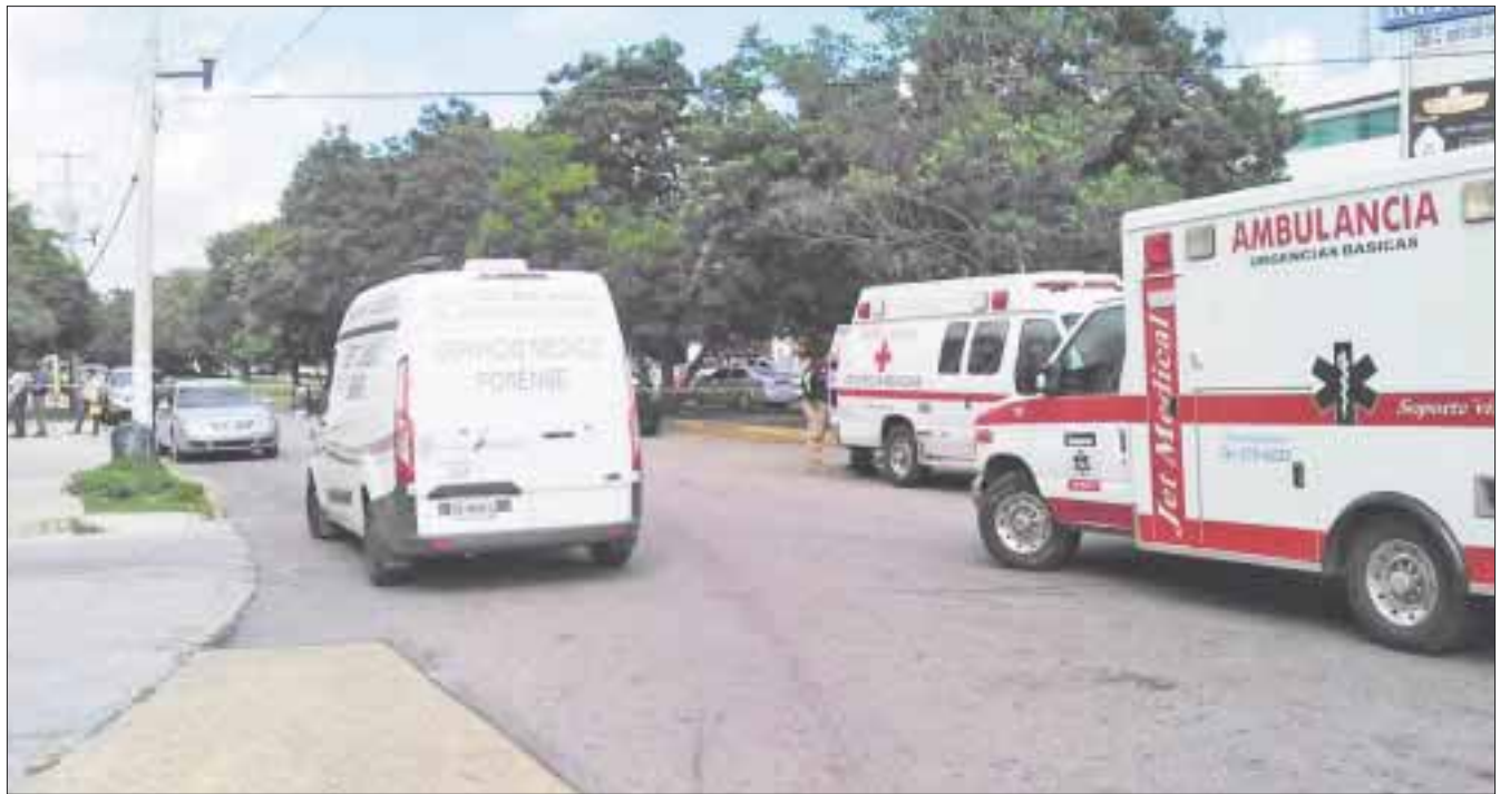
Los atracadores lograron un botín de 120 mil pesos, los cuales habían sido retirados minutos antes de una sucursal bancaria.

El agraviado dijo que arrojó el maletín adentro de la reja de las oficinas, con la intención de que los maleantes no se llevaran el dinero, pero esto los enojó, por lo que uno de ellos le disparó en la pierna.