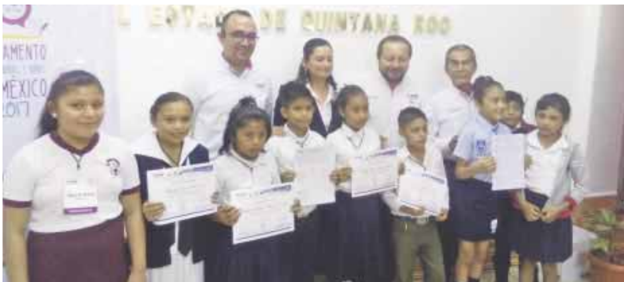
El Parlamento Infantil es un ejercicio para niños que ellos consideraron las mejores propuestas.

Cancún.- Concluyó la elección de los representantes infantiles que participarán en la Décimo Parlamento de los Niños que representan a los tres distritos electorales de Quintana Roo, informó el Instituto Nacional Electoral.