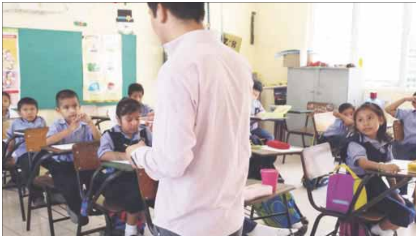
Más de 165 mil alumnos de nivel básico en el municipio de Benito Juárez, saldrán de vacaciones de forma escalonada.

Tener días efectivos para el sector escolar es la prioridad, de manera que para muchos los 20 días de vacaciones que tendrán les permitirá tener un respiro y divertirse de acuerdo a su edad ya que algunos se llevarán algunos trabajos de regularización en casa.