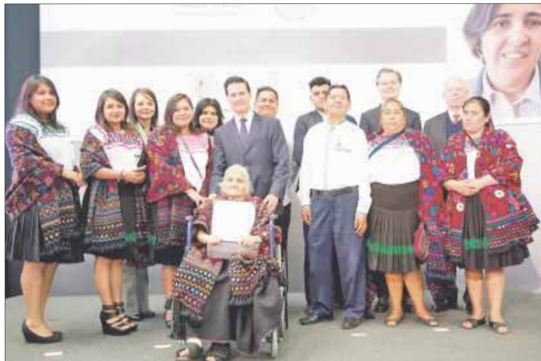
El presidente Enrique Peña Nieto entregó en Los Pinos el Premio Nacional de Ciencia, Artes y Literatura 2016.

Peña Nieto sostuvo que el progreso está ligado a la educación, y para ello, en 2017 se seguirá trabajando en el diseño de un nuevo modelo educativo acorde a los retos del nuevo siglo, y se realizará la actualización más profunda