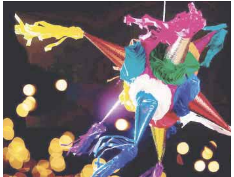
Visita los talleres de piñatas en Acolman.

Chignahuapan, Puebla (para comprar esferas). Este destino es ideal para comprar las esferas del tradicional árbol de Navidad, y lo mejor de todo es que está produciendo esferas durante todo el año y puedes conseguir esferas de todos los tamaños, colores y precios. Cuenta la leyenda que esta tradición de dominar el vidrio soplado, llegó a Chignahuapan de las familias michoacanas con Rafael Méndez , el fundador del primer taller de esferas de este poblado. Hoy día