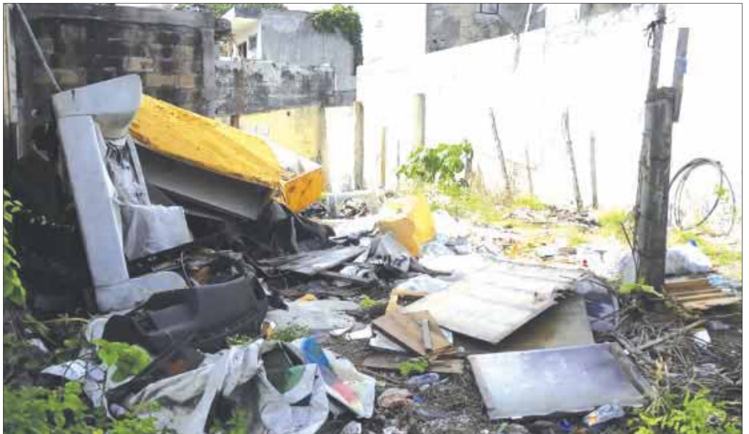
De esta manera se encuentra el terreno que fue reportado por habitantes de la región 102, el cual lleva tres lustros abandonado.

“Ahora resulta que cuando les conviene a los policías, los maleantes están en propiedad privada y no se les puede molestar, pero cuando no les conviene, se meten hasta dentro de la casa y sacan a la personas, sin que les interese que sea propiedad o no”, dijo otro de los vecinos.