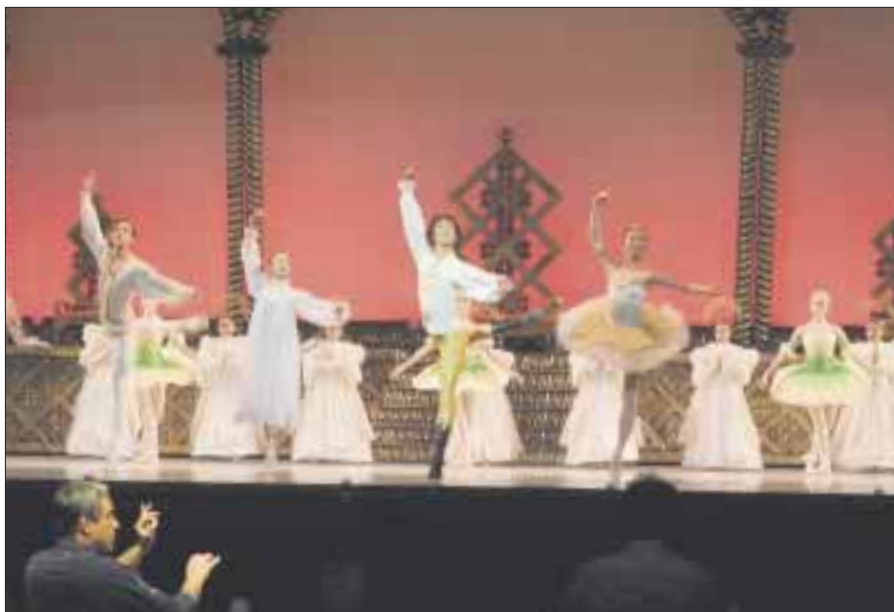
La Compañía Nacional de Danza y la Orquesta del Teatro de Bellas Artes dejaron en claro que todo se encuentra listo para una nueva temporada del ballet clásico "El Cascanueces" en el Auditorio Nacional.

Actividades como éstas, en las que Ana Torroja muestra su lado humano, son las que promueve Fundación CIE, que a lo largo de 11 años ha sido conocida por ser la plataforma social más importante del país que enlaza los intereses filantrópicos de los artistas con causas que buscan mejorar la vida de niñas, niños, y jóvenes, mujeres, hombres, y adultos mayores que por circunstancias físicas o sociales se encuentran en desventaja.