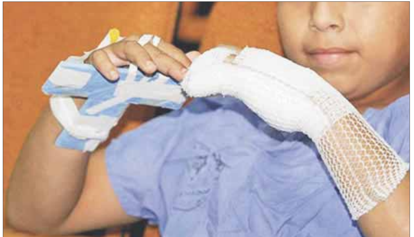
En diciembre las quemaduras por diversas causas se incrementan hasta un 50 por ciento entre los menores.

Otro de los casos más comunes son cuando las mamás están en la cocina, es decir cuando preparan de comer o calientan agua, en la estufa o con leña, situación que en cualquier descuido puede ser letal para los menores al sufrir alguna lesión grave en la piel.