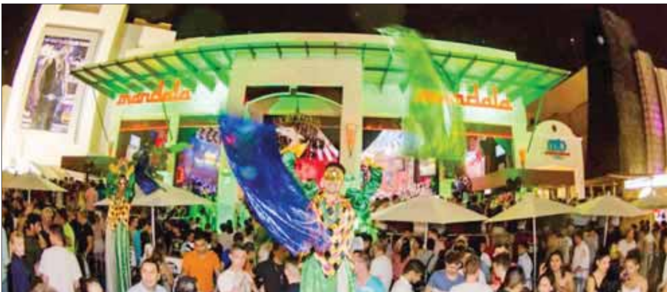
Mil 200 adolescentes intentaron entrar a los diferentes giros negros en la ciudad la semana pasada, a pesar de los operativos que se implementan.

Cancún.- Un total de mil 200 adolescentes intentaron entrar a los diferentes giro negros de la ciudad la semana pasada, a pesar de los operativos que se implementan desde inicio de mes previo a la temporada vacacional, que al parecer no ocasionan mella en los adolescentes.