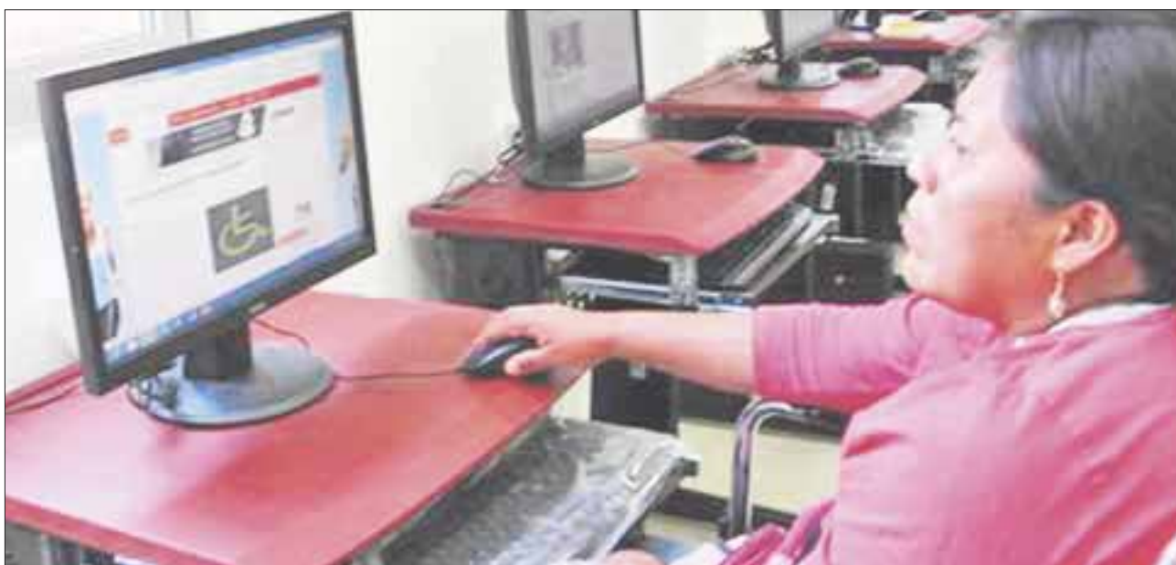
El Instituto Estatal para la Educación de Jóvenes y Adultos (IEEA) de Quintana Roo, entregó mobiliario y equipo de cómputo a la biblioteca pública del municipio de Puerto Morelos.

Puerto Morelos.- En beneficio de los alumnos, el Instituto Estatal para la Educación de Jóvenes y Adultos (IEEA) de Quintana Roo, entregó mobiliario y equipo de cómputo a la biblioteca pública del municipio de Puerto Morelos.