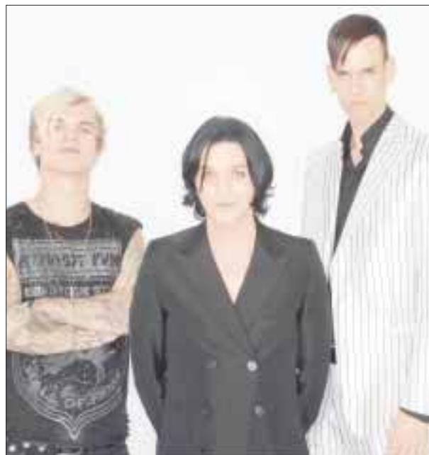
Placebo celebrará dos década de éxito con sus fans.

La película Rogue One: Una historia de Star Wars llega a los cines mexicanos este viernes 16 de diciembre.