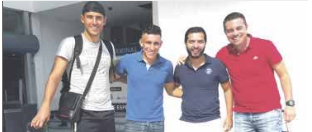
Junto al Inter Playa, dos ex leones de Guadalajara intentarán hacer que el equipo de la Riviera Maya se consagre campeón.