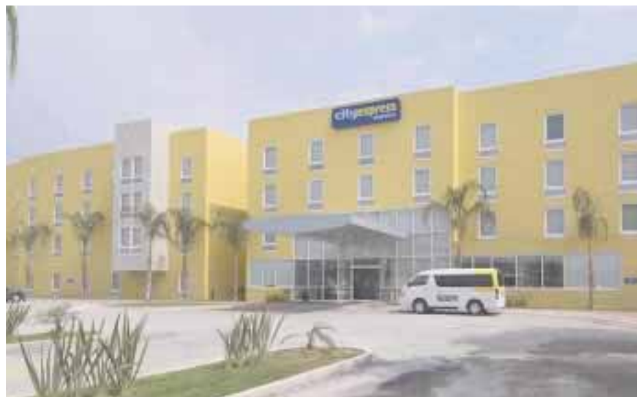
El City Express , en Tepotztlán.