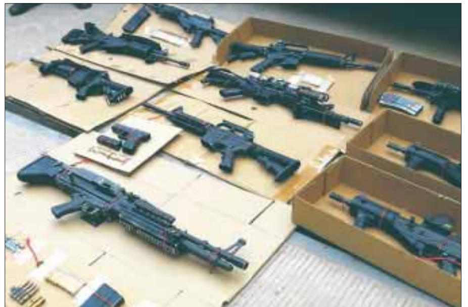
Sancionarán hasta con 30 años de cárcel a quien introduzca en forma clandestina armas de fuego.

La reforma contempla de cuatro a 10 años de prisión y multa de 200 a 600 Unidades de Medida de Actualización, así como el decomiso, a los comerciantes en armas, municiones y explosivos, que los adquieran sin comprobar su procedencia legal