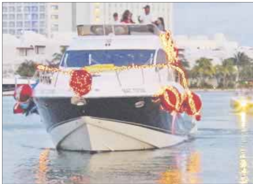
El Sunset Boat Parade es un espectáculo para todos, visitantes y locales, es totalmente gratuito y lleno de magia.