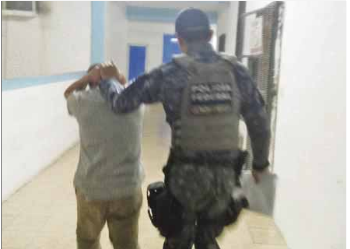
Un robo de dos gallos valuados en 7 mil pesos cada uno, fue impedido por elementos de la Gendarmería, en Villas Otoch Paraíso.

En tanto, los propietarios tuvieron que acreditar la legítima propiedad de los ejemplares, así como la actividad para la que los tienen en posesión, ya que en el estado el maltrato animal se penaliza hasta con cinco años de cárcel.