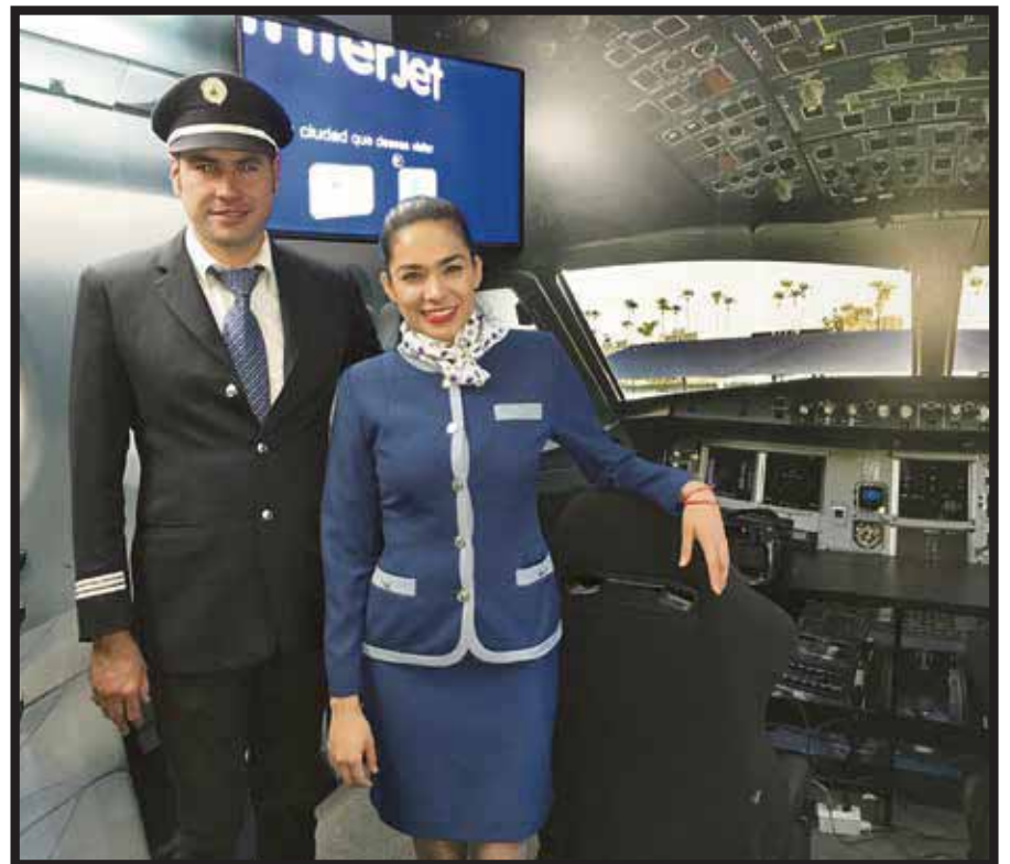
Personal de la aerolínea nos invitó a participar en el simulador.

La aerolínea llevó a Plaza Carso un simulador en el que tuvimos la oportunidad de realizar un aterrizaje en una ciudad a elegir