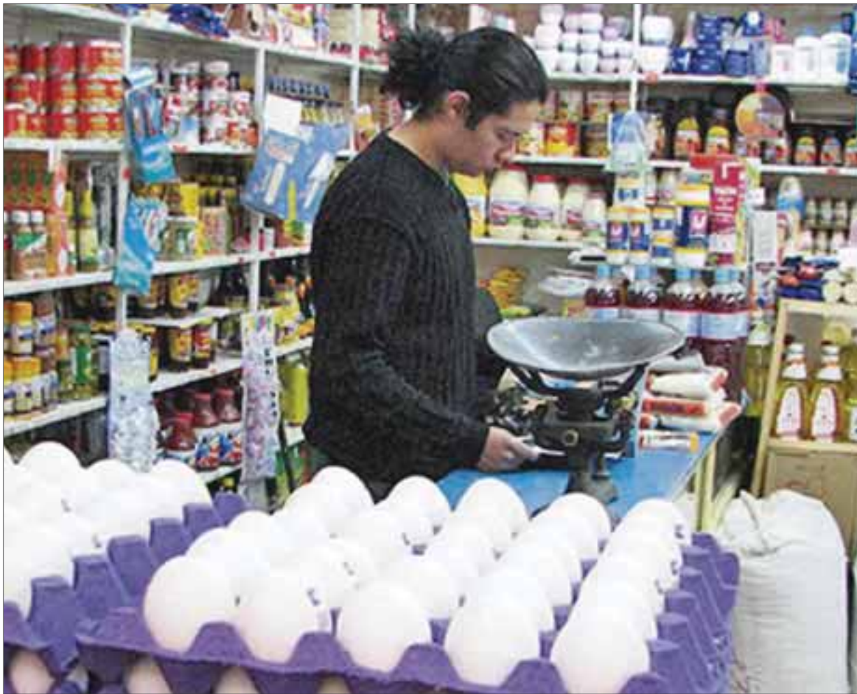
Revelan que este año será más angustiante para las familias de la clase trabajadora.

Consideró que la mayoría de la población no es cauta con el dinero, "porque una vez que no se pagan los compromisos cuesta más caro, dado que en las actividades de gobierno como en las comerciales hay recargos y entonces la 'cuesta de enero' sale más cara".