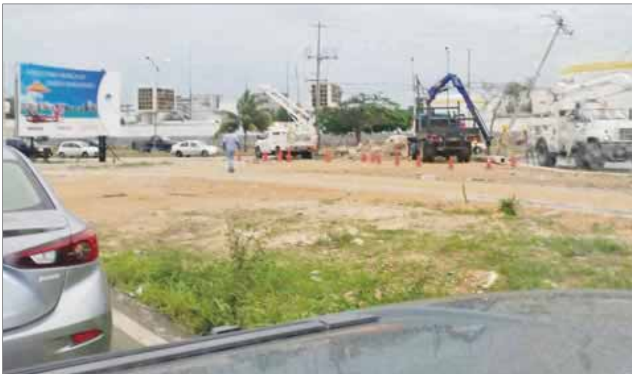
La avenida Huayacán se mantuvo cerrada por espacio de cinco horas, luego que un conductor irresponsable impactara un poste de luz.

Cancún.- Un accidente que se registró la madrugada de ayer sobre avenida Huayacán, provocó el cierre total de aquella transitada arteria, debido a que el conductor de una camioneta impactó un poste de alumbrado público.