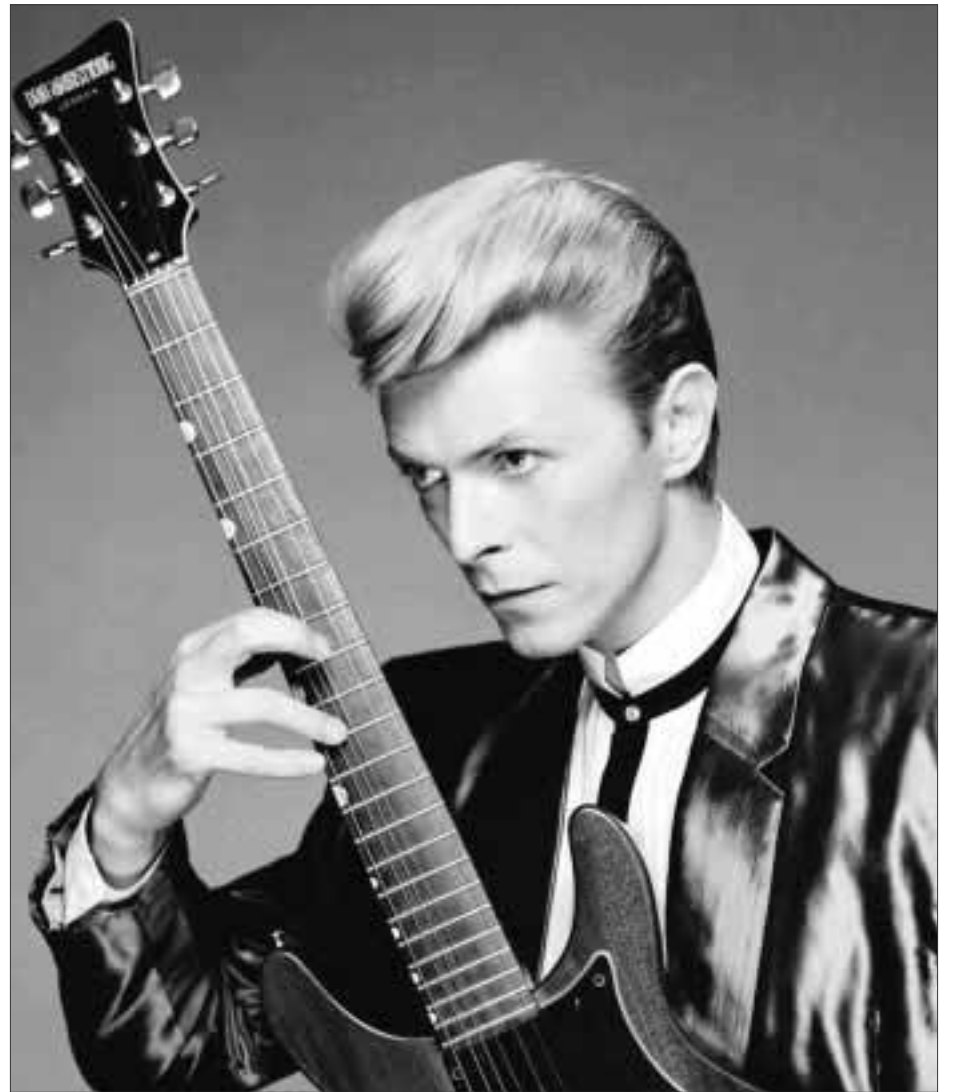
La prensa británica reportó que si bien durante años hubo rumores sobre la enfermedad de Bowie, las versiones nunca se pudieron corroborar hasta el anuncio oficial de su muerte.

Bowie, una de las más grandes leyendas del Rock and Roll, lanzó más de 24 discos de larga duración durante toda