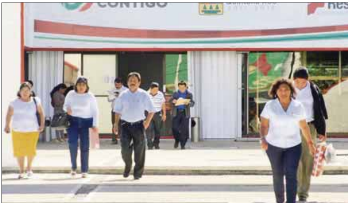
Son 32 maestros a los que les aplicarán la "guillotina".