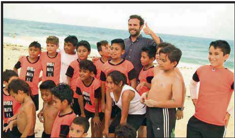
El futbolista Juan Mata apoyará a la Fundación Vacaciones con Causa.

☆☆☆☆☆ El mediocampista del Manchester United , Juan Mata se ha convertido en la imagen de cam-