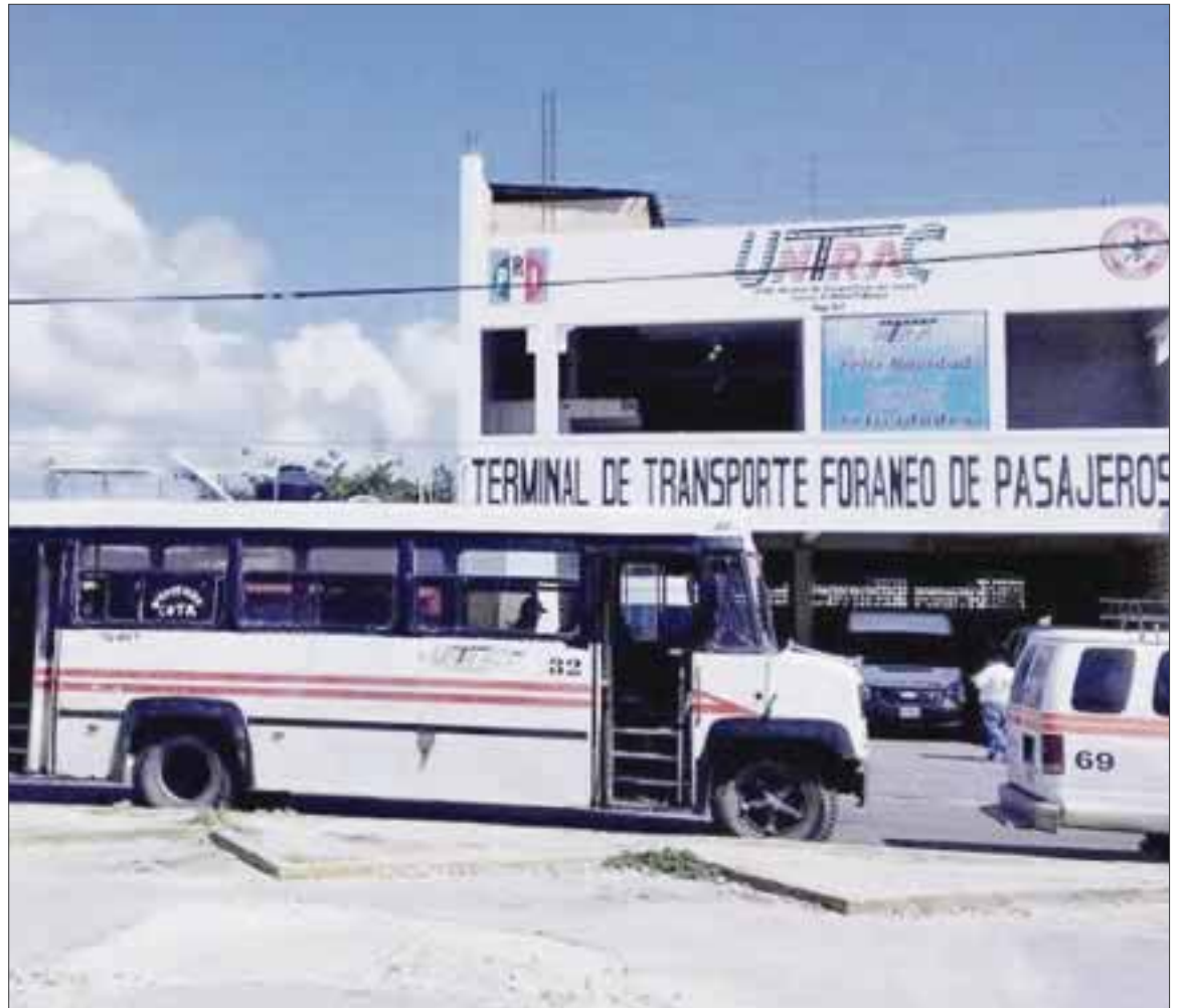
La Untrac brinda servicio a pobladores y campesinos de la zona centro y sur de la entidad.