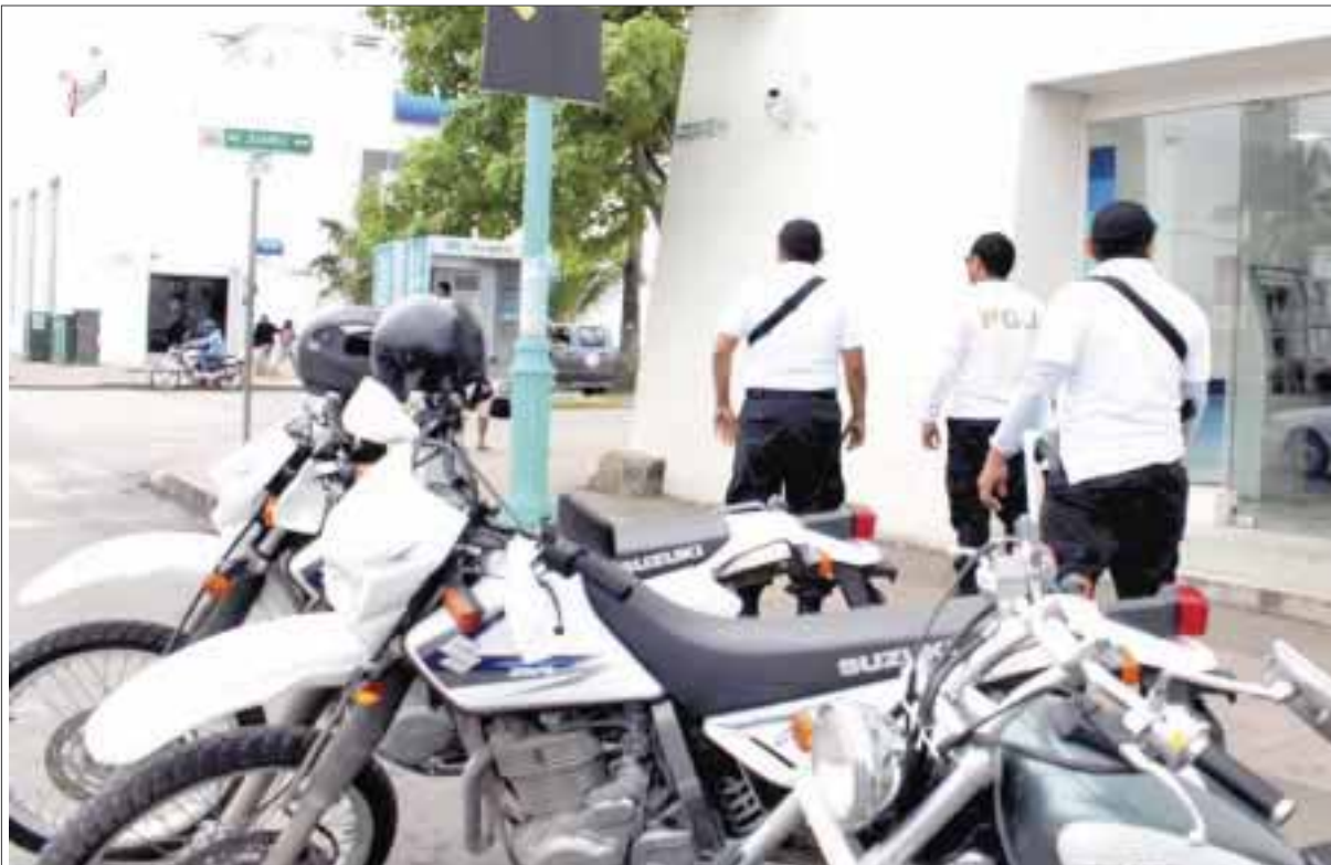
Las unidades fueron puestas a disposición del agente del Ministerio Público del Fuero Común, instancia que realiza las diligencias para la entrega de las unidades a sus propietarios.

Chetumal.-La Procuraduría General de Justicia del Estado informó que como resultado de los trabajos de investigación y de los operativos que realiza la Policía Ministerial en la Zona Sur la Fiscalía Especializada en Recuperación de Vehículos Robados, logró ubicar tres motocicletas, que contaban con reporte de robo y por las cuales se iniciaron expedientes con base en la denuncia interpuesta por los respectivos propietarios.