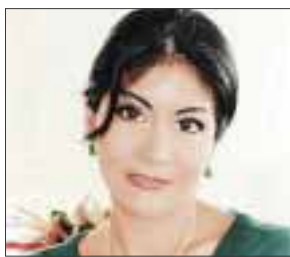
POR YOLANDA MONTALVO