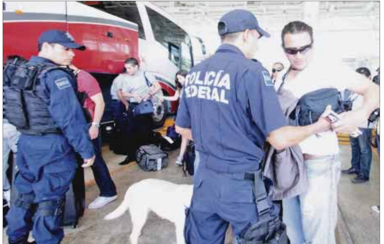
La jovencita fue asegurada en la terminal de autobuses por elementos de la Gendarmería