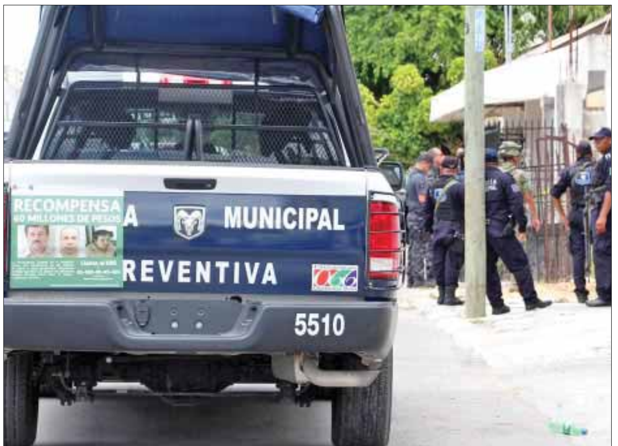
Ante la posibilidad de que Cancún sufra el “efecto cucaracha” por la detención de Joaquín Guzmán Loera, el FBI trabaja en coordinación con la Procuraduría de Justicia.

Cabe mencionar que Cancún y Playa del Carmen, específicamente, han sido escenario de detenciones de diferentes prófugos de la justicia, así como delincuentes internacionales, por los que inclusive se había generado una “ficha roja” de los llamados “más buscados del FBI”