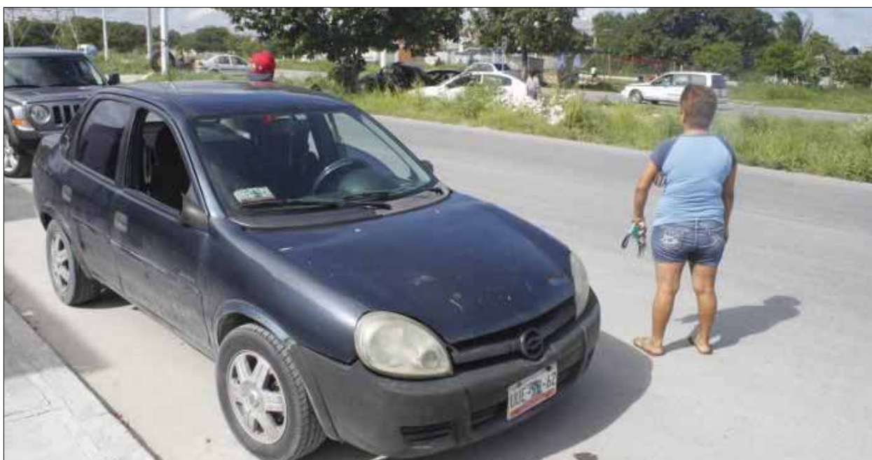
En teoría y de acuerdo con las cifras de la Oficina Coordinadora de Riesgos Asegurados, en la entidad se roban por lo menos un auto todos los días.

Cancún.-De acuerdo con el reporte más reciente de la Oficina Coordinadora de Riesgos Asegurados (OCRA), en tan sólo 15 años el robo de autos en el estado de Quintana Roo aumentó 267%.