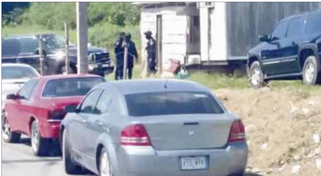
Las autoridades cumplieron con la orden de desalojo del supuesto propietario.

Chetumal.- Un ciudadano denunció ser víctima de un despojo de un predio ubicado en la calle Sacalaca con Tzisauché, en las inmediaciones de la plaza Las Américas.