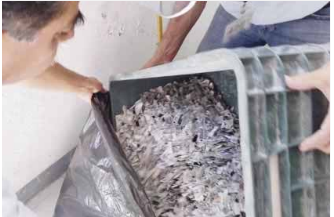
El 1 de marzo se realizará el corte definitivo de los ciudadanos que integrarán la Lista Nominal que participará en el Proceso Electoral Local 2016.

Del Distrito 1 se destruyeron 8 mil 461 credenciales para votar; del Distrito 2, con cabecera en Chetumal, 2 mil 875 micas y del Distrito 3, en la Ciudad de Cancún, 5 mil 482 micas