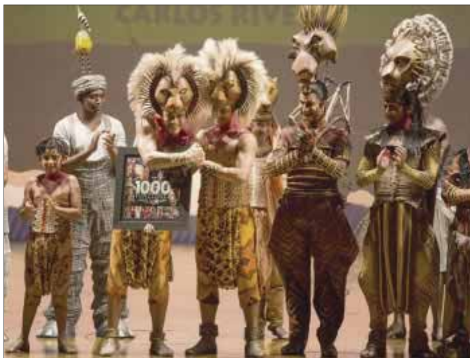
Carlos Rivera celebra mil funciones como "Simba" en "El Rey León"

*** El cantante y actor Carlos Rivera cumplió las primeras mil representaciones como "Simba", en este espectacular montaje que se presenta en el Teatro Telcel