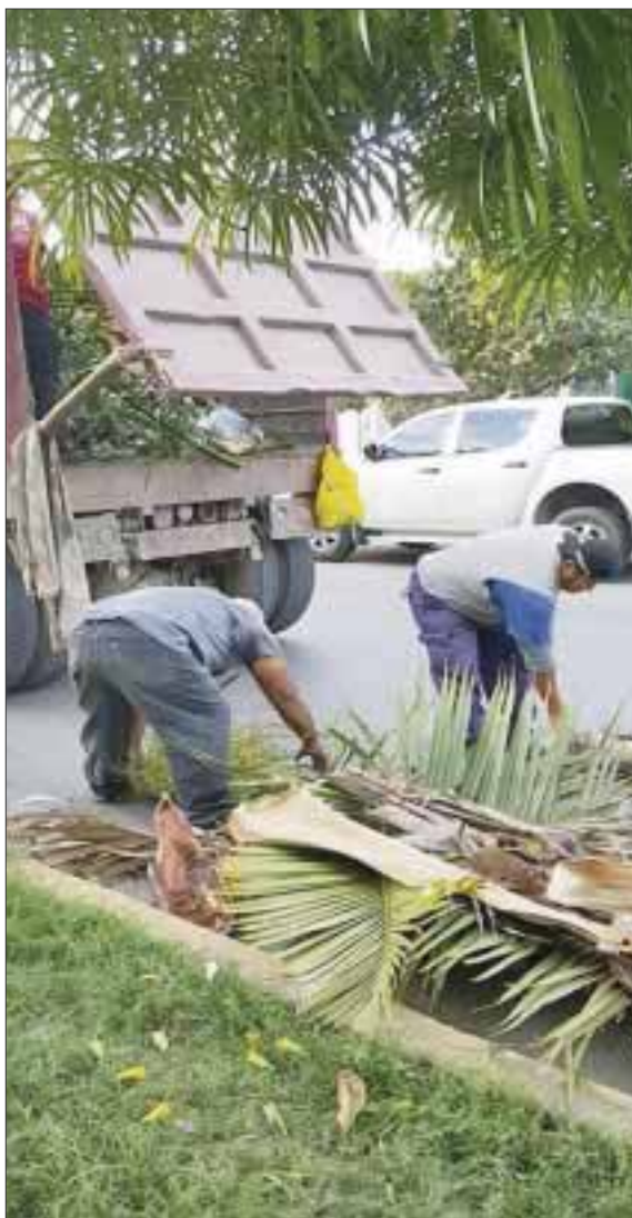
Más de 300 trabajadores con apoyo de 60 camiones de basura y material de limpieza, recolectan al día 500 toneladas de basura, a fin de mantener una imagen urbana de primera calidad en Solidaridad.

El funcionario añadió que al mes se atiende un promedio de 300 llamadas al número de atención ciudadana 072, que son canalizadas a su departamento por diversos servicios como alumbrado público, recolecta de basura o bacheo entre los principales, los cuales son atendido en menos de 48 horas.