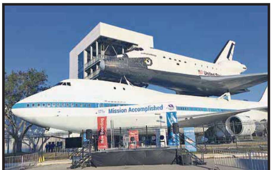
La Plaza de la Independencia luce con el Boeing 747 y encima el transbordador.