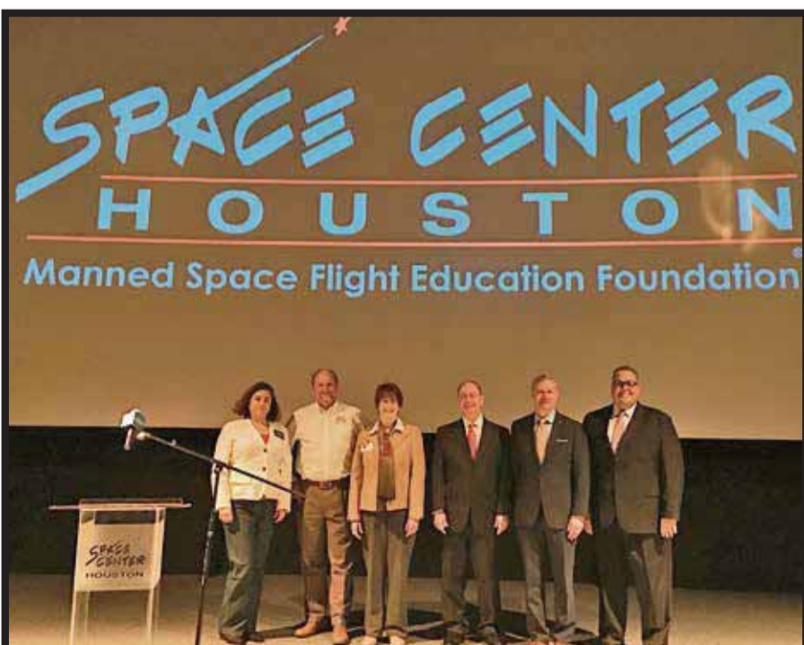
Durante la presentación a los medios de información.