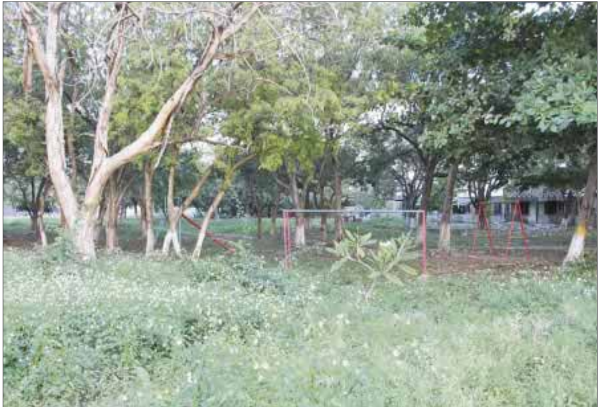
Este es el parque de la región 92, donde según la denuncia de los vecinos, se han registrado varios robos con violencia.

Pese a que la situación es delicada en esta parte de la ciudad, algunos habitantes, prefirieron no emitir ningún comentario, ya que lo consideran "peligroso".