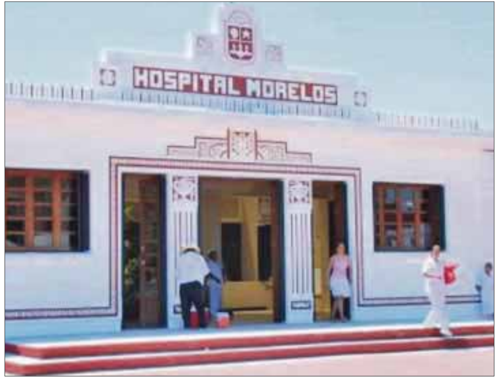
La afectada señala que no fue atendida a tiempo, lo que provocó el deceso de su hijo.

La mujer afectada narró que el día martes “la doctora estaba ocupada con su celular y me atendió de mala gana después de casi una hora y cuando por fin me atiende me dice que todavía no es tiempo, que me vaya a caminar para que dilate y cuando regreso al hospital me recibe y después de casi cuatro horas la ginecóloga le informó que no escuchaba el corazón del bebé”.