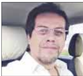
POR MAURICIO CONDE OLIVARES