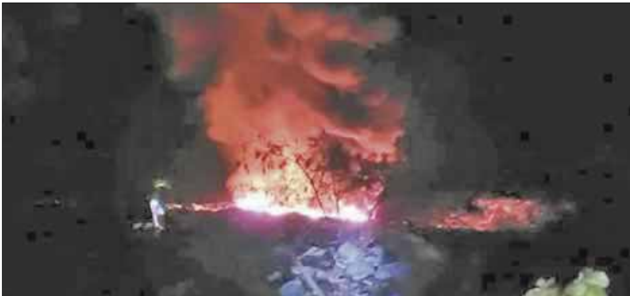
En el lugar permanecen bomberos, personal de la Marina que también combate el siniestro, la Policía Municipal Preventiva y voluntarios que continúan apoyando.

Chetumal.- Permanecen autoridades combatiendo el incendio en el basurero municipal, luego que la conflagración iniciara la noche del miércoles y hasta el momento no han podido extinguirlo.