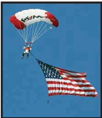
Paracaidista de ReMax.

Houston, Tex.- En el Centro Espacial de Houston ( Space Center Houston ), el centro oficial de visitantes de NASA-Johnson Space Center , que dirige una mujer de origen mexicano, Ellen Ochoa , quien fuera astronauta, hoy ocupa la dirección, fue inaugurada Independence Plaza , como les conté la semana pasada, lo que sin duda será una atracción de