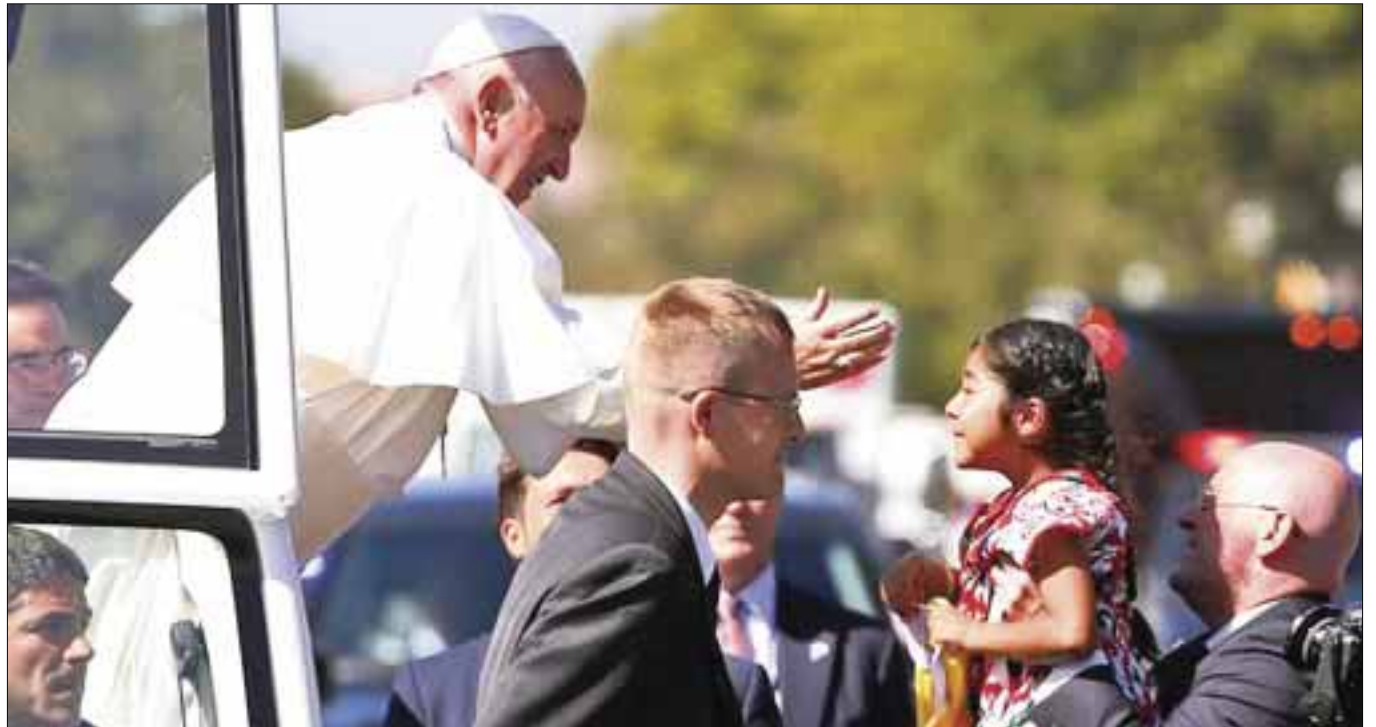
Es la cuarta visita del Pontífice al continente americano, después de su viaje a Cuba, Ecuador, Bolivia y Paraguay en 2015, y a Brasil, en 2013

El viaje del Papa a México, el cuarto de su pontificado a Latinoamérica, se realizará del 12 al 18 de febrero próximos.