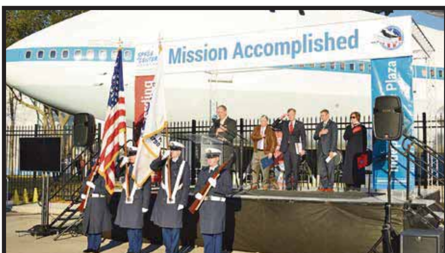
Guardia de Honor de U.S. Coast Guard.

“ Independence Plaza ” tiene una altura aproximada a ocho pisos y es el proyecto más ambicioso que se ha realizado desde que el centro