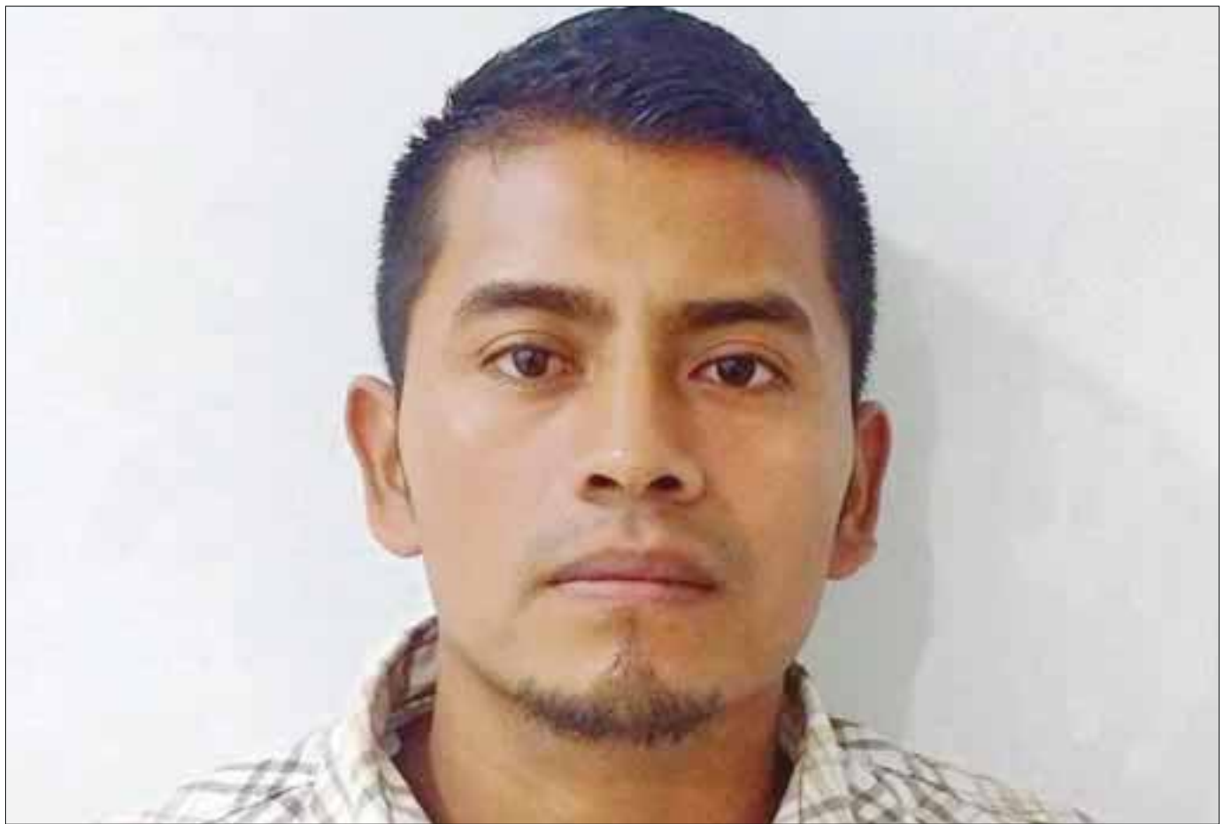
El guatemalteco dijo que "un señor" lo había llevado al aeropuerto para que viajara a Monterrey y luego Estados Unidos.

Ante esta situación, los polifederales le leyeron sus derechos al sujeto, para luego ser puesto a disposición del agente del Ministerio Público, bajo los cargos de probable portación de documentos oficiales apócrifos, a fin de que se determine su situación legal.