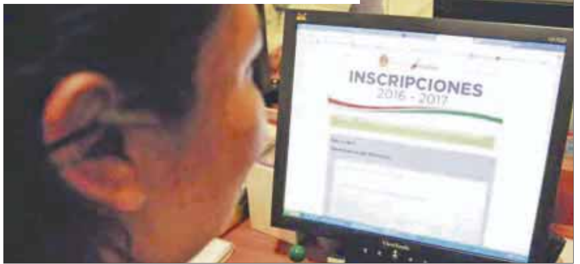
La Secretaría de Educación y Cultura en Quintana Roo prolongará el periodo de inscripción del 15 al 29 de febrero.

La situación provocó que se saturara la página por lo que se prolongará el periodo de inscripción en beneficio de los padres de familia y de los menores para poder inscribirse y continuar su educación básica sin ningún problema en el municipio donde radiquen.