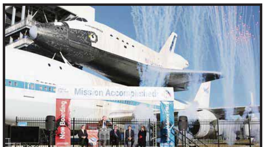
Inicio de los fuegos artificiales.