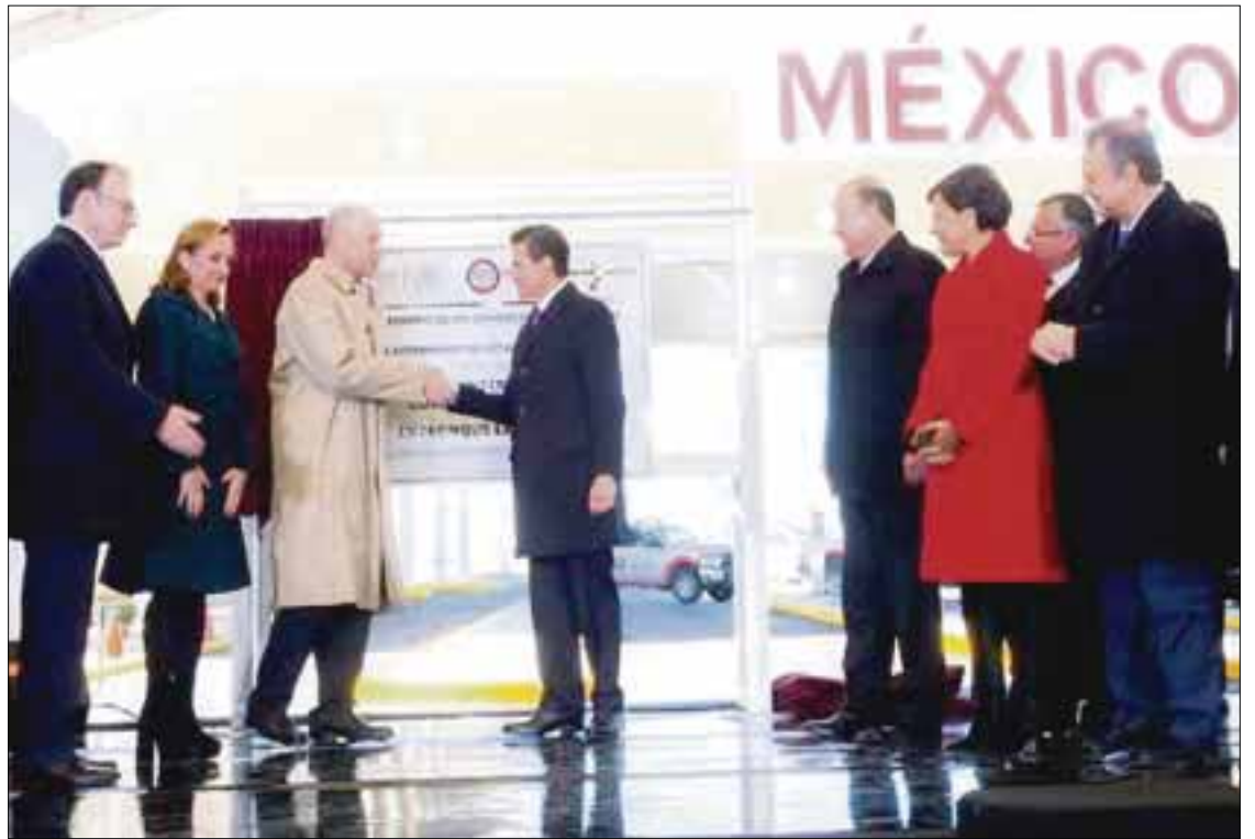
Enrique Peña Nieto inauguró el Puente Fronterizo Guadalupe-Tornillo, acompañado del secretario de Seguridad Nacional de Estados Unidos, Jeh Johnson.

Agregó que gracias al Diálogo Económico de Alto Nivel (DEAN), que ha servido para evaluar las coincidencias y fortalezas, la región es la más competitiva y próspera del mundo, en la que convergen 10 estados