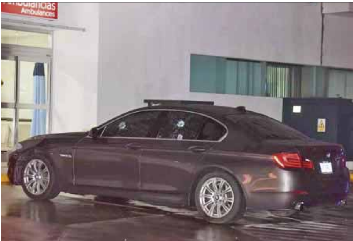
El atentado a balazos de un supuesto cubano en Plaza Nichupté, quedará impune, porque la víctima salió ya del hospital sin declarar una palabra y no compareció ante MP.

Cancún.- Luego de permanecer casi ocho días “grave” en un hospital privado de este destino de playas, el hombre que recibió tres disparos de arma de fuego en el estacionamiento de Plaza Nichupté, fue dado de alta y tras salir del nosocomio, su paradero de reporta como desconocido.