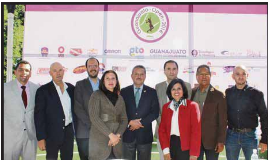
El torneo tiene como objetivo apoyar y favorecer el desarrollo de los jugadores mexicanos.

Dijo que la encomienda al impulso deportivo es elemental en Guanajuato, por eso se unen esfuerzos entre gobierno e iniciativa privada para celebrar eventos como este que conjuntan a participantes nacionales y extranjeros.