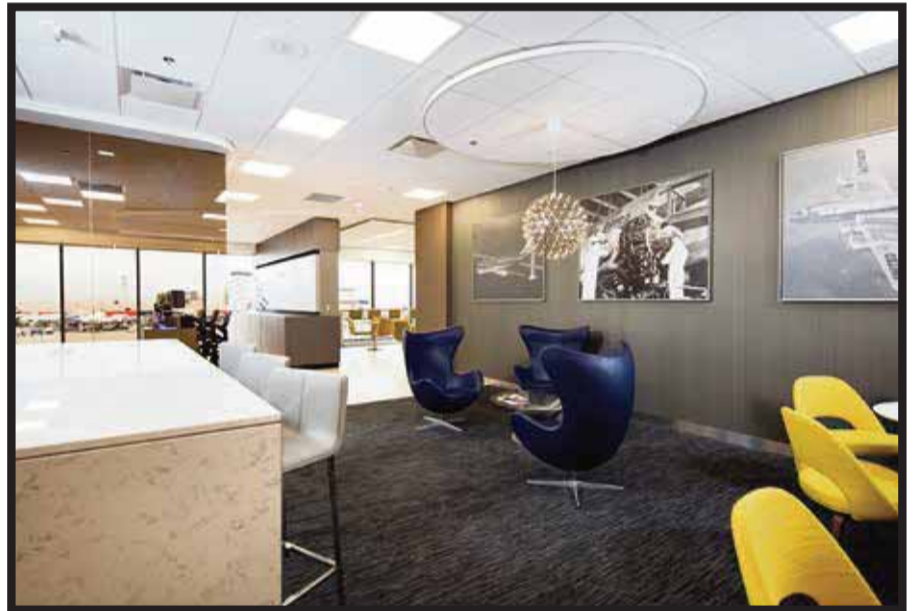
La compañía aérea continuará remozando sus salones en los hubs .

2018, continuará remozando sus salones en los hubs situados en territorio estadounidense continental y en algunas ciudades internacionales clave, y renovando los clubes en otros destinos en el mundo.