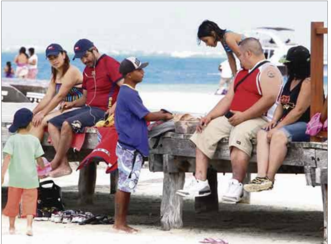
La calidad de los productos que venden en las playas de la zona hotelera, tiene que ver con el soborno que les exigen representantes de Zofemat.

“Ellos venden su producto mal manejado, asoleado y de mala calidad, porque tienen que cumplir su cuota de 100 pesos diarios, además de pagar a su jefe que aparentemente los protege, y por último sacar para que coman sus ,” denunció un mesero del hotel Casa Maya.