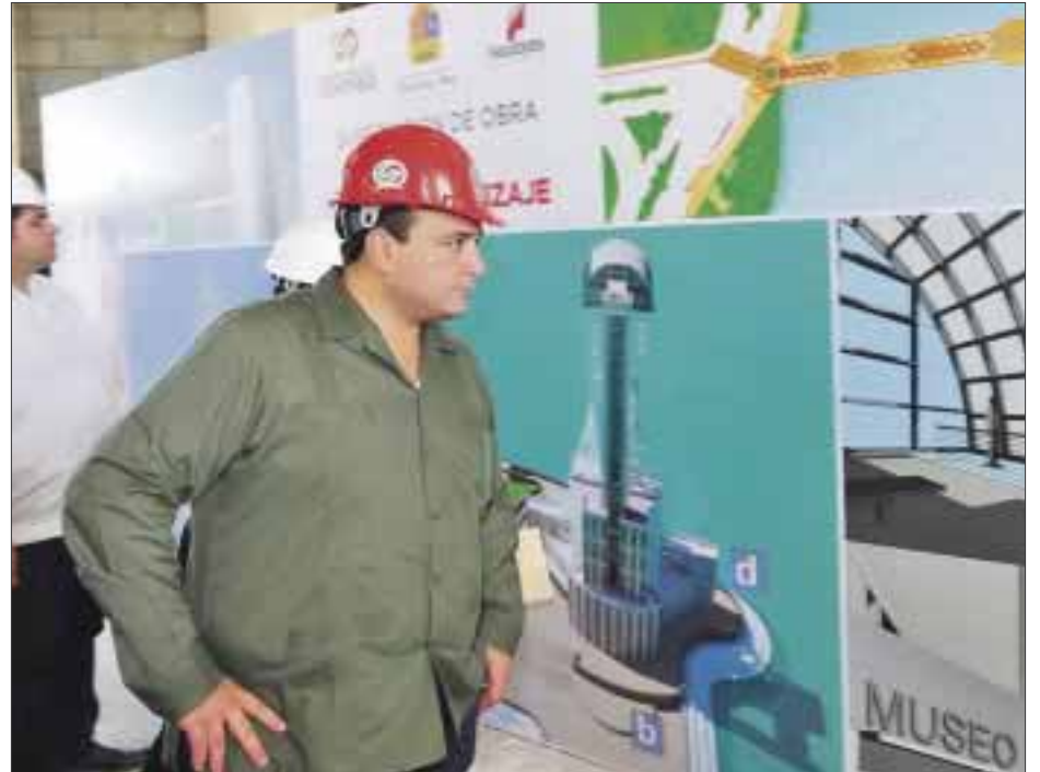
El nuevo recinto cultural entrará en funciones en julio de este año.

El gobernador dijo que, una vez concluida esta obra, "habremos cumplido un compromiso más con los chetumaleños, al brindarles más servicios y atractivos turísticos que permitan diversificar la economía de la ciudad"