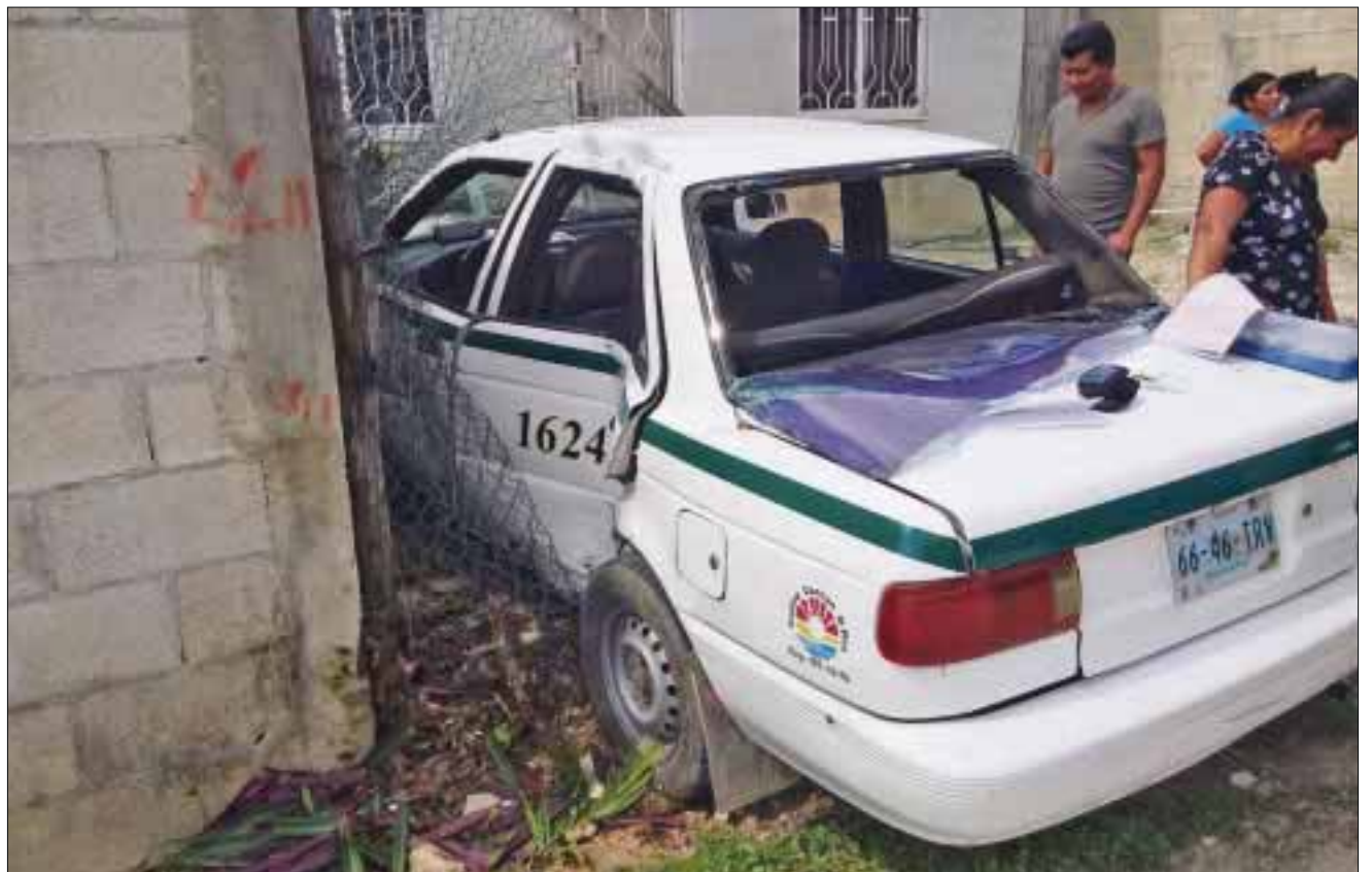
De esta manera quedó el auto, que era conducido por inexperto taxista.

A la llegada de los servicios de emergencias, no se reportó ningún lesionado, por lo que todo se limitó a los daños materiales.