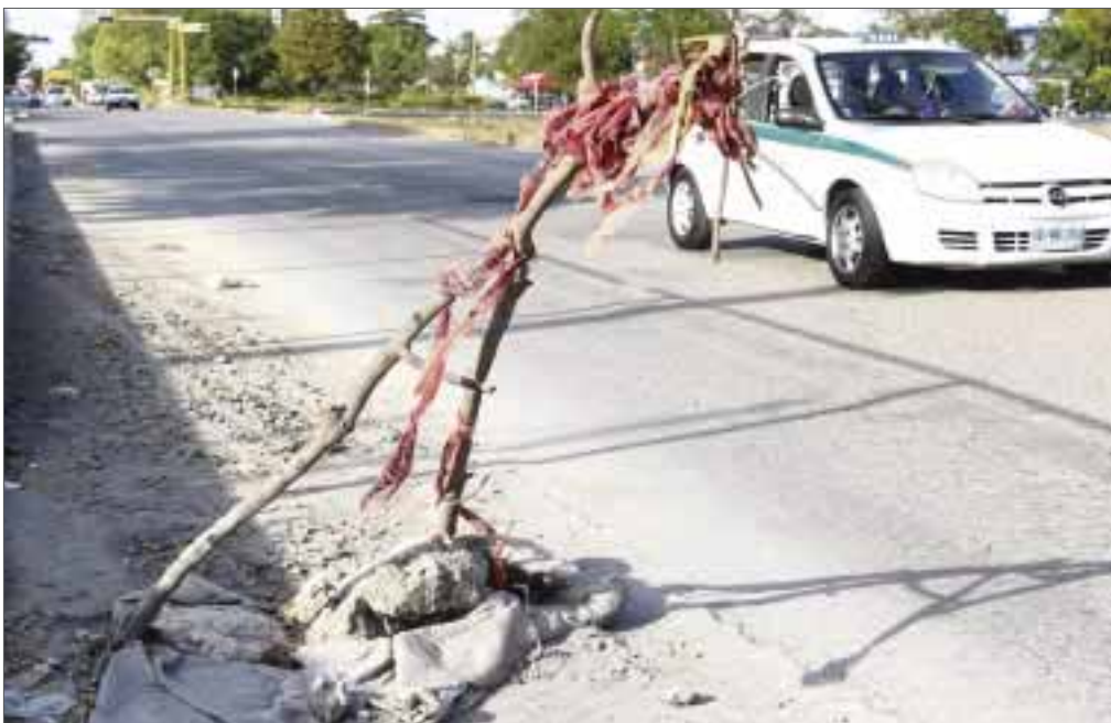
De esta forma se encuentra el tramo de avenida Chacmol, que es reportado constantemente por vecinos de la región 101.

Cancún.- En una auténtica trampa para los automovilistas se han convertido una coladera colapsada desde hace tres meses sobre la avenida Chacmol, esquina con calle 52 poniente en la región 101.