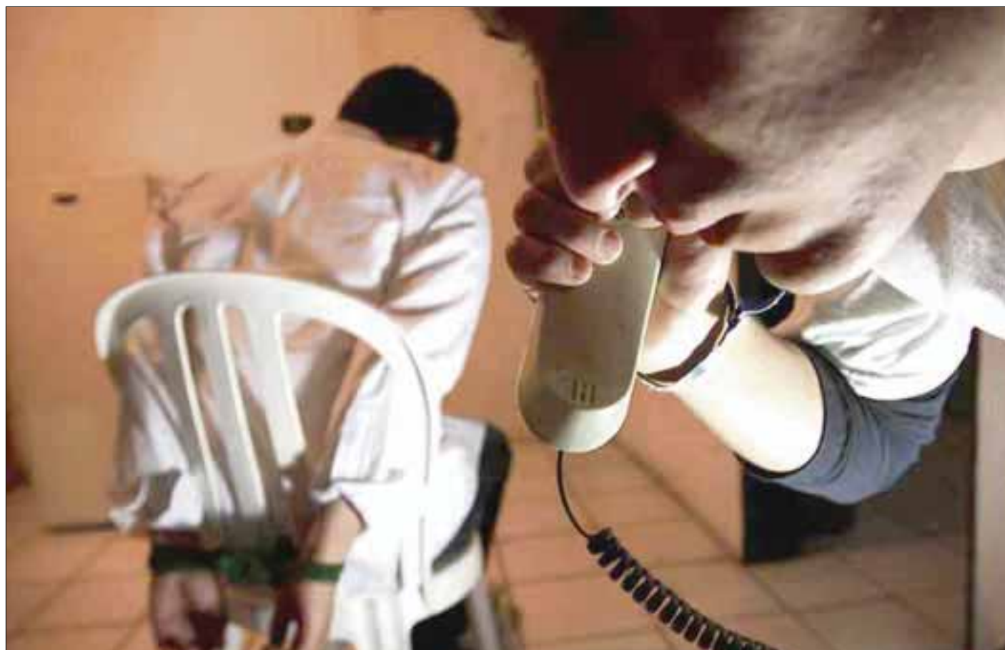
La Policía Federal y la Gendarmería realizarán conferencias gratuitas como parte del programa de acciones de proximidad para la prevención de delitos y el fortalecimiento del tejido social.

La "Prevención de Delitos en Redes Sociales", se expondrá el jueves 16 de marzo a las 16:00 y 18:00 horas, con un lenguaje fácil de digerir para los jóvenes, al ser un tema que atañe a las nuevas generaciones, conferencias, que en coordinación con autoridades locales y SEyC también se llevarán a las escuelas.