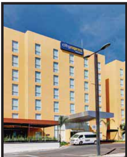
El hotel en Querétaro.

El hotel proyectado se ubicará en las Islas Deira, desarrolladas por Nakheel , y será único en el destino, ya