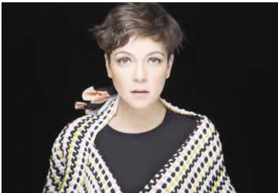
La cantautora mexicana Natalia Lafourcade y el rapero de origen cubano, Pitbull, empataron en la categoría con sus producciones "Hasta la raíz" y "Dale", respectivamente.

*** Ninguno de estos artistas estuvo presente en la ceremonia previa a la gala televisada, en la que se reparten la mayoría de los gramófonos