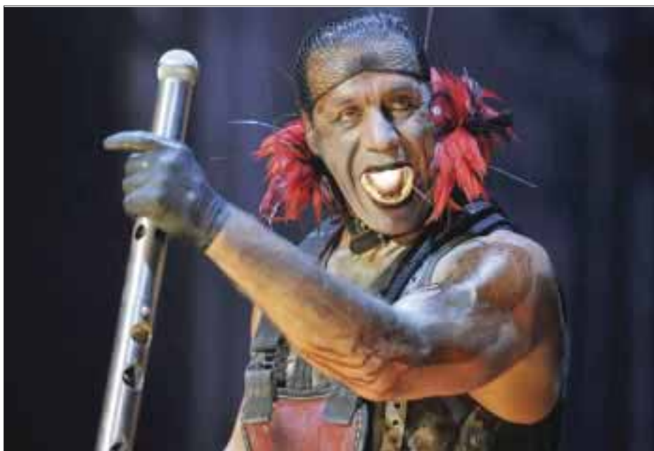
El Corona Hell & Heaven Fest será encabezado por Rammstein.

Sé parte de esta presentación y déjate seducir por Bebe y su “Cambio de piel” el próximo 7 de mayo en el Plaza Condesa. PRECIOS: General $360 // Palco $480 // Balcón $600.