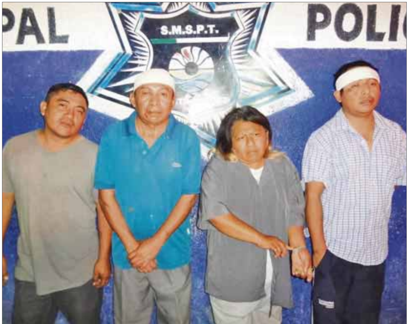
Una situación que pudo ser controlada por la vía del diálogo, terminó en el Ministerio Público.

A la llegada de los uniformados y ante la agresión de ambas partes, se procedió a detenerlos a todos y ponerlos a disposición del Ministerio Público por daños y lesiones.