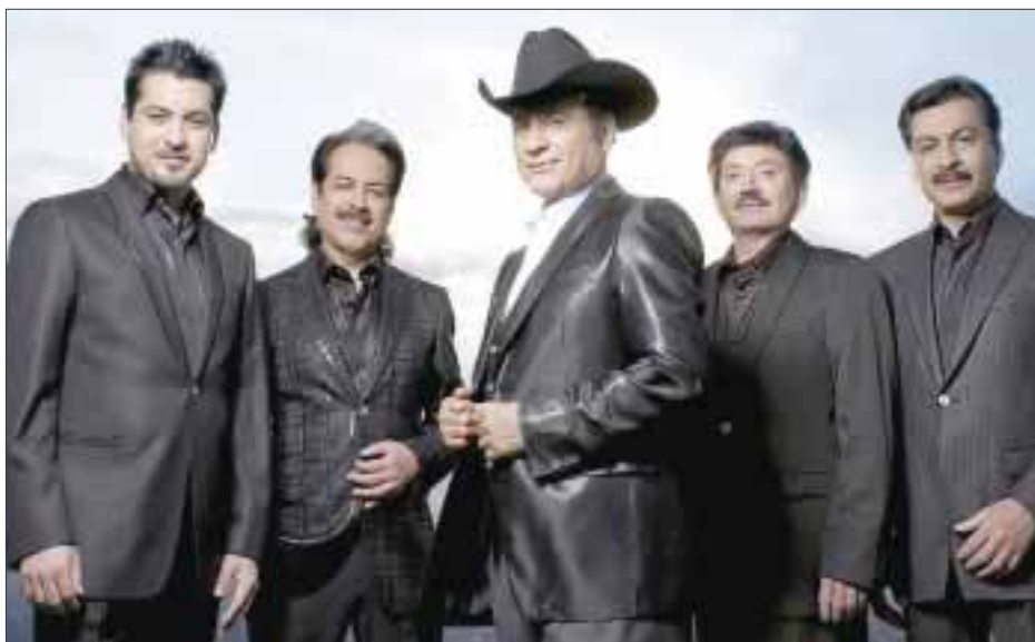
Los Tigres del Norte no defraudaron y fueron los mejores en Música Regional Mexicana, con "Realidades".

Ricky Martin, Natalia Lafourcade, Los Tigres del Norte, Pitbull y Rubén Blades se llevaron ayer lunes un Grammy cada uno durante la gala no televisada, previa a la gran fiesta de la música estadounidense, que se celebra en Los Ángeles.