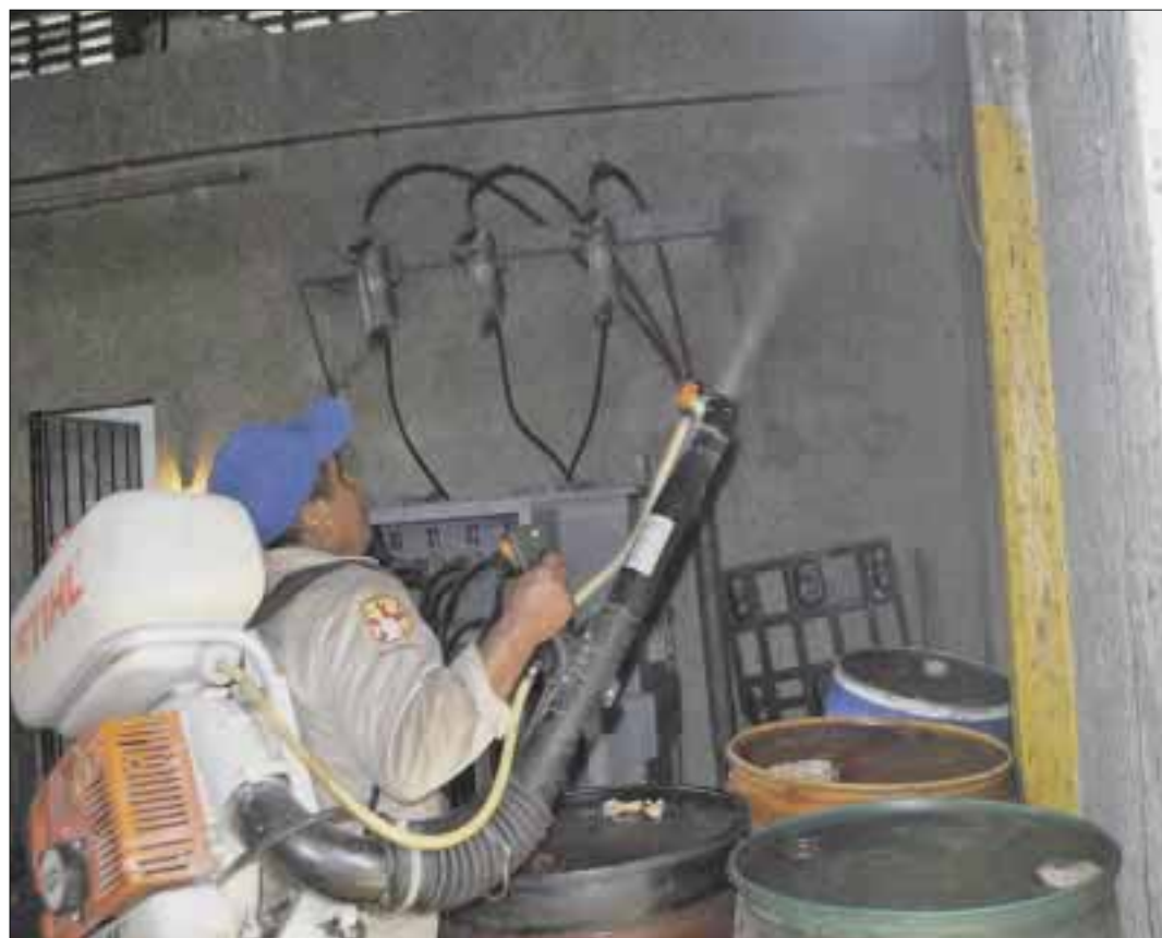
Inició en Chetumal el segundo ciclo de nebulización, que cubrirá 48 colonias para eliminar al mosquito Aedes aegypti en su fase adulta.