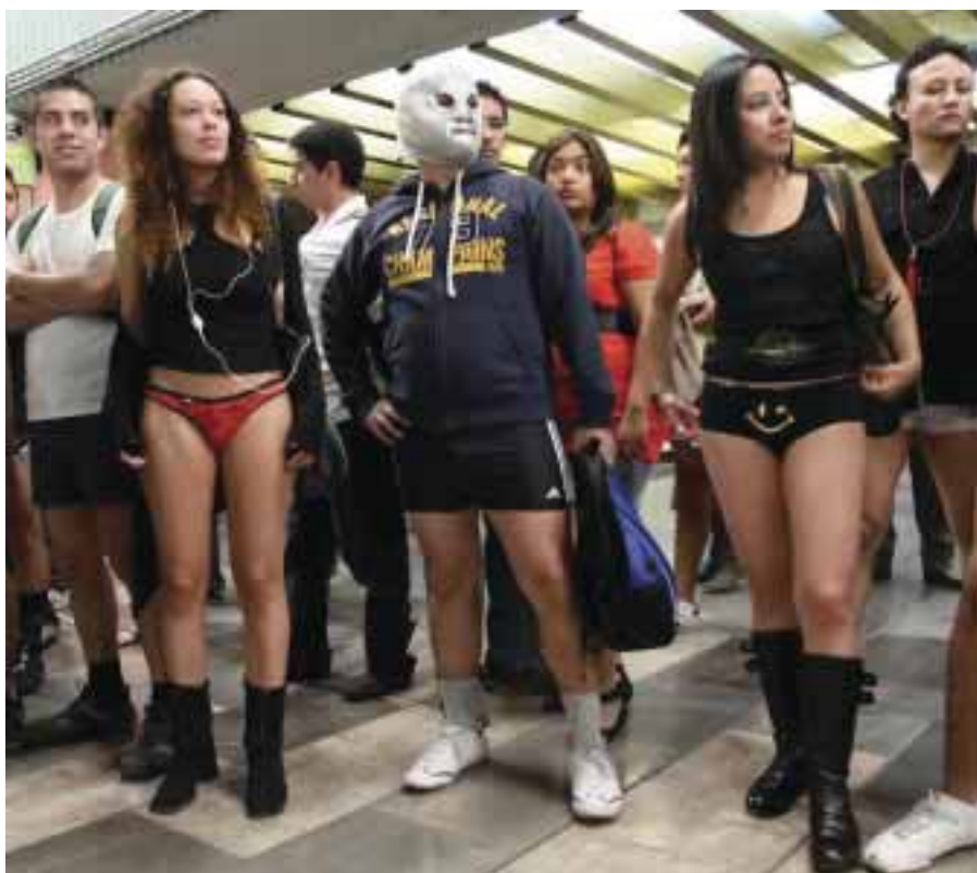
La meta es romper el récord de asistentes con más de 5 mil participantes en el "Paseo sin pantalones" y más de 15 mil personas en el MP3.

La obra se presenta en el Teatro El Galeón del Centro Cultural del Bosque con funciones sábados y domingos a las 13:00 horas. La temporada termina el 17 de abril próximo. Únicamente se suspenden las fechas de 12 y 13 de marzo.