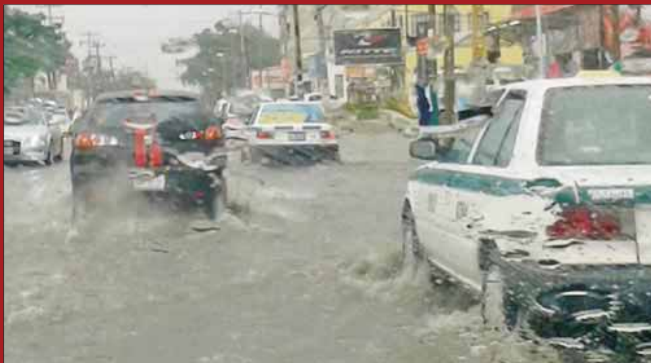
Los encharcamientos volvieron aparecer en Cancún por una repentina lluvia que se dejó sentir todo el día.

Cancún.- Una pertinaz lluvia que duró todo el día, puso a prueba los más de 400 pozos de absorción y coladeras recién desazolvadas del llamado “primer cuadro de la ciudad”.