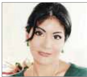
POR YOLANDA MONTALVO