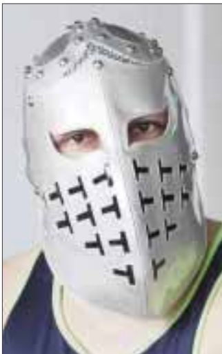
El nuevo valor de la TWS, "Templario", buscará sobresalir en su primer combate frente a "Magno".

"Estamos tratando de impulsar la lucha libre de Cancún. Vamos a dar una gira por diferentes arenas del país, así como también ya hemos firmados convenios con agencias de viajes, para que puedan haber funciones donde asistan turistas de otras partes del mundo" consideró Novelo.