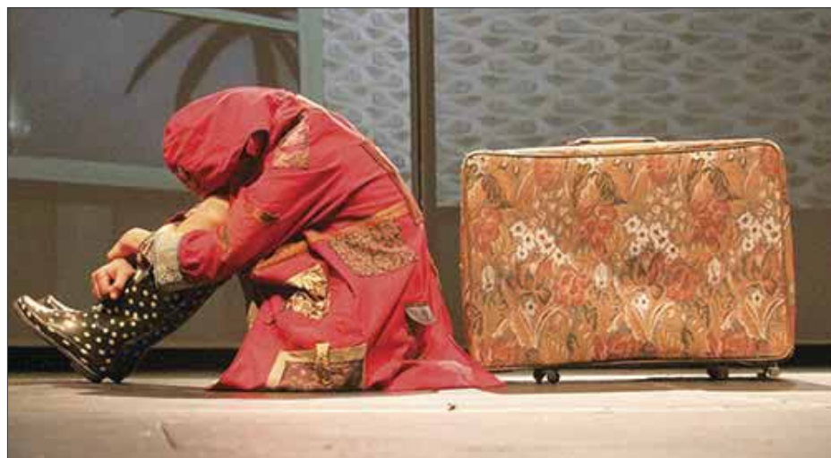
"Cosas pequeñas y extraordinarias" es una puesta en escena que invita a los padres de familia a retomar la plática con sus hijos.

Además del ya famoso "Paseo sin pantalones", este FlashMob contará con un experimento MP3 con una misión muy divertida que los agentes podrán compartir a través del Hashtag #SexyEnElMetro. Como en cada MP3, habrá música e indicaciones, pero esta misión será algo completamente diferente que ningún agente se puede perder, con audios de última tecnología para poder disfrutar a lo grande esta misión; experimentando sensaciones que llevarán a los participantes a vivir momentos graciosos y divertidos. Algunos de los más memorables son las olas masivas, freeze, las caminatas en cámara lenta, entre otras.