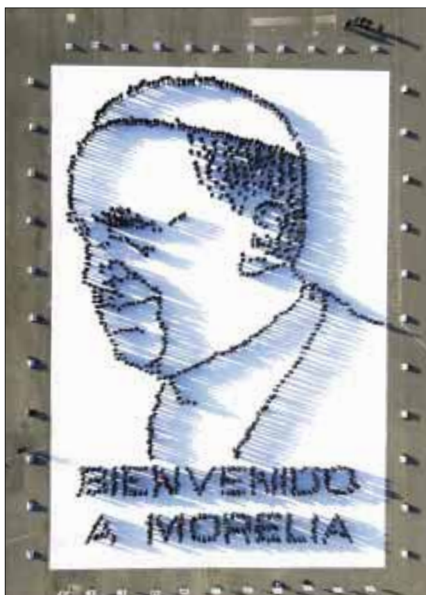
Participaron mil 500 jóvenes en la formación del rostro viviente del Papa Francisco.

Insistió que es difícil sentirse la riqueza de una nación cuando no se tienen oportunidades de trabajo digno, posibilidades de estudio y capacitación, cuando no se sienten reconocidos los derechos que terminan impulsándonos a situaciones límites.