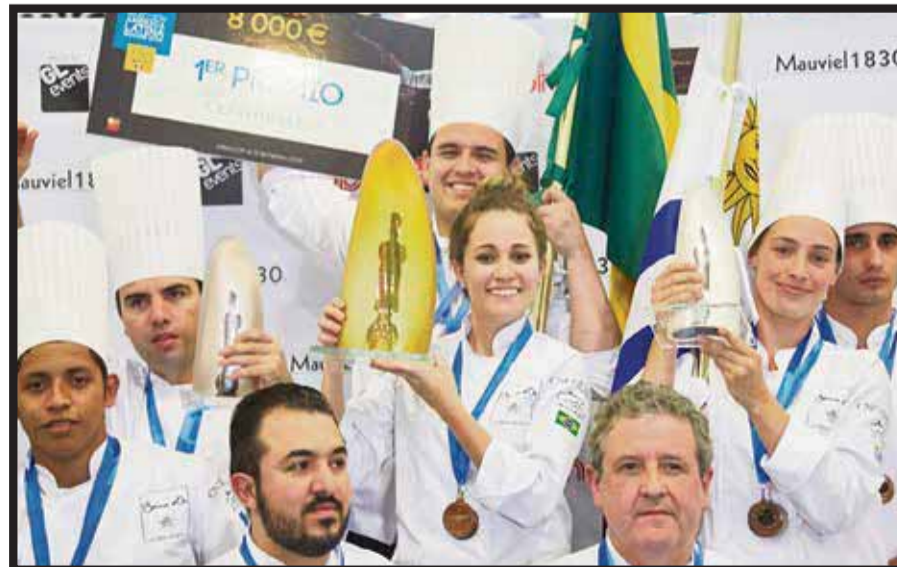
Los ganadores de Bocuse d'Or, en Sirha México.