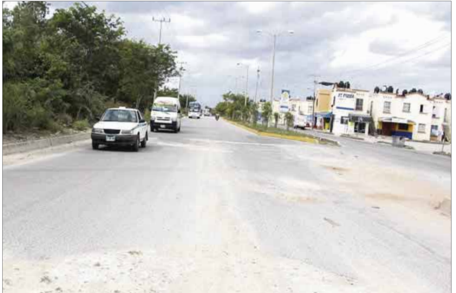
De esta manera se encuentra la avenida principal de Villas Otoch, porque los trabajadores del ayuntamiento sólo tapan los baches con tierra.

Aunado al problema de los baches, también se encuentra el problema de las inundaciones que se registran en esa misma avenida, que surge del fraccionamiento y confluye con el llamado “Arco Vial”.