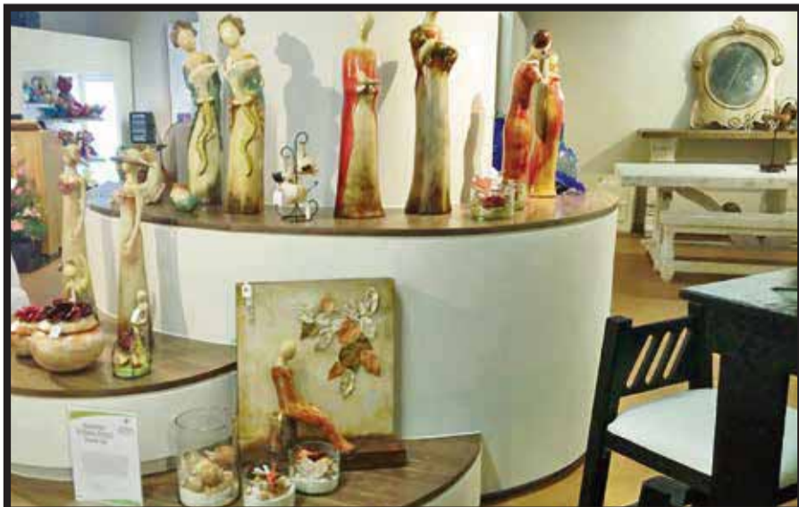
Abren Casa Mejiú en el Centro Histórico capitalino.

Esta empresa mexicana, destacó, mantiene actualmente relación comercial con tiendas de autoservicio y cuenta con más de 2 mil espacios de exhibición y venta de artesanías en todo el país, generando entre 50 y