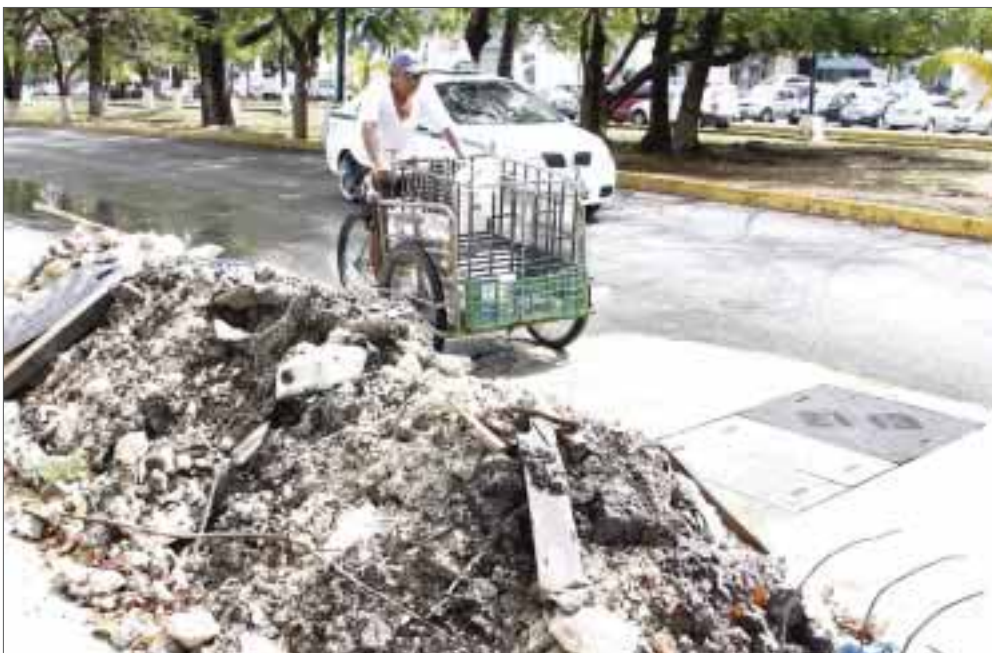
Casi media tonelada de escombros se encuentran sobre la vía pública de avenida Cobá, sin que nadie haga algo.

Cancún.- Luego de reparar un registro reportado hace dos semanas en este mismo espacio, trabajadores de la empresa Teléfonos de México (Telmex), dejaron abandonado sobre la banquetta de avenida Cobá, cerca de media tonelada de escombros.