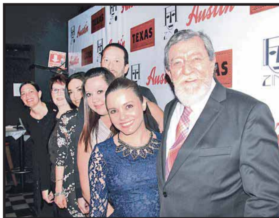
El equipo de Texas y Austin, en Music Night by Texas .

tin cuenta con una gastronomía reconocida, ofrece una amplia gama de atracciones culturales, eventos deportivos de renombre y aventuras únicas al aire libre.