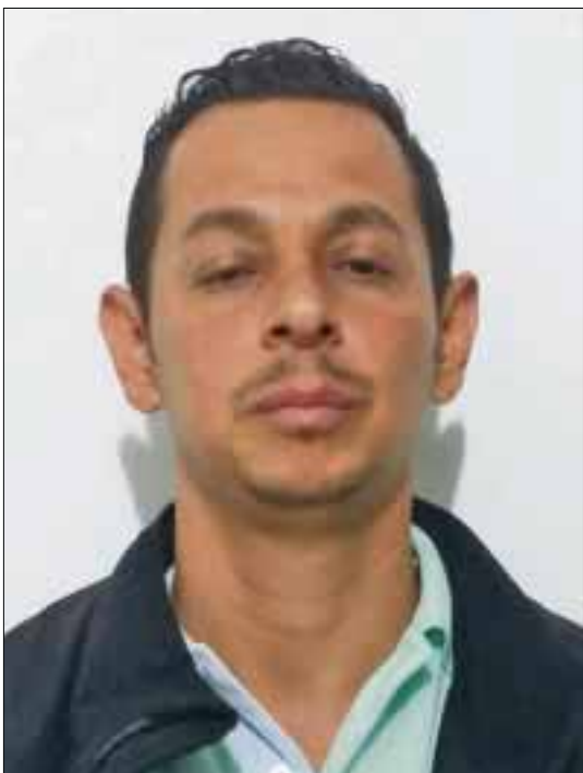
Este individuo es pieza clave para quien sigue la ruta del dinero; traía 253 mil 100 dólares en maletas doble fondo.