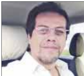
POR MAURICIO CONDE OLIVARES