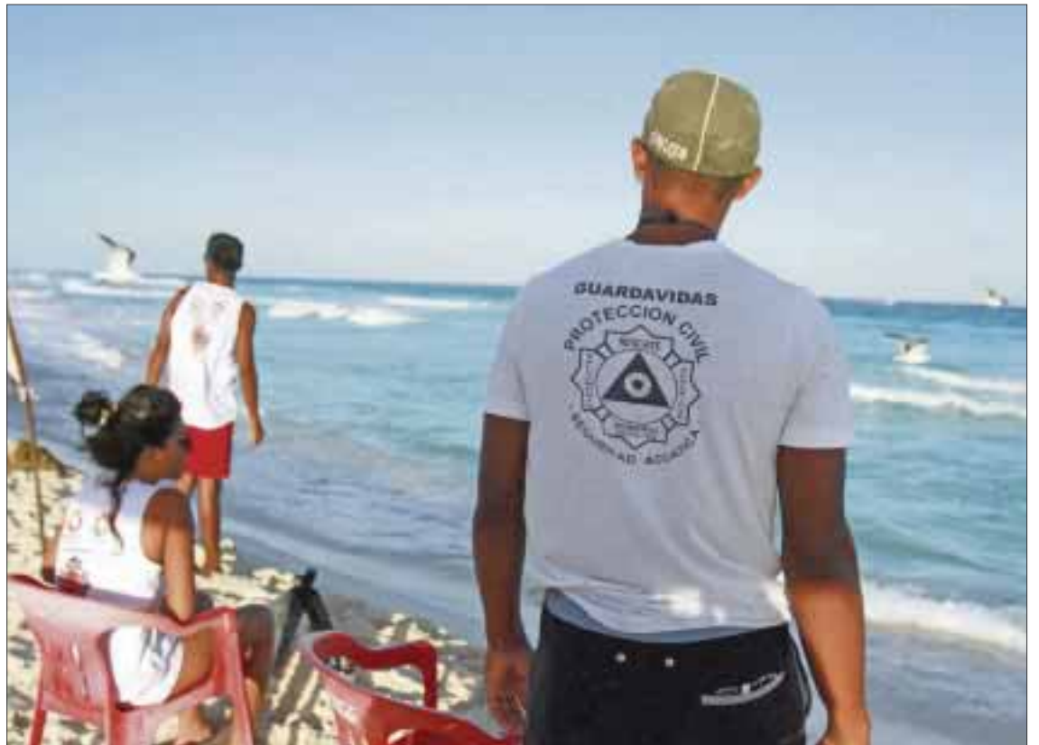
La Direcci3n de Zona Federal Mar timo Terrestre cerrar  filas a favor de los "springbreakers", con 58 elementos, autoridades y hoteleros.

Se instituy3 que las autoridades de Seguridad P blica, Bomberos, Fiscalizaci3n y Comercio en la V a P blica, realicen binomios todos los d as para verificar que los guardavidas de los hoteles tengan todas las herramientas para operar y actuar en caso de emergencia.