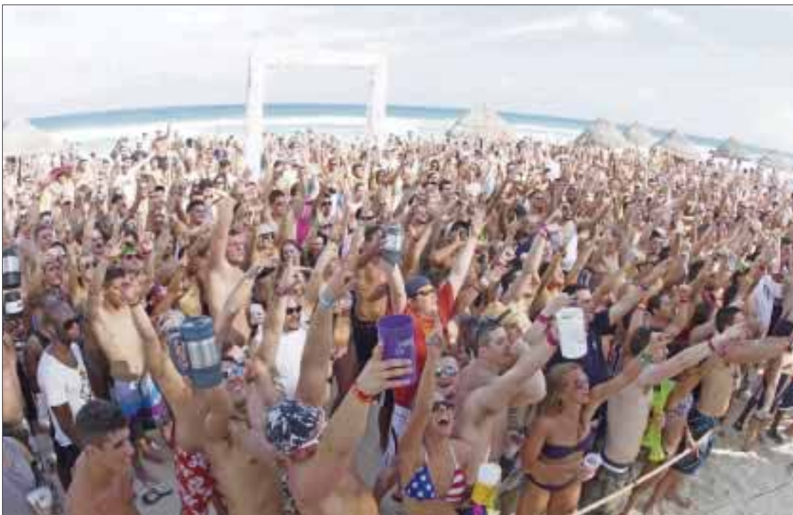
La llegada masiva de estudiantes de los Estados Unidos y Canad  dividi3 a los hoteleros, quienes estaban en contra de su llegada, pero finalmente el todo incluido los abrig3 para la realizaci3n de sus fiestas en la playa.

Canc n.- Student City, agencia de viajes especializada en el sector juvenil norteamericano, coloc3 a Canc n como el n mero uno en las preferencias para la realizaci3n del Springbreaker por arriba de Nassau, el Bahama Party Caribe y Punta Cana en Rep blica Dominicana.