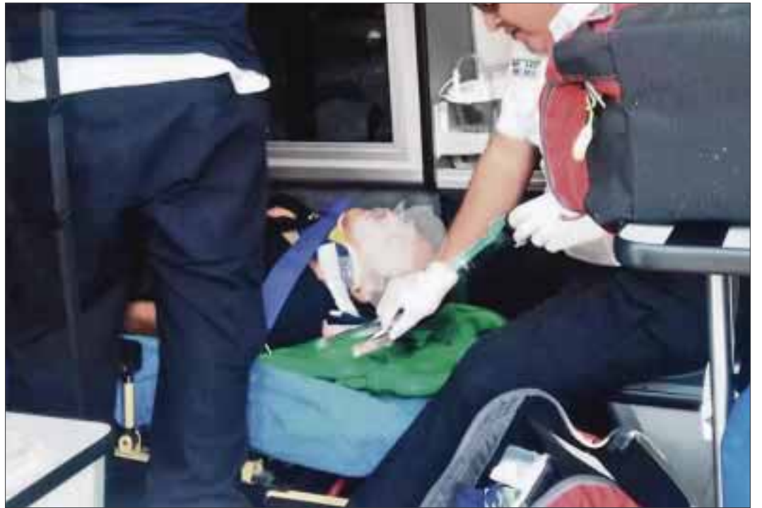
El atropellamiento ocurrió cuando el ahora occiso abanderaba un tour de bicicletas con extranjeros, principalmente estadounidenses.

Trascendió que las placas número USP-929-B de Quintana Roo entregadas a la Judicial, corresponden a un auto Audi gris, el cual es al parecer propiedad de la inmobiliaria Aldasodi, con domicilio en la zona hotelera, y que la tarde cuando sucedieron los hechos, dicho automóvil era conducido por el hijo de uno de los directivos de esta empresa, aunque esta versión no pudo ser confirmada.