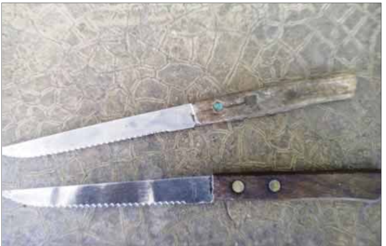
Estos cuchillos de mesa fueron las armas que le recogieron los policías a un alumno de 13 años de la secundaria Juan Vasconcelos, que quiso “apuñalar” a un compañero.

Con este caso arrancó un programa en las escuelas para prevenir los delitos, pues el caso será puesto como ejemplo de lo que no debe hacerse dentro de los planteles.