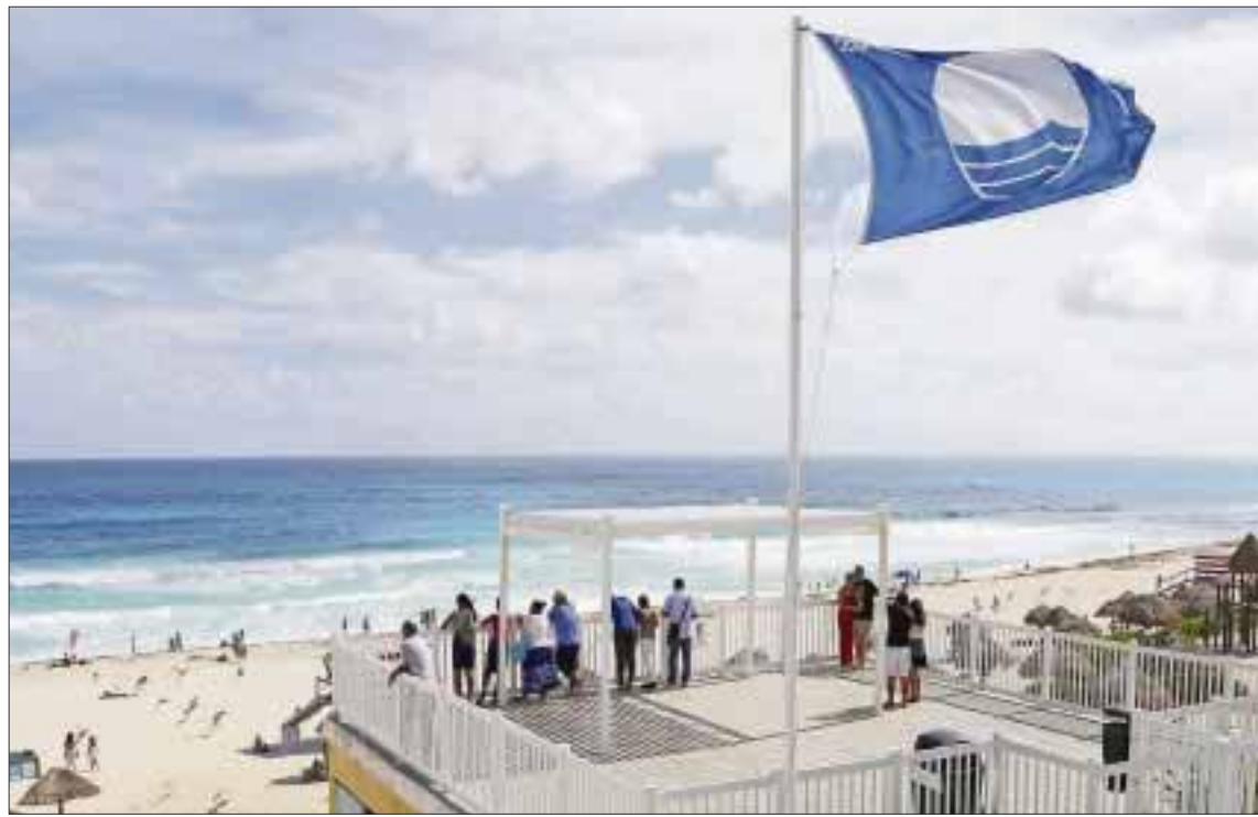
En este 2016 se trabajará para lograr el distintivo Blue Flag en Playa Coral, la primera en su tipo en Latinoamérica, por ser amigable con las mascotas.

les de gobierno e iniciativa privada es trabajar para lograr que Playa Coral, ubicada en el kilómetro 21.5 de la zona hotelera de Cancún, contribuya a elevar los estándares internacionales de calidad y mantenerse como la vanguardia en materia de arenales certificados. Además de elevar la calidad de las playas certificadas se trabajará en rehabilitar su infraestructura para poder superar la imagen que se tiene a nivel internacional. Playa Coral está a un costado de conocido parque de diversiones donde se cumplirá con los 35 criterios para obtener el galardón internacional Blue Flag.