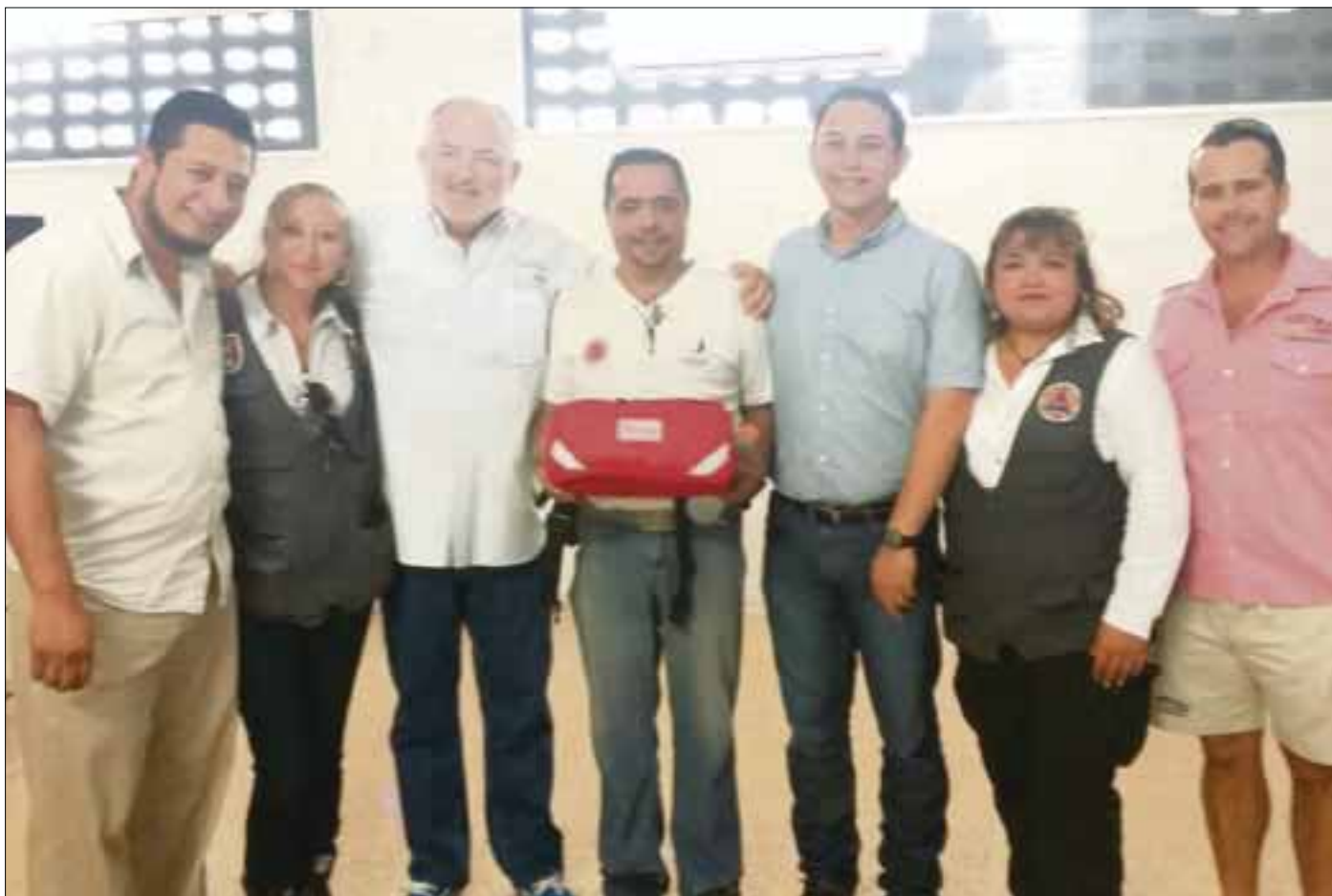
Las pruebas juveniles también otorgarán pases para la Olimpiada Nacional, lo que hace más competitiva esta prueba.

Se destacó que para esta "Ruta del Arrecife", estarán en competencia las distancias de 10 kilómetros, así como las pruebas de 7.5, 2.5, 1.25 y 250 metros, recalando que para las categorías mayores, esta prueba será clasificatoria a la competencia de Portugal que a su vez reparte boletos para los Juegos Olímpicos de "Río 2016".