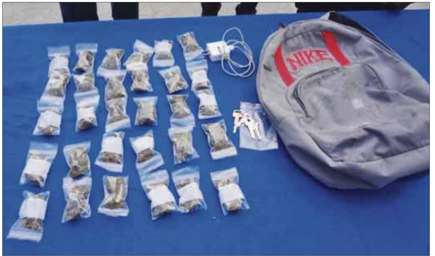
En esta mochila, el menor de edad y estudiante de secundaria, escondía la droga que supuestamente pretendía comercializar en Villas Otoch Paraíso.

El estudiante de secundaria en este centro vacacional, quedó detenido para ser trasladado a la Secretaría Municipal de Seguridad Pública para ser valorado médicamente, y posteriormente ser puesto a disposición de la Fiscalía de Atención al Narcomenudeo.