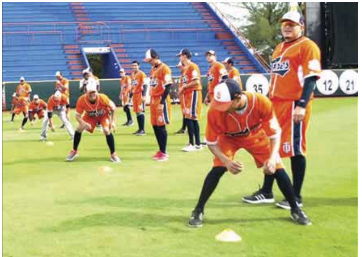
Durante dos días, la guarida Tigres será la sede mundial de los diferentes representantes de las Ligas Mayores.