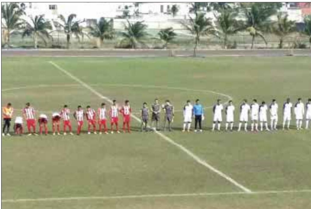
Esta semana, Pioneros FC recibe en el estadio Cancún 86 al Athletic Club Morelos, el sábado a las tres de la tarde.

Cancún.- Pioneros FC no se apiadó del último lugar de la competencia y los de Cancún terminaron goleando a los Petroleros de Veracruz con abultado marcador de 7-1 en la cancha de la UVM Boca del Río en acciones de la séptima jornada de la Liga Premier de Ascenso de la Segunda División Profesional.