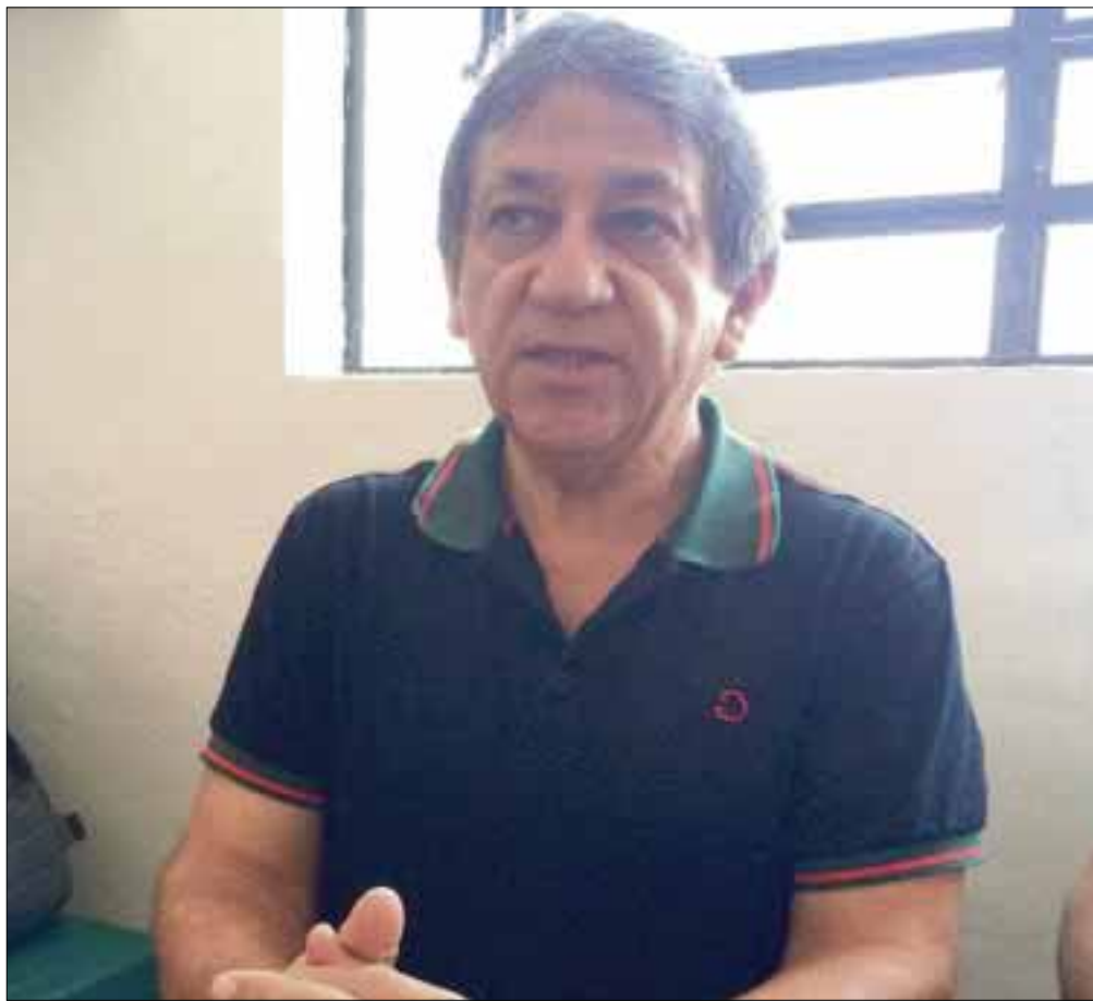
Planean realizar bloqueos y toma de la terminal aérea.

Los inconformes llegaron al acuerdo de realizar el bloqueo y la toma de la terminal aérea, hasta que la SCT les pague lo que les corresponde esta semana.