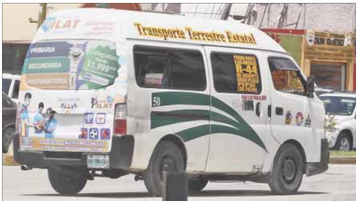
Algunas camionetas como ésta, han pegado mañosamente publicidad en el panorámico trasero, para disimular el sobrecupo que traen.

La situación “reveló” a la autoridad que aquellas camionetas tipo Urvan principalmente del sindicato de taxistas de esta ciudad, circulaban con excesivo sobrecupo de pasajeros