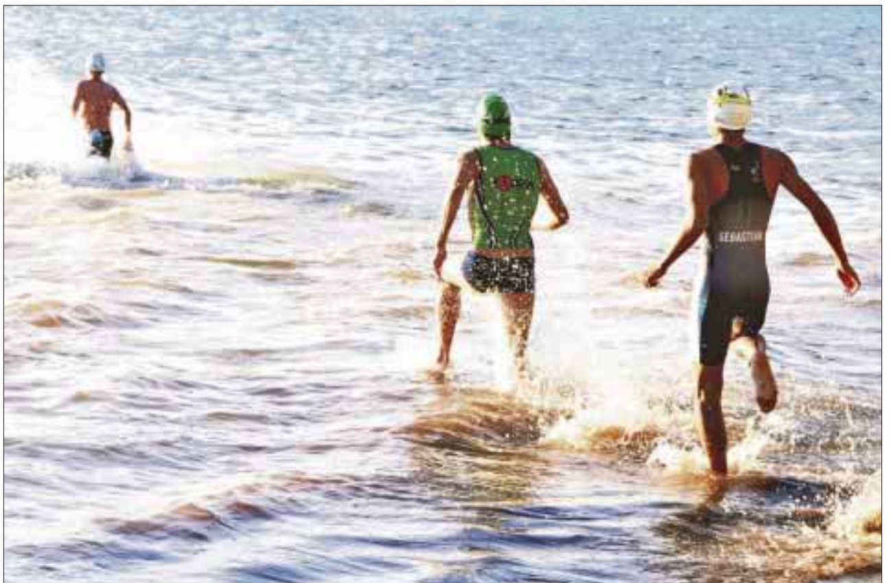
A menos de sesenta días del Mundial de Triatlón que se celebrará en Cozumel, Cancún será escenario del AquaRun 2016 en playa Coral.

El comité organizador espera la participación de más de 300 atletas, quienes llegarán con la intención de alistarse de cara a la Copa del Mundo de Triatlón a celebrarse durante las fiestas patrias, en la isla de las golondrinas.