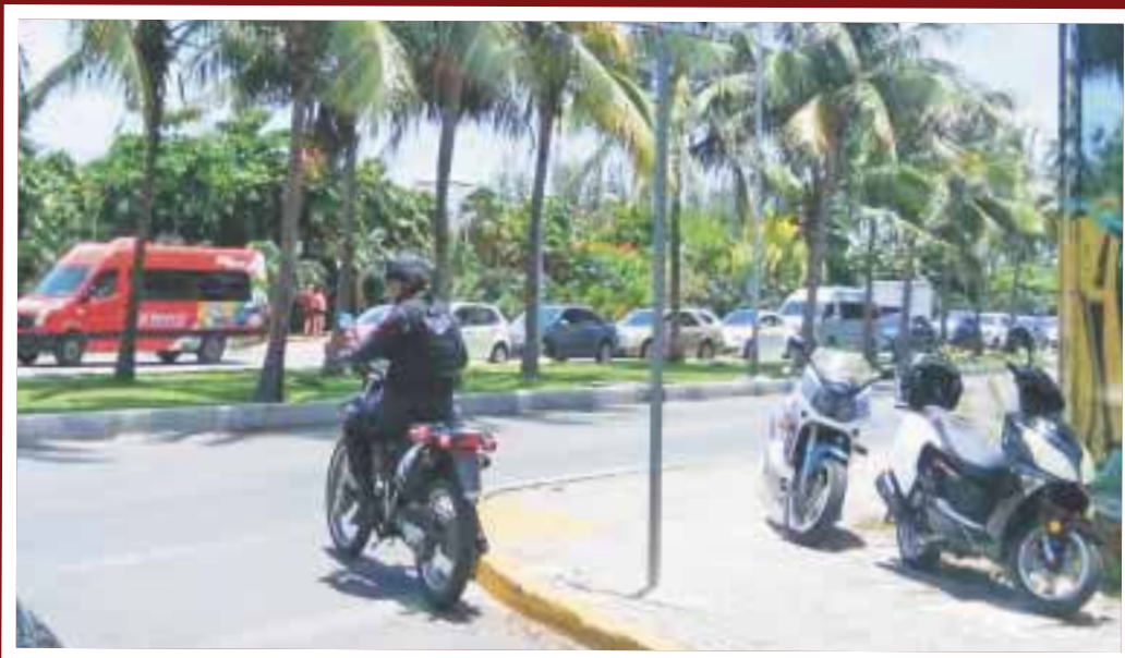
El Escuadrón Motorizado de Acción Policial tiene una triple función de enlace en estas vacaciones.

Cancún.- Desde ayer y hasta que finalice la administración, la Policía Turística estará reforzada con seis elementos del Escuadrón Motorizado de Acción Policial (EMAP) que realizan recorridos constantes con la finalidad de inhibir el delito.