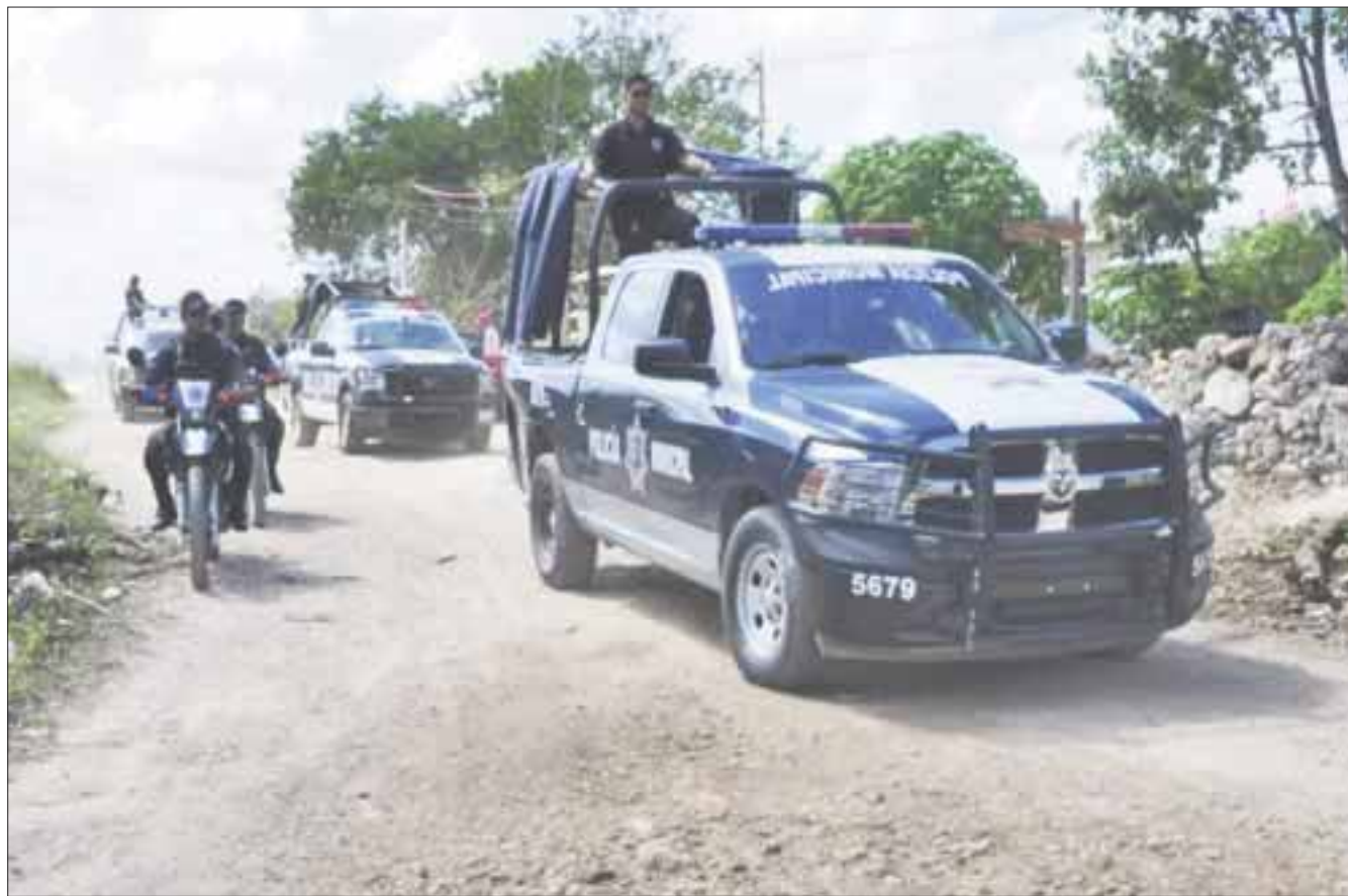
Las regiones 102, 103, 105, 247, 248, Valle Verde, Avante y Bonfil son las colonias más peligrosas para mujeres en el municipio de Benito Juárez.

Ahora, con la nueva ley del ramo se crearán políticas públicas para acompañar la legislación.