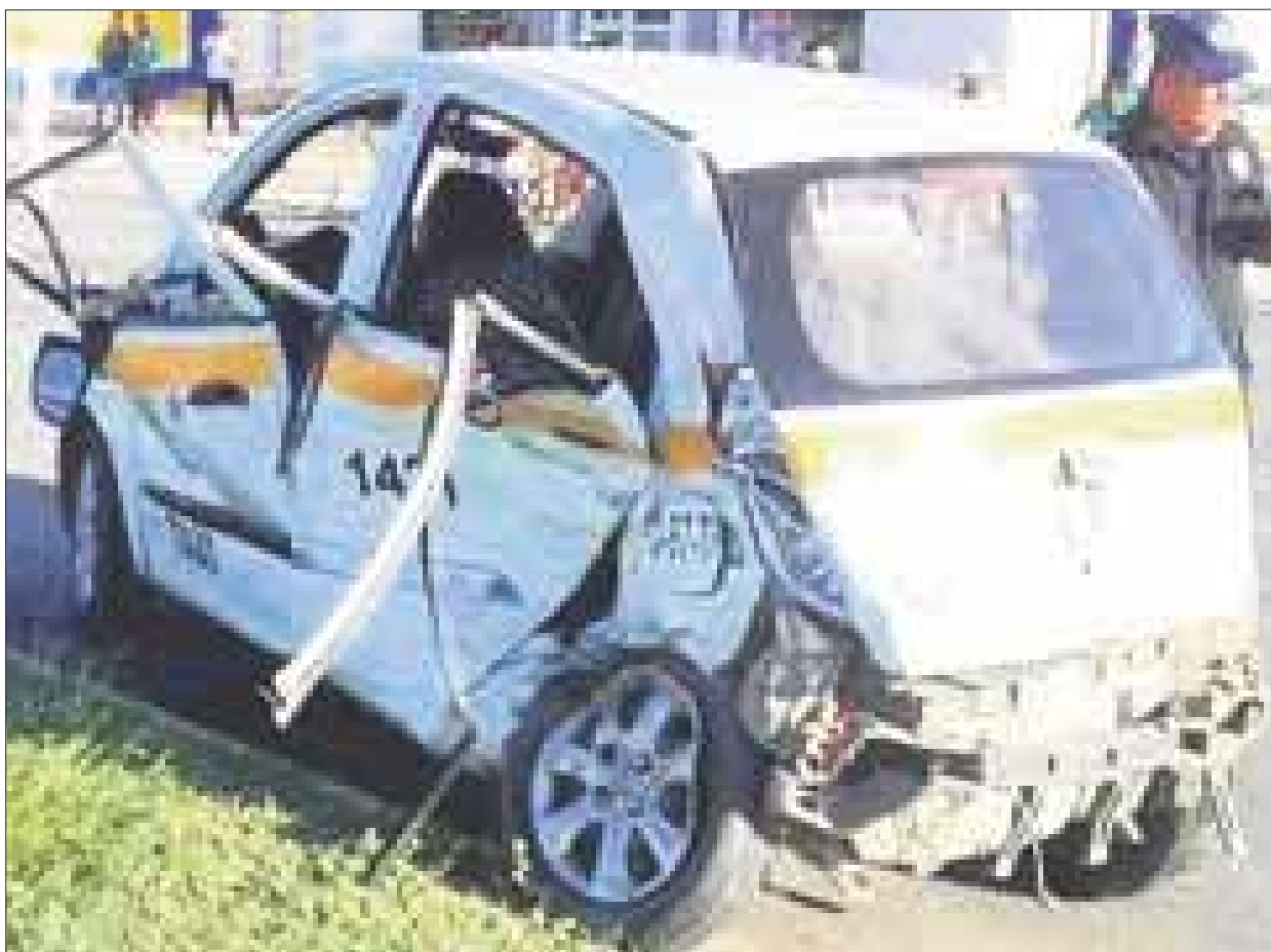
En el taxi, número 1421 viajaba una mujer y su hijo de 4 años, quien falleció.

En tiempo y forma, la Fiscalía General del Estado integró la carpeta de investigación consignada al Juzgado Penal y el domingo se efectuó la primera audiencia, en donde el juzgador determinó vincular a proceso al imputado, además de fijarle dos años de prisión preventiva y tres meses para que la autoridad ministerial concluya con las investigaciones necesarias.