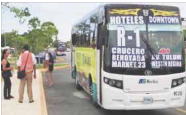
Hay un descontrol entre transportistas por el cambio de sentido en varias calles de Cancún.

Cancún.- Antes de que finalice la administración municipal, en su afán de dejar su huella, a partir del 1 de agosto cambiará el sentido de la avenida Tulum y otras calles aledañas para evitar el congestionamiento del transporte de servicio público. La falta de información por parte de la Dirección de Tránsito y el propio ayuntamiento de Benito Juárez ha propiciado nula comunicación con los operadores de camiones y combis del servicio público, que a una semana del cambio desconocen cuáles