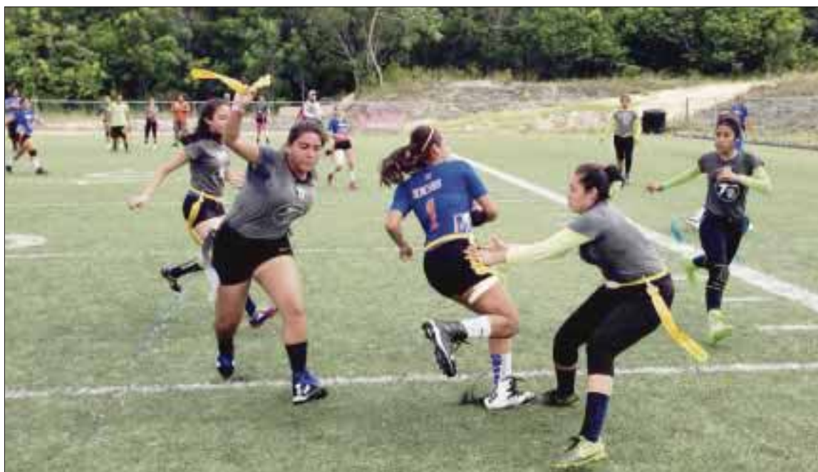
Las Sirenas lucharon contra la experiencia del equipo de la Ofase, pero al final sucumbieron por un cómodo 47-19.

Cancún.- La Selección de la Ofase (Organización de Fútbol Americano del Sureste) venció por cómodo marcador de 47-19 sobre las Sirenas de Cancún en el partido de la gran final y se consagró flamante campeón de la categoría U-17 Femenil en el Abierto Nacional de Tocho Bandera, celebrado en el Coliseo Maya de la Universidad Anáhuac.