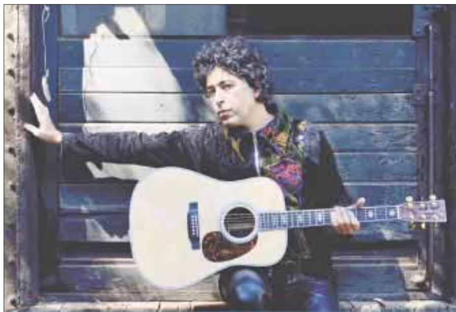
Manuel García ha obtenido discos de Platino por sus altas ventas en Chile; participó en Viña del Mar donde fue ovacionado por varios minutos y obtuvo Gaviota de Oro, además de tres premios Altazor y el Premio a la Música, entre otros.

Puntos de venta: A través del sistema www.superboletos.com , Palacio de Hierro, en Taquillas de la Arena Monterrey, Innova Sport y al Teléfono 15 15 41 00. Los boletos oscilan entre los $350.00 hasta los $3,700.00.