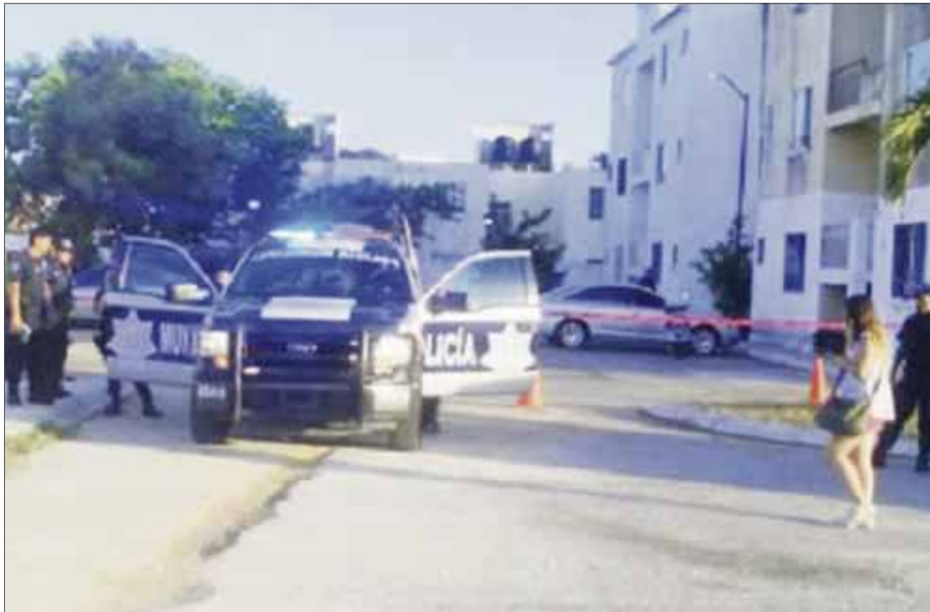
Los vecinos del fraccionamiento Mundo Habitat llamaron al 066, al escuchar los gritos de la joven embarazada.

La muchacha vino a Playa del Carmen a visitar a su novio, cuando le sorprendió la muerte en la colonia Mundo Hábitat, colonia ubicada frente a La Toscana, en donde una par de semanas antes habían violado y herido a otra mujer con un arma punzocortante, es decir, es un modus operandi similar.