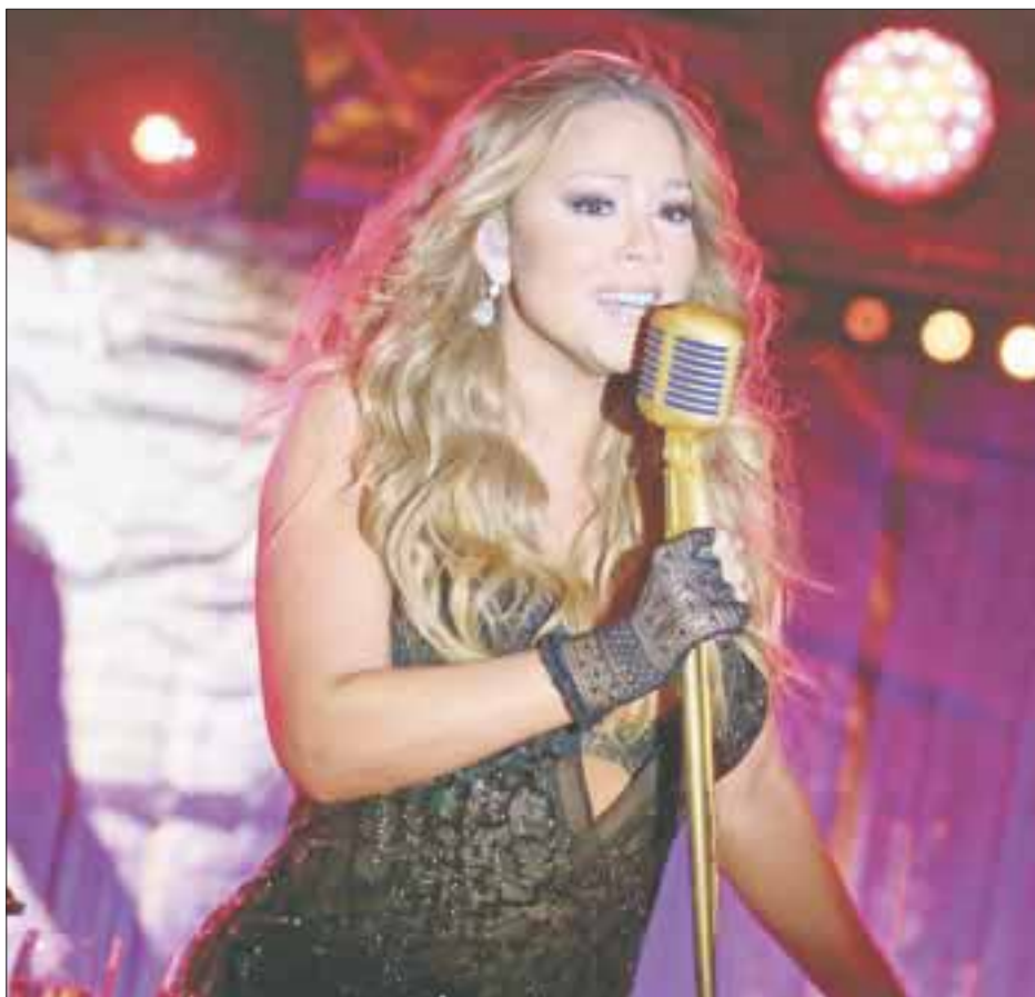
Miles de fans podrán deleitarse con la extraordinaria voz de Mariah Carey. La gira en México contará con dos únicas fechas en la Arena Ciudad de México y Arena Monterrey.

Señaló que no está peleada la canción de contenido social con lo romántico, "cuando una canción está bien lograda funciona, porque la canción social no debe ser un manual para la vida, sino una invitación a la reflexión, por ejemplo Bob Dylan o Violeta Parra tienen tanto canciones para celebrar como para pensar, esa versatilidad hace de los artistas algo muy especial, porque así somos los humanos y hay momento para todo". De su presentación en el Lunario el próximo 19 de agosto, adelantó que será un recorrido por toda su discografía y una probadita de su nueva música. Además contará con invitados especiales, tanto chilenos como mexicanos.