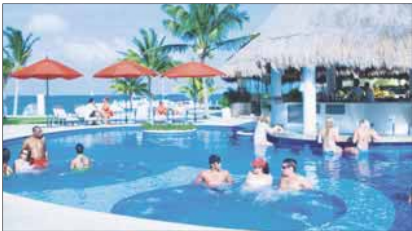
El sistema "Todo Incluido" genera polémica y controversia en Quintana Roo.

Ante este problema detectado por el SAT se realizan revisiones en mil 327 hoteles localizados en el Caribe mexicano en donde se ha logrado recuperar 225 millones de pesos por gravámenes no reportados.