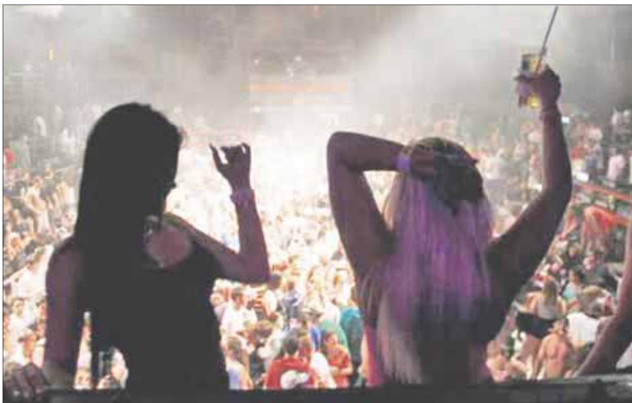
Los antros y bares están “bajo la lupa” de Fiscalización, a fin de frenar la entrada de menores de edad.

Con un promedio de 14 supervisores, vigilarán que los menores de edad no entren a bares, antros o que se les venda algún tipo de bebida embriagante, ya sea en playas o restaurantes.