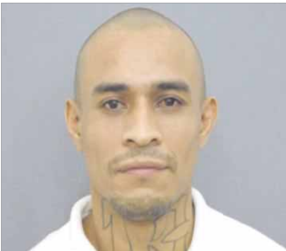
El reo recapturado se encuentra sentenciado a 16 años de prisión por violación equiparada.

Argenis G.V. conducía, el viernes una camioneta tipo Mitsubishi, color gris oscuro al momento en el que se estrelló en contra del taxi marcado con el número 1421, en donde además del operador de la unidad, viajaba una mujer y su hijo