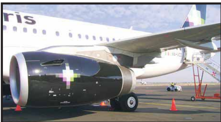
Nueva ruta Ciudad de México-San Francisco.

En la reunión, encabezada por el mandatario electo, quien tomará pos-