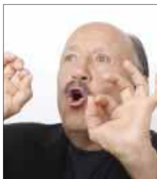
Fue a inicios de julio cuando Polo Polo anunció su retiro de los escenarios.

*** El comediante desmiente padecer dicha enfermedad. Su gira del adiós arrancará el próximo 6 de agosto con una presentación en El Cuevón, de San Jerónimo