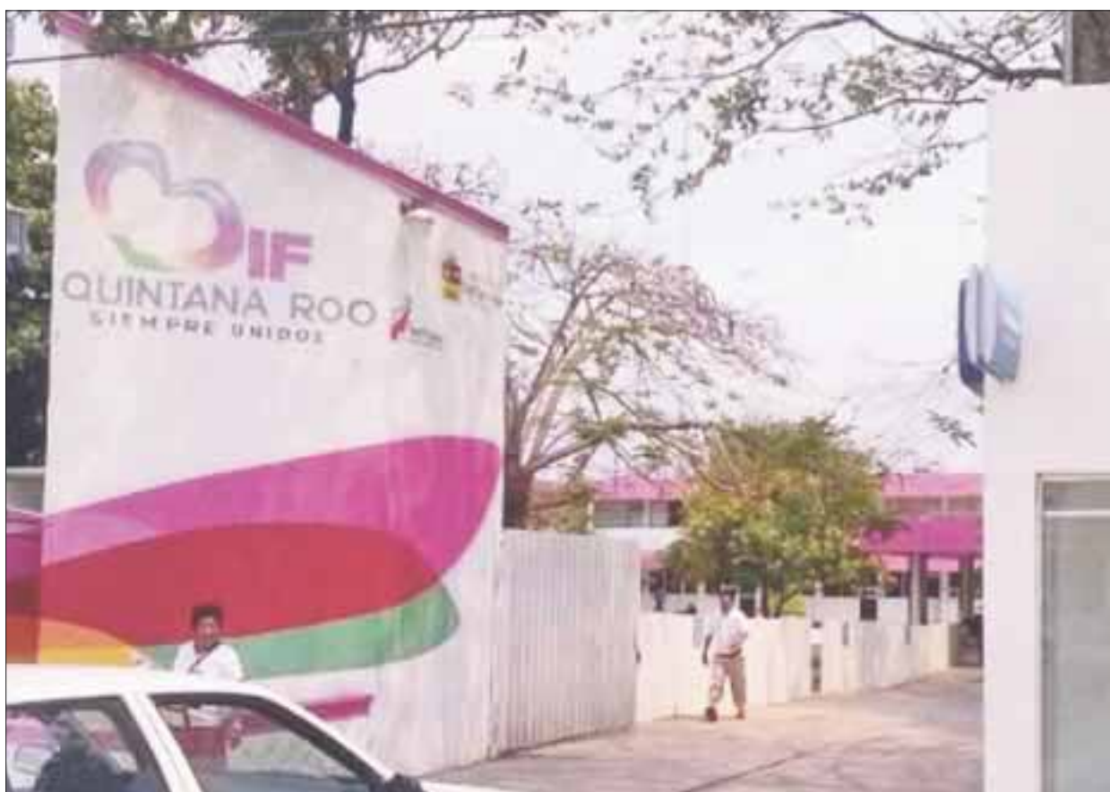
El DIF revela que por cada denuncia de violencia hay 10 que no trascienden.

Explicó que Quintana Roo, al ser una entidad con mayor desarrollo turístico, hace también una de las entidades con mayor problema de índices de violencia en el seno familiar.