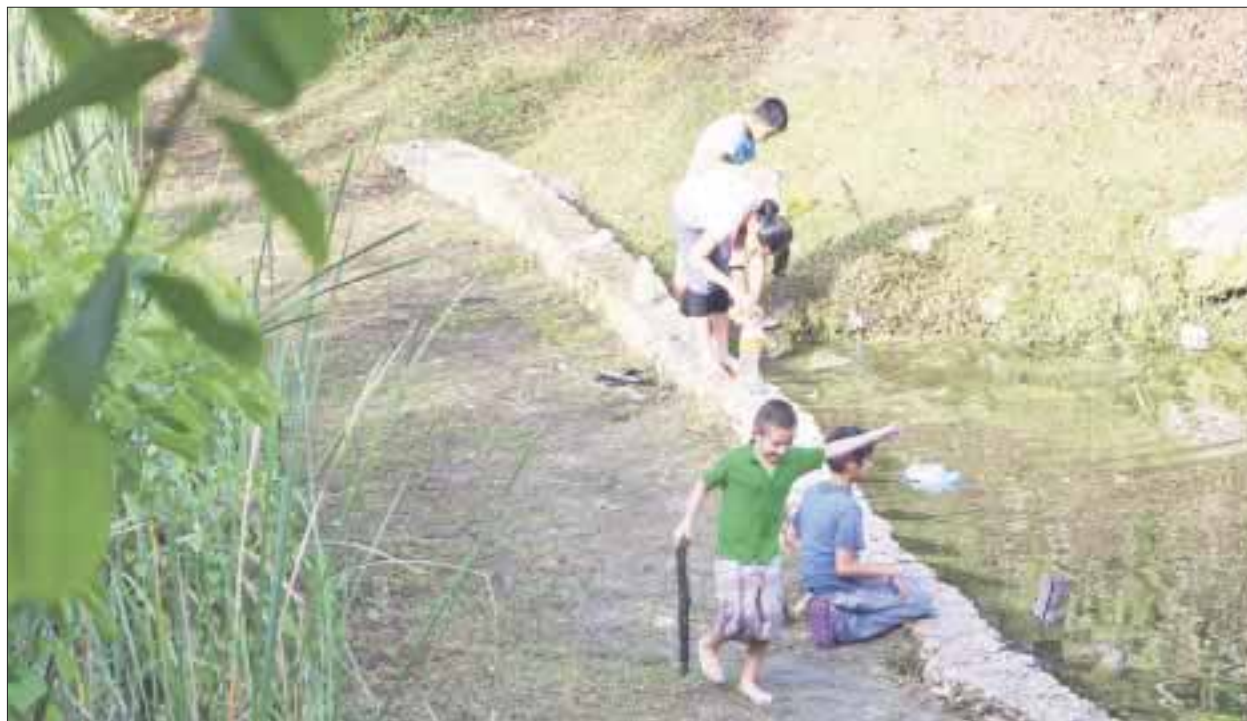
De esta manera luce ahora el parque de la región 230, luego de pasar casi un año en manos de los delincuentes.

Cancún.- Más de un año soportaron los vecinos de la región 230 los actos vandálicos en el parque del Cenote de esta apartada colonia; la cara de aquel parque ya es otra, luego que apareciera la denuncia de los vecinos en las páginas de DIARIOIMAGEN.