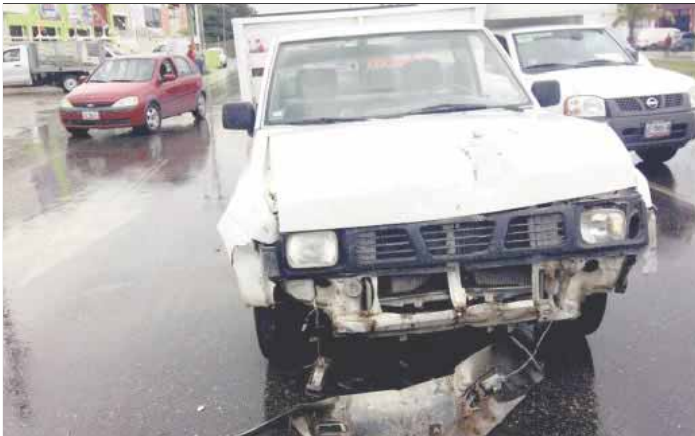
Una “combi” del transporte público fue impactada por esta “estaquitas” en la Región 99. El choque dejó seis pasajeros de la Urvan lesionados.

Con este percance en la ciudad van más de 10 en las últimas semanas con las mismas características: la circulación a altas velocidades, tanto de vehículos particulares como del transporte colectivo, sin que se tomen algunas medidas de seguridad.