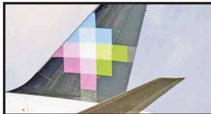
Estrena vuelo de Monterrey a Chicago.

victoriagprado@gmail.com Twitter: @victoriagprado