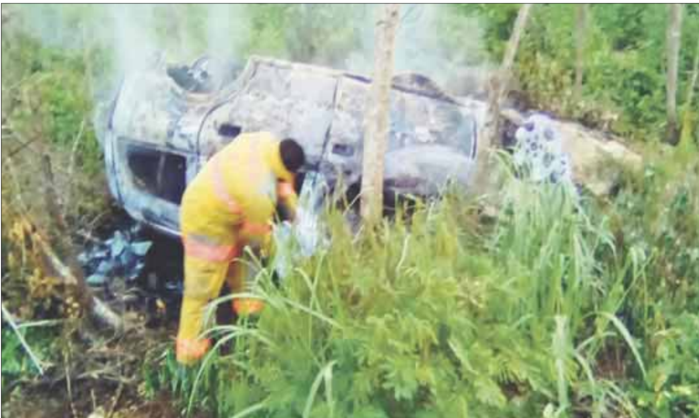
Las personas que murieron en la volcadura fueron trasladadas a la ciudad de Playa del Carmen, donde serían veladas.

Cancún.- Las víctimas del mortal accidente registrado la madrugada del pasado martes fueron trasladadas ayer a Playa del Carmen, donde serán veladas por sus familiares, según trascendió.