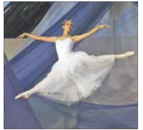
La Lotería Nacional realizará el 2 de julio la función de fin de cursos y graduación del Ballet Clásico Cancún, de la escuela de danza de la Secretaría de Educación en el Teatro de Cancún.