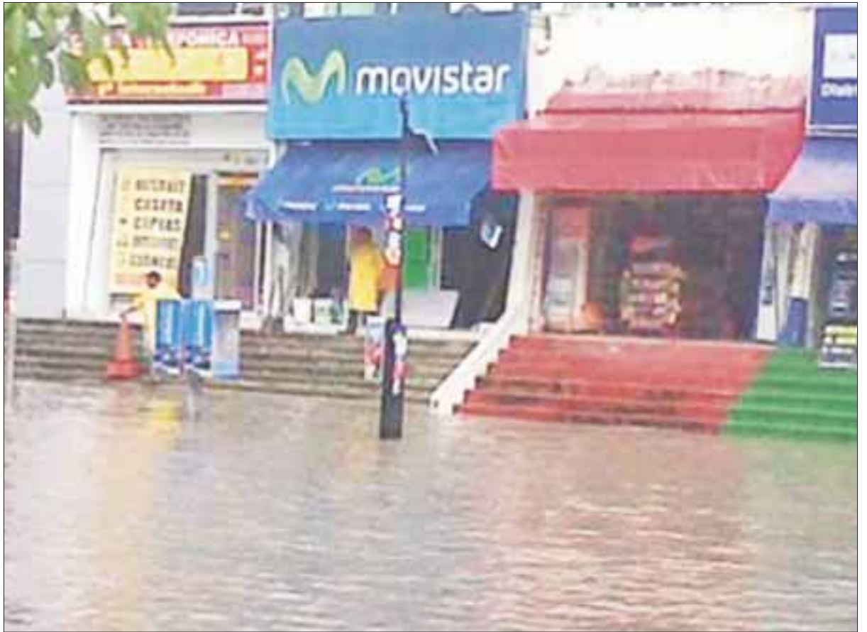
Desquició el chubasco a la ciudad de Cancún, al inundarse calles y avenidas que ocasionaron caos vial al rebasar el agua las banquetas.

Los pobladores asentados cerca de humedales como la colonia Lombardo Toledano, Donceles 28, y Puerto Juárez padecieron inundaciones al superar su capacidad el drenaje pluvial o estar tapados con lodo.