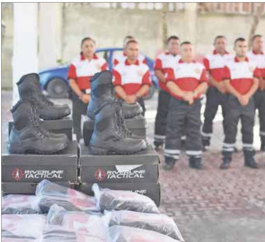
Uniformes y equipo estrenaron los vulcanos para cumplir con su misión.

Añadió que se han estado proporcionando implementos de trabajo especiales para que los vulcanos operen con el máximo posible de seguridad para ellos mismos y con mayor efectividad en sus tareas.