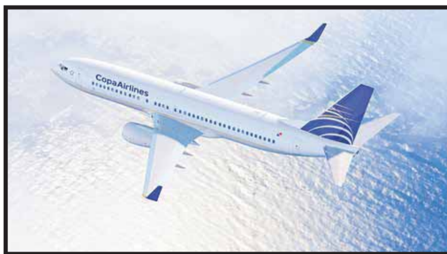
De Panamá a Holguín.

Durante la ceremonia de vuelo inaugural, realizado en el Aeropuerto Internacional de Tocumen en Pan-