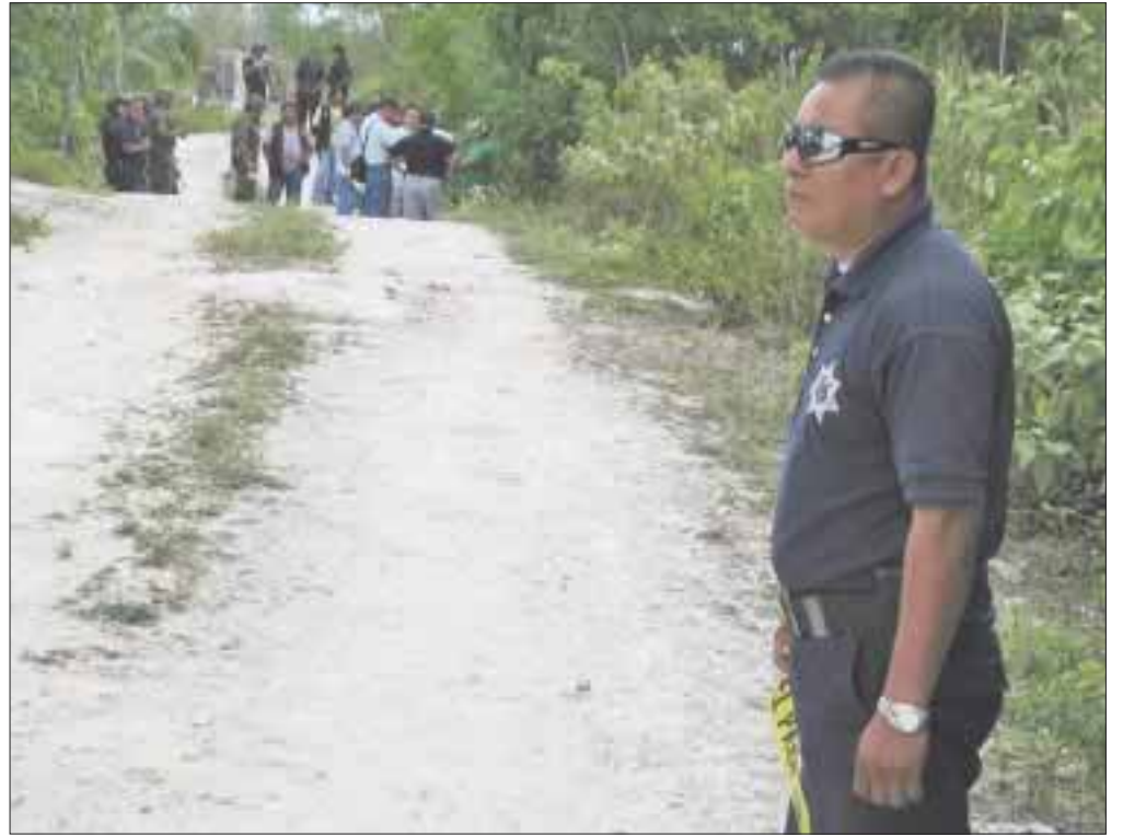
El hombre que apareció muerto en la periferia de la delegación Alfredo V. Bonfil, fue ejecutado de un disparo en la nuca.

Vale la pena mencionar que al momento de ser encontrado, el cadáver vestía bermuda de colores, así como una playera azul y no traía calzado