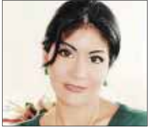
POR YOLANDA MONTALVO