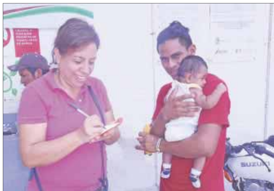
En la entrada del Hospital General Jesús Kumate Rodríguez varias mujeres del “Misterio Pan de Vida” le obsequian comida a la gente humilde.

Cancún.- Todos los jueves, desde hace dos años, de 10:00 a 12:00 horas en la entrada del Hospital General Jesús Kumate Rodríguez varias mujeres del “Misterio Pan de Vida”, le obsequian comida a la gente humilde que acude a solicitar alguna consulta o servicio, porque la mayoría son personas de escasos recursos.