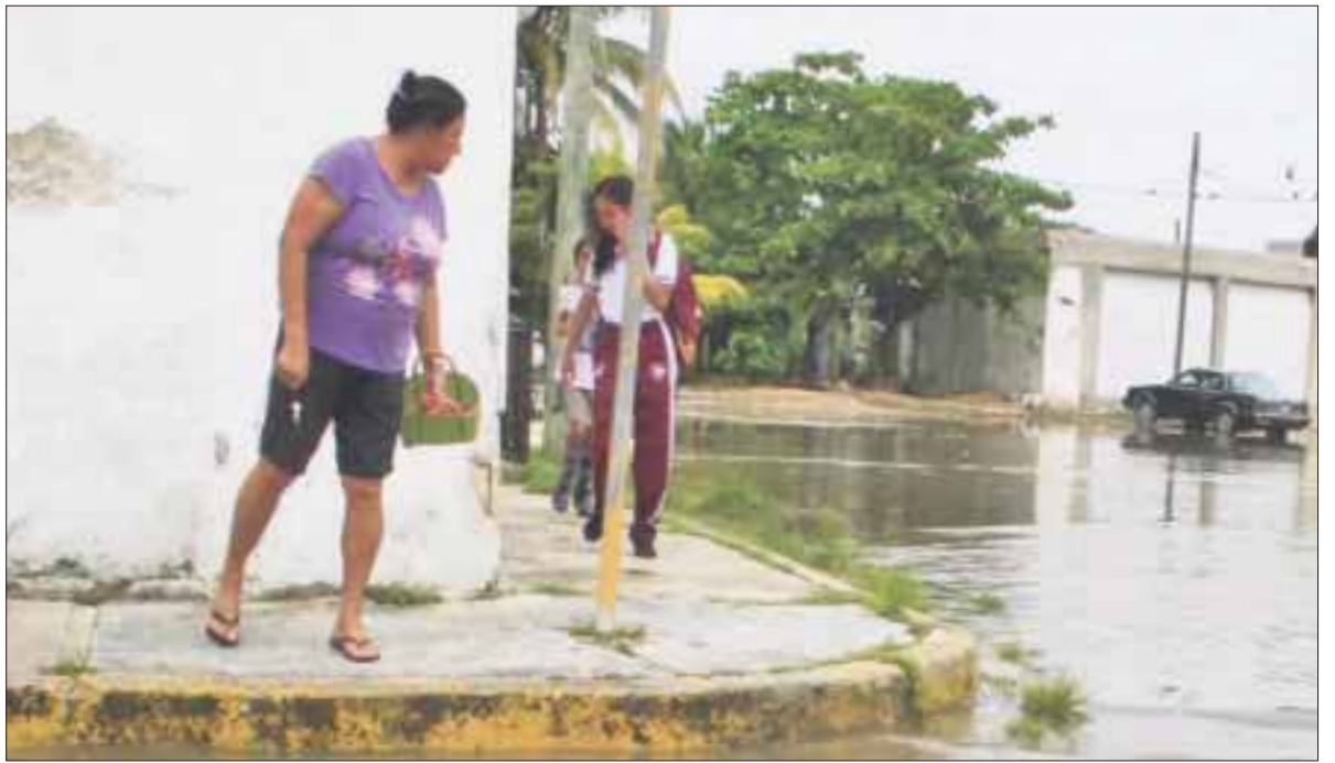
El Ejército activó el plan DN-III-E, como medida preventiva ante las constantes precipitaciones pluviales en la zona sur del estado.

Las colonias que sufren los constantes inundaciones de calles son las populares, el agua entra a sus endebles hogares, las más críticas son: Los Monos, Nuevo Progreso y Antorchista.