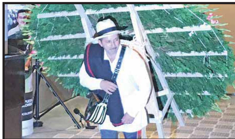
Así se carga una silleta.

últimos años, eventos tan importantes como la Asamblea de Gobernadores del Banco Interamericano de desarrollo BID, 2009; Congreso Iberoamericano de Cultura, 2010; XXXIII Congreso Interamericano de Psicología, 2011; Asamblea General de la Asociación de Ciudades iluminadas, LUCI, 2012; Copa Mundo de Billar, 2013; Foro Urbano Mundial WUF7, 2014; XXI Asamblea General de la Organización Mundial del Turismo, 2015 y, en marzo pasado el Congreso Mundial de Emprendimiento.