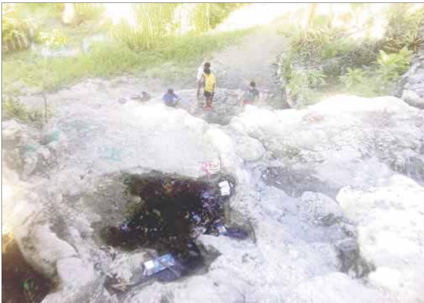
Las tortugas y los peces de colores que habitaban los tres estanques de agua, fueron robados al igual que la bomba de agua.

Es de esta forma, como desde hace un año la cascada se quedó seca, ya que unos desconocidos se robaron la bomba que la alimentaba y el ayuntamiento cancenense no ha querido reponerla o si quiera mandar a limpiar el lugar.