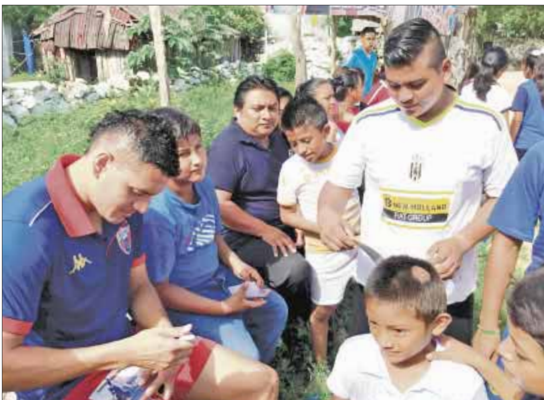
Los jugadores de Atlante, se dieron el tiempo para convivir con una parte de los integrantes del cuadrangular que se disputó en Tres Reyes.