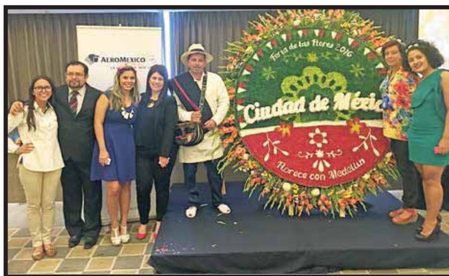
Los participantes, en la presentación de la Feria de las Flores.

todos los eventos es el desfile de los silleteros, que integran 500 artesanos (hombres, mujeres y niños), de Santa Elena de Medellín, quienes llenan las calles de Medellín con silletas que cargan en hombros, con más de 100 kilos de peso y decoradas con flores de colores.