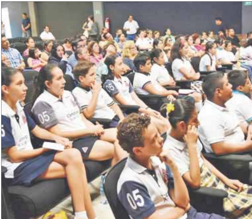
Existen espacios culturales para que los jóvenes desarrollen sus cualidades artísticas.