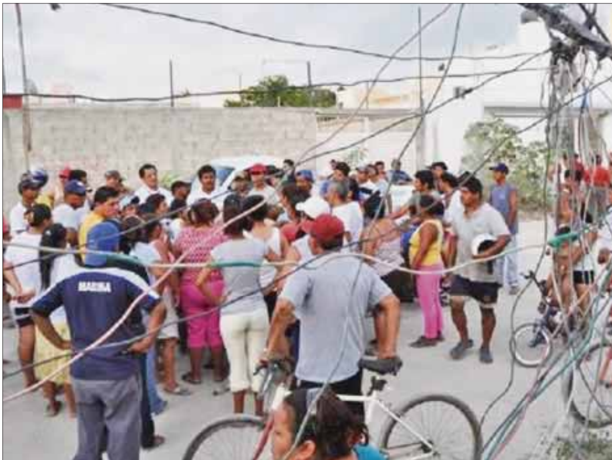
Por un pleito por la luz, un joven de 27 años perdió la vida la madrugada de ayer.

Cerca de la media noche, el ahora occiso quien estaba en estado de ebriedad, salió de su casa y fue directamente a la vivienda de su asesino, con quien discutió. Según testigos, tras la discusión, la víctima regresaba a su casa cerca de la 01:30 de la madrugada, cuando fue sorprendido por “El Guerrero”, quien aparentemente lo habría lesionado con cuchillo. A la llegada de los cuerpos de emergencia, sólo fue para informar a la ahora viuda que su marido había fallecido.