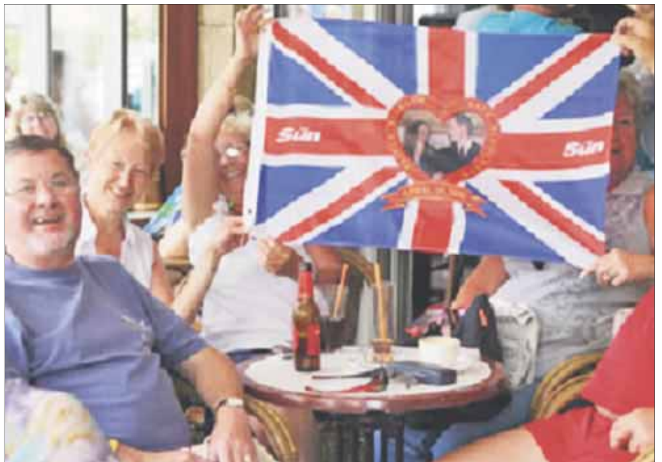
El impacto real de la salida de Gran Bretaña de la Unión Europea se notaría en la temporada de invierno en la Riviera Maya.

Indicó que es prematuro aún para ver una tendencia clara, especialmente porque el mercado alemán en donde es más notorio este encarecimiento de los paquetes de viaje, que tienen una planeación de al menos tres meses para viajar.