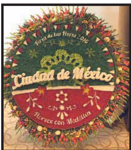
La silleta, dedicada a la Ciudad de México.