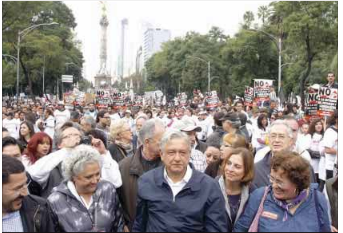
Andrés Manuel López Obrador y simpatizantes marcharon del Ángel de la Independencia hacia la Glorieta de Colón.

Federal en contra de maestros, padres de familia y de la población en general congregada en Nochixtlán”, condenó.