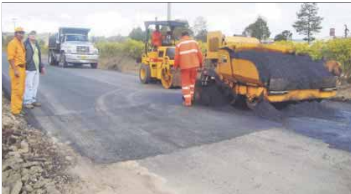
El mayor gasto realizado en Quintana Roo es en inversión pública y ha mantenido su gasto corriente a raya, según valoró la Agencia HR Ratings.

La Agencia HR Ratings, aunque considera que el estado ofrece seguridad para el pago oportuno de sus obligaciones de deuda, advierte un moderado riesgo crediticio, con debilidad en la capacidad de pago ante cambios económicos adversos. De allí, la importancia para Quintana Roo, de mejorar los factores que inciden en la captación de sus ingresos disponibles, que le permitan soportar las variaciones al entorno económico nacional e internacional.