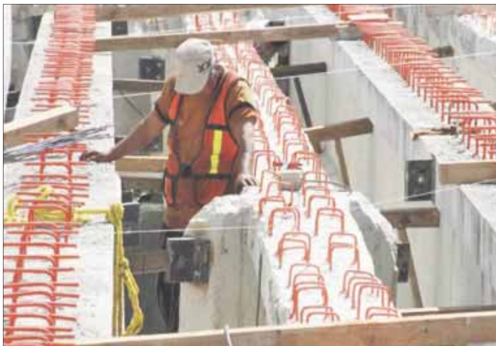
La industria de la construcción avanzó 48.4 por ciento anual, el mayor aumento en el país.

De acuerdo con el reporte de la actividad industrial estatal, Quintana Roo con un avance 19.9 por ciento anual en mayo, encabeza el aumento de la dinámica industrial apenas por debajo de Aguascalientes que creció 21.2 por ciento.