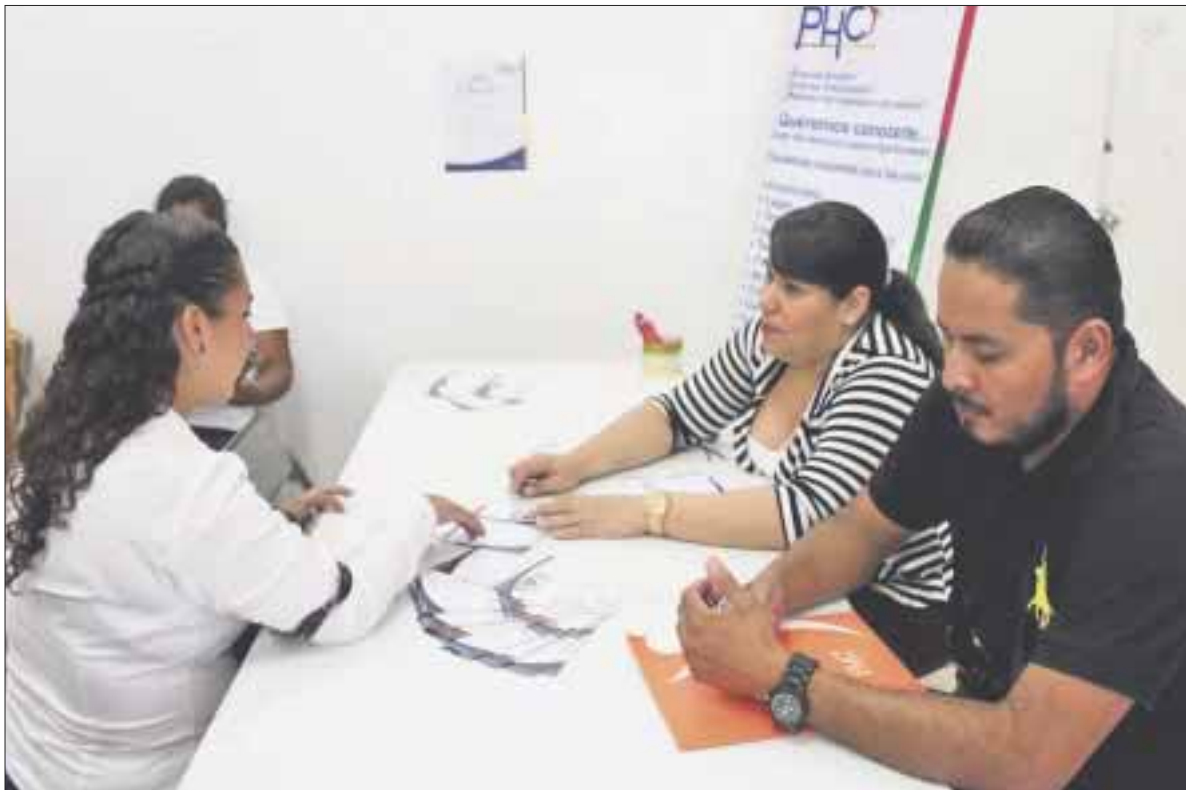
En estas ferias, más del 90 por ciento de los solicitantes son contratados.