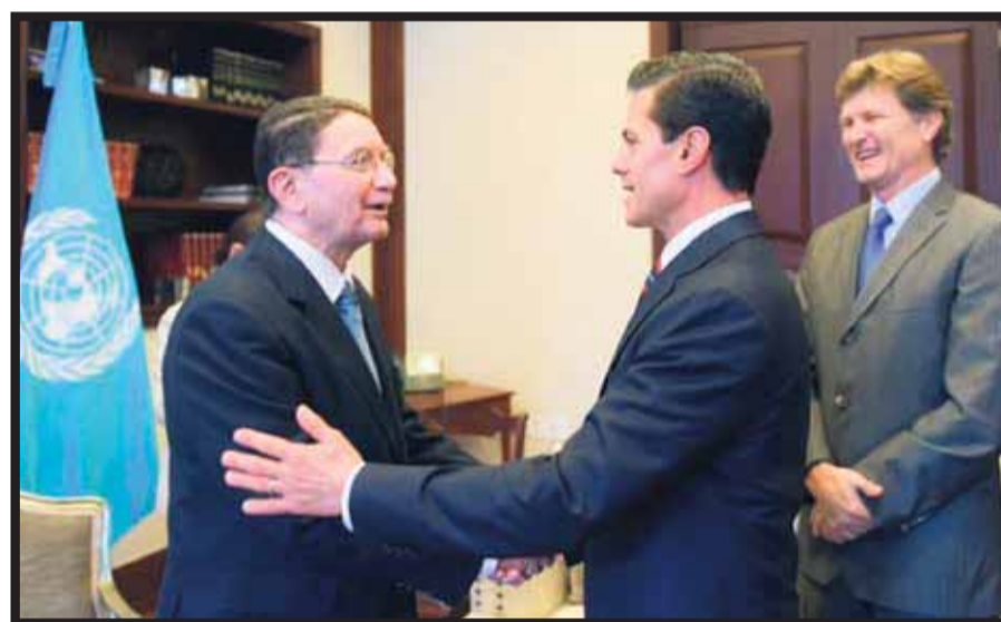
Talef Rifai, secretario general de la OMT; Enrique Peña Nieto, presidente de México, y Enrique de la Madrid, secretario de Turismo federal.

Cabe mencionar que el primer lugar en captación de turistas internacionales durante el 2015 es Francia, con 86 millones 112 mil; seguido de Estados Unidos, con 77 millones 936 mil; en tercer lugar se ubica España, con 68 millones 215 mil; en cuarto China, con 56 millones 886 mil, y en