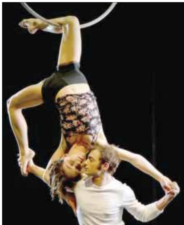
El espectáculo cuenta con las actividades típicas de la tradición del circo, con el estilo del arte callejero.

El espectáculo que podrá ver el público mexicano en el