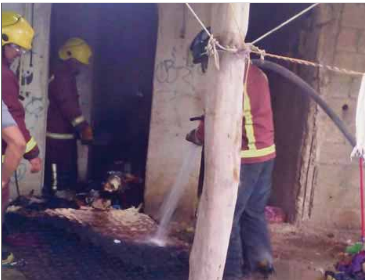
Dos menores que se encontraban solos al interior de una casa de la región 235, fueron rescatados por su joven tía, antes de morir quemados.

Por lo pronto, la casa quedó reducida a cenizas, por lo que la familia fue auxiliada por vecinos, quienes no alcanzan a comprender cómo se originó el fuego.