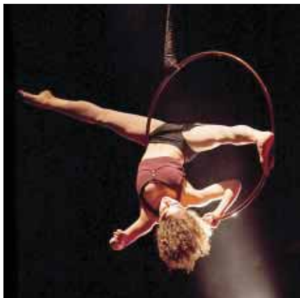
“Traces” ofrecerá 13 funciones en el Centro Cultural Teatro 1 y serán dos semanas exclusivamente, del 20 al 31 de julio.