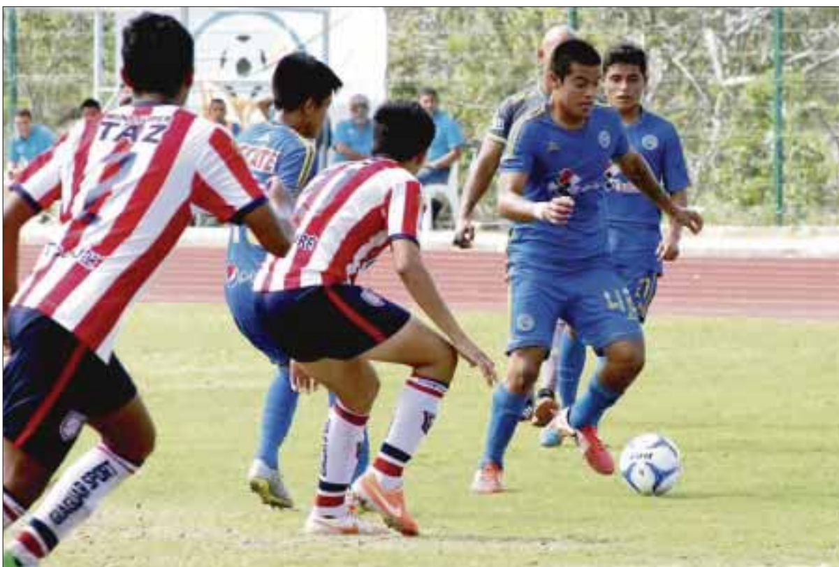
Los Chacmoles de Yalmakán tendrán una tarde complicada hoy, cuando enfrenten a los filibusteros de Campeche.

Por su parte Corsarios de Campeche, campeón de zona, selló la temporada con 44 puntos producto de 13 triunfos, 5 empates y 2 reveses, con 34 anotaciones a favor y 12 en contra.