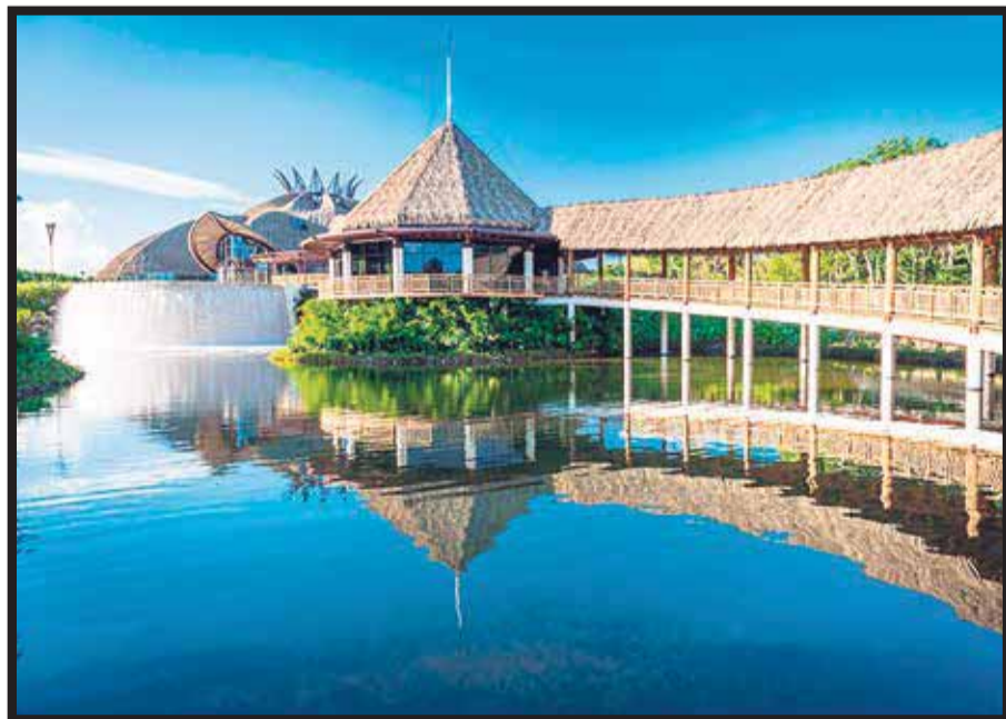
Grupo Vidanta continúa invirtiendo en México.

El director general de grupo Vidanta confirmó que la primera etapa del parque temático del Cirque Du Soleil en Puerto Vallarta estará abierta en 2018, pero el concepto total estará lis-