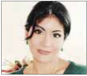
POR YOLANDA MONTALVO