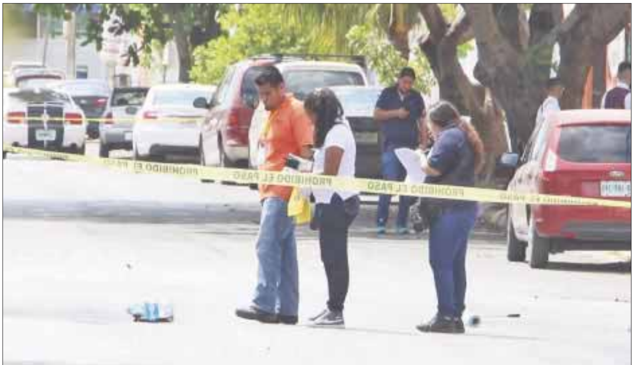
El occiso era seguido por dos sujetos que viajaban en una moto, los cuales dispararon en cinco ocasiones.

Fuentes no oficiales revelaron que detrás de la supesta motocicleta en la que escapaban los gatilleros, también iba un auto Versa, el cual aparentemente colisionó con un taxi, pero extrañamente logró evadir la situación y también se dio a la fuga.