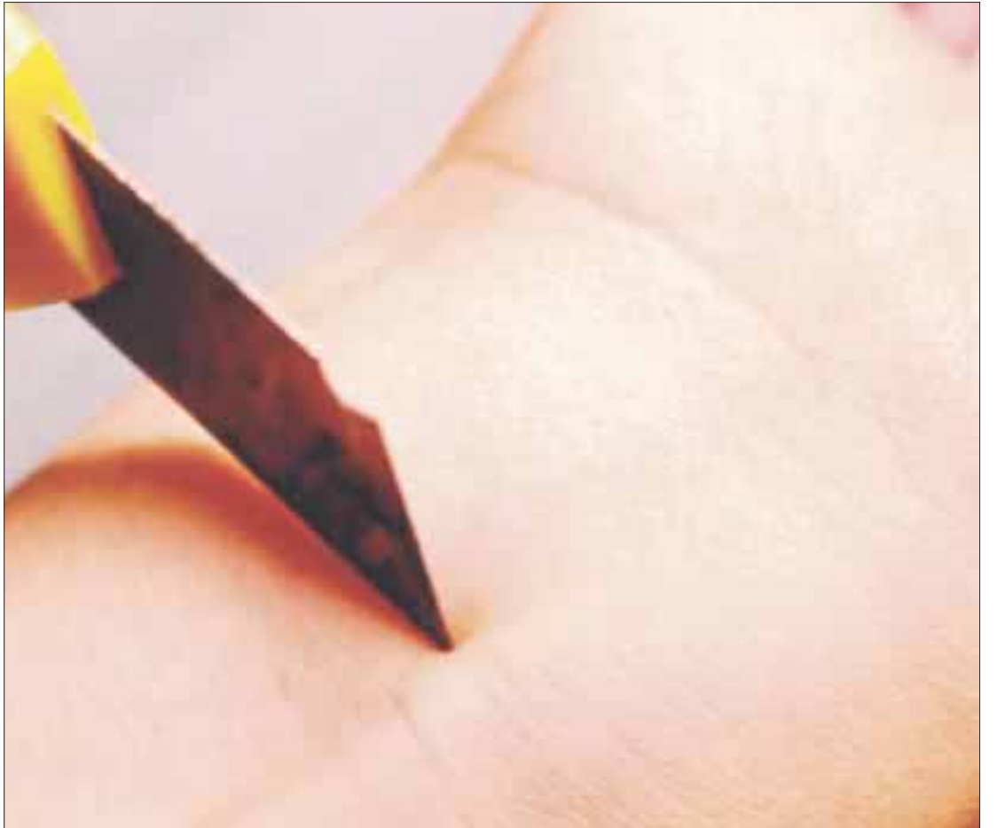
El 20 por ciento de los menores de edad de 12 a 16 años practican el “cutting” para sustituir el dolor psicológico por el físico.

Las heridas autoinfligidas en las muñecas, antebrazos, piernas, caderas, costillas y hasta en la frente, son las partes que los menores eligen para hacerse “cutting” en su cuerpo con objetos punzocortantes, que pueden ocasionarse heridas graves