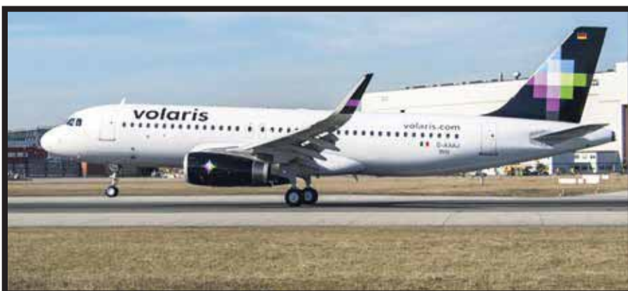
Entregan en Toulouse, Francia, avión para Volaris.

☆☆☆☆☆ Hace unos días el avión número 60 de Airbus fue entregado en Toulouse, Francia para incorporarse a la flota de Volaris. El A320 es uno