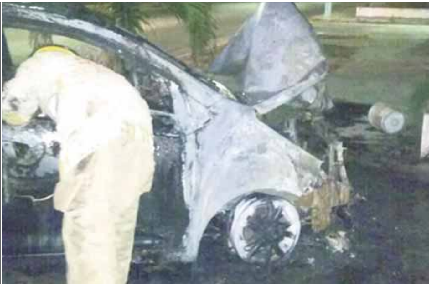
El chofer de este auto no logró accionar el freno y se estampó contra un poste.