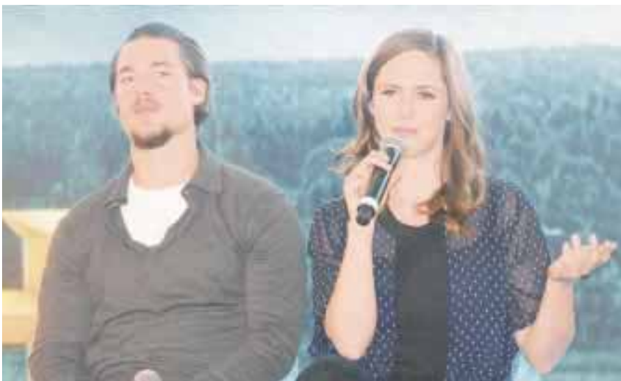
En conferencia de prensa con Alexander y Emily, se dieron detalles de esta primera temporada de la serie “El último reino”, que se estrenará el 5 de mayo y que está compuesta de 10 emocionantes episodios.

Durante el show , Manoella realizará un recorrido por sus éxitos, que se escucharán en nuevas versiones y contarán con la participación de invitados especiales, cuyos nombres se revelarán en breve; también se prevé grabar el espectáculo y editarlo en CD-DVD: “la Compañía Universal está tomando en cuenta grabar el concierto, y si se grabará en vivo, el CD está para salir en unos tres o cuatro meses, tenía diez años que no grababa sola, me gustaría poderles dar calidad en los que son las interpretaciones, hay jóvenes que me han seguido en mi carrera, que los jóvenes me conozcan ante todo como mujer y artista”, finalizó la bella mujer, que ha grabado 40 álbumes con ritmos, que van de la balada al mariachi, pasando por sonidos de pop latino.