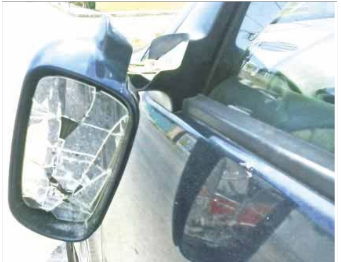
Se contabilizaron daños en 7 vehículos que se encontraban estacionados.

Será de suma importancia para identificar a los presuntos culpables y ya se trabaja en las investigaciones, pero no es el único caso en la isla, ya que se han presentado más denuncias de este tipo en otras colonias.