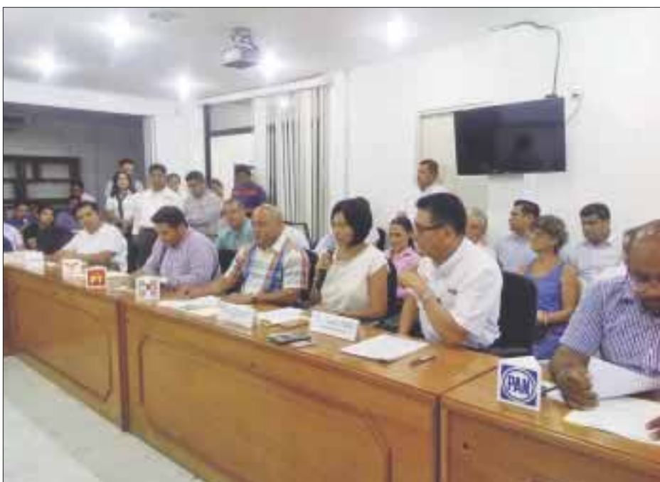
Los ciudadanos que podrán emitir su voto el próximo 5 de junio son un millón 83 mil 297 personas.

Chetumal.- Se hizo la entrega oficial de la Lista Nominal de Electores a partidos políticos y al Consejo General del Instituto Electoral de Quintana Roo por parte de la Junta Local Ejecutiva del Instituto Nacional Electoral.