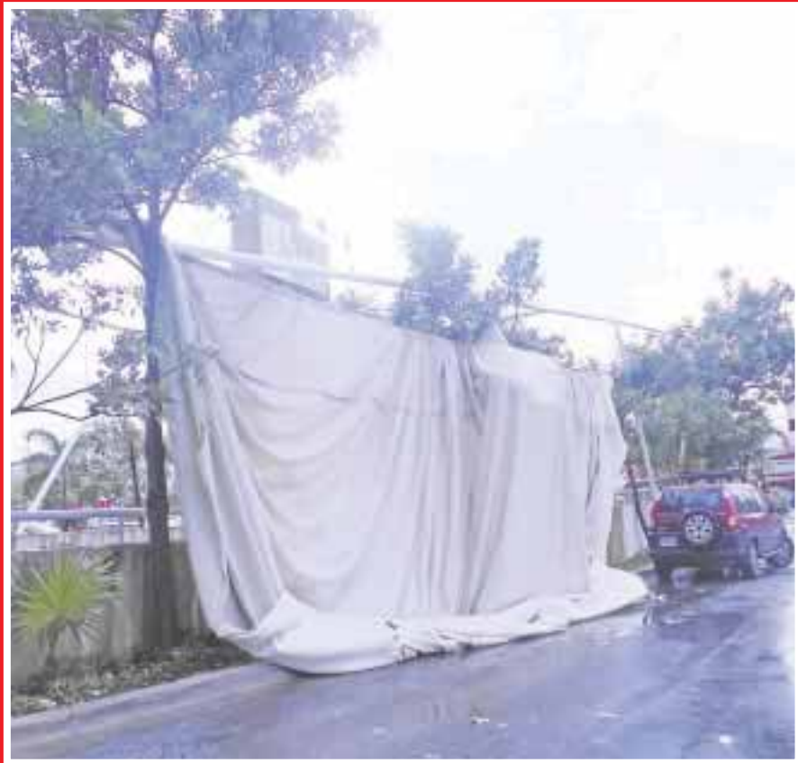
De pronto se dejó sentir el mini-tornado con ráfagas de viento y lluvia que levantó árboles desde su raíz.

Cancún.- Eran las 15:10 horas cuando el cielo se veía nublado, y en ese momento se sintió una fuerte ráfaga de viento y lluvia que simulaba un minitornado, que arrancó ramas de los árboles y alcanzó a levantar desde su raíz a otros, lo que generó que la gente corriera a resguardarse.