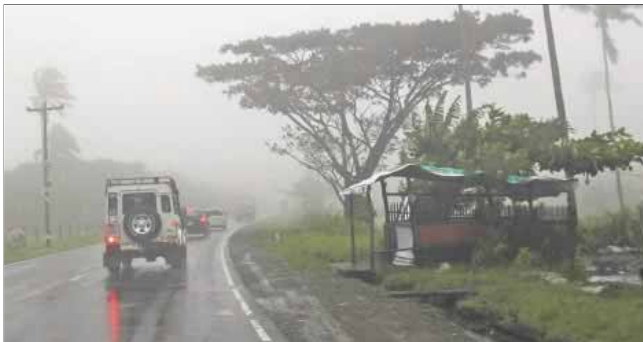
En Quintana Roo se mantendrá un ambiente caluroso y se pronostican lluvias dispersas, además de humedad.

Cancún.- En Quintana Roo se mantendrá el ambiente caluroso mientras que en el municipio de Benito Juárez se pronostican lluvias dispersas, además de la humedad y condiciones climatológicas similares en otros estados de la República propicio para la formación de huracanes.