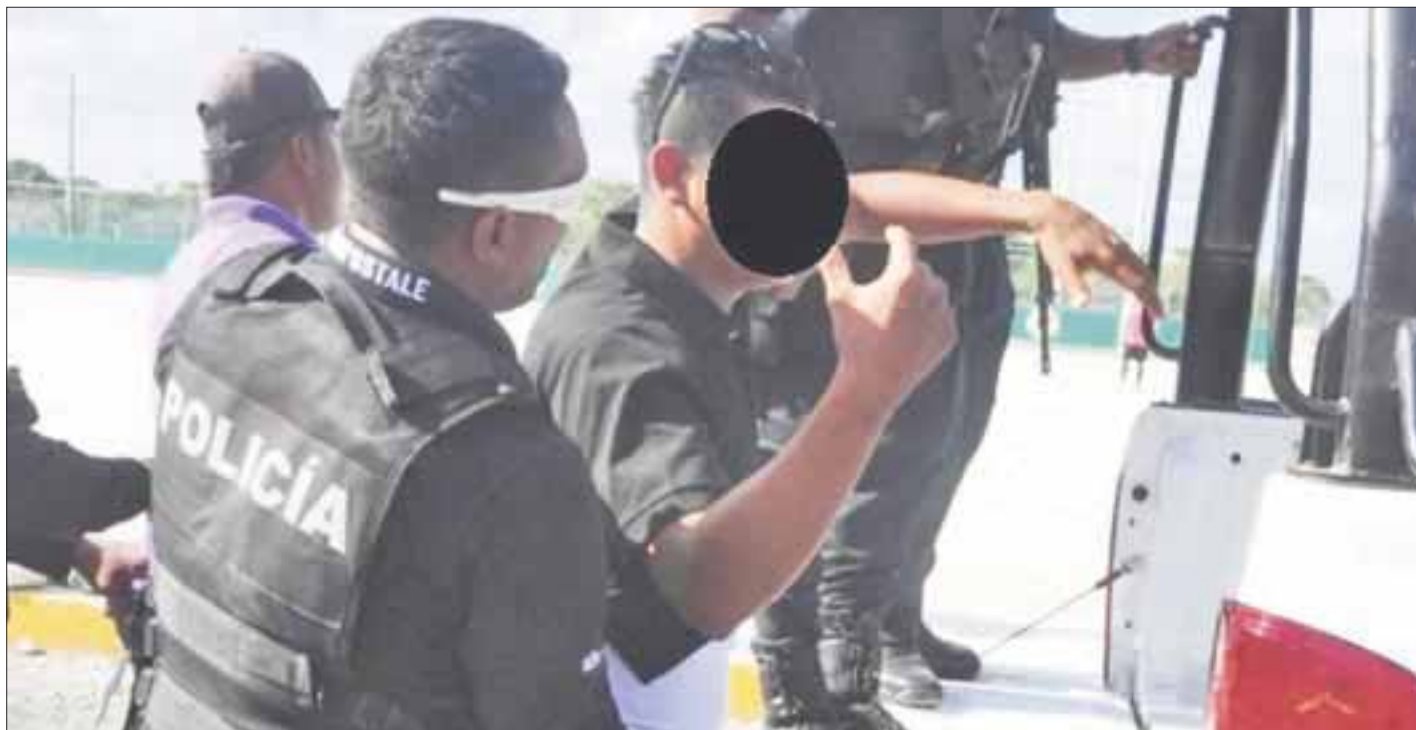
El joven violador fue remitido a la Fiscalía Especializada, que dirá la última palabra.

Cancún.- La Fiscalía Especializada en Delitos Sexuales turnó ayer a un juez de control al individuo de 22 años, quien aparentemente habría abusado sexualmente de su vecina de 21 años.