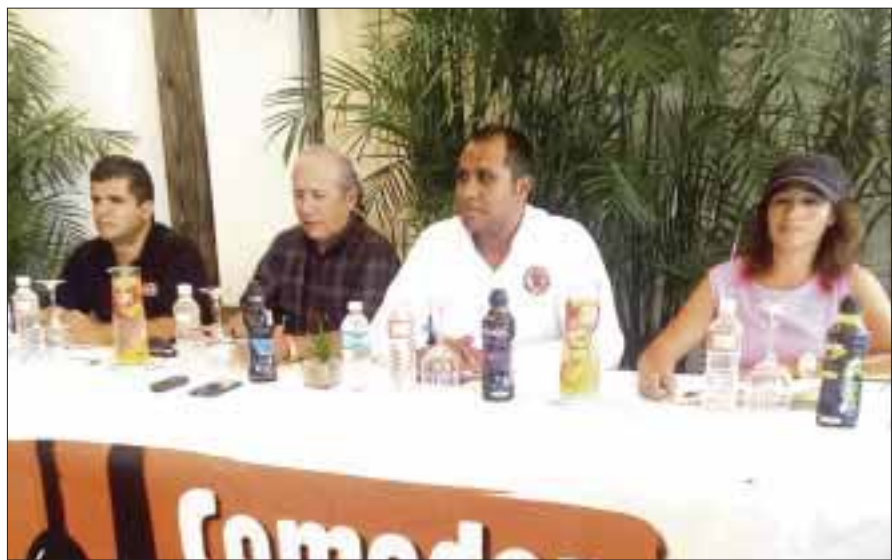
Más de 250 alumnos de la Universidad Politécnica de Quintana Roo, estarán involucrados en la Carrera del Día del Padre.