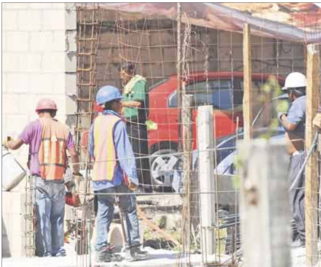
—Protección Civil, además de la verificación de las medidas de seguridad en las obras, también reparte agua para la hidratación de los trabajadores.

Indicó que aunado a dichas revisiones, continúan con el operativo de hidratación para los trabajadores expuestos al sol, “ninguna labor debe exponer la vida de una persona, por ello hacemos recorridos y supervisiones a las obras, donde verificamos la seguridad; además, con las temperaturas que hemos registrado, continuamos visitando obras y estacionamientos para dotar de agua y suero oral a los empleados, además de impartirles charlas de lo importante que es no exponerse al sol, principalmente de las 11 a.m a 2:00 p.m. y exhortar a los jefes de obra a contar con garrafones de agua”.