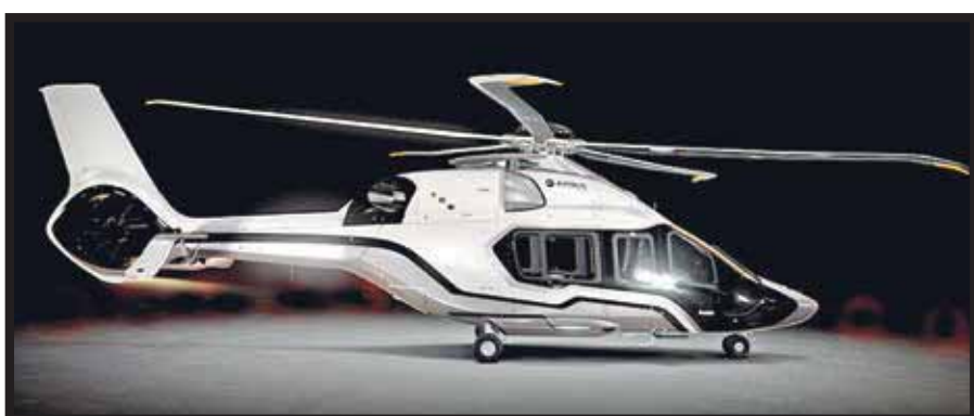
Inigualable mezcla de innovación, diseño y rendimiento.

El desarrollo del H160 continúa progresando, y ambos prototipos de pruebas en vuelo acumulan ya alrededor de 140 horas; el programa llegó al vuelo número cien a mediados de mayo con el segundo prototipo (PT2). Este último ha volado propulsado por motores Arrano de Turbomeca desde enero de 2016 y el PT1, cuyo retrofit está a punto de finalizar,