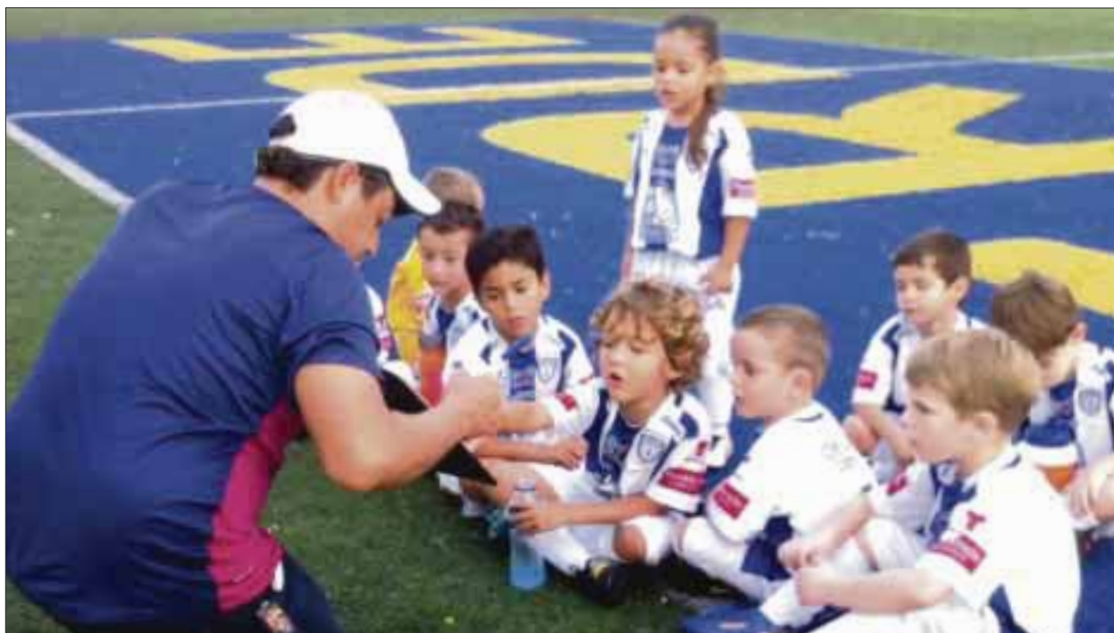
El Club Pachuca arranca en Cancún su primera observación del año, en la cual busca reforzar las fuerzas básicas.

Cancún.- Desde ayer y hasta pasado mañana (viernes), buscadores de talento de los Tuzos, estarán en este centro vacacional tratando de encontrar a los nuevos integrantes de las fuerzas básicas del Club Pachuca.