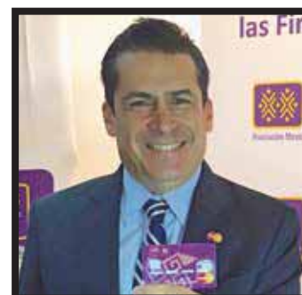
Presentan la primera tarjeta de débito a nivel nacional.

victoriagprado@gmail.com Twitter: @victoriagprado