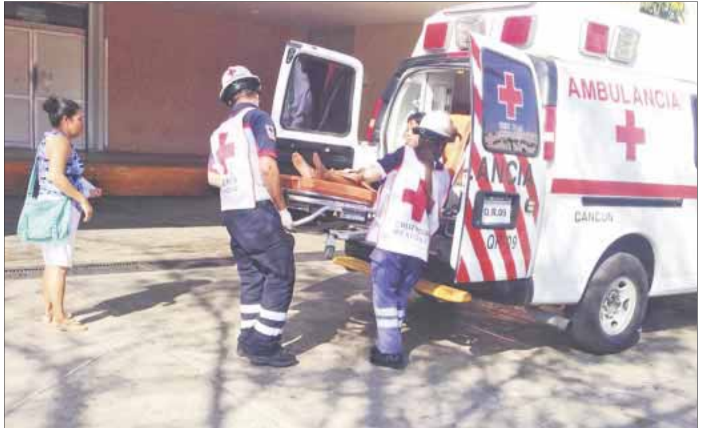
La joven intentó rescatar algunas pertenencias, pero las llamas la alcanzaron, provocándole quemaduras de primer grado.

Preliminarmente se averiguó que las probables causas del siniestro fue por un corto circuito y que las llamas iniciaron en la sala de la casa.