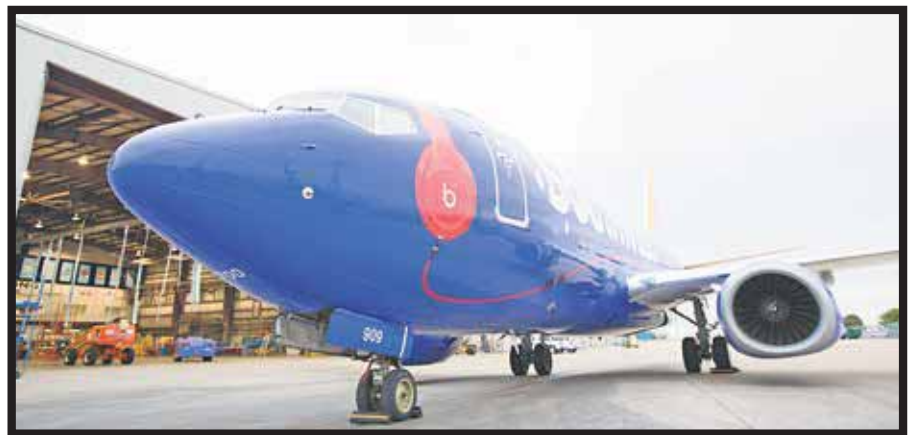
Quiere volar de Los Ángeles a tres ciudades mexicanas.

La nueva propuesta de servicio se alinea con el plan para 2016 de cre-