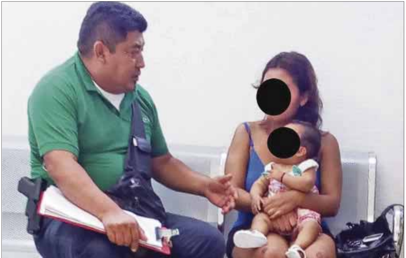
La joven narró a la policía, como fue atacada por los tripulantes de un auto negro, desde donde pretendían robarle a su hija.

Cabe mencionar que al acudir al Ministerio Público, la joven mamá todavía presentaba en rodillas, codos y espaldas las huellas del arrastre del que fue víctima por parte de sus atacantes, quienes pretendían despojarla de su hija.