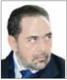
POR FRANCISCO RODRÍGUEZ