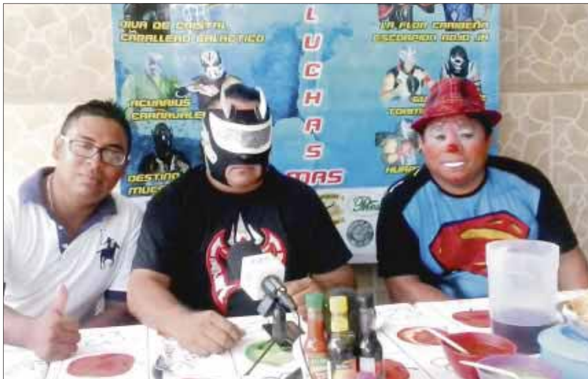
Lo que se recaude se destinará para la operación de dos personajes conocidos en Cozumel.