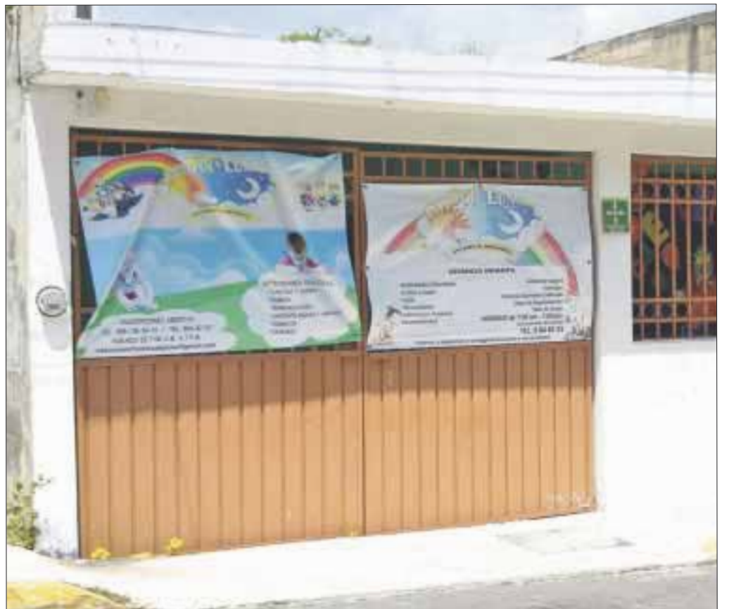
Las educadoras de la estancia no tenían claro cómo actuar y todavía llamaron a la madre para que autorizara su traslado a un hospital.

El caso se registró el pasado 13 de mayo, cuando una menor de un año cinco meses fue ingresada de emergencia al Instituto Mexicano del Seguro Social de la avenida Kabah, tras presentar síntomas de asfixia por alimento