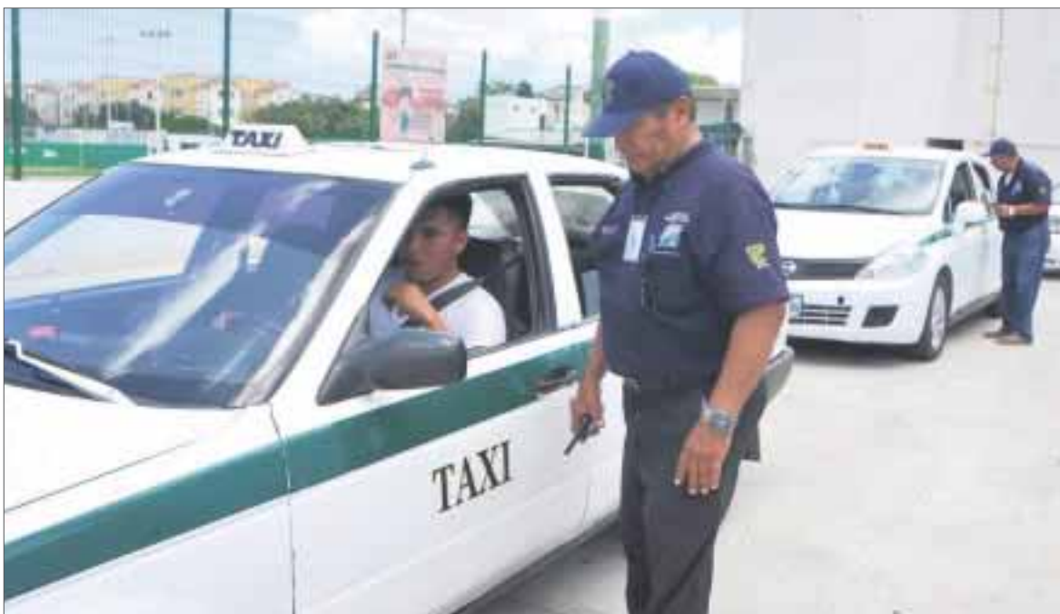
Un equipo especializado realiza las revisiones acerca de las condiciones mecánicas de los vehículos, con el marcado rigor de la ingeniería automotriz.

Cancún.- En atención a una solicitud de usuarios para mejorar las condiciones del servicio de taxis en el municipio, la Secretaría del Trabajo del Sindicato de Taxis "Andrés Quintana Roo", remitió ayer tres vehículos en mal estado, acorde al programa "Operativo Visual".