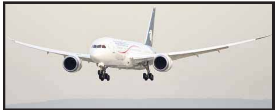
Galardonada por su cocina a bordo.