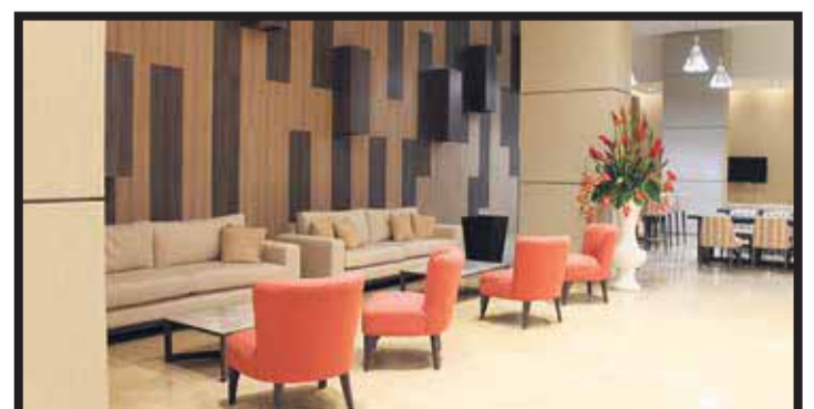
Parte del lobby del nuevo hotel en Barranquilla, Colombia.

victoriagprado@gmail.com Twitter: @victoriagprado