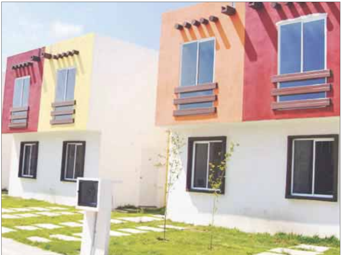
En Quintana Roo, el coyotaje es un mal que se pretende desaparecer de las Juntas de Conciliación y Arbitraje y el Infonavit.

El problema es común en Cancún, Playa del Carmen y Chetumal, donde los gestores en promedio reciben de 2 mil 500 hasta 3 mil pesos o más por sus servicios, que no deberían recibir, ya que no pueden hacer nada en las juntas ni en el Infonavit ya que todos los trámites e información son gratuitos para el interesado.