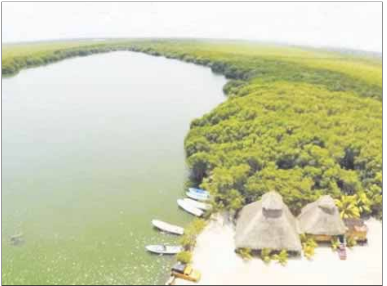
Entre el mar Caribe y la laguna Chacmucuch, en lo que es Isla Blanca, existen 690 hectáreas de selva que serán afectados.

La parte principal del informe sostiene que "Chacmucuch es sensible," y añade "amerita su protección general antes que se repita la misma historia de Bojórquez, de la Zona Hotelera de Cancún".