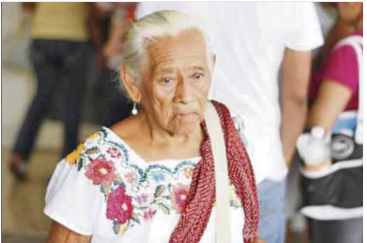
En Quintana Roo, 4 de cada 10 adultos mayores padecen depresión geriátrica ante el abandono de sus familiares, ya sea en su propio hogar o en los asilos.

Especialistas del Sistema Para el Desarrollo Integral de la Familia consideran que los ancianos experimentan un trastorno del estado anímico, que interfieren con la vida diaria durante semanas o por más tiempo.