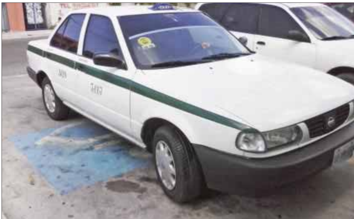
Ciudadanos reprochan del fracaso que el programa “Respeto mi lugar” no ha cumplido con sus objetivos.

Cancún.- Aunque se han emprendido campañas para orientar a ciudadanos y conductores sobre la importancia de respetar los cajones de estacionamiento destinados a personas con capacidades diferentes, los operadores del sindicato de taxistas parecieran no estar enterados.