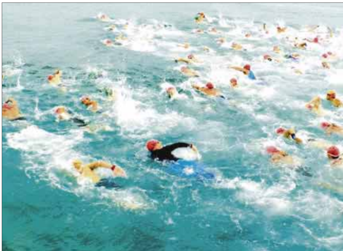
En este 2016 Starc Producciones, con el apoyo de empresas privadas y la Federación Mexicana de Natación, organizan el 11º maratón de nado, denominado desde el año pasado como El Cruce .

Después de algunos años organizando "Por la Libre", se ha logrado un buen incremento de participantes año con año (230 nadadores en el año 2008, 380 en el 2009, 600 en el 2010 y 780 en el 2011, 780 en el 2012, 750 en 2013 y 750 en el 2014).