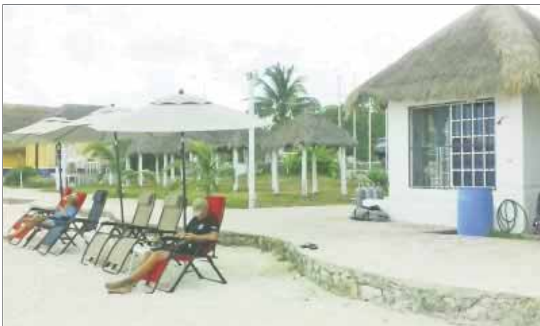
Casas de buceo administradas por extranjeros operan indebidamente en la isla de Cozumel.

Cozumel.- Las autoridades federales, estatales y municipales, d han permitido que extranjeros desplacen a buzos locales, al ser contratados por las empresas dedicadas a esta actividad.