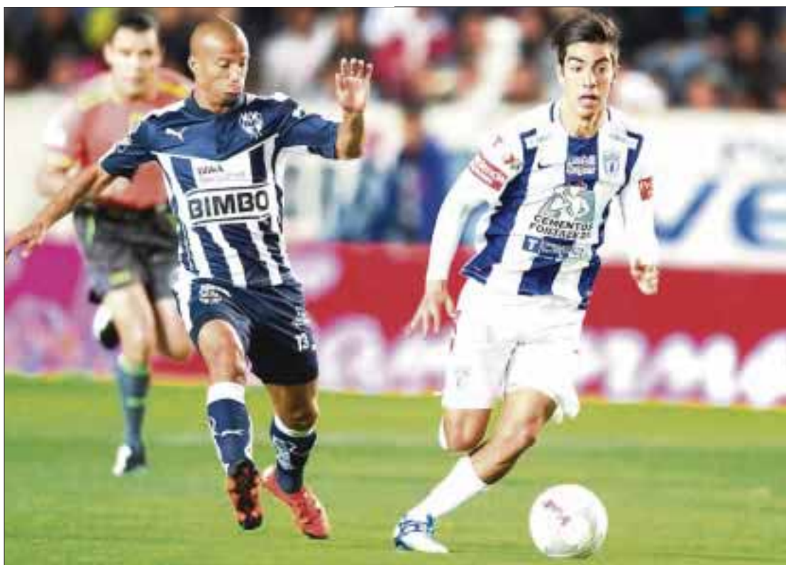
La cancha del estadio Hidalgo será el escenario donde Pachuca y Monterrey esperan ofrecer un espectacular primer episodio de la gran final.

Por su parte, Rayados no cuenta con una historia muy diferente e incluso ha sufrido todavía un poco más, pero tal vez enfrentó a dos rivales de mayor nivel. Primero dejó en el camino al campeón defensor y acérrimo rival Tigres de la UANL, que estuvo cerca de remontar un 3-1.