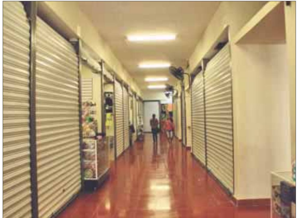
En el 2016, la figura del deudor solidario se aplica en agravio del sector comercial, que al año genera 100 cierres definitivos de negocios.

Los restauranteros y negocios de la zona centro, consideran que este panorama en nada ayuda a la imagen turística de Cancún, al existir 100 locales cerrados que sólo pueden ser utilizados por los grafiteros para dejar su sello e imágenes en las paredes o cortinas.