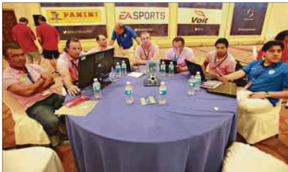
Las reglas han cambiado en lo que refiere a la adquisición de jugadores; este año estará lleno de sorpresas.