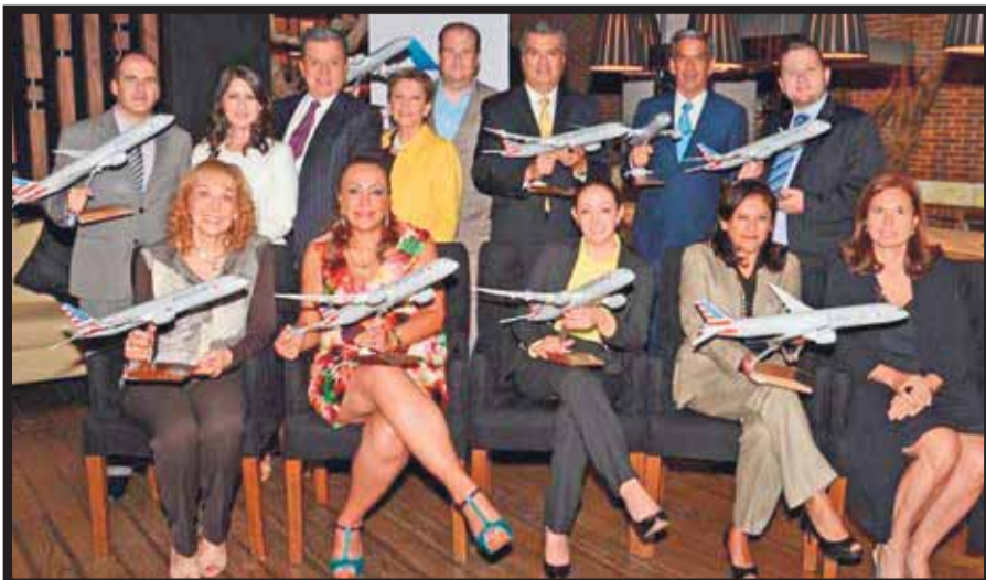
Las agencias de viajes premiadas.

Los vinos premiados fueron Sibaris Chardonnay 2015 , un vino proveniente del Valle de Leyda, ideal para acompañar carnes blancas, mariscos, pescados, pastas y queso. Sibaris Carmenere 2014 , producido en el Valle de Colchagua, perfecto para preparaciones típicas chilenas tales como pastel de choclo, humitas y empanadas y Sibaris Cabernet Sauvignon 2014 , un clásico del Valle del Maipo, que marida con carnes de va-