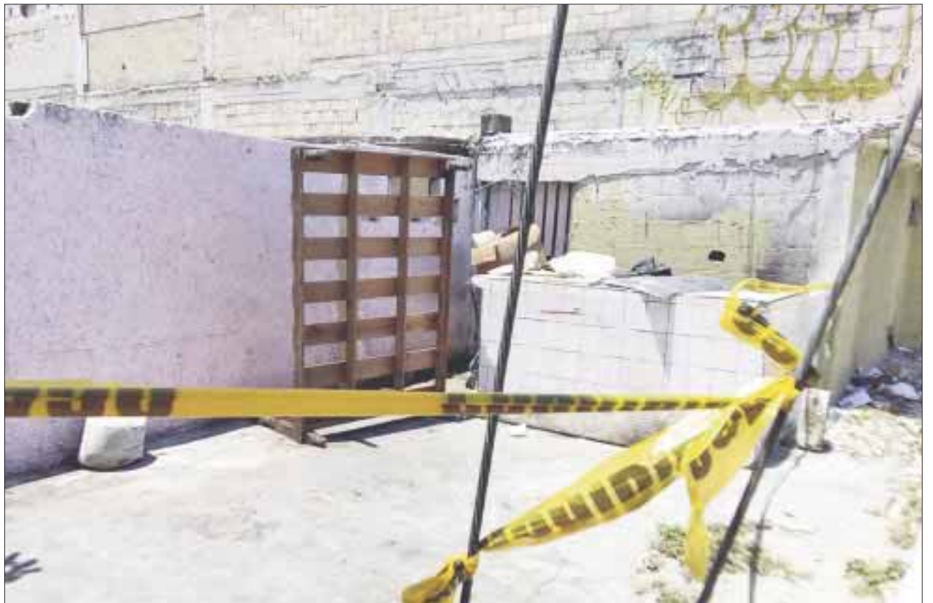
Una llamada anónima alertó a los policías sobre el cuerpo que se encontró dentro de un terreno abandonado y que tenía visibles huellas de tortura.

Extraoficialmente, vecinos de la zona refirieron que por la cercanía que el lugar tiene con la zona de El Crucero, el predio donde se cometió este crimen es presuntamente un lugar donde se consume droga, ya que en las noches es un incesante ir y venir de gente extraña.