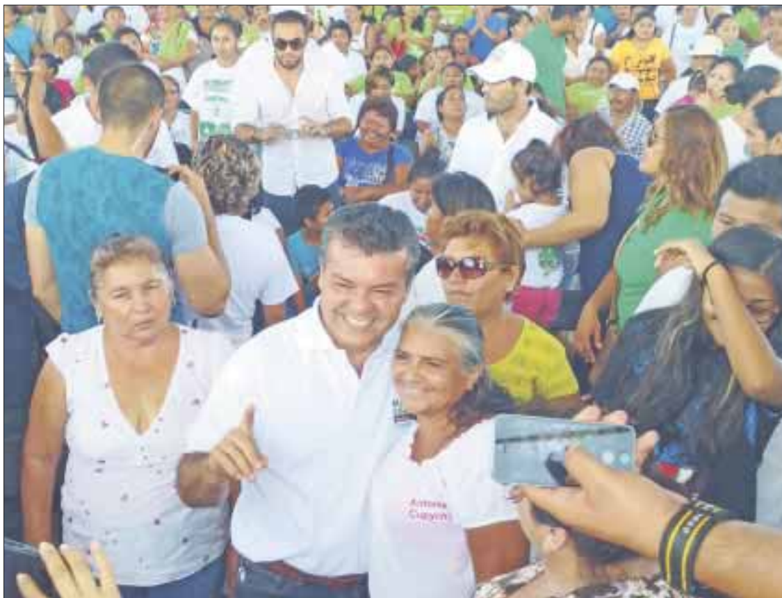
En el nuevo gobierno estatal habrá nuevas reglas, señala Mauricio Góngora Escalante ante trabajadores.

Agregó que su gobierno será un aliado para que tengan mejores condiciones laborales, mejores ingresos, oportunidades de crecimiento, pero sobre todo, que ese esfuerzo diario lo vean reflejado en la seguridad de su familia, con mejores servicios de salud, educación, además de alumbrado público, recolección de basura, pavimentación, entre otros, que les permita una mejor calidad de vida.