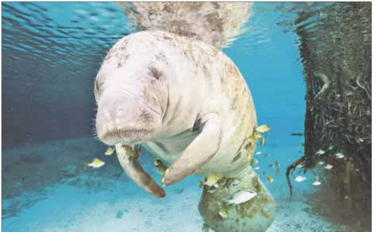
El manatí antillano, en peligro de extinción, se enfrenta a desafíos de fuentes climáticas y antropogénicas.

La importancia del estudio se incrementa debido a que existen estudios limitados sobre el análisis espectral de las vocalizaciones de los manatíes.