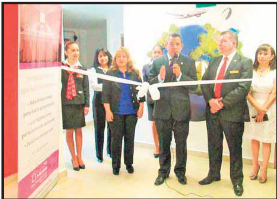
Alianza entre la UVM y Hoteles Misión.

Ambas instituciones confían en que este intercambio enriquecerá y fortalecerá su relación pues la UVM Campus Hispano preparará a sus jóvenes para el mercado laboral y Misión Tereo abrirá sus puertas para recibir todas las propuestas que las nuevas generaciones