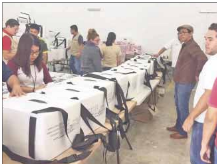
Comenzó la entrega de 479 paquetes electorales de los 1917 que serán trasladados del 26 al 29 de mayo a los 15 distritos electorales y tres consejos municipales.

Chetumal.- El Instituto Electoral de Quintana Roo (IEQRoo) inició la entrega de 479 paquetes de los mil 917 que serán trasladados y entregados entre este día y el 29 de mayo a los 15 Distritos Electorales y tres Consejos Municipales.