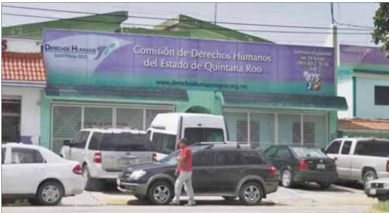
Asociaciones civiles luchan a favor de los pacientes con VIH-Sida.

Chetumal.- Cinco asociaciones civiles pusieron su queja ante la Comisión de los Derechos Humanos del Estado de Quintana Roo, contra de la Secretaría de Salud, a la que acusan por la falta de tratamientos y exámenes médicos.