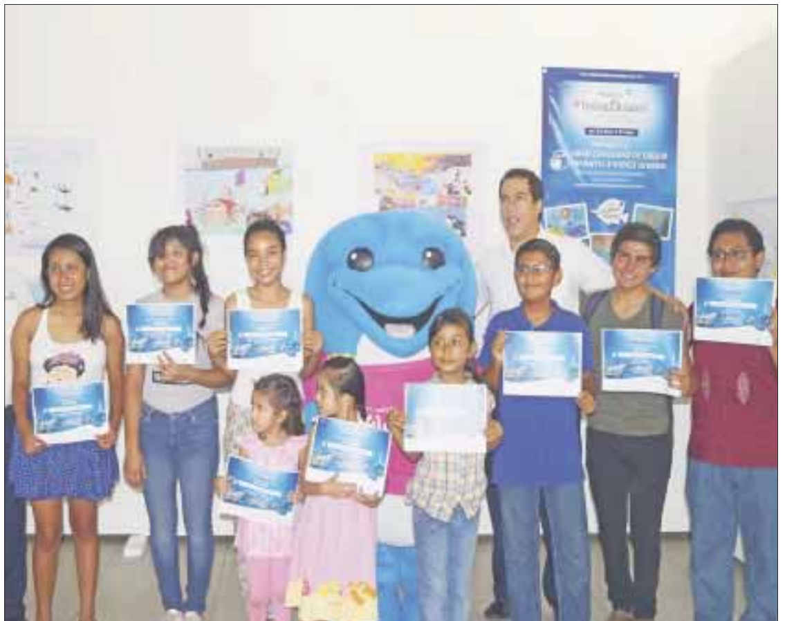
El índice de contaminación que padece el mar por la presencia de la basura es uno de los cuatro temas que se plasmaron en el concurso de dibujo y video infantil.

Pesca, la invasión de especies exóticas y cambio climático son temas que se incluyeron dentro del concurso, en donde el sector infantil desde su perspectiva plasmó la problemática que padece los ecosistemas marinos, además la importancia de cuidar el mar y los océanos