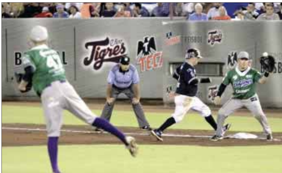
Los felinos fueron cazados por los "carmelitos", quienes aseguraron la serie al derrotar a Tigres en los primeros dos duelos.