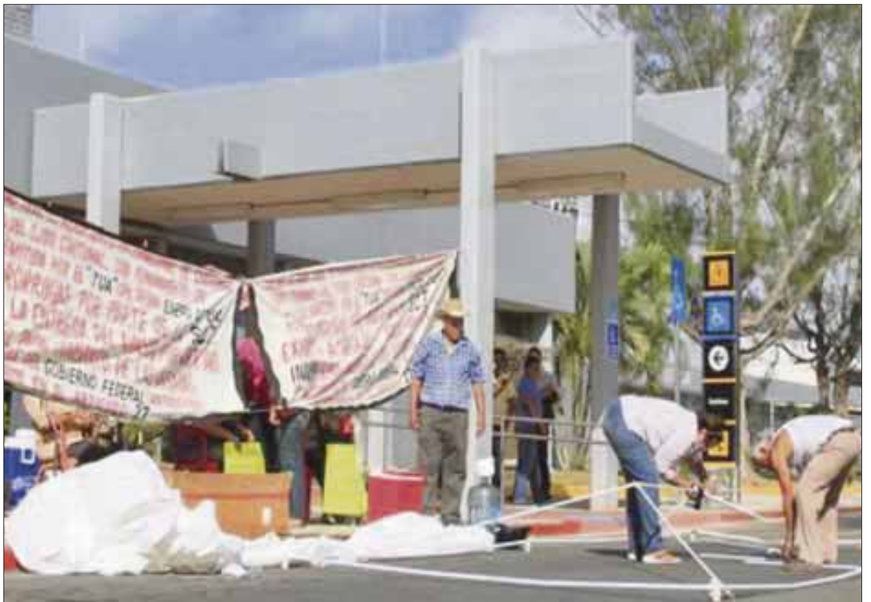
Manifestantes revelan que las autoridades les regatean el precio de su indemnización.

Finalmente, detalló que esperan respuesta de sus peticiones de manera breve, ya que de lo contrario hoy estarían tomando por completo la instalación del aeropuerto.