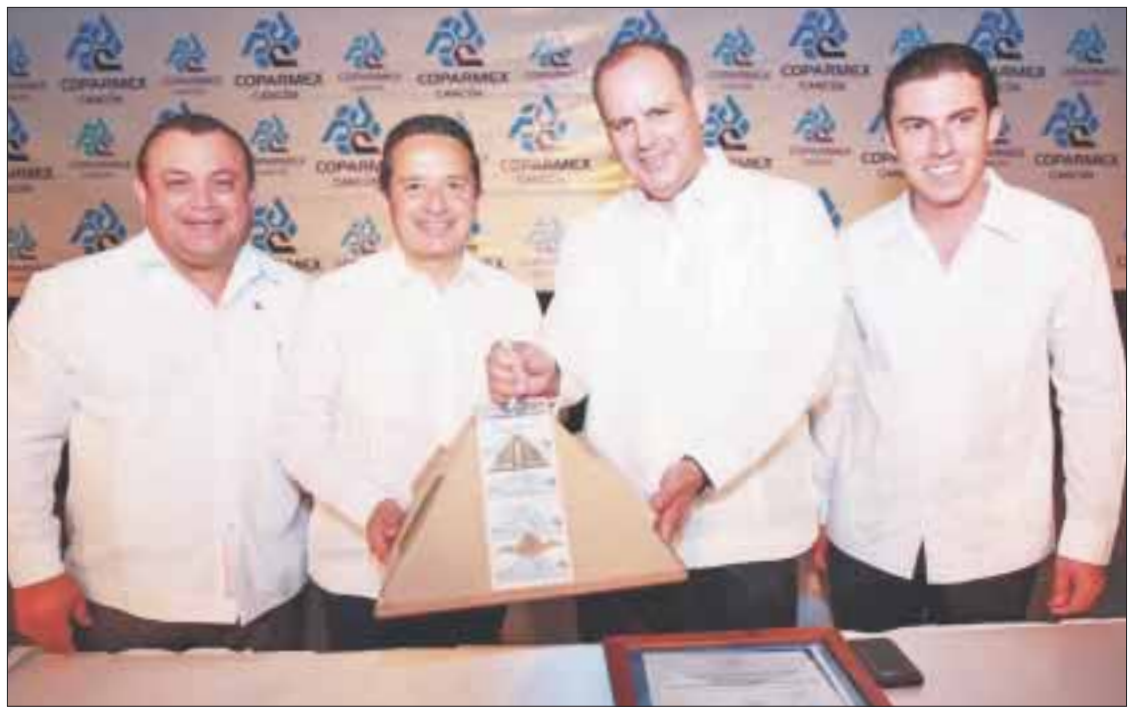
El gobernador Carlos Joaquín se reunió con líderes empresariales del estado.

Quintana Roo operan 45 mil 488 unidades económicas que emplean a 347 mil 726 personas y anualmente el número de empresas crece en 3.2 por ciento.