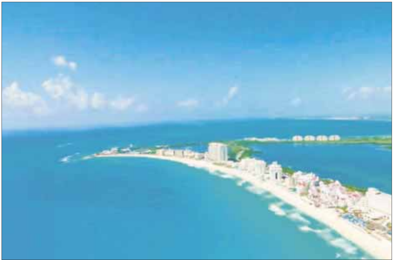
Los 650 delegados que asistieron a la 29 Edición del Cancún Travel Mart México Summit generaron al menos 3 mil 500 citas de negocios.

Confió que esta feria siga como una de las principales no sólo del estado, sino también se mantenga como una de las mejores del país, tal como en su oportunidad reconoció el propio titular nacional de turismo, durante su inauguración en Cancún.