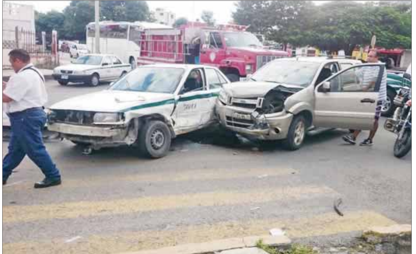
De esta manera quedaron los vehículos involucrados en el aparatoso accidente ocurrido ayer en avenida Chichén Itzá y Palenque.

Ambos conductores fueron puestos a disposición del Ministerio Público para el deslinde de responsabilidades.