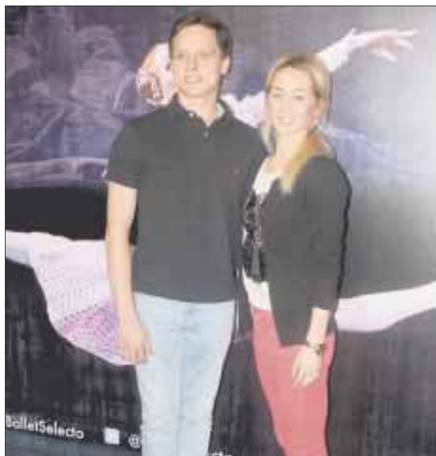
Por séptimo año el Russian State Ballet Mari El, regresa para deleitar a los mexicanos de la mano de Ballet Selecto. (Foto: Arturo Arellano).

traer a estos talentosos bailarines, a veces se gana y a veces se pierde en cuestión de dinero, pero en la emoción y la convivencia con la gente mexicana siempre se gana". El Russian State Ballet Mari El presentará Romeo y Julieta , los días 22 y 23 de octubre y posteriormente el 19 de noviembre en el Centro Cultural Teatro 1.