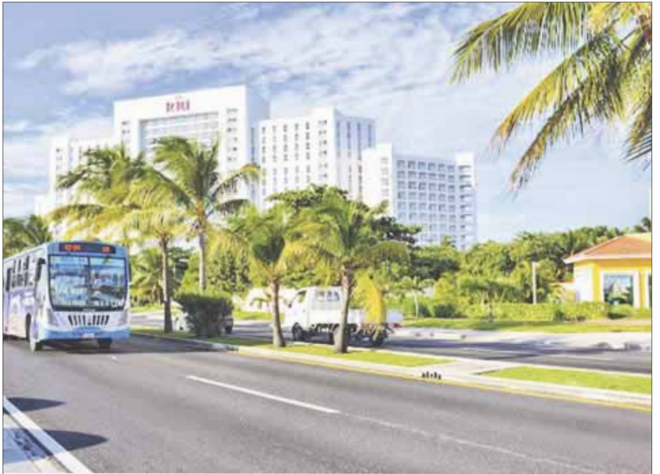
Con una inversión de 600 millones de pesos terminarán seis puentes elevados sobre la avenida José López Portillo.

Recordó, que tan sólo en Benito Juárez, se realizó una inversión importante en cuanto a vialidades, que permitió reencarpetar la avenida Kukulkán, la José López Portillo, Bonampak, Chichén Itza, y varias colonias que fueron beneficiadas.