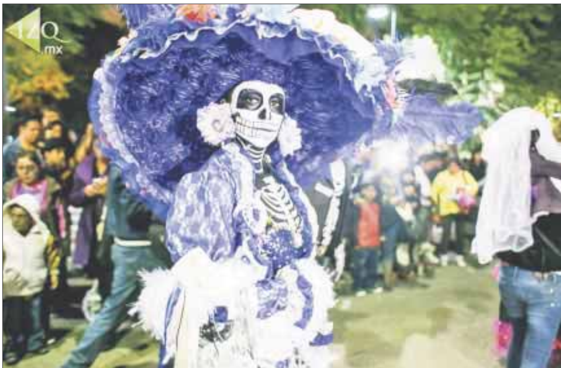
El VI Festival Cena de las Ánimas será del 31 de octubre al 2 de noviembre.

Cancún.- Dejando atrás del sincretismo, el VI Festival Cena de las Ánimas se realizará del 31 de octubre al 2 de noviembre, abrirá las puertas a todas las expresiones artísticas en un ánimo incluyente donde se proyecta un vistoso y magno “Desfile de Catrinas” como novedad en esta edición.