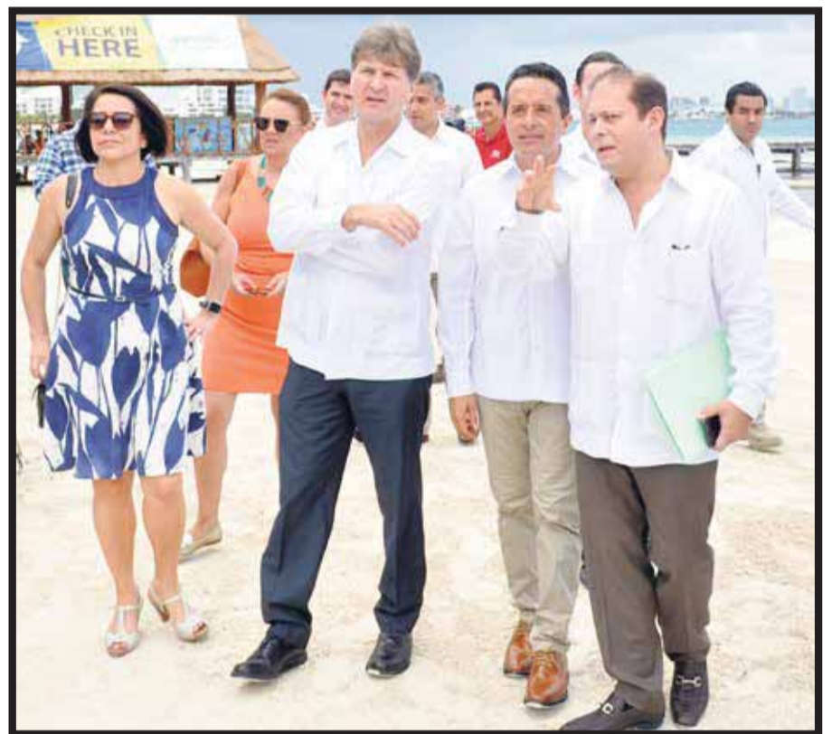
En la presentación del “Parque Público Playa Langosta”, en el CIP Cancún.

promiso que tienen la Sectur y el Fonatur para seguir contribuyendo a generar áreas públicas para los mexicanos, como el Parque Público Playa Langostas, el cual mejorará la imagen urbana de la primera zona hotelera del CIP Cancún y coadyuvará a elevar su competitividad a nivel internacional.