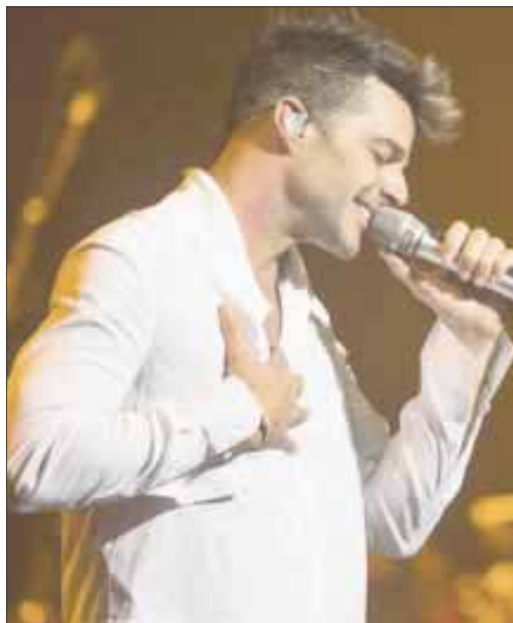
En la gira “One World Tour” Ricky Martin ofrecerá un repertorio de clásicos y nuevos.

*** El próximo 13 de noviembre en Cancún