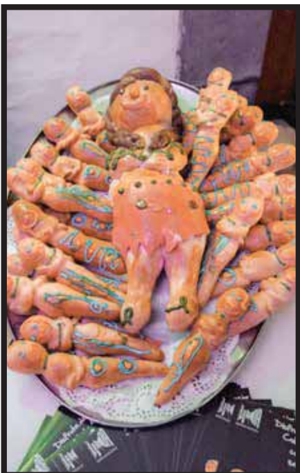
En la celebración del Día de Muertos en Quito.

La preparación casera de estas comidas brinda además un motivo para que la familia se reúna. Uno de los platillos típicos de esta celebración es la colada morada, una bebida aborigen de las más tradicio-