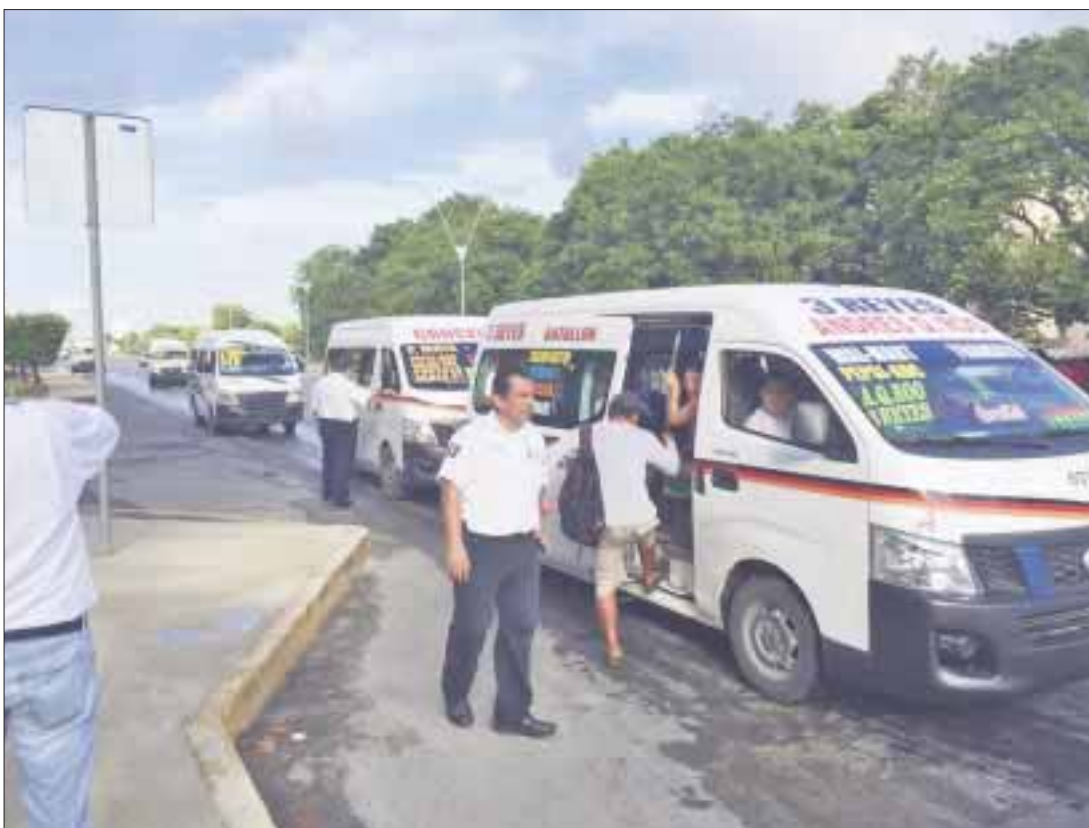
Las camionetas Urvan y sus operadores seguirán siendo sancionadas en forma estricta, hasta que cumplan con la ley en cuanto a cupos.

Las camionetas que siguen con vidrios polarizados, se coordina con la Dirección de Tránsito, por lo que ya se platicó con las empresas concesionarias para que se haga un trabajo en conjunto, para que haya cordialidad