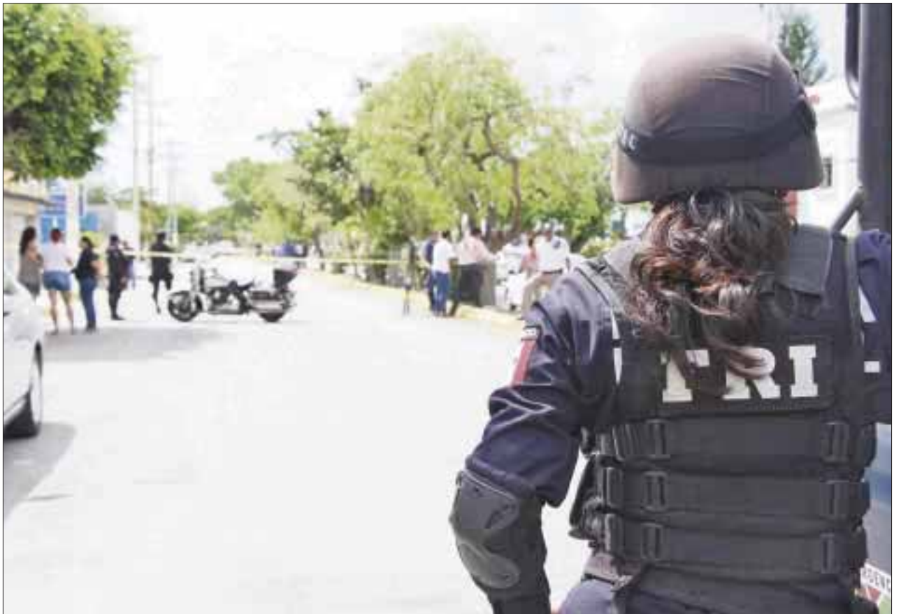
Motivado por un arranque de celos, un sujeto asesinó a su pareja del mismo sexo en la Región 210, al encontrarlo con "un amiguito".

Según se explica, al pasar un rato, la misma casera ingresó a la pieza que les tenía rentado, descubriendo el cadáver de la pareja sentimental de Orvelín.