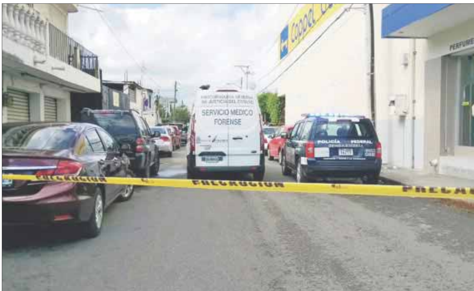
La hoy viuda continúa siendo interrogada por el Ministerio Público para documentar el suicidio.

El agente del Ministerio Público interroga ampliamente a la esposa, en razón de que este tipo de fallecimientos se investigan de oficio, hasta dejar ampliamente descartado que se trata de un suicidio.