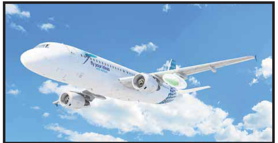
Fly your Ideas , programa de Airbus y la Unesco.

Sin embargo, esta celebración no es exclusiva de México. Países como