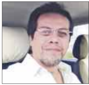
POR MAURICIO CONDE OLIVARES