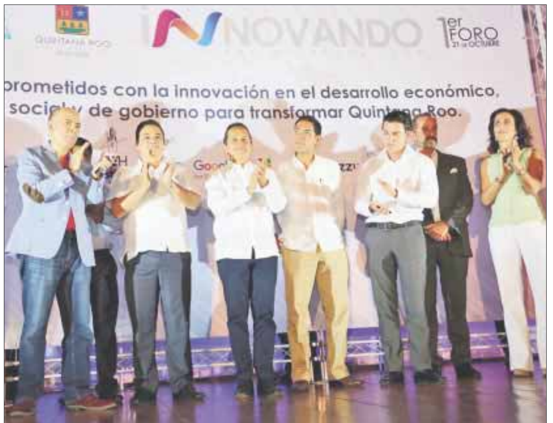
El gobernador, Carlos Joaquín, firmó el compromiso para impulsar habilidades digitales en la entidad, durante el “Primer Foro Innovando por Quintana Roo”.

Cabe destacar que el “Primer Foro Innovando por Quintana Roo” tiene por objetivo convertir la innovación y el desarrollo empresarial, social y de gobierno en un elemento cotidiano para la entidad, de tal forma que le resulte accesible y cercano a nuestra sociedad, con el establecimiento de una agenda conjunta con empresarios, sociólogos y agentes transformadores para desarrollar procesos de gobernanza más coordinados, amplios, participativos, incluyentes y eficaces que ofrezcan soluciones integrales a los desafíos planteados.