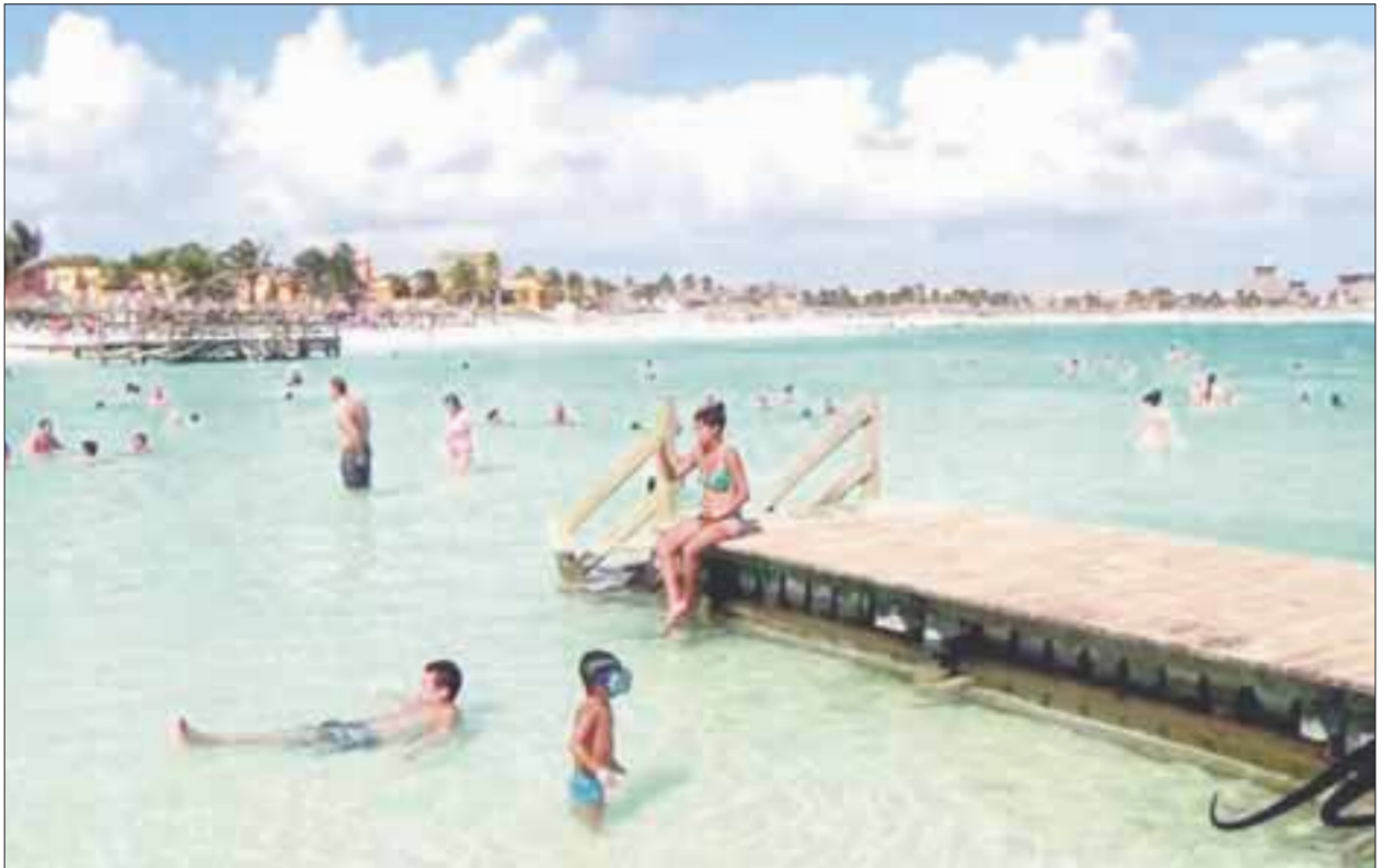
Han realizado estudios de calidad de agua, pastizales marinos, corales y tortugas en la Bahía de Akumal, con la Unidad Académica y Sistemas Arrecifales de la UNAM.

Además llevaron a cabo 31 supervisiones en dicha área para vigilar el cumplimiento de la norma y la regulación de la carga turística; dos recorridos marítimos y 16 más en áreas de Refugio de Tortuga Marina.