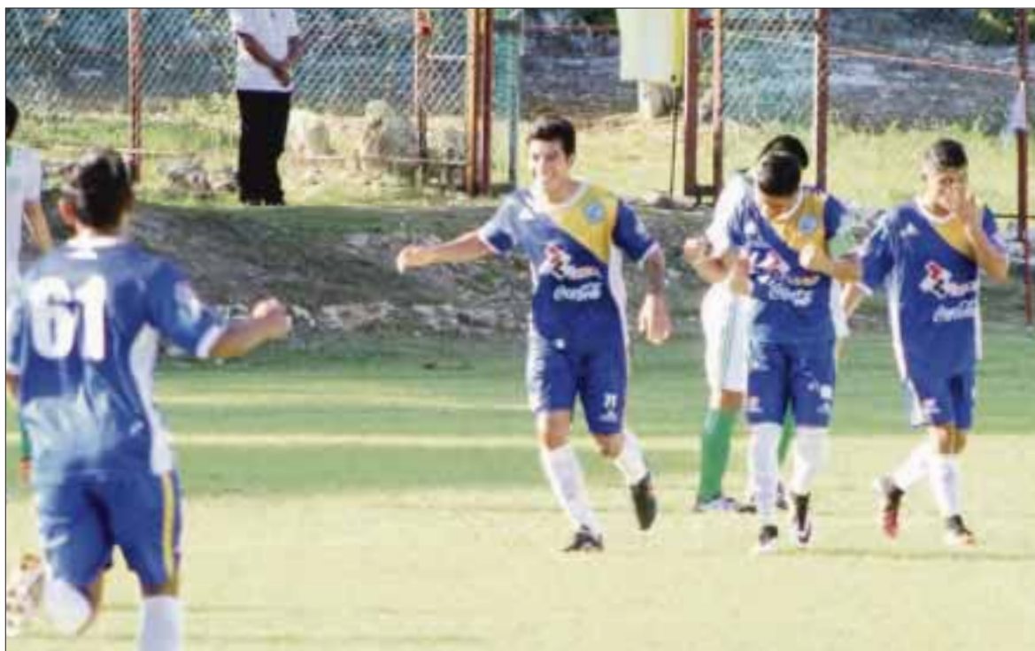
Lo que habían ganado en el primer tiempo, fue desaprovechado en la segunda mitad, para que Caimanes arribara a 11 unidades.

Cancún.- El conjunto de los “Chacmools” de Yalmakán FC desaprovecharon una ventaja de 1-2, y terminaron cayendo por marcador de 4-2 ante los Caimanes de Cancún FC, como parte de las acciones del jornada cinco de la Temporada 2016-17 de la Tercera División Profesional, en duelo que se disputó en el campo del Colegio Rush.