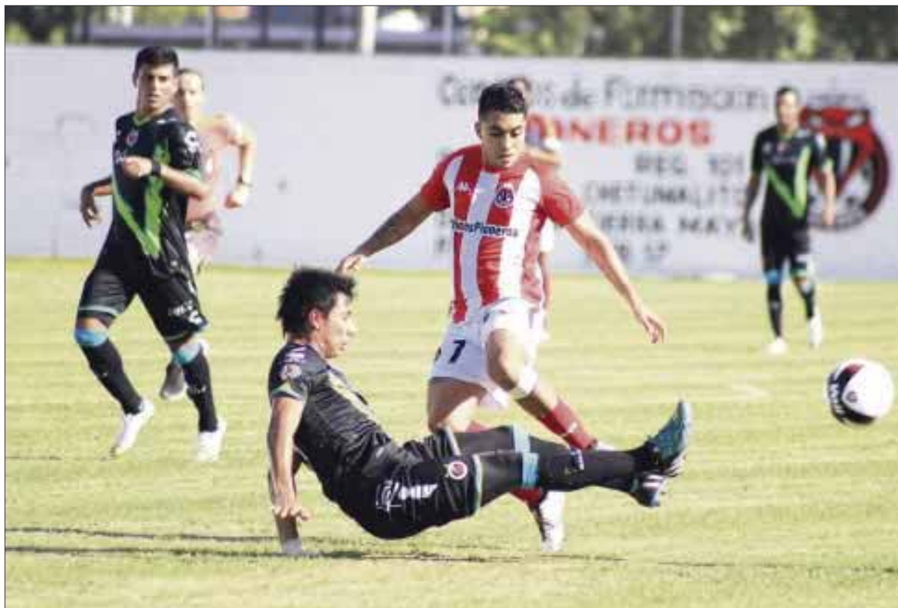
Los Pioneros de la segunda división se vieron influenciados por “la mala vibra” de los jarochos, por lo que el partido tuvo “un exceso de patadas”.

Los del puerto comenzaron bien el juego y con varias acciones sobre la meta pionera, pero la zaga rojiblanca se portó a la altura y detuvo cualquier intento jarocho