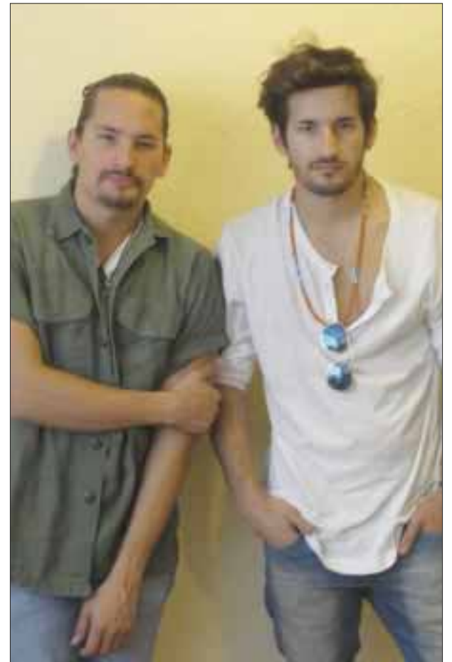
En entrevista con DIARIOIMAGEN , platicaron sobre su nuevo sencillo, Para olvidarte , que será parte de su nuevo trabajo discográfico, Arte , mismo que saldrá el año entrante.