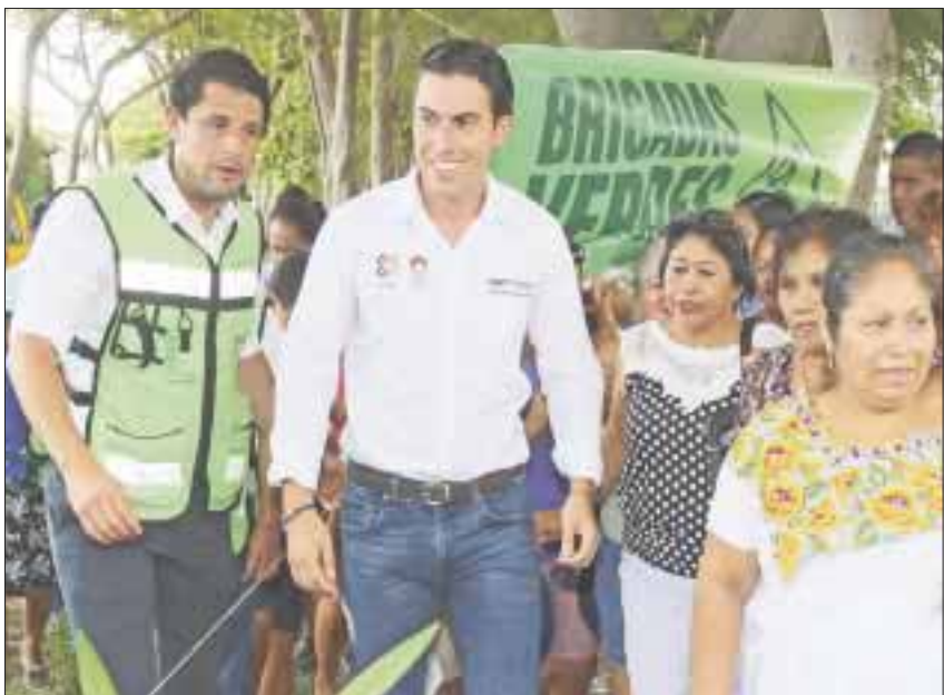
El alcalde de Benito Juárez, Remberto Estrada, supervisó el trabajo de las “Brigadas Verdes”, integradas por 700 trabajadores que mueven a la ciudad.

En lo que respecta a limpieza de playas, el edil informó que se han cubierto 3 millones 504 mil 646.70 metros cuadrados de arenales, junto con la recolección de 682 metros cúbicos de sargazo y 377 metros cúbicos de basura, con lo que se preservan los paisajes naturales.