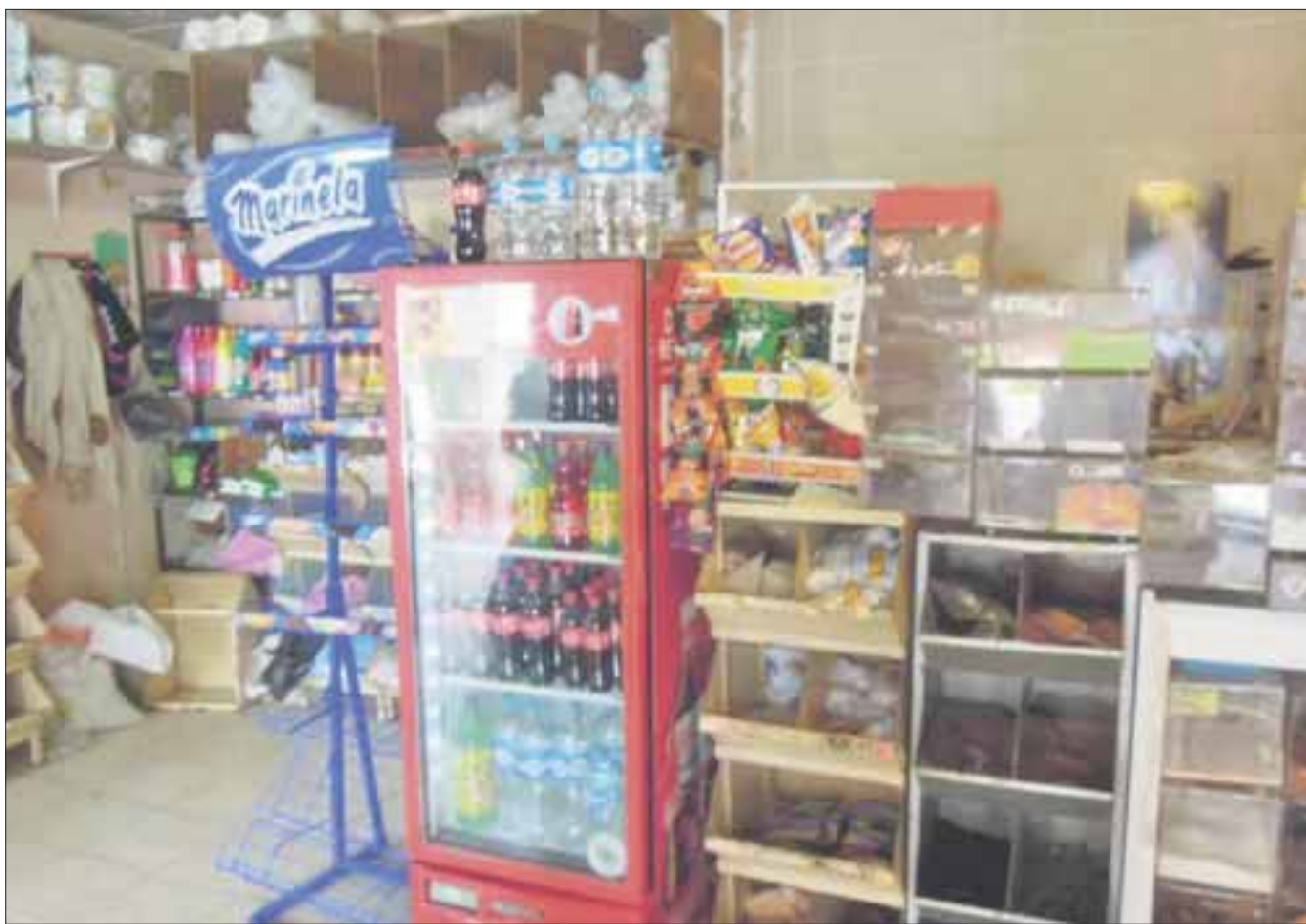
El comercio en pequeño “sobrevive” y pide al nuevo gobierno no “ahogarlos” con derechos que merman su economía.

Las opciones para el comercio en pequeño son mínimas ya que además tienen que lidiar con obligaciones que muchas veces no se cumplen como es el pago por recolección de basura. Los dueños de los negocios indicaron que a pesar de los acuerdos, el comercio en pequeño ya no progresa ya que el pago de derechos e impuestos sobrepasan su economía y a unos los destina a trabajar en la informalidad.