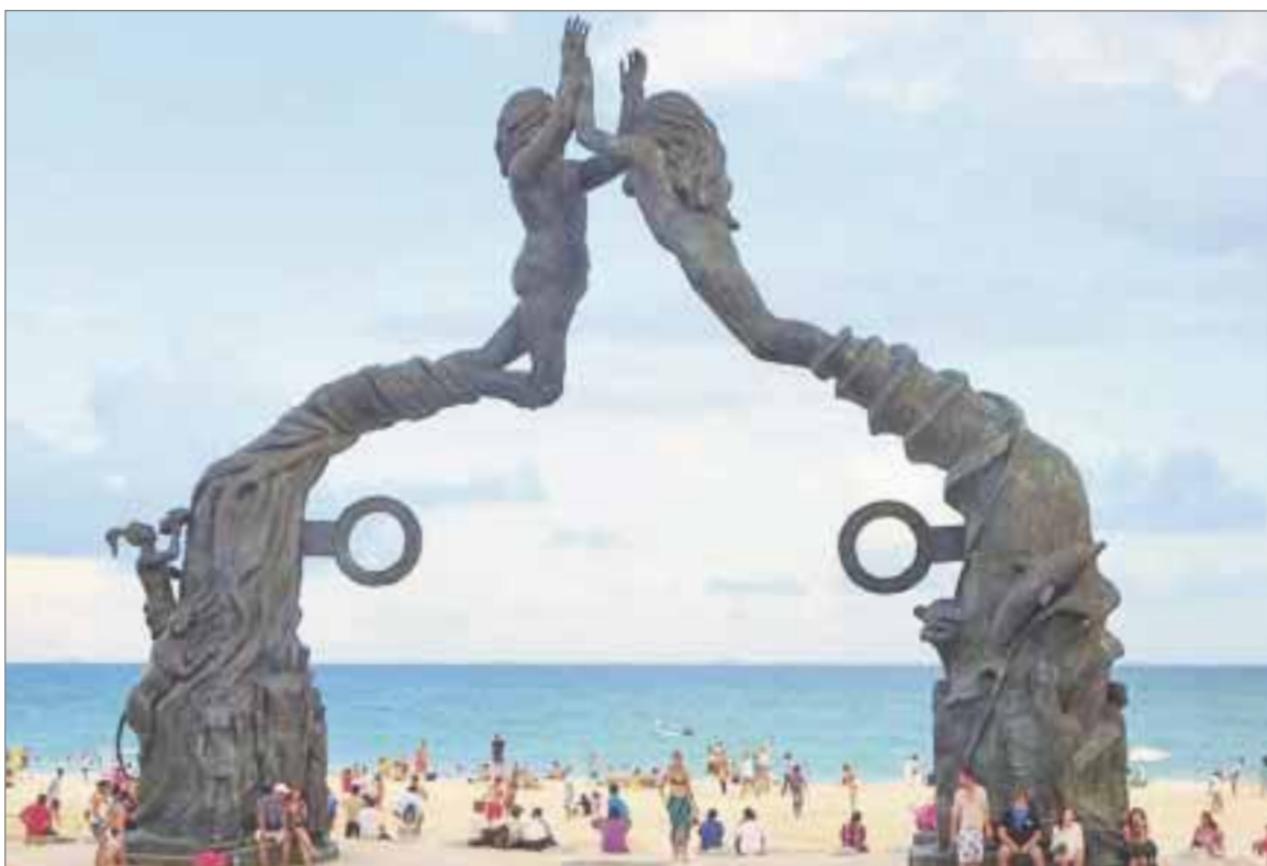
El Grupo ABC adoptó el parque “Leona Vicario”, principal centro de esparcimiento para los habitantes de Playa del Carmen.

Solidaridad.- El parque público “Leona Vicario” que se encuentra en la avenida Juárez y que es un ícono en Playa del Carmen por su majestuoso Arco Maya, fue adoptado por la iniciativa privada quien se encargará de los trabajos de rehabilitación y limpieza.