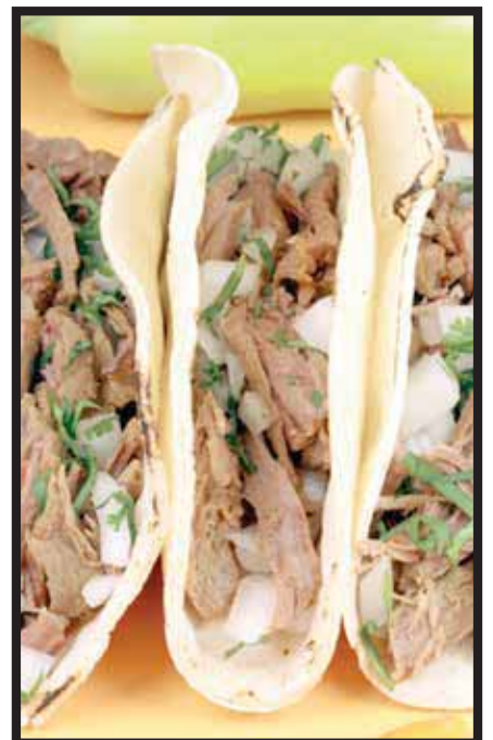
El Festival de Tacos y Cervezas.