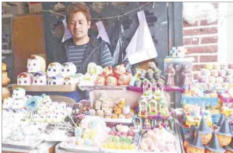
Las cadenas comerciales de la ciudad se “visten” de Halloween y el comercio en pequeño de Día de Muertos.

Cancún.- Las grandes cadenas comerciales de la ciudad se “visten” de Halloween y Día de Muertos, al tener llenos los mostradores de productos de la temporada donde los disfraces acaparan la atención de los niños, que divertidos eligen el suyo.