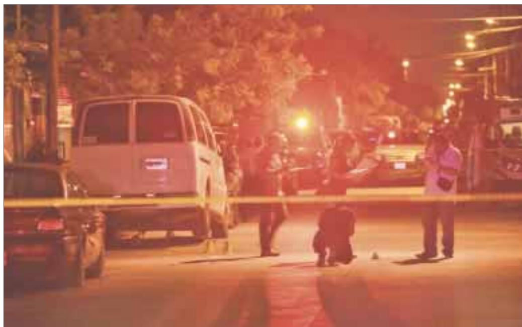
Los baleados portaban identificaciones falsas, por lo que se presume que están relacionados con actividades de la mafia.

Cancún.- La vicefiscalía del estado informó que hasta ayer por la tarde nadie se había presentado al Ministerio Público a reclamar el cadáver del baleado y luego atropellado sobre la avenida Kinik, en la supermanzana 50.