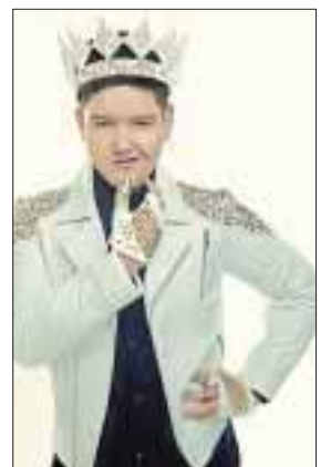
Presentaciones Loco de atar : 4 de noviembre, en Mexicali; 3 de diciembre, en El Foro Tijuana (concierto Yuri); 10 de diciembre, Angelópolis, en Puebla.

gustaría ir paso a pasito y de pronto por qué no hacer mi primer Teatro Metropolitano, después el Auditorio Nacional y por qué no hasta el Palacio de los Deportes, creo que todo éxito se empieza soñando y trabajando fuerte, entonces eso hago, la industria es muy difícil, pero por eso trato de darle una identidad a lo que hago, para que me conozcan y me identifiquen entre los demás cantantes que salen todos los días".