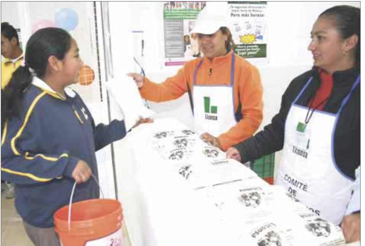
Liconsa apoya a la nutrición de millones de mexicanos en los 150 municipios más pobres del país.

También se atiende a 422 mil 339 mujeres adolescentes de 13 a 15 años; 214 mil 073 son personas con enfermedades crónicas y personas con discapacidad; mientras que 69 mil 147 son mujeres embarazadas o en periodo de lactancia. En este padrón se incluye a 759 mil 422 mujeres de 45 a 59 años, así como a un millón 398 mil 419 personas adultas de más de 60 años.