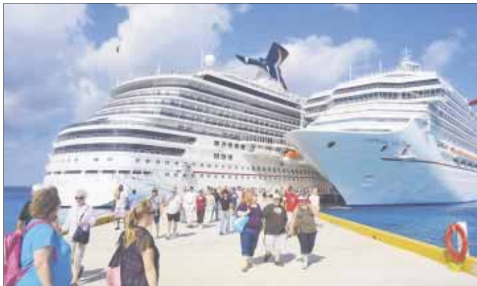
En Quintana Roo se dio por concluida la “temporada baja” con buenos resultados para APIQRoo, servicios y hoteleros.

Cancún.- En Quintana Roo con el megapuerto de Día de Muertos se puede dar por concluida la “temporada baja” ante los buenos resultados de los sectores vinculados con la industria sin chimeneas como APIQRoo, servicios, hoteleros, la CROC y CTM.