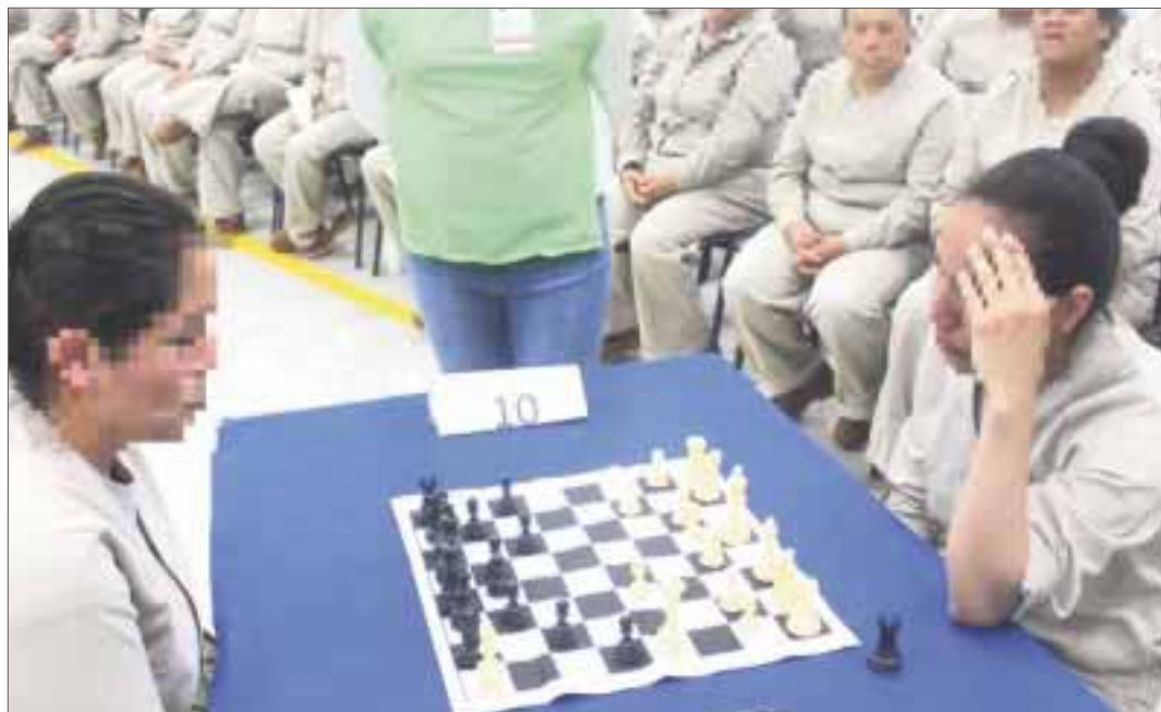
La práctica del ajedrez ayuda erradicar problemáticas de reclusos, como distorsiones afectivas y emocionales.

Para cumplir con el objetivo de la reinserción social, la Comisión Nacional de Seguridad impulsa desde octubre de 2015 el ajedrez como instrumento para erradicar problemáticas de reclusos, como distorsiones afectivas, emocionales, cognitivas y perceptivas, que ocasionan un deterioro en los ámbitos personal y familiar.