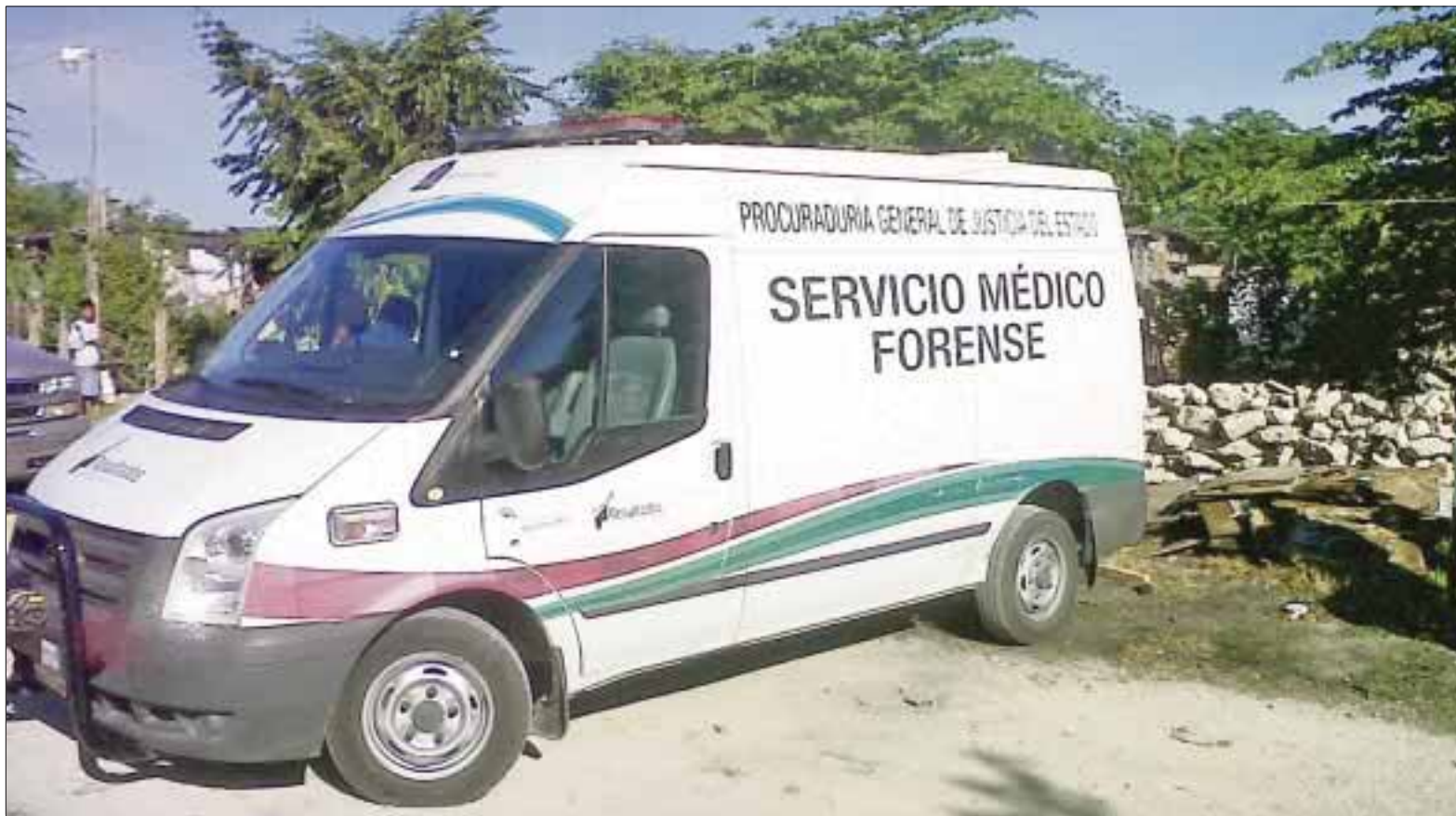
El suicidio número 43 del año en Cancún se registró la madrugada de ayer domingo, cuando una persona del sexo masculino se quitó la vida con una soga.

La esposa relató que el sujeto amenazó con quitarse la vida colgándose de una soga entre la cocina y el baño y en su desesperación salió a pedir ayuda a la policía, momento que aprovechó su marido para quitarse la vida.