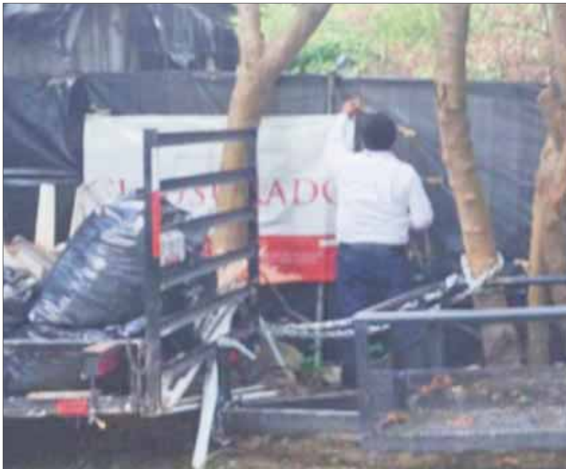
En el terreno clausurado en Playa del Carmen se constató el relleno del área con material pétreo.

De acuerdo a la Ley General de Vida Silvestre no está permitido el aprovechamiento de ninguna especie debido a que se encuentran enlistadas en la Norma Oficial Mexicana NOM-059-SEMARNAT-2010, bajo la categoría de Amenazadas.