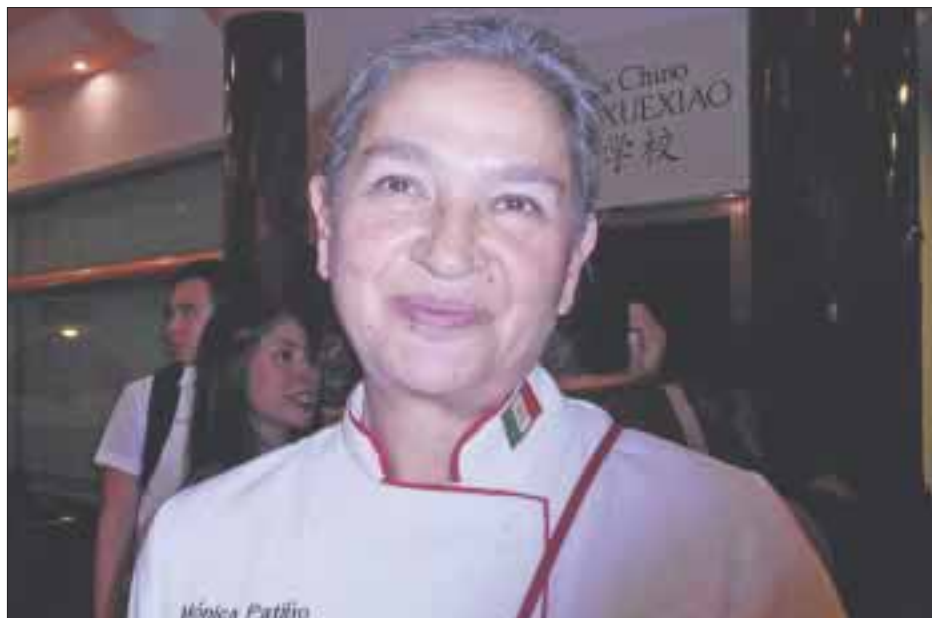
Mónica Patiño, una de las chefs más reconocidas en el mundo, ofreció una cátedra a estudiantes de gastronomía

Cancún.- La reconocida chef mexicana, Mónica Patiño, quien fue invitada a dar una plática e impartir sus conocimientos a los estudiantes que participaron en el Décimo Congreso de Gastronomía de la Universidad del Caribe, dijo que fue una experiencia grata, ya que le pudo transmitir a los jóvenes lo que ella ha aprendido y que le hizo recordar cuando empezó en esta bonita profesión.