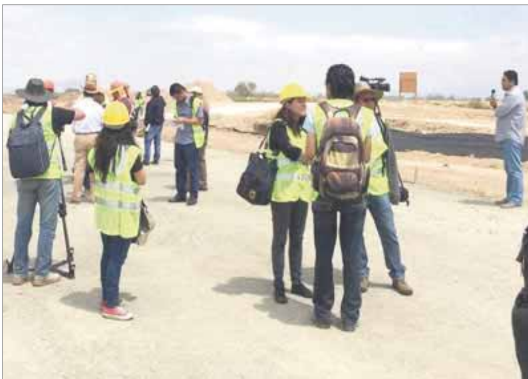
El Nuevo Aeropuerto de la Ciudad de México estará en operación en su primera etapa en el año 2020.

El titular la Secretaría de Comunicaciones y Transportes (SCT) Gerardo Ruiz Esparza, aseguró que el Nuevo Aeropuerto Internacional de la Ciudad de México (NAICM) en construcción, será sin duda el hub o centro de distribución más importante de América Latina.