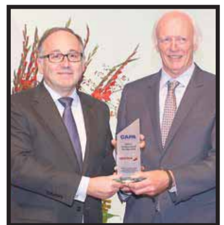
En la entrega del premio a la aerolínea de bandera española.