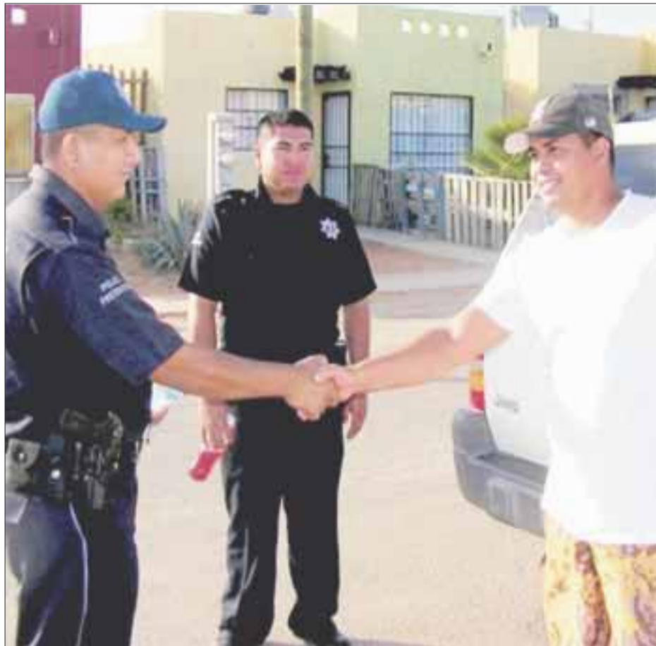
El objetivo del Proyecto de Policía de Proximidad es generar lazos sólidos con la ciudadanía..

El proyecto se da en el marco del Programa Nacional para la Prevención Social de la Violencia y la Delincuencia y la estrategia 3.3, cuyo propósito es favorecer el proceso de proximidad entre las instituciones policiales y la ciudadanía