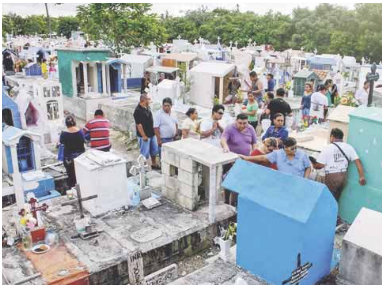
Se esperan en los panteones Jardines de Paz, Los Olivos y Los Álamos a 10 mil personas por la celebración de Día de Muertos.