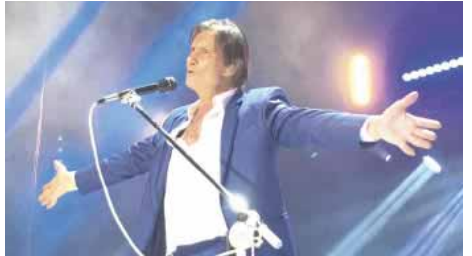
El hombre se marchó y la gente duró cinco minutos seguidos aplaudiendo, hasta obligarlo a regresar para entonar “Un millón de amigos”.

Sus conciertos son de película y así lo demostró el pasado 24 de septiembre en la Arena Ciudad de México, pues se