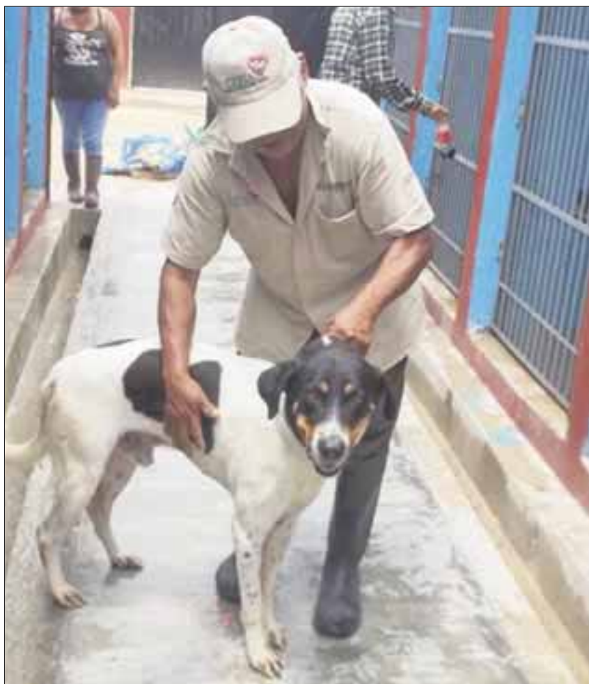
El Centro de Bienestar Animal ha atendido 3 mil 502 denuncias de la población en lo que va de la administración.

Para ello, cuenta con una plantilla laboral entre veterinarios, inspectores y choferes que son capacitados constantemente en la sensibilización, adiestramiento en materia de trato digno de la fauna, la aplicación correcta de biológicos y captura correcta en operativos apegados a lo que marca el reglamento de bienestar animal.