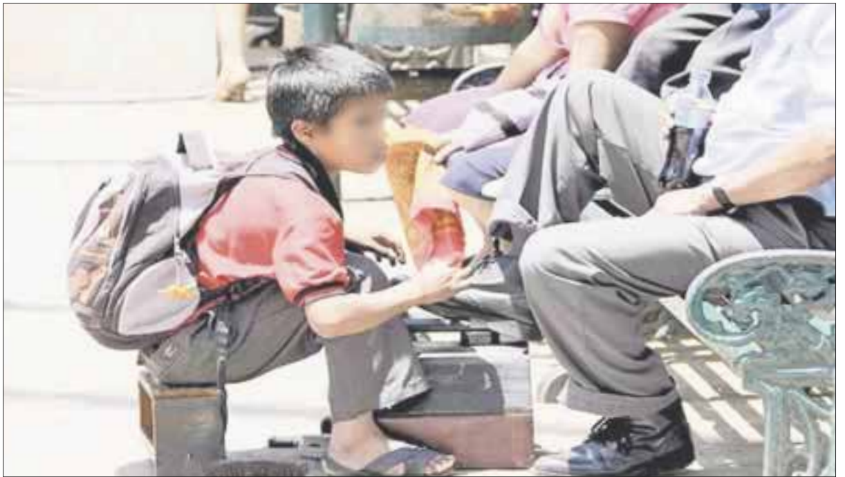
Diez mil niños de entre cinco y 17 años no acuden al colegio y trabajan, al nacer en condiciones precarias y en familias con más de cinco integrantes.

En Quintana Roo hay 379 mil 479 menores de cinco a 17 años, de los cuales, 93.7 por ciento de la población asiste a la escuela, mientras que 6.3 por ciento restante vive en condiciones precarias, de acuerdo con datos del Instituto Nacional de Estadística y Geografía (Inegi).