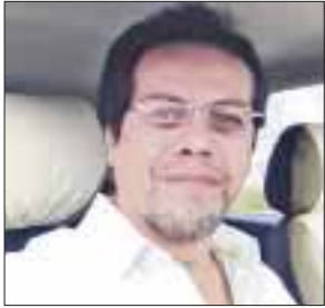
POR MAURICIO CONDE OLIVARES