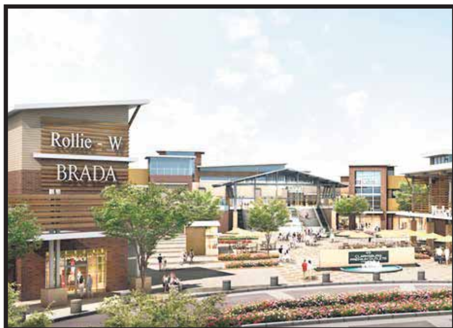
Nuevas tiendas se suman al nuevo Clarkburg Premium Outlets .