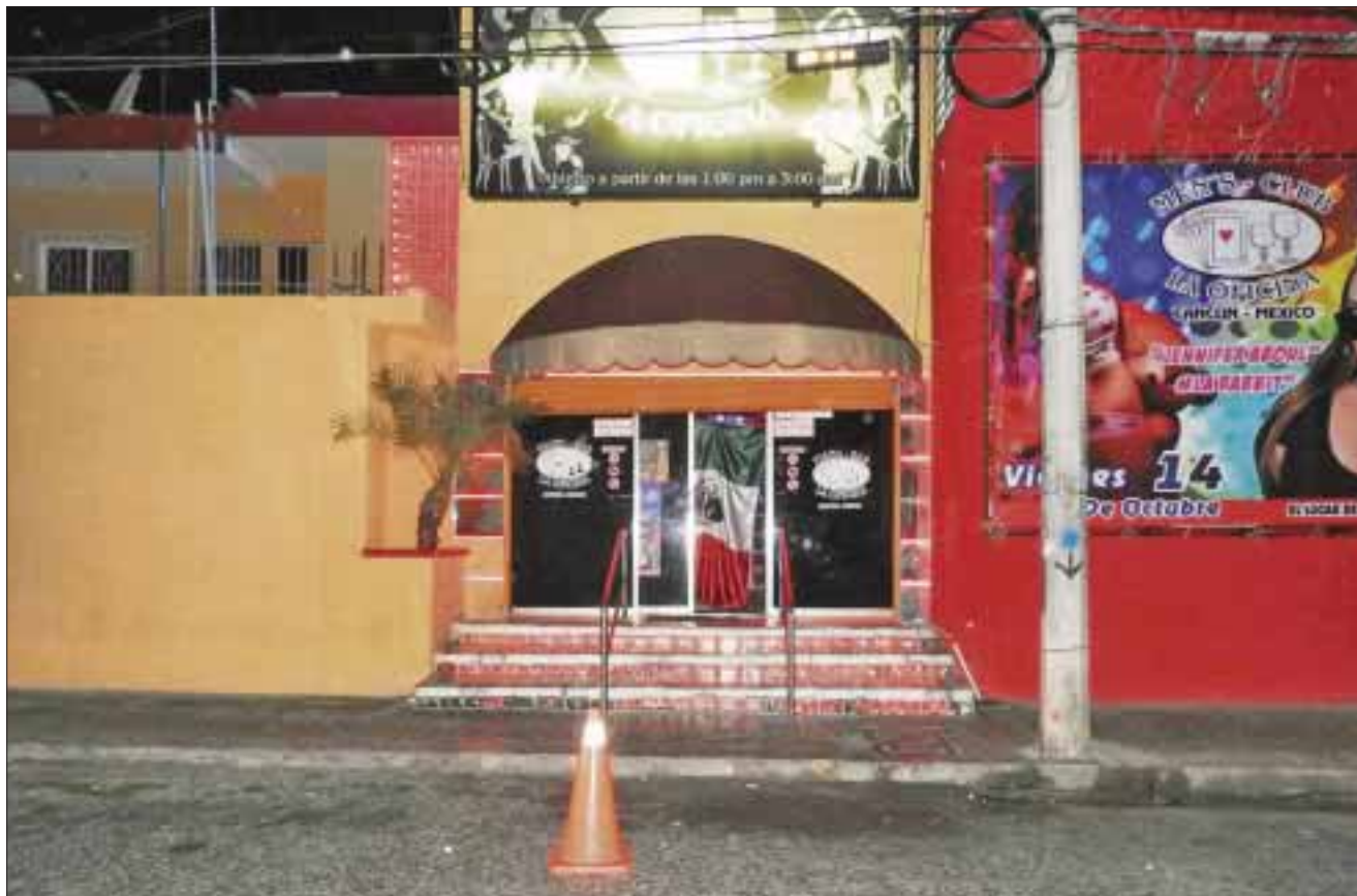
Un agente de seguridad privada "la libró", luego que supuestos gatilleros dispararan sobre la fachada del bar donde trabaja.

Hasta ayer no se había presentado el agraviado a interponer denuncia.