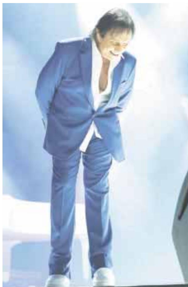
Fueron dos horas exactas de concierto, pero a los fans de este prolífico compositor brasileño se les hicieron 15 minutos.

Son pocos los conciertos que llegan a lo máximo del romanticismo, donde hasta la persona más insensible transpira amor y eso lo logra un grande, como lo es Roberto Carlos, a quien Dios le dio el don de ser un extraordinario cantautor, cuyo talento lo transmite, no sólo con el corazón, sino con el alma.