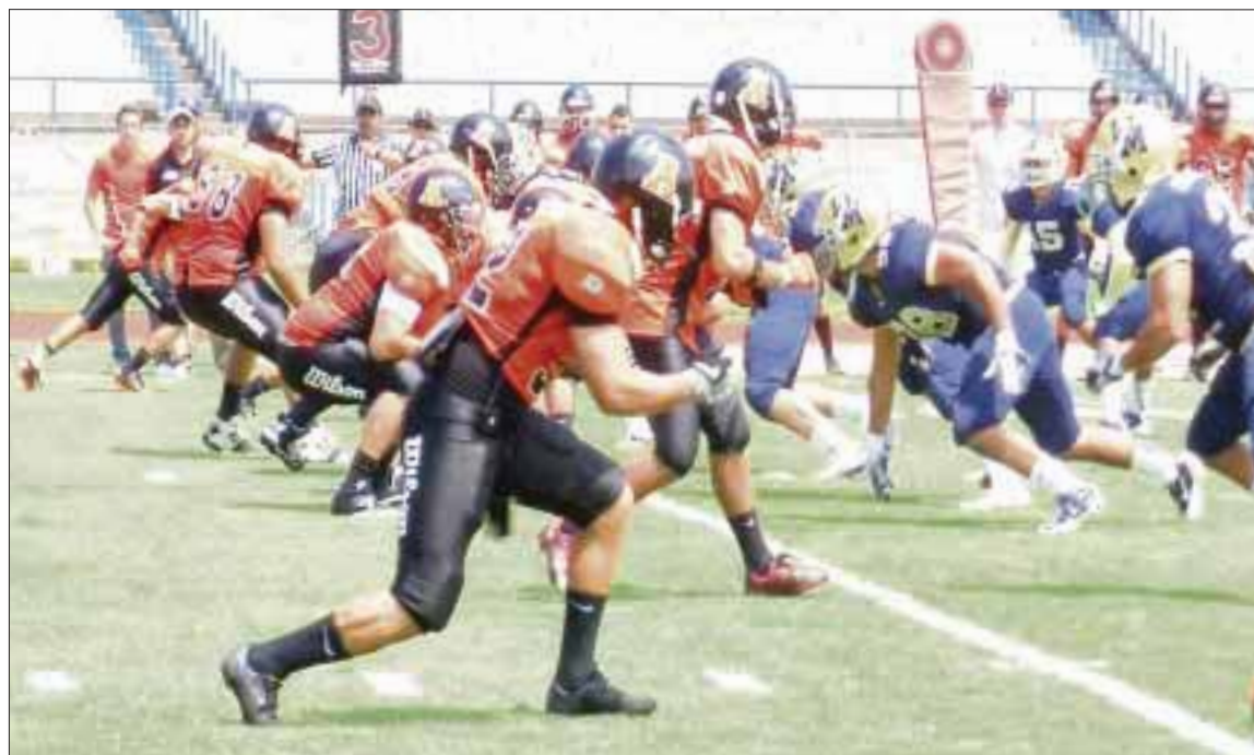
Una nueva derrota enciende los focos rojos en la escuadra caribeña, la cual cayó ante Pumas CU.