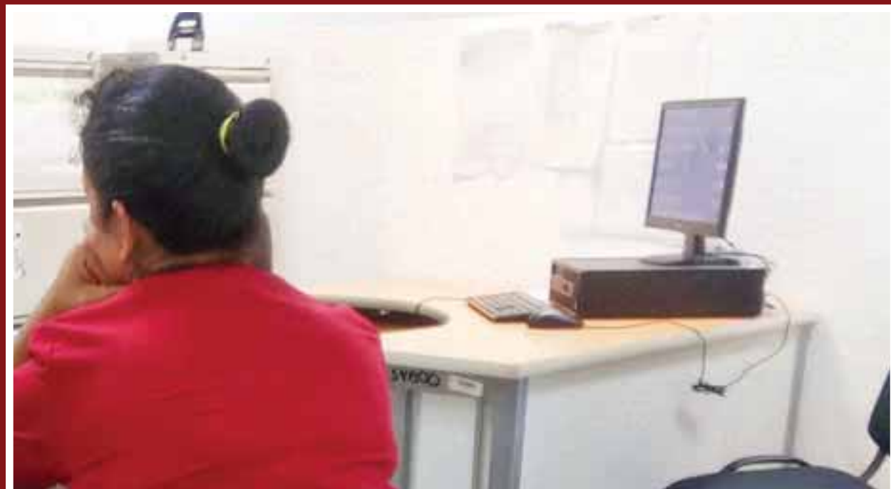
Familiares de una jovencita cristiana se hallan desesperados por la desaparición de su hija de apenas 23 años.