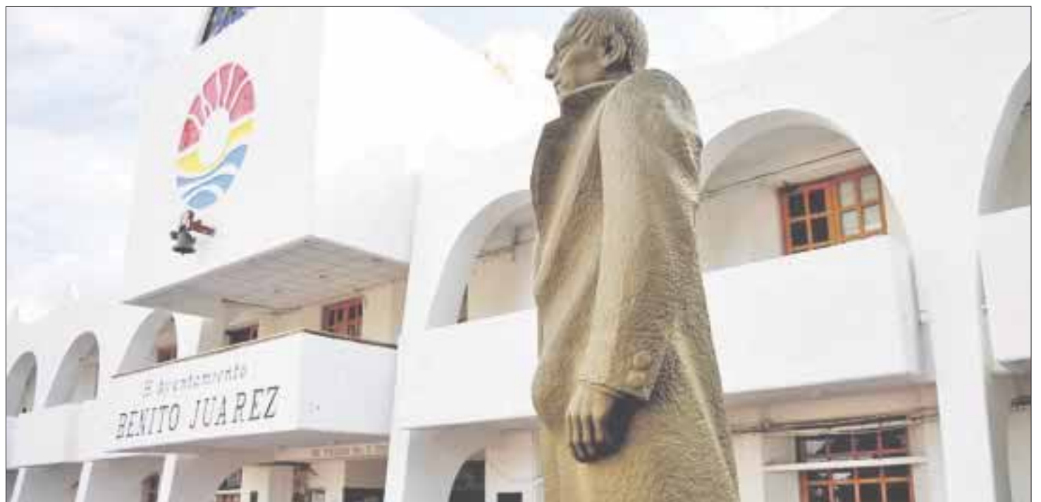
Se da vista a la Procuraduría General de la República (PGR), “con copia de la demanda y sus anexos, para que manifieste lo que a su representación corresponda”.

Agrega que, “se tiene como demandados en el presente asunto, al Poder Legislativo y al Órgano de Fiscalización Superior, ambos del estado de Quintana Roo, consecuentemente deberá emplazárseles para que presenten su contestación”.