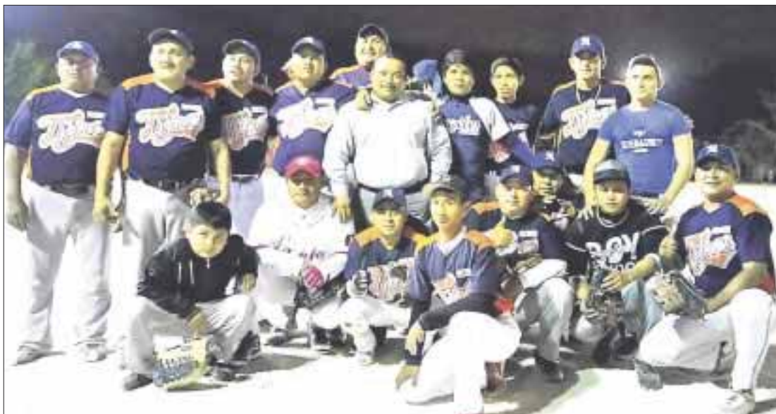
Tigres logró dar el primer zarpazo al equipo de Trabucos, al doblegarlos 20-11.

Cancún.- Empezaron los Play Offs en la Liga Sabatina Nocturna de Softbol de Tercera Fuerza en la Región 103 con dos partidos jugados que fueron Tigres que venció al equipo de Trabucos 20-11 y Tercera Potencia hizo lo mismo con el equipo de Astros al ganarles 3-1.