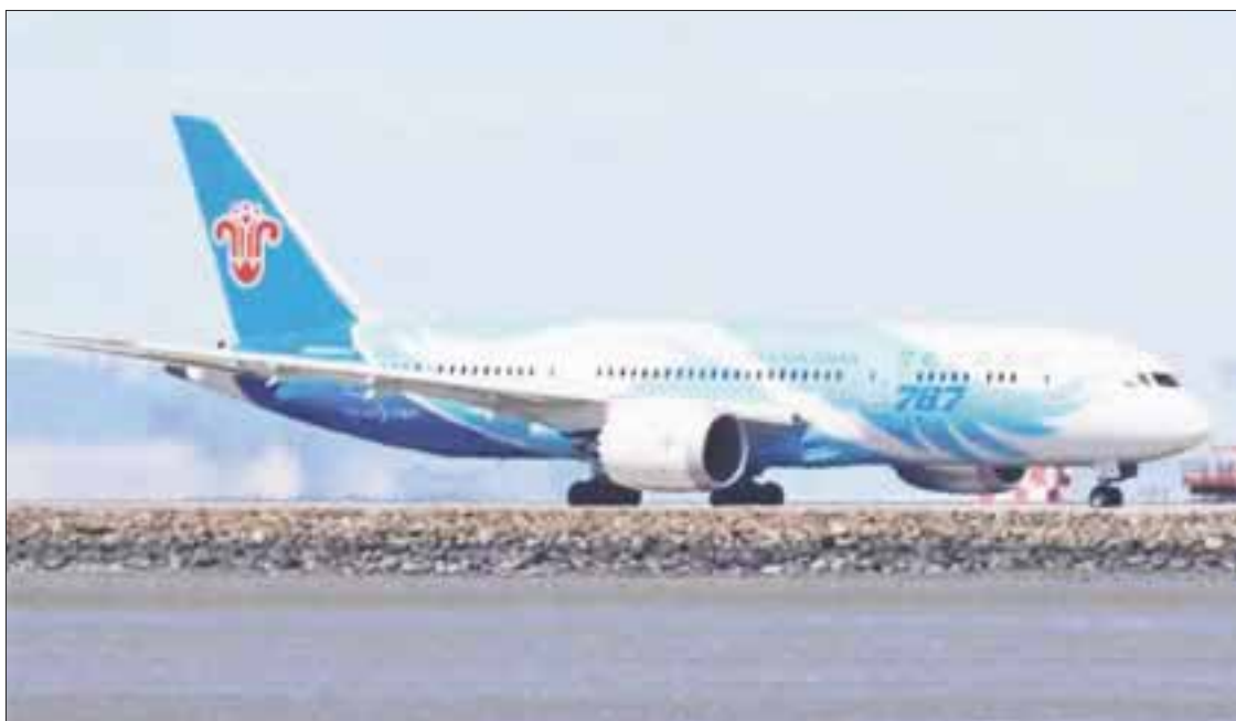
Inauguraron el vuelo de la aerolínea china Southern Airlines en la ruta Guangzhou-Vancouver-Ciudad de México.

Ayer se llevó a cabo la ceremonia de inauguración del vuelo de la aerolínea china Southern Airlines en la ruta Guangzhou-Vancouver-Ciudad de México, el cual es el primero de una aerolínea china a México, y el primero de dicha compañía a América Latina, destacó la cancillería.