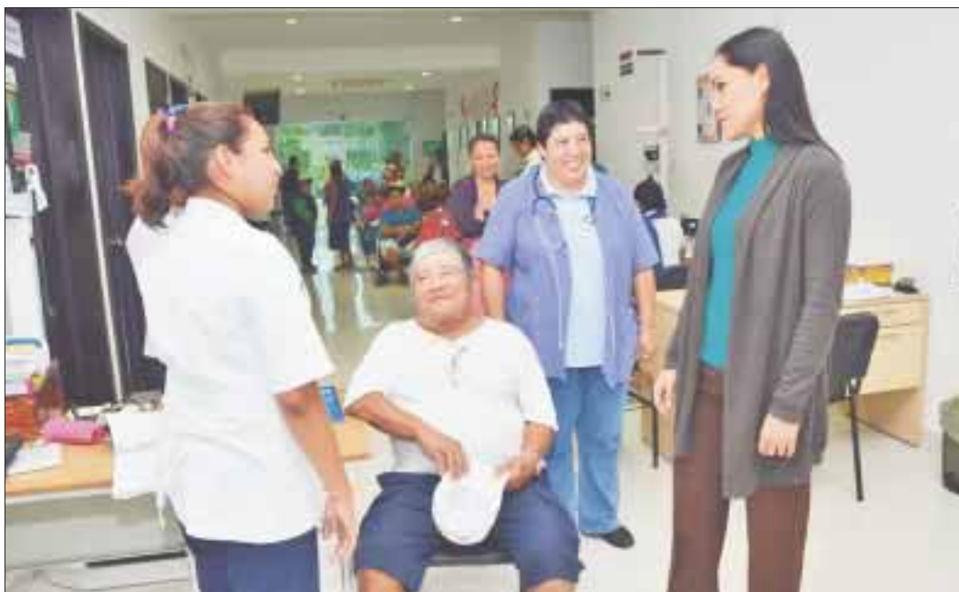
Los centros de salud y hospitales estarán otorgando servicios de manera habitual los días jueves 13 y viernes 14 de abril.

Chetumal.- En los Servicios Estatales de Salud vamos hacia adelante en la generación de más y mejores oportunidades de acceso a los servicios públicos de calidad, destacó la secretaria de Salud, Alejandra Aguirre Crespo, al dar a conocer la cobertura de los servicios médicos y de urgencias en 178 unidades de salud como parte del “Operativo Vacacional de Semana Santa” del 8 al 23 de abril.