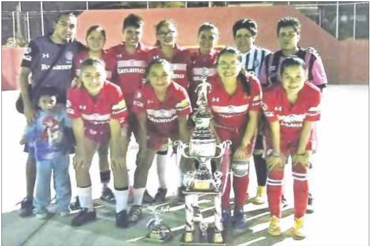
Linces ya son campeonas de futbol rápido de la región 103, al ganar en la final al equipo del Deportivo Gacelas.