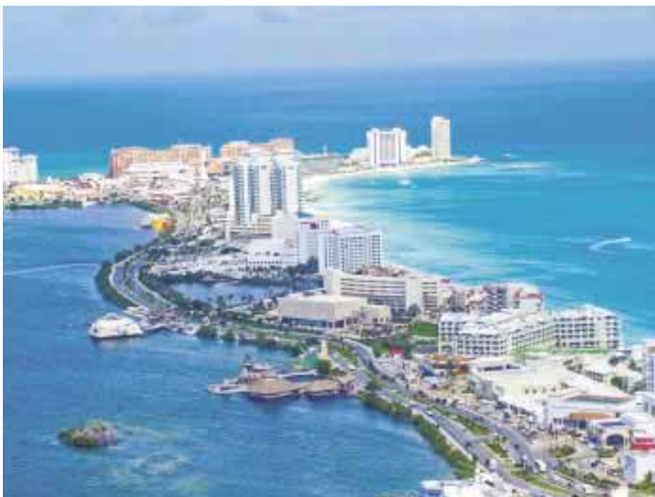
"Viajemos por Quintana Roo".

Oaxaca, Oaxaca: esta temporada ofrece una gran variedad de actividades tanto relacionadas a Semana Santa como turísticas. Además, tendrás la oportunidad de acudir a alguna de las múltiples fábricas de mezcal que existen, o bien turistar por los alre-