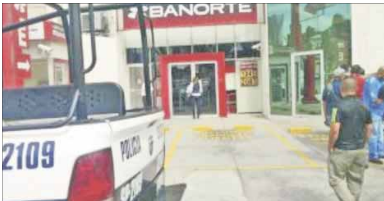
Al salir de esta sucursal de Banorte en Multiplaza La Luna, el mensajero fue interceptado y despojado de 120 mil pesos.

Cancun.- Par de ladrones con arma en mano despojan del efectivo a diligenciero que acababa de retirar del Banorte, ubicado en la región 50.