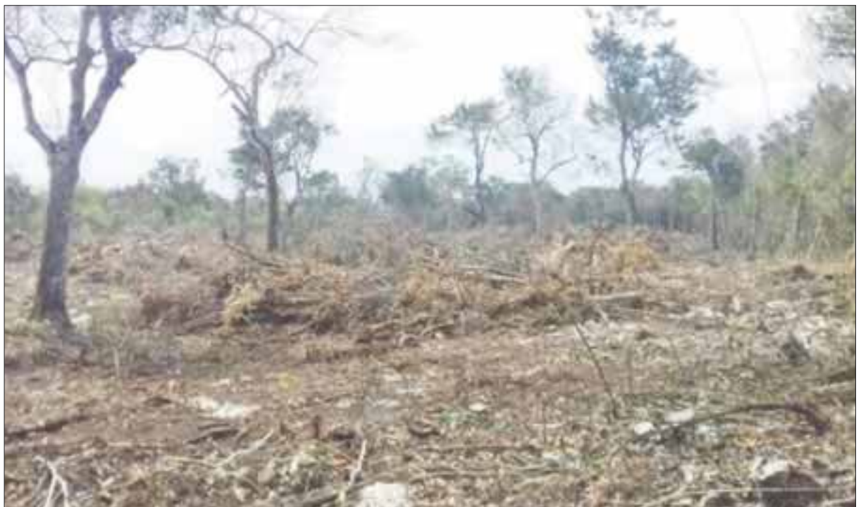
La Ruta de los Cenotes en Puerto Morelos está vetada para el desmonte, pues ejidatarios y campesinos tampoco respetan la ley forestal, motivo por el cual han sido sancionados.

Las violaciones cometidas podrán ser sancionadas con la imposición de una multa por el equivalente de 100 a 20 mil días de la Unidad de Medida y Actualización vigente en la Ciudad de México, además de la clausura total de las obras y actividades.