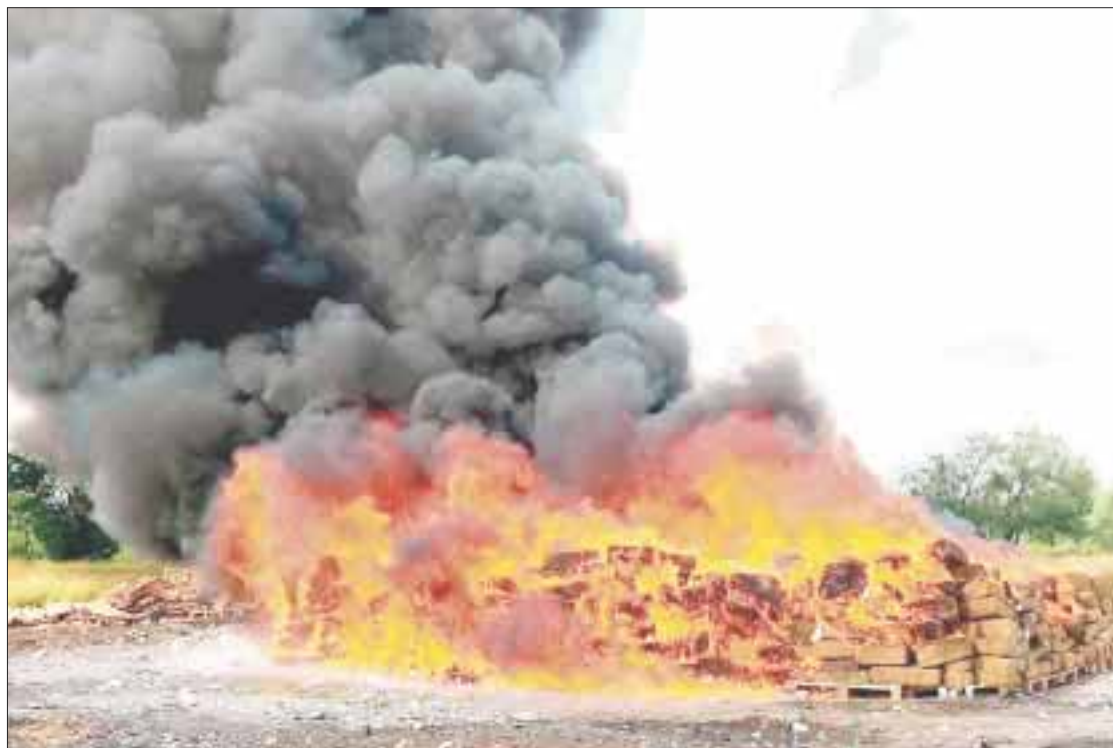
La PGR incineró más de tres toneladas de drogas diversas, principalmente marihuana, en el Campo de Tiro Zafari.

La PGR apuntó que la Subprocuraduría de Control Regional, Procedimientos Penales y Amparo dio cumplimiento así al calendario Na-