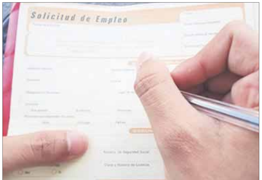
La tasa de desempleo en México en febrero fue de 3.4 por ciento, su menor nivel en los últimos 11 años.

En contraste, las menores tasas de desempleo en el segundo mes del año pasado se registraron en Japón con 2.8 por ciento, Islandia con 2.9 por ciento, República Checa y México con 3.4 por ciento, cada uno, y Alemania con 3.9 por ciento