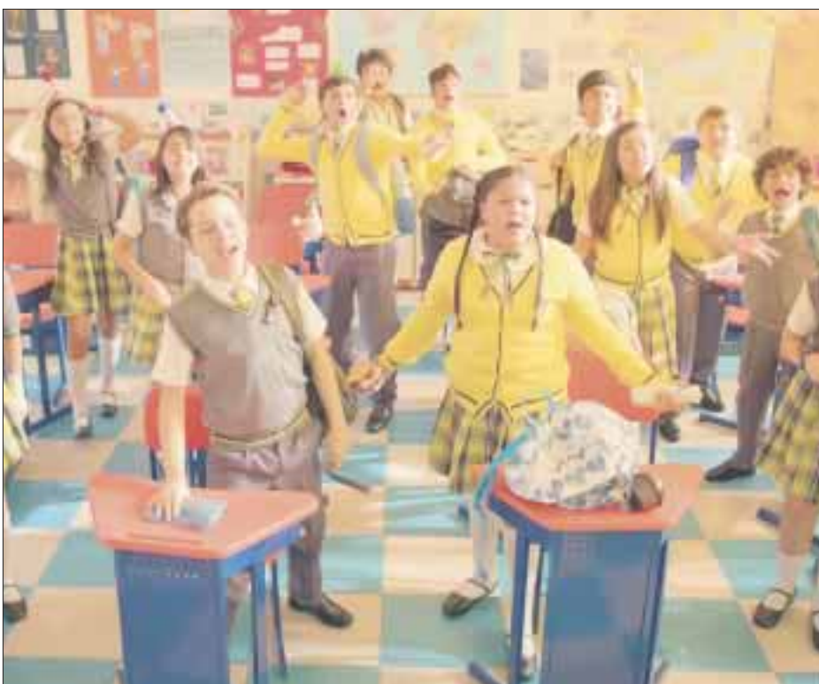
La película pretende resaltar los valores de amistad, respeto y tolerancia entre los niños.