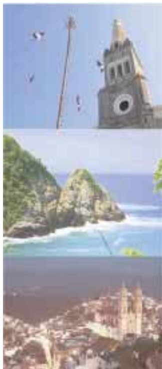
Para disfrutar del descanso.

dedores y conocer la zona arqueológica de Monte Albán y la inigualable belleza de Hierve el Agua.