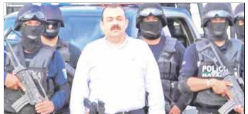
Fue aplazada para el 5 de junio la próxima audiencia del caso contra el ex procurador Edgar Veytia.

al gobernador de Nayarit la casa donde mataron al “H2”. Fuentes de seguridad en la entidad refirieron que el fiscal ya había iniciado el trámite para obsequiar al mandatario la propiedad de tres plantas en la colonia Lindavista de Tepic, que todavía mantiene sellos y una manta de la Fiscalía estatal.