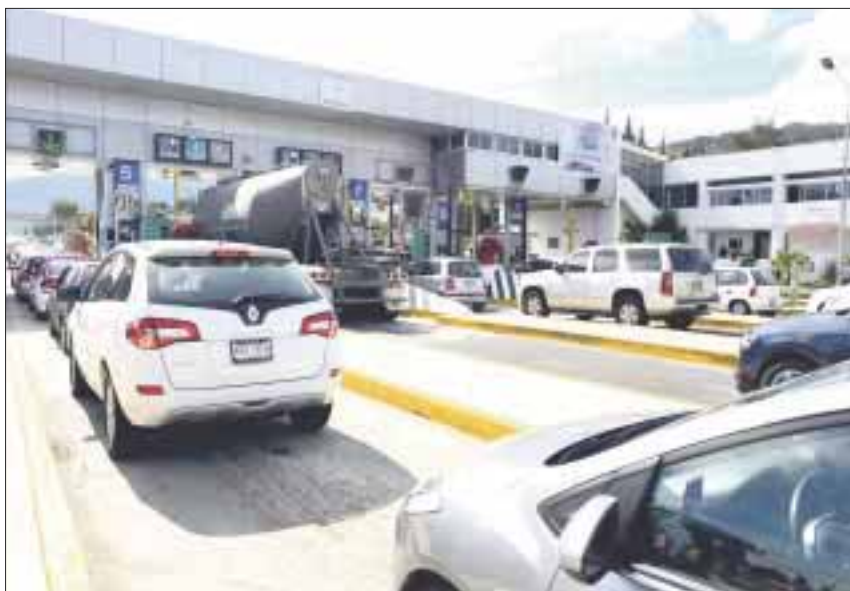
Protección Civil recomienda planificar una ruta de viaje, llevar un kit básico de herramientas y un botiquín de primeros auxilios.

La Coordinación Nacional de Protección Civil de la Secretaría de Gobernación llamó a la población a adoptar diversas medidas de seguridad además de planificar, para evitar contratiempos en carretera, un centro turístico o bien, en su domicilio, durante la temporada vacacional de Semana Santa.