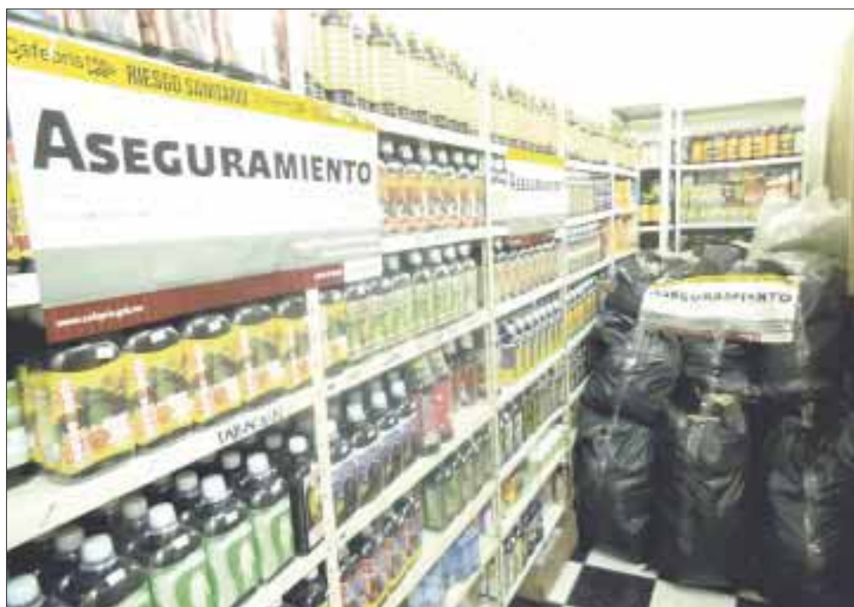
Cofepris aseguró 429 mil 912 piezas de productos milagro en varios operativos en Jalisco y CDMX.

La Comisión Federal para la Protección contra Riesgos Sanitarios (Cofepris) aseguró 429 mil 912 piezas de productos milagro , bajo la presentación de suplementos alimenticios en tabletas y cápsulas, tanto a granel como productos terminados.