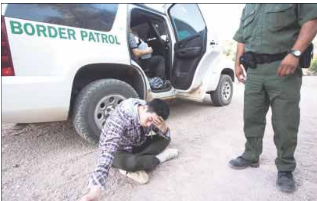
Los migrantes indocumentados que sean detenidos en la frontera ya no serán liberados, anuncia el gobierno de Estados Unidos.

De la misma forma, el Departamento de Justicia iniciará procesos judiciales contra los inmigrantes indocumentados que cometan fraude con documentos, lo cual será considerado como un “robo