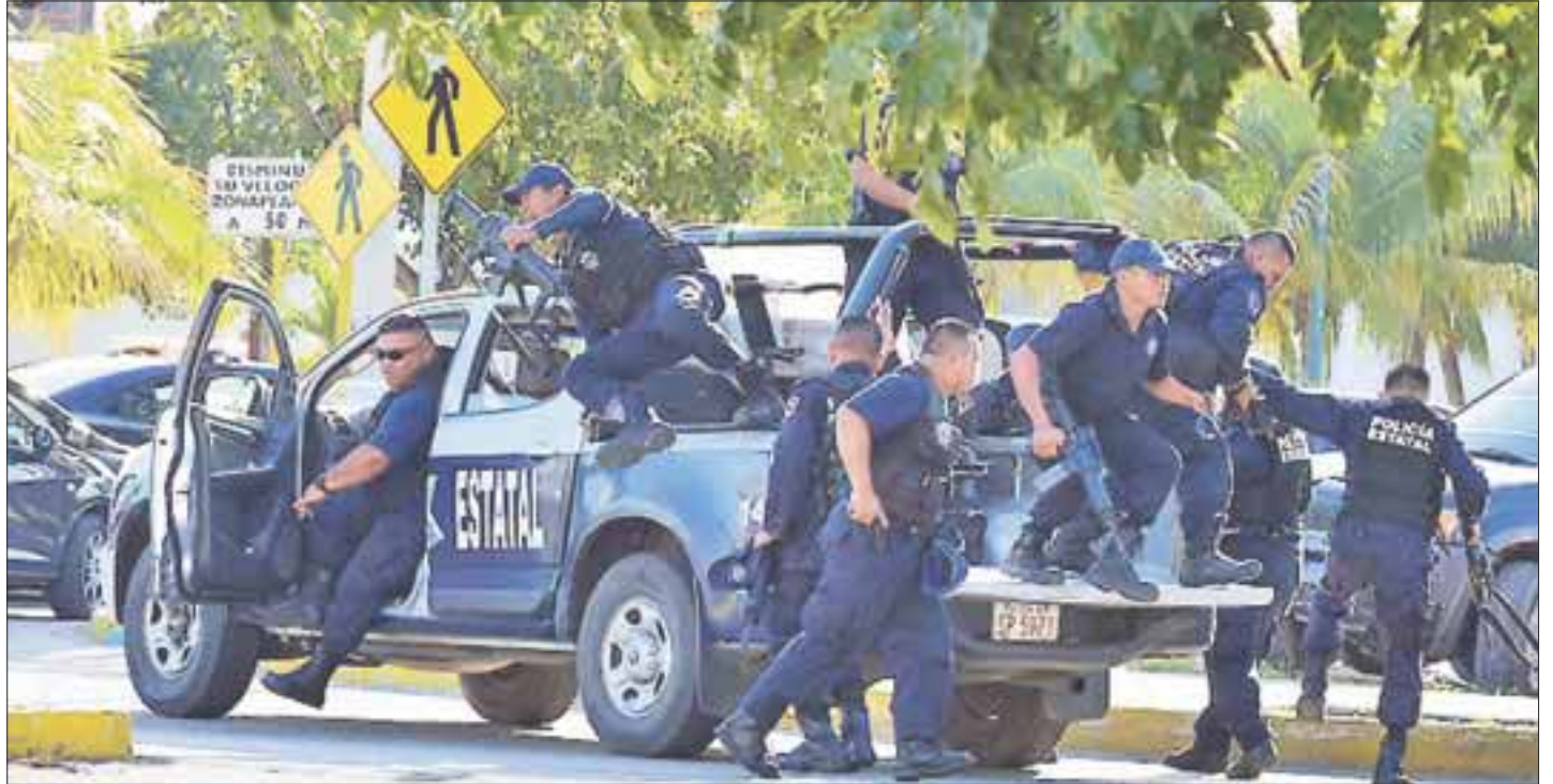
La presencia de autoridades federales en la ciudad no afectó la imagen ante los consulados, que al igual que en otros países ven con buenos ojos garantizar la seguridad de los visitantes.

La respuesta de los consulados es que están al pendiente de la presencia de sus connacionales, no mostraron rechazo a dicha presencia policiaca ya que se hace este tipo de despliegues hasta en las grandes ciudades turísticas.