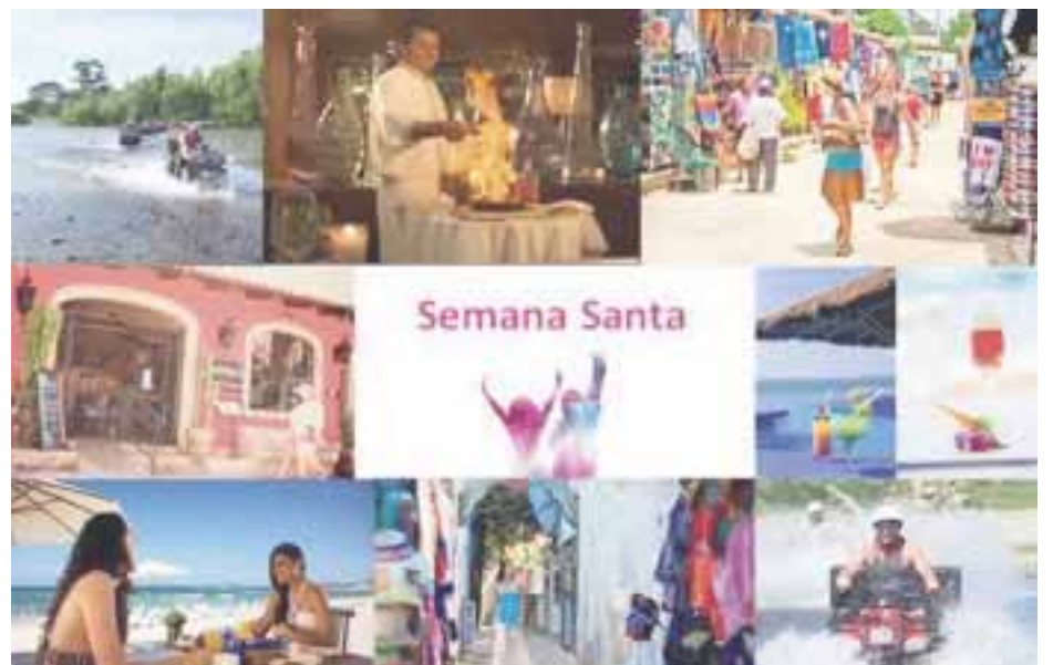
Riviera Nayarit, una opción para viajar estas vacaciones.

La diversión es una garantía en territorio nayarita, y es que en el destino puedes disfrutar de diversas actividades gracias al