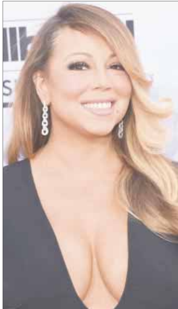
La cantante, de 47 años, firma con nueva disquera, por lo que es cuestión de meses para que saque a la luz un nuevo material.

En México, la telenovela “Carrusel” se transmitió en 1989 logrando colocarse en el gusto de la audiencia. En 1992 se hizo una nueva versión titulada “Carrusel de las Américas” y en 2002 se produjo “¡Vivan los niños!”.