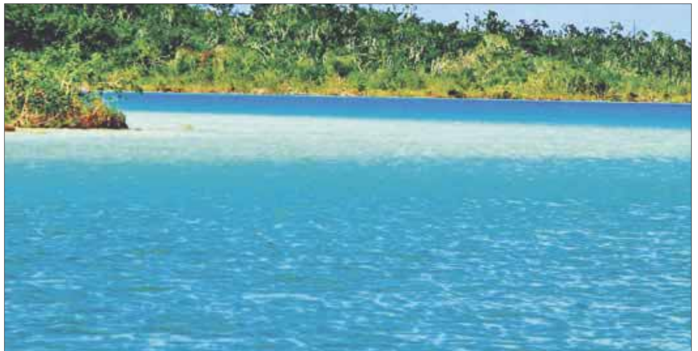
La popularmente conocida como la laguna de los siete colores, debido a que se pueden distinguir siete diferentes tonalidades de azul entre sus aguas.

La reunión a desarrollarse en la Casa del Escritor o la sala de juntas del Ejido Bacalar, donde todos los involucrados analizarán y estudiarán la situación actual de la laguna de los Siete Colores, su desarrollo, con un menor impacto en su flora y fauna.