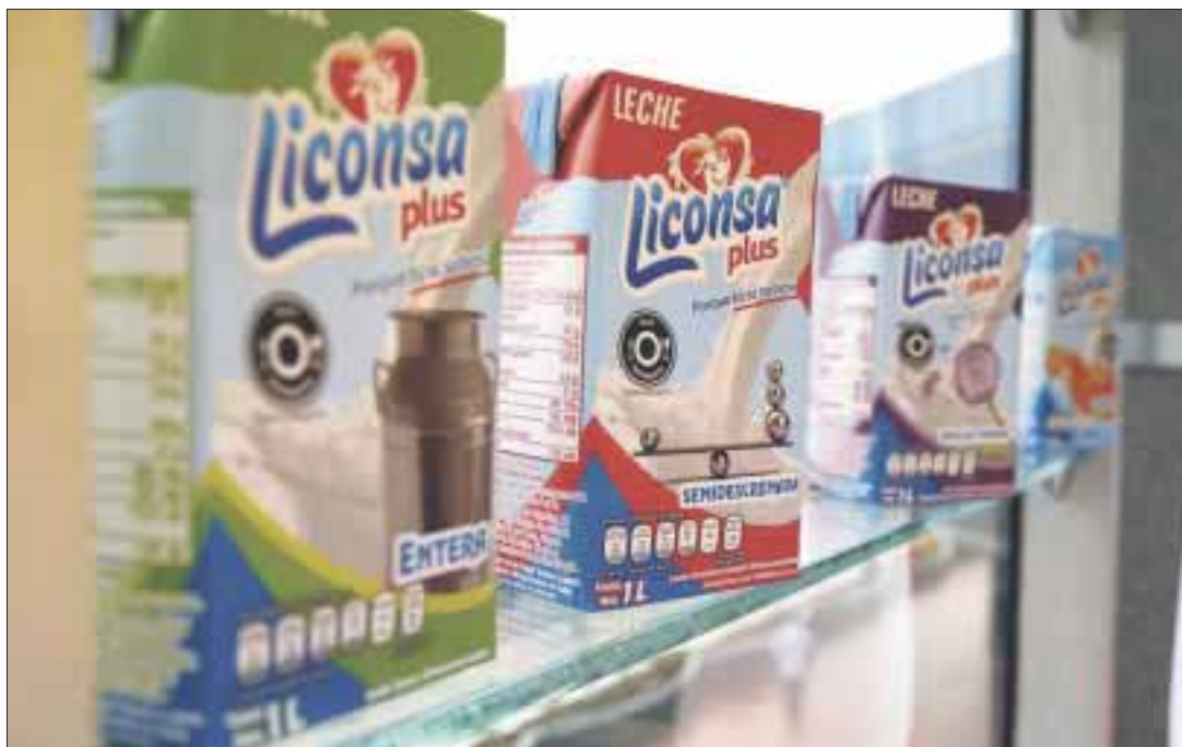
Casi 544 mil personas de Oaxaca, Guerrero y Chiapas podrán adquirir el litro de leche Liconsa por 4.50 pesos.

Liconsa cuenta con 10 plantas industriales en Guadalajara, Jalisco; Xalapa, Veracruz; Jiquilpan, Michoacán; Tláhuac, en la Ciudad de México; Tlalnepantla y Toluca, Estado de México, así como Colima, Oaxaca, Tlaxcala y Querétaro