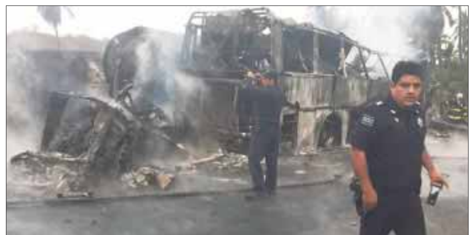
Concluyeron los trabajos de identificación de las 28 personas que fallecieron en el accidente registrado la semana pasada en la Autopista Siglo 21.

se pudo identificar que los restos corresponden a un total de 28 cadáveres, todos con plena correspondencia a los perfiles genéticos que previamente se tomaron a los familiares que comparecieron ante la autoridad”, menciona el comunicado.