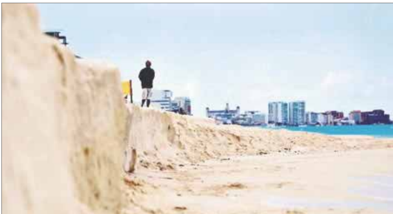
La erosión se devora tres kilómetros de playa de la costa de Cancún, Playa del Carmen y Tulum.

Cancún.- La erosión se devora tres kilómetros de playas de la costa de Cancún, Playa del Carmen y Tulum, como parte de un fenómeno natural en el Caribe que se analizará con sobrevuelos a partir de esta semana para poder actuar según estimaciones de la secretaria de Turismo en el estado.