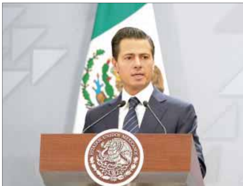
Enrique Peña Nieto hizo un reconocimiento a las agencias y unidades de inteligencia que lograron la captura de Javier Duarte de Ochoa.

El presidente Enrique Peña Nieto afirmó que las detenciones de los ex gobernadores de Veracruz, Javier Duarte, y Tomás Yarrington, de Tamaulipas, son un mensaje firme y contundente del Estado mexicano contra la impunidad.