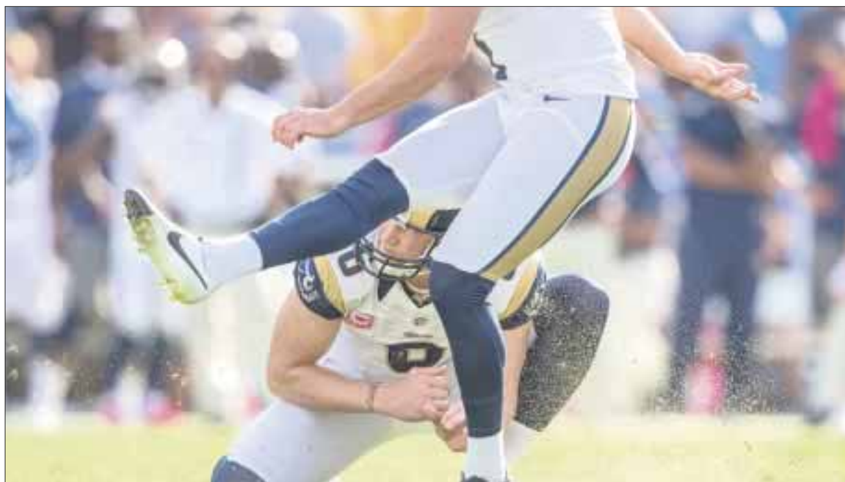
Más de 23 equipos arrancaron con la primera etapa de entrenamientos, de cara a la campaña 2017.

Por su parte, los Bills de Buffalo y los Carneros de Los Ángeles, quienes arrancaron actividades el 3 de abril, iniciarán con la fase dos de los entrenamientos, los cuales ya permiten ejercicios en el terreno de juego sin contacto de por medio.