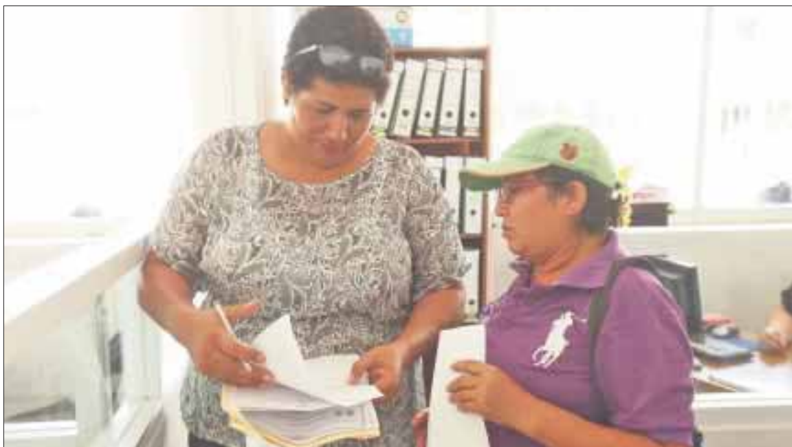
El DIF de Quintana Roo atiende diariamente alrededor de 150 personas de bajos recursos que acuden en busca de apoyo