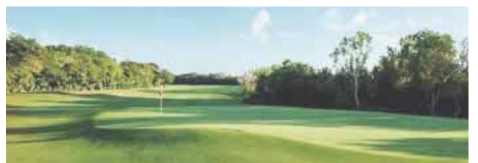
Cozumel Country Club.