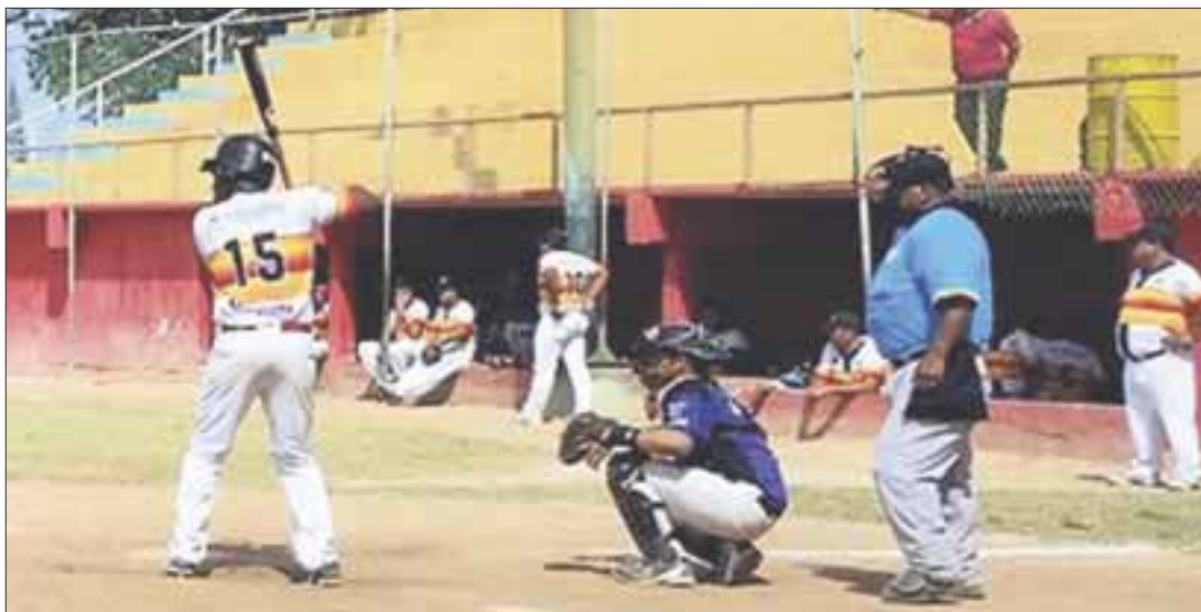
Rockies de Cancún sigue sumando triunfos en la Liga Estatal Carlos Joaquín González, al vencer a Lázaro Cárdenas.

Cancún.- En lo que fue un duelo de pitcheo, el conjunto de Rockies logró someter a solo una carrera al equipo Ganaderos de Lázaro Cárdenas, al vencerlos 4 carreras a 1 en la Liga Estatal de Beisbol Carlos Joaquín González.