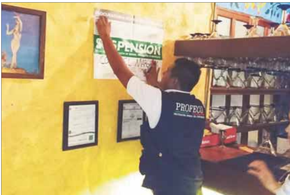
Para reforzar las acciones y proteger los derechos de los consumidores, se proporcionaron 20 asesorías por parte de la Profeco.

En su padrón de vendedores tiene un total de 22 mil ambulantes, de los cuales 600 hicieron los trámites para la renovación de permiso y licencia de funcionamiento, el 50 por ciento, no logró reunir los requisitos