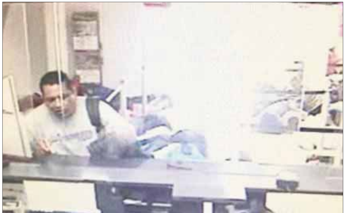
El asaltante era de 1.70 de estatura, complexión delgada, moreno, quien portaba gorra negra y lentes oscuros.

En el lugar los servicios de emergencia atendieron a algunas personas que presentaron crisis nerviosa.