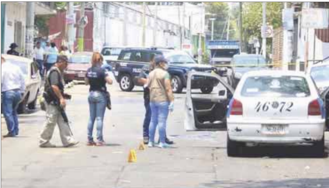
En el barrio La Fábrica, en Acapulco, fue asesinado un taxista y un pasajero resultó herido.

Matan a una mujer y a un taxista en Acapulco; en Taxco, a un profesor