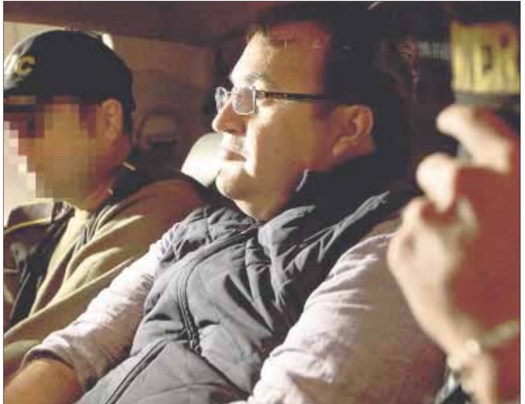
Las autoridades mexicanas van “por todo lo que se llevó” Javier Duarte, afirma la PGR.

La PGR refirió que han realizado aseguramientos en diversos estados del país, y han solicitado asistencias jurídicas en países como Estados Unidos y España, donde se han identificado activos, cuentas e inmuebles del ex funcionario