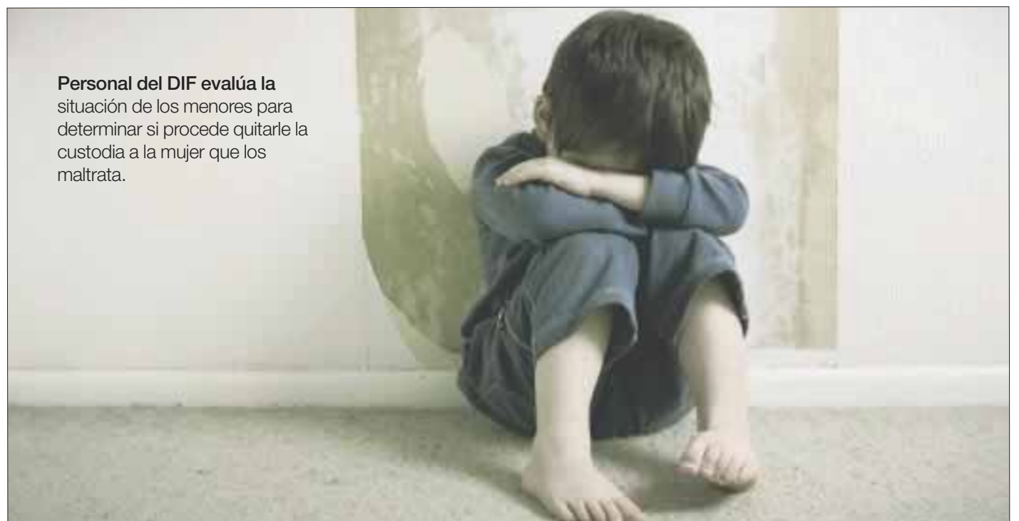
Personal del DIF evalúa la situación de los menores para determinar si procede quitarle la custodia a la mujer que los maltrata.

Sin embargo, la mujer continuó con su comportamiento agresivo e incluso golpeó a un policía, por lo que fue detenida mientras se realizan las investigaciones sobre la verdadera situación de los menores que no presentan daño físico, pero sí emocional por las condiciones de higiene y falta de alimento.