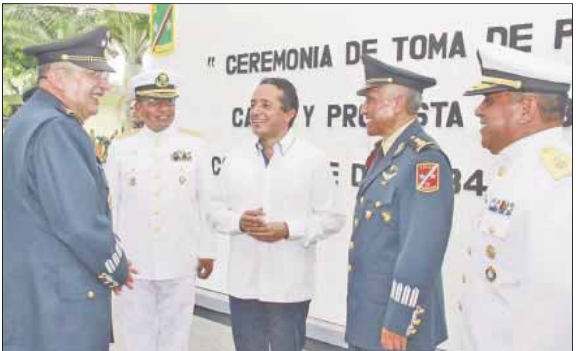
El gobernador, Carlos Joaquín, atestiguó la toma de posesión del general de Brigada Diplomado de Estado Mayor, Gabriel García Rincón.

Como ejemplo citó la presencia de más de 600 elementos del Ejército que se encuentran en Quintana Roo trabajando en diferentes operativos durante la presente temporada vacacional, brindando protección a los quintanarroenses y los visitantes, acciones que se fortalecerán con el cambio de mando militar. Durante la ceremonia, el personal de comandantes, jefes jurisdiccionales, directivos adscritos a esta comandancia se presentaron ante el nuevo jefe militar.