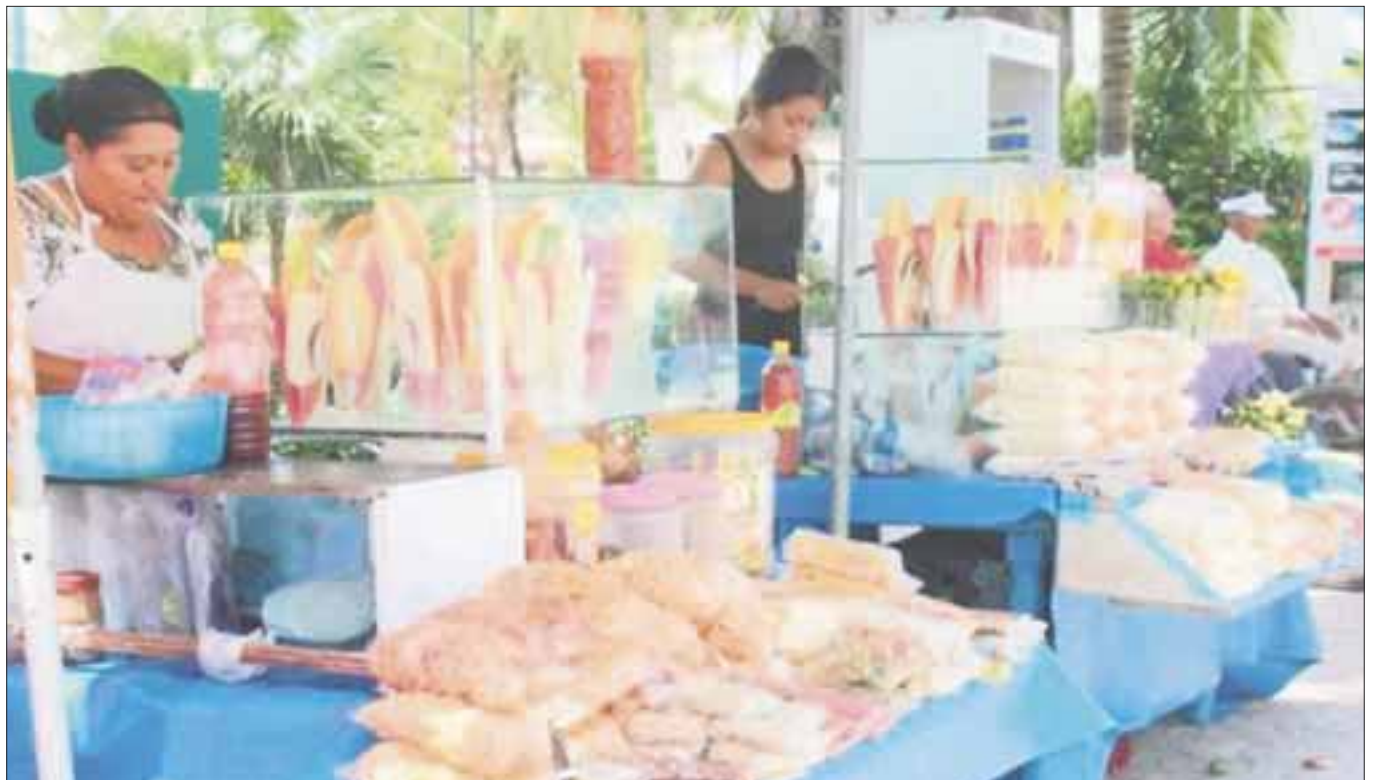
Más de 300 vendedores ambulantes fueron rechazados de obtener permiso para venta de alimentos en la calle, de 600 que solicitaron su renovación.

Mencionó que el manejo inadecuado de los alimentos, la contaminación del agua y las condiciones climáticas son favorables para generar infecciones gastrointestinales e intoxicaciones por la descomposición del producto, que afecta directo a niños y ancianos.