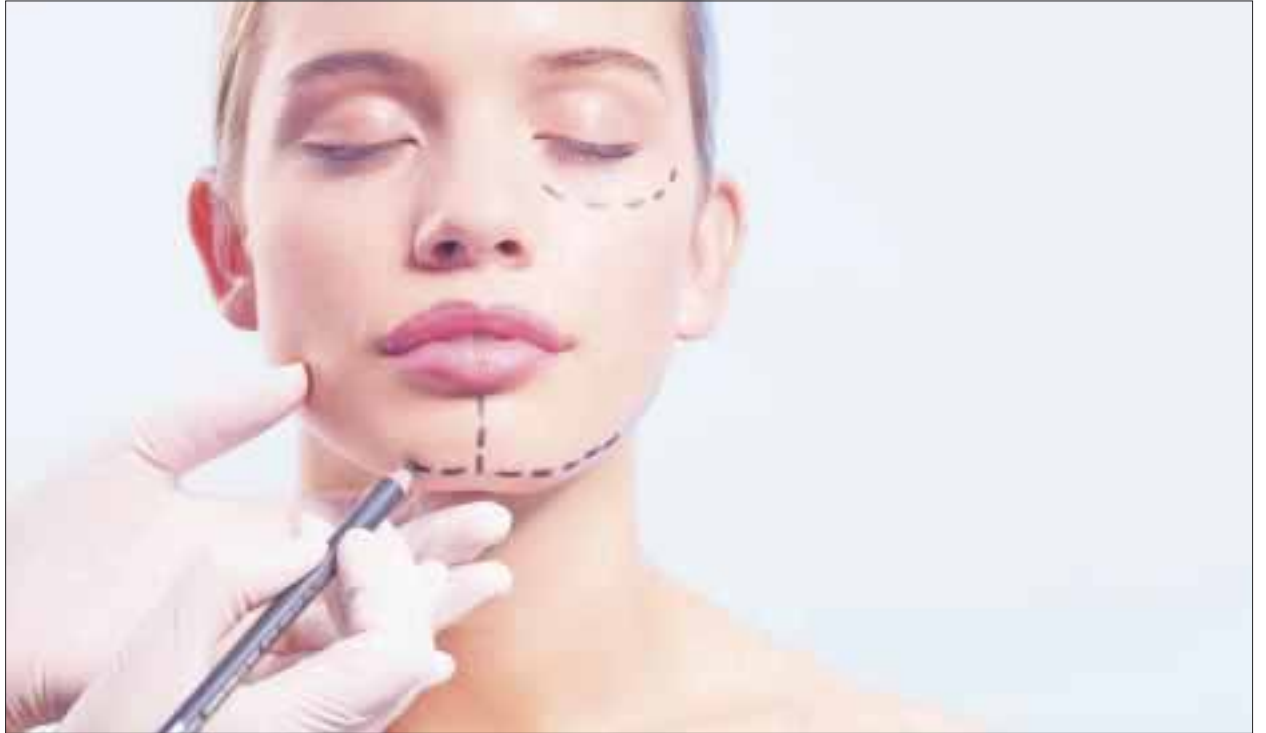
El 20 por ciento del turismo médico en Cancún, será incrementado con un Reality Show como parte de una campaña promocional, con una cirugía estética que se transmitirá en vivo vía YouTube.

En los últimos años Cancún se posicionó en la zona oeste, en las provincias de Alberta y Columbia Británica, y la estrategia con el Reality Show es darle más promoción al destino en el este de Canadá, en las provincias de Montreal y Ontario donde se hizo una convocatoria a través de un concurso.