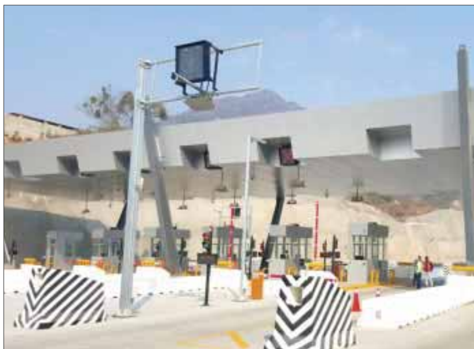
Fue puesto en operación el Macrotúnel Acapulco, la obra más larga de su tipo en México.

Acapulco.- Fue inaugurado en Guerrero el Macrotúnel Acapulco, la obra más larga de su tipo en el país, aseguró el titular de la Secretaría de Comunicaciones y Transportes (SCT), Gerardo Ruiz Esparza.