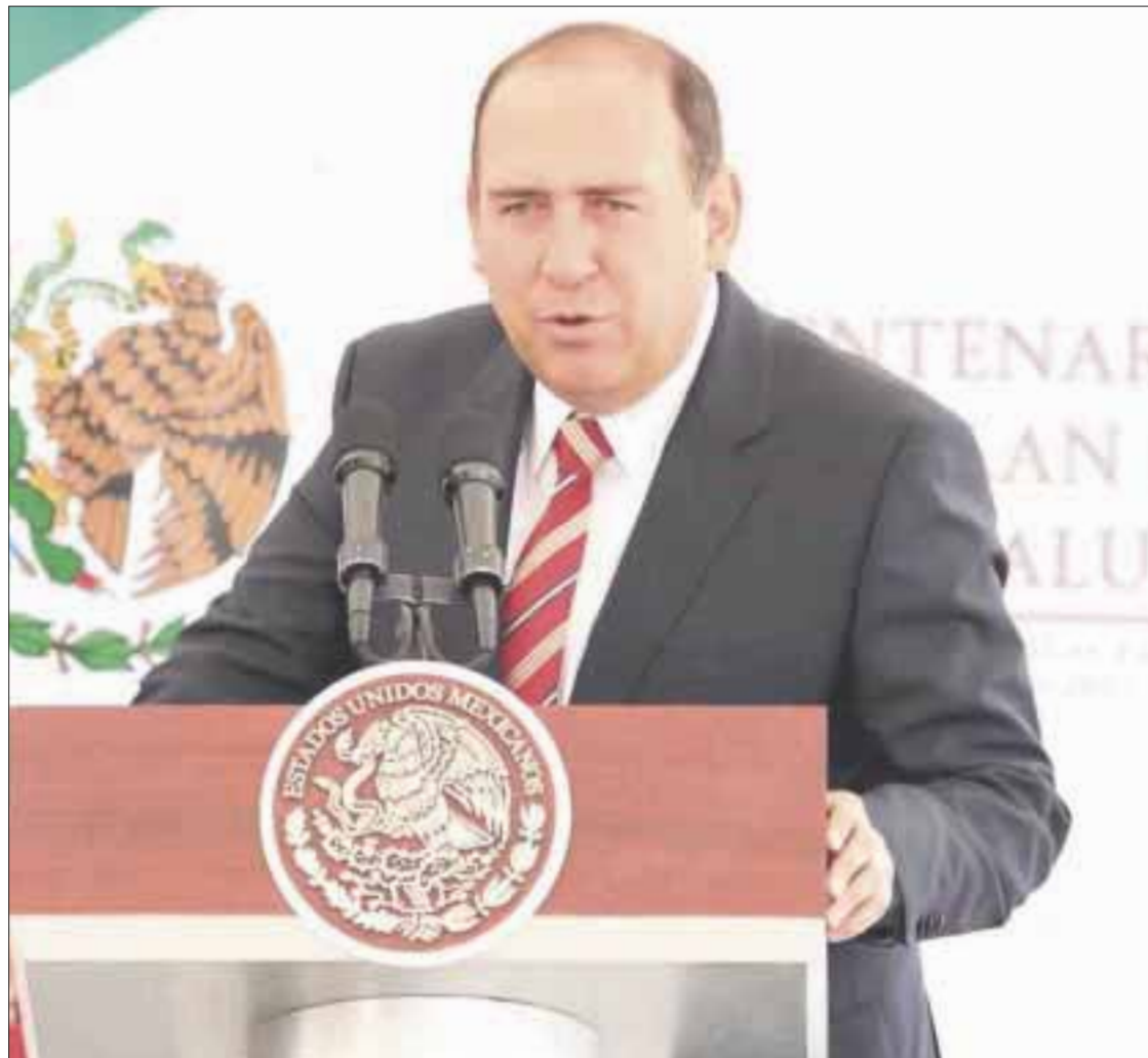
Rubén Moreira Valdez , gobernador de Coahuila, es señalado por diversas faltas, aunque no se presenta todavía denuncia alguna.

Y es que el gobierno federal y el Congreso de la Unión no han respondido en los momentos adecua-