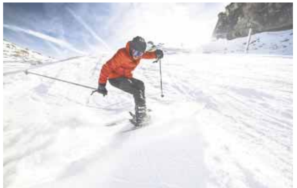
El nuevo resort familiar.

El inigualable Todo Incluido contempla una alta experiencia gastronómica; los restaurantes principales son La Rivière , La Prairie , Les Randonneurs y Les Sommets . Cada uno le brinda al comensal una atmósfera distinta y le augura un paladar satisfecho con un menú diseñado por el