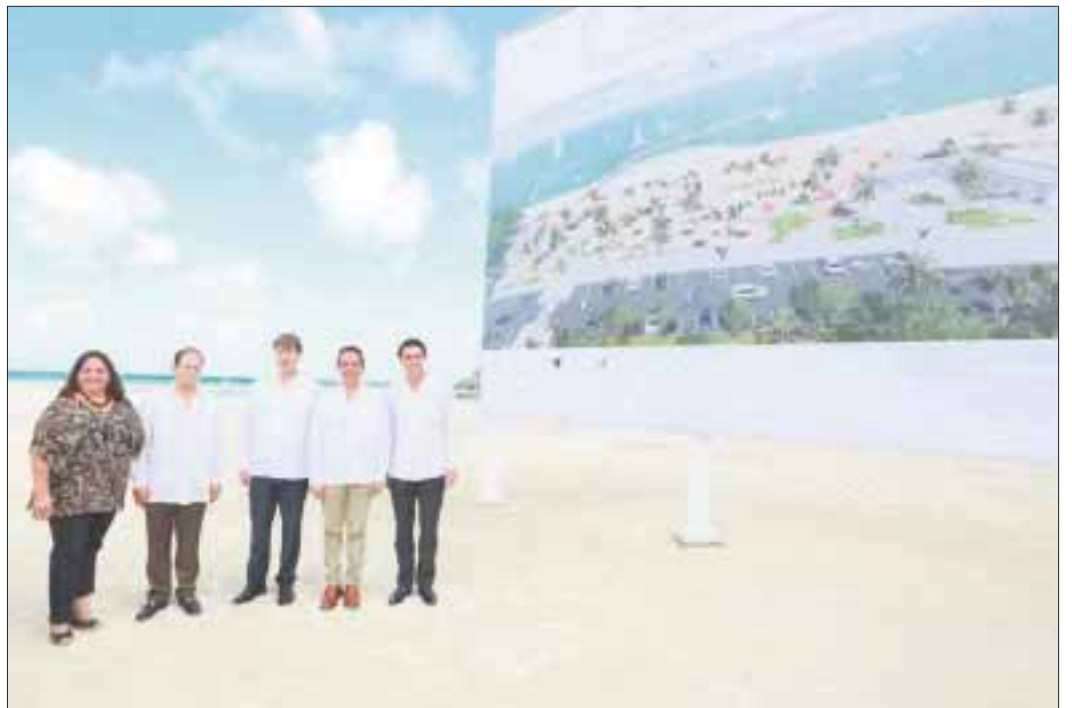
La administración estatal implementó nuevas medidas para la conservación de los arenales del estado.

Las playas certificadas por Blue Flag son: Ballenas, Centro, Chac Mool, Coral, Delfines, El Niño, Las Perlas y Marlin, en el municipio de Benito Juárez; en Bacalar, el balneario ejidal. Todas reúnen los 33 protocolos de conservación y aprovechamiento sustentable que establece la Foundation Environment Education, encargada de otorgar las menciones.