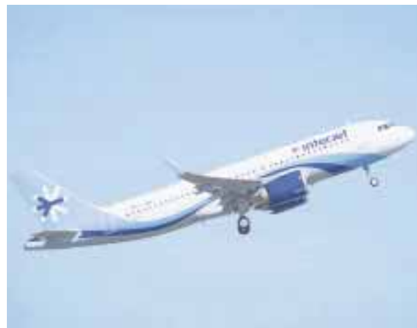
El nuevo A320neo.