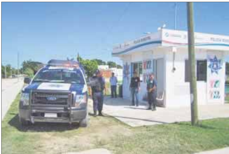
Se reincorporaron al trabajo operativo 54 agentes de la Policía Ministerial, informó la Fiscalía General del Estado.

Chetumal.- La Fiscalía General del Estado de Quintana Roo informa que por instrucción del titular de la institución, Miguel Ángel Pech Cen, se reincorporaron al trabajo operativo 54 agentes de la Policía Ministerial que se encontraban comisionados como escoltas de ex funcionarios y directivos de medios de comunicación.