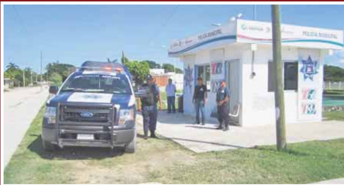
La mujer acusada de secuestrar menores fue consignada por falta administrativa, que se solventa con el pago de una multa.

Chetumal.- Una mujer, supuestamente dedicada a secuestrar menores, fue denunciada en Calderitas, a petición de unos vecinos, pero al no haber flagrancia, sólo se le consignó por falta administrativa y en lapso de 36 horas o pagar la multa correspondiente obtendrá su libertad.