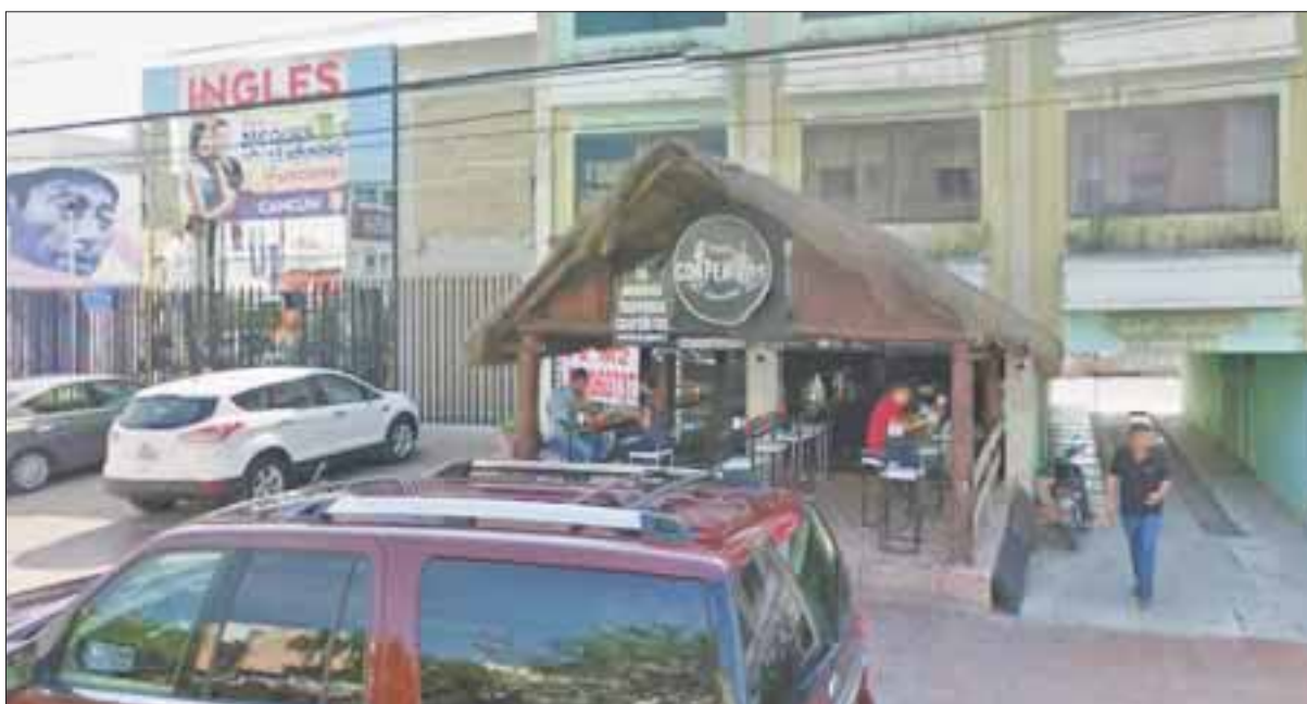
Abfieron fuego contra del personal de seguridad del establecimiento con razón social “Tacos Los Coapeñitos”, en este destino turístico.

Cancún.- Personas a bordo de lujosos autos agredieron con armas de fuego a personal de seguridad de una taquería, ubicada en la avenida Náder. Cerca de las 23:00 horas del lunes elementos armados a bordo de dos autos accionaron sus armas en contra del personal de seguridad del establecimiento con razón social “Tacos Los Coapeñitos”.