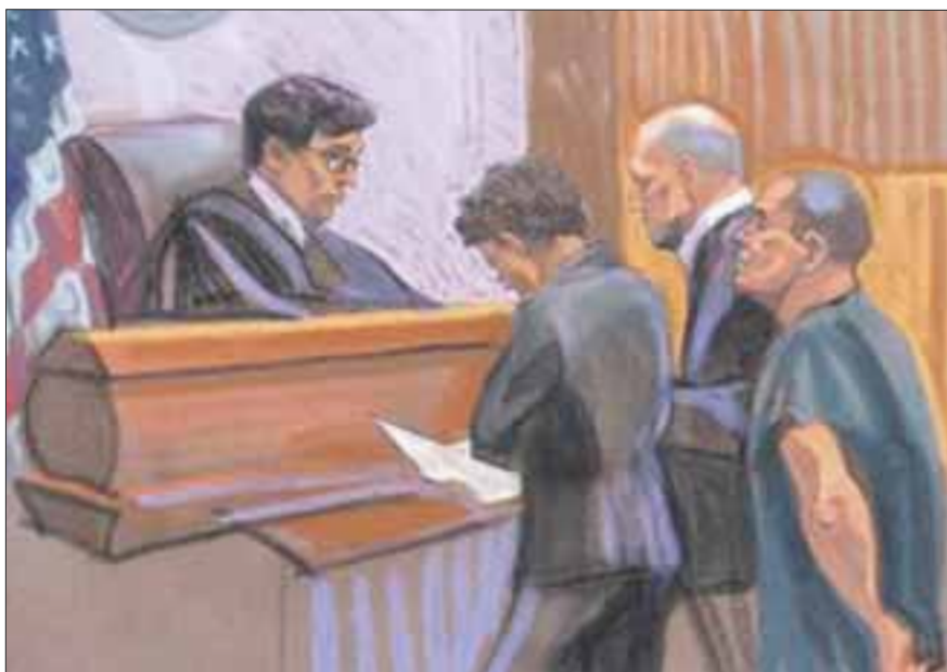
Los abogados de Joaquín El Chapo Guzmán aseguran que la salud del capo se ha visto afectada por las “inhumanas” condiciones de aislamiento.

Sus abogados se quejan de las condiciones “inhumanas”