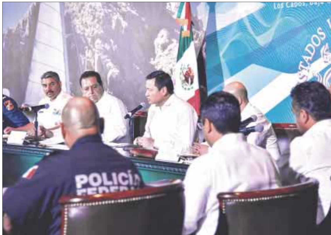
Miguel Ángel Osorio Chong pidió a las autoridades estatales y municipales asumir una labor de corresponsabilidad contra la delincuencia.