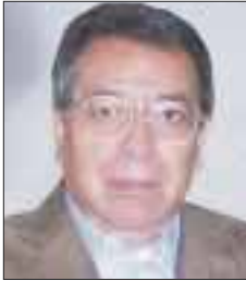
Por Roberto Vizcaino