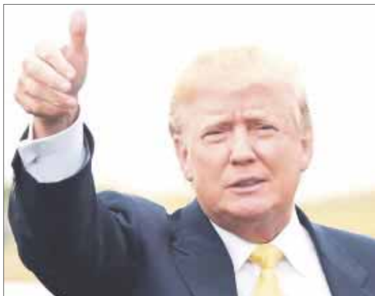
El presidente de Estados Unidos, Donald Trump, reiteró que sólo se darán visas a quienes estén más calificados.

El presidente Donald Trump prometió que buscará hacerle “grandes cambios” al Tratado de Libre Comercio de América del Norte (TLCAN) y reiteró que, de lo contrario, abandonará el acuerdo comercial iniciado con Canadá y México en 1994. “Vamos a hacerle grandes cambios o nos vamos a deshacer del TLCAN de una vez por todas. No se puede continuar así”, señaló el mandatario en el marco de una visita de trabajo a Milwaukee, Wisconsin.