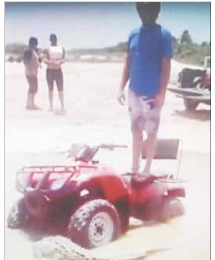
Los turistas grabaron el momento en que arrollan al cocodrilo que descansaba en una pequeña laguneta.