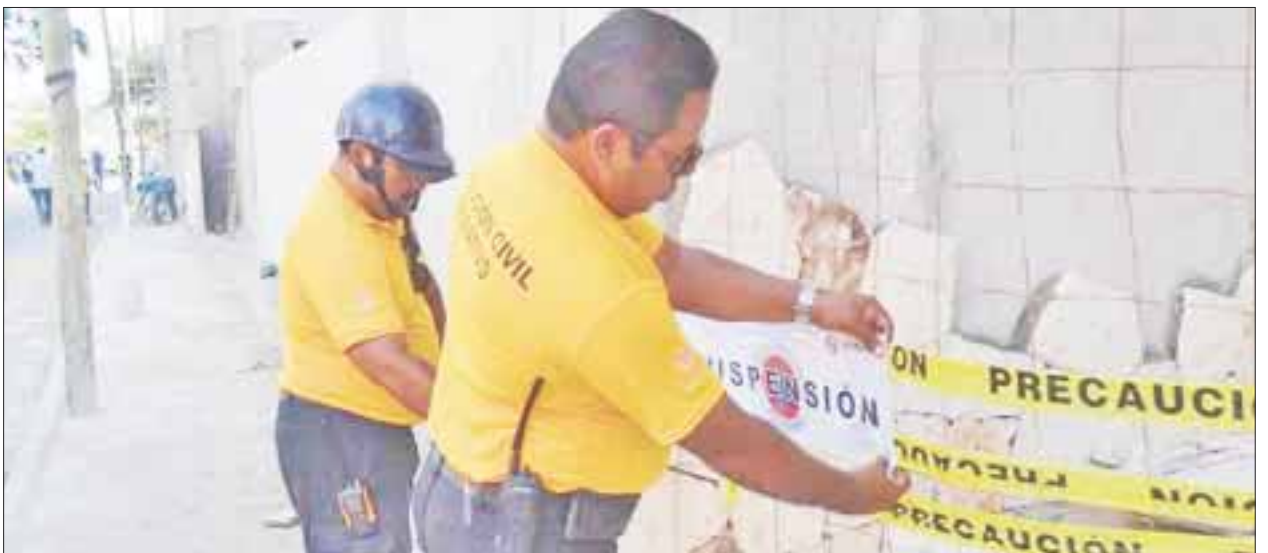
Los inspectores de Protección Civil visitan centros de trabajo, lo cual, a varios, les permite extorsionar.

Por esa razón, exhortó a los presuntos afectados a proceder y de este modo deslindar responsabilidades y añadió que el fin no es hacer de Protección Civil un instrumento recaudatorio, sino crear cultura preventiva de riesgos.