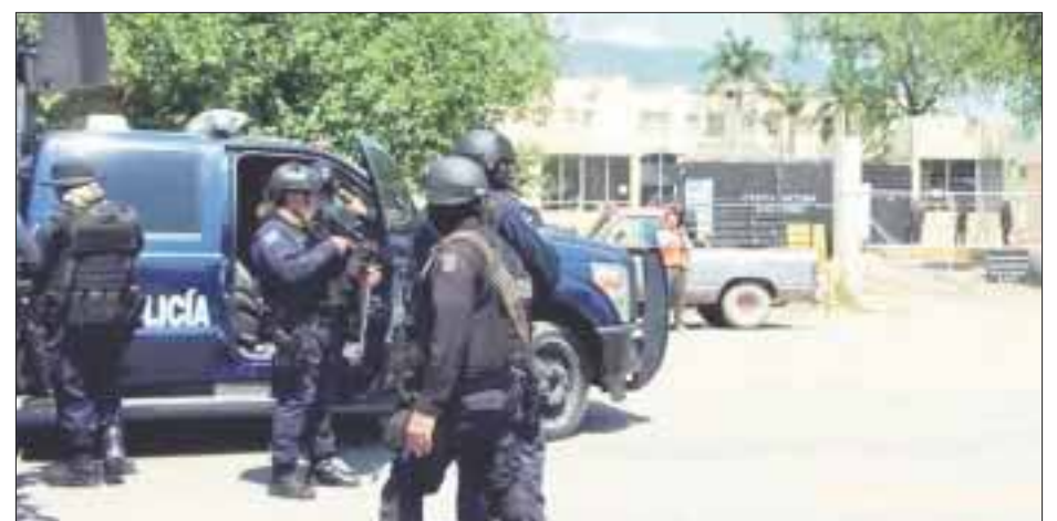
Una riña entre grupos de reclusos en el Centro de Ejecución de Sanciones (Cedes) de Ciudad Victoria dejó un muertos y 4 heridos.