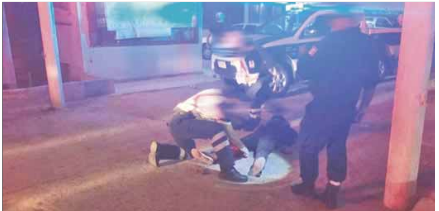
Un joven que se negó a cooperar para las “chelas” fue picado con arma blanca en la región 92 por uno de los bebedores en la vía pública.

Lo anterior fue dado a conocer por parte de uno de los vecinos que observaron los hechos, y que además solicitó los servicios de emergencia para la atención del lesionado, ya que sangraba profusamente, quien además lo ayudó a desplazarse a las inmediaciones de Comercial Mexicana, para su pronta localización por parte de los paramédicos, quienes al llegar le proporcionaron los primeros auxilios, trasladándolo al Hospital General, donde indicaron que sus heridas no ponen en riesgo su vida.