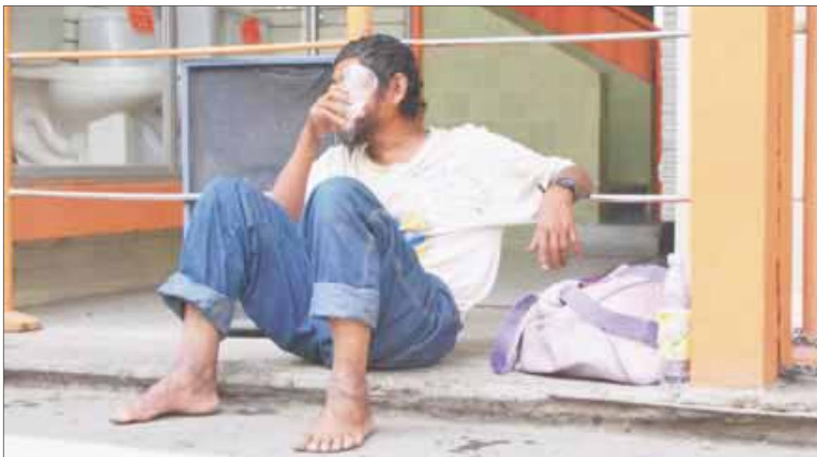
Las adicciones se incrustan entre las nuevas generaciones, la marihuana y el crack, mantienen la entidad en el 1° y 2° lugar de estados con mayor consumo de drogas.

Cancún.- Las adicciones en Quintana Roo se disparan y se incrustan entre las nuevas generaciones al ser las preferidas de niños de 10, 12 años; la marihuana y crack, mantienen cada año a la entidad en la disputa constante por el 1° y 2° lugar entre los estados con mayor consumo de cannabis y alcohol.