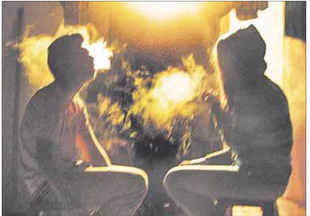
Enclavados en la región 96, “en el Cancún pobre que nadie quiere”, donde la pobreza, la violencia, el abandono y las adicciones son parte de su vida cotidiana.