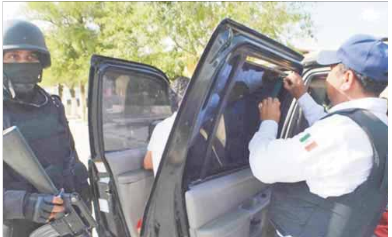
El senador Félix González Canto se quedó sin seguridad personal a cargo del erario.

En tanto, se acordó iniciar el retiro de 10 elementos al Borge Angulo, pues están de más, debido a que la ley sólo le permite 30 y que sin razón alguna, el ex gobernador se ha negado a incorporarlos.