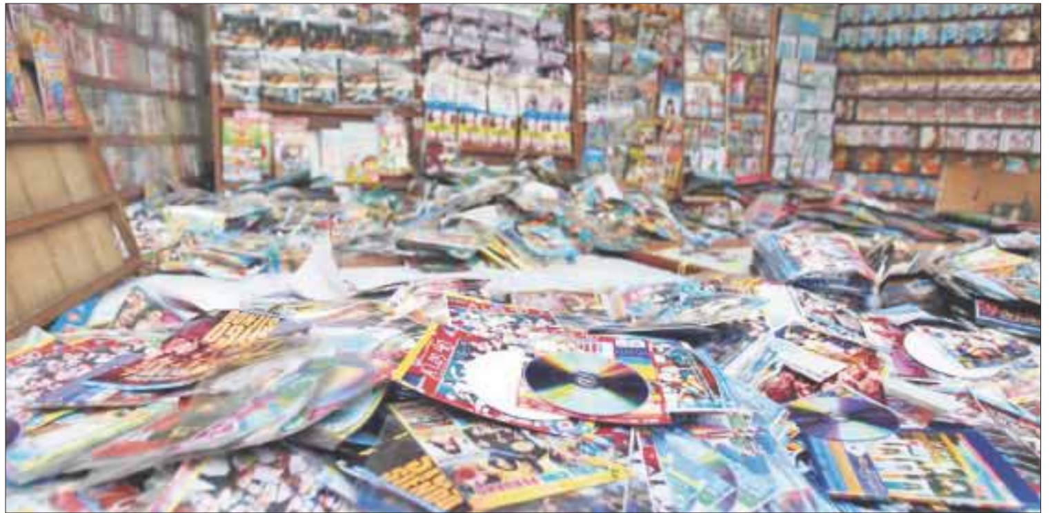
Un total de 21 mil discos pirata se decomisaron en El Crucero, sobre avenida Tulum y la Portillo.

Los recorridos en diferentes puntos, generó la detección y decomiso de la mercancía, que a pesar de ser decomisada en reiteradas ocasiones, se vuelve a vender en la zona más concurrida en la ciudad.