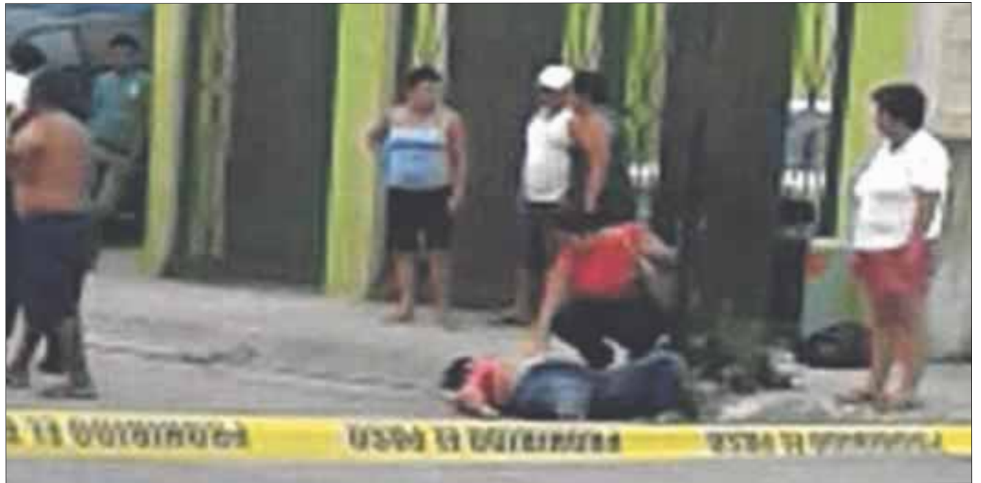
Pese a sus graves heridas, la mujer resistió y fue trasladada por la Cruz Roja al Hospital General.

Al cierre de la edición no se conocían aún los datos de la detención de los agresores.