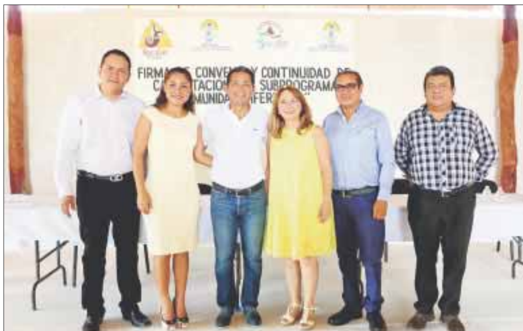
Municipio y gobierno del estado trabajan en alianza para mejorar la situación alimentaria de comunidades lejanas.

Bacalar.- El Sistema DIF Quintana Roo, que encabeza Gaby Rejón, hace alianzas para sumar esfuerzos y juntos disminuir la desigualdad de las zonas rurales de la entidad con la firma de un convenio de colaboración con el Ayuntamiento de Bacalar, a fin de emprender acciones en materia de asistencia y participación social para que haya más y mejores oportunidades de desarrollo.