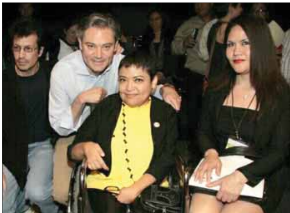
Aurelio Nuño Mayer encabezó la ceremonia de egreso de la primera generación de alumnos “Prepa en Línea” de la SEP.

El secretario de Educación Pública, Aurelio Nuño Mayer dio a conocer que cinco mil 065 estudiantes de diferentes estados del país concluyeron sus estudios de Prepa en Línea SEP, de los cuales 91 por ciento han manifestado su interés de ingresar a instituciones de nivel superior. Al encabezar la ceremonia de egreso de la primera generación, el titular de la Secretaría de Educación Pública (SEP) informó que para 2018 se tiene como meta tener en esta opción de estudio a 150 mil estudiantes de manera gratuita.