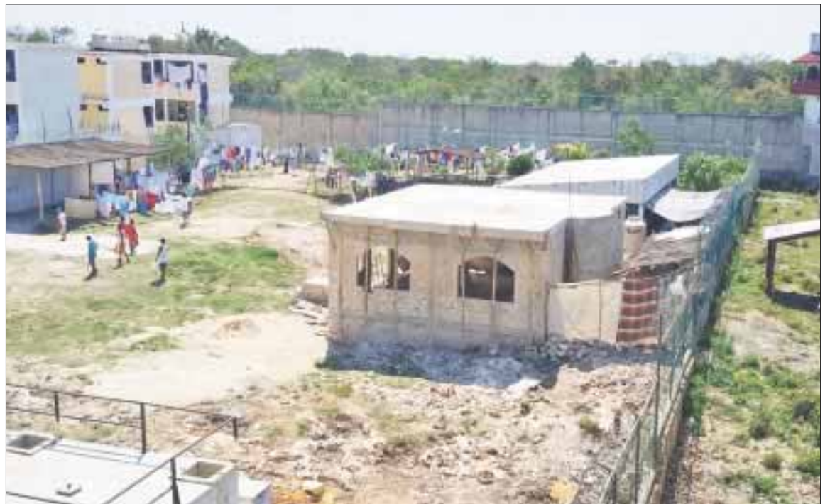
Las columnas de humo por el incendio provocado por los internos de la cárcel de Playa del Carmen se apreciaron a varias cuadras de distancia.

Refiere que se ha solicitado el apoyo de unidades médicas y de las Policías Ministerial quien ya se encuentra en el lugar. También se han llevado a cabo todos los protocolos por fase. Se dijo que "se está atendiendo de manera coordinada y con firmeza este hecho para mantener el orden al interior del Centro de Retención".