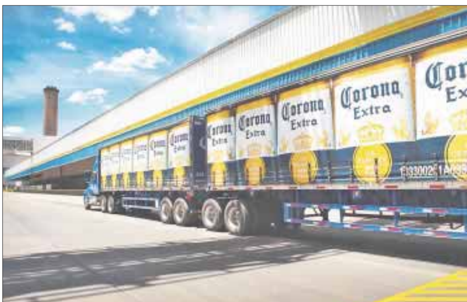
La marca más valiosa de México, cerveza Corona, alcanza un valor de 84 mil 123 millones de pesos.

La cerveza Corona se posicionó de nuevo como la marca más valiosa de México, al alcanzar un valor de 84 mil 123 millones de pesos, de acuerdo con Interbrand.