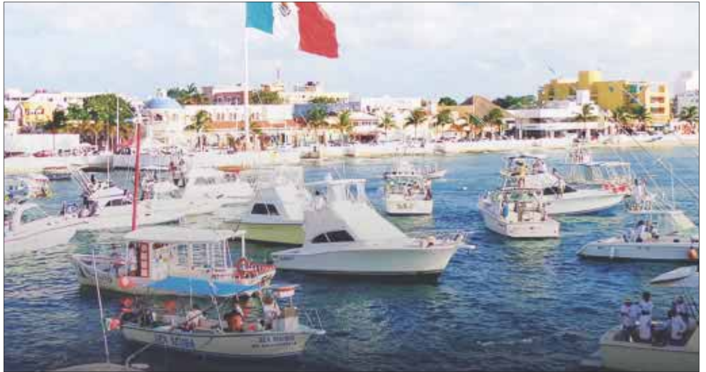
Los capitanes y marineros cobran 5 dólares por un brazaletes de ingreso al parque marino que no se le entrega al turista.

Estos abusos dañan la imagen turística de la isla y no permiten tener una cifra exacta de visitas que diariamente se tienen en la zona natural protegida, porque dejan de comprar físicamente los brazaletes que cuestan 38 pesos en el local de la Conanp.