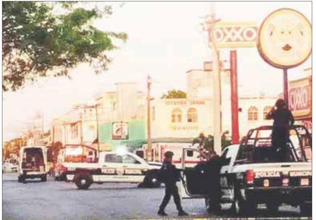
Las autoridades localizaron cerca del lugar de los hechos, el vehículo en el que viajaban los agresores, un Tsuru, placas USY496C del estado de Quintana Roo.

Cabe señalar que es la segunda agresión en lo que va del año en contra de policías adscritos a Puerto Morelos. Este tipo de ataques muchas de las veces se traducen en ajuste de cuentas por parte del crimen organizado en contra de servidores públicos inmiscuidos en hechos delictivos.