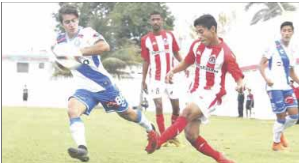
Pioneros Jr. buscarán mantenerse en la segunda posición en su último juego de la temporada regular cuando enfrenten a Corsarios de Campeche.

Cancún.- Con el cierre de la jornada 25 en lo que respecta al grupo 1 de la Tercera División Profesional del Fútbol, ya se encuentran varios clasificados a la liguilla y otros que aún tienen posibilidades, ya que se encuentra muy disputado desde el primero hasta el décimo puesto y se pueden mover varios equipos, ya sea a lo alto o para bajar más en la tabla de posiciones de la clasificación general.