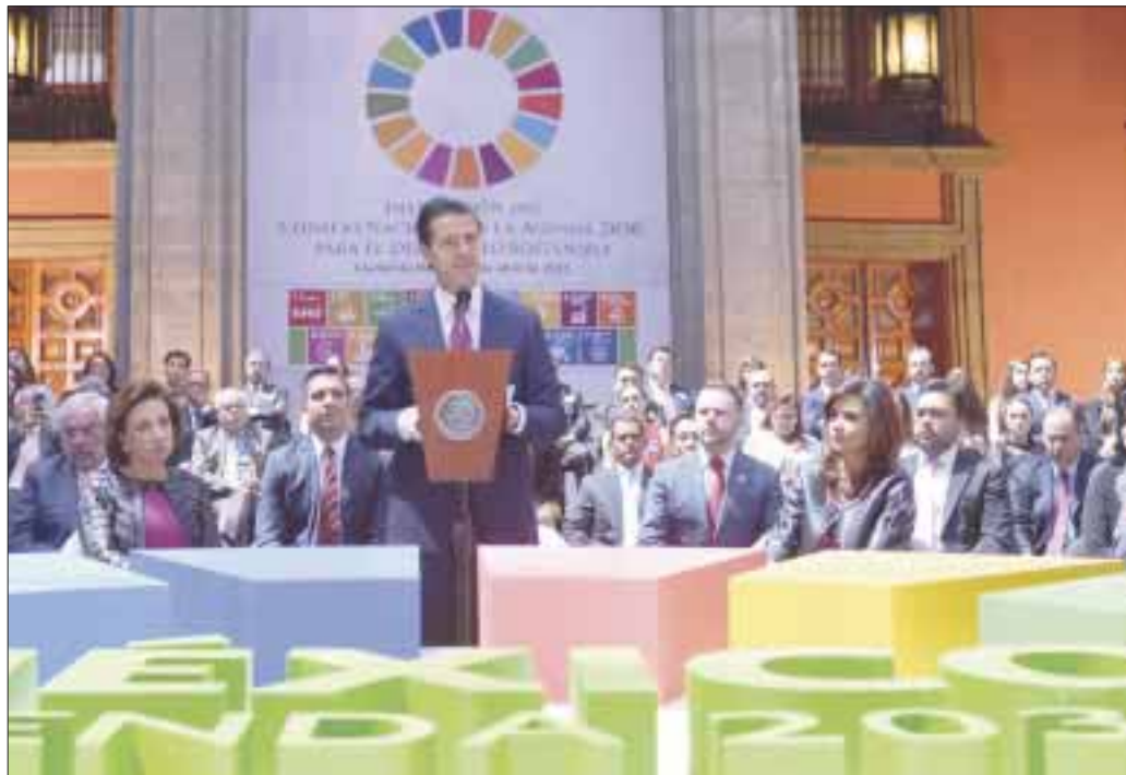
El presidente Enrique Peña Nieto instaló el Consejo Nacional de la Agenda 2030 para el Desarrollo Sostenible.

Acompañado de su gabinete legal y ampliado, gobernadores, empresarios e integrantes de la sociedad civil, sostuvo que México “debe mantenerse en el rumbo y la dirección como hasta ahora ha ocurrido