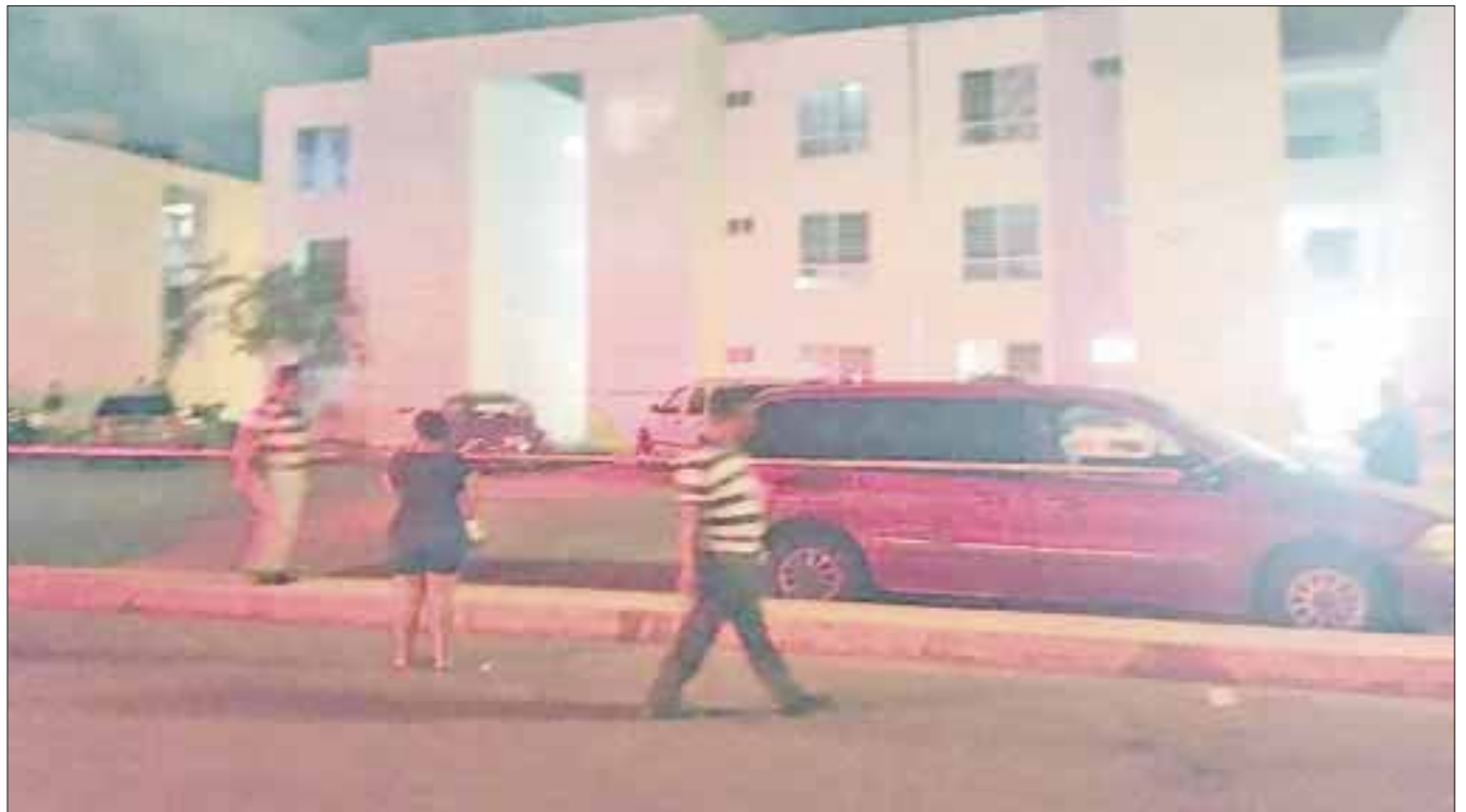
Dantesca escena encontró la cuñada de la suicida en el Fraccionamiento Prado Norte de Cancún.

Los cuerpos de los pequeños fueron encontrados sobre un colchón inflable, aún con las bolsas con las que su madre los asfixió. Presentaban putrefacción, por lo que se presume que los asesinatos y el suicidio sucedieron al poco tiempo de que el padre de familia se fue de viaje.