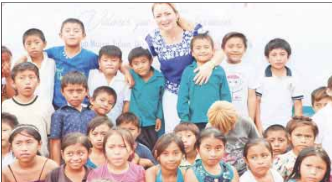
El fin de semana iniciarán en grande los festejos por el Día del Niño, con artistas de la talla de "La Chilindrina" y los Vázquez Sound.

Chetumal.- Como parte de las acciones que impulsa el gobernador Carlos Joaquín, y su esposa, Gaby Rejón, en favor de la niñez, a través del Sistema DIF Quintana Roo se llevarán a cabo celebraciones en varias partes del estado del 27 al 30 de abril con motivo del Día del Niño, para agasajar a los reyes del hogar y que tengan más y mejores oportunidades de recreación y esparcimiento que fomenten la unión familiar.