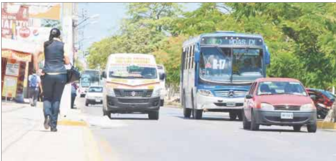
Sancionan a 45 unidades a través de operativos de las autoridades ante denuncias de los usuarios por sobrecupo.

Cancún.- Sancionan a 45 unidades de Autocar, Turicun, Maya Caribe y Transporte Terrestre Estatal a través de operativos aleatorios de las autoridades, ante denuncias de los usuarios por sobrecupo y ponerlos en riesgo con “carretitas para disputar usuarios”, además de hacer acenso y descenso en puntos no autorizados.