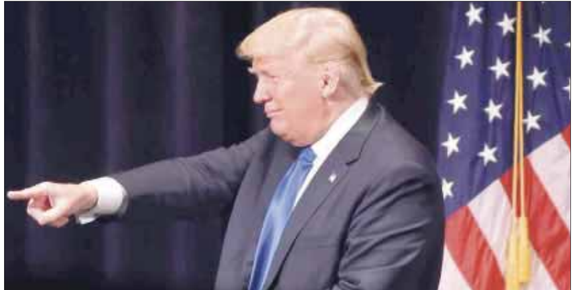
Donald Trump estudia el borrador de una orden ejecutiva para retirar a Estados Unidos del TLCAN, de acuerdo con los medios estadounidenses.

orden ejecutiva para imponer un arancel del 20 por ciento a las exportaciones de madera de Canadá, debido a que, acusó, que ese país es injusto con los productores de lácteos estadounidenses.