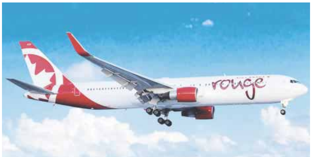
Del 1 de mayo al 27 de octubre, la ruta estacional Ciudad de México-Montreal.