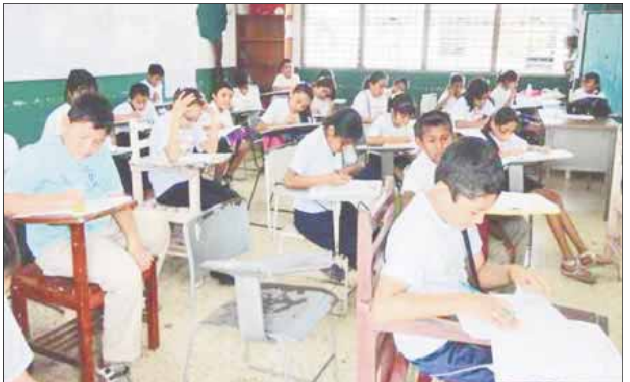
Alrededor de 435 mil alumnos de escuelas de nivel básico no tendrán actividades escolares por cuatro días.

El subsecretario de la SEyC, señaló que adicionalmente, el próximo viernes habrá otro puente escolar, porque el 5 de mayo se considera inhábil en conmemoración de la Batalla de Puebla, aunque no aclaró si se suspenderán también el miércoles Día de las Madres.