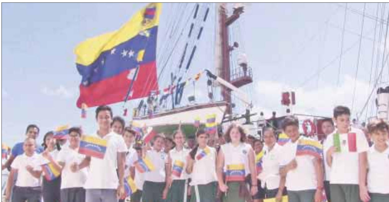
A bordo del navío hay 90 jóvenes cadetes y 36 tripulantes, siendo la segunda vez que visita Cozumel, la primera fue en 2014.

Cozumel.- Ciento diez estudiantes de primaria y secundaria subieron a conocer el buque escuela 11 “Simón Bolívar”, que llegó a la isla y atracó en el muelle Punta Langosta.