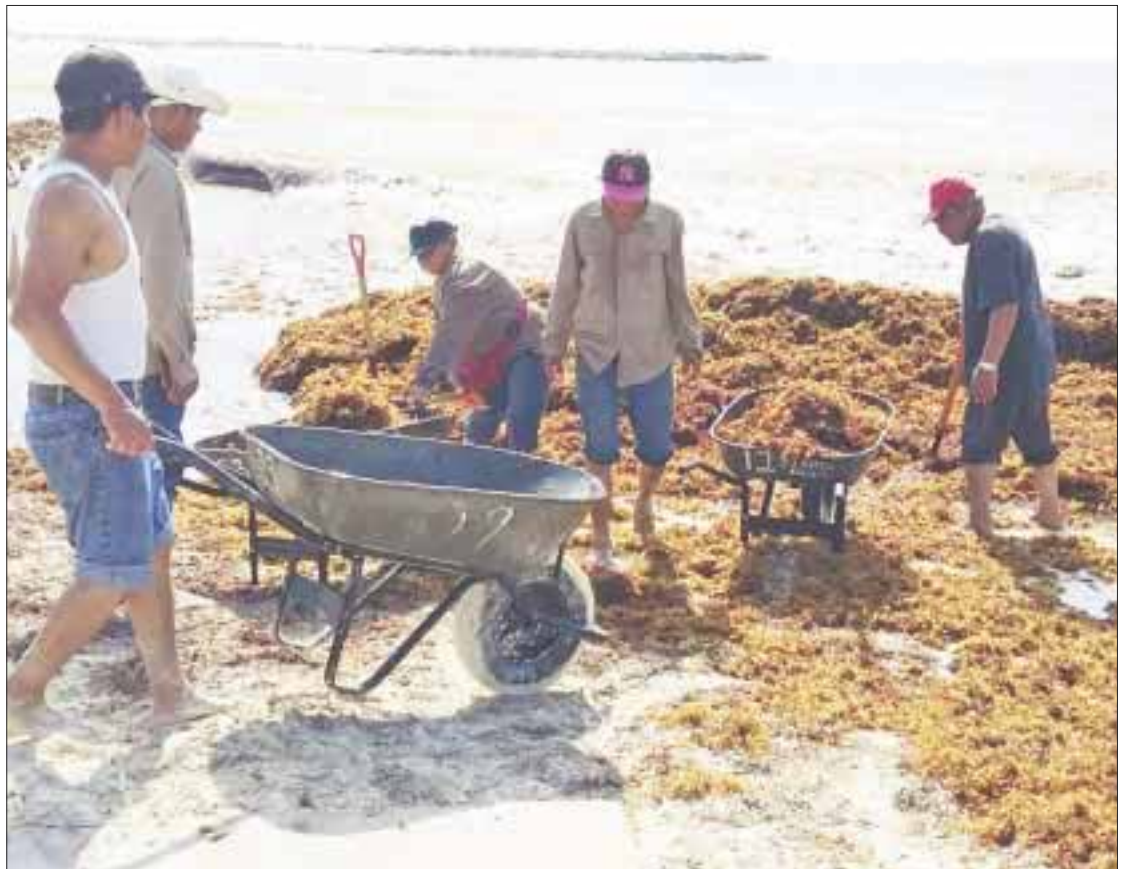
Limpiaron por lo menos tres puntos de la zona turística de Cancún donde se acumula el sargazo.

Asimismo, indicó que de acuerdo con los reportes, de forma diaria se están retirando un promedio de 50 metros cúbicos de sargazo, para lo cual dijo se utiliza maquinaria y mano de obra a través de brigadas de limpieza conformada por 25 elementos adscritos a esta dependencia avocados especialmente a estas acciones.