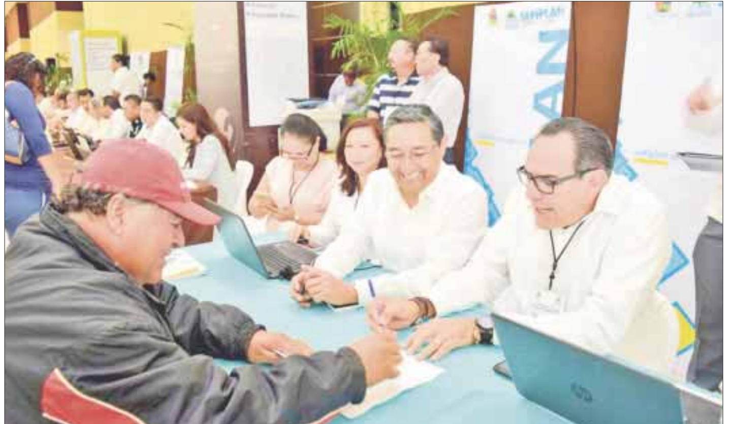
Esta administración estatal fomenta la denuncia ciudadana con el fin de erradicar la corrupción.

La transparencia y rendición de cuentas son prácticas que surgen como el antídoto a la corrupción, que evalúa la honestidad de nuestros gobernantes e instituciones públicas, es por ello que se han impulsado acciones en esta actual administración para un buen uso y funcionamiento de los recursos materiales y financieros.