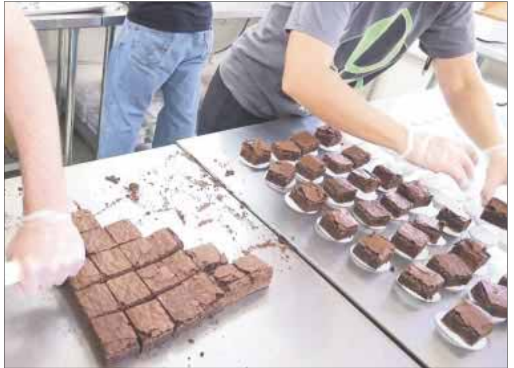
Para enganchar a los jóvenes, narcomenudistas venden “brownies”, “grapas”, “hot cakes”, “muffins” o cigarrillos con marihuana o cocaína.

Lo más importante es la comunicación, los padres deben estar alerta del comportamiento de sus hijos”, e identificar a tiempo comportamientos hostiles, bajo rendimiento académico, somnolencia, o signos físicos como ojos rojos y resequedad en la boca, para tomar medidas a tiempo.