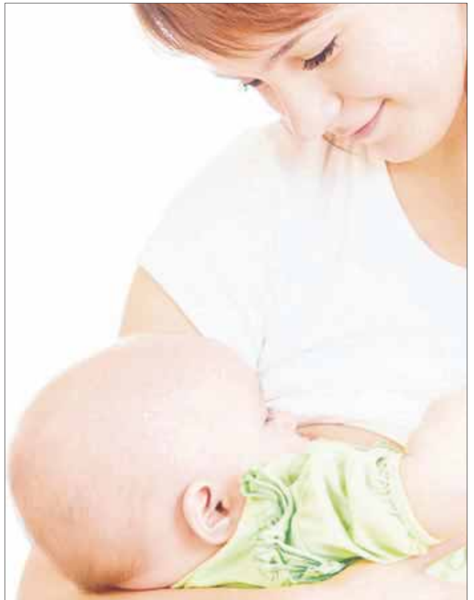
La leche materna en los primeros seis meses de vida beneficia, tanto a la madre como al bebé, al ser capaz de incrementar las defensas y reducir riesgos.

trición y la aparición en la edad adulta de problemas de enfermedades crónicas no transmisibles como el sobrepeso, la obesidad, la diabetes y enfermedades cardiovasculares.