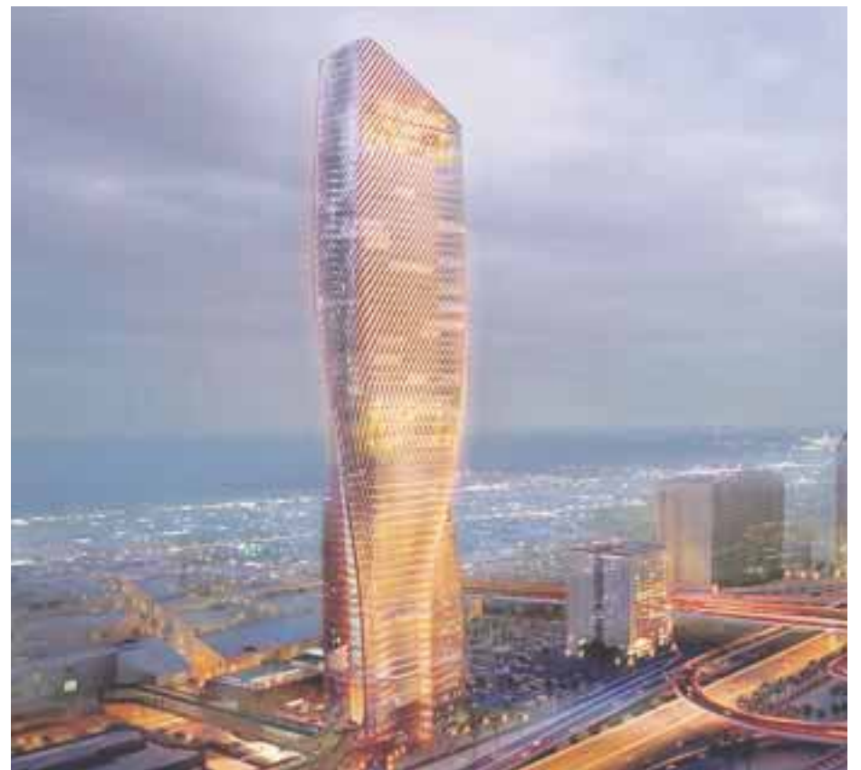
La Torre Wasl.

Ambos hoteles están a poca distancia de los dos aeropuertos de la ciudad, siendo 20 minutos del Aeropuerto Internacional de