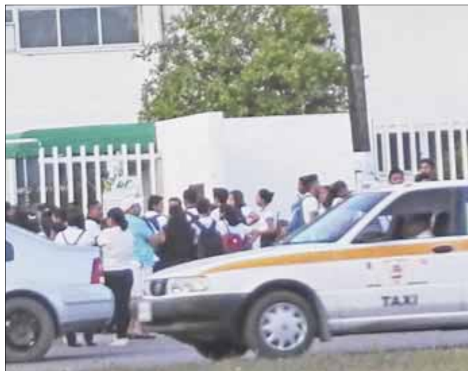
Los bachilleratos y universidades debieron iniciar cursos del presente año lectivo y los suspendieron hoy se conocerá la fecha del arranque.