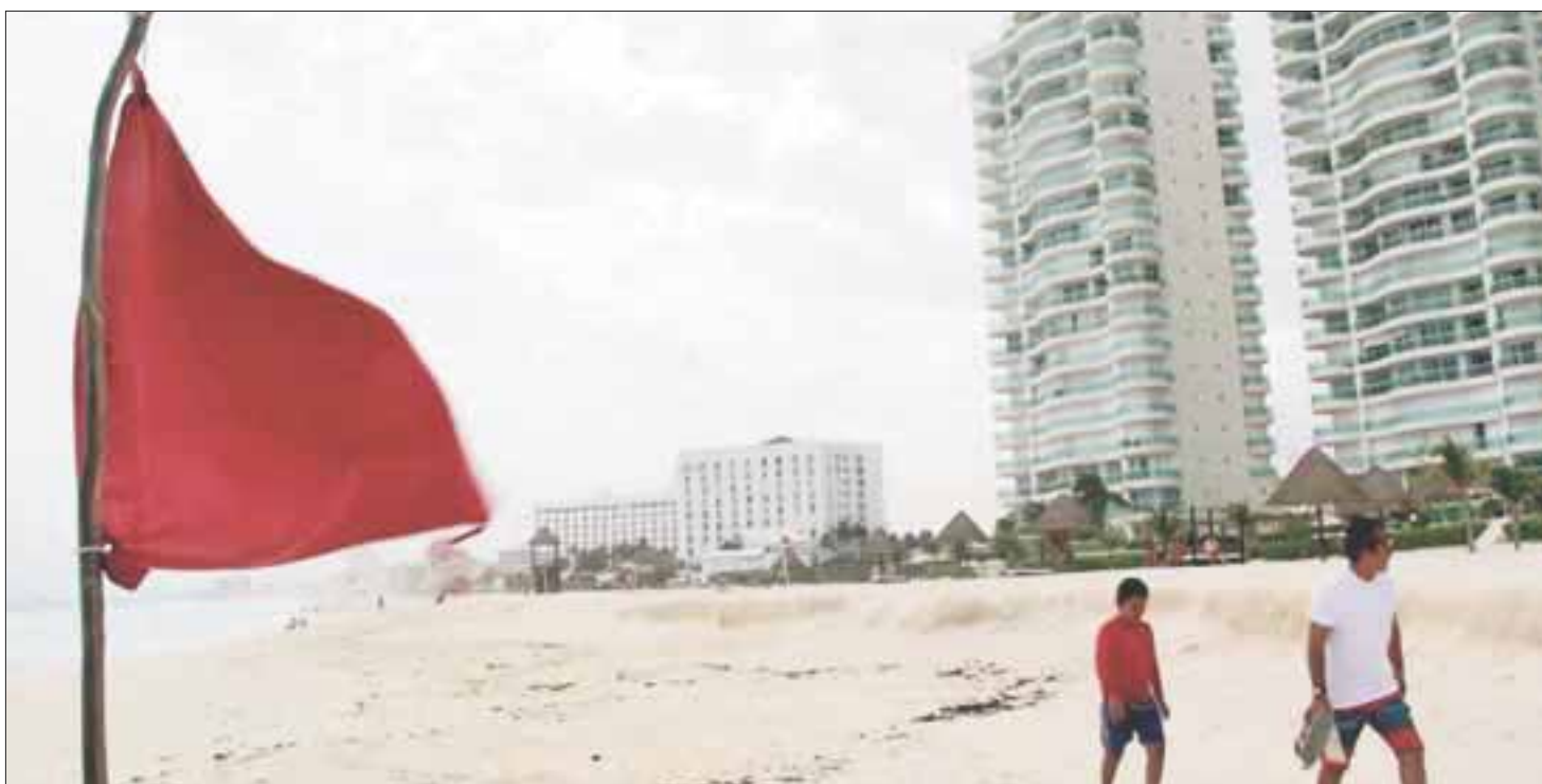
Colocaron bandera roja en las playas de Cancún por "Franklin"; pese a prohibición de meterse al mar, la gente no hace caso.

Cancún. – El paso de la Tormenta "Franklin" por la Península de Yucatán y el estado de Quintana Roo provocó el cierre de puertos de Isla Mujeres, Puerto Juárez, Cozumel y Costa Maya debido a que las ráfagas de vientos máximos cerca del centro de 95 kph y rachas de 111 kph.