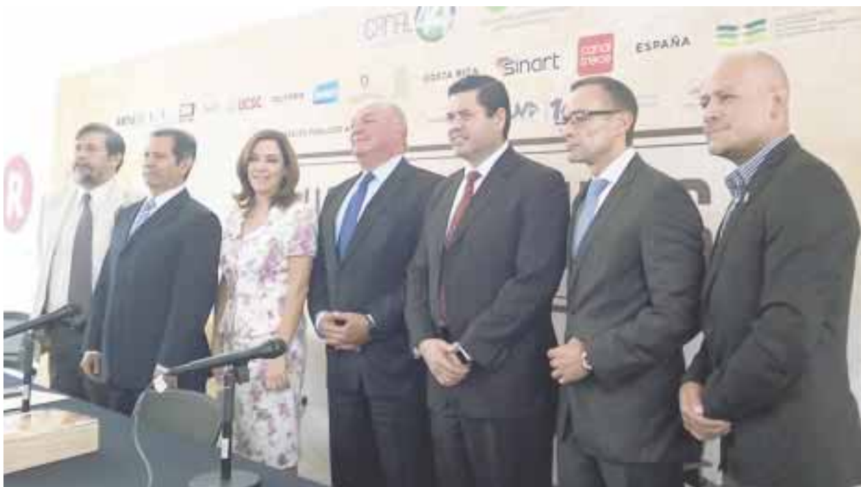
Durante la presentación de la nueva serie “ Vidas y Bebidas ”.

Con ello, indicó, se promueve también la cultura de los pueblos, el turismo, empleo y gastronomía. Aclaró, sin embargo,