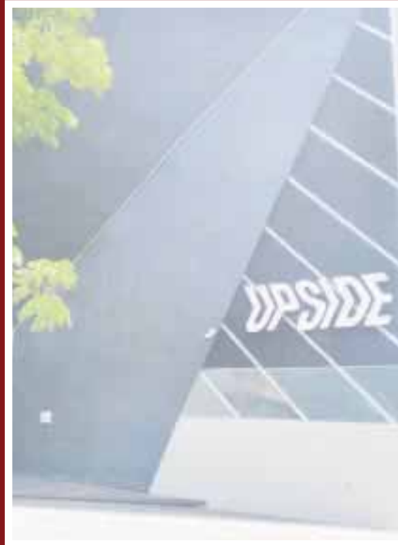
Inspectores sorprendieron a menores de edad consumiendo drogas y alcohol en la discoteca "Up Side".

Cozumel.- Se tiene conocimiento que encontraron a menores de edad consumiendo drogas y alcohol en la discoteca "Up Side" y eso fue el motivo por el cual los fiscales de la tesorería clausuraron el antro, ubicado en la 11 Avenida, colonia Centro.