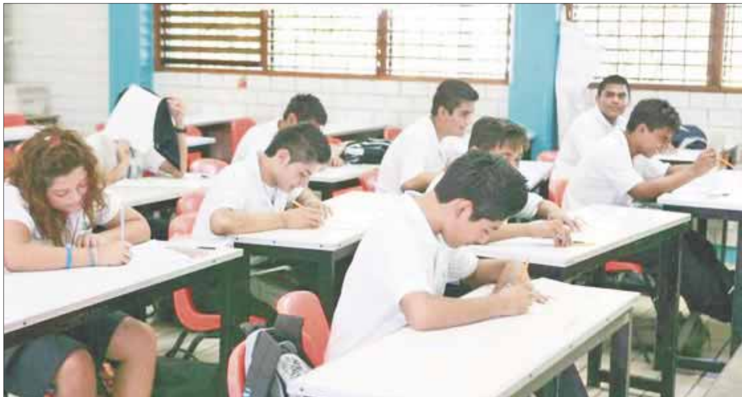
Ante el impacto de la tormenta tropical "Franklin", se decidió suspender clases en las escuelas de nivel medio superior y superior.

Mientras, que el sector de educación básica, iniciará su nuevo ciclo escolar 2017-2018 el próximo 21 de agosto, de manera que