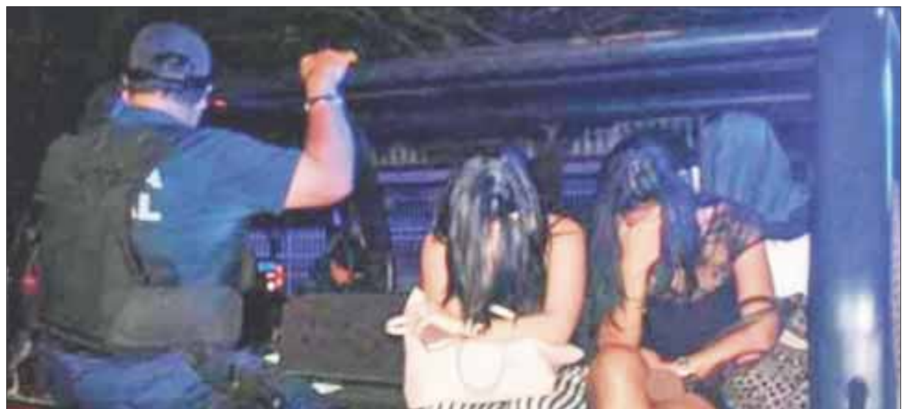
Las acciones coordinadas de fuerzas federales, estatales y locales dieron duro golpe, no sólo con la detención de los cabecillas de los cárteles de la droga, sino que han desactivado sus fuentes de ingresos.

Las mujeres se desempeñaban como bailarinas exóticas y permanecen en las instalaciones del Instituto Nacional de Migración para resolver su situación legal en el país, algunas con la deportación, fueron llevadas a la comandancia de la Policía Federal y después serán enviadas a Chetumal para su expulsión.