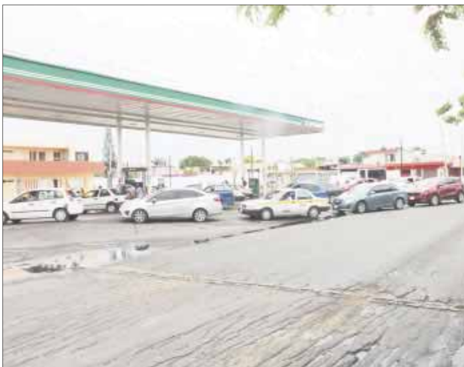
Las filas en las gasolineras se formaron desde que se anunció la peligrosidad de "Franklin" en Chetumal.

estarán disponibles para apoyar a las autoridades del gobierno estatal en caso de que sea necesario.