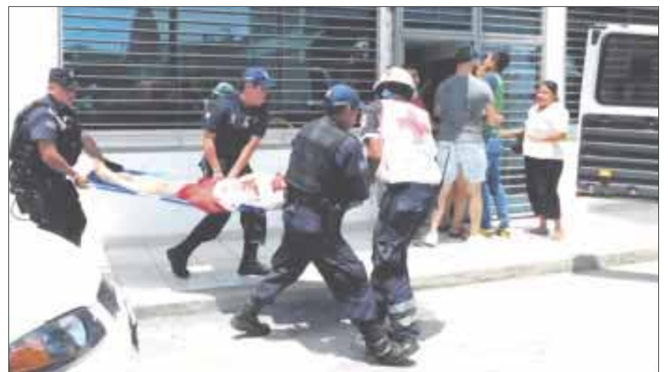
La doctora fue atacada en su consultorio, ubicado en la clínica particular "La Esperanza", en Martínez de la Torre.

consultorio ubicado en la clínica particular "La Esperanza", ubicada en la esquina de las calles Nicolás Bravo e Ignacio Zaragoza, en la colonia Patria, de Martínez de la Torre.