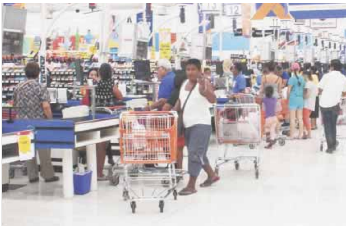
Los centros comerciales de Othón P. Blanco y las gasolineras suspendieron sus actividades a las 20:00 horas de ayer, por lo que los chetumaleños abarrotaron esos negocios durante este lunes

En coordinación con la Secretaría de la Defensa Nacional y con la Secretaría de Marina, se inició la evacuación desde Xcalak hasta Punta Herrero; se han evacuado pescadores de las cooperativas de Banco Chinchorro, Mahahual y Xcalak.