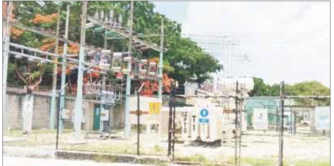
La Comisión Federal de Electricidad (CFE) alistó operativo de “Plan de Contingencia” para salvaguardar la infraestructura eléctrica en Quintana Roo, Yucatán, Campeche y Tabasco.

Luego de la alerta, las acciones de la CFE se fortalecen y se enfocan al: Monitoreo permanente de la evolución de la tormenta tropical “Franklin”, identificación de las áreas de probable impacto, Implementación de los Centros de Operación Estratégicos para toma de decisiones oportunas.