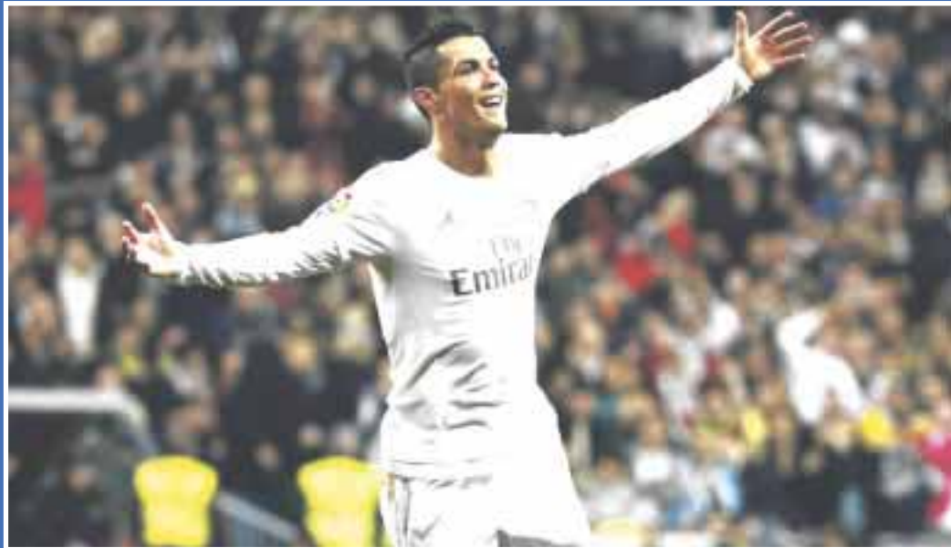
Cristiano Ronaldo dijo ante la justicia española que nunca tuvo problemas con el fisco en Inglaterra y que le "gustaría volver".

Madrid.- La estrella del Real Madrid dijo que nunca tuvo problemas con el fisco en Inglaterra, por lo que estaría de acuerdo en volver.