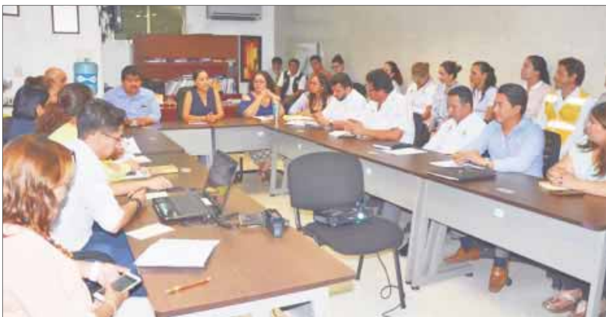
Previo a la llegada de la tormenta "Franklin" en la Sesa se tomaron las medidas pertinentes para garantizar la atención médica en el estado.

Desde ayer, 8 brigadas móviles en Chetumal, 3 brigadas en Felipe Carrillo Puerto y 3 en Bacalar, provistas con el personal, medicamentos e insumos médicos, garantizaron la atención de la población en cualquier punto de la geografía estatal así como de los refugios anticiclónicos, los cuales con anticipación fueron fumigados.