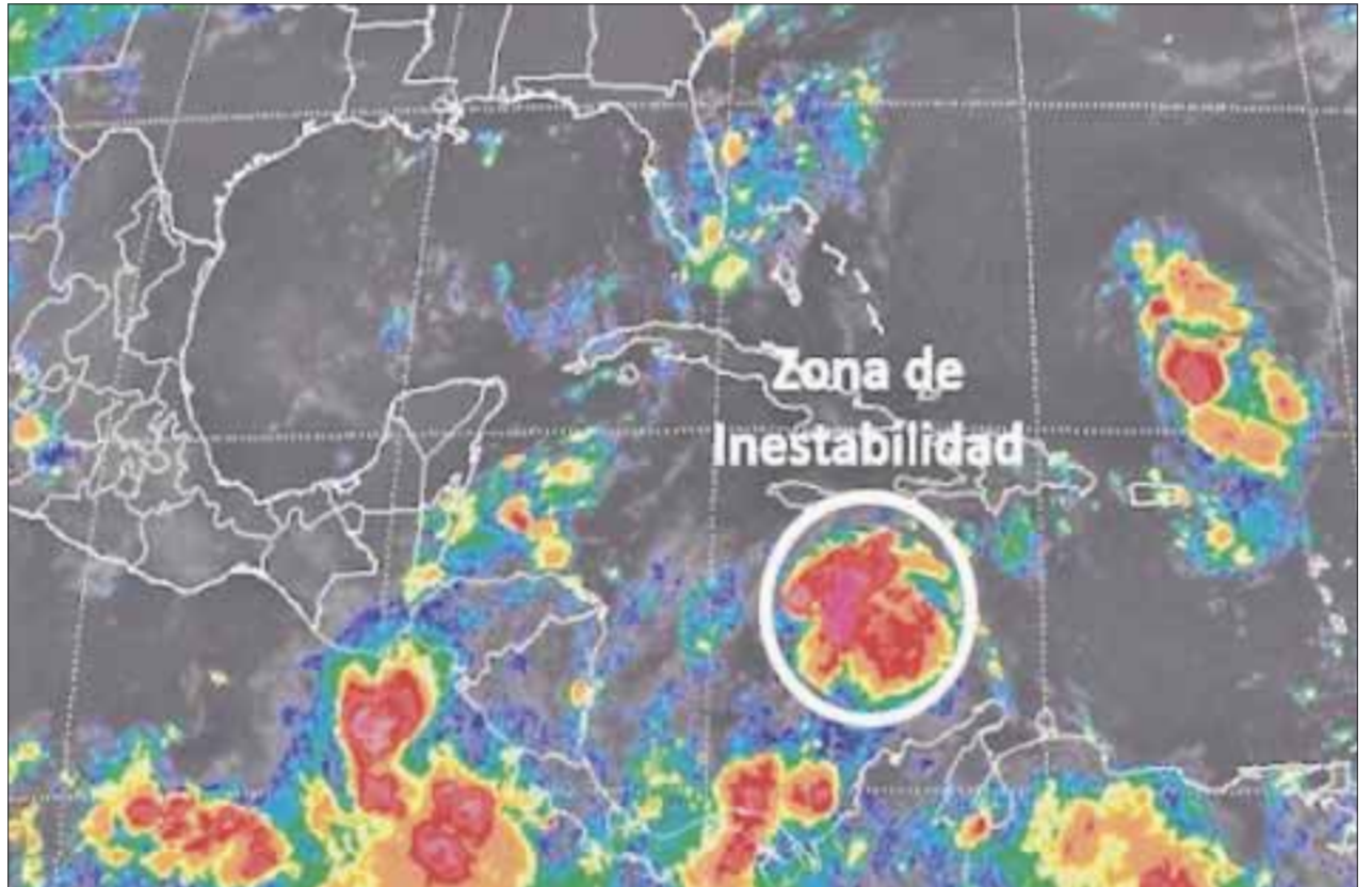
Se mantendrá el monitoreo de la onda tropical para salvaguardar la integridad de la población quintanarroense.

Asimismo, refirió que en razón de su actual distancia y por lo que la onda tropical no representa ningún riesgo para el estado de Quintana Roo, se recomienda consultar y mantenerse informado por los medios oficiales.