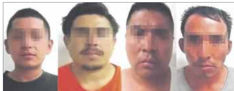
Estos sujetos mataron a un niño y violaron a dos mujeres en un asalto en la autopista México-Puebla, en mayo pasado.