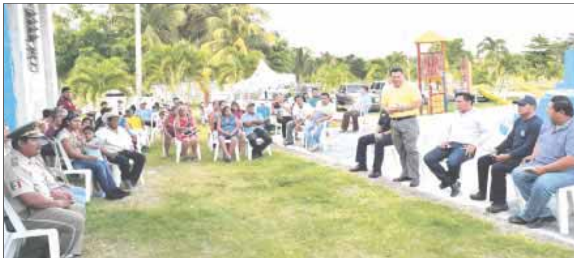
Ante las quejas constantes de la población, la comunidad Ramonal ya cuenta con su propia partida policiaca.

Chetumal.- La comunidad Ramonal ya cuenta con su propia partida policiaca. Fue concedida por las quejas constantes de la población, que amenazaba con linchamientos a los responsables de los delitos que más les perjudican, principalmente el robo.