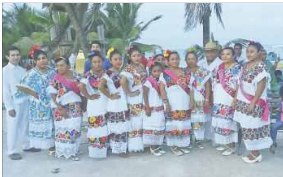
Puede decirse que en Mahahual se producen los mejores ternos del sureste.

Mahahual.- Un verdadero éxito fue el décimo festival Jats'a J'a, que comenzó el viernes y terminó ayer, en el que hubo una procesión en lanchas en las que se lanzaron gladiolas al mar; la presentación de un rito maya con los sacerdotes de Tihousco, que apoyan cada año; una exposición de 16 artesanos de Othón P. Blanco, Bacalar y Carrillo Puerto; le siguió la Vaquería, con representantes de Bacalar y la orquesta de un poblado de Carrillo Puerto y que terminó a las dos y media de la mañana.