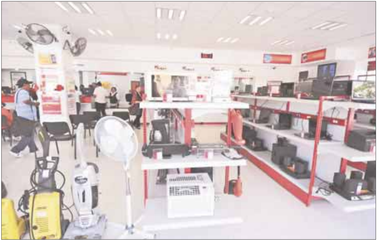
Con el regreso a clases en este periodo las casas de empeño elevaron su afluencia en 20 por ciento.

Tanto en Fundación Dondé, como en el Monte de Piedad, se estima que al menos un 85 por ciento de las personas, recuperan sus objetos empeñados, a diferencia de otros negocios en donde los intereses ahogan a los pignorantes, que optan por dejar como perdidas sus propiedades.