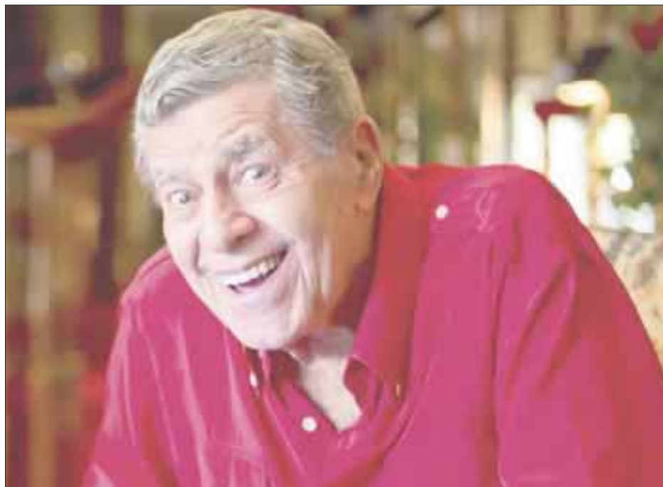
Lewis fue de los rostros más importantes de la Meca del cine, logrando firmar un contrato de 14 película por siete años por 10 millones de dólares con el estudio Paramount.

En 1982, apareció en El rey de la comedia de Martin Scorsese. Sus dos últimas películas fueron Max Rose (2013) y Policías corruptos (2016), donde tenía un pequeño cameo.