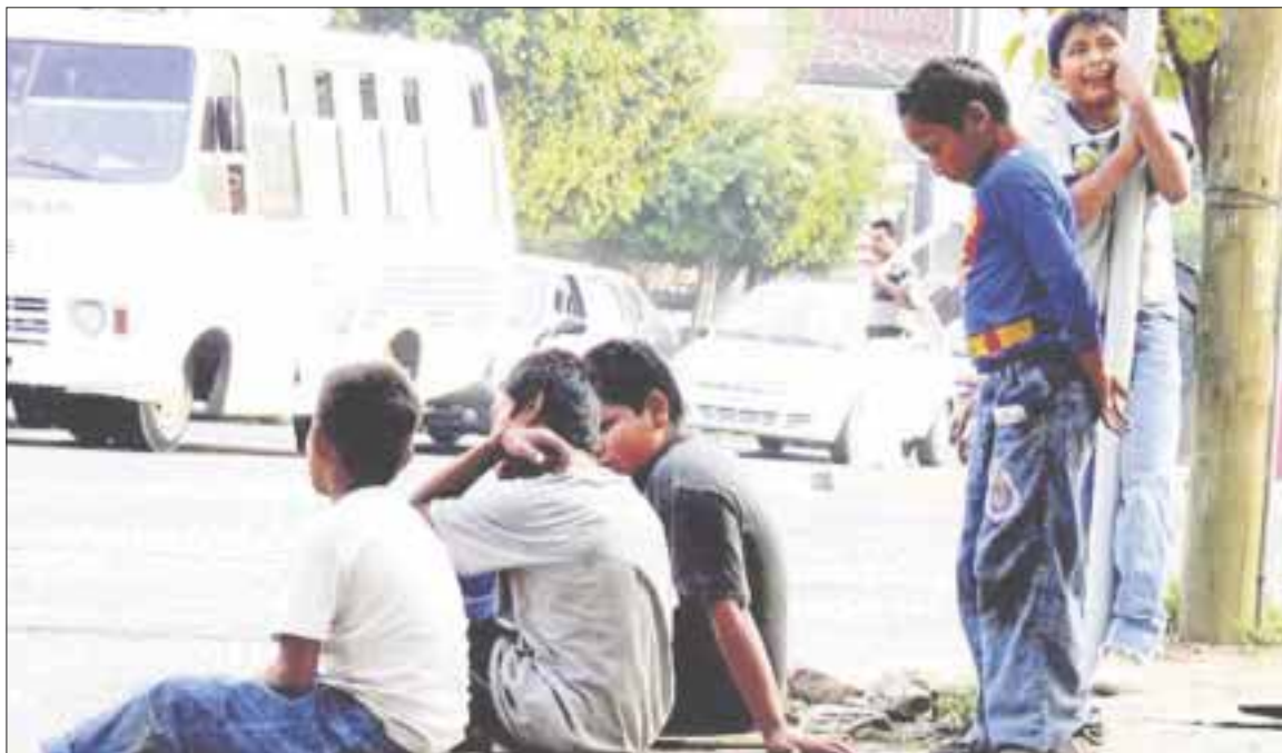
Los niños-llave incrementan su afluencia en la Casa Filtro de la ciudad, al encontrarlos deambulando en la vía pública o muchas veces en malas compañías que los utilizan para explotarlos.

Cancún.- En este destino turístico, los niños-llave incrementan su afluencia en la Casa Filtro de la ciudad, al encontrarlos deambulando en la vía pública o muchas veces con malas compañías que los utilizan para explotarlos o cometer actos delictivos.