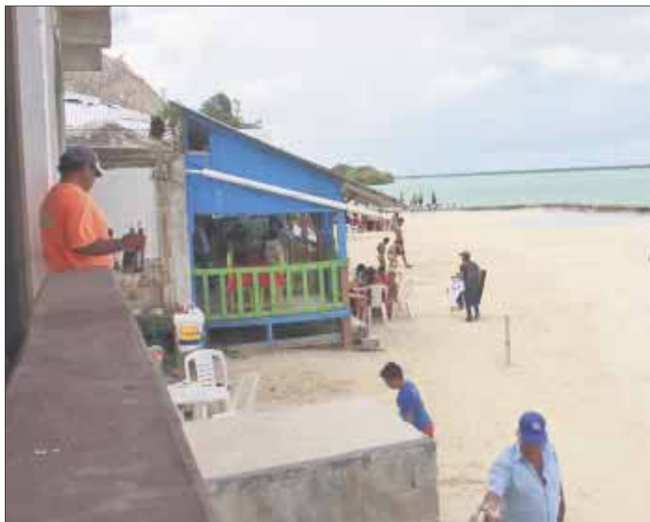
Calderitas es un balneario que compite, pues es el favorito de los beliceños.

Chetumal.- Los chetumaleños y visitantes extranjeros, en su mayoría provenientes de Belice, ante el intenso calor abarrotaron los balnearios, entre ellos el de Calderitas.