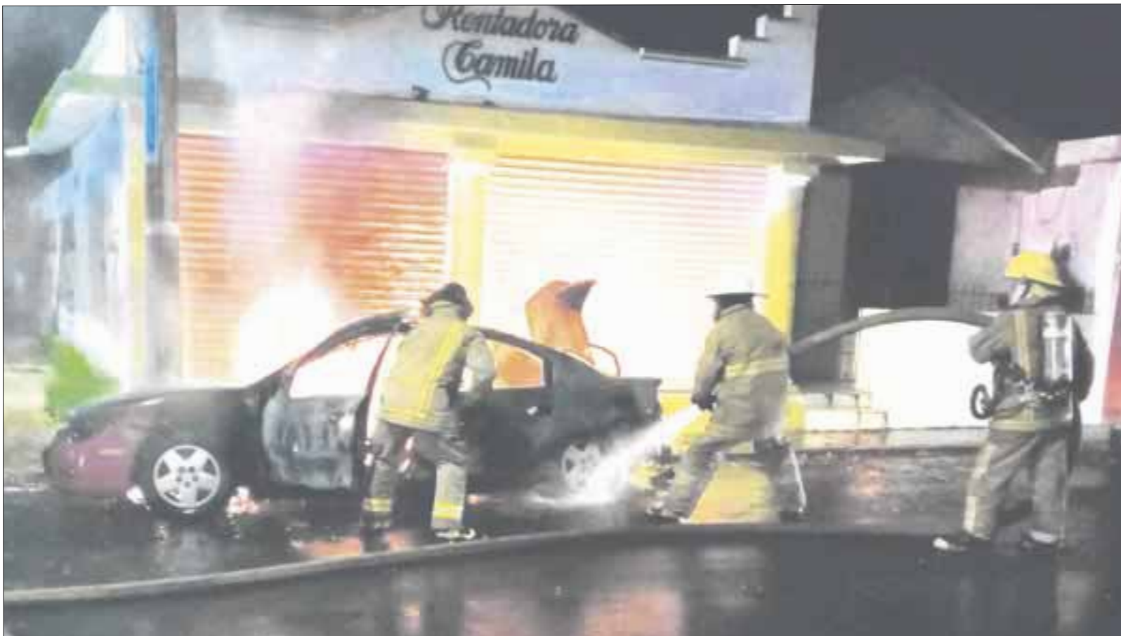
El vehículo que fue incendiado estaba estacionado sobre la avenida Belice esquina con Luis Cabrera en la ciudad de Chetumal.

El incendio del vehículo fue provocado, al parecer con gasolina, por lo que se suma al cuarto automóvil que es quemado a altas horas de la noche en Chetumal; anteriormente ocurrieron en la colonia Santa María y otro en la Adolfo López Mateos.