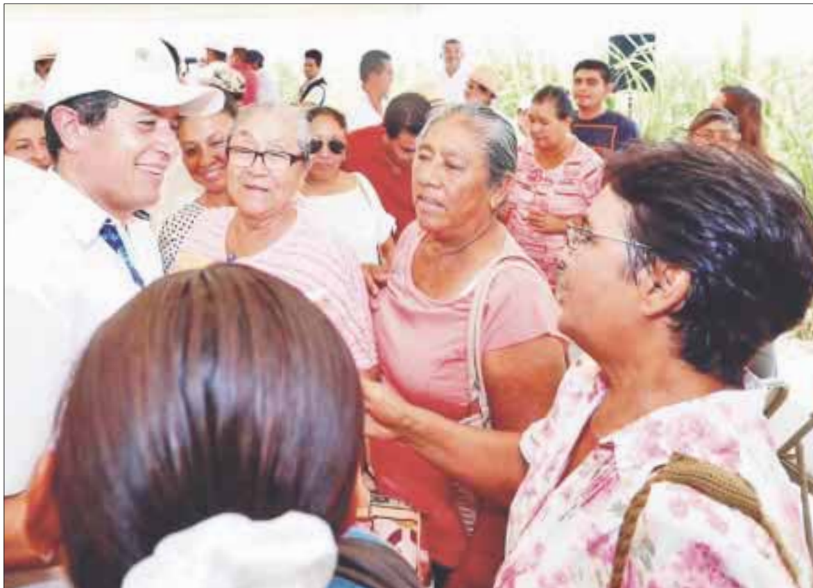
El programa de caminos sacacosechas contempla este año una inversión de 29 millones de pesos.

“Con ello, vamos a poder apoyar a un buen número de productores de aquí a fin de año, sin descuidar a los grupos vulnerables, a las mujeres, a los jóvenes que quieren emprender negocios, para ir disminuyendo más rápidamente la brecha de la desigualdad en la zona rural”.