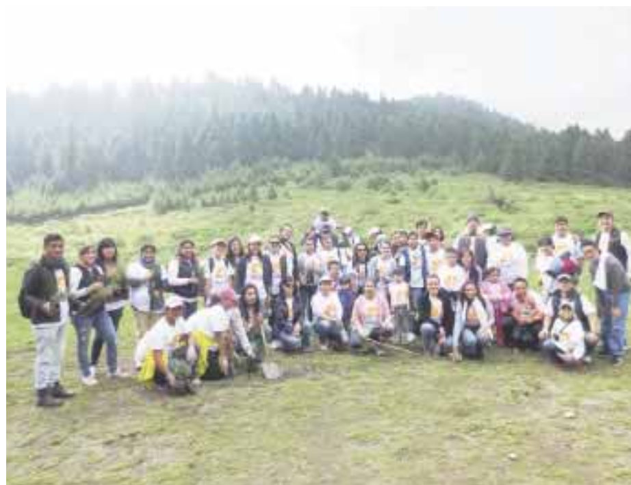
Apoya a personas en condiciones vulnerables.