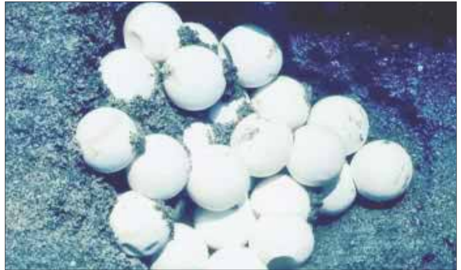
Salvaguardaron más de mil 462 huevos que corresponden a aproximadamente a 15 nidos de tortuga marina de la especie de tortuga blanca ( Chelonia mydas ).

El objetivo primario fue verificar a los campamentos tortugeros que realicen el aprovechamiento no extractivo, cuenten con las autorizaciones correspondientes.