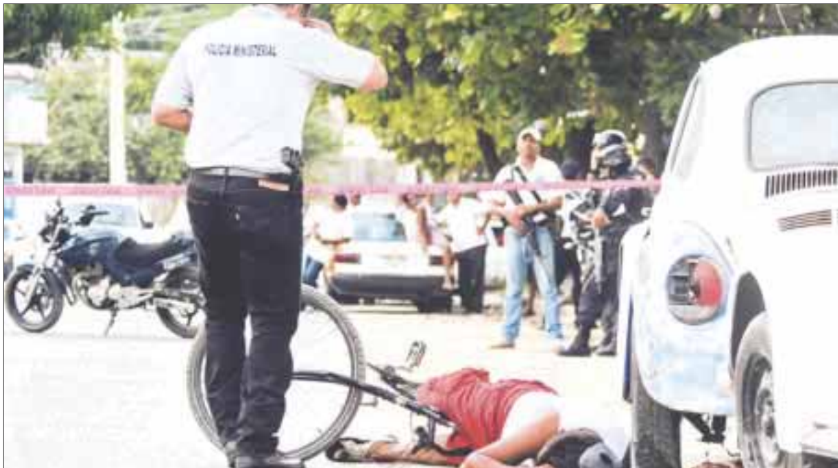
El periodo enero-julio de este año es el lapso más violento de las últimas dos décadas.

En 7 meses, 14 mil indagatorias por homicidio doloso