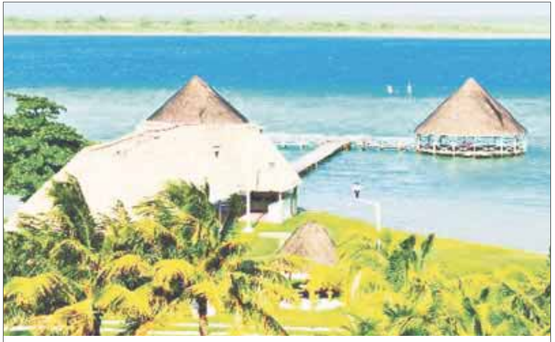
Comenzaron las protestas contra la insinuación de que la Laguna de Bacalar será convertida en área protegida, que afectaría a quienes han invertido en el sitio.

Con la apertura de Cuba al turismo, el gobierno federal proyecta al sur de Quintana Roo como alternativa para diversificar la oferta y tener nuevos elementos para competir con el Caribe.