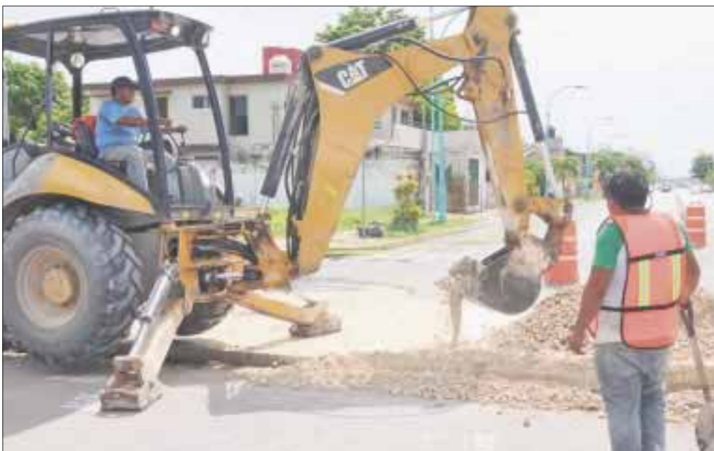
Se sustituye la tubería de aguas residuales en Chetumal.

Chetumal.- La Comisión de Agua Potable y Alcantarillado (CAPA) realiza labores para la rehabilitación de la línea del drenaje sanitario al vacío sobre la avenida Álvaro Obregón con Reforma, en la colonia Centro, con el fin de mejorar el servicio de recolección de aguas residuales que se brinda a cerca de 25 mil habitantes del sector.