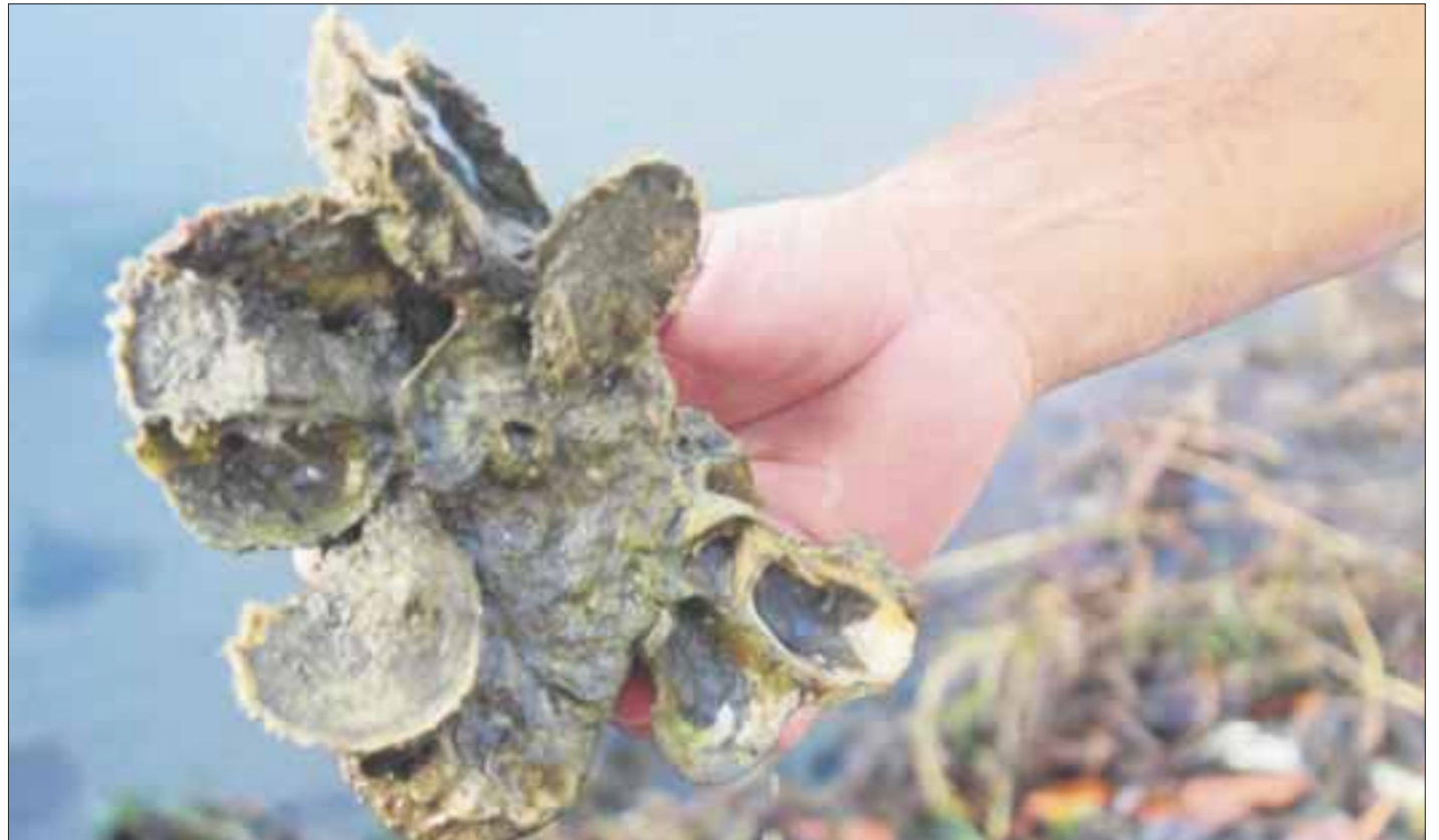
La bacteria proveniente de Asia está alojada en el ostión y causa severos daños a la salud.

Sin embargo, la prevención ciudadana, al evitar dicho alimento, será la mejor herramienta para evitar riesgos a la salud.