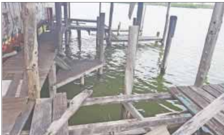
Construcciones en mal estado, no sólo dan mala apariencia, sino también son focos de contaminación de las aguas.

El manglar protegido en la laguna y que cuenta en una zona de humedales Ramsar, fue reforestado de manera reciente y apenas en la pasada COP 13 se presumió, por autoridades federales, el éxito de la restauración de los manglares, sin embargo, servirán para que los turistas den un paseo en canoa.