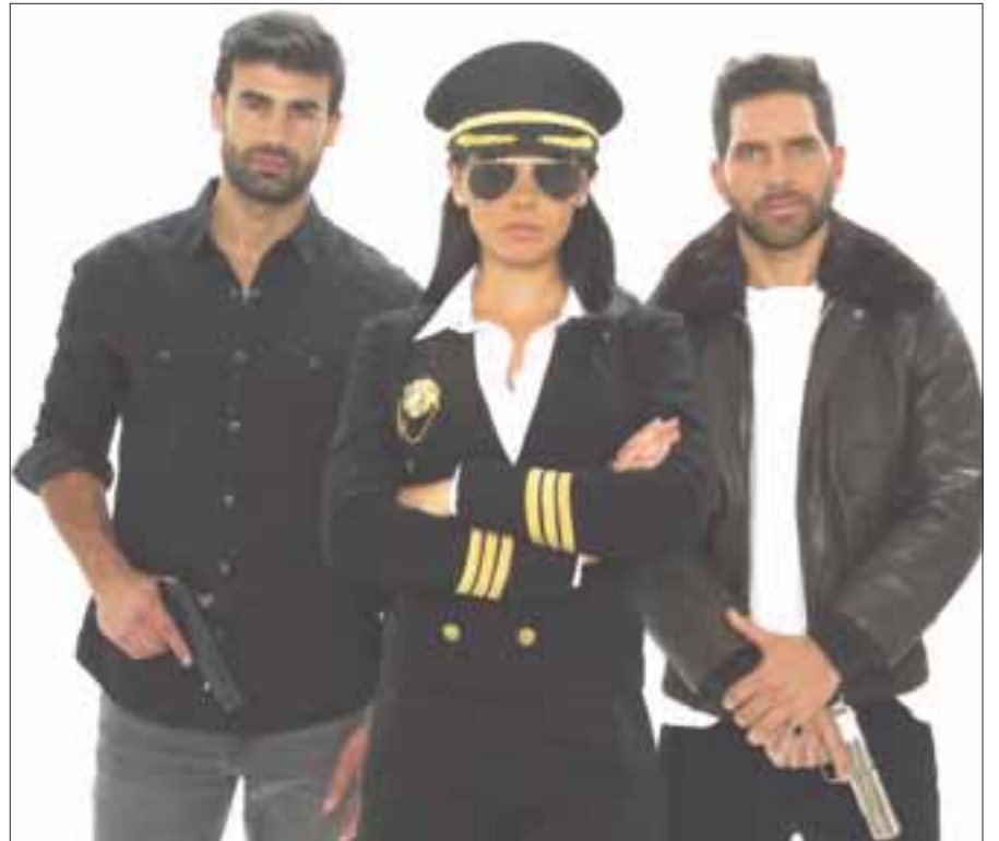
“La Piloto” también contó con las actuaciones de Alejandro Nones, Verónica Montes, Macarena Achaga, Mauricio Aspe y Tommy Vásquez, entre otros.

En 2015, Angélica María lanzó junto su hija Angélica Vale el disco “Dinastía” en homenaje a 65 años de carrera artística de la “Novia de México”, un disco que incluye todos los éxitos de Angélica María: “haré el show junto a mi hija, espero que el año que entra, y hay muchos planes, muchos planes buenos, ahora en La Caravana del Rock and Roll vamos a darlo todo, vamos a estar juntos, unidos, público y artistas, una vez más, porque el rock and roll nos une, y ha unido al mundo entero, y lo sigue haciendo, y ahí vamos a estar todos juntos para divertirlos, para que pasen una noche maravillosa, al igual que nosotros, gozando la música que nos gusta, gozando el estar juntos, quiero mucho a mis compañeros, los respeto, los amo, me encanta estar con ellos, el que estemos vivos todavía arriba en un escenario, es una maravilla”, concluyó.