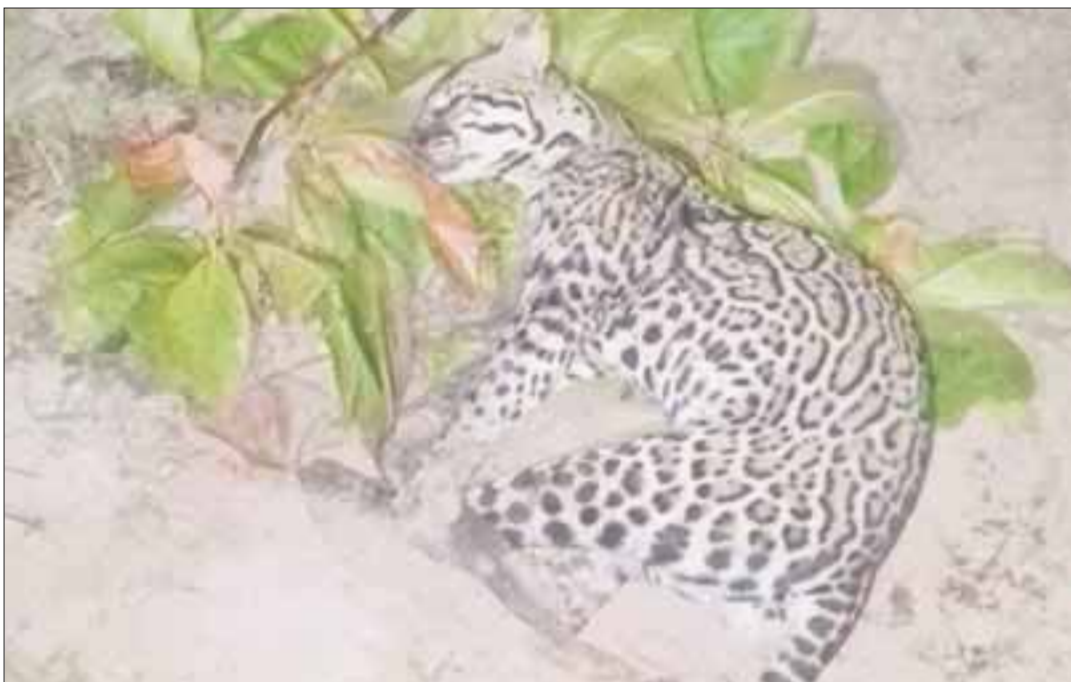
Luego de tres días de ser atropellado, un jaguar fue levantado para su atención.

Solidaridad.- Luego de tres días de ser atropellado y reportado al 911 para que sea rescatado, un jaguar fue levantado para su atención por Integrantes de la Red Comunitaria de Conservación que denunció la desidia de las autoridades.