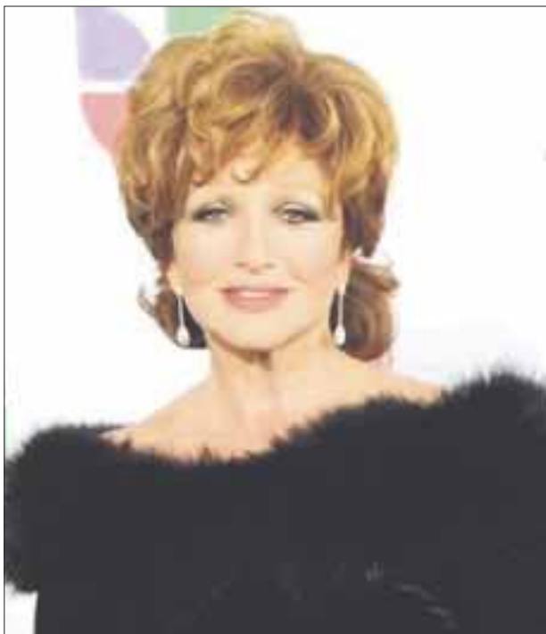
Respecto a qué podrá escuchar el público que se dé cita este 25, 26 y 27 de agosto en La Caravana del Rock and Roll, Angélica María agregó que “son muchos éxitos de la época dorada del rock and roll, en La Caravana del Rock and Roll deben sonar los éxitos de los 60”.

De acuerdo con datos de Nielsen IBOPE México, la historia protagonizada por Livia Brito, Arap Bethke y Juan Colucho registró un share de 26.46%, superando a su competencia más cercana por 234.51%.