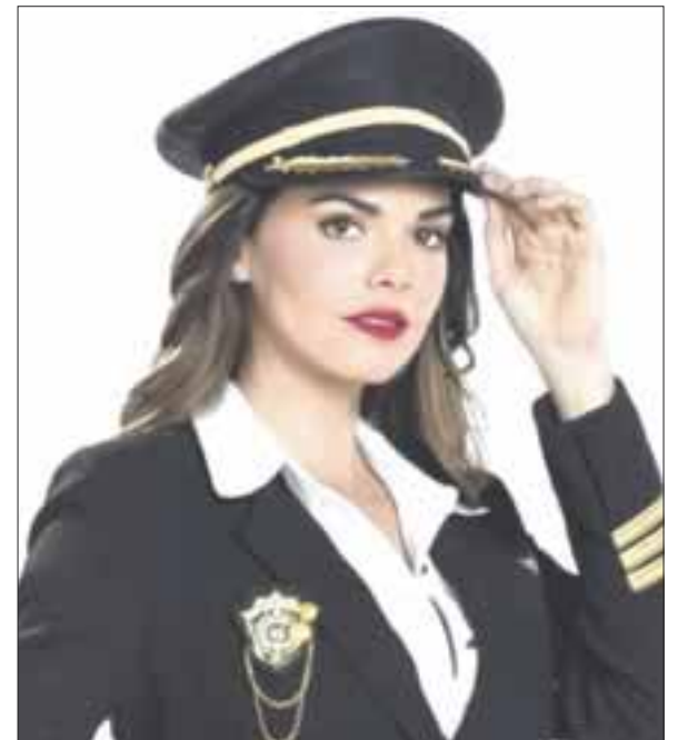
“La Piloto” inició el pasado 21 de mayo por las estrellas y desde su primer capítulo se ubicó como líder de audiencia en su horario, gracias a que el público la colocó como una de sus historias favoritas.