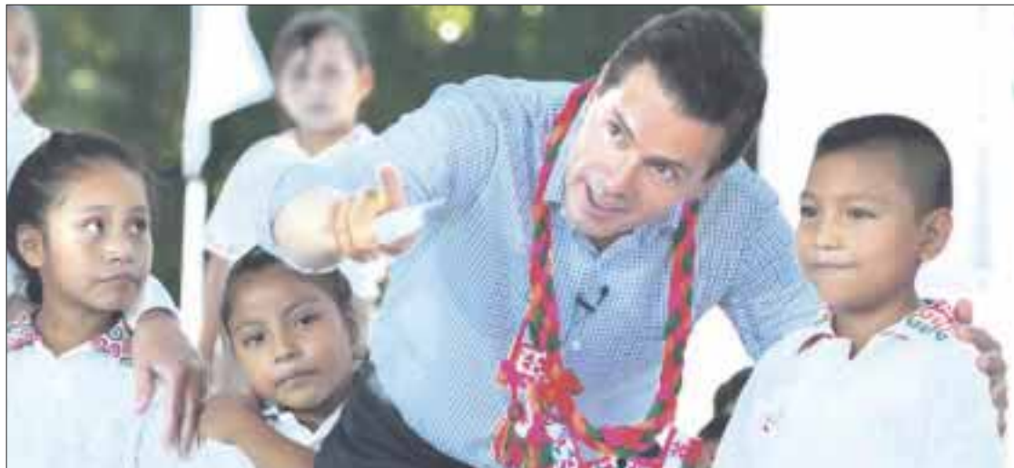
El presidente Enrique Peña Nieto encabezó en San Luis Potosí el inicio del ciclo escolar 2017-2018.

En su discurso durante el acto, sostuvo que "es la determinación y la valentía lo que hace que las cosas cambien, no es la retórica, no es la palabra,