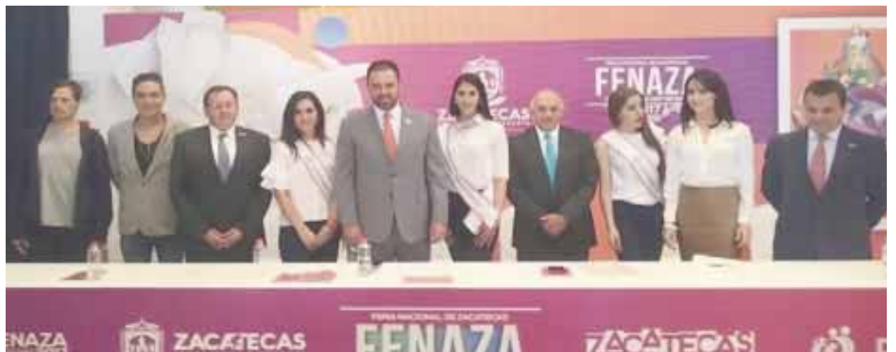
En la presentación de la Feria Nacional de Zacatecas.

Una nueva modalidad para este año es que no habrá un estado invitado, sino que serán los 58 municipios zacatecanos los invitados especiales a esta fiesta popular, porque éstos están lle-