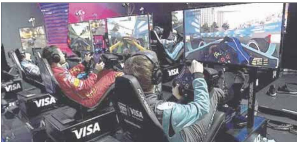
Fue anunciado lanzamiento de la Fórmula 1 Sports Series, competencia virtual que reunirá a los mejores videojugadores de todo el mundo.

Londres.- La máxima categoría del deporte motor anunció este lunes el lanzamiento de la Fórmula 1 Esports Series, competencia virtual que reunirá a los mejores videojugadores de todo el mundo.