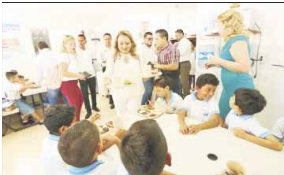
El programa de Desayunos Escolares beneficiará a 62 mil 414 niñas y niños de más de 200 escuelas del estado.