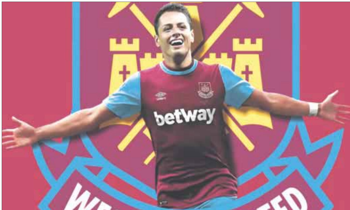
Cientos de aficionados hicieron largas filas en Londres para fotografiarse y recibir la firma del goleador jalisciense, Javier Hernández.

Ayer lunes “Chicharito” Hernández causó revuelo en la capital inglesa, ya que junto al defensa argentino Pablo Zabaleta repartieron autógrafos en una tienda oficial del West Ham, donde cientos de aficionados hicieron largas filas para fotografiarse y recibir la firma del goleador jalisciense.