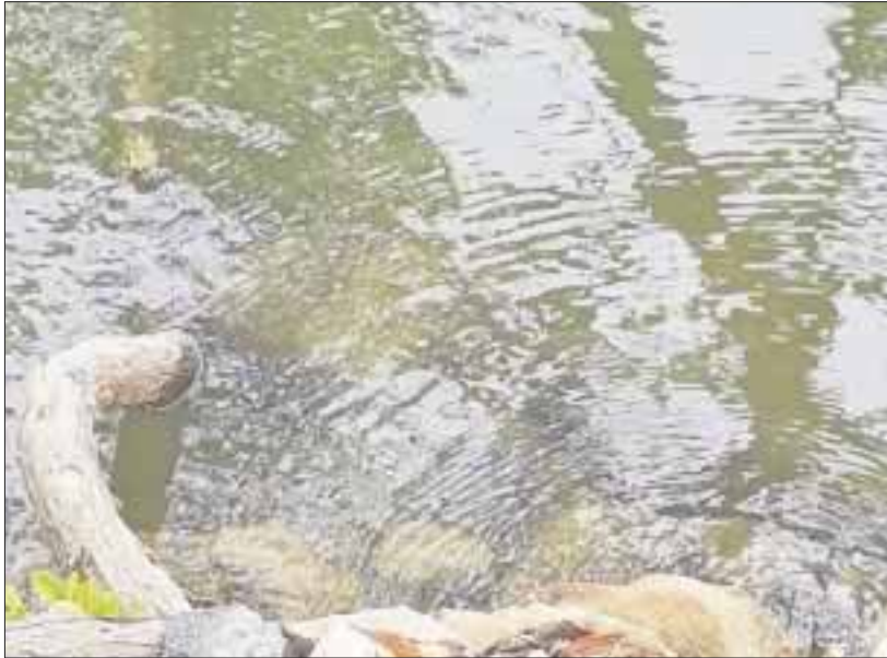
Se observa la escasez de aves que antes colmaban el lugar.