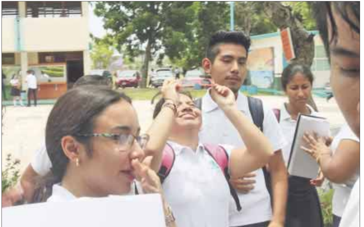
Estudiantes de astronomía proporcionaron lentes especiales para que los alumnos pudieran seguir de cerca el eclipse de sol.

Los alumnos de Bachilleres Plantel 1 encargados de dar seguimiento al eclipse, indicaron que este fenómeno tardó aproximadamente cuatro horas, teniendo su máxima – es decir cuando la sombra cubrió parte la circunferencia del sol, alrededor de las 13.30 horas, pese a que las nubes no dejaron apreciar totalmente este fenómeno natural.