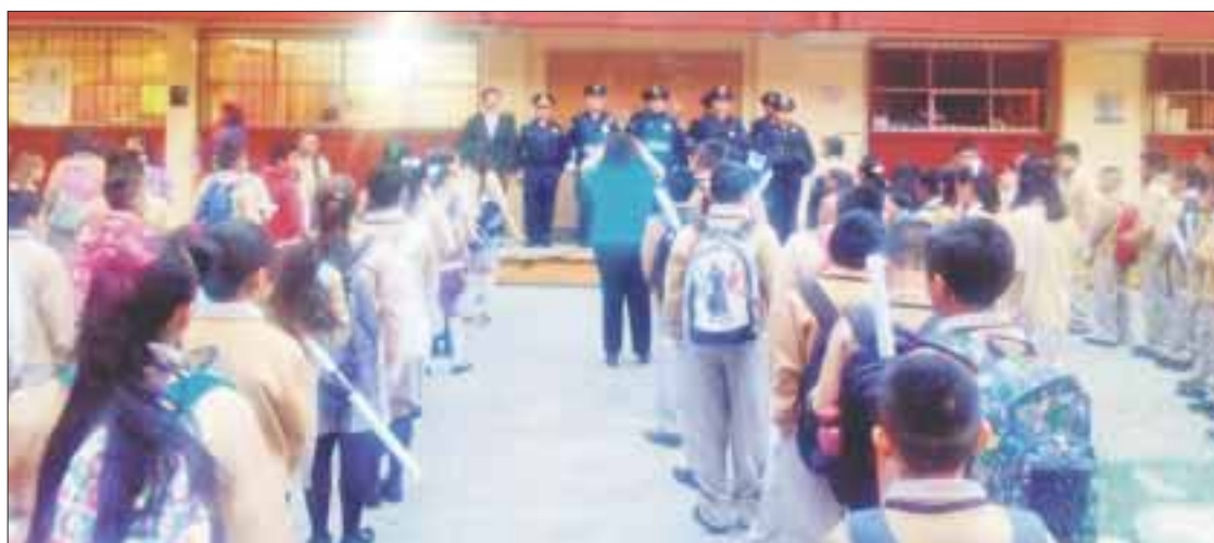
Regresaron a clases casi 26 millones de niños y jóvenes en el país, así como un millón 200 mil maestros en el inicio del ciclo escolar 2017-2018.

Detalló que programas piloto se refiere a que iniciarán en algunas escuelas, en una escala pequeña, "para ver cómo están funcionando, qué ajustes deben de tener, etcétera, y la idea es que después, poco a poco, se empiecen a escalar".