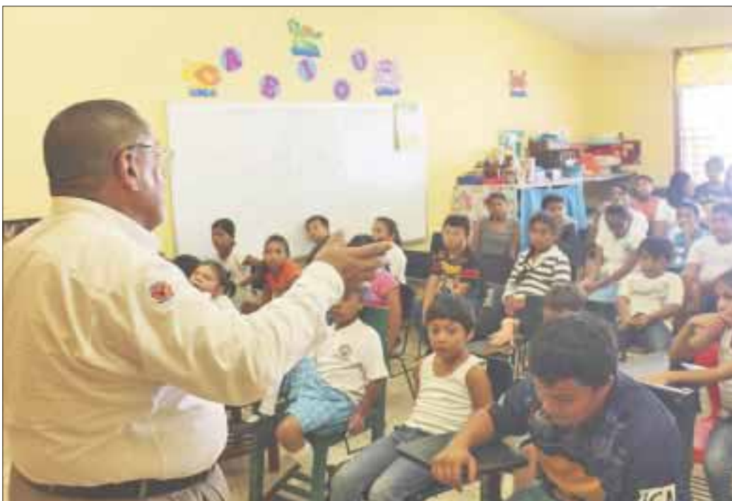
El director de Educación Básica del gobierno estatal consideró exitoso el inicio de clases.

Chetumal.- El inicio de clases para más de 322 mil alumnos de educación básica fue exitoso, al observarse gran movilidad estudiantil en la zona norte del estado, debido al incremento de la matrícula escolar con la llegada de nuevos alumnos provenientes de Campeche, Chiapas y Tabasco, principalmente.