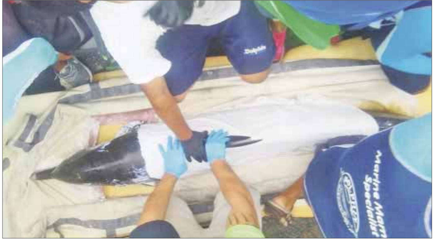
El delfín que encalló en playas de Yucatán, falleció en la Tortugranja de Isla Mujeres.

Se hizo todo lo humano y médicamente posible para contribuir en la recuperación del stenella , apoyados por Dolphin Discovery tanto en recursos como en personal, pero desafortunadamente su estado de salud era crítico y no fue posible salvarle la vida.