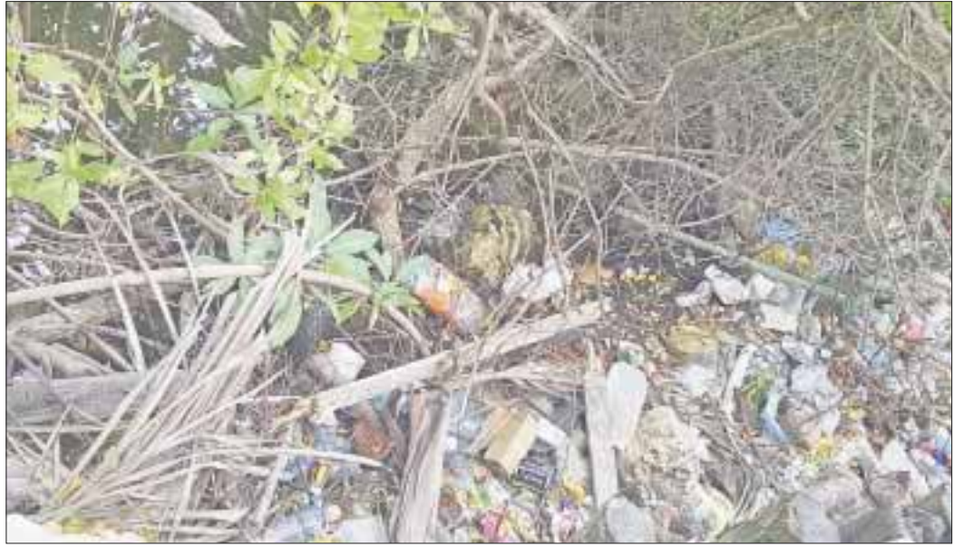
Montones de basura se acumulan en la ribera de la laguna.